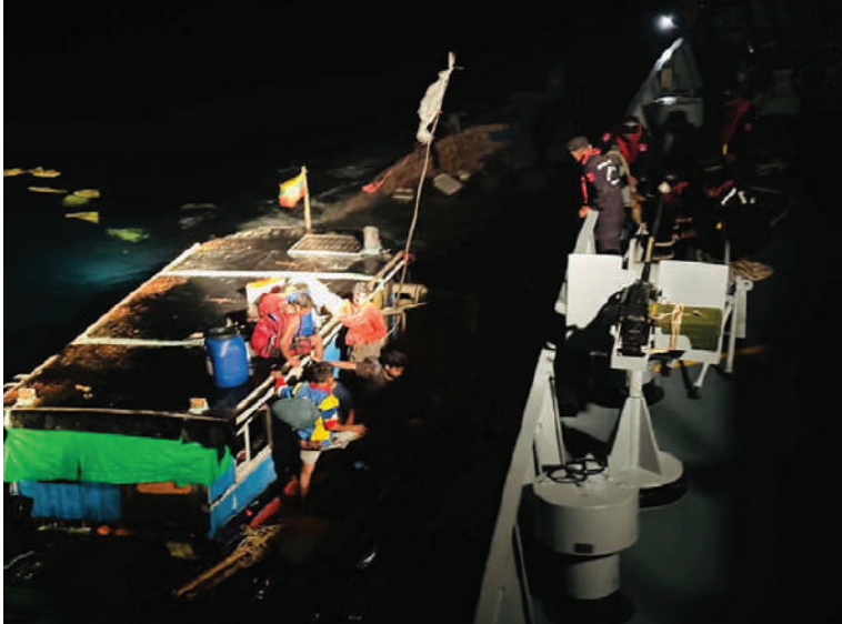
ဝှံမြို့အနီး မြန်မာ့ပင်လယ်ပြင်အတွင်း ရေဝင်နှစ်မြုပ်နေသည့် ကုန်တင်လှေတစ်စီးကို လုံခြုံရေးတပ်ဖွဲ့ဝင်များက ကူညီကယ်ဆယ်ပေးစဉ်။

လုပ်ငန်းများ သွားရောက်ဆောင်ရွက်ရာ ၅ နာရီ ၄၅ မိနစ်ခန့်တွင်ရေဝင်နှစ်မြုပ်နေသည့် ကုန်တင်လှေအနီးသို့ရောက်ရှိခဲ့ပြီး လှေပေါ်တွင်လိုက်ပါလာသော လှေသား ငါးဦးကို ရေယာဉ်ပေါ်သို့ ကယ်ဆယ်တင်ဆောင်ကာ လိုအပ်သည့်ကျန်းမာရေးစစ်ဆေးပေးခြင်းများ ဆောင်ရွက်ပေးပြီး အဝတ်အထည်နှင့် စားသောက်ဖွယ်ရာများ ပေးအပ်၍လှေသားများကို သက်ဆိုင်ရာ သို့စနစ်တကျလှေပြောင်းပေးအပ်သွားမည် ဖြစ်ကြောင်း သတင်းရရှိသည်။ (၅၀၁)