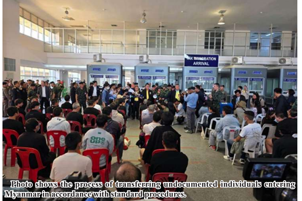
Photo shows the process of transferring undocumented individuals entering Myanmar in accordance with standard procedures.