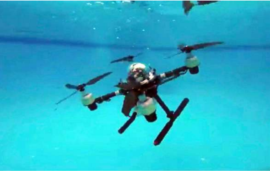
တရုတ်နိုင်ငံ၏ ဝေဟင်မှ ပင်လယ်ပြင်သွား Feiyi ဒရုန်းကို တွေ့ရစဉ်။

အဆိုပါဒရုန်းများ၏ နည်းပညာမြောက်သက်ရောက်မှုသည် အထပ်ထပ်သော ကာကွယ်ရေးစနစ်များကို ကျော်လွှားနိုင်စွမ်းရှိမည်ဖြစ်သည်။ သမားရိုးကျနှင့် အသံလွန်လက်နက်များ၏ ကန့်သတ်ချက်များကို ကျော်လွှားနိုင်ဖွယ်ရှိခြင်း၊ နယ်ပယ်မျိုးစုံနှင့် အရပ်မျက်နှာမျိုးစုံမှနေ၍ ဒရုန်းအုပ်များဖြင့် ရန်သူကို အသာစီးရယူတိုက်ခိုက်နိုင်စွမ်းရှိလာမည် ဖြစ်သည်။ ထို့ပြင် အဆိုပါဒရုန်းများသည် ထိုင်ဝမ် ရေလက်ကြား၊ တောင်တရုတ်ပင်လယ်နှင့်