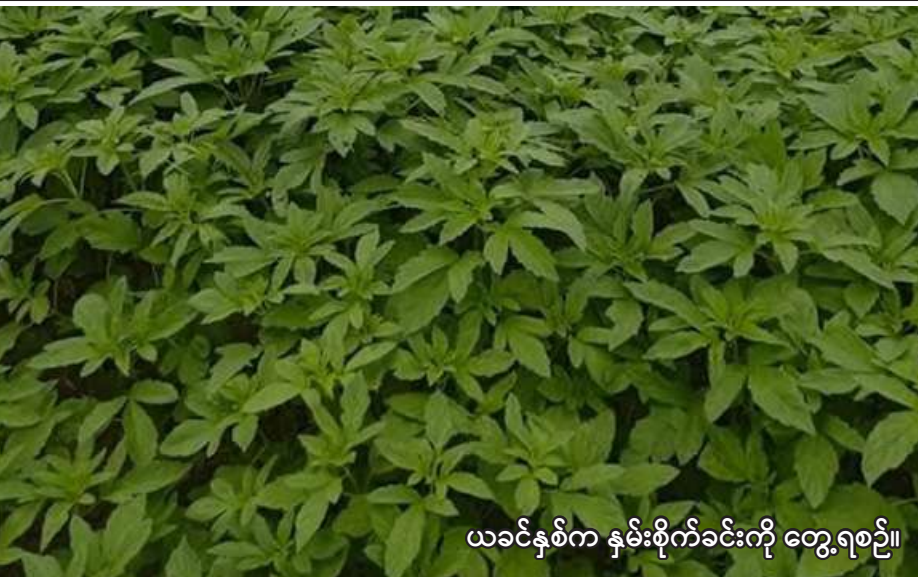
ယခင်နှစ်က နှမ်းစိုက်ခင်းကို တွေ့ရစဉ်။

တို့ပြည်ထောင်စုတိုင်းရင်းသားများ ညီညွတ်စွမ်းအား ပြည့်ခွန်အား