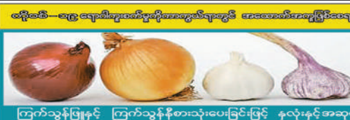
ကြက်သွန်ဖြူနှင့် ကြက်သွန်နီစားသုံးပေးခြင်းဖြင့် နှလုံးနှင့်အဆုတ် အတွက် အထူးကောင်းမွန်သည်။