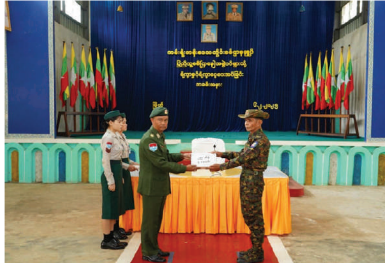
ကမ်းရိုးတန်းဒေသတိုင်းစစ်ဌာနချုပ် တိုင်းမှူး ဗိုလ်မှူးချုပ်ကျော်ကျော်ဟန် မြိတ်မြို့နယ်ရှိ ပြည်သူ့စစ်(ဌာနေ)တပ်ဖွဲ့ဝင်များအတွက် စားသောက်ဖွယ်ရာများနှင့် ဂုဏ်ပြုချီးမြှင့်ငွေများပေးအပ်စဉ်။

နေပြည်တော် ဖေဖော်ဝါရီ ၆ တနင်္သာရီတိုင်းဒေသကြီး မြိတ်မြို့နယ်ရှိ ပြည်သူ့စစ်(ဌာနေ) တပ်ဖွဲ့ဝင်များအား စားသောက်ဖွယ်ရာများနှင့် ဂုဏ်ပြုချီးမြှင့်ငွေများပေးအပ်ခြင်းကို ယနေ့နံနက်ပိုင်းတွင် မြိတ်မြို့ရှိ နယ်မြေခွဲတပ်ရင်းခန်းမ၌ပြုလုပ်ရာ ကမ်းရိုးတန်းဒေသတိုင်းစစ်ဌာနချုပ် တိုင်းမှူး ဗိုလ်မှူးချုပ်ကျော်ကျော်ဟန်နှင့် အဖွဲ့ဝင်များ၊ ပြည်သူ့စစ်(ဌာနေ)တပ်ဖွဲ့ဝင်များ တက်ရောက်ကြသည်။ ဦးစွာ တိုင်းမှူးက အမှာစကားပြောကြားသည်။ ထို့နောက် ပြည်သူ့စစ်(ဌာနေ)တပ်ဖွဲ့ဝင်များ၏ တင်ပြချက်များအပေါ် လိုအပ်သည်များ ပေါင်းစပ်ညှိနှိုင်းဆောင်ရွက်ပေးပြီး ပြည်သူ့စစ်(ဌာနေ)တပ်ဖွဲ့ဝင်များအတွက် စားသောက်ဖွယ်ရာများနှင့် ဂုဏ်ပြုချီးမြှင့်ငွေများ ပေးအပ်သည်။ ယင်းနောက် တိုင်းစစ်ဌာနချုပ် နယ်လှည့်ဆေးကုသရေးအဖွဲ့က ပြည်သူ့စစ်(ဌာနေ)တပ်ဖွဲ့ဝင်များအား လိုအပ်သည့်