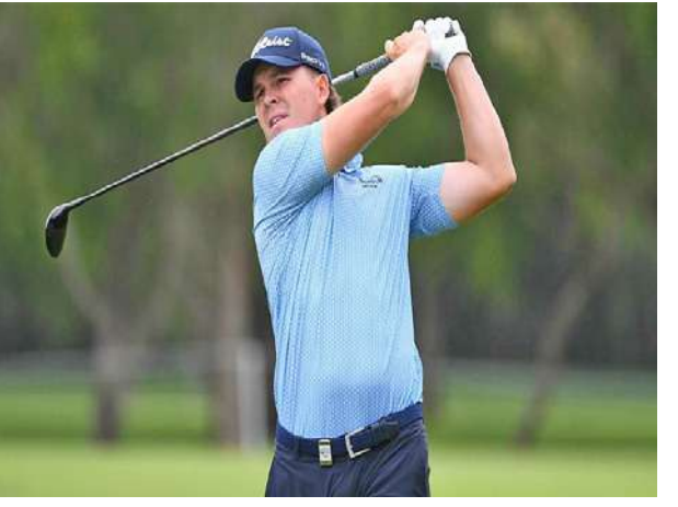
Ref : RT Trs : AZL

ပထမနေ့အပြီး အမှတ်ပေးဇယားကို ဦးဆောင်ခွင့်ရသွားခဲ့သည့် မက်ဘရစ်သည် ပထမနေ့တွင် သတ်မှတ်ရိုက်ချက်ထက် ၁၀ ချက် လျော့ရိုက်နိုင်ခဲ့ခြင်းမှာ Vic Open ဂေါက်သီးရိုက်ပြိုင်ပွဲ သက်တမ်းတစ်လျှောက် ၁၈ကျင်းအပြီး သတ်မှတ်ရိုက်ချက်ထက် အများဆုံး လျော့ရိုက်နိုင်ခဲ့သည့် မှတ်တမ်းကောင်းတစ်ရပ်ကို ရရှိခဲ့ကြောင်း သိရသည်။