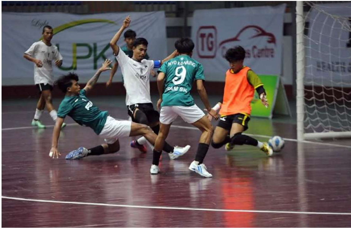
SK FC အသင်းနှင့် Team YG U-19 အသင်းတို့ ယှဉ်ပြိုင်ကစားနေမှုကို တွေ့ရစဉ်။

မန္တလေး ဖေဖော်ဝါရီ ၆ မန္တလေးတိုင်းဒေသကြီးသံသောင်ပြင်နှင့် ဖူဆယ်ကော်မတီက ကြီးမှူးကျင်းပသည့် Royal-D Qualified Futsal Cup Mandalay 2025 ပြိုင်ပွဲ ၁၆ သင်းရုံးထွက်အဆင့်ပွဲစဉ်များကို ယနေ့နံနက် ၈ နာရီမှ စတင်ပြီးမန္တလေးမြို့မန္တလာသီရိအားကစား