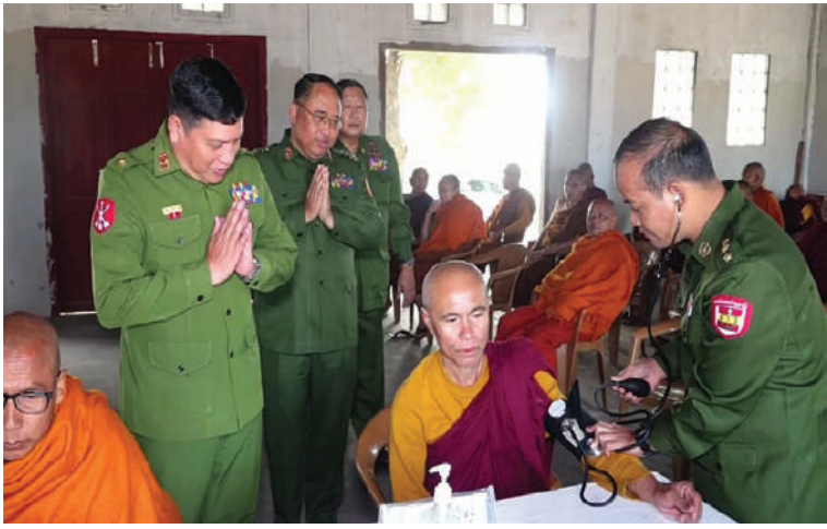
သံဃာတော်များအား ကျန်းမာရေးစောင့်ရှောက်မှုလုပ်ငန်းများ ဆောင်ရွက်ပေးနေမှုကို မြစ်ကြီးနားတပ်နယ်မှ တာဝန်ရှိသူများက ကြည့်ရှုအားပေးစဉ်။

နေမှုတို့ကို လိုက်လံရှင်းလင်းပြသရာ တိုင်းဒေသကြီး ဝန်ကြီးချုပ်က နိုင်ငံတော်အကြီးအကဲ လာရောက်စစ်ဆေးစဉ် လမ်းညွှန်မှာကြားချက်များ ပြီးမြောက်အောင် အလေးထားဆောင်ရွက်သွားရေးနှင့် လုပ်ငန်းများသတ်မှတ်ကာလအတွင်း အရည်အသွေးပြည့်မီစွာဖြင့် ပြီးစီးရေးသက်ဆိုင်ရာဌာနများနှင့်ပေါင်းစပ်ညှိနှိုင်းဆောင်ရွက်သွားရေးတို့ကို ပြောကြား၍ လိုအပ်သည်များ ဖြည့်ဆည်းဆောင်ရွက်ပေးပြီး တည်ဆောက်ရေးစီမံကိန်းအတွင်းနှင့် ရေဆိုးစွန့်ပစ်မှုစနစ်များကောင်းမွန်စေရန် Box Culvert ဆောက်လုပ်နေမှုနှင့်ရေစီးရေလာကောင်းမွန်ရေးအတွက် ဆောင်ရွက်မည့်အခြေအနေများကို လိုက်လံကြည့်ရှုခဲ့သည်။ ထို့နောက် တိုင်းဒေသကြီးဝန်ကြီးချုပ်သည် ရပ်ကွက်ကြီး(၁၀)ရှိ သီရိရတနာဈေးသို့ရောက်ရှိပြီး တာဝန်ရှိသူများကလိုက်လံရှင်းလင်းပြသရာ တိုင်းဒေသကြီး ဝန်ကြီးချုပ်က တာဝန်ရှိသူများ၏ ရှင်းလင်းတင်ပြမှုများအပေါ် လိုအပ်သည်များ ပေါင်းစပ်ညှိနှိုင်းဆောင်ရွက်ပေးကာ ဈေးသူ၊ ဈေးသားများနှင့် ဈေးဝယ်ပြည်သူများကို ရင်းနှီးစွာ နှုတ်ဆက်အားပေးစကားပြောကြားခဲ့ကြောင်း သတင်းရရှိသည်။ မျိုးကျော်