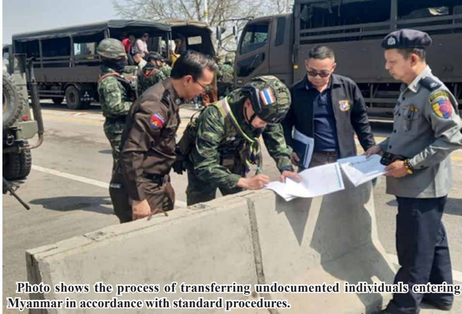
Photo shows the process of transferring undocumented individuals entering Myanmar in accordance with standard procedures.