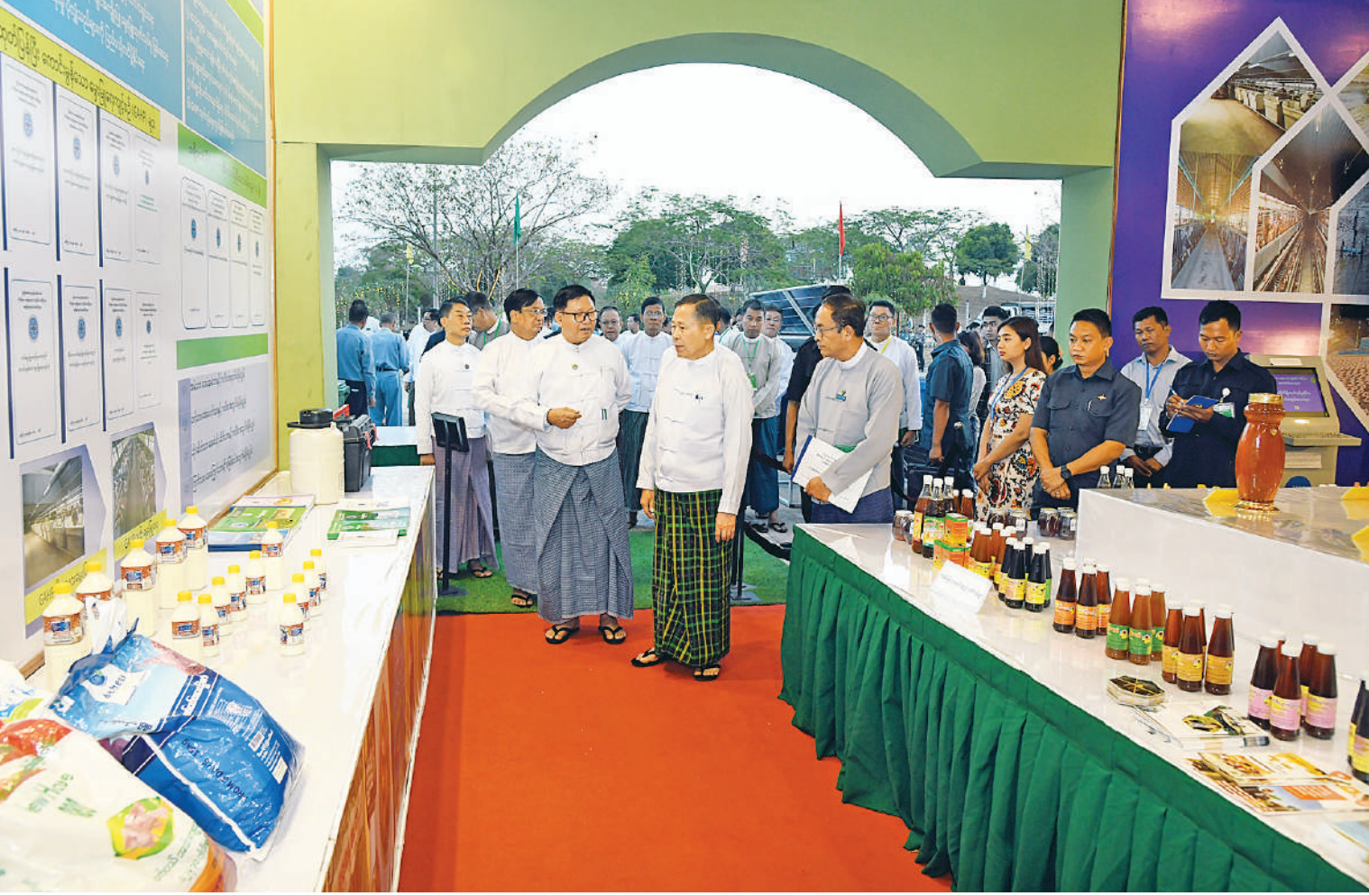
အသေးစား၊ အငယ်စားနှင့် အလတ်စားစီးပွားရေးလုပ်ငန်းများဖွံ့ဖြိုးတိုးတက်ရေးလုပ်ငန်းကော်မတီဥက္ကဋ္ဌ နိုင်ငံတော်စီမံအုပ်ချုပ်ရေးကောင်စီ ဒုတိယဥက္ကဋ္ဌ ဒုတိယဝန်ကြီးချုပ် ဒုတိယဗိုလ်ချုပ်မှူးကြီးစိုးဝင်း ပြခန်းအလိုက် ခင်းကျင်းပြသရန် ပြင်ဆင်ဆောင်ရွက်နေမှုများကို လိုက်လံကြည့်ရှုအားပေးစဉ်။

နေပြည်တော် ဖေဖော်ဝါရီ ၅ ပြည်ထောင်စုအဆင့် MSME ထုတ်ကုန်ပြပွဲနှင့် ပြိုင်ပွဲကျင်းပနိုင်ရေး လုပ်ငန်း ညှိနှိုင်းအစည်းအဝေးကို ယနေ့မွန်းလွဲပိုင်း တွင် နေပြည်တော်ရှိ ဥပ္ပါတသန္တီစေတီ တော်တပေါင်းကွင်း၌ ကျင်းပရာ အသေး စား၊ အငယ်စားနှင့် အလတ်စားစီးပွားရေး လုပ်ငန်းများ ဖွံ့ဖြိုးတိုးတက်ရေးလုပ်ငန်း ကော်မတီဥက္ကဋ္ဌ နိုင်ငံတော်စီမံအုပ်ချုပ် ရေးကောင်စီ ဒုတိယဥက္ကဋ္ဌ ဒုတိယ ဝန်ကြီးချုပ် ဒုတိယဗိုလ်ချုပ်မှူးကြီးစိုးဝင်း တက်ရောက်အမှာစကားပြောကြားသည်။ အခမ်းအနားသို့ ဒုတိယဝန်ကြီးချုပ် နှင့်စီမံကိန်းနှင့် ဘဏ္ဍာရေးဝန်ကြီးဌာန ပြည်ထောင်စုဝန်ကြီး ဦးဝင်းရှိန်၊ စက်မှု ဝန်ကြီးဌာန ပြည်ထောင်စုဝန်ကြီး ဒေါက်တာချာလီသန်း၊ နေပြည်တော် ကောင်စီဥက္ကဋ္ဌ ဦးသန်းထွန်းဦး၊ ဆပ်ကော် မတီဥက္ကဋ္ဌများဖြစ်ကြသည့် ဒုတိယဝန်ကြီး များ၊ နေပြည်တော်ကောင်စီနှင့်တိုင်းဒေသ ကြီး၊ ပြည်နယ်များမှ အေဂျင်စီဥက္ကဋ္ဌများ၊ အသင်းအဖွဲ့များမှ တာဝန်ရှိသူများနှင့် ပြခန်းတာဝန်ခံများ၊ ဌာနဆိုင်ရာအကြီး အကဲများနှင့်တာဝန်ရှိသူများ တက်ရောက် ကြသည်။