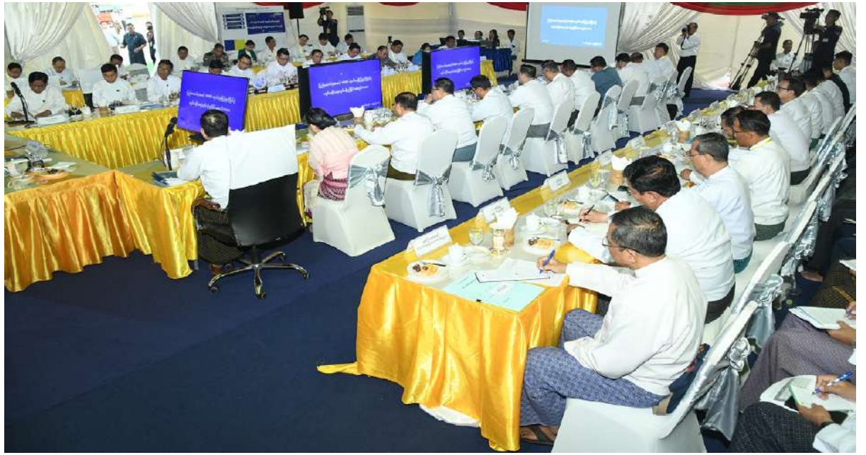
အသေးစား၊ အလတ်စားနှင့် အလတ်စားစီးပွားရေးလုပ်ငန်းများ ဖွံ့ဖြိုးတိုးတက်ရေးလုပ်ငန်းကော်မတီဥက္ကဋ္ဌ နိုင်ငံတော်စီမံအုပ်ချုပ်ရေးကောင်စီ ဒုတိယဥက္ကဋ္ဌ ဒုတိယဝန်ကြီးချုပ် ဒုတိယဗိုလ်ချုပ်မှူးကြီးစိုးဝင်း ပြည်ထောင်စုအဆင့် MSME ထုတ်ကုန်ပြပွဲနှင့် ပြိုင်ပွဲကျင်းပနိုင်ရေးလုပ်ငန်းညှိနှိုင်းအစည်းအဝေးတွင် အမှာစကားပြောကြားစဉ်။