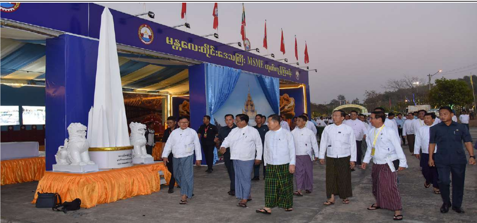
အသေးစား၊ အငယ်စားနှင့် အလတ်စား စီးပွားရေးလုပ်ငန်းများ ဖွံ့ဖြိုးတိုးတက်ရေးလုပ်ငန်းကော်မတီဥက္ကဋ္ဌ နိုင်ငံတော်စီမံအုပ်ချုပ်ရေးကောင်စီ ဒုတိယဥက္ကဋ္ဌ ဒုတိယဝန်ကြီးချုပ် ဒုတိယဗိုလ်ချုပ်မှူးကြီးစိုးဝင်း ပြခန်းအလိုက် ခင်းကျင်းပြသရန် ပြင်ဆင်ဆောင်ရွက်နေမှုများကို လိုက်လံကြည့်ရှုအားပေးစဉ်။

ပိုလျှံမှုအပေါ် နိုင်ငံအဆင့်မဟာဓာတ်အား လိုင်းသို့ရောင်းချရန်ကြောင့်၊ ဆိုလာ စနစ်ဆောင်ရွက်သည့်အတွက် ကုန်ကျမည့် ငွေပမာဏမှာ နှစ်အနည်းငယ်အတွင်းအရင်း ကြေကာလသို့ ရောက်ရှိမည်ဖြစ်ကြောင်း၊ ဥပမာအားဖြင့် မိမိတို့ကာကွယ်ရေးဦးစီးချုပ် ရုံးအတွင်း မဂ္ဂါဝပ် ၂၀ ရှိ ဆိုလာဓာတ်အားပေး စနစ်ကို လွန်ခဲ့သည့် နှစ်နှစ်ခန့်မှစတင် တည်ဆောက်အသုံးပြုခဲ့ရာ လာမည့်တစ်နှစ် ခွဲအတွင်း အရင်းကျေကာလ ပြည့်မြောက် မည်ဖြစ်ကြောင်း၊ သို့ဖြစ်၍ MSME လုပ်ငန်းရှင် များအနေဖြင့် သက်ဆိုင်ရာတိုင်းဒေသကြီး နှင့်ပြည်နယ်များရှိ စက်မှုဇုန်များ၏မြေလွတ် နေရာများနှင့်အခြားမြေလွတ်မြေရိုင်းနေရာ များတွင် ဆိုလာစနစ်ဖြင့် တစ်ပိုင်တစ်နိုင် လျှပ်စစ်ဓာတ်အားရရှိရေးအတွက် ဆောင် ရွက်စေလိုကြောင်း၊ ထိုသို့ဆောင်ရွက်ခြင်းဖြင့် စက်မှုဇုန်များ၌ လျှပ်စစ်မီးမလုံလောက်သည့် စိန်ခေါ်မှုကို ကျော်လွှားနိုင်မည်ဖြစ်ကြောင်း၊ နိုင်ငံတော်အနေဖြင့် အခြားပြည်နယ်နှင့် တိုင်းဒေသကြီးများတွင်လည်း သဘာဝ ဓာတ်ငွေ့၊ ဆိုလာလျှပ်စစ်အင်ဂျင်ပေါင်းစပ်