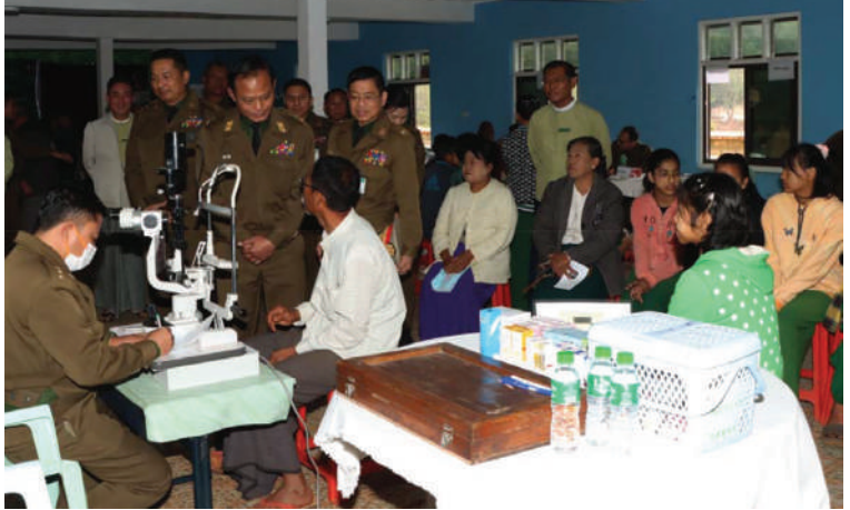
ဒေသခံပြည်သူများအား ကျန်းမာရေးစောင့်ရှောက်မှုလုပ်ငန်းများ ဆောင်ရွက် ပေးနေမှုကို ပြင်ဦးလွင်တပ်နယ်မှ တာဝန်ရှိသူများက ကြည့်ရှုအားပေးစဉ်။

ဆိုင်ရာရောဂါ၊ မျက်စိရောဂါ၊ သွားနှင့် ခံတွင်းရောဂါ၊ ခွဲစိတ်ကုသမှုဆိုင်ရာရောဂါ၊ အထွေထွေရောဂါတို့နှင့် ပတ်သက်၍ လိုအပ်သည့် ကျန်းမာရေးစစ်ဆေးကုသ ပေးခြင်း၊ ECG စက်၊ Ultrasound စက် တို့ဖြင့် ရောဂါရှာဖွေစစ်ဆေးသပ်စစ်ဆေး ခြင်း၊ ကျန်းမာရေးဆိုင်ရာအသိပညာပေး ဟောပြောခြင်းများ ဆောင်ရွက်ပေးပြီး ဆေးရုံတက်ရောက်ကုသရန် လိုအပ်သည့် လူနာများကို နယ်မြေခံတပ်မတော် ဆေးရုံသို့ တက်ရောက်ကုသနိုင်ရေး စီစဉ် ဆောင်ရွက်ပေးသည်။ ထိုသို့ ဆောင်ရွက်ပေးနေမှုများကို ပြင်ဦးလွင်တပ်နယ်မှ တာဝန်ရှိသူများက သွားရောက်ကြည့်ရှုအားပေးပြီး လိုအပ် သည်များ ညှိနှိုင်းဆောင်ရွက်ပေးခဲ့ မီးယပ်ရောဂါ၊ အသက်ရှူလမ်းကြောင်း ကြောင်း သတင်းရရှိသည်။ (၅၀၁)