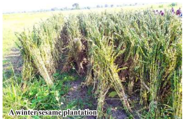
A winter sesame plantation