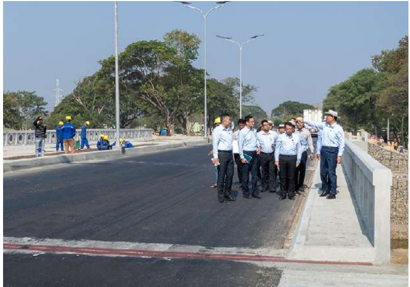
နေပြည်တော် ဖေဖော်ဝါရီ ၅ ဆောက်လုပ်ရေးဝန်ကြီးဌာနပြည်ထောင်စု ဝန်ကြီး ဦးမျိုးသန့်သည် ဒုတိယဝန်ကြီး ဦးဝင်းဖေ၊ တာဝန်ရှိသူများနှင့်အတူ ယနေ့တွင် နေပြည်တော်ကောင်စီနယ်မြေ

အတွင်းရှိ လမ်း၊ တံတားများအဆင့်မြှင့်တင် တည်ဆောက်ခြင်းနှင့်ပြုပြင်ထိန်းသိမ်းခြင်း လုပ်ငန်းများဆောင်ရွက်နေမှုကို ကွင်းဆင်း ကြည့်ရှုစစ်ဆေးသည်။ ဦးစွာပြည်ထောင်စုဝန်ကြီးနှင့်အဖွဲ့သည်