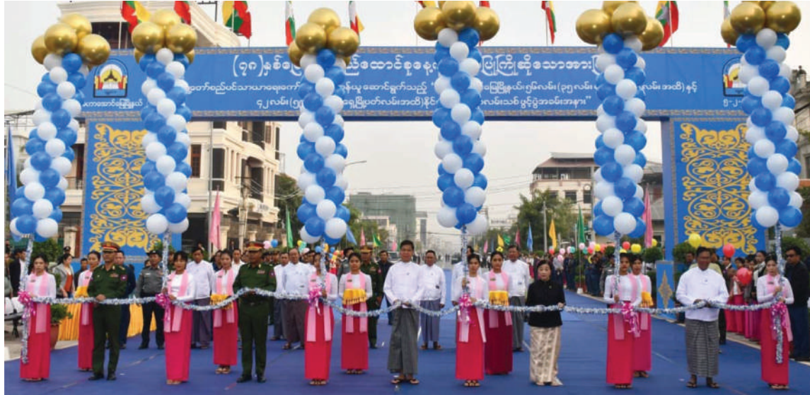
မန္တလေးတိုင်းဒေသကြီးဝန်ကြီးချုပ် ဦးမျိုးအောင်၊ အလယ်ပိုင်းတိုင်းစစ်ဌာနချုပ် တိုင်းမှူး ဗိုလ်မှူးချုပ်ကျော်ကိုထိုက်နှင့် တာဝန်ရှိသူများက နိုင်လွန်ကတ္တရာလမ်းသစ်ကို ဖဲကြိုးဖြတ်ဖွင့်လှစ်ပေးစဉ်။

နေပြည်တော် ဖေဖော်ဝါရီ ၅ ၇၈ နှစ်မြောက် ပြည်ထောင်စုနေ့ကို ကြိုဆိုဂုဏ်ပြုသောအားဖြင့် မဟာ အောင်မြေမြို့နယ် ၅၆ လမ်းပေါ်ရှိ ၃၅ လမ်းမှ သိပ္ပံလမ်းထိလည်းကောင်း၊ ၄၂