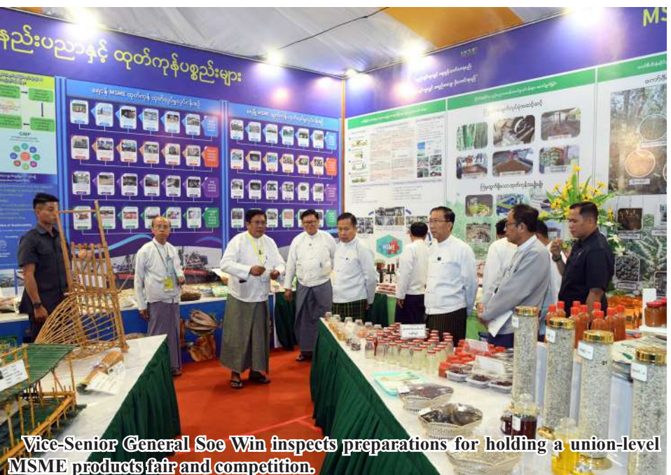
Vice-Senior General Soe Win inspects preparations for holding a union-level MSME products fair and competition.

years ago, and the cost will be recovered within the next year and a half. Therefore, MSME business owners should aim to secure an electricity supply through solar systems by utilizing vacant land in industrial zones and other available areas in the respective regions and states. By doing so, they will be able to overcome the challenge of insufficient electricity in industrial zones. The state is also carrying out projects in other states and regions to generate over 1,000 megawatts of hybrid power, combining natural gas and solar power. With electricity generated being distributed nationwide, power will be allocated in proportion. If each business operates its own solar power system, operations will be more efficient. As such, further discussions and implementation are crucial. Therefore, agency chairmen from states and regions who are attending the meeting are urged to meet entrepreneurs in respective states and regions and explain how to successfully operate MSMEs by generating electricity from solar energy. As MSMEs can greatly contribute to