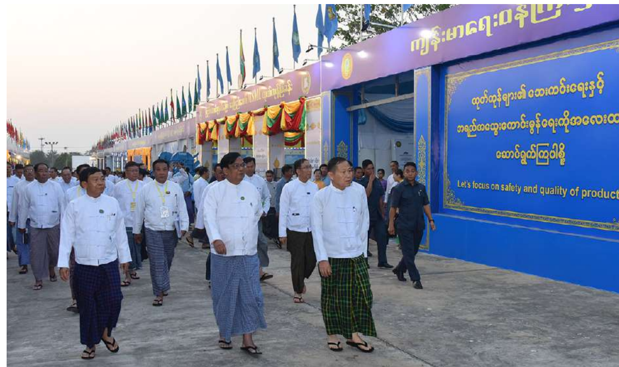
အသေးစား၊ အလတ်စားနှင့် အလတ်စားစီးပွားရေးလုပ်ငန်းများ ဖွံ့ဖြိုးတိုးတက်ရေးလုပ်ငန်းကော်မတီဥက္ကဋ္ဌ နိုင်ငံတော်စီမံအုပ်ချုပ်ရေး ကောင်စီ ဒုတိယဥက္ကဋ္ဌ ဒုတိယဝန်ကြီးချုပ် ဒုတိယဗိုလ်ချုပ်မှူးကြီးစိုးဝင်း ပြခန်းအလိုက် ခင်းကျင်းပြသရန် ပြင်ဆင်ဆောင်ရွက်နေမှု များကို လိုက်လံကြည့်ရှုအားပေးစဉ်။

အနက် အဓိကအချက်မှာ ငွေကြေးအရင်း အနှီးမြေနေရာနှင့်လျှပ်စစ်ဓာတ်အားရရှိရေး ဖြစ်ကြောင်း၊ အရင်းအနှီးနှင့်စပ်လျဉ်း၍ MSME လုပ်ငန်းကော်မတီတွင် လုပ်ငန်းရှင် များချေးငွေရရှိရေးအတွက် အတတ်နိုင်ဆုံး ဖြေလျှော့မှုများ ဆောင်ရွက်ပေးထား ကြောင်း၊ မြေနေရာရရှိရေးနှင့်စပ်လျဉ်း၍ လုပ်ငန်းကော်မတီမှ တာဝန်ရှိသူများက ရသင့်ရထိုက်သည်များကို စီမံဆောင်ရွက် ပေးလျက်ရှိကြောင်း၊ MSME လုပ်ငန်းရှင်များ ၏ အဓိကတင်ပြချက်ဖြစ်သည့် လျှပ်စစ်ရရှိ ရေးကိစ္စနှင့်စပ်လျဉ်း၍ တစ်နိုင်လုံးအနေ ဖြင့် လျှပ်စစ်ဓာတ်အားထုတ်လုပ်မှုမှာမဂ္ဂါဝပ် ၆၃၀၀ ကျော်ရှိကြောင်း၊ သို့သော်လည်း အကြောင်းအမျိုးမျိုးကြောင့် ရပ်တန့်နေမှု များနှင့် အကြမ်းဖက်မှုဖြစ်စဉ်များကြောင့် ထုတ်လုပ်နိုင်မှုရပ်ဆိုင်းနေသည့် စက်ရုံများရှိ ကြောင်း၊ လျှပ်စစ်ဝန်ကြီးဌာနကထုတ်လုပ် နိုင်သည့် ပမာဏပေါ်မူတည်၍ အလှည့်ကျ ရရှိရေးအတွက် အတတ်နိုင်ဆုံးစီစဉ်ဆောင် ရွက်ပေးလျက်ရှိကြောင်း၊ အဆိုပါ လျှပ်စစ် ဓာတ်အားရရှိရေးကျော်လွှားနိုင်မည့် မိမိတို့ စက်ရုံ၊ အလုပ်ရုံများကို အသိပညာပေး လိုသည်မှာ လက်ရှိ သီလဝါစက်မှုဇုန်၌ ကုမ္ပဏီ ခြောက်ခုမှ ဆိုလာစနစ်ဖြင့်ဓာတ်အား ထုတ်လုပ်မှု ၄ ဒသမ ၉ မဂ္ဂါဝပ်ကျော် ထုတ် လုပ်သုံးစွဲလျက်ရှိကြောင်း၊ ထိုသို့ထုတ်လုပ် နိုင်မှုကြောင့် လုပ်ငန်းများဆောင်ရွက်ရာ တွင်ပိုမိုတွင်ကျယ်လာကြောင်း၊ အဆိုပါ ဆောင်ရွက်မှုကို နမူနာယူပြီး အခြားကုမ္ပဏီ များက လျှပ်စစ်ဓာတ်အား ၈ မဂ္ဂါဝပ်ကျော် ထုတ်လုပ်သုံးစွဲနိုင်ရေးစီမံဆောင်ရွက်လျက် ရှိကြောင်း၊ ယင်းသို့ဆောင်ရွက်ခြင်းဖြင့် တစ်ပိုင်တစ်နိုင် မိမိလုပ်ငန်းအတွက်လျှပ်စစ် ဓာတ်အားပြည့်ဝစွာ သုံးစွဲရသည့်အပြင်