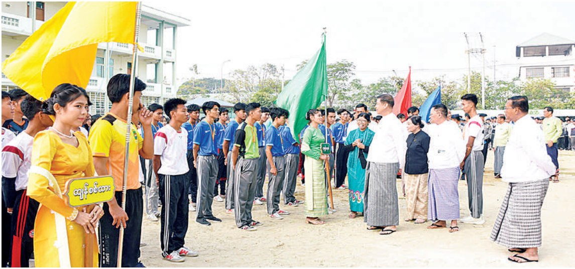
အခမ်းအနား၌ တိုင်းဒေသကြီးဝန်ကြီး ချုပ်က အဖွဲ့အမှတ်စကားပြောကြားပြီး တိုင်းဒေသကြီး ဝန်ကြီးချုပ်နှင့် အဖွဲ့၊ ဖဲကြိုးဖြတ်ဖွင့်လှစ်ပေး၍ ပြိုင်ပွဲဝင် ကျောင်းအုပ်ကြီးတို့က အားကစားပြိုင်ပွဲကို အားကစားသမားများက အားကစားသဘော သတင်းရရှိသည်။ မျိုးကျော်

မန္တလေး ဖေဖော်ဝါရီ ၅ ၇၈ နှစ်မြောက် ပြည်ထောင်စုနေ့အကြို မန္တလေး ပညာရေးဒီဂရီကောလိပ် အားကစားပြိုင်ပွဲ ဖွင့်ပွဲအခမ်းအနားကို ယနေ့နံနက်ပိုင်းက ချမ်းအေးသာစံမြို့နယ်ရှိ အဆိုပါဒီဂရီကောလိပ်တွင် ကျင်းပရာ မန္တလေးတိုင်းဒေသကြီး ဝန်ကြီးချုပ် ဦးမျိုးအောင်၊ တိုင်းဒေသကြီး တရားလွှတ်တော် တရားသူကြီးချုပ်၊ တိုင်းဒေသကြီးဝန်ကြီးများနှင့် တာဝန်ရှိသူများ၊ ကျောင်းအုပ်ကြီးနှင့် အားကစား ပြိုင်ပွဲကျင်းပရေးကော်မတီ အဖွဲ့ဝင်များ၊ ဆရာဆရာမများ၊ကျောင်းသား၊ ကျောင်း သူစုစုပေါင်း ၁၂၅၂ ဦးနှင့် ဖိတ်ကြားထား သူများ တက်ရောက်ကြသည်။