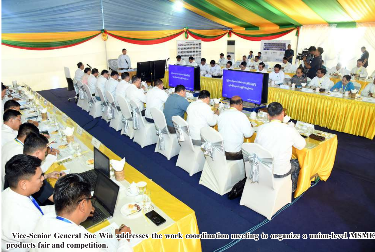
Vice-Senior General Soe Win addresses the work coordination meeting to organize a union-level MSME products fair and competition.