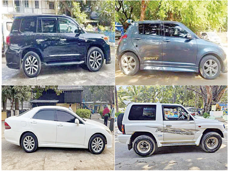
၂၀၂၅ ခုနှစ် ဇန်နဝါရီလအတွင်း ဖမ်းဆီးရမိမှုကို တွေ့ရစဉ်။

နေပြည်တော် ဖေဖော်ဝါရီ ၅ တရားမဝင်ကုန်သွယ်မှုတိုက်ဖျက်ရေး ဦးဆောင်ကော်မတီ၏ ကြီးကြပ်ကွပ်ကဲမှုဖြင့် နေပြည်တော်ကောင်စီနယ်မြေအပါအဝင် တိုင်းဒေသကြီး၊ ပြည်နယ်များတွင် တရားမဝင်ကုန်သွယ်မှုတိုက်ဖျက်ရေးအထူးအဖွဲ့များကို ဖွဲ့စည်း၍လည်းကောင်း၊ အကောက်ခွန်ဦးစီးဌာနက ဦးဆောင်သည့် One Stop Service ဌာနဆိုင်ရာအဖွဲ့များဖွဲ့စည်း၍လည်းကောင်း၊ နယ်စပ်ဝင်ထွက်ဂိတ်များ၊ နယ်စပ်ကုန်သွယ်ရေးရုံးနှင့် စခန်းများ၊ အမြဲတမ်းစစ်ဆေးရေးစခန်းများ၊ ကုန်သွယ်မှုလမ်းကြောင်းတစ်လျှောက်နှင့် ကုန်ပစ္စည်းသိုလှောင်ရုံများ၊ အပြည်ပြည်ဆိုင်ရာဆိပ်ကမ်းများနှင့် လေဆိပ်များ၊ ကမ်းရိုးတန်းဆိပ်ကမ်းများတွင် တရားမဝင်ကုန်သွယ်မှုတိုက်ဖျက်ရေးလုပ်ငန်းများကို ထိရောက်စွာဆောင်ရွက်လျက်ရှိရာ သတင်းအချက်အလက်ရရှိမှုသည် အလွန်အရေးပါသည်။ တာဝန်သိပြည်သူများ၏ သတင်းပေးတိုင်ကြားမှုများကြောင့် စာမျက်နှာ ၂၂ ကော်လံ ၁ ☆