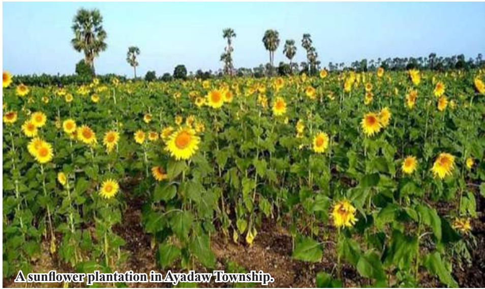
A sunflower plantation in Ayadaw Township.

Ayadaw February 5 According to the Department of Agriculture in Monywa District of Sagaing Region, sunflower cultivation in Ayadaw Township has reached 2,705 acres for the winter crop season.