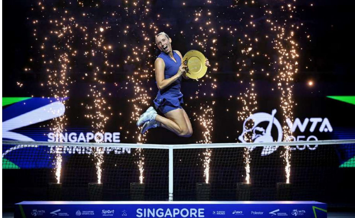
စင်ကာပူ ဖေဖော်ဝါရီ ၂ မာတန်နှင့် အမေရိကန်တင်းနစ်မယ် သိရသည်။ စင်ကာပူနိုင်ငံတွင် ကျင်းပခဲ့သည့် အန်နာလီတို့ ယှဉ်ပြိုင်ကစားခဲ့ရာ မာတန်အနေဖြင့် ၁၇ လတာကာလ Singapore Open တင်းနစ်ပြိုင်ပွဲ ဗိုလ်လု မာတန်က (၆-၁၊ ၆-၄)ရလဒ်ဖြင့် အနိုင် အတွင်း ပထမဆုံးဆွတ်ခူးနိုင်ခဲ့သည့် ပွဲစဉ်တွင် ဘယ်လ်ဂျီယံတင်းနစ်မယ် ရရှိကာ ချန်ပီယံဆုကို ဆွတ်ခူးခဲ့ကြောင်း စာမျက်နှာ ၂၀ ကော်လံ ၁ ☆

၂၀၂၅ ခုနှစ် ဖေဖော်ဝါရီ ၂ ရက် ဓာတ်သတ္တု(ရွှေ) ရည်ညွှန်းဈေး (Market Rate) သိပ်သည်းဆ ၁၉.၂၅ ဂရမ် / ကုဗစင်တီမီတာနှင့်အထက်ရှိ စံချိန်မီ ရွှေတစ်ကျပ်သား (၁၆.၃၂၉၃၂၅ ဂရမ်) ၏ ဈေးနှုန်း ၅၄၅၀၀၀၀ ကျပ်။ ဓာတ်သတ္တု(ရွှေ)ရည်ညွှန်းဈေး သတ်မှတ်ရေးကော်မတီ