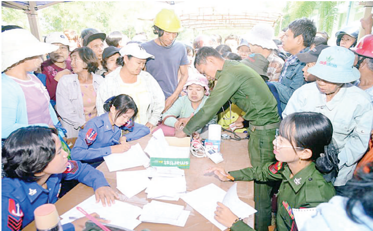
တပ်မတော်ပင်လယ်သွားဆေးရုံရေယာဉ်(သံလွင်)မှ နယ်လှည့်အထူးကုဆေးအဖွဲ့က ရောဂါတိုင်းဒေသကြီး ငပုတောမြို့နယ် ဟိုင်းကြီးကျွန်းမြို့နှင့် အနီးဝန်းကျင်မှ ဒေသခံပြည်သူများကို ကျန်းမာရေးစောင့်ရှောက်မှုလုပ်ငန်းများ ဆောင်ရွက်ပေးစဉ်။

စစ်မှန်စည်းကမ်းပြည့်ဝသည့် ပါတီစုံဒီမိုကရေစီစနစ်ခိုင်မာစေရေးနှင့် ဒီမိုကရေစီနှင့် ဖက်ဒရယ်စနစ်ကို အခြေခံသည့် ပြည်ထောင်စုတည်ဆောက်ရေးလုပ်ငန်းစဉ်များကို အရှိန်အဟုန်ဖြင့် ဆက်လက်ဆောင်ရွက်သွားမည်။ ဆန္ဒမဲပေးပိုင်ခွင့်ရှိသူအားလုံး၏အခွင့်အရေးများ နစ်နာမှုမရှိစေရေးနှင့် နည်းလမ်းကျန်ကုန်မှုရှိသည့် အထွေထွေရွေးကောက်ပွဲတစ်ရပ်ဖြစ်စေရေးဆောင်ရွက်ခြင်း၊ အရေးပေါ်ကာလဆိုင်ရာပြဋ္ဌာန်းချက်များနှင့်အညီ ဆောင်ရွက်ခြင်းတို့ပြီးစီးပါက လွတ်လပ်ပြီး တရားမျှတသော ပါတီစုံဒီမိုကရေစီအထွေထွေရွေးကောက်ပွဲကျင်းပ၍ ထွက်ပေါ်လာသည့်အစိုးရအား နိုင်ငံတော်တာဝန်လွှဲအပ်နိုင်ရေး ဆက်လက်ဆောင်ရွက်သွားမည်။