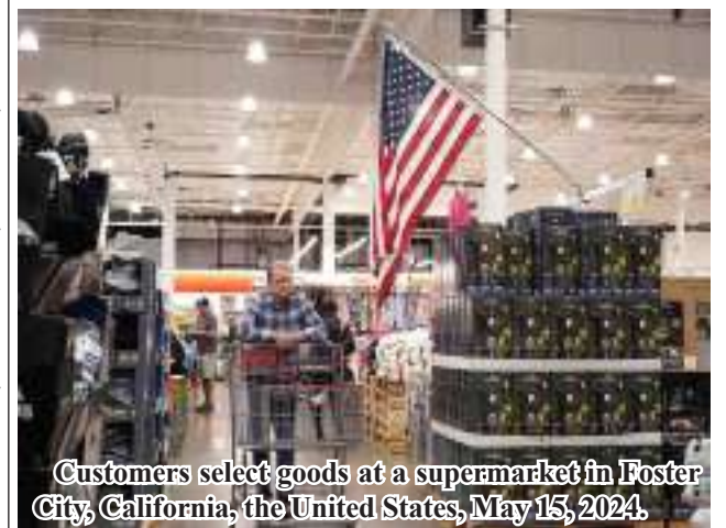
Customers select goods at a supermarket in Foster City, California, the United States, May 15, 2024.