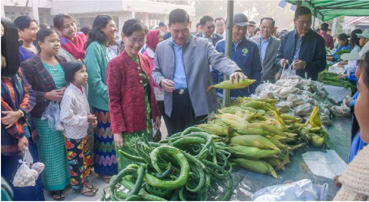
စစ်တွေ ဖေဖော်ဝါရီ ၂ ရခိုင်ပြည်နယ်ဝန်ကြီးချုပ် ဦးထိန်လင်း သည် အနောက်ပိုင်းတိုင်းစစ်ဌာနချုပ် တိုင်းမှူး၊ ပြည်နယ်အစိုးရအဖွဲ့ဝင်များ၊ စစ်တွေတပ်နယ်မှ တပ်မတော်အရာရှိကြီး များ၊ ဌာနဆိုင်ရာတာဝန်ရှိသူများနှင့်အတူ ယနေ့နံနက်ပိုင်းက စစ်တွေမြို့ ရှေးဟောင်း သမိုင်းဝင် လက်ဝဲသလုံးတော်စာတော် မြတ်အား သွားရောက်ဖူးမြော် ကြည့်ညိုကြပြီး ပန်း၊ ရေချမ်း၊ ဆီမီးများ ကပ်လှူပူဇော်ကြသည်။ ဆက်လက်၍ ပြည်နယ်ဝန်ကြီးချုပ်နှင့် ထို့နောက် ပြည်နယ်ဝန်ကြီးချုပ်နှင့်အဖွဲ့

အဖွဲ့သည် စေတီတော်ဓမ္မာရုံ၌ လက်ဝဲ သလုံးတော်စာတော် စေတီတော်မြတ်အား ထီးတော်တင်လှူနိုင်ရန်နှင့် ဘက်စုံပြုပြင် မွမ်းမံနိုင်ရန်အတွက် စေတီတော်ဂေါပက အဖွဲ့ဝင်များနှင့် တွေ့ဆုံဆွေးနွေးကြပြီး စေတီတော်တွင် ဆီမီးပူဇော်ရန်အတွက် အလှူငွေများ ထည့်ဝင်လှူဒါန်းကြသည်။ ဆက်လက်၍ ပြည်နယ်ဝန်ကြီးချုပ်နှင့် အဖွဲ့သည် စေတီတော်အနီးပတ်ဝန်းကျင် သန့်ရှင်းသာယာရေး ဆောင်ရွက်ထားရှိမှု အား လှည့်လည်ကြည့်ရှုကြပြီး ကန်တော် ကြီး၌ ဇီဝိတဒါနအဖြစ် ငါးလွတ်ကုသိုလ် ကောင်းမှုပြုကြသည်။ ယင်းနောက် ပြည်နယ်ဝန်ကြီးချုပ်နှင့် အဖွဲ့သည် ရန်အောင်ဇေယျသုခမင်္ဂလာ စေတီတော်အား သွားရောက်ဖူးမြော် ကြည့်ညိုကြပြီး ပန်း၊ ရေချမ်း၊ ဆီမီးများ ကပ်လှူပူဇော်ကြကာ စေတီတော်ဘက်စုံ ပြုပြင်မွမ်းမံနိုင်ရန်အတွက် အလှူငွေများ ထည့်ဝင်လှူဒါန်းခဲ့ကြသည်။ ထို့နောက် ပြည်နယ်ဝန်ကြီးချုပ်နှင့်အဖွဲ့ သည် ရခိုင်ပြည်နယ်အစိုးရအဖွဲ့၏ အစီအစဉ်ဖြင့် ဝန်ထမ်းများအား အခြေခံစားကုန်နှင့် သား၊ ငါး၊ ကြက်ဥ၊ ဟင်းသီးဟင်းရွက်များအား ဈေးနှုန်းသက်သာစွာ ရောင်းချပေးနေမှုကို သွားရောက်ကြည့်ရှုအားပေးကြသည်။ ဦးစွာ ပြည်နယ်ဝန်ကြီးချုပ် ဦးထိန်လင်းနှင့်အဖွဲ့သည် ဝန်ထမ်းများအား ရောင်းချပေးမည့်အခြေခံစားကုန်နှင့် သား၊ ငါး၊ ကြက်ဥ၊ ဟင်းသီးဟင်းရွက်များ ခင်းကျင်း ထားရှိမှုကို လှည့်လည်ကြည့်ရှုအားပေးပြီး ဈေးဝယ်ရန်ရောက်ရှိလာကြသည့် ဝန်ထမ်း များကို ရင်းရင်းနှီးနှီးတွေ့ဆုံနှုတ်ဆက် ခဲ့သည်။ ထို့နောက် ပြည်နယ်ဝန်ကြီးချုပ်က အခြေခံစားသုံးကုန်များနှင့် သား၊ ငါးများ ပြတ်လပ်မှုမရှိစေရေးနှင့် ဈေးနှုန်းမြင့်တင် ရောင်းချခြင်းမရှိစေရေးတို့ကို စိစစ် ကြပ်မတ်ဆောင်ရွက်သွားရန် တာဝန်ရှိ သူများအား မှာကြားခဲ့ကြောင်း သတင်း ရရှိသည်။ တင်ထွန်း(ပြန်/ဆက်)