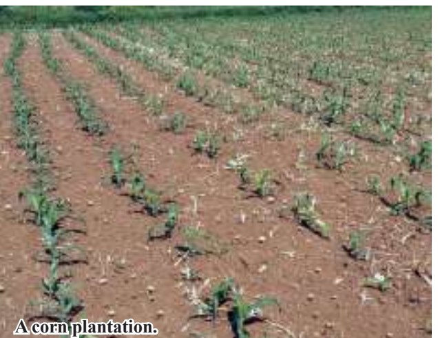
A corn plantation.

50 baskets of seed corn are produced per acre, and the cost of planting one acre of seed corn is 500,000 kyats. A total of 15,000 corn ears of millets are produced per acre, and the cost of planting one acre is over 500,000 kyats. 206