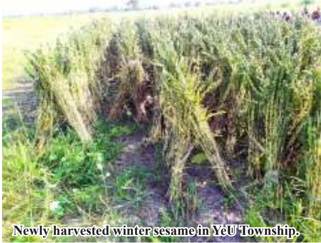
Newly harvested winter sesame in YeU Township.

“The total cultivated area for winter sesame in YeU