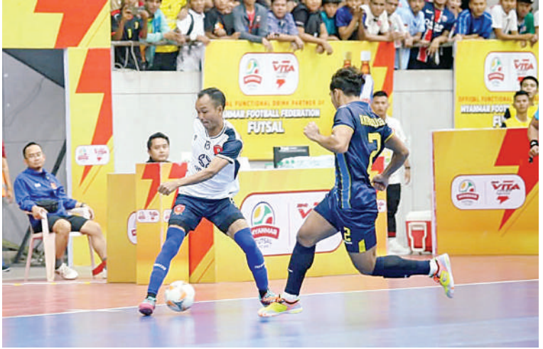
MH Dream Team အသင်းနှင့် MIU FC အသင်းတို့ ယှဉ်ပြိုင်ကစားနေမှုကို တွေ့ရစဉ်။

ရန်ကုန် ဖေဖော်ဝါရီ ၂ စတင်ပြီး ရန်ကုန်မြို့ MFF Futsal Stadium တွင်ကျင်းပခဲ့ရာ MH Dream Team နှင့် သဲသောင်ပြင်ကော်မတီက ကြီးမှူး အသင်းကိုအနိုင်ရရှိခဲ့ကာ MIU FC အသင်း က ရာသီဝက်ချန်ပီယံအဖြစ် ပွဲစဉ်(၉) ပွဲစဉ်များကို ယနေ့နံနက်၉နာရီမှ စာမျက်နှာ ၂၂ ကော်လံ ၃ ❖