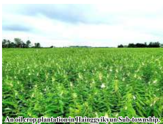
An oilcrop plantation in Hainggyikyun Sub-township.

oilseed crops meet the target, the Department of Agriculture, the authorities, and local farmers have carried out agricultural technology and pest control activities in advance before planting the crops. KKL