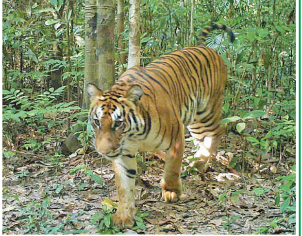
ထမံသီတောရိုင်းတိရစ္ဆာန်ဘေးမဲ့တောအတွင်း ကျက်စားနေသည့် ဘင်္ဂလားကျားကို တွေ့ရစဉ်။

နေပြည်တော် ဖေဖော်ဝါရီ ၂ စစ်ကိုင်းတိုင်းဒေသကြီး ခန္တီးမြို့နယ်နှင့် ဟုမ္မလင်းမြို့နယ်အတွင်း တည်ရှိသည့် ထမံသီတောရိုင်းတိရစ္ဆာန်ဘေးမဲ့တောရှိ ရှားပါးစာရင်းဝင် ဘင်္ဂလားကျား၊ ဝက်ဝံမျိုးစိတ်နှင့် တောရိုင်းတိရစ္ဆာန်များ၏ ကျက်စားနေထိုင်မှုကို ကင်မရာထောင်ချောက် ၂၄ လုံးတပ်ဆင်၍ ရက် ၉၀ ကြာမှတ်တမ်းတင်စာရင်းပြုစုနေကြောင်း ထမံသီတောရိုင်းတိရစ္ဆာန်ဘေးမဲ့တော အုပ်ချုပ်ရေးမှူးရုံးမှ သိရသည်။ စာမျက်နှာ ၁၇ ကော်လံ ၁