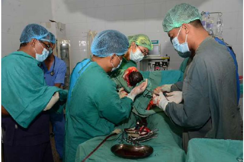
တပ်မတော်မှ ပါရဂူများ၊ ဆေးမှူးများ၊ သူနာပြုများပါဝင်သော နယ်လှည့်အထူးကုဆေး အဖွဲ့က ရောဂါတိုင်းဒေသကြီး ငပုတောမြို့နယ် ဟိုင်းကြီးကျွန်းမြို့နှင့် အနီးဝန်းကျင်မှ ဒေသခံပြည်သူများကို ကျန်းမာရေးစောင့်ရှောက်မှုလုပ်ငန်းများ ဆောင်ရွက်ပေးစဉ်။

“မရမ်းကွင်းကပါ၊ မျက်စိလာပြတာပါ၊ ဆရာဝန်က ပုသိမ်သွားပြီး မျက်မှန်လုပ်ဖို့ ပြောပါတယ်၊အရင်ကလည်း မျက်စိပြုဖူးပါ တယ်၊ အခုတော်တော်အဆင်ပြေသွားပါပြီ၊ မျက်စိလည်း အရင်ထက်ကြည့်ရတာ ပိုကောင်းသွားတယ်၊အထူးကိုပဲကျေးဇူးတင် ပါတယ်၊ဒီမှာထမင်းလည်းကျွေးတယ်၊ကားခ ကအစ လမ်းစရိတ်အကုန် စရိတ်ငြိမ်းလုပ် ပေးတာပါ။ ဒါကြောင့်မို့ ကျွန်မတို့က ကျေးဇူးတင်ပါတယ်၊ဒီဆေးသင်တန်းလာမယ် ဆိုတာကိုလူကြီးကဖုန်းဆက်ပြီးအကုန်ပြော ပေးတယ်၊ အဲ့တော့သားတွေကိုပြောတယ်၊ ဆရာဝန်တွေပါရဂူတွေရောက်မယ်လို့ဆိုပြီး လာပြတာ မနေ့ကလည်းလာသေးတယ်၊ သင်တန်းကရောက်သေးလို့ ဒီနေ့ထပ်လာ ပြတာပါ။ သင်တန်းဆိုတာက ကားနဲ့ လာကြိုပေးတယ်၊ ထမင်းကျွေးတဲ့သူတွေ ရောလာကုပေးကြတဲ့ ဆရာဝန်တွေရော ဆရာ၊ဆရာမတွေအကုန်လုံးကိုကျေးဇူးတင် ပါတယ်”ဟု ပြောပြသည်။ (၅၀၀)