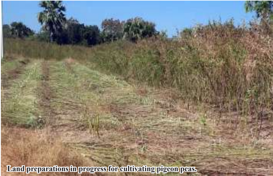
Land preparations in progress for cultivating pigeon peas.

Ayadaw February 2 Township, Monywa District, Sagaing Region, according to the statistics of the Department of Agriculture for Monywa District. In Ayadaw Township, 25,410 acres of pigeon peas were planted during the rainy season, and the pigeon peas were harvested