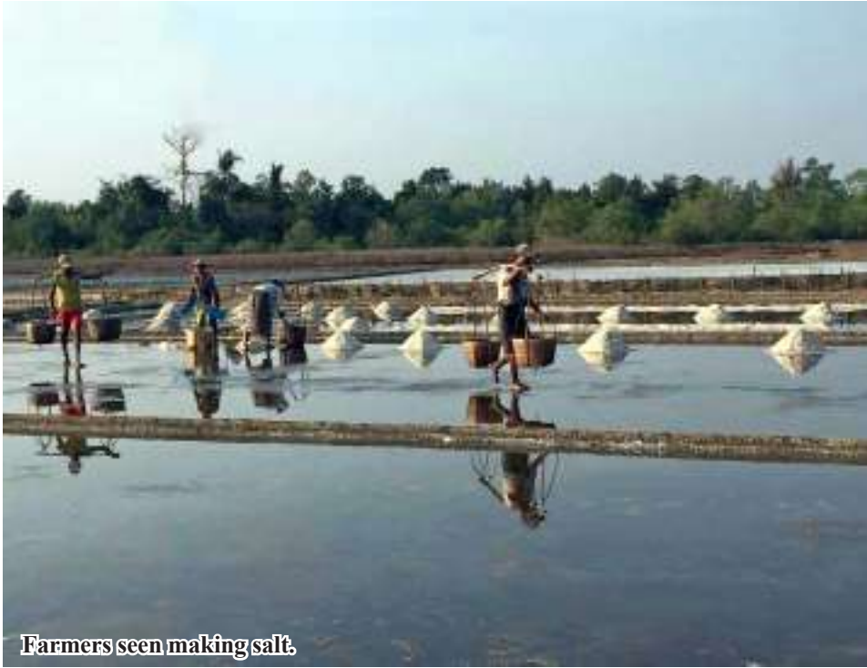
Farmers seen making salt.

72,000 visses of sun-dried salt to the Yangon market in December.