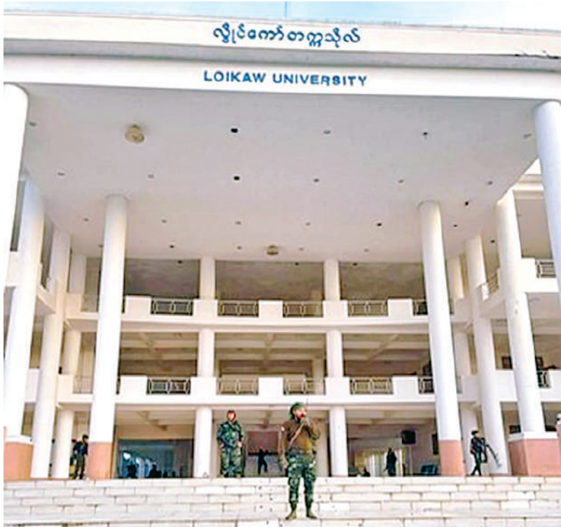
KNPP/KNDF အဖွဲ့နှင့် PDF အမည်ခံအကြမ်းဖက်အဖွဲ့များက စစ်ရေးပစ်မှတ် မဟုတ်သည့် လွိုင်ကော်တက္ကသိုလ်အတွင်း စီးနင်းဝင်ရောက်မှုအား အွန်လိုင်းအထောက်အထား ဓာတ်ပုံများမှတစ်ဆင့် တွေ့မြင်ရစဉ်။