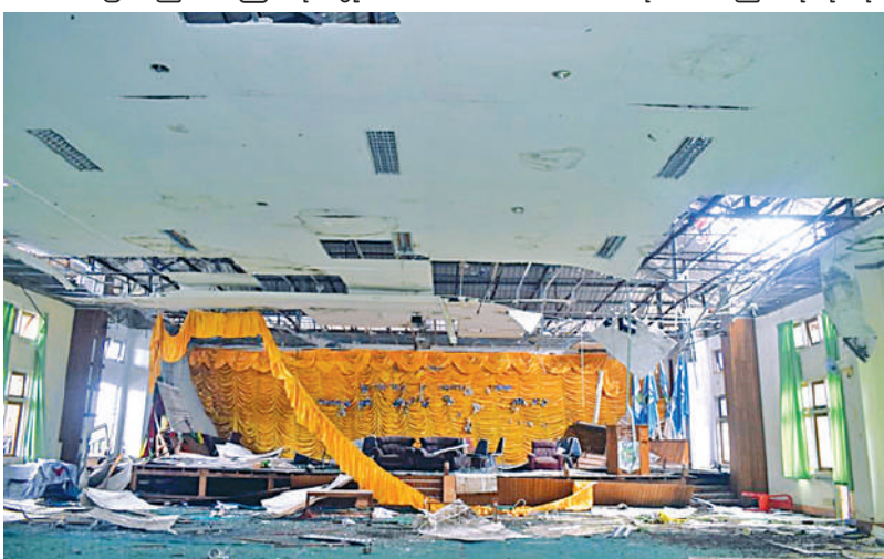
KNPP/KNDF အဖွဲ့နှင့် PDF အမည်ခံအကြမ်းဖက်အဖွဲ့များဖျက်ဆီးမှုကြောင့် လွိုင်ကော်တက္ကသိုလ်ပျက်စီးမှုအခြေအနေကို တွေ့ရစဉ်။

အခုအခါ လွိုင်ကော်မြို့၏အခြေအနေ မှာ တည်ငြိမ်မှု ရှိနေပြီဖြစ်သည့်အတွက် ၂၀၂၄-၂၀၂၅ပညာသင်နှစ်ကစပြီး လွိုင်ကော် နည်းပညာတက္ကသိုလ်၊ စာမျက်နှာ ၁၈ သို့