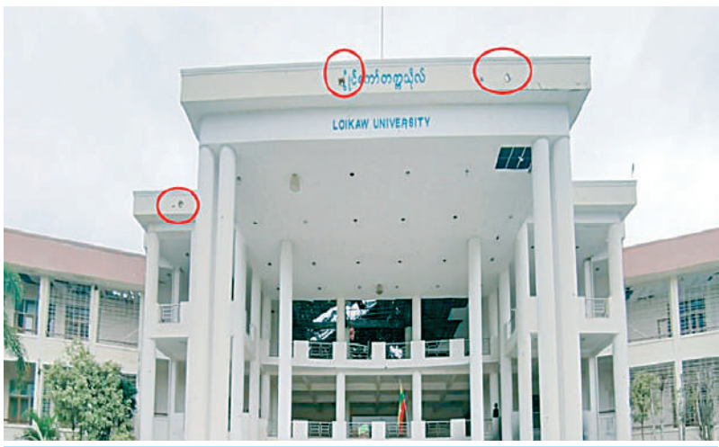
KNPP/KNDF အဖွဲ့နှင့် PDF အမည်ခံအကြမ်းဖက်အဖွဲ့များက လွိုင်ကော်တက္ကသိုလ်ပေါ်မှ အကာအကွယ်ရယူ၍ လုံခြုံရေးတပ်ဖွဲ့ဝင်များကို ပစ်ခတ်တိုက်ခိုက်ခဲ့သည့် နေရာအား တွေ့မြင်ရစဉ်။

၂၀၂၃ ခုနှစ် နိုဝင်ဘာ ၁၃ ရက်နှင့် ၁၄ ရက်တွင် KNPP/KNDF အဖွဲ့နှင့် PDF အမည်ခံအကြမ်းဖက်အဖွဲ့တို့သည် စစ်ရေး