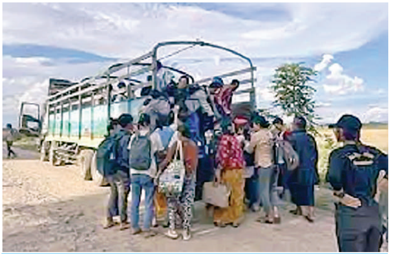
KNPP/KNDF အဖွဲ့နှင့် PDF အမည်ခံအကြမ်းဖက်အဖွဲ့များက လွိုင်ကော်တက္ကသိုလ်မှ ဆရာ၊ ဆရာမများ၊ ပညာရေးဝန်ထမ်းများနှင့် ကျောင်းသား၊ ကျောင်းသူများအား အတင်းအဓမ္မ ဖမ်းဆီးခေါ်ဆောင်သွားမှုအား အွန်လိုင်းအထောက်အထားဓာတ်ပုံများမှ တစ်ဆင့် တွေ့မြင်ရစဉ်။

ကမ္ဘာ့နိုင်ငံအများစုက ထောက်ခံအတည်ပြုထားသည့် လုံခြုံစိတ်ချသည့် ကျောင်းများဆိုင်ရာကြေညာချက်(The Safe Schools Declaration)တွင်လည်း လက်နက်ကိုင်ပဋိပက္ခ၏ အဆိုးရွားဆုံးသက်ရောက်မှုများကနေ ကျောင်းသား၊ ကျောင်းသူများ၊ ဆရာ၊ ဆရာမများ၊ ကျောင်းများနှင့်