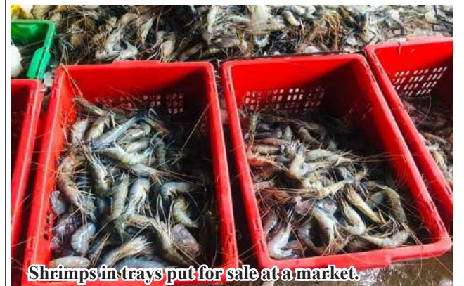
Shrimps in trays put for sale at a market.