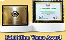
Exhibition Vanue Award

၇၈ လမ်း နှင့် ၃၈ လမ်းထောင့်၊ မဟာအောင်မြေမြို့နယ်၊ မန္တလေးမြို့။ ဖုန်း - ၀၉ ၆၉၅၀၀၈၆၈၀၊ ၀၉ ၆၆၇၈၉၉၉၁၊ ၀၉ ၆၆၇၈၉၉၉၂၊ ၀၂ ၄၀၃၀၄၃၈၊ ၀၂ ၄၀၃၀၄၃၉။