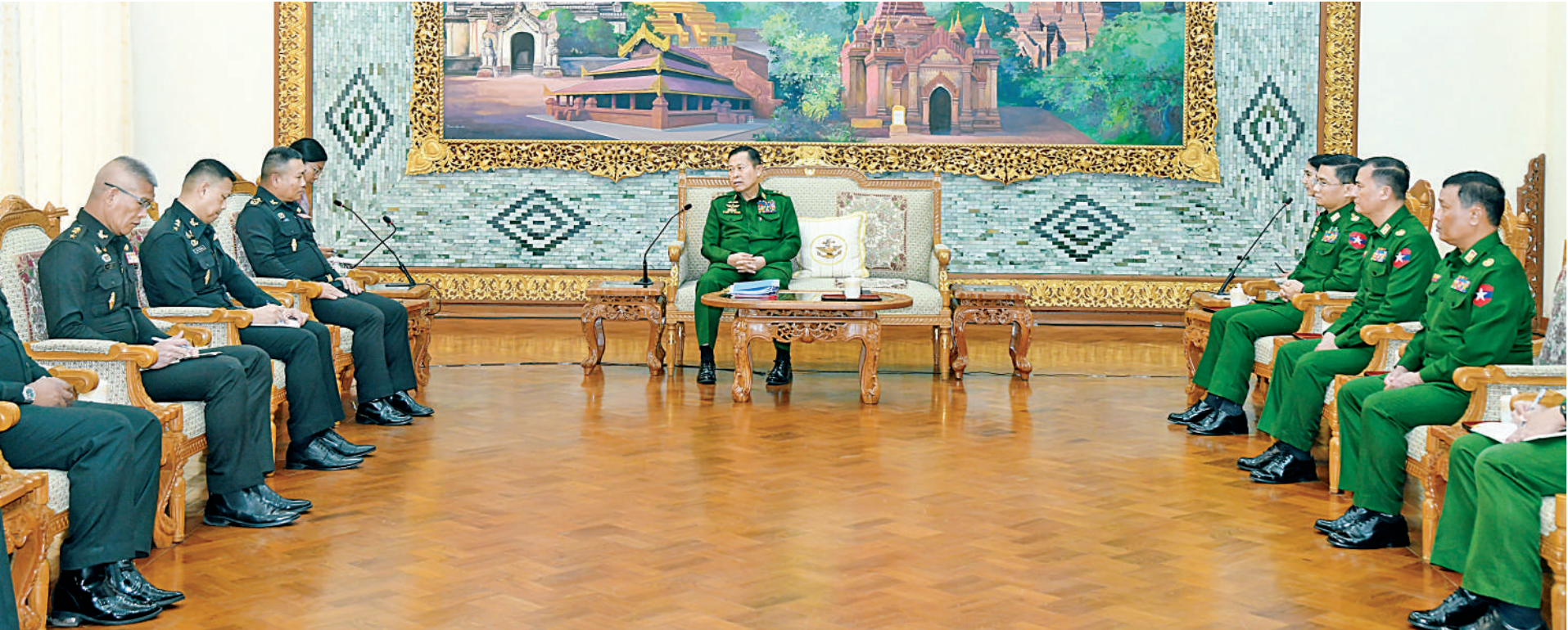
နိုင်ငံတော်စီမံအုပ်ချုပ်ရေးကောင်စီ ဒုတိယဥက္ကဋ္ဌ ဒုတိယတပ်မတော်ကာကွယ်ရေးဦးစီးချုပ် ကာကွယ်ရေးဦးစီးချုပ်(ကြည်း) ဒုတိယဗိုလ်ချုပ်မှူးကြီးစိုးဝင်း ထိုင်းဘုရင့်ကြည်းတပ်ဦးစီးချုပ်ရုံး အကြံပေးဘုတ်အဖွဲ့ ဥက္ကဋ္ဌနှင့် Army Operations Center၊ Neighboring Countries Coordination Center(NCCC)ဌာနတာဝန်ခံ General Direk Bongkarn ဦးဆောင်သည့်ကိုယ်စားလှယ်အဖွဲ့ကို လက်ခံတွေ့ဆုံစဉ်။

နေပြည်တော် ဇန်နဝါရီ ၂၁ နိုင်ငံတော်စီမံအုပ်ချုပ်ရေးကောင်စီ ဒုတိယဥက္ကဋ္ဌ ဒုတိယတပ်မတော်ကာကွယ်ရေးဦးစီးချုပ် ကာကွယ်ရေးဦးစီးချုပ်(ကြည်း) ဒုတိယဗိုလ်ချုပ်မှူးကြီးစိုးဝင်း သည် ထိုင်းဘုရင့်ကြည်းတပ်ဦးစီးချုပ်ရုံး အကြံပေးဘုတ်အဖွဲ့ဥက္ကဋ္ဌနှင့် Army Operations Center၊ Neighboring Countries Coordination Center (NCCC)ဌာနတာဝန်ခံ General Direk Bongkarn ဦးဆောင်သည့် ကိုယ်စားလှယ်အဖွဲ့ကို ယနေ့မွန်းလွဲပိုင်းတွင် နေပြည်တော်ရှိဘုရင့်နေောင်ရိပ်သာဧည့်ခန်းမဆောင်၌ လက်ခံတွေ့ဆုံသည်။ ထိုသို့ တွေ့ဆုံဆွေးနွေးရာတွင် နှစ်နိုင်ငံနှင့် တပ်မတော်နှစ်ရပ်အကြား သံတမန်ဆက်ဆံရေးနှင့် ချစ်ကြည်ရင်းနှီးမှုများ ကောင်းမွန်လျက်ရှိမှုအခြေအနေများ၊ တပ်မတော်နှစ်ရပ်အကြား ခေါင်းဆောင်များနှင့် အဆင့်မြင့်တပ်မတော်အရာရှိကြီးများ အချင်းချင်း ဆက်ဆံရေးတိုးတက်ကောင်းမွန်လျက်ရှိသကဲ့သို့ ပူးပေါင်းဆောင်ရွက်မှုများတိုးတက်ကောင်းမွန်လျက်ရှိမှုအခြေအနေများ၊ နှစ်နိုင်ငံတပ်မတော်နှစ်ရပ်အကြား အဆင့်အလိုက် အစည်းအဝေးများ နှစ်စဉ် အောင်မြင်စွာကျင်းပနိုင်မှုအခြေအနေများ၊ နယ်စပ်ဒေသတွင် ဖြစ်ပွားလျက်ရှိသည့် တရားမဝင်လူကုန်ကူးမှုများ၊ စာမျက်နှာ ၁၉ ကော်လံ ၁