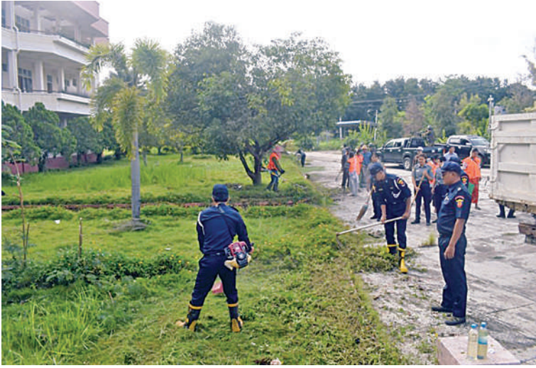
လွိုင်ကော်တက္ကသိုလ်အတွင်း စုပေါင်းသန့်ရှင်းရေးဆောင်ရွက်နေမှုကို တွေ့ရစဉ်။