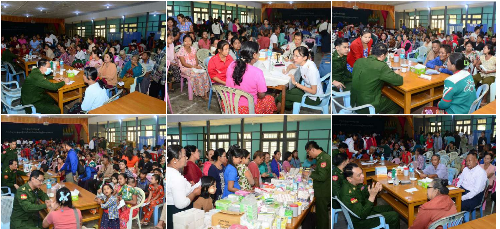
တပ်မတော်ပင်လယ်သွားဆေးရုံရေယာဉ်(သံလွင်)မှ နယ်လှည့်အထူးကုဆေးအဖွဲ့က တနင်္သာရီတိုင်းဒေသကြီး ကျွန်းစုမြို့နယ် ကျွန်းစုမြို့နှင့် အနီးဝန်းကျင်မှ ဒေသခံပြည်သူများကို ကျန်းမာရေးစောင့်ရှောက်မှု လုပ်ငန်းများဆောင်ရွက်ပေးစဉ်။

နေပြည်တော် ဇန်နဝါရီ ၂၁ တနင်္သာရီ ကမ်းရိုးတန်းဒေသတစ်လျှောက်မှ ဒေသခံပြည်သူများရန်ကုန်တိုင်းဒေသကြီး ကိုကျွန်းမြို့နယ်နှင့် ဧရာဝတီတိုင်းဒေသကြီး ဟိုင်းကြီးကျွန်းမြို့နယ် အနီးပတ်ဝန်းကျင်ကျေးရွာများမှ ဒေသခံပြည်သူများကို ကျန်းမာရေးစောင့်ရှောက်မှုလုပ်ငန်းများဆောင်ရွက်ပေးရန် ပါရဂူများ၊ ဆေးမှူးများနှင့် သူနာပြုများပါဝင်သော နယ်လှည့်အထူးကုဆေးအဖွဲ့များ လိုက်ပါလာသည့် တပ်မတော်ပင်လယ်သွားဆေးရုံရေယာဉ်(သံလွင်)သည် ယနေ့တွင် တနင်္သာရီတိုင်းဒေသကြီး ကျွန်းစုမြို့ အထွေထွေအုပ်ချုပ်ရေးဦးစီးဌာနရုံးတွင် အခြေပြု၍ ကျွန်းစုမြို့နှင့် အနီးဝန်းကျင်မှ ဒေသခံပြည်သူ ၈၀၇ ဦးတို့ကို ကျန်းမာရေးစောင့်ရှောက်မှုလုပ်ငန်းများ ဆက်လက်ဆောင်ရွက်ပေးသည်။ ထိုသို့ဆောင်ရွက်ပေးရာတွင် ဆေးကုသမှုဆိုင်ရာရောဂါ ၂၇ ဦး၊ ခွဲစိတ်ရောဂါ ၆၂ ဦး၊ သားဖွားမီးယပ်ရောဂါ ၆၇ ဦး၊ ကလေးရောဂါ ၁၀၅ ဦး၊ အရိုးရောဂါ ၇၅ ဦး၊ နား၊ နှာခေါင်း၊ လည်ချောင်းရောဂါ ၄၁ ဦး၊ မျက်စိရောဂါ ၁၅၈ ဦးနှင့် သွားနှင့် ခံတွင်း