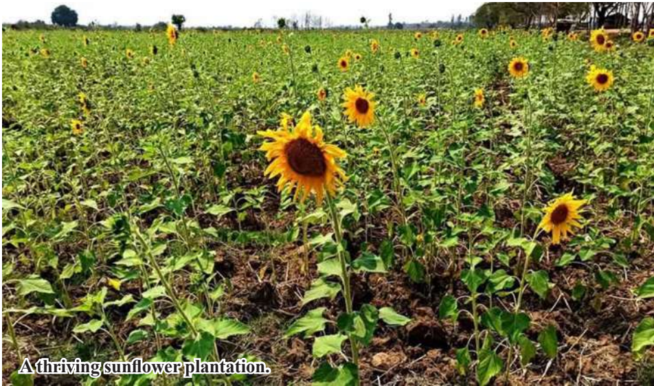
A thriving sunflower plantation.

of sunflower aims to reduce import of palm oil abroad. Hence, local farmers expand sown acreage of sunflower yearly. Yield of oil from sunflower is larger than sesame and groundnut."