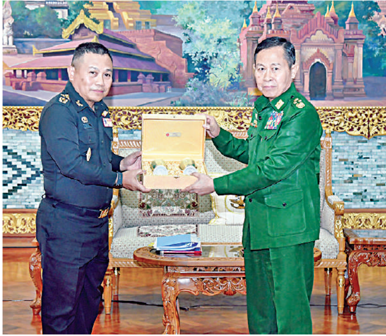
နိုင်ငံတော်စီမံအုပ်ချုပ်ရေးကောင်စီဒုတိယဥက္ကဋ္ဌ ဒုတိယတပ်မတော်ကာကွယ်ရေးဦးစီးချုပ် ကာကွယ်ရေးဦးစီးချုပ်(ကြည်း) ဒုတိယဗိုလ်ချုပ်မှူးကြီးစိုးဝင်းနှင့် ထိုင်းဘုရင့်ကြည်းတပ်ဦးစီးချုပ်ရုံး အကြံပေးဘုတ်အဖွဲ့ဥက္ကဋ္ဌနှင့် Army Operations Center၊ Neighboring Countries Coordination Center (NCCC) ဌာနတာဝန်ခံ General Direk Bongkarn တို့ အမှတ်တရလက်ဆောင်ပစ္စည်းများ အပြန်အလှန်ပေးအပ်ကြစဉ်။

၉ ရှေ့ဖုံးမှအဆက် အွန်လိုင်းငွေကြေး ပပျောက်ရေးအတွက် တပ်မတော်အကြား သင့်သည့်ကိစ္စရပ်များ၊ ထိုင်းနိုင်ငံက မြန်မာရေပိုင်နက်အတွင်း ငါးဖမ်းလှေနှင့် မြန်မာနိုင်ငံက အရေးယူထားရှိမှုနှင့် ဆက်လက်ဆောင်ရွက်လိုသည့် အစီအစဉ် များ၊ နယ်စပ်ဒေသတည်ငြိမ်အေးချမ်းရေး အတွက် သတင်းအချက်အလက်များ အပြန်အလှန်ဖလှယ်ရေးဆိုင်ရာ ကိစ္စရပ် များ၊ တပ်မတော်နှစ်ရပ်အကြား အဆင့်မြင့် တပ်မတော်အရာရှိကြီးများ ချစ်ကြည်ရေး ခရီးများ လည်ပတ်ရေးဆိုင်ရာကိစ္စရပ်များ နှင့် ပူးပေါင်းဆောင်ရွက်မှုများ တိုးမြှင့် ဆောင်ရွက်ရေးဆိုင်ရာ ကိစ္စရပ်များနှင့် ပတ်သက်၍ ခင်မင်ရင်းနှီးစွာဖြင့် အမြင်ချင်း ဖလှယ်ဆွေးနွေးခဲ့ကြသည်။ တွေ့ဆုံပွဲအပြီးတွင် နိုင်ငံတော်စီမံ