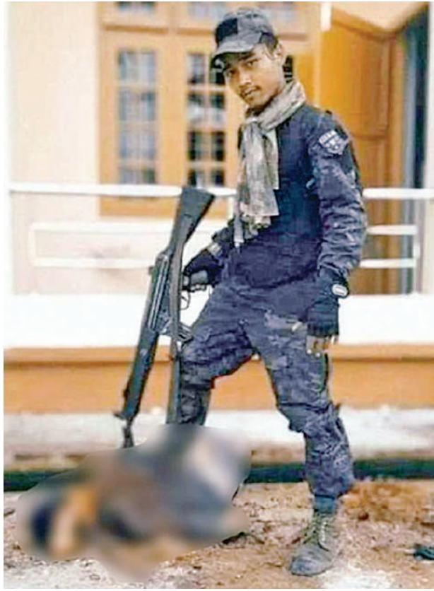
KNPP/KNDF အဖွဲ့နှင့် PDF အမည်ခံ အကြမ်းဖက် အဖွဲ့များက လွိုင်ကော် တက္ကသိုလ်မှ ဆရာဆရာမ အချို့အား ရက်စက်စွာ သတ်ဖြတ် ထားရှိမှုအား အွန်လိုင်း အထောက် အထား ဓာတ်ပုံများမှ တစ်ဆင့် တွေ့မြင်ရစဉ်။