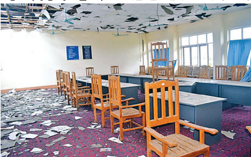
KNPP/KNDF အဖွဲ့နှင့် PDF အမည်ခံအကြမ်းဖက်အဖွဲ့များဖျက်ဆီးမှုကြောင့် လွိုင်ကော်တက္ကသိုလ်ပျက်စီးမှုအခြေအနေကို တွေ့ရစဉ်။