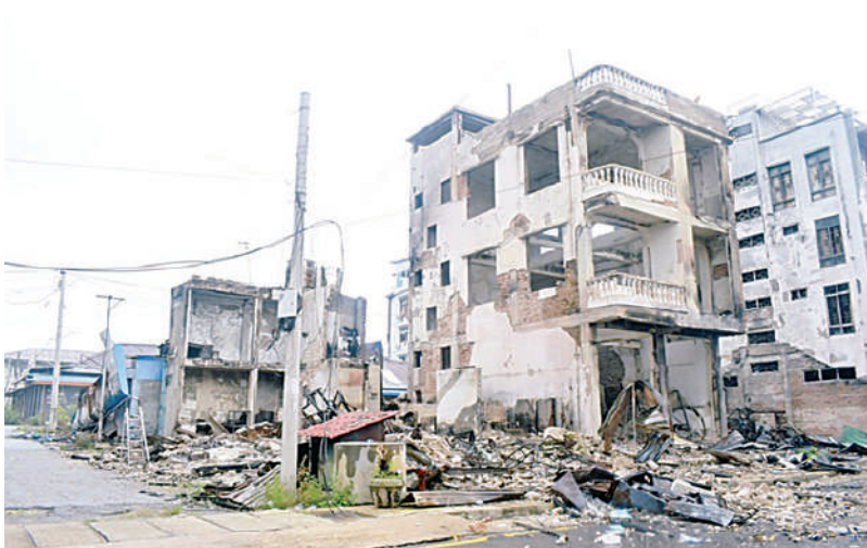
KNPP/KNDF အဖွဲ့နှင့် PDF အမည်ခံအကြမ်းဖက်အဖွဲ့များ၏ အဖျက်အမှောင့်လုပ်ရပ်များကြောင့် လွိုင်ကော်မြို့ရှိ ဒေသခံပြည်သူများ၏ နေအိမ်များပျက်စီးနေမှုကို တွေ့ရစဉ်။