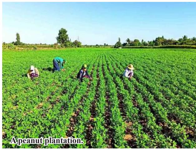
A peanut plantation.