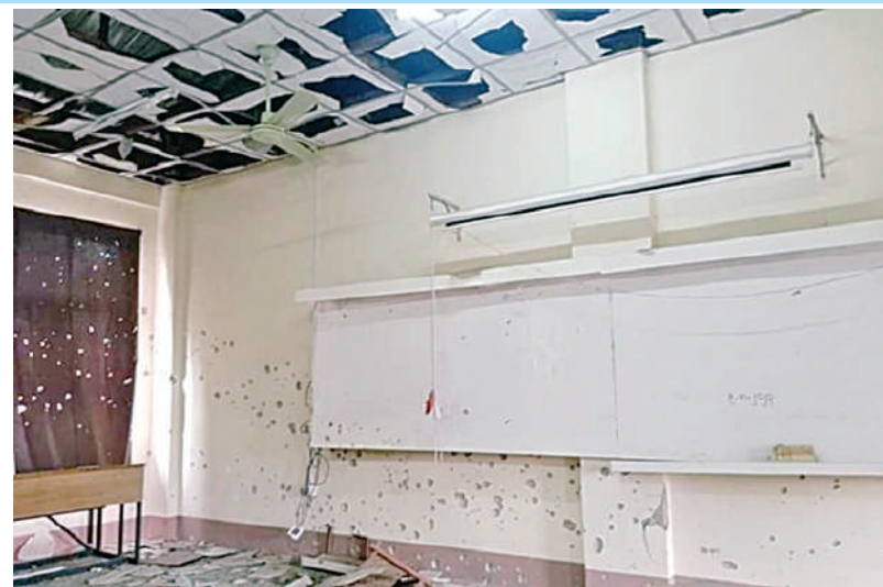
KNPP/KNDF အဖွဲ့နှင့် PDF အမည်ခံအကြမ်းဖက်အဖွဲ့များ ဖျက်ဆီးမှုကြောင့် လွိုင်ကော်တက္ကသိုလ်ပျက်စီးမှုအခြေအနေကို တွေ့ရစဉ်။

မှုကျူးလွန်ခြင်းပင်ဖြစ်ကြောင်း။ လက်နက်ဟူ၍ အပ်တိုတစ်ချောင်းမျှ မရှိသည့်မြေဖြူသာရှိသော အပြစ်မဲ့ဆရာ၊ ဆရာမများ၊ ပညာရေးဝန်ထမ်းများ၊ နိုင်ငံအနာဂတ်အတွက် အားကိုးအားထားပြုရမည့် ကျောင်းသား၊ ကျောင်းသူများကို ပစ်မှတ်ထားတိုက်ခိုက်ခြင်းသည် နိုင်ငံတော်၏ အနာဂတ်ကို ရိုက်ချိုးဖျက်ဆီးသည့် စဉ်းစားဉာဏ်ကင်းမဲ့သော လူမဆန်သည့် လက်နက်အားကိုး အကြမ်းဖက်လုပ်ရပ်ပင် ဖြစ်ကြောင်း၊ ၂၀၂၃ခုနှစ် နိုဝင်ဘာ ၁၃ ရက်တွင် ဖြေဆိုရမည့်အဝေးသင်တက္ကသိုလ် တတိယအသုတ်စာမေးပွဲကိုလည်း ကျင်းပနိုင်ခြင်းမရှိတော့ဘဲ လွိုင်ကော်တက္ကသိုလ် ကြီးကိုပိတ်ခဲ့ရသည်မှာ ယနေ့ထိပင်ဖြစ်ပြီး အဆိုပါဖြစ်ရပ်ကိုသိရှိကြသည့် ကမ္ဘာ့ပညာတတ်အသိုင်းအဝိုင်းအနေဖြင့် ရင်ထုမနာစိတ်မကောင်းဖြစ်နေကြမည်မှာ အသေအချာပင်ဖြစ်ကြောင်း။