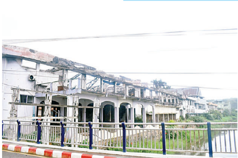
KNPP/KNDF အဖွဲ့နှင့် PDF အမည်ခံအကြမ်းဖက်အဖွဲ့များ၏ အဖျက်အမှောင့် လုပ်ရပ်များကြောင့် လွိုင်ကော်မြို့ နှစ်ထပ်ဈေးပျက်စီးနေမှုကို တွေ့ရစဉ်။