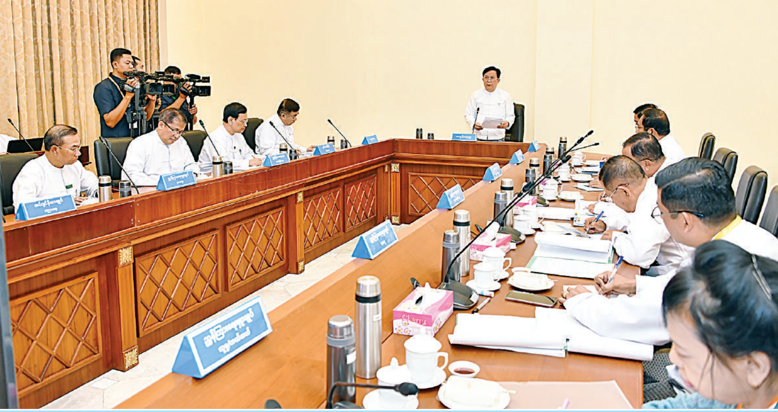
နိုင်ငံတော်စီမံအုပ်ချုပ်ရေးကောင်စီ အတွင်းရေးမှူး ဗိုလ်ချုပ်ကြီးအောင်လင်းခွေး ကယားပြည်နယ် လွိုင်ကော်တက္ကသိုလ်ကို အကြမ်းဖက်သောင်းကျန်းသူများ ဖျက်ဆီးမှုကြောင့် အဆောက်အအုံများပျက်စီးခဲ့မှုအခြေအနေနှင့် ပြန်လည်ပြုပြင်ရေးဆိုင်ရာညှိနှိုင်းအစည်းအဝေးတွင် အမှာစကားပြောကြားစဉ်။

နေပြည်တော် ဇန်နဝါရီ ၂၁ KNPP/KNDF အဖွဲ့နှင့် PDF အမည်ခံ အကြမ်းဖက်သမားများသည် ကယားပြည်နယ်အတွင်း အစိုးရ၏ အုပ်ချုပ်မှုယန္တရား ပျက်ပြားစေရန်ရည်ရွယ်၍ ၂၀၂၁ ခုနှစ် ဒီဇင်ဘာလမှစတင်ကာ လူနေအဆောက်အအုံများ၊ဘာသာရေးကျန်းမာရေးပညာရေးဆိုင်ရာအဆောက်အအုံများကို အကာအကွယ်ရယူ၍ အဖျက်အမှောင်လုပ်ရပ်များကို လုပ်ဆောင်ခဲ့ကြသည့်အပြင် စစ်ရေးနှင့်သက်ဆိုင်သော ပစ်မှတ်မဟုတ်သည့် ကယားပြည်နယ် လွိုင်ကော်တက္ကသိုလ် အား လက်နက်ကြီး၊ လက်နက်ငယ်များဖြင့် ရည်ရွယ်ချက်ရှိရှိလှောင်ပစ်ခတ်တိုက်ခိုက်ခဲ့ကာ ပညာရေးဆိုင်ရာအဆောက်အအုံများ ဖျက်ဆီးခြင်း၊ တက္ကသိုလ်တွင် တာဝန်ထမ်းဆောင်လျက်ရှိသည့် ပါမောက္ခချုပ်အပါအဝင် ဆရာ၊ ဆရာမများ၊ ပညာရေးဆိုင်ရာဝန်ထမ်းများနှင့် ပညာသင်ကြားလျက်ရှိသည့် ကျောင်းသား၊ ကျောင်းသူများကို အတင်းအဓမ္မဖမ်းဆီးချုပ်နှောင်ခြင်း၊ စာမျက်နှာ ၁၆ ကော်လံ ၁ - ၇