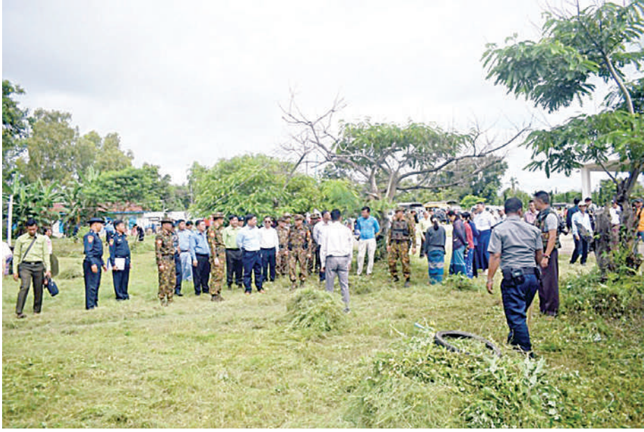
ကယားပြည်နယ် ဝန်ကြီးချုပ် ဦးဇော်မျိုးတင်နှင့် အရှေ့ပိုင်းတိုင်း စစ်ဌာနချုပ် တိုင်းမှူး ဗိုလ်ချုပ်ဇော်မင်းလတ် လွိုင်ကော်လေယာဉ် ကွင်းအတွင်း စုပေါင်းသန့်ရှင်းရေး ဆောင်ရွက်နေမှုကို ကြည့်ရှုအားပေးစဉ်။