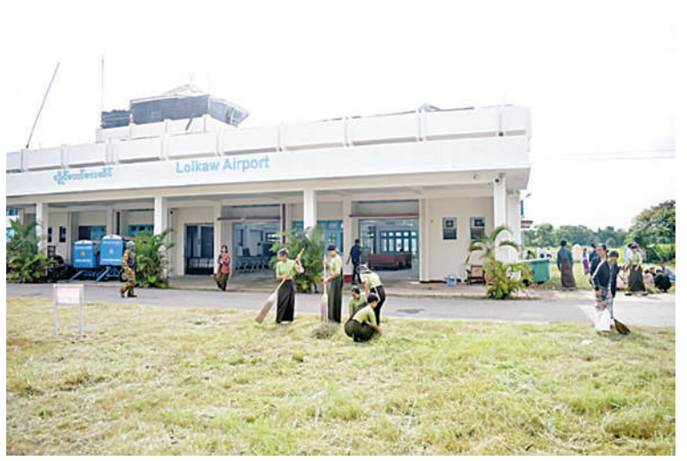
လွိုင်ကော်လေယာဉ်ကွင်းအတွင်း စုပေါင်းသန့်ရှင်းရေးဆောင်ရွက်နေမှုကို တွေ့ရစဉ်။