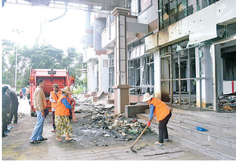
လွိုင်ကော်မြို့ ယဉ်ကျေးမှုပြတိုက်အတွင်း စုပေါင်းသန့်ရှင်းရေးဆောင်ရွက် နေမှုကို တွေ့ရစဉ်။