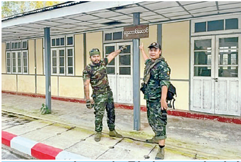
KNPP/KNDF အဖွဲ့နှင့် PDF အမည်ခံအကြမ်းဖက်အဖွဲ့များက စစ်ရေးပစ်မှတ် မဟုတ်သည့် လွိုင်ကော်တက္ကသိုလ်အတွင်း စီးနင်းဝင်ရောက်မှုအား အွန်လိုင်းအထောက်အထား ဓာတ်ပုံများမှတစ်ဆင့် တွေ့မြင်ရစဉ်။