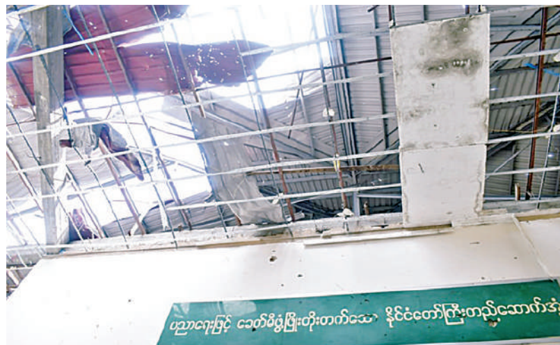
KNPP/KNDF အဖွဲ့နှင့် PDF အမည်ခံအကြမ်းဖက်အဖွဲ့များ ဖျက်ဆီးမှုကြောင့် လွိုင်ကော်တက္ကသိုလ်ပျက်စီးမှုအခြေအနေကို တွေ့ရစဉ်။