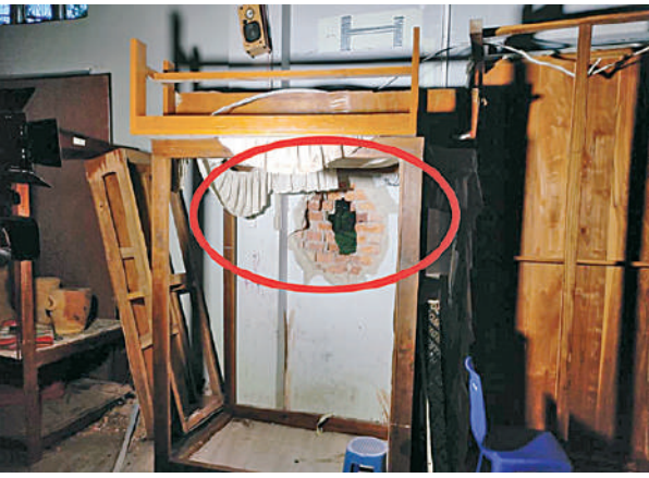
KNPP/KNDF အဖွဲ့နှင့် PDF အမည်ခံအကြမ်းဖက်အဖွဲ့များ၏ အဖျက်အမှောင်လုပ်ရပ်များကြောင့် လွိုင်ကော်မြို့ ယဉ်ကျေးမှု ပြတိုက်ပျက်စီးခဲ့မှုကို တွေ့ရစဉ်။

ပြုပြင်ရေးဆိုင်ရာ ညှိနှိုင်းအစည်းအဝေးကို ယနေ့နံနက်ပိုင်းတွင် နေပြည်တော်ရှိ နိုင်ငံတော်စီမံအုပ်ချုပ်ရေးကောင်စီရုံး အစည်းအဝေးခန်းမ၌ ကျင်းပသည်။