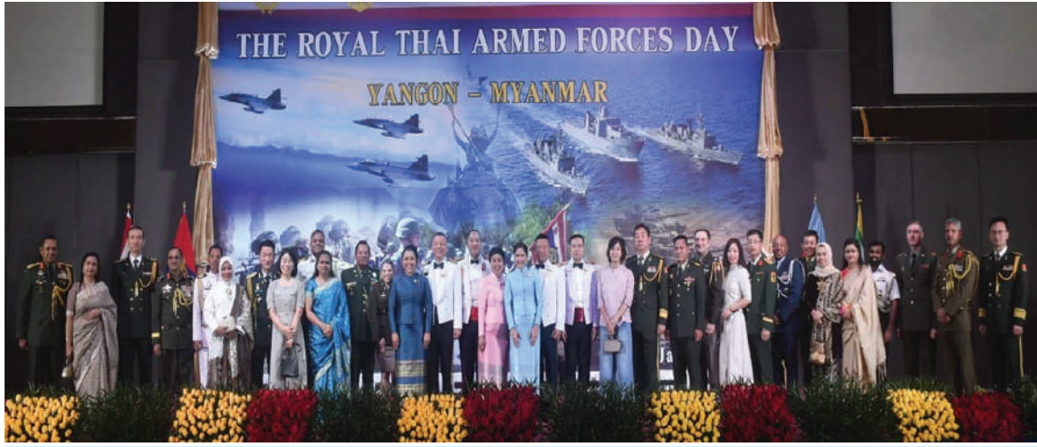
ထိုင်းဘုရင့်တပ်မတော်နေ့အထိမ်းအမှတ်အခမ်းအနား တက်ရောက်လာကြသူများ အမှတ်တရပေါင်းမှတ်တမ်းတင်ဓာတ်ပုံရိုက်ကြစဉ်။