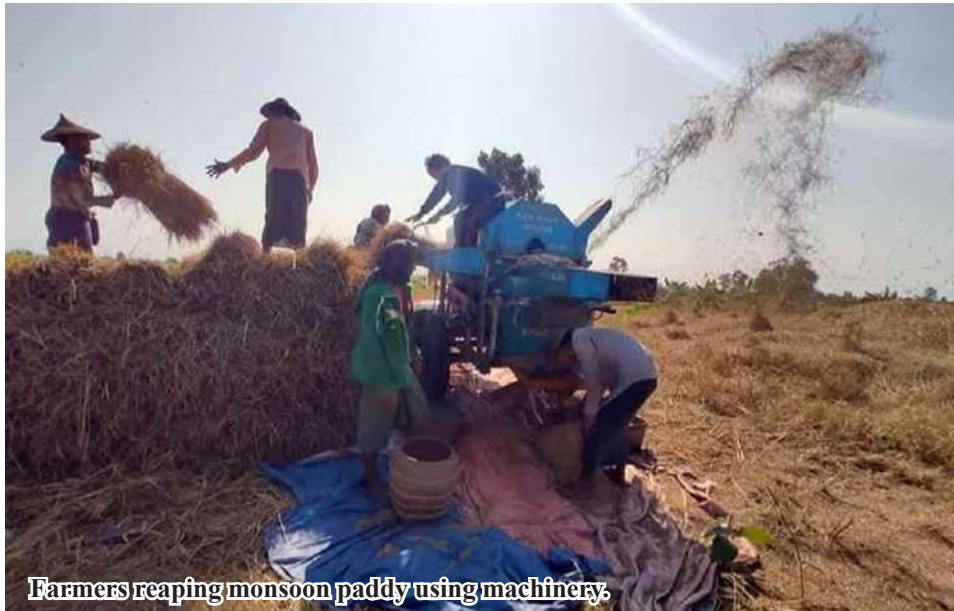
Farmers reaping monsoon paddy using machinery.

Tamu January 18 The statistics of Tamu District Agriculture Department stated that a total of 48,716 acres of monsoon paddy has been harvested in Tamu District of Sagaing Region.