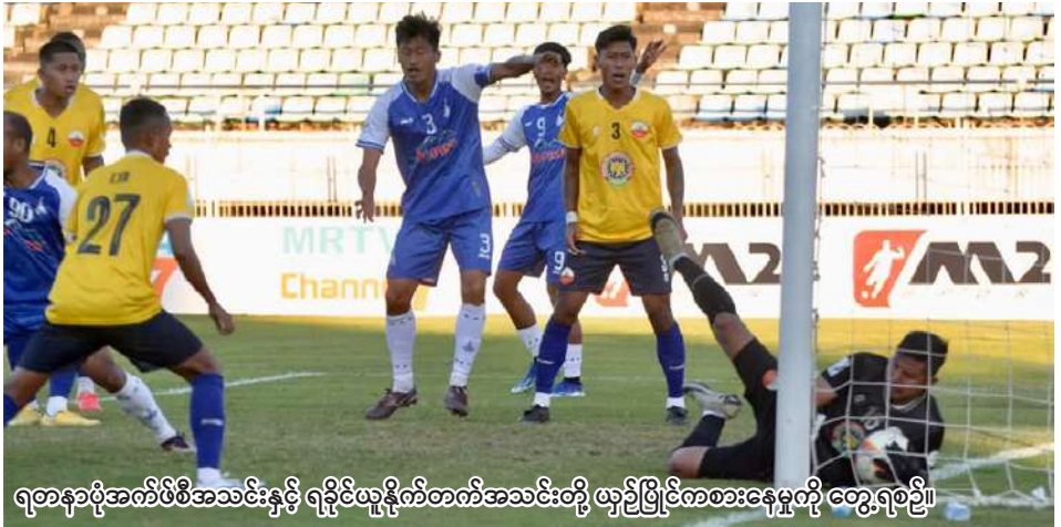
ရတနာပုံအက်ဖ်စီအသင်းနှင့် ရခိုင်ယူနိုက်တက်အသင်းတို့ ယှဉ်ပြိုင်ကစားနေမှုကို တွေ့ရစဉ်။