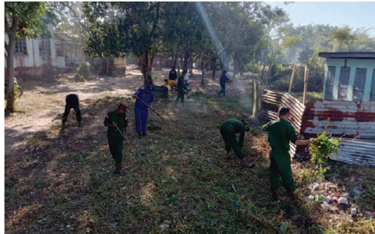
ရန်ကုန်တိုင်းစစ်ဌာနချုပ်မှ နယ်မြေခံတပ်မတော်သားများနှင့် ဌာနဆိုင်ရာဝန်ထမ်းများ စုပေါင်းသန့်ရှင်းရေးဆောင်ရွက်ပေးစဉ်။

ကျန်းမာရေးအသိပညာပေးလက်ကမ်းစာစောင်များ ဖြန့်ဝေပေးခြင်းများကို စုပေါင်းဆောင်ရွက်ပေးကြသည်။ ယင်းသို့ ဆောင်ရွက်နေမှုများကို သက်ဆိုင်ရာ တိုင်းစစ်ဌာနချုပ်များမှ တာဝန်ရှိသူများက သွားရောက်ကြည့်ရှုအားပေးပြီး လိုအပ်သည်များညှိနှိုင်းဆောင်ရွက်ပေးခဲ့ကြကြောင်း သတင်းရရှိသည်။ (၅၀၁)