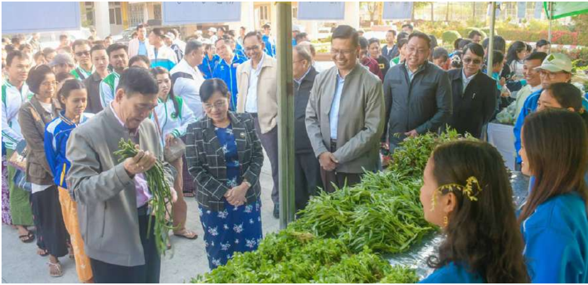
စစ်တွေ ဇန်နဝါရီ ၁၈ ဖြင့် ဝန်ထမ်းများအား အခြေခံစားကုန်နှင့် ကို ယနေ့နံနက်ပိုင်းက ရခိုင်ပြည်နယ် ရခိုင်ပြည်နယ်အစိုးရအဖွဲ့၏အစီအစဉ် သား၊ ငါး၊ ကြက်ဥ၊ ဟင်းသီးဟင်းရွက်များ အစိုးရအဖွဲ့ရုံးဝင်း၌ ဈေးနှုန်းသက်သာစွာ

ရောင်းချပေးလျက်ရှိရာ ရခိုင်ပြည်နယ် ဝန်ကြီးချုပ် ဦးထိန်လင်း၊ ပြည်နယ်တရား လွှတ်တော်တရားသူကြီးချုပ်၊ ပြည်နယ် အစိုးရအဖွဲ့ဝင်များနှင့် ဌာနဆိုင်ရာများက လှည့်လည်ကြည့်ရှုအားပေးကြသည်။ ဦးစွာ ပြည်နယ်ဝန်ကြီးချုပ် ဦးထိန်လင်း နှင့်အဖွဲ့သည် ဝန်ထမ်းများအား ရောင်းချ ပေးမည့် အခြေခံစားကုန်နှင့် သား၊ ငါး၊ ကြက်ဥ၊ ဟင်းသီးဟင်းရွက်များ ခင်းကျင်း ထားရှိမှုကို လှည့်လည်ကြည့်ရှုအားပေးပြီး ဈေးဝယ်ရန်ရောက်ရှိလာသည့် ဝန်ထမ်း များအား ရင်းရင်းနှီးနှီးနှုတ်ဆက်သည်။ အလားတူ ပြည်နယ်ဝန်ကြီးချုပ်က အခြေခံစားကုန်များနှင့် သား၊ ငါးများ ပြတ်လပ်မှုမရှိစေရေးနှင့် ဈေးနှုန်းမြင့်တင် ရောင်းချခြင်းမရှိစေရေးတို့ကို စိစစ်ကြပ် မတ်ဆောင်ရွက်သွားကြရန် တာဝန်ရှိသူ များအား မှာကြားသည်။ ဝန်ထမ်းများကိုသက်သာသောဈေးနှုန်း ဖြင့် ဈေးရောင်းချပေးရာတွင် အခြေခံ စားကုန်များဖြစ်သည့် ဆီ၊ ကြက်သွန်နီ၊ ကြက်သွန်ဖြူ၊ ငရုပ်သီးခြောက်၊ မုန့်လာဥ၊ ငရုတ်သီးစိမ်း၊ ကြက်ဟင်းခါးသီး၊ မြေထောက်ပဲ၊ ကန်စွန်းဥ၊ ခရမ်းချဉ်သီး၊ ဂေါ်ဖီထုပ်၊ ပဲသီး၊ နံနံ၊ ပန်းဂေါ်ဖီ၊ ချဉ်ပေါင်၊ ကြက်ဥ၊ ဘူးသီးနှင့် ပြောင်းဖူး စသည့် ဟင်းသီးဟင်းရွက်များကို ရောင်းချပေး ခြင်းဖြစ်ပြီး သား၊ ငါးအနေဖြင့် ကြက်သား၊ ဝက်သားနှင့် ငါး၊ ပုစွန်များကို ဈေးနှုန်း သက်သာစွာဖြင့် ရောင်းချပေးခြင်းဖြစ် ကြောင်း သတင်းရရှိသည်။ တင်ထွန်း(ပြန်/ဆက်)