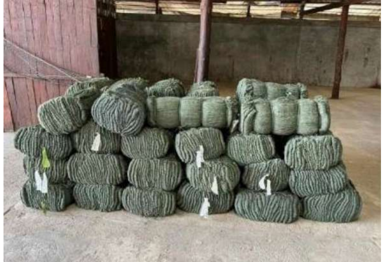
တနင်္သာရီတိုင်းဒေသကြီး၌ ဖမ်းဆီးရမိမှုကို တွေ့ရစဉ်။

နေပြည်တော် ဇန်နဝါရီ ၁၈ သေတ္တာတစ်လုံးအတွင်းမှ တရားမဝင် တရားမဝင်ကုန်သွယ်မှုတိုက်ဖျက်ရေး စာရွက်စာတမ်း အထောက်အထားတင်ပြ ဦးဆောင်ကော်မတီ၏ ကြီးကြပ်ကွပ်ကဲမှု နိုင်ခြင်းမရှိသည့် လုပ်ငန်းသုံးပစ္စည်း ဖြင့် တရားမဝင်ကုန်သွယ်မှုများကို ဥပဒေ လေးမျိုး ခန့်မှန်းတန်ဖိုးငွေကျပ် နှင့်အညီ ထိရောက်စွာတားဆီးအရေးယူ ၆၈၂၉၈၂၉၈ ကိုလည်းကောင်း၊ သီလဝါ နိုင်ငံရေး ဆောင်ရွက်လျက်ရှိသည်။ ဆိပ်ကမ်း၌ ကုန်သေတ္တာသုံးလုံးအတွင်းမှ ဇန်နဝါရီ ၁၆ ရက်တွင် အကောက်ခွန် တရားဝင်စာရွက်စာတမ်း အထောက် ဦးစီးဌာန၏ စီမံခန့်ခွဲမှုဖြင့် တာဝန်ကျ အထားတင်ပြနိုင်ခြင်းမရှိသည့် လုပ်ငန်း ပူးပေါင်းအဖွဲ့များက စစ်ဆေးမှုများဆောင် သုံးပစ္စည်းနှစ်မျိုး ရွက်ခွဲရာ မြန်မာ့စက်မှုဆိပ်ကမ်း၌ ကုန် စာမျက်နှာ ၂၂ ကော်လံ ၁ ☆