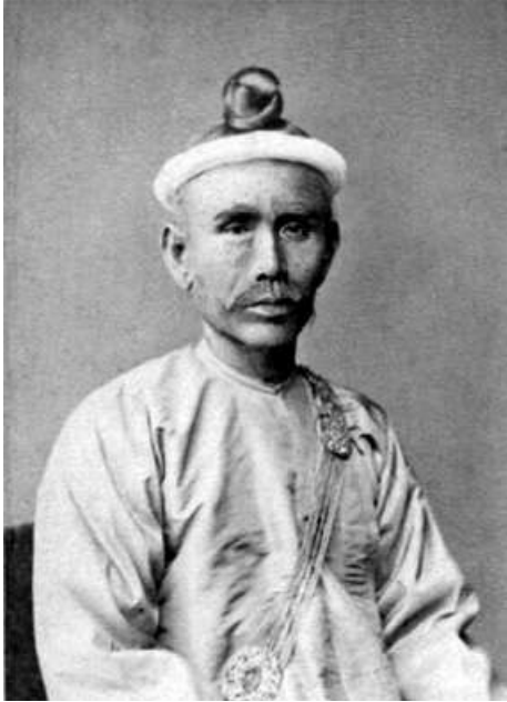
ကင်းဝန်မင်းကြီးဦးကောင်း

ကင်းဝန်မင်းကြီး ဦးကောင်းဆိုတာနဲ့ ဘာလုပ်သွားသံအဖွဲ့မှတ်တမ်းကိုသတိရကြမှာပါ။ ဘကြီးတော်မင်းလက်ထက်မှာ အင်္ဂလိပ်နဲ့ မြန်မာစစ်ဖြစ်ပြီး စစ်ရှုံးတော့ တနင်္သာရီနဲ့ ရခိုင်ကို အင်္ဂလိပ်တွေက သိမ်းပါတယ်။ ပုဂံမင်းလက်ထက်မှာ ဒုတိယအကြိမ် စစ်ရှုံးတော့ သရက်မြို့ထိ မြန်မာပိုင်နက်ကို စွန့်လွှတ်ခဲ့ရပါတယ်။ ပုဂံမင်းနောက် စိုးစံတဲ့မင်းတုန်းမင်းက အမြော်အမြင်ကြီးတာကြောင့် အင်္ဂလိပ်နဲ့ဆက်ဆံရေးက သင့်တင့်ခဲ့ပါတယ်။