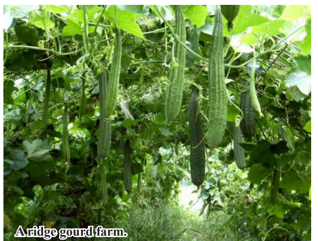
A ridge gourd farm.