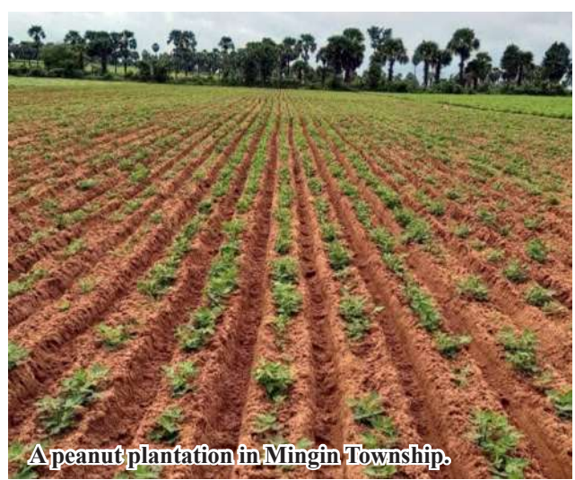
A peanut plantation in Mingin Township.

Farmers use 1.5 baskets of peanut seeds per acre and cost more than K200,000 per acre for quality seeds, labour charge, fertilizers and pests. But, the crops yield more than 50 baskets of peanut per acre.