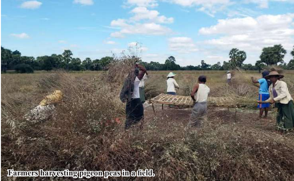
Farmers harvesting pigeon peas in a field.