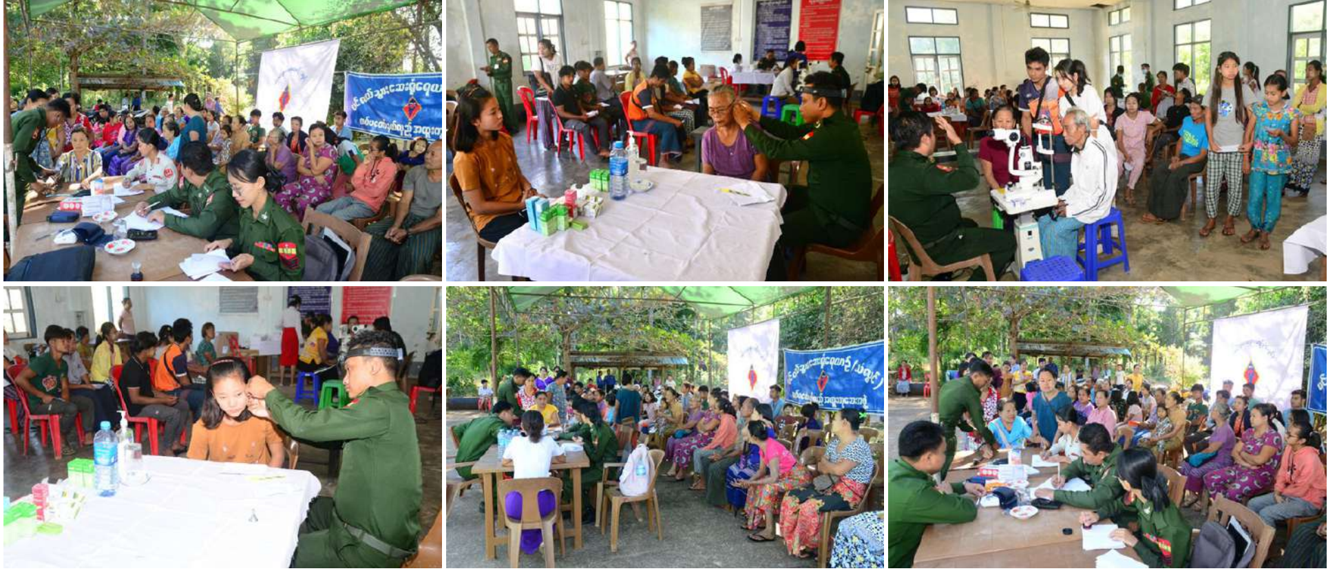
တပ်မတော်ပင်လယ်သွားဆေးရုံရေယာဉ်(သံလွင်)မှ နယ်လှည့်အထူးကုဆေးအဖွဲ့က တနင်္သာရီတိုင်းဒေသကြီး ပုလောမြို့နယ် မလိကျွန်းနှင့် အနီးဝန်းကျင်မှ ဒေသခံပြည်သူများကို ကျန်းမာရေးစောင့်ရှောက်မှု လုပ်ငန်းများဆောင်ရွက်ပေးစဉ်။

နေပြည်တော် ဇန်နဝါရီ ၁၈ တနင်္သာရီကမ်းရိုးတန်း ဒေသတစ်လျှောက်မှ ဒေသခံပြည်သူများ၊ ရန်ကုန်တိုင်းဒေသကြီး ကိုကိုးကျွန်းမြို့နယ်နှင့် ဧရာဝတီတိုင်းဒေသကြီး ဟိုင်းကြီးကျွန်းမြို့နယ် အနီးပတ်ဝန်းကျင်ကျေးရွာများမှ ဒေသခံပြည်သူများကို ကျန်းမာရေးစောင့်ရှောက်မှုလုပ်ငန်းများဆောင်ရွက်ပေးရန် ပါရဂူများ၊ ဆေးမှူးများနှင့် သူနာပြုများ ပါဝင်သော နယ်လှည့်အထူးကုဆေးအဖွဲ့များလိုက်ပါလာသည့် တပ်မတော်ပင်လယ်သွားဆေးရုံရေယာဉ်(သံလွင်)သည် ယနေ့