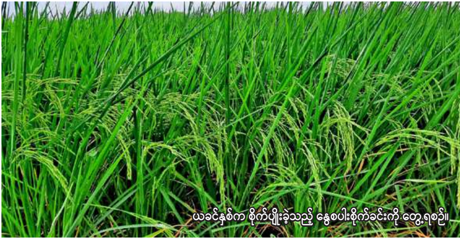
ယခင်နှစ်က စိုက်ပျိုးခဲ့သည့် နွေစပါးစိုက်ခင်းကို တွေ့ရစဉ်။

ပွင့်ဖြူ ဇန်နဝါရီ ၁၈ မကွေးတိုင်းဒေသကြီး ပွင့်ဖြူ မြို့နယ်တွင် ယခုနှစ် နွေသီးနှံ စိုက်ပျိုးရာသီ၌ စပါး ၃၃၂၃၅ ဧက စိုက်ပျိုးမည်ဖြစ်ကြောင်း ပွင့်ဖြူ မြို့နယ် စိုက်ပျိုးရေးဦးစီးဌာနမှ သိရသည်။