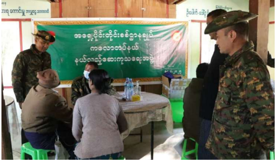
သံဃာတော်များနှင့် ဒေသခံပြည်သူများအား ကျန်းမာရေးစောင့်ရှောက်မှုလုပ်ငန်းများဆောင်ရွက်ပေးနေမှုကို အလယ်ပိုင်းတိုင်းစစ်ဌာနချုပ်မှ တာဝန်ရှိသူများက ကြည့်ရှုအားပေးစဉ်။