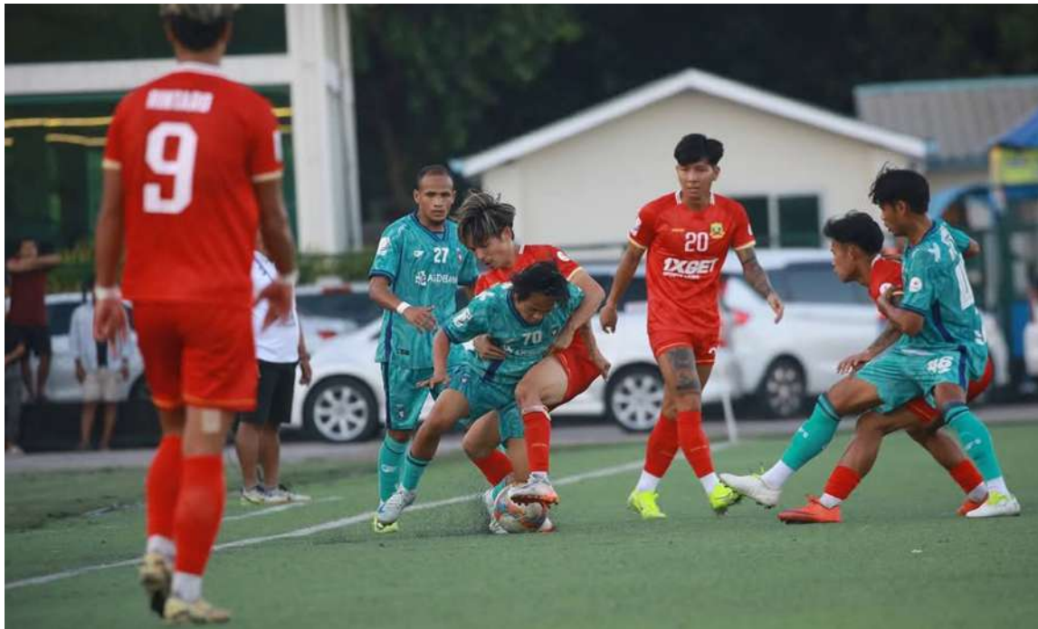
ရန်ကုန်ယူနိုက်တက်အသင်းနှင့် ရှမ်းယူနိုက်တက်အသင်းတို့ ယှဉ်ပြိုင်ကစားနေမှုကို တွေ့ရစဉ်။