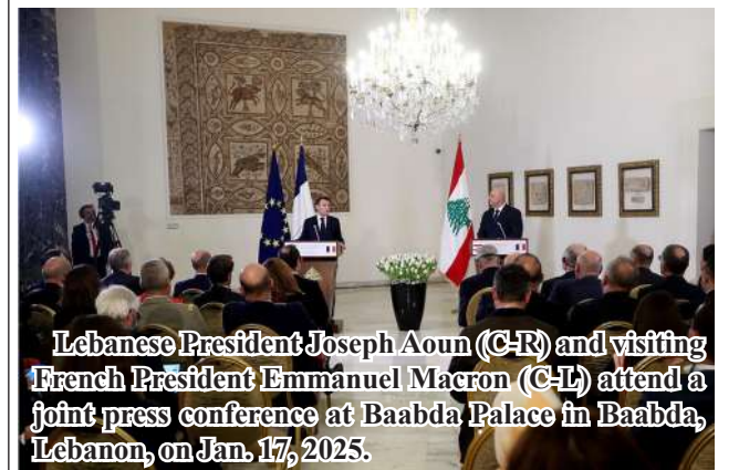
Lebanese President Joseph Aoun (C-R) and visiting French President Emmanuel Macron (C-L) attend a joint press conference at Baabda Palace in Baabda, Lebanon, on Jan. 17, 2025.

aspiration for the complete withdrawal of Israeli forces and for all weapons to be under the exclusive control of the Lebanese army. "We will work to mobilize the international community to assist Lebanon across various sectors," Macron added. For his part, Aoun said, "The world's confidence in Lebanon must also be fully restored because the true and authentic Lebanon has returned." Macron arrived in Beirut on Friday for an official visit. Upon his arrival, Macron also met with Lebanese Prime Minister Najib Mikati to discuss potential support initiatives for Lebanon. Xinhua