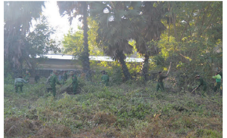
တောင်ပိုင်းတိုင်းစစ်ဌာနချုပ်မှ နယ်မြေခံတပ်မတော်သားများနှင့် ဌာနဆိုင်ရာဝန်ထမ်းများ စုပေါင်းသန့်ရှင်းရေးဆောင်ရွက်ပေးစဉ်။