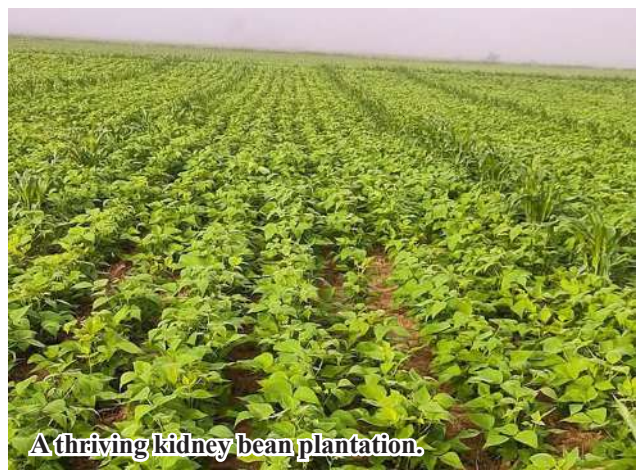
A thriving kidney bean plantation.

"Local farmers have so far planted more than 1,000 acres of kidney bean against the target of over 3,000 acres this cold season. Our department provides quality strains of crops, agricultural inputs and post-harvest technology for local farmers to boost per-acre yield of quality crops." Officials from the Township Agriculture Department raise farmer awareness to expand sown acreage of kidney bean, boosting per-acre yield of crops, and using GAP system and quality seeds.