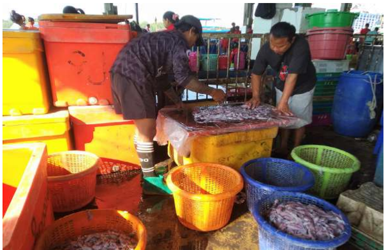
အဆက်မပြတ် တင်ပို့ရလျက်ရှိသည့် ကွက်ပွင့်လန်းလျက်ရှိကြောင်း ရွှေ အတွက် မြန်မာ့ကင်းမွန်များ ပြည်ပဈေး ပိတောက်ငါးဈေးမှ သိရသည်။ သစ္စာ (MNA)

အရွယ်အစား နှစ်လက်မအောက် ကင်းမွန်တစ်ပိဿာလျှင် ငွေကျပ် ၄၈၀၀၊ နှစ်လက်မနှင့် သုံးလက်မကြား ကင်းမွန် တစ်ပိဿာလျှင် ငွေကျပ် ၁၆၆၀၀၊ သုံးလက်မနှင့် ငါးလက်မကြား ကင်းမွန် တစ်ပိဿာလျှင် ငွေကျပ် ၂၅၀၀၀ နှင့် ငါး လက်မနှင့် ခြောက်လက်မကြား ကင်းမွန် တစ်ပိဿာလျှင် ငွေကျပ် ၂၇၀၀၀ ဖြင့် ရောင်းချလျက်ရှိကြောင်း သိရသည်။ မြိတ်ကျွန်းစုပင်လယ်ပြင်မှ ဆလုံ တိုင်းရင်းသားများ ဖမ်းမိရရှိသည့် ကင်းမွန် များကိုလည်း ပြည်ပဈေးကွက်အတွက် မြိတ်မြို့မှတစ်ဆင့် ရန်ကုန်မြို့သို့တင်ပို့ပြီး ကွန်တိန်နာသင်္ဘောဖြင့် ပြည်ပသို့