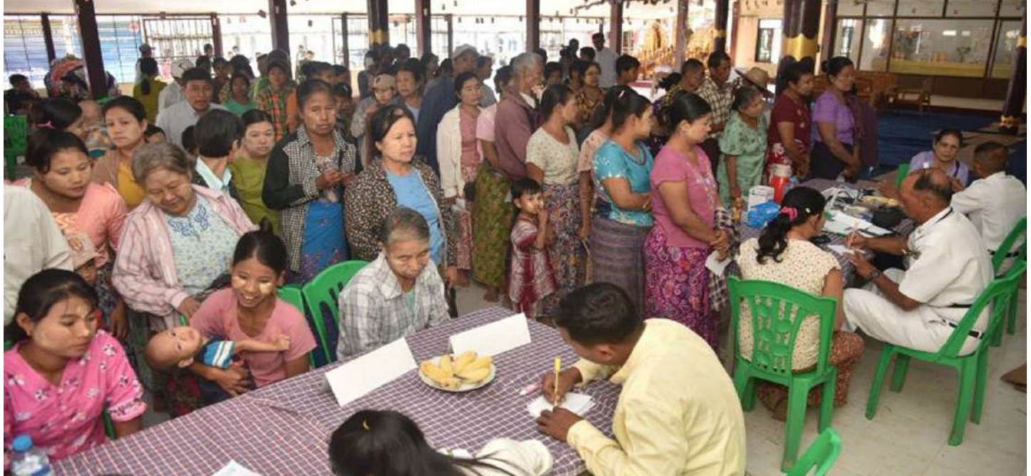
တပ်မတော်မှ ပါရဂူများဆေးမှူးများသူနာပြုများပါဝင်သော နယ်လှည့်အထူးကုဆေးအဖွဲ့ ဧရာဝတီတိုင်းဒေသကြီး မအူပင်မြို့နယ် ထန်းကျေးရွာ အောင်ကျိုက္ခမိဘုန်းကြီးကျောင်းရှိ ဓမ္မရတနာဗိမာန်တွင် ဒေသခံပြည်သူများကို ကျန်းမာရေးစောင့်ရှောက်မှုလုပ်ငန်းများ ဆောင်ရွက်ပေးစဉ်။

နေပြည်တော် ဇန်နဝါရီ ၁၅ များဆောင်ရွက်ပေးရန်အတွက် တပ်မတော်မြစ်တွင်း ဆေးမှူးများသူနာပြုများပါဝင်သော နယ်လှည့်အထူးကုဆေးအဖွဲ့သည် ဧရာဝတီတိုင်းဒေသကြီး မအူပင်မြို့နယ် ထန်းကျေးရွာရှိ ဒေသခံပြည်သူများကို ကျန်းမာရေးစောင့်ရှောက်မှုလုပ်ငန်းနှင့်အတူ လိုက်ပါလာသည့် တပ်မတော်မှ ပါရဂူများ၊ ကြီး