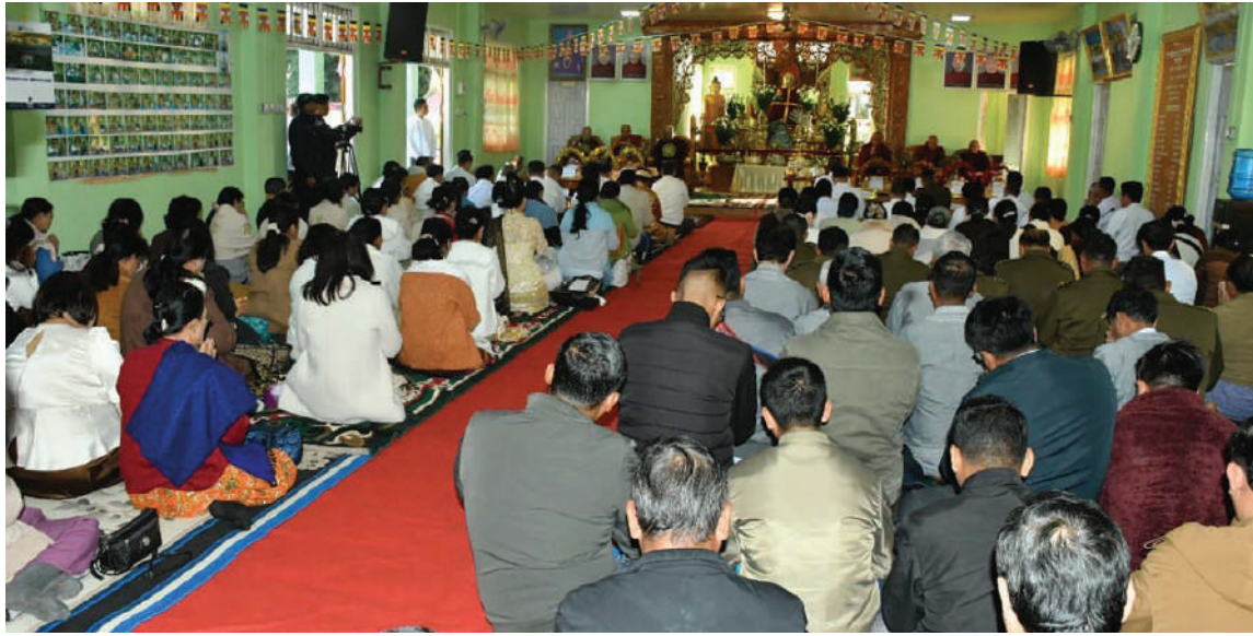
တောင်ကြီးမြို့ရှိ ရွှေဘုန်းပွင့်စေတီတော်မြတ်ကြီးဓမ္မာရုံ၌ မဟာပန်းလည်တိုင်စိုက်ထူခြင်းနှင့် အလှူငွေပေးအပ်ပွဲကျင်းပ ပြုလုပ်စဉ်။