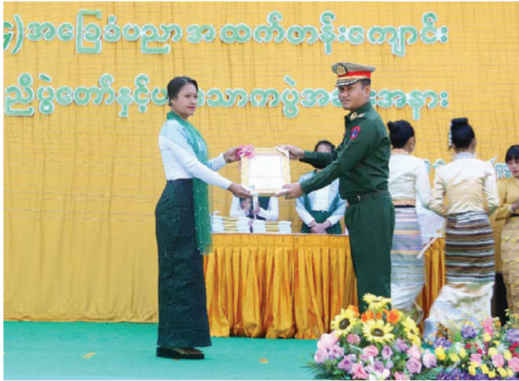
မြောက်ပိုင်းတိုင်းစစ်ဌာနချုပ် တိုင်းမှူး ဗိုလ်မှူးချုပ်အောင်ဇော်ထွေး ပြည်နယ် အဆင့်လူမှုထူးချွန်ဆုရရှိသော ဆရာမတစ်ဦးကို ဂုဏ်ပြုမှတ်တမ်းလွှာပေးအပ်စဉ်။

နေပြည်တော် ဇန်နဝါရီ ၁၅ ပွဲတော်ကို ယနေ့နံနက်ပိုင်းတွင် အဆိုပါ ကချင်ပြည်နယ်မြစ်ကြီးနားမြို့ အမှတ် ကျောင်း၌ပြုလုပ်ရာ မြောက်ပိုင်းတိုင်းစစ် (၄)အခြေခံပညာအထက်တန်းကျောင်း၏ ဌာနချုပ် တိုင်းမှူး ဗိုလ်မှူးချုပ်အောင်ဇော်ထွေးနှင့် တာဝန်ရှိသူများ၊ ဆရာ၊ ဆရာမများ၊ ကျောင်းအကျိုးတော်ဆောင်များ၊ ကျောင်းသား၊ ကျောင်းသူများ၊ ကျောင်းသား မိဘများနှင့် ဖိတ်ကြားထားသူများ တက်ရောက်ကြသည်။ ဦးစွာ ကျောင်းသား၊ ကျောင်းသူများက “ကြိုဆိုပါသည် စုံညီပွဲတော်” သီချင်းဖြင့် သီဆိုဖျော်ဖြေကြပြီး တိုင်းမှူးက ဂုဏ်ပြု အမှာစကားပြောကြားသည်။ ထို့နောက် တိုင်းမှူးနှင့် တာဝန်ရှိသူများက ထူးချွန်ဆုရရှိကြသည့် ကျောင်းသား၊ ကျောင်းသူများအား ဆုများကိုလည်းကောင်း၊ ၂၀၂၄-၂၀၂၅ ပညာသင်နှစ်တွင် လုပ်သက်အရ ပင်စင်ယူသော်လည်း နိုင်ငံတာဝန်များကို ပညာသင်နှစ် တစ်နှစ်ပြီးဆုံးအောင် ဆက်လက် သင်ကြားပေးလျက်ရှိသော ဆရာမ နှစ်ဦးနှင့် ပြည်နယ်အဆင့်လူမှုထူးချွန်ဆုရရှိသော ဆရာမ တစ်ဦးတို့အား ဂုဏ်ပြုမှတ်တမ်းလွှာများကိုလည်းကောင်း ပေးအပ်ကာ ကျောင်းသား၊ ကျောင်းသူများ၏ သီဆို၊ ကပြဖျော်ဖြေမှုများကို ကြည့်ရှုအားပေးခဲ့ကြောင်း သတင်းရရှိသည်။ (၅၀၁)