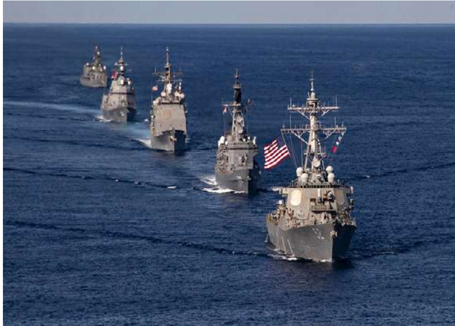
ပစ်ဖိတ်ဒေသအတွင်း ဖြန့်ကြက်နေသော အမေရိကန်စစ်ရေးယာဉ်များကို တွေ့ရစဉ်။

ရေတပ်၏ စစ်ရေးယာဉ်အင်အားချည့်နဲ့လာမှုကို လည်းသတိပေးခဲ့သည်။ ၎င်းကိစ္စနှင့် စပ်လျဉ်း၍ အိုဘားမားက မိမိတို့အနေဖြင့် စစ်ရေးယာဉ်အရေ အတွက်နည်းပါးသော်လည်း နည်းပညာသာလွန် သည့်ဟုတုံ့ပြန်ပြောကြားခဲ့သည်။ သို့သော်လေယာဉ် တင်သင်္ဘောနှစ်စီး တည်ဆောက်ပြီးဖြစ်သည့်အပြင် တတိယမြောက်တစ်စီးကိုလည်း လာမည့်နှစ်အတွင်း တပ်တော်သွင်းတော့မည့် တရုတ်နိုင်ငံ၏ရေတပ် သည် ၂၀၂၁ ခုနှစ်ကထက် စွမ်းဆောင်ရည်ပိုမိုမြင့်မား လာပြီး AI စွမ်းအားနှင့် အသံလွန်စွမ်းဆောင်ရည် များကိုပင်လျှင် ပိုင်ဆိုင်ထားရှိနေပြီဖြစ်သည်။