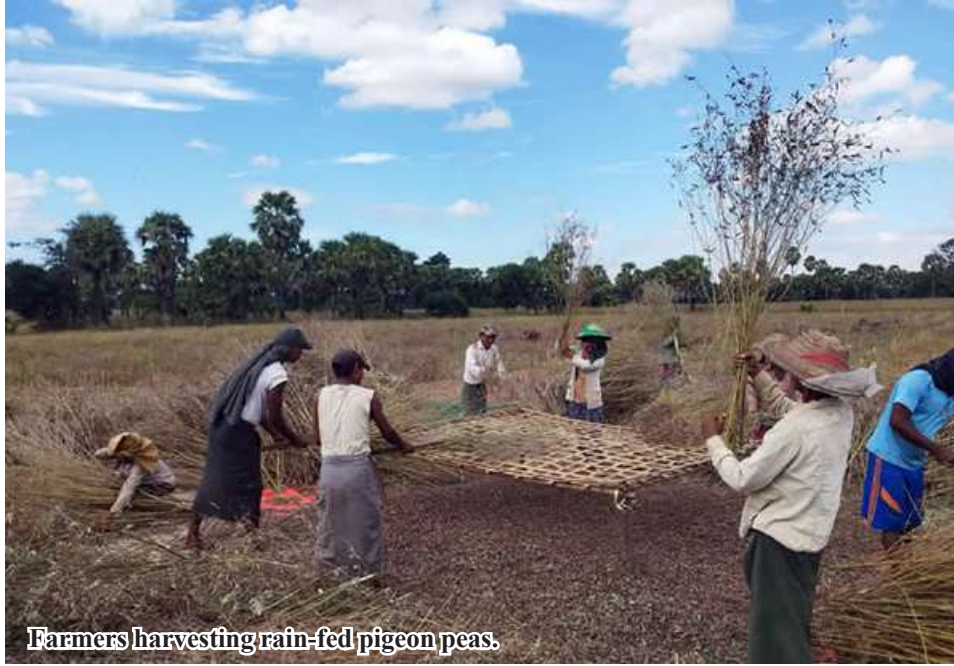
Farmers harvesting rain-fed pigeon peas.

Myinmu January 15 Sagaing Region, have been harvested, according to statistics from the Department of Agriculture for Sagaing District.