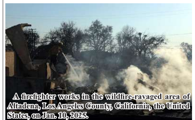
A firefighter works in the wildfire-ravaged area of Altadena, Los Angeles County, California, the United States, on Jan. 10, 2025.

The two largest fires -- the Palisades and Eaton wildfires -- were 17 percent and 34 percent contained respectively as of Tuesday morning, according to the California Department of Forestry and Fire Protection.