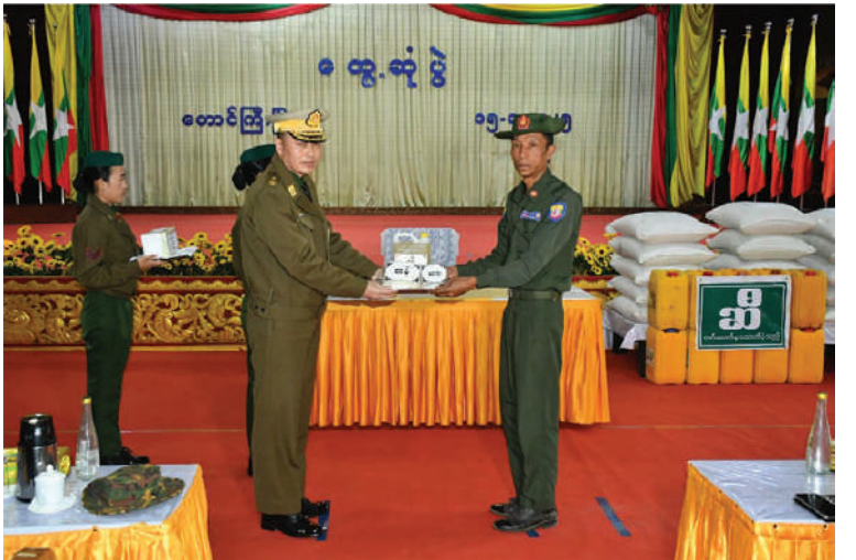
အရှေ့ပိုင်းတိုင်းစစ်ဌာနချုပ် တိုင်းမှူး ဗိုလ်ချုပ်ဇော်မင်းလတ် ပြည်သူ့စစ်(ဌာနေ) တပ်ဖွဲ့ဝင်များအတွက် ဆန်း၊ ဆီ၊ စားသောက်ဖွယ်ရာများနှင့် ချီးမြှင့်ငွေများ ပေးအပ်စဉ်။

နေပြည်တော် ဇန်နဝါရီ ၁၅ တိုင်းမှူးက ရှမ်းပြည်နယ်(တောင်ပိုင်း)နှင့် ကယား အမှာစကားပြောကြားပြီး ပြည်သူ့စစ် ပြည်နယ်အတွင်းရှိ ပြည်သူ့စစ်(ဌာနေ) (ဌာနေ)တပ်ဖွဲ့ဝင်များ၏ တင်ပြအပ်များ တပ်ဖွဲ့ဝင်များကို ယနေ့နံနက်ပိုင်းတွင် အပေါ် လိုအပ်သည်များညှိနှိုင်းဆောင်ရွက် အရှေ့ပိုင်းတိုင်းစစ်ဌာနချုပ် တိုင်းမှူး ပေးကာ ဆန်း၊ ဆီ၊ စားသောက်ဖွယ်ရာ ဗိုလ်ချုပ်ဇော်မင်းလတ်နှင့် တာဝန်ရှိသူ များနှင့် ချီးမြှင့်ငွေများ ပေးအပ်ခဲ့ကြောင်း များက တိုင်းစစ်ဌာနချုပ် သံလွင်ခန်းမ၌ သတင်းရရှိသည်။ တွေ့ဆုံသည်။ (၅၀၁)