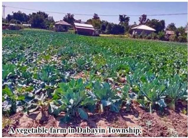
A vegetable farm in Dabayin Township.

duced from the fields, and to encourage the growers to expand the cultivation of vegetables. 206