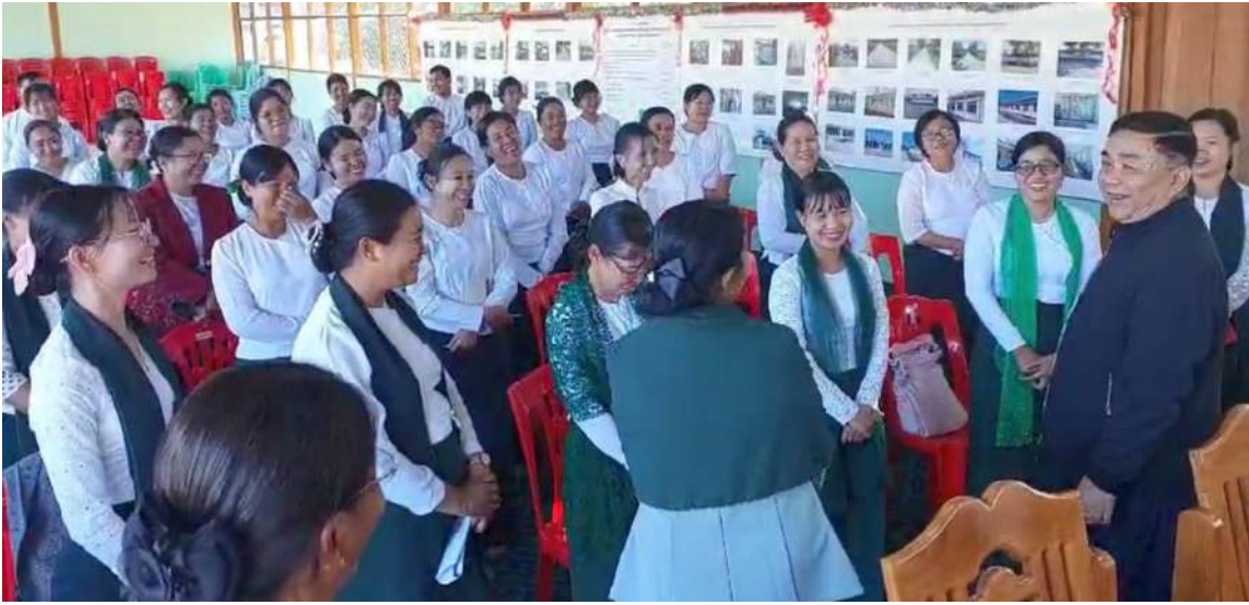
နေပြည်တော် ဇန်နဝါရီ ၁၅ - ပညာရေးဝန်ကြီးဌာန ပြည်ထောင်စု ဝန်ကြီး ဒေါက်တာညွန့်ဖေသည် ယနေ့ ရှေးရာဝန်ကြီး ဦးစိန်ဦး၊ တာဝန်ရှိသူများ နှင့်အတူ လွိုင်ကော်တက္ကသိုလ်

ပင်မဆောင်ပြန်လည်ပြုပြင်ရန် လိုအပ်မှု အခြေအနေများကို လှည့်လည်ကြည့်ရှု စစ်ဆေးသည်။ ထိုသို့ကြည့်ရှုစစ်ဆေးပြီး ပြည်ထောင်စုဝန်ကြီး က ကျောင်းဝင်းအတွင်းရှိ ဘွဲ့နှင်းသဘင် ခန်းမ၊ စာကြည့်တိုက်၊ စာသင်ဆောင်၊ အိပ်ဆောင်၊ ဝန်ထမ်းဆောင်များ ပြန်လည် ပြုပြင်ထိန်းသိမ်းရေး လုပ်ငန်းများကို ဦးစားပေးအဆင့်လိုက် ခွဲခြားဆောင်ရွက် နိုင်ရေးနှင့် တက္ကသိုလ်ပြန်လည်ဖွင့်လှစ်နိုင် ရေးအတွက် လိုအပ်သောပြင်ဆင်ထိန်း သိမ်းရေးလုပ်ငန်းများ အမြန်ဆုံးဆောင် ရွက်ရေးတို့ကို မှာကြားသည်။ ယင်းနောက် ပြည်ထောင်စုဝန်ကြီး သည် လွိုင်ကော်ပညာရေးဒီဂရီကောလိပ်