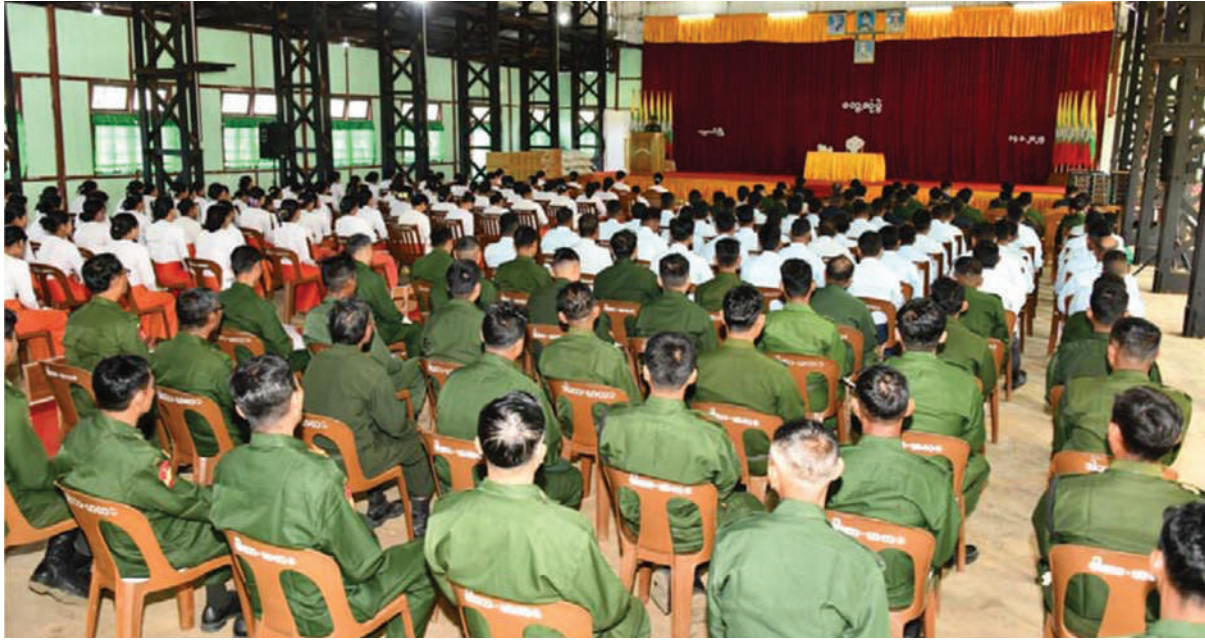
ကာကွယ်ရေးဝန်ကြီးဌာန ပြည်ထောင်စုဝန်ကြီး ဗိုလ်ချုပ်ကြီးမောင်မောင်အေး ဟုမ္မလင်းတပ်နယ်မှ အရာရှိ၊ စစ်သည်၊ မိသားစုများကို တွေ့ဆုံအမှာစကားပြောကြားစဉ်။

နေပြည်တော် ဇန်နဝါရီ ၁၅ ကာကွယ်ရေးဝန်ကြီးဌာန ပြည်ထောင်စု ဝန်ကြီး ဗိုလ်ချုပ်ကြီးမောင်မောင်အေးသည် တပ်နယ်ခန်းမ၌ ဟုမ္မလင်းတပ်နယ်ရှိ အရာရှိ၊ စစ်သည်၊ မိသားစုများကို ရင်းရင်းနှီးနှီး