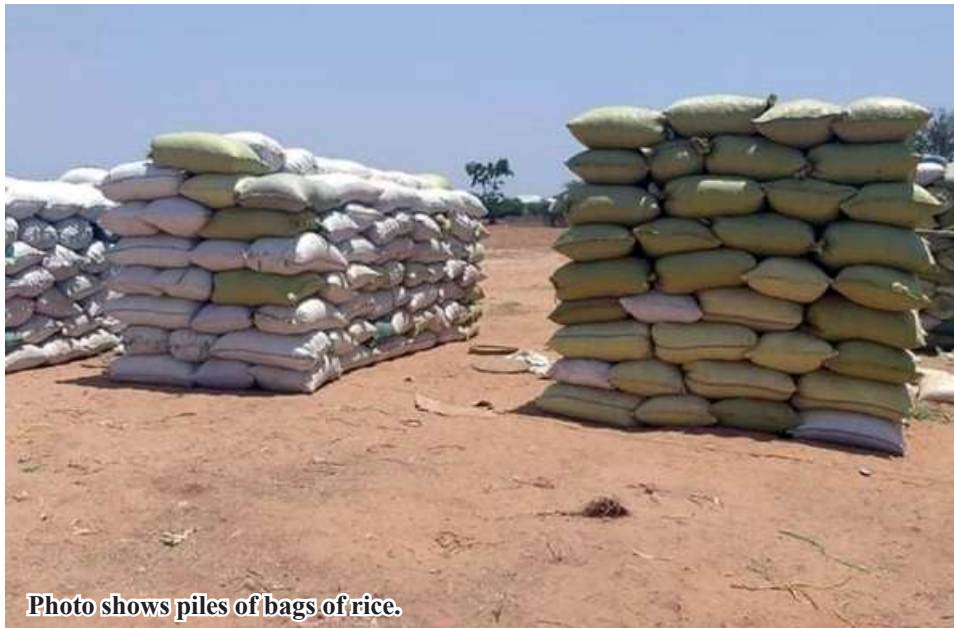
Photo shows piles of bags of rice.

Kyonpyaw January 15 Local merchants from Kyonpyaw Township of Ayeyawady Region sold 73,000 baskets of 90-day paddy to