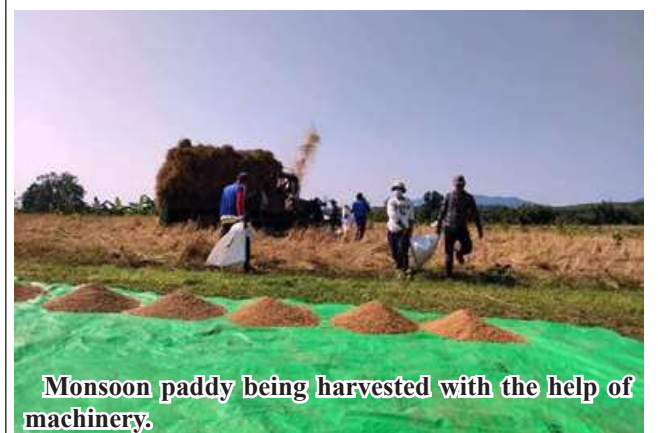
Monsoon paddy being harvested with the help of machinery.

The department offered agricultural technology, pest prevention education, crop protection strategies, and guidance on the timely storage of harvested rice under shelter to farmers in Indaw Township. 206