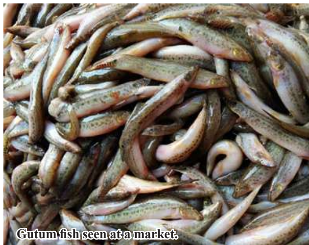
Gutum fish seen at a market.

in Bogale Township are convenient in their livelihoods. Kyaw Kyaw Lin