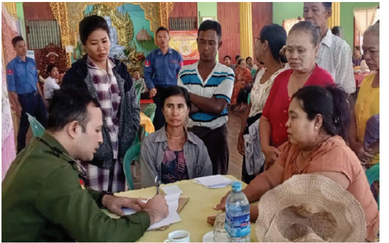
ရန်ကုန်တိုင်းစစ်ဌာနချုပ် နယ်လှည့်ဆေးကုသရေးအဖွဲ့က ဒေသခံပြည်သူများကို ကျန်းမာရေးစောင့်ရှောက်မှုလုပ်ငန်းများ ဆောင်ရွက်ပေးစဉ်။

နေပြည်တော် ဇန်နဝါရီ ၁၅ ရန်ကုန်တိုင်းဒေသကြီး ကော့မှူးမြို့နယ် သမင်ခြံကျေးရွာရှိ ဒေသခံပြည်သူများကို ယနေ့နံနက်ပိုင်းတွင် ရန်ကုန်တိုင်းစစ်ဌာနချုပ် နယ်လှည့်ဆေးကုသရေးအဖွဲ့က အဆိုပါကျေးရွာရှိ သမင်ခြံကျောင်းတိုက်၌ ကျန်းမာရေးစောင့်ရှောက်မှု လုပ်ငန်းများ ဆောင်ရွက်ပေးသည်။ ထိုသို့ဆောင်ရွက်ပေးရာ၌ ဆေးကုသရေးအဖွဲ့က ဒေသခံပြည်သူ ၁၆၂ ဦးတို့ကို အရိုးအကြောရောဂါ၊ ခွဲစိတ်ကုသမှုဆိုင်ရာ ရောဂါ၊ ကလေးရောဂါ၊ နား၊ နှာခေါင်း၊ လည်ချောင်းရောဂါ၊ သွေးတိုးရောဂါ၊ သွားနှင့် ခံတွင်းရောဂါ၊ ဆီးချိုသွေးချိုရောဂါ၊ မျက်စိရောဂါ၊ အရေပြားရောဂါ၊ အထွေထွေရောဂါ တို့နှင့်ပတ်သက်၍ လိုအပ်သည့် ကျန်းမာရေး စစ်ဆေးကုသပေးခြင်းများ ဆောင်ရွက်ပေးခဲ့ကြောင်း သတင်းရရှိသည်။ (၅၀၁)