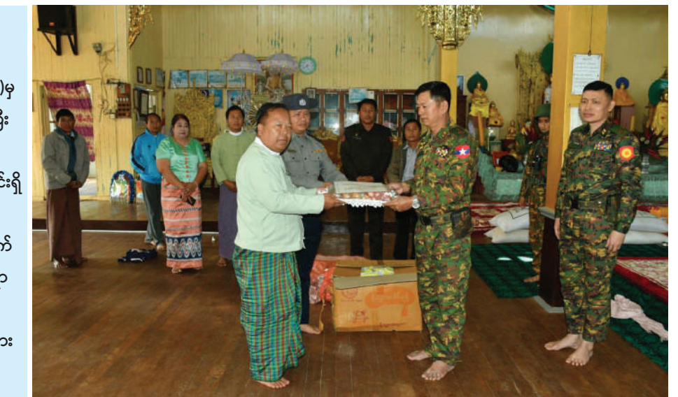
တိုင်းရင်းသားများပြန်လည်အခြေချနေထိုင်လုပ်ကိုင်စားသောက်နိုင်ရေး၊ ပြန်လည်တည်ဆောက်ရေးလုပ်ငန်းများ ဆောင်ရွက်နိုင်ရေးတို့အတွက် ယနေ့နံနက်ပိုင်းတွင် ဖယ်ခုံမြို့နယ်အတွင်းရှိ လမ်းဘေး ဝဲယာနေရာများနှင့် လုဒ်မယ်တော်ကျောင်း(မယ်တော်ဂူ)နေရာများအား လုံခြုံရေးတပ်ဖွဲ့ဝင်များက စုပေါင်းသန့်ရှင်းရေးလုပ်ငန်းများနှင့် ပြန်လည်တည်ဆောက်ရေးလုပ်ငန်းများကို ပိုင်းဝန်းကူညီဆောင်ရွက်ပေးသည်။

ကာကွယ်ရေးဦးစီးချုပ်ရုံး(ကြည်း)မှ ဒုတိယဗိုလ်ချုပ်ကြီးနိုင်နိုင်ဦး ဖယ်ခုံမြို့နယ်အတွင်းရှိ ဌာနဆိုင်ရာဝန်ထမ်းများအတွက် စားသောက်ဖွယ်ရာများနှင့် ဂုဏ်ပြုချီးမြှင့်ငွေများ ပေးအပ်စဉ်။