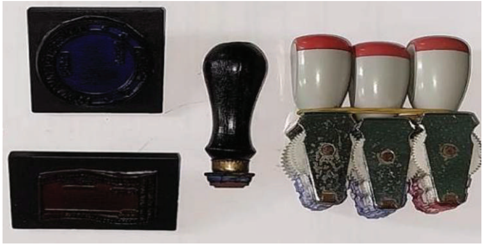
မြန်မာနိုင်ငံကူးလက်မှတ်အတုတွင် ရိုက်နှိပ်အသုံးပြုသည့် လေဆိပ်ဝင်ထွက်တံဆိပ်တုံးအတုများ သိမ်းဆည်းရမိမှု မှတ်တမ်းဓာတ်ပုံ။