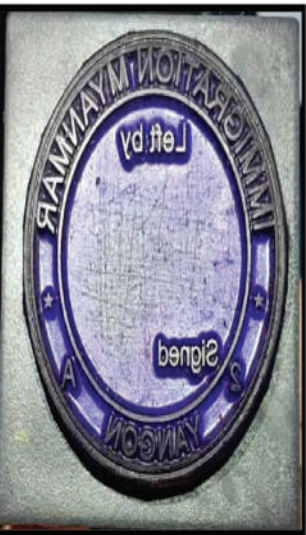
မြန်မာနိုင်ငံကူးလက်မှတ်အတုတွင် ရိုက်နှိပ်အသုံးပြုသည့် လေဆိပ်ဝင်ထွက် တံဆိပ်တုံး အတုများ မှတ်တမ်းဓာတ်ပုံ။