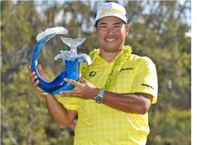
Ref : Xinhua Trs : AZL

ရရှိခဲ့ခြင်းဖြစ်သလို ပုံစံကောင်း ကိုလည်း နောက်ဆုံးနေ့ထိ ထိန်းသိမ်းနိုင်ခဲ့သည်။ မက်ဆူယာမာသည် PGA ဂျာနယ်ဂေါက်သီးရိုက်ကစားသမား Tour၏ပြိုင်ပွဲများတွင် သတ်မှတ် ရိုက်ချက်ထက် အများဆုံးလျော့ ရိုက်နိုင်ခဲ့သည့် ချန်ပီယံအဖြစ် မှတ်တမ်းကောင်း တစ်ရပ်ကို လည်း ရရှိခဲ့သည်။ မက်ဆူယာမာက “နောက်ဆုံး နေ့ရဲ့ နောက်ဆုံးကျင်းမှာ အမှား မရှိအောင်ကစားနိုင်ရင် မှတ်တမ်း ကောင်းတစ်ခုကို သေချာပေါက် ၃၂ ချက်ဖြင့် အမှတ်ပေးဇယား၏ ဒုတိယနေရာတွင် လည်းကောင်း၊ နောက်ဆုံးကျင်းမှာကျင်းစိမ်ပြီးတဲ့ အချိန် အဆင်ပြေပြေပဲ ဝင်သွား တော့ ပျော်စရာတွေနဲ့ အဆုံးသတ် နိုင်ပြီလို့လဲတွေးမိခဲ့တယ်။ တကယ် တမ်းလဲ အားလုံးပြီးတော့ PGA Tour ရဲ့ မှတ်တမ်းကောင်းတစ်ခု ကိုရလိုက်တယ်လို့ သိလိုက်တယ်” ဟုပြောကြားခဲ့ကြောင်း သိရသည်။