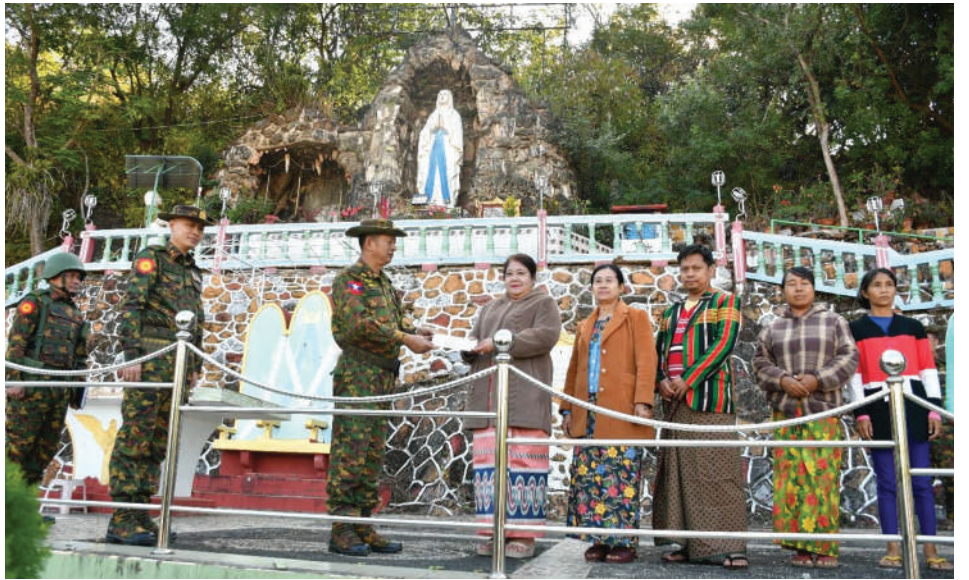
ကာကွယ်ရေးဦးစီးချုပ်ရုံး(ကြည်း)မှ ဒုတိယဗိုလ်ချုပ်ကြီးနိုင်နိုင်ဦး လုဒ်မယ်တော်ကျောင်း(မယ်တော်ဂူ) အတွက် အလှူငွေများ ပေးအပ်လှူဒါန်းစဉ်။

နေပြည်တော် ဇန်နဝါရီ ၆ ရှမ်းပြည်နယ်(တောင်ပိုင်း) ဖယ်ခုံမြို့နယ်အတွင်း KNPP၊ KNDF အဖွဲ့နှင့် PDF အမည်ခံ အကြမ်းဖက်သမားများသည် ၂၀၂၄ ခုနှစ် ဇန်နဝါရီလမှစ၍ အဆိုပါမြို့နယ်အတွင်းရှိ ကျေးရွာ၊ ရပ်ကွက်များအတွင်းသို့ဝင်ရောက်ကာ ကျေးရွာများအတွင်းရှိ နေအိမ်များကို အကာအကွယ်ရယူ၍ အဖျက်အမှောင့်လုပ်ငန်းများ လုပ်ဆောင်ခဲ့သည်။ ထိုသို့လုပ်ဆောင်နေမှုအပေါ် ဒေသခံတိုင်းရင်းသားပြည်သူများသည် လက်ခံနိုင်ခြင်းမရှိသည့်အတွက် တပ်မတော်သို့ သတင်းပေးပို့တိုင်ကြားမှုများပြုလုပ်ခဲ့ကြသဖြင့် တပ်မတော်နှင့် PNO အသွင်ပြောင်းပြည်သူ့စစ်(ဌာန)တပ်ဖွဲ့ဝင်များပူးပေါင်း၍ အဆိုပါဒေသများအတွင်း လိုအပ်သည့် နယ်မြေလုံခြုံရေးလုပ်ငန်းများဆောင်ရွက်ခဲ့ရာ KNPP၊ KNDF အဖွဲ့နှင့် PDF အမည်ခံ အကြမ်းဖက်သမားများနှင့် ထိတွေ့တိုက်ပွဲ