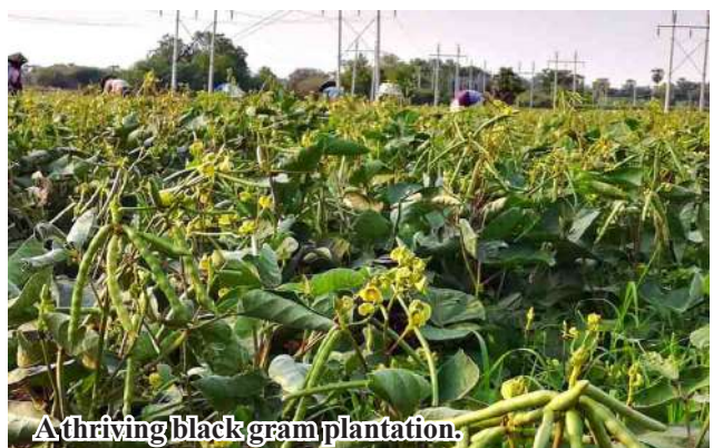
A thriving black gram plantation.

Department of Agriculture, Township Administration Body and relevant departments are joining hands in providing necessary aid for local farmers in growing black grams to meet the target cultivation. Kyaw Kyaw Lin