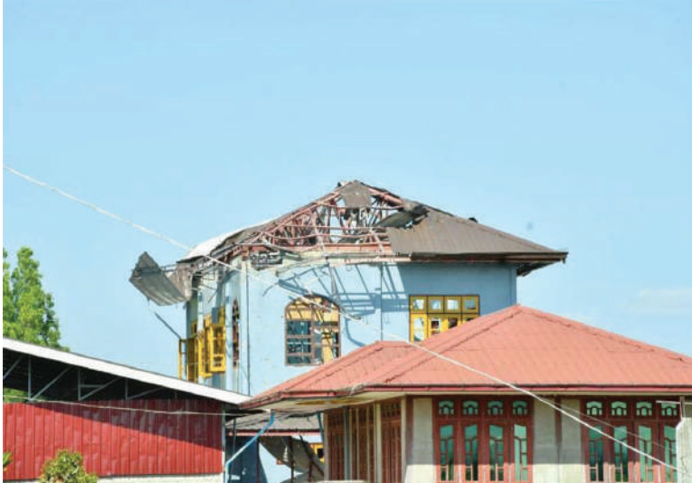
KNPP၊ KNDF အဖွဲ့နှင့် PDF အမည်ခံအကြမ်းဖက်သမားများ ဖယ်ခုံမြို့အတွင်းရှိ အဆောက်အအုံများကို ဖောက်ခွဲဖျက်ဆီးခဲ့သည့် မှတ်တမ်းဓာတ်ပုံ။

ထိုသို့ ဆောင်ရွက်ပေးနေမှုများကို ကာကွယ်ရေးဦးစီးချုပ်ရုံး(ကြည်း)မှ ဒုတိယဗိုလ်ချုပ်ကြီးနိုင်နိုင်ဦး၊ အရှေ့ပိုင်းတိုင်းစစ်ဌာနချုပ် တိုင်းမှူးနှင့် တာဝန်ရှိသူများက သွားရောက်ကြည့်ရှုအားပေးကာ လုဒ်မယ်တော်ကျောင်း (မယ်တော်ဂူ) အတွက် အလှူငွေများပေးအပ်ပြီး အဆိုပါမြို့နယ်အတွင်းရှိ ဆရာတော်၊ သံဃာတော်များအား နတ်တောဘုန်းတော်ကြီးကျောင်းတွင် ဆန်၊ ဆီ၊ စားသောက်ဖွယ်ရာများ၊ အလှူငွေများအား ဆက်ကပ်လှူဒါန်းခဲ့သည်။ ထို့ပြင် ကာကွယ်ရေးဦးစီးချုပ်ရုံး(ကြည်း)မှ ဒုတိယဗိုလ်ချုပ်ကြီးနိုင်နိုင်ဦးနှင့် အဖွဲ့ဝင်များသည် ဖယ်ခုံမြို့နယ်အတွင်းရှိ ဌာနဆိုင်ရာဝန်ထမ်းများအတွက် စားသောက်ဖွယ်ရာများနှင့် ဂုဏ်ပြုချီးမြှင့်ငွေများ ပေးအပ်ခဲ့ကြောင်း သတင်းရရှိသည်။ (၅၀၁)