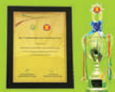
(ASEAN-OSHNET AWARD) တွင် BEST Practices Award ရရှိသည့် ရွှေစိစစ်မှု