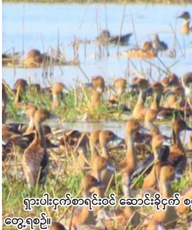
ရူးပိုးမှအဆက် ဆောင်းခိုငှက် စွလီကြီး (Fulvous Whistling-Duck) များကို တွေ့ရစဉ်။

ထပ်မံဝင်ရောက်လာနိုင်သည်ဟု မိုးအင်းကြီးအင်းဘေးမဲ့တော အုပ်ချုပ်ရေးမှူးရုံးက ခန့်မှန်းထားသည်။