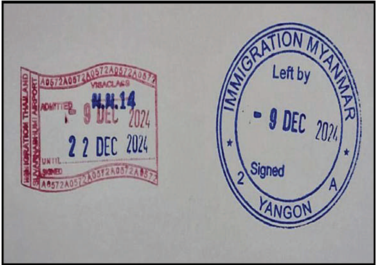
မြန်မာနိုင်ငံကူးလက်မှတ်အတုတွင် ရိုက်နှိပ်အသုံးပြုသည့် လေဆိပ်ဝင်ထွက် တံဆိပ်တုံးအတုများဖြင့် ရိုက်နှိပ်ထားသည့် မှတ်တမ်းဓာတ်ပုံ။