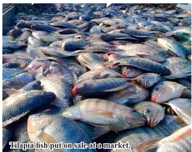
Tilapia fish put on sale at a market.

Local fishermen capture tilapia at natural water whereas local fish farmers