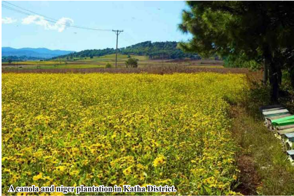
A canola and niger plantation in Katha District.

Township finished cultivation of 149 acres of canola and 12,749 acres of niger, Indaw Township 150 acres of canola and 2,200 acres of niger, Hti-gyaing Township 4,680 acres of niger and Bamauk Township, 2,221 acres of canola and 229 acres of niger, total-ling 22,378 acres.