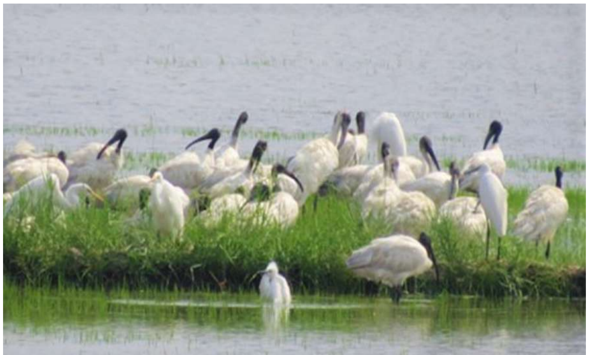
ရှားပါးငှက်စာရင်းဝင် ဆောင်းခိုငှက်ခရုစုတ်ခေါင်းမည်း(Black-headed Ibis)များကို တွေ့ရစဉ်။

ရန်ကုန် ဇန်နဝါရီ ၆ ကမ္ဘာ့ဆောင်းခိုငှက်မျိုးစိတ်များ ကျက်စားရာ ရမ်ဆာရေဝပ်ဒေသ(Ramsar Site) တစ်ခုဖြစ်သည့် မိုးယွန်းကြီးအင်းဘေးမဲ့တောသို့ ဆောင်းခိုငှက်၊ ဌာနေရေပျော်ငှက် မျိုးစိတ်များအပါအဝင် ငှက်မျိုးစိတ် ၁၁၅ မျိုး ဝင်ရောက်ကျက်စားနေကြောင်း မိုးယွန်းကြီးအင်း ဘေးမဲ့တော အုပ်ချုပ်ရေးမှူးမှ သိရသည်။ မိုးယွန်းကြီးဘေးမဲ့တောအင်းဝှက်အင်းရေပြည့်နေပြီး အနိမ့်ဆုံးနေရာတွင် ရေအနက် ငါးပေကျော်နှင့် အနက်ဆုံးနေရာ၌ ၁၀ ပေကျော်ရှိနေ၍ ဆောင်းခိုငှက်ဝင်ရောက်မှု ယမန်နှစ်နှင့် နှိုင်းယှဉ်လျှင် အနည်းငယ် လျော့နည်းနေသော်လည်း လကုန်ပိုင်းတွင် စာမျက်နှာ ၁၇ ကော်လံ ၁ ပ။