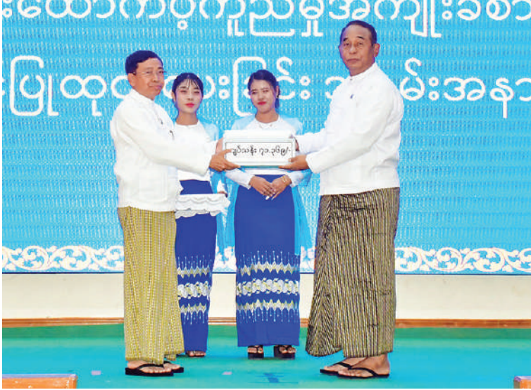
လှယ်များ၊ အလုပ်သမားကိုယ်စားလှယ် ဦးစွာ ပြည်ထောင်စုဝန်ကြီးက တိုင်ဖွန်း မုန်တိုင်း(ရာဂီ)၏အရှိန်ကြောင့် မိုး

အခမ်းအနားသို့ အလုပ်သမားဝန်ကြီးဌာန ပြည်ထောင်စုဝန်ကြီး ဦးမြင့်နောင်၊ နေပြည်တော်ကောင်စီဥက္ကဋ္ဌ ဦးသန်းထွန်းဦး၊ နေပြည်တော်ကောင်စီနယ်မြေအတွင်းရှိ အရာထမ်း၊ အမှုထမ်းများ၊ တာဝန်ရှိသူများနှင့် အလုပ်ရှင်ကိုယ်စားများ တက်ရောက်ကြသည်။