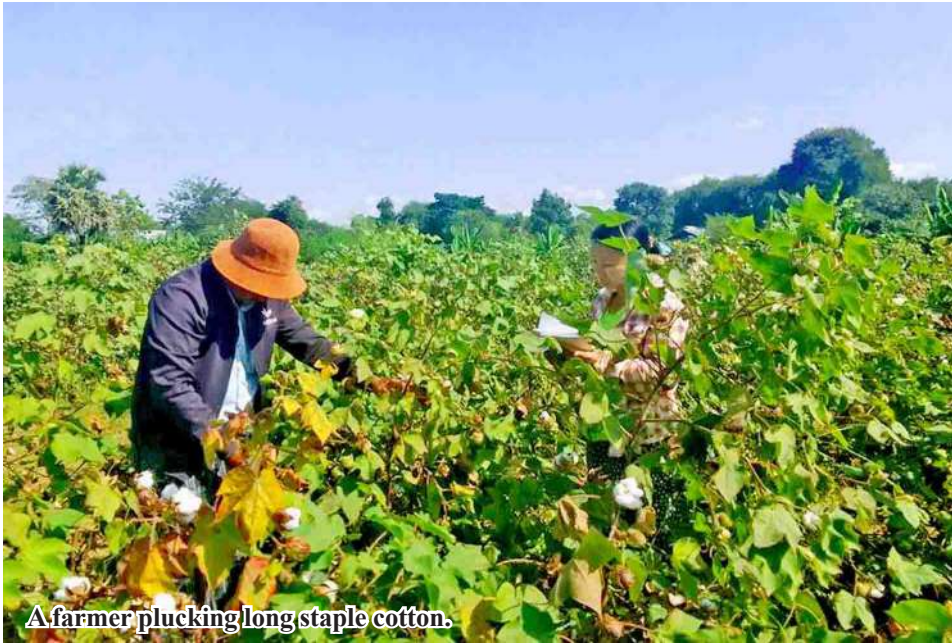
A farmer plucking long staple cotton.

Pwintbyu January 6 A total of 2,457 acres of long-staple cotton has been harvested in Pwintbyu Township of Magway Region, said Daw Moe Moe Wai, Head of Pwintbyu Township Department of Agriculture.