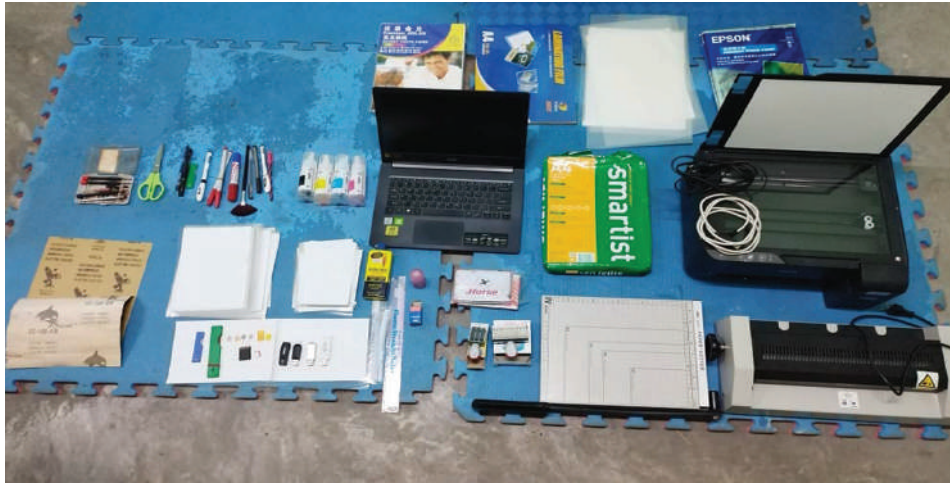
မြန်မာနိုင်ငံကူးလက်မှတ်အတုပြုလုပ်ရာတွင် အသုံးပြုသည့် သက်သေခံပစ္စည်းများ သိမ်းဆည်းရမိမှု မှတ်တမ်းဓာတ်ပုံ။