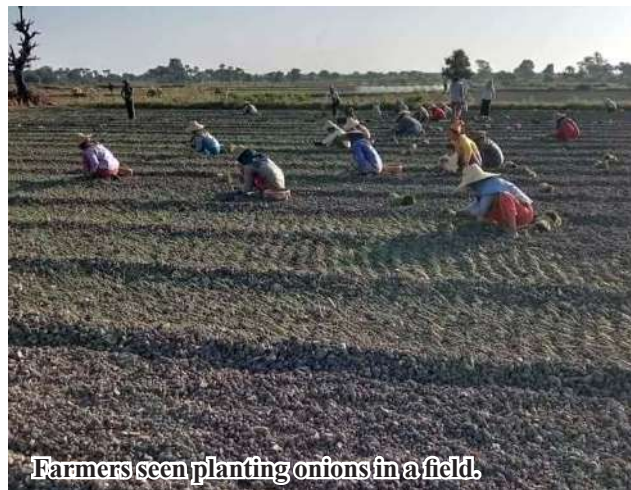
Farmers seen planting onions in a field.

bin, ChaungU, Shwebo and Myinmu townships empha-size cultivation of onions on large sown acreage. 206