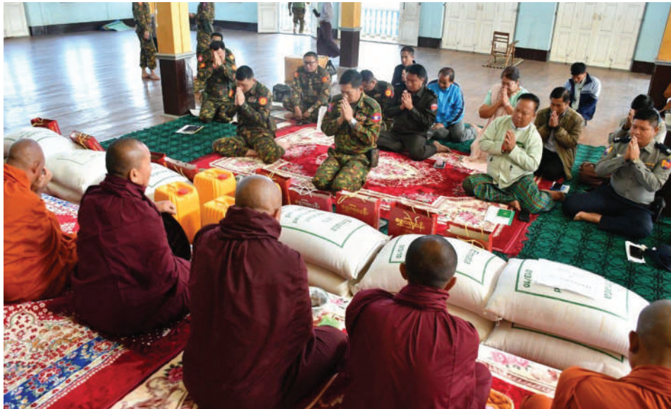
ဖယ်ခုံမြို့နယ်အတွင်းရှိ ဆရာတော်၊ သံဃာတော်များအား ကာကွယ်ရေးဦးစီးချုပ်ရုံး(ကြည်း)မှ ဒုတိယ ဗိုလ်ချုပ်ကြီးနိုင်နိုင်ဦး ဆန်၊ ဆီ၊ စားသောက်ဖွယ်ရာများနှင့် အလှူငွေများ ဆက်ကပ်လှူဒါန်းစဉ်။