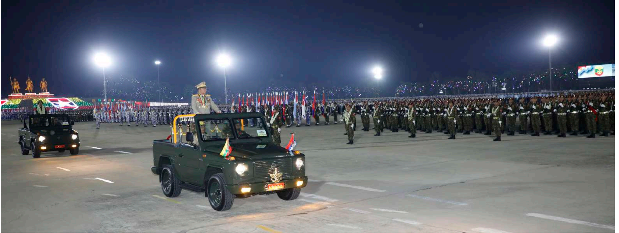
နိုင်ငံတော်စီမံအုပ်ချုပ်ရေးကောင်စီဥက္ကဋ္ဌ တပ်မတော်ကာကွယ်ရေးဦးစီးချုပ် ဗိုလ်ချုပ်မှူးကြီး သတိုးမဟာသရေစည်သူ သတိုးသီရိသုဓမ္မမင်းအောင်လှိုင် စစ်ရေးပြစစ်ကြောင်းကြီးများကို လိုက်လံစစ်ဆေးစဉ်။

အတူ စစ်ရေးပြကွင်းအတွင်းသို့ အစီအစဉ် အတိုင်း ချီတက်ကြသည်။ ထိုသို့ချီတက်ချိန်တွင် နိုင်ငံတော်စီမံ အုပ်ချုပ်ရေးကောင်စီဥက္ကဋ္ဌ တပ်မတော် ကာကွယ်ရေးဦးစီးချုပ်၏ ဇနီးဒေါ်ကြူကြူလှ၊ ကောင်စီဒုတိယဥက္ကဋ္ဌ ဒုတိယတပ်မတော် ကာကွယ်ရေးဦးစီးချုပ် ကာကွယ်ရေးဦးစီးချုပ် (ကြည်း)၏ဇနီးဒေါ်သန်းသန်းနွယ်၊ ညှိနှိုင်း ကွပ်ကဲရေးမှူး (ကြည်း၊ ရေ၊ လေ)၏ ဇနီး၊ ကာကွယ်ရေးဦးစီးချုပ်(ရေ)၏ဇနီး၊ ကာကွယ် ရေးဦးစီးချုပ်(လေ)၏ဇနီး၊ ကာကွယ်ရေး ဦးစီးချုပ်ရုံးမှ တပ်မတော်အရာရှိကြီးများ၏ ဇနီးများက ဂုဏ်ပြုပန်းကုံးများစွပ်၍ ကြိုဆို ကြသည်။ အလားတူကာကွယ်ရေးဦးစီးချုပ် ရုံး(ကြည်း)မှ အရာရှိ စစ်သည်၊ မိသားစုများ၊ နေပြည်တော်တိုင်းစစ်ဌာနချုပ်နှင့် တပ်နယ် အသီးသီးတို့မှ အရာရှိ စစ်သည်၊ မိသားစု များ၊ မြန်မာနိုင်ငံရဲတပ်ဖွဲ့ဝင်များနှင့် မိသားစု များ၊ ဝန်ကြီးဌာနအသီးသီးမှ နိုင်ငံ့ဝန်ထမ်း များ၊ ရုပ်ရှင်ဂီတအနုပညာရှင်များ၊ ဒေသခံ မိဘပြည်သူများကလည်း စစ်ကြောင်း ကြီးများချီတက်ရာ လမ်းတစ်လျှောက် သောင်းသောင်းဖြူဖြူဆိုကာ ဂုဏ်ပြုပန်းကုံး များစွပ်၍ကြိုဆိုခဲ့ကြပြီး စစ်ကြောင်းကြီးများ