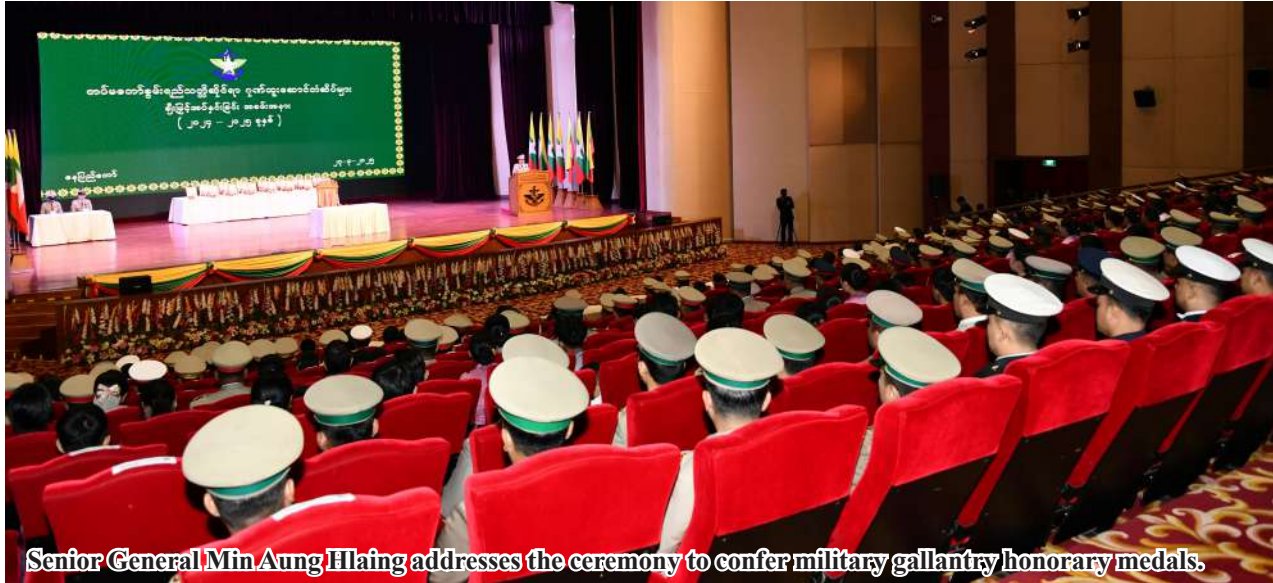
Senior General Min Aung Hlaing addresses the ceremony to confer military gallantry honorary medals.