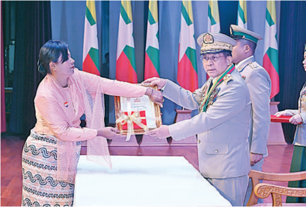
နိုင်ငံတော်စီမံအုပ်ချုပ်ရေးကောင်စီဥက္ကဋ္ဌ တပ်မတော်ကာကွယ်ရေး ဦးစီးချုပ် ဗိုလ်ချုပ်မှူးကြီး သတိုးမဟာသရေစည်သူ သတိုးသီရိသုဓမ္မ မင်းအောင်လှိုင် သူရဲကောင်းမှတ်တမ်းဝင်တံဆိပ်ရရှိသူ ကြည်း ၇၄၉၅၃ ဗိုလ်မှူးအောင်မျိုးကို၏ မိခင် ဒေါ်ဝင်းဝင်းခိုင်အား ဆုတံဆိပ်ပေးအပ် ချီးမြှင့်စဉ်။