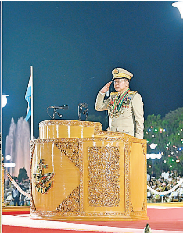
နိုင်ငံတော်စီမံအုပ်ချုပ်ရေးကောင်စီဥက္ကဋ္ဌ တပ်မတော်ကာကွယ်ရေးဦးစီးချုပ် ဗိုလ်ချုပ်မှူးကြီး သတိုးမဟာသရေစည်သူ သတိုးသီရိသုဓမ္မမင်းအောင်လှိုင်အား စစ်ရေးပြမှူးကြီး ဗိုလ်ချုပ်ရဲကျော်သူ ဦးဆောင်သော စစ်ကြောင်းကြီးများက စစ်ကြောင်းပုံဖြင့် ညီညာစွာချီတက်အလေးပြုကြပြီး စစ်ရေးပြကွင်းကြီးအတွင်းမှ ပြန်လည်ထွက်ခွာကြစဉ်။

နေပြည်တော် မတ် ၂၇ ကျင်းပပြုလုပ်ရာ နိုင်ငံတော်စီမံအုပ်ချုပ် ကြားသည်။ တပ်ခွဲ၊ မြန်မာနိုင်ငံရဲတပ်ဖွဲ့ဝင်များနှင့် ပြုအစီအစဉ်အတိုင်း ဆောင်ရွက်ကြသည်။ ၂၀၂၅ ခုနှစ် မတ် ၂၇ ရက် ယနေ့တွင် ရေးကောင်စီဥက္ကဋ္ဌ တပ်မတော်ကာကွယ် ဦးစွာ စစ်ရေးပြအခမ်းအနားတွင် မြန်မာနိုင်ငံရဲတပ်ဖွဲ့ အမျိုးသမီးစစ်ရေးပြ ထို့နောက် ဘက်ပိုက်တပ်စုနှင့် ဗဟိုစစ်တီး ကျရောက်သည့် နှစ် ၈၀ ပြည့် တပ်မတော် ရေးဦးစီးချုပ် ဗိုလ်ချုပ်မှူးကြီး သတိုးမဟာ ပါဝင်ချီတက်ကြမည့် တပ်မတော် မြန်မာနိုင်ငံရဲတပ်ဖွဲ့ အမျိုးသမီးစစ်ရေးပြ ဝိုင်းအဖွဲ့သည် စစ်ရေးပြကွင်းအတွင်းရှိ နေ့စစ်ရေးပြအခမ်းအနားကို ယနေ့ည သရေစည်သူ သတိုးသီရိသုဓမ္မ (ကြည်း၊ ရေ၊ လေ)မှ အရာရှိ၊ စစ်သည်များ၊ များအလိုက် သစ်တပ်စစ်ရေးပြကွင်း၌ သတ်မှတ်နေရာ၌ နေရာယူကြသည်။ ပိုင်းတွင် နေပြည်တော်စစ်ရေးပြကွင်း၌ မင်းအောင်လှိုင် တက်ရောက်မိန့်ခွန်းပြော တပ်မတော်(ကြည်း) အမျိုးသမီးစစ်ရေးပြ စတင်စုရုံးရောက်ရှိနေရာယူကြပြီး စစ်ရေး စာမျက်နှာ ၁၆ ကော်လံ ၁ ပု