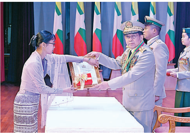
နိုင်ငံတော်စီမံအုပ်ချုပ်ရေးကောင်စီဥက္ကဋ္ဌ တပ်မတော်ကာကွယ်ရေး ဦးစီးချုပ် ဗိုလ်ချုပ်မှူးကြီး သတိုးမဟာသရေစည်သူ သတိုးသီရိသုဓမ္မ မင်းအောင်လှိုင် သူရဲကောင်းမှတ်တမ်းဝင်တံဆိပ်ရရှိသူ ကိုယ်ပိုင် အမှတ် တတ-၁၃၅၄၀၃ တပ်ကြပ်တိုးတက်အောင်၏ အစ်မ ဒေါ်ဆွေဇင်မြင့်အား ဆုတံဆိပ်ပေးအပ်ချီးမြှင့်စဉ်။