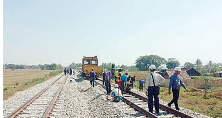
အဆန်ရထားလမ်းပေါ်၌ အကြမ်းဖက်သောင်းကျန်းသူအဖွဲ့က မိုင်းထောင်ဖောက်ခွဲဖျက်ဆီးမှုကြောင့် ရထားလမ်းပျက်စီးမှုအား ပြန်လည်ပြုပြင်ဆောင်ရွက်နေမှုကို တွေ့ရစဉ်။

နှင့် တွဲများ၊ ရထားလမ်းနှင့် တံတားများ၊ ခရီးသည်များနှင့် ကုန်စည်များ ထိခိုက်ပျက်စီးဆုံးရှုံးစေရေး၊ ရထားစီးခရီးသွားပြည်သူများအနေဖြင့် ရထားဖြင့် ခရီးသွားလာရာတွင် ကိုယ်စိတ်နှလုံးချမ်းမြေ့ပြီး အသက်အန္တရာယ်ကင်းရှင်းစွာဖြင့် လုံခြုံစိတ်ချစွာ သွားလာနိုင်မှုမရှိစေရေးအတွက် ရည်ရွယ်ပြီး ယခုကဲ့သို့အကြမ်းကြမ်းကျူးလွန်ဖျက်ဆီးနေကြခြင်းဖြစ်သော်လည်း နိုင်ငံတော်အစိုးရအနေဖြင့် အများပြည်သူခရီးသွားလာမှုနှင့် ကုန်စည်ပို့ဆောင်မှု အဆင်ပြေချောမွေ့မြန်ဆန်စေရေးအတွက် ရထားလမ်းနှင့် အခြေခံအဆောက်အအုံများ ပိုမိုတိုးတက်ကောင်းမွန်လာစေရေးနှင့် ရထားပို့ဆောင်ရေးစနစ် အဆင့်မြှင့်တင်ရေး စီမံကိန်းလုပ်ငန်းများကို ရည်မှန်းချက်ထားရှိ၍ အစဉ်တစိုက် အလေးထားစီမံဆောင်ရွက်ပေးလျက်ရှိကြောင်း မြန်မာ့မီးရထားမှ သတင်းရရှိသည်။ (၅၀၁)