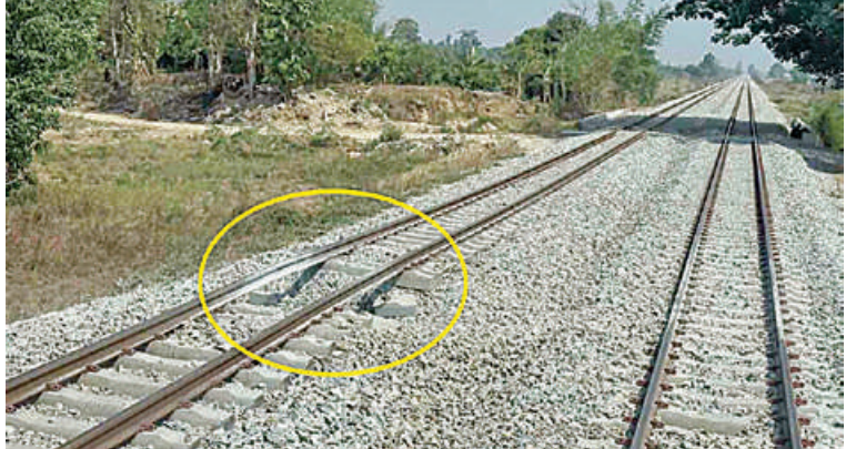
ရန်ကုန်-မန္တလေးရထားလမ်းပိုင်းအတွင်းရှိ ညောင်ခြေထောက်နှင့် ကျွဲပွဲဘူတာအကြား အဆန်ရထားလမ်းပေါ်၌ အကြမ်းဖက်သောင်းကျန်းသူအဖွဲ့က မိုင်းထောင်ဖောက်ခွဲဖျက်ဆီးမှုကြောင့် ရထားလမ်းပျက်စီးမှုကို တွေ့ရစဉ်။