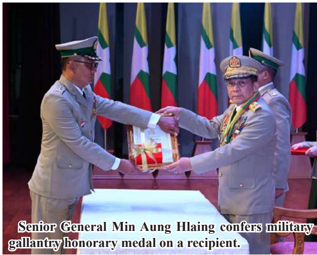
Senior General Min Aung Hlaing confers military gallantry honorary medal on a recipient.

Given the current situation in Myanmar, the Tatmadaw has been serving its duties more intensively than before, working tirelessly day and night. In addition to national defence responsibilities, it is also engaged in training exercises and public welfare activities. Furthermore, the Tatmadaw is actively participating in the implementation of the country's Roadmap and objectives. The efforts made to ensure the security and stability of the people's lives, as well as the economic and social development of the nation, reflect the Tatmadaw's true stance and commitment.