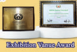
Exhibition Vanue Award