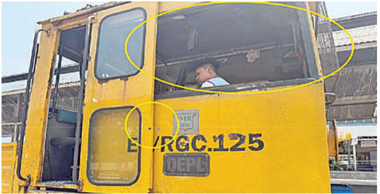
ရန်ကုန်-မန္တလေးရထားလမ်းပိုင်းအတွင်းရှိ ညောင်ခြေထောက်နှင့် ကျွဲပွဲဘူတာအကြား အကြမ်းဖက်သောင်းကျန်းသူအဖွဲ့က လုံခြုံရေးကင်းလှည့် RGC ရထားကို လက်နက်ငယ်ဖြင့်ပစ်ခတ်မှုကြောင့် အနောက်ဘက်မှန်ကွဲ ထိခိုက်မှုကိုတွေ့ရစဉ်။

ကျောက်နှင့် ကွန်ကရစ်လီဖားတုံးအချို့ ပျက်စီးခဲ့သည်။ မြန်မာ့မီးရထားဝန်ထမ်းများအနေဖြင့် လမ်းပိုင်းကို အမြန်ဆုံးပြန်လည်ဖွင့်လှစ်နိုင်ရေးစစ်ဆေးဆောင်ရွက်ခဲ့ပြီး အဆန်လမ်း၏ သံလမ်းကို လဲလှယ်ခြင်း၊ လမ်းပြုပြင်ခြင်းများကို ည ၆ နာရီတွင် အပြီးဆောင်ရွက်နိုင်ခဲ့ပြီး အဆန်ရထားလမ်းပိုင်းကို ပြန်လည်ဖွင့်လှစ်၍ ရထားများ ပုံမှန်အတိုင်း ပြေးဆွဲပေးလျက် ရှိကြောင်း သိရသည်။ အကြမ်းဖက်သောင်းကျန်းသူအဖွဲ့များ အနေဖြင့် ၂၀၂၁ ခုနှစ် ဖေဖော်ဝါရီလမှစ၍ ယခုအချိန်ထိ မြန်မာ့မီးရထားလမ်း