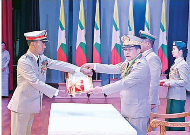
နိုင်ငံတော်စီမံအုပ်ချုပ်ရေးကောင်စီဥက္ကဋ္ဌ တပ်မတော်ကာကွယ်ရေး ဦးစီးချုပ် ဗိုလ်ချုပ်မှူးကြီး သတိုးမဟာသရေစည်သူ သတိုးသီရိသုဓမ္မ မင်းအောင်လှိုင် သူရဲကောင်းမှတ်တမ်းဝင်တံဆိပ်ရရှိသူ ကြည်း ၂၄၄၈ ဗိုလ်မှူးကြီးကျော်စံဦး၏ ဇနီး ဒေါ်ရွှန်းလွဲလွဲထွန်းအား ဆုတံဆိပ် ပေးအပ်ချီးမြှင့်စဉ်။

လိုကြောင်း။ ယနေ့မိမိတို့နိုင်ငံတွင်ဖြစ်ပေါ်နေသည့် အခြေအနေများအရ တပ်မတော်အနေဖြင့် ယခင်ကထက် လုပ်ငန်းတာဝန်များကို နေ့ညမနားဘဲ ဆတက်ထမ်းပိုးဆောင် ရွက်နေကြကြောင်း၊ နိုင်ငံတော်ကာကွယ် ရေးတာဝန်များအပြင် လေ့ကျင့်ရေး တာဝန်များ၊ ပြည်သူ့အကျိုးပြုလုပ်ငန်း များကို ဆောင်ရွက်နေရသကဲ့သို့ နိုင်ငံ တော်၏ ရှေ့လုပ်ငန်းစဉ်များနှင့် ဦးတည် ချက်များကို အကောင်အထည်ဖော်ရာတွင် လည်း တစ်တပ်တစ်အား ပါဝင်ထမ်း ဆောင်လျက်ရှိကြောင်း၊ ပြည်သူများ၏ဘဝ လုံခြုံအေးချမ်းရေး၊ လူမှုစီးပွားဖွံ့ဖြိုးတိုး တက်ရေးမှ တိုင်းပြည်တစ်ဝန်းလုံး တည် ငြိမ်အေးချမ်းဖွံ့ဖြိုးစေရန် တပ်မတော်က ကြိုးစားဆောင်ရွက်ပေးနေခြင်းများသည် စာမျက်နှာ ၂၁ သို့