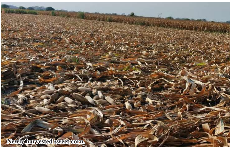
Newly harvested sweet corn.