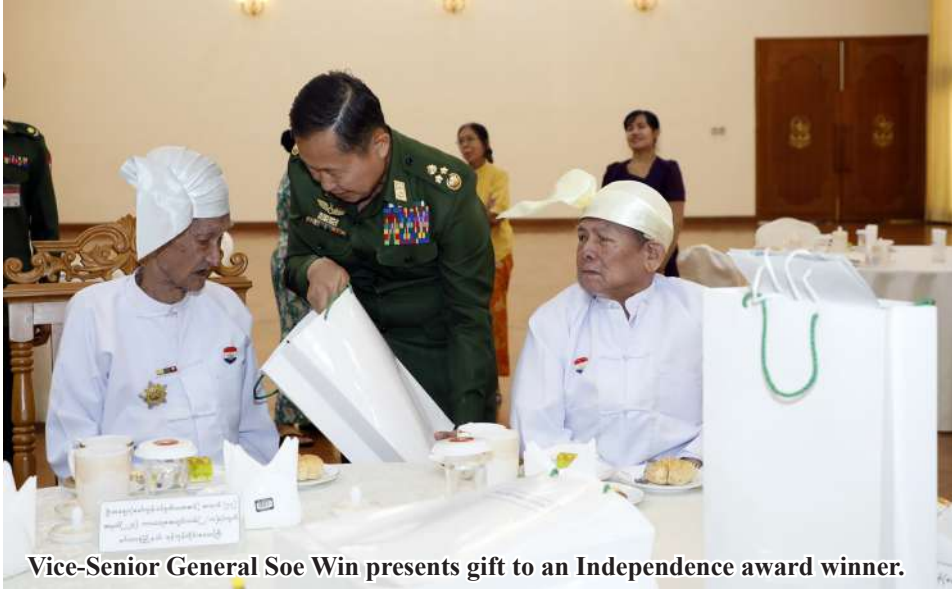
Vice-Senior General Soe Win presents gift to an Independence award winner.

Nay Pyi Taw March 27 Chairman of the State Administration Council Deputy Commander-in-Chief of Defence Services Com-