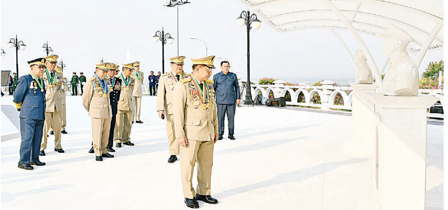
နိုင်ငံတော်စီမံအုပ်ချုပ်ရေးကောင်စီဥက္ကဋ္ဌ တပ်မတော်ကာကွယ်ရေးဦးစီးချုပ် ဗိုလ်ချုပ်မှူးကြီး သတိုးမဟာသရေစည်သူ သတိုးသီရိသုဓမ္မမင်းအောင်လှိုင် သူရဲကောင်းဗိမာန်အတွင်း လှည့်လည်ကြည့်ရှုစဉ်။