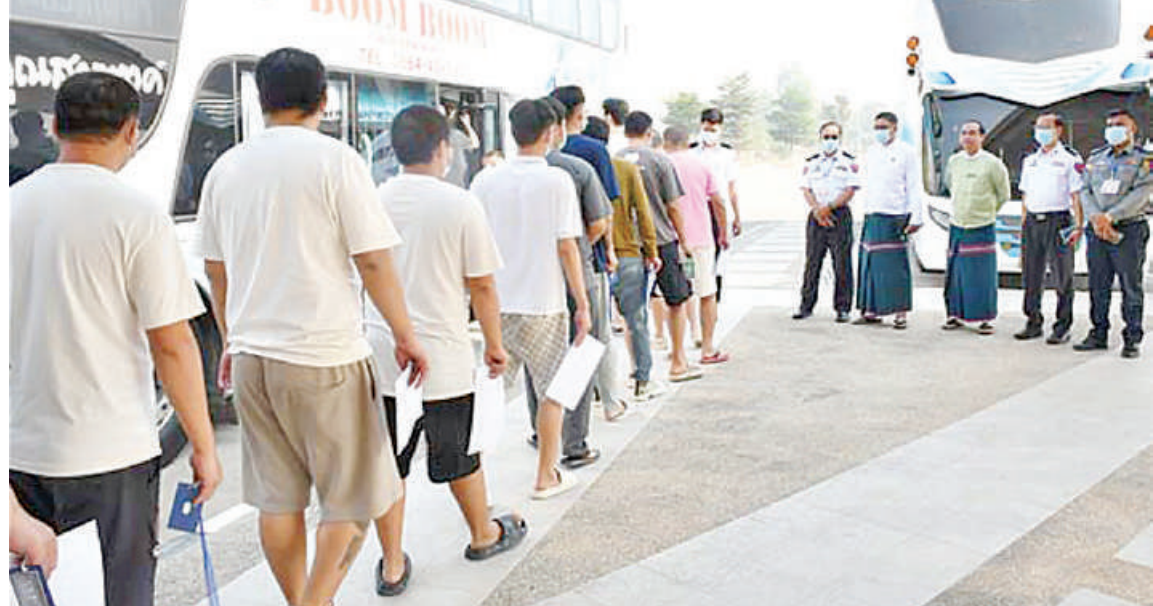
အွန်လိုင်းလိမ်လည်မှု(Telecom Fraud)နှင့် ဒုစရိုက်မှုလုပ်ငန်းများတွင် ဆက်စပ်ပါဝင်ခဲ့ကြသည့် တရုတ်နိုင်ငံသား ၃၆၅ ဦးကို သက်ဆိုင်ရာနိုင်ငံသို့ ထပ်မံပြည်နှင့်လွှဲပြောင်းပေးအပ်မှု မှတ်တမ်းဓာတ်ပုံ။

နေပြည်တော် မတ် ၂၇ မြန်မာ-တရုတ်-ထိုင်းသုံးနိုင်ငံအကြား သုံးပိုင်ဆိုင် ပူးပေါင်းဆောင်ရွက်မှုပုံစံ (Trilateral Cooperation) ဖြင့် အွန်လိုင်း အသုံးပြုလိမ်လည်မှု (Online Scam) နှင့် အွန်လိုင်းလောင်းကစားမှု (Online Gambling) လုပ်ဆောင်နေကြသူများ၊ ပါဝင်ပတ်သက်သူများနှင့် နောက်ကွယ်က ကြိုးကိုင်သော ပြည်ပနိုင်ငံသားများကို ပြတ်ပြတ်သားသား စုံစမ်းဖော်ထုတ် တိုက်ဖျက်လျက်ရှိရာ ယနေ့တွင် အဆိုပါ လုပ်ငန်းများ၌ ဆက်စပ်ပါဝင်ခဲ့ကြသည့် တရုတ်နိုင်ငံသား ၃၆၅ ဦးကို မြန်မာ-ထိုင်း အမှတ်(၂)ချစ်ကြည်ရေးတံတားမှတစ်ဆင့် သက်ဆိုင်ရာနိုင်ငံသို့ လူသားချင်းစာနာ ထောက်ထားမှုနှင့် နိုင်ငံအချင်းချင်း ချစ်ကြည်ရင်းနှီးမှုတို့ကို ရှေးရှု၍ ဥပဒေ လုပ်ထုံးလုပ်နည်းများနှင့်အညီ ထပ်မံ ပြည်နှင့်လွှဲပြောင်းပေးသည်။