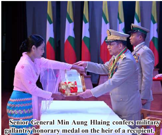
Senior General Min Aung Hlaing confers military gallantry honorary medal on the heir of a recipient.