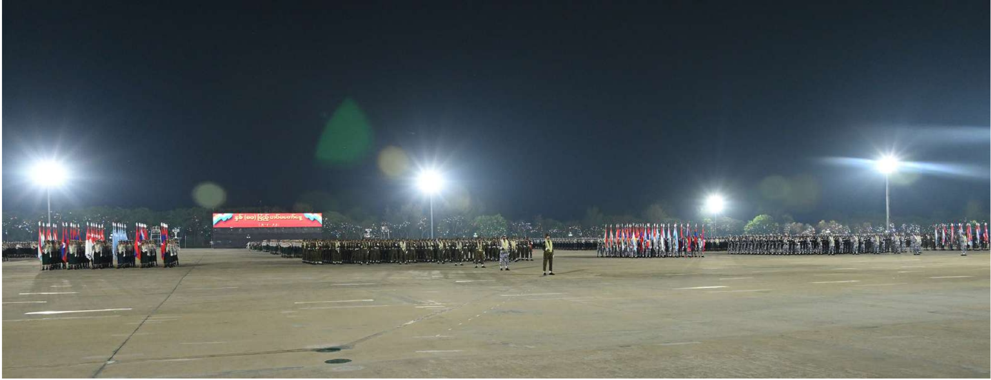
နိုင်ငံတော်စီမံအုပ်ချုပ်ရေးကောင်စီဥက္ကဋ္ဌ တပ်မတော်ကာကွယ်ရေးဦးစီးချုပ် ဗိုလ်ချုပ်မှူးကြီး သတိုးမဟာသရေစည်သူ သတိုးသီရိသုဓမ္မမင်းအောင်လှိုင် နှစ် ၈၀ ပြည့် တပ်မတော်နေ့စစ်ရေးပြအခမ်းအနားတွင် မိန့်ခွန်း ပြောကြားစဉ်။