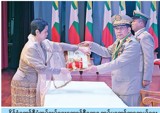
နိုင်ငံတော်စီမံအုပ်ချုပ်ရေးကောင်စီဥက္ကဋ္ဌ တပ်မတော်ကာကွယ်ရေး ဦးစီးချုပ် ဗိုလ်ချုပ်မှူးကြီး သတိုးမဟာသရေစည်သူ သတိုးသီရိသုဓမ္မ မင်းအောင်လှိုင် သူရဲကောင်းမှတ်တမ်းဝင်တံဆိပ်ရရှိသူ ရဲ ၁၇၄၀ ရဲမှူးချုပ်မှူးကြီးကျော်စံဦး၏ ဇနီး ဒေါ်ဥမ္မာအေးအား ဆုတံဆိပ်ပေးအပ် ချီးမြှင့်စဉ်။