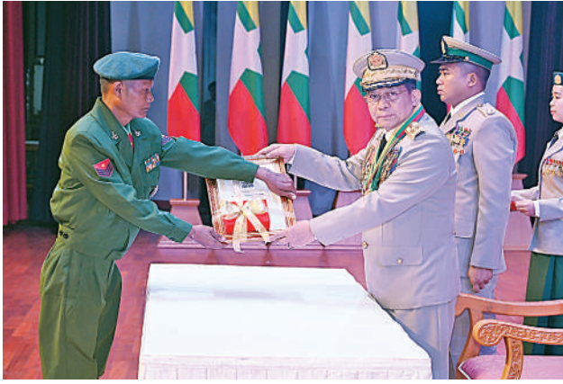
နိုင်ငံတော်စီမံအုပ်ချုပ်ရေးကောင်စီဥက္ကဋ္ဌ တပ်မတော်ကာကွယ်ရေး ဦးစီးချုပ် ဗိုလ်ချုပ်မှူးကြီး သတိုးမဟာသရေစည်သူ သတိုးသီရိသုဓမ္မ မင်းအောင်လှိုင် သူရဲကောင်းမှတ်တမ်းဝင်တံဆိပ်ရရှိသူ ကိုယ်ပိုင် အမှတ် ၇၉၇၇၉၇ တပ်ခွဲတပ်ကြပ်ကြီးစန်းမြင့်အား ဆုတံဆိပ်ပေးအပ် ချီးမြှင့်စဉ်။