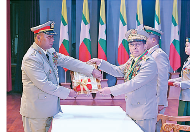
နိုင်ငံတော်စီမံအုပ်ချုပ်ရေးကောင်စီဥက္ကဋ္ဌ တပ်မတော်ကာကွယ်ရေး ဦးစီးချုပ် ဗိုလ်ချုပ်မှူးကြီး သတိုးမဟာသရေစည်သူ သတိုးသီရိသုဓမ္မ မင်းအောင်လှိုင် သူရဲကောင်းမှတ်တမ်းဝင်တံဆိပ်ရရှိသူ ကြည်း ၂၆၈၉ ဗိုလ်မှူးကြီးဖြူဝင်းအား ဆုတံဆိပ်ပေးအပ်ချီးမြှင့်စဉ်။