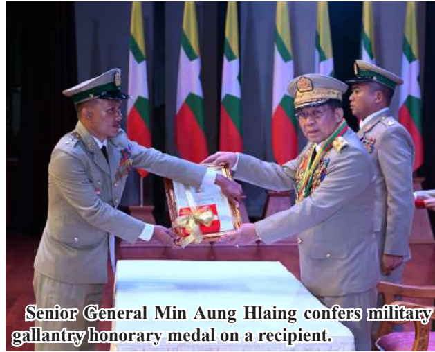
Senior General Min Aung Hlaing confers military gallantry honorary medal on a recipient.