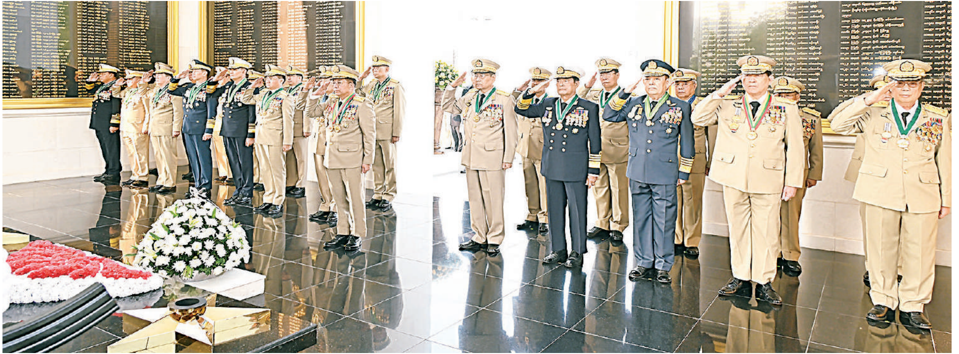
နိုင်ငံတော်စီမံအုပ်ချုပ်ရေးကောင်စီဥက္ကဋ္ဌ တပ်မတော်ကာကွယ်ရေးဦးစီးချုပ် ဗိုလ်ချုပ်မှူးကြီး သတိုးမဟာသရေစည်သူ သတိုးသီရိသုဓမ္မမင်းအောင်လှိုင်နှင့် တပ်မတော်အရာရှိကြီးများ သူရဲကောင်းဗိမာန်(နေပြည်တော်)၌ ဂုဏ်ပြုပန်းခြင်းချ အလေးပြုစဉ်။

နေပြည်တော် မတ် ၂၇ ယနေ့တွင်ကျရောက်သည့် နှစ် ၈၀ ပြည့် တပ်မတော်နေ့အထိမ်းအမှတ်အဖြစ် ယနေ့နံနက်ပိုင်းတွင် သူရဲကောင်းဗိမာန်(နေပြည်တော်)၌ ဂုဏ်ပြုပန်းခြင်းချ အလေးပြုခြင်းအခမ်းအနားကို ကျင်းပပြုလုပ်ရာ နိုင်ငံတော်စီမံအုပ်ချုပ်ရေးကောင်စီဥက္ကဋ္ဌ တပ်မတော်ကာကွယ်ရေးဦးစီးချုပ်ဗိုလ်ချုပ်မှူးကြီး သတိုးမဟာသရေစည်သူ သတိုးသီရိသုဓမ္မမင်းအောင်လှိုင် တက်ရောက်၍ ဂုဏ်ပြုပန်းခြင်းချအလေးပြုသည်။ အခမ်းအနားသို့ နိုင်ငံတော်စီမံအုပ်ချုပ်ရေးကောင်စီဥက္ကဋ္ဌ တပ်မတော်ကာကွယ်ရေးဦးစီးချုပ်နှင့်အတူ နိုင်ငံတော်စီမံအုပ်ချုပ်ရေးကောင်စီ ဒုတိယဥက္ကဋ္ဌ ဒုတိယ တပ်မတော်ကာကွယ်ရေးဦးစီးချုပ် ကာကွယ်ရေးဦးစီးချုပ်(ကြည်း) ဒုတိယဗိုလ်ချုပ်မှူးကြီး သီရိပျံချီ မဟာသရေစည်သူစိုးဝင်း၊ ညှိနှိုင်းကွပ်ကဲရေးမှူး(ကြည်း) ရှေ့လေ ဗိုလ်ချုပ်ကြီး ဇေယျကျော်ထင် သရေစည်သူကျော်စွာလင်း၊ ကာကွယ်ရေးဦးစီးချုပ်(ရေ) ဗိုလ်ချုပ်ကြီး ဇေယျကျော်ထင်ထိန်ဝင်း၊ ကာကွယ်ရေးဦးစီးချုပ်(လေ) ဗိုလ်ချုပ်ကြီး ဇေယျကျော်ထင်စည်သူထွန်းအောင်၊ အငြိမ်းစား တပ်မတော်အရာရှိကြီးများ၊ ကာကွယ်ရေးဦးစီးချုပ်ရုံးမှ အဆင့်မြင့်တပ်မတော်အရာရှိကြီးများ တက်ရောက်ကြသည်။ ဦးစွာ နိုင်ငံတော်စီမံအုပ်ချုပ်ရေးကောင်စီဥက္ကဋ္ဌ တပ်မတော်ကာကွယ်ရေးဦးစီးချုပ်နှင့် တပ်မတော်အရာရှိကြီးများသည် သူရဲကောင်းဗိမာန်အတွင်း နှင့် ရင်ပြင်တွင် နေရာယူကြကာ နိုင်ငံတော်စီမံအုပ်ချုပ်ရေး ကောင်စီဥက္ကဋ္ဌ တပ်မတော်ကာကွယ်ရေးဦးစီးချုပ် က ဂုဏ်ပြုပန်းခြင်းချပြီး တက်ရောက်လာကြသည့် တပ်မတော်အရာရှိကြီးများနှင့်အတူ နိုင်ငံတော်ကာကွယ်ရေးနှင့် လုံခြုံရေးတာဝန်များ ထမ်းဆောင်စဉ် အသက်စွန့်လွှတ်ပေးလှူခဲ့ရသည့် သူရဲကောင်းစစ်သည်များအား အလေးပြုကြသည်။ ထို့နောက် နိုင်ငံတော်စီမံအုပ်ချုပ်ရေး