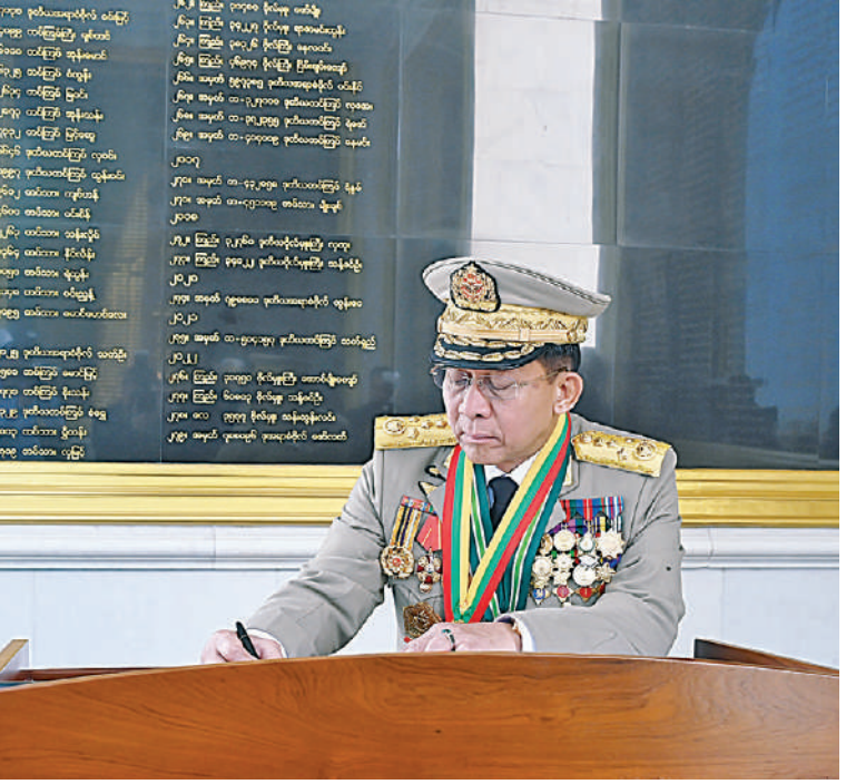
နိုင်ငံတော်စီမံအုပ်ချုပ်ရေးကောင်စီဥက္ကဋ္ဌ တပ်မတော်ကာကွယ်ရေးဦးစီးချုပ် ဗိုလ်ချုပ်မှူးကြီး သတိုးမဟာသရေစည်သူ သတိုးသီရိသုဓမ္မမင်းအောင်လှိုင် သူရဲကောင်းဗိမာန်(နေပြည်တော်)၌ ဧည့်သည်တော်မှတ်တမ်းစာအုပ်တွင် လက်မှတ်ရေးထိုးစဉ်။

ရရှိသည့် စွန့်လွှတ်စွန့်စားလို သည့်စိတ်ဓာတ်များ ရှင်သန်ကိန်းအောင်း လာစေရန် စသည့်ရည်ရွယ်ချက်များဖြင့် နိုင်ငံတော်စီမံအုပ်ချုပ်ရေးကောင်စီဥက္ကဋ္ဌ တပ်မတော်ကာကွယ်ရေး ဦးစီးချုပ်၏ လမ်းညွှန်ချက်အရ ၂၀၁၇ ခုနှစ် မတ် ၂၇ ရက်တွင် ဖွင့်လှစ်ခဲ့ခြင်းဖြစ်ကြောင်း၊ ဗိမာန်အတွင်းနံရံများ၌ နိုင်ငံတော်ကာကွယ်ရေးတာဝန်များကို ထမ်းဆောင်ရင်း အသက်စွန့်လွှတ်ပေးလှူခဲ့ရသည့် အောင်ဆန်းသူရိယဘွဲ့ရရှိခဲ့သူ၊ သီဟသူရဘွဲ့ရရှိခဲ့သူ၊ သူရဘွဲ့ရရှိခဲ့သူ၊ သူရဲကောင်းမှတ်တမ်းဝင်တံဆိပ် ရရှိခဲ့သူများ၏ အမည်များကို ဂရင်းနိုက်ကျောက်ပြားပေါ်၌ ရွှေစာလုံးများဖြင့် ရေးထွင်းမှတ်တမ်းတင် ဂုဏ်ပြုထားရှိကြောင်းနှင့် ဗိမာန်၏အပြင်ဘက်တွင်လည်း အောင်ဆန်းသူရိယဘွဲ့ရရှိခဲ့သူ စစ်သည် ငါးဦးနှင့် အရပ်သားတစ်ဦးတို့၏ ပုံတူများကို ဂုဏ်ပြုစိုက်ထူထားရှိကြောင်း သတင်းရရှိသည်။ (၅၀၁)