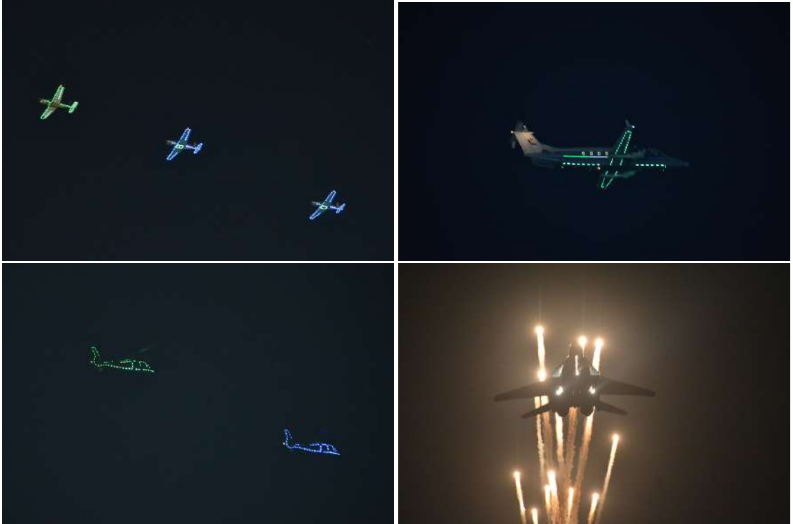
နိုင်ငံတော်စီမံအုပ်ချုပ်ရေးကောင်စီဥက္ကဋ္ဌ တပ်မတော်ကာကွယ်ရေးဦးစီးချုပ် ဗိုလ်ချုပ်မှူးကြီး သတိုးမဟာသရေစည်သူ သတိုးသီရိသုဓမ္မမင်းအောင်လှိုင်အား တပ်မတော်(လေ)မှ လေယာဉ်၊ ရဟတ်ယာဉ်များက သရုပ်ပြပျံသန်း၍ အလေးပြုစဉ်။

ထိုသို့ ချိတ်အလေးပြုချိန်တွင် တပ်မတော်(လေ)မှ MTX-1A လေယာဉ် တစ်စင်းနှင့် PT-6 လေယာဉ် နှစ်စင်းတို့က ရှုရပ်၏ရှေ့တည့်တည့်သို့ Trail Formation ပုံစံဖြင့်လည်းကောင်း၊ H-125 ရဟတ် ယာဉ် နှစ်စင်းက Trail Formation ပုံစံဖြင့် လည်းကောင်း၊ Bell-206 ရဟတ်ယာဉ် တစ်စင်းက ရှုရပ်၏လက်ဝဲဘက်မှလက်ယာ ဘက်သို့ ပျံသန်း၍လည်းကောင်း၊ Eurocopter နှစ်စင်းက Trail Formation ပုံစံ ဖြင့် ရှုရပ်၏လက်ဝဲဘက်မှ လက်ယာဘက် သို့ပျံသန်း၍လည်းကောင်း၊ H-125 ရဟတ် ယာဉ် နှစ်စင်းက ရှုရပ်၏အရှေ့ဘယ် ၄၅ ဒီဂရီမြင်ကွင်းမှ ၂၉၅ ဒီဂရီလမ်းကြောင်း အတိုင်း Echelon Formation ပုံစံဖြင့် လည်းကောင်း၊ Bell-206 ရဟတ်ယာဉ် တစ်စင်းက ရှုရပ်၏ ရှေ့တည့်တည့်မှ