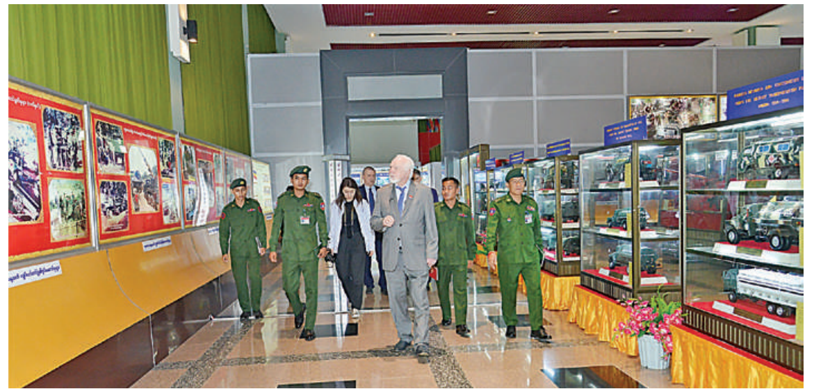
ရုရှားဖက်ဒရေးရှင်းနိုင်ငံမှ ရုရှားကာကွယ်ရေးဝန်ကြီးဌာန ပြည်သူ့ရေးရာကောင်စီဥက္ကဋ္ဌ Mr. Pavel Nikoleaevich GUSEV ဦးဆောင်သော ကိုယ်စားလှယ်အဖွဲ့ တပ်မတော်စစ်သမိုင်းပြတိုက်(နေပြည်တော်)ရှိ ပြခန်းများကို လေ့လာကြစဉ်။

အတွင်းဝန် ဦးမြင့်ကျော်၊ ကာကွယ်ရေး ဦးစီးချုပ်ရုံးမှ တာဝန်ရှိသူများ တက် ရောက်ကြပြီး ရုရှားဖက်ဒရေးရှင်းနိုင်ငံမှ ရုရှားကာကွယ်ရေးဝန်ကြီးဌာန ပြည်သူ့ ရေးရာကောင်စီဥက္ကဋ္ဌ Mr.Pavel Nikole- aevich GUSEV နှင့်အတူ ကိုယ်စားလှယ် အဖွဲ့ဝင်များ တက်ရောက်ကြသည်။ ထိုသို့ တွေ့ဆုံဆွေးနွေးရာတွင် ရုရှား- မြန်မာ နှစ်နိုင်ငံတပ်မတော် နှစ်ရပ်အကြား ဆက်ဆံရေး ပိုမိုတိုးတက်ကောင်းမွန် လာသည့် အခြေအနေများ၊ ပြည်သူ့ရေးရာ ကောင်စီအနေဖြင့် ရုရှားတပ်မတော် နှင့် ပြည်သူ့လူထုအကျိုးပြုလုပ်ငန်းများ ဆောင်ရွက်လျက်ရှိသည့် အခြေအနေများ၊ လေ့လာရေးခရီးစဉ်များအဖြစ် နှစ်နိုင်ငံ လူငယ်များကို အပြန်အလှန်စေလွှတ်