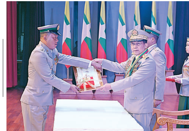
နိုင်ငံတော်စီမံအုပ်ချုပ်ရေးကောင်စီဥက္ကဋ္ဌ တပ်မတော်ကာကွယ်ရေး ဦးစီးချုပ် ဗိုလ်ချုပ်မှူးကြီး သတိုးမဟာသရေစည်သူ သတိုးသီရိသုဓမ္မ မင်းအောင်လှိုင် သူရဲကောင်းမှတ်တမ်းဝင်တံဆိပ်ရရှိသူ ကြည်း ၄၄၅၁ ဗိုလ်မှူးအောင်ဘိုဘိုအား ဆုတံဆိပ်ပေးအပ်ချီးမြှင့်စဉ်။