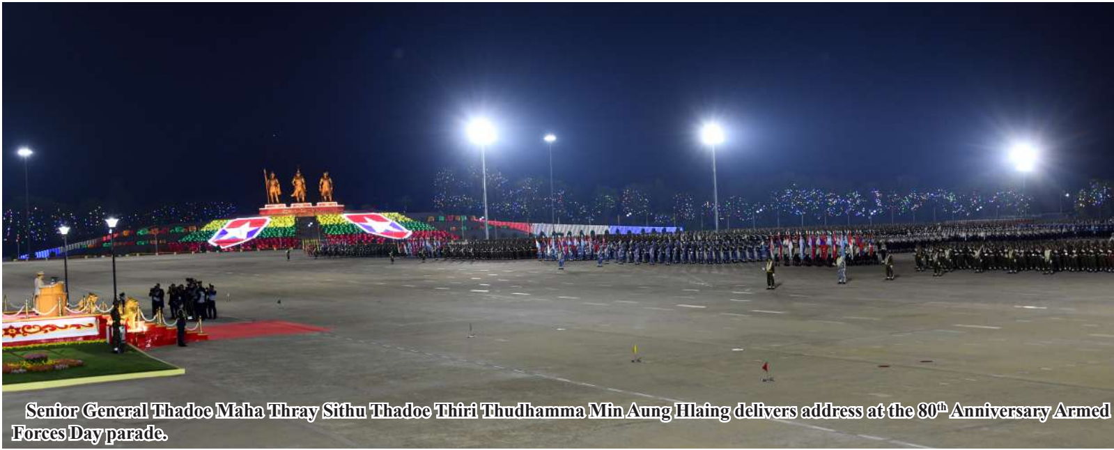
Senior General Thadoe Maha Thray Sithu Thadoe Thiri Thudhamma Min Aung Hlaing delivers address at the 80 th Anniversary Armed Forces Day parade.