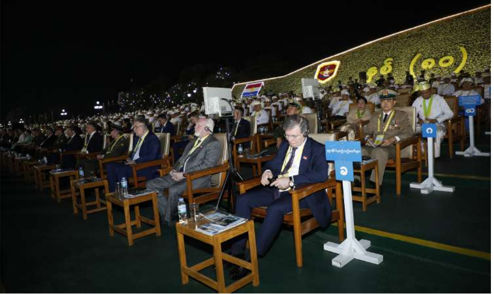
နှစ် ၈၀ ပြည့် တပ်မတော်နေ့ စစ်ရေးပြအခမ်းအနားသို့တက်ရောက်လာကြသည့် ဧည့်သည်တော်များကို တွေ့ရစဉ်။

ရဲတပ်ဖွဲ့ဝင်များက နိုင်ငံတော်အလံနှင့် ကျဆုံးလေပြီးသော တပ်မတော်သားများ အား အလေးပြုကြပြီး သစ္စာလေးချက်ကို သံပြိုင်ရွတ်ဆိုကြသည်။