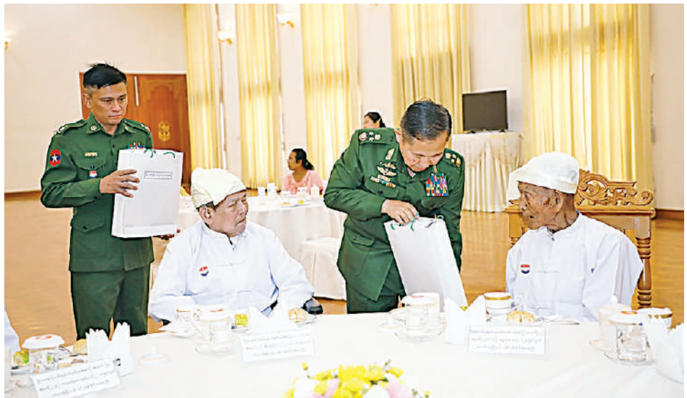
နိုင်ငံတော်စီမံအုပ်ချုပ်ရေးကောင်စီ ဒုတိယဥက္ကဋ္ဌ ဒုတိယတပ်မတော်ကာကွယ်ရေးဦးစီးချုပ် ကာကွယ်ရေးဦးစီးချုပ်(ကြည်း) ဒုတိယဗိုလ်ချုပ်မှူးကြီးစိုးဝင်း လွတ်လပ်ရေးမော်ကွန်းဝင် တတိယဆင့် ဦးအေးသိန်းအား ဂါရဝပြုချီးမြှင့်ငွေနှင့် အားဖြည့်ငှက်သိုက်များကို ကိုယ်တိုင်ကိုယ်ကျပေးအပ်စဉ်။

နေပြည်တော် မတ် ၂၇ နှစ် ၈၀ ပြည့် တပ်မတော်နေ့စစ်ရေးပြအခမ်းအနားသို့ တက်ရောက်ကြသည့် လွတ်လပ်ရေးမော်ကွန်းဝင်ပုဂ္ဂိုလ် ဒုတိယဆင့်နှစ်ဦးနှင့် တတိယဆင့် တစ်ဦး စုစုပေါင်း သုံးဦးတို့ကို နိုင်ငံတော်စီမံအုပ်ချုပ်ရေးကောင်စီ ဒုတိယဥက္ကဋ္ဌ ဒုတိယတပ်မတော်ကာကွယ်ရေးဦးစီးချုပ် ဖြင့် တည်ခင်းဧည့်ခံ၍ ဂါရဝပြုတွေ့ဆုံသည်။ ထိုသို့တွေ့ဆုံစဉ် နိုင်ငံတော်စီမံအုပ်ချုပ်ရေးကောင်စီ ဒုတိယဥက္ကဋ္ဌ ဒုတိယတပ်မတော်ကာကွယ်ရေးဦးစီးချုပ် ကာကွယ်ရေးဦးစီးချုပ်(ကြည်း) ဒုတိယဗိုလ်ချုပ်မှူးကြီးစိုးဝင်းနှင့်ဇနီး ဒေါ်သန်းသန်းနွယ်တို့က ယနေ့နံနက်ပိုင်းတွင် နေပြည်တော်ရှိ ဘုရင့်နေောင်ရိပ်သာ