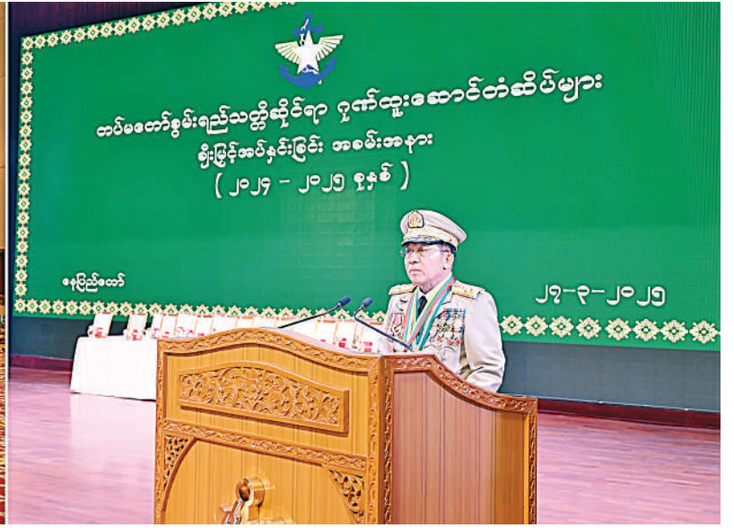
နိုင်ငံတော်စီမံအုပ်ချုပ်ရေးကောင်စီဥက္ကဋ္ဌ တပ်မတော်ကာကွယ်ရေးဦးစီးချုပ် ဗိုလ်ချုပ်မှူးကြီး သတိုးမဟာသရေစည်သူ သတိုးသီရိသုဓမ္မမင်းအောင်လှိုင် တပ်မတော်စွမ်းရည်သတ္တိဆိုင်ရာ ဂုဏ်ထူးဆောင်တံဆိပ်များ ချီးမြှင့်အပ်နှင်းခြင်းအခမ်းအနားတွင် ဂုဏ်ပြုအမှာစကားပြောကြားစဉ်။