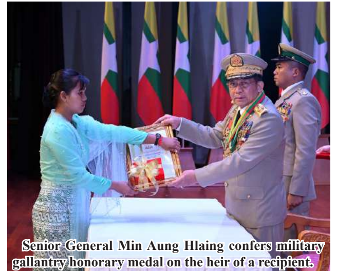
Senior General Min Aung Hlaing confers military gallantry honorary medal on the heir of a recipient.

dress by State Administration Council Commander-in-Chief of Defence Services Senior General Thadoe Maha Thray Sithu Thadoe Thiri Thudhamma Min Aung Hlaing.