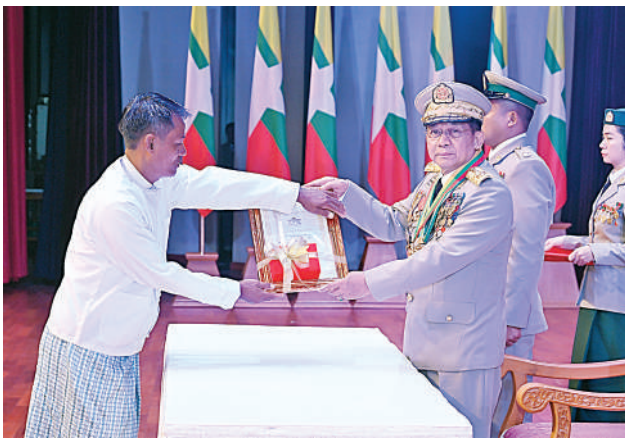
နိုင်ငံတော်စီမံအုပ်ချုပ်ရေးကောင်စီဥက္ကဋ္ဌ တပ်မတော်ကာကွယ်ရေး ဦးစီးချုပ် ဗိုလ်ချုပ်မှူးကြီး သတိုးမဟာသရေစည်သူ သတိုးသီရိသုဓမ္မ မင်းအောင်လှိုင် သူရဲကောင်းမှတ်တမ်းဝင်တံဆိပ်ရရှိသူ ပစ-၁၀၀၃၂၆ ဒုတိယတပ်ကြပ်သန့်ဇင်ဦး၏ ဖခင် ဦးကျော်ကြီးအား ဆုတံဆိပ် ပေးအပ်ချီးမြှင့်စဉ်။