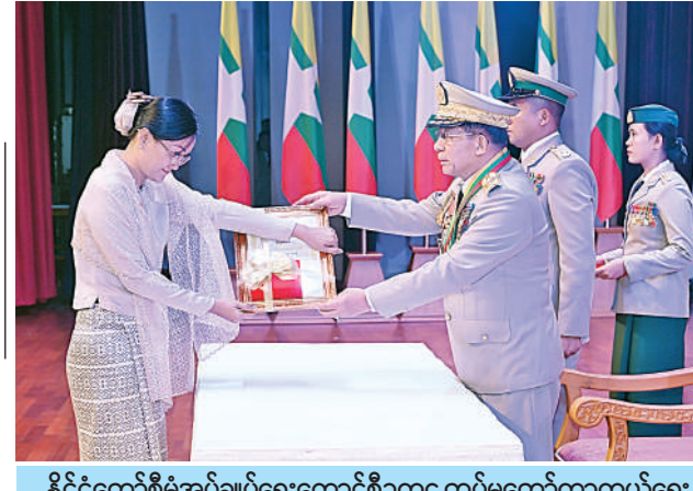
နိုင်ငံတော်စီမံအုပ်ချုပ်ရေးကောင်စီဥက္ကဋ္ဌ တပ်မတော်ကာကွယ်ရေး ဦးစီးချုပ် ဗိုလ်ချုပ်မှူးကြီး သတိုးမဟာသရေစည်သူ သတိုးသီရိသုဓမ္မ မင်းအောင်လှိုင် သူရဲကောင်းမှတ်တမ်းဝင်တံဆိပ်ရရှိသူ ကြည်း ၂၆၄၈ ဗိုလ်မှူးကြီးကျော်စံဦး၏ ဇနီး ဒေါ်ရွှန်းလွဲလွဲထွန်းအား ဆုတံဆိပ် ပေးအပ်ချီးမြှင့်စဉ်။