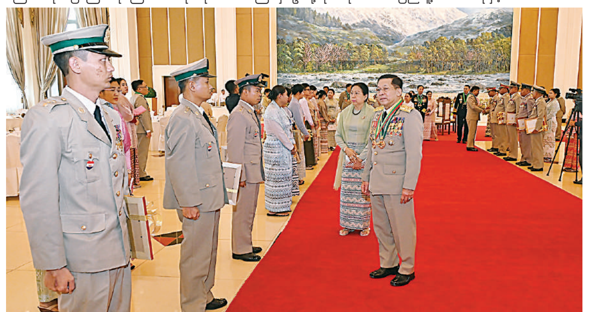
နိုင်ငံတော်စီမံအုပ်ချုပ်ရေးကောင်စီဥက္ကဋ္ဌ တပ်မတော်ကာကွယ်ရေးဦးစီးချုပ် ဗိုလ်ချုပ်မှူးကြီး သတိုးမဟာသရေစည်သူ သတိုးသီရိသုဓမ္မမင်းအောင်လှိုင်နှင့် ဇနီး ဒေါ်ကြူကြူလှတို့က တပ်မတော်စွမ်းရည်သတ္တိဆိုင်ရာ ဂုဏ်ထူးဆောင်တံဆိပ်များ ချီးမြှင့်ခံရသူများနှင့် အမွေခံများကို ရင်းရင်းနှီးနှီးနှုတ်ဆက်စဉ်။

ရောင်းဦးစီးချုပ်နှင့် အဖွဲ့ဝင်များသည် တပ်မတော်စွမ်းရည်သတ္တိဆိုင်ရာဂုဏ်ထူး ဆောင်တံဆိပ်များ ချီးမြှင့်ခံရသူများကို လက်ဖက်ရည်ပိုင်းဖြင့် တည်ခင်းဧည့်ခံခဲ့ ပြီး ကာကွယ်ရေးဦးစီးချုပ်မှူး(ကြည်း) ပြည်သူ့ဆက်ဆံရေးနှင့်စိတ်ဓာတ်စစ်ဆင် ရေးဦးစီးချုပ်နှင့် အဖွဲ့ဝင်များသည် တပ်မတော်စွမ်းရည်သတ္တိဆိုင်ရာ ဂုဏ်ထူးဆောင်တံဆိပ်များ ချီးမြှင့်ခံရသူများကို ရင်းရင်း နှီးနှီးနှုတ်ဆက်ခဲ့ကြကြောင်း သတင်းရရှိ သည်။ (၅၀၁)