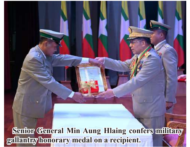
Senior General Min Aung Hlaing confers military gallantry honorary medal on a recipient.