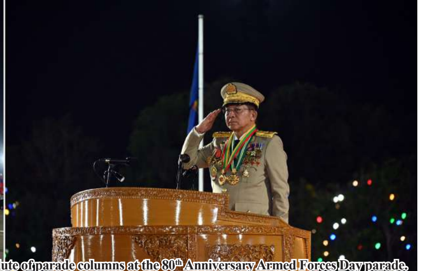
Senior General Thadoe Maha Thray Sithu Thadoe Thiri Thudhamma Min Aung Hlaing takes the salute of parade columns at the 80 th Anniversary Armed Forces Day parade.