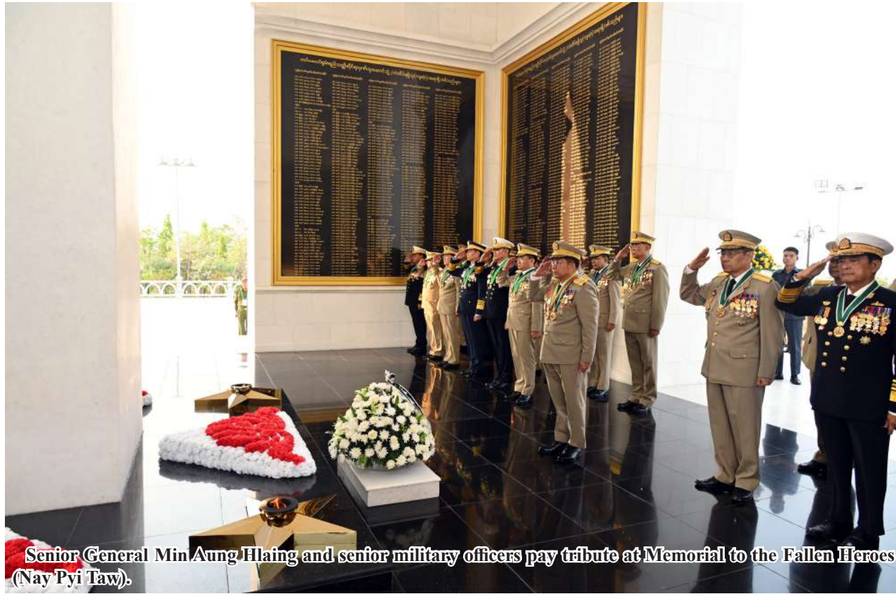
Senior General Min Aung Hlaing and senior military officers pay tribute at Memorial to the Fallen Heroes (Nay Pyi Taw).