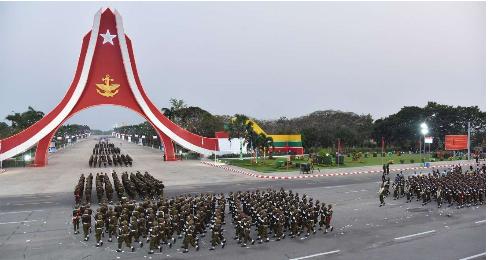
နှစ် ၈၀ ပြည့် တပ်မတော်နေ့စစ်ရေးပြကွင်းအတွင်းသို့ စစ်ရေးပြစစ်ကြောင်းကြီးများ ချီတက်နေရာယူစဉ်။

အတူ စစ်ရေးပြကွင်းအတွင်းသို့ အစီအစဉ် အတိုင်း ချီတက်ကြသည်။ ထိုသို့ချီတက်ချိန်တွင် နိုင်ငံတော်စီမံ အုပ်ချုပ်ရေးကောင်စီဥက္ကဋ္ဌ တပ်မတော် ကာကွယ်ရေးဦးစီးချုပ်၏ ဇနီးဒေါ်ကြူကြူလှ၊ ကောင်စီဒုတိယဥက္ကဋ္ဌ ဒုတိယတပ်မတော် ကာကွယ်ရေးဦးစီးချုပ် ကာကွယ်ရေးဦးစီးချုပ် (ကြည်း)၏ဇနီးဒေါ်သန်းသန်းနွယ်၊ ညှိနှိုင်း ကွပ်ကဲရေးမှူး (ကြည်း၊ ရေ၊ လေ)၏ ဇနီး၊ ကာကွယ်ရေးဦးစီးချုပ်(ရေ)၏ဇနီး၊ ကာကွယ် ရေးဦးစီးချုပ်(လေ)၏ဇနီး၊ ကာကွယ်ရေး ဦးစီးချုပ်ရုံးမှ တပ်မတော်အရာရှိကြီးများ၏ ဇနီးများက ဂုဏ်ပြုပန်းကုံးများစွပ်၍ ကြိုဆို ကြသည်။ အလားတူကာကွယ်ရေးဦးစီးချုပ် ရုံး(ကြည်း)မှ အရာရှိ စစ်သည်၊ မိသားစုများ၊ နေပြည်တော်တိုင်းစစ်ဌာနချုပ်နှင့် တပ်နယ် အသီးသီးတို့မှ အရာရှိ စစ်သည်၊ မိသားစု များ၊ မြန်မာနိုင်ငံရဲတပ်ဖွဲ့ဝင်များနှင့် မိသားစု များ၊ ဝန်ကြီးဌာနအသီးသီးမှ နိုင်ငံ့ဝန်ထမ်း များ၊ ရုပ်ရှင်ဂီတအနုပညာရှင်များ၊ ဒေသခံ မိဘပြည်သူများကလည်း စစ်ကြောင်း ကြီးများချီတက်ရာ လမ်းတစ်လျှောက် သောင်းသောင်းဖြူဖြူဆိုကာ ဂုဏ်ပြုပန်းကုံး များစွပ်၍ကြိုဆိုခဲ့ကြပြီး စစ်ကြောင်းကြီးများ