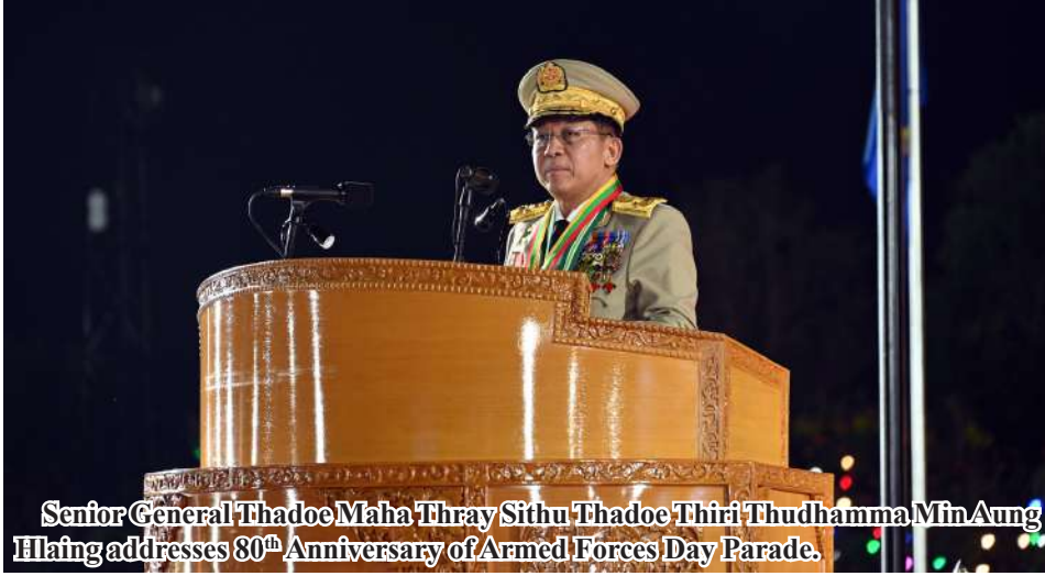
Senior General Thadoe Maha Thray Sithu Thadoe Thiri Thudhamma Min Aung Hlaing addresses 80 th Anniversary of Armed Forces Day Parade.