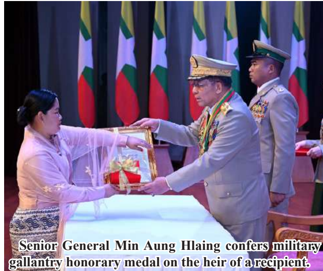
Senior General Min Aung Hlaing confers military gallantry honorary medal on the heir of a recipient.