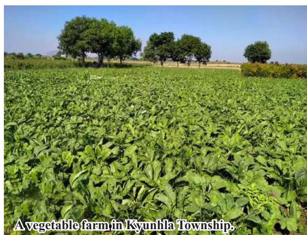
A vegetable farm in Kyunhla Township.

Township but farmers have so far planted 561 acres of crops. They grow mustard, chilli, spicy, potato, cabbage, eggplant, ladyfinger, cauliflowers and Chinese cabbage as well as cannabis. We share agricultural techniques with local farmers to grow crops in GAP system. Only when they grow crops in GAPs will vegetables be healthy for public consumption with least chemical residue."