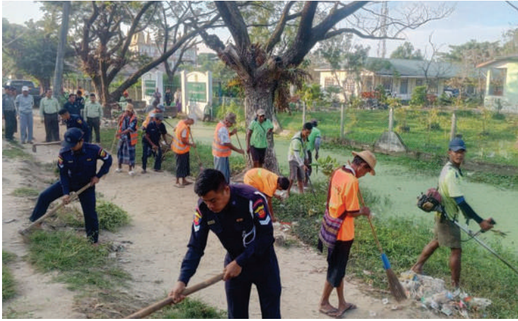
ရန်ကုန်တိုင်းဒေသကြီး၌ မြန်မာနိုင်ငံမီးသတ်တပ်ဖွဲ့ဝင်များ၊ ဌာနဆိုင်ရာဝန်ထမ်းများနှင့် လူမှုရေးအသင်းအဖွဲ့များက စုပေါင်းသန့်ရှင်းရေးဆောင်ရွက်ပေးစဉ်။

နေပြည်တော် ဒီဇင်ဘာ ၁၄ ၂၀၂၄-၂၀၂၅ ပညာသင်နှစ်တွင် တက်ရောက်ပညာသင်ကြားလျက်ရှိသည့် ကျောင်းသား၊ ကျောင်းသူများ အဆင်ပြေ