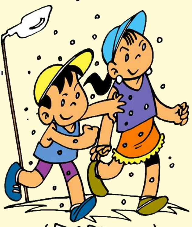
ကန်မြ ချစ်မင်းေဝ