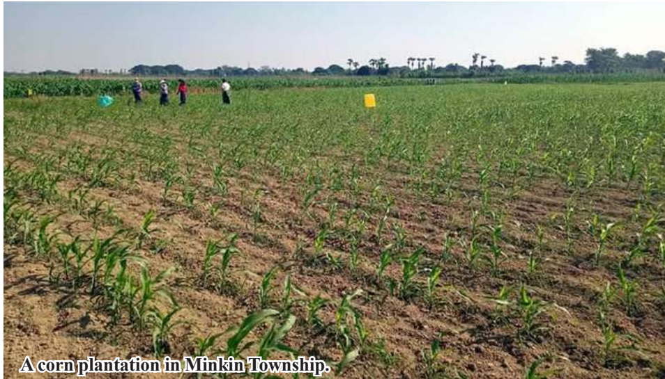
A corn plantation in Minkin Township.

Minkin December 14 In Minkin Township, Kale District, Sagaing Region, 4,437 acres of corn crops, including seed-producing corn and edible corn, have been cultivated during this year's winter crop season, according to records from the Minkin Township Department of Agriculture. For the 2024-2025 winter