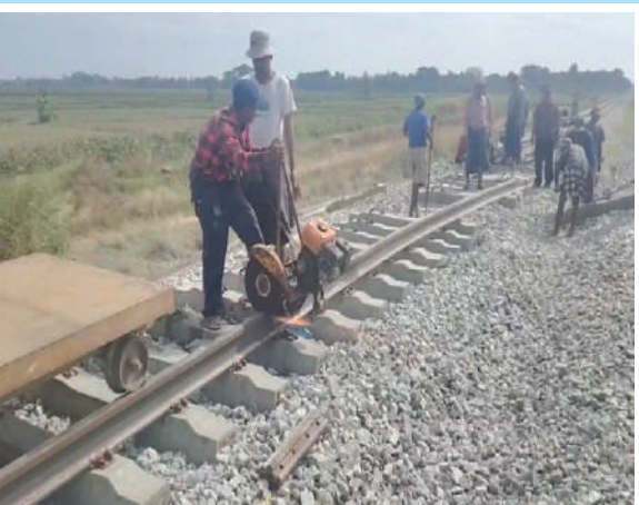
ရန်ကုန်-မန္တလေး ရထားလမ်းပိုင်းအတွင်း တော်ဝိဘူတာနှင့် ပိန်းလုပ် ဘူတာကြား မိုင်းပေါက်ကွဲမှုကြောင့် ပျက်စီးသွားသည့် အစုန်ရထားလမ်းအား ဝန်ထမ်းများက ပြန်လည်ပြုပြင်နေမှုကို တွေ့ရစဉ်။