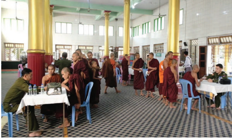
သံဃာတော်များအား အလယ်ပိုင်းတိုင်းစစ်ဌာနချုပ် နယ်လှည့်ဆေးကုသရေး အဖွဲ့က ကျန်းမာရေးစောင့်ရှောက်မှုလုပ်ငန်းများ ဆောင်ရွက်ပေးစဉ်။

နေပြည်တော် ဒီဇင်ဘာ ၁၄ တိုင်းဒေသကြီးနှင့် ပြည်နယ်များ အတွင်းရှိ သံဃာတော်များ၊ သာသနာ့ နွယ်ဝင်သီလရှင်များနှင့် ဒေသခံပြည်သူ များကို သက်ဆိုင်ရာတိုင်းစစ်ဌာနချုပ် အသီးသီးမှ နယ်လှည့်ဆေးကုသရေးအဖွဲ့ များက လိုအပ်သည့်ကျန်းမာရေးစောင့် ရှောက်မှုလုပ်ငန်းများ ဆောင်ရွက်ပေး လျက်ရှိရာ ယနေ့တွင် ရန်ကုန်တိုင်းစစ် ဌာနချုပ် နယ်လှည့်ဆေးကုသရေးအဖွဲ့