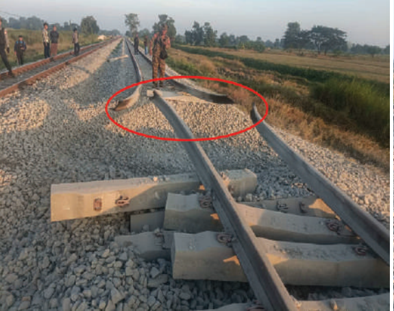
ရန်ကုန်-မန္တလေး ရထားလမ်းပိုင်းအတွင်း တော်ဝိဘူတာနှင့် ပိန်းလုပ် ဘူတာကြား အစုန်ရထားလမ်းပေါ်၌ အကြမ်းဖက်သောင်းကျန်းသူအဖွဲ့က မိုင်းထောင်ဖောက်ခွဲမှုကြောင့် ပျက်စီးနေမှုကို တွေ့ရစဉ်။

အကြမ်းဖက်သောင်းကျန်းသူအဖွဲ့များအနေဖြင့် ၂၀၂၁ ခုနှစ် ဖေဖော်ဝါရီလမှစ၍ ယခုအချိန်ထိ မြန်မာ့မီးရထားလမ်းကွန်ရက်တစ်ခုလုံးတွင် ရထားလမ်းနှင့် ရထားဘူတာနယ်မြေအတွင်း ဗုံးထောင်မိုင်းခွဲ၊ ဖျက်ဆီးခြင်း ၇၉ ကြိမ်၊ ရထားတံတား၊ သံလမ်းများကို မိုင်းခွဲဖျက်ဆီးခြင်း ၁၇၄ ကြိမ်၊ ဘူတာအဆောက်အအုံနှင့်ဝန်ထမ်းနေအိမ်များကို မီးရှို့ဖျက်ဆီးခြင်း ၁၆ ကြိမ် ကျူးလွန်ခဲ့ကြသည်။