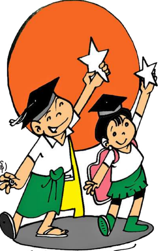
ရဲသွေးနီ