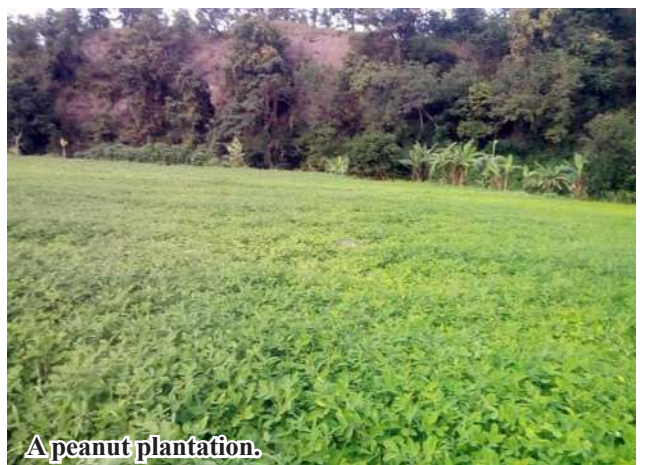
A peanut plantation.