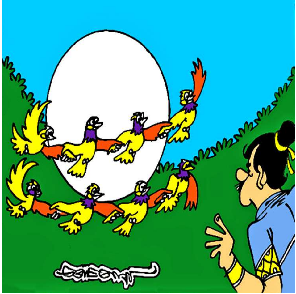
အဲဒီလိုနဲ့ ငှက်ကလေးတွေကလဲ အစား အသောက် စားချိန်တန်တဲ့အခါ ယာခင်းထဲရောက် လာပြီး ထုံးစံအတိုင်း ကောက်ပဲသီးနှံတွေကို ပျံနေချိန်၊ မပျံဘဲကြောက်လန့်ပြီး ငြိမ်နေတဲ့ ငှက်ကလေးတွေဟာ ကြောက်အားလန့်အားနဲ့ ထပ်ပြီးပျံကြတော့သတဲ့။ ဒါပေမဲ့လဲ ပျံတဲ့ငှက်က ပျံနေချိန်၊ မပျံဘဲကြောက်လန့်ပြီး ငြိမ်နေတဲ့