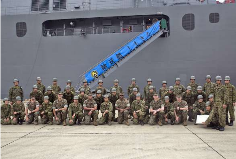
အုပ်ချုပ်ထောက်ပံ့မှု

ပို့ဆောင်ရေးလေယာဉ် အစင်း ၃၀ ခန့်သာရှိသည်။ ထို့ပြင် ကိုယ်ပိုင်မရိန်းတပ်ဖွဲ့သည်လည်း ကုန်းရေနှစ်သွယ်စစ်ဆင်ရေးအတွက် များစွာအသုံးတည့်သော တင့်ကားများရွှေ့ပြောင်းနိုင်သည့် တင့်ကားတင်ကမ်းထိုးစစ်ရေးယာဉ် (LST) သုံးစီးသာ ပိုင်ဆိုင်ထားရှိသည်။ လက်ရှိ ကမ်းထိုးစစ်ရေးယာဉ်များသည် ARDB အတွက် လေ့ကျင့်မှုနှင့် စစ်မက်ဖြစ်ပွားချိန်တွင် ပေါင်းစပ်တာဝန်ထမ်းဆောင်နိုင်ရန် လိုအပ်ချက်ရှိနေဆဲပင်ဖြစ်သည်။ ၎င်းအရေးအတွက်သည် အရေးပေါ်လေကြောင်းချိန်နှင့် ကုန်းရေနှစ်သွယ်စစ်ဆင်ရေးများ၏လိုအပ်ချက်များ၊ ဂျပန်နိုင်ငံ၏ဝေးကွာသော ကျွန်းစုများကိုကျူးကျော်လာပါက အရေးပေါ်တပ်ဖြန့်ချိထားနိုင်ရန် လိုအပ်ချက်ရှိနေဆဲပင်ဖြစ်သည်။