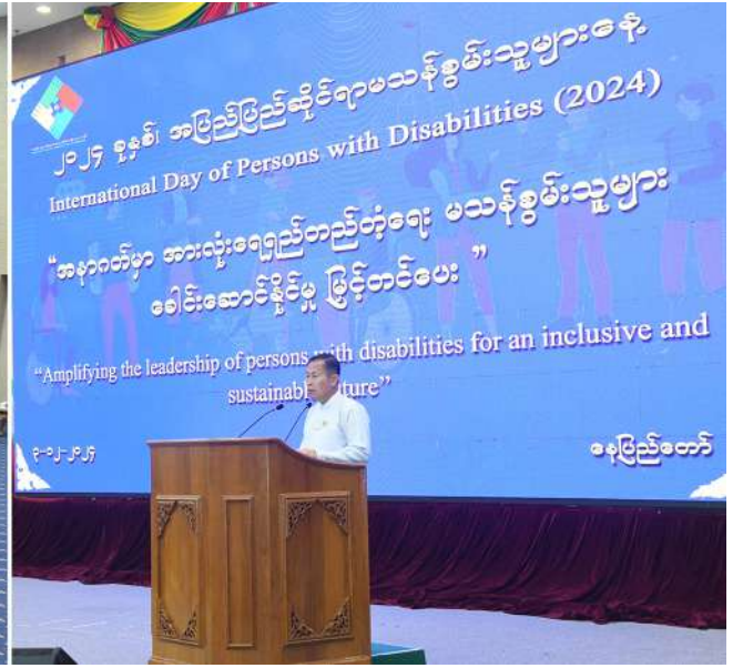
မသန်စွမ်းသူများ၏အခွင့်အရေးများဆိုင်ရာအမျိုးသားကော်မတီဥက္ကဋ္ဌ နိုင်ငံတော်စီမံအုပ်ချုပ်ရေးကောင်စီဒုတိယဥက္ကဋ္ဌ ဒုတိယဝန်ကြီးချုပ် ဒုတိယဗိုလ်ချုပ်မှူးကြီးစိုးဝင်း ၂၀၂၄ ခုနှစ် အပြည်ပြည်ဆိုင်ရာမသန်စွမ်းသူများနေ့အထိမ်းအမှတ်အခမ်းအနားတွင် အမှာစကားပြောကြားစဉ်။