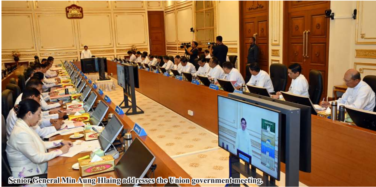
Senior General Min Aung Hlaing addresses the Union government meeting.