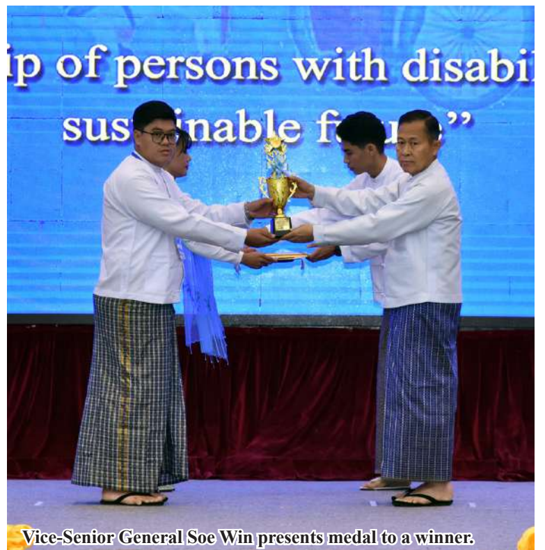
Vice-Senior General Soe Win presents medal to a winner.

In addition, people with disabilities are disproportionately impacted by natural disasters compared to the general population. As a result, it is crucial to address the specific needs of people with