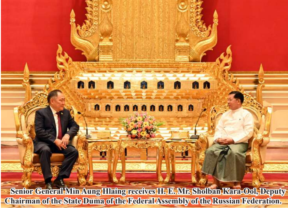
Senior General Min Aung Hlaing receives H. E. Mr. Sholban Kara-Ool, Deputy Chairman of the State Duma of the Russian Federation.

Nay Pyi Taw December 3 Chairman of the State Administration Council Prime Minister Senior General Min Aung Hlaing received a delegation led by H. E. Mr.