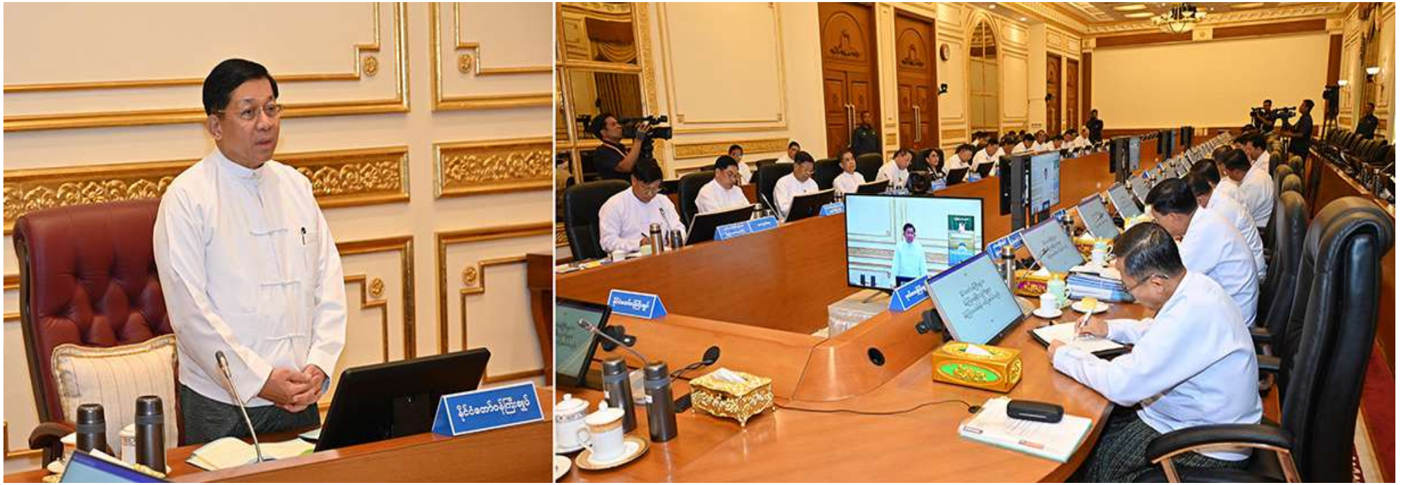
နိုင်ငံတော်စီမံအုပ်ချုပ်ရေးကောင်စီဥက္ကဋ္ဌ နိုင်ငံတော်ဝန်ကြီးချုပ် ဗိုလ်ချုပ်မှူးကြီးမင်းအောင်လှိုင် ပြည်ထောင်စုအစိုးရအဖွဲ့အစည်းအဝေးတွင် အမှာစကားပြောကြားစဉ်။