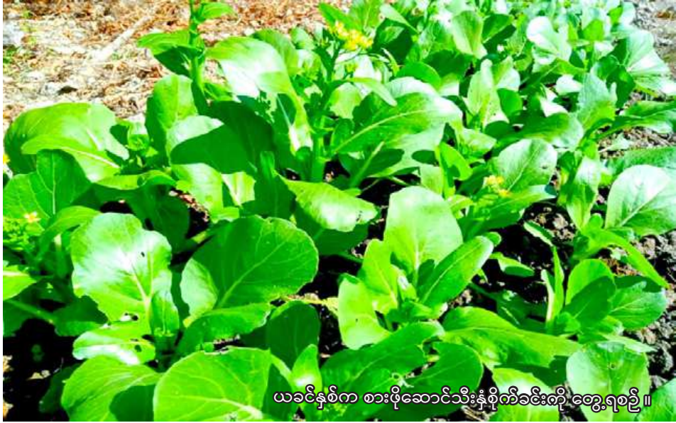
ယခင်နှစ်က စားဖိုဆောင်သီးနှံစိုက်ခင်းတို့ တွေ့ရစဉ်။