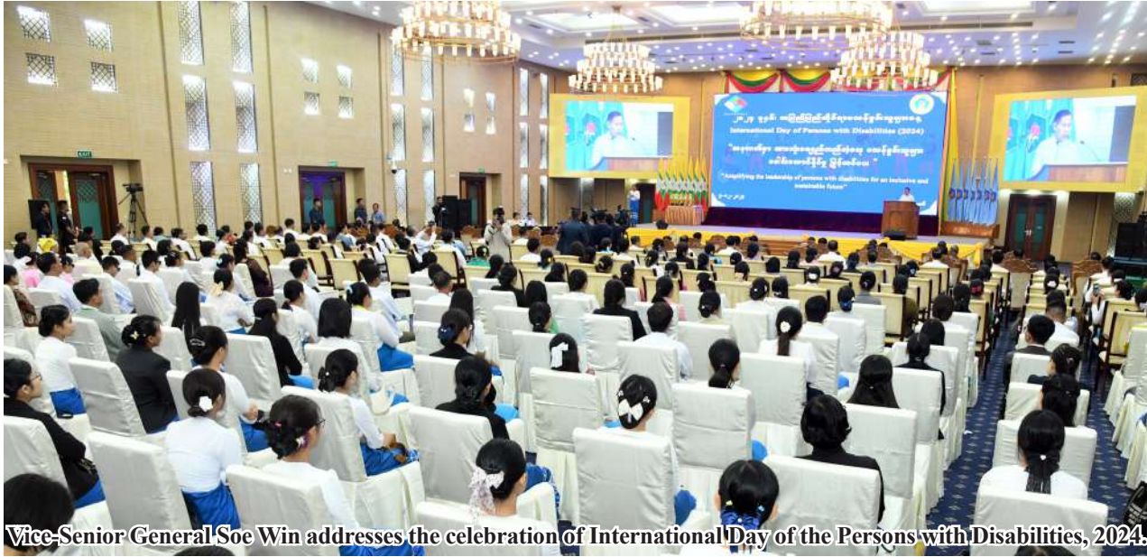
Vice-Senior General Soe Win addresses the celebration of International Day of the Persons with Disabilities, 2024.