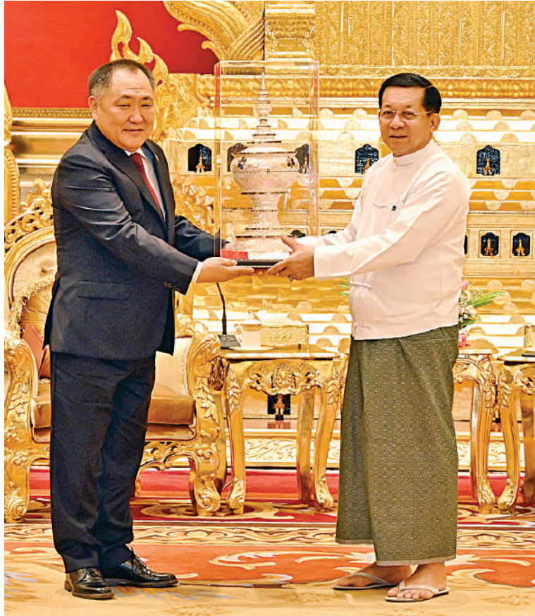
နိုင်ငံတော်စီမံအုပ်ချုပ်ရေးကောင်စီဥက္ကဋ္ဌ နိုင်ငံတော်ဝန်ကြီးချုပ် ဗိုလ်ချုပ်မှူးကြီး မင်းအောင်လှိုင်နှင့် ရှာဖွေဖက်ဒရေးရှင်းနိုင်ငံ ဒူးမားလွတ်တော်ဒုတိယဥက္ကဋ္ဌ H.E. Mr. Sholban Kara-Ool တို့ အမှတ်တရလက်ဆောင်ပစ္စည်းများအပြန်အလှန်ပေးအပ်စဉ်။

ရှေ့မှအဆက် ရင်းနှီးသည့်ဆက်ဆံမှုများရှိခဲ့ပြီး ယခုအခါ ချစ်ကြည်ရင်းနှီးမှုနှင့် ပူးပေါင်းဆောင်ရွက်မှုများ ပိုမိုတိုးတက်ကောင်းမွန်လျက်ရှိမှု အခြေအနေများ၊ နှစ်နိုင်ငံအဆင့်မြင့်အရာရှိ