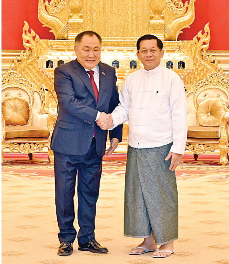
နိုင်ငံတော်စီမံအုပ်ချုပ်ရေးကောင်စီဥက္ကဋ္ဌ နိုင်ငံတော်ဝန်ကြီးချုပ် ဗိုလ်ချုပ်မှူးကြီး မင်းအောင်လှိုင် ရှာဖွေဖက်ဒရေးရှင်းနိုင်ငံ ဒူးမားလွတ်တော်ဒုတိယဥက္ကဋ္ဌ H.E. Mr. Sholban Kara-Ool ကို ရင်းရင်းနှီးနှီးနှုတ်ဆက်စဉ်။