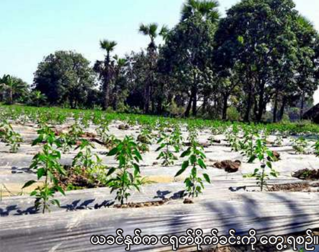
ယခင်နှစ်ထာ ရေစိုက်စိုက်ခင်းကို တွေ့ရစဉ်။