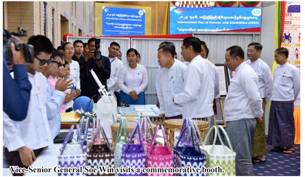
Vice-Senior General Soe Win visits a commemorative booth.

Strength," while children with disabilities from School the Deaf Children (Yangon) performed a dance to the song "Yay Ohh Yane." Then, the Vice-Senior General presented awards and cash prizes to those who performed. Later, the Vice-Senior General posed for a group photo with the attendees of the ceremony and toured the display of books, handicrafts, and commemorative photo galleries related to people with disabilities. 100