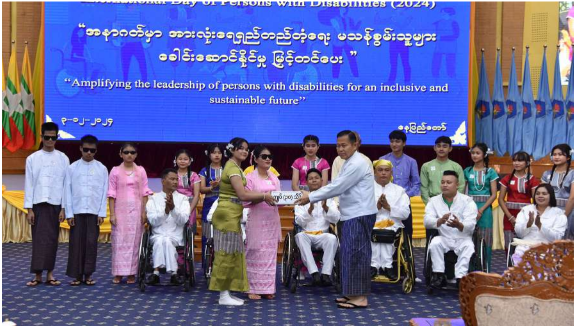
မသန်စွမ်းသူများ၏အခွင့်အရေးများဆိုင်ရာအမျိုးသားကော်မတီဥက္ကဋ္ဌ နိုင်ငံတော်စီမံအုပ်ချုပ်ရေးကောင်စီ ဒုတိယဥက္ကဋ္ဌ ဒုတိယဝန်ကြီးချုပ် ဒုတိယဗိုလ်ချုပ်မှူးကြီးစိုးဝင်း သီဆိုကပြဖျော်ဖြေခဲ့ကြသူများကို ဂုဏ်ပြုချီးမြှင့်ငွေများပေးအပ်စဉ်။

ထို့ပြင် သဘာဝဘေးအန္တရာယ်ရင်ဆိုင် ကြုံတွေ့ကြရာတွင်လည်း မသန်စွမ်းသူ များအနေဖြင့် အများတကာများထက် ပိုမိုထိခိုက်ခံစားရကြောင်း၊ ထို့ကြောင့်