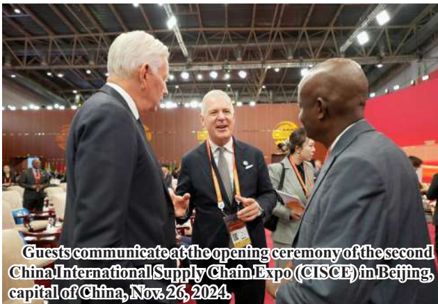
Guests communicate at the opening ceremony of the second China International Supply Chain Expo (CISCE) in Beijing, capital of China, Nov. 26, 2024.

Beijing December 3 In the global marketplace, two opposing forces are at odds: one determined to disrupt supply chains, and the other focused on