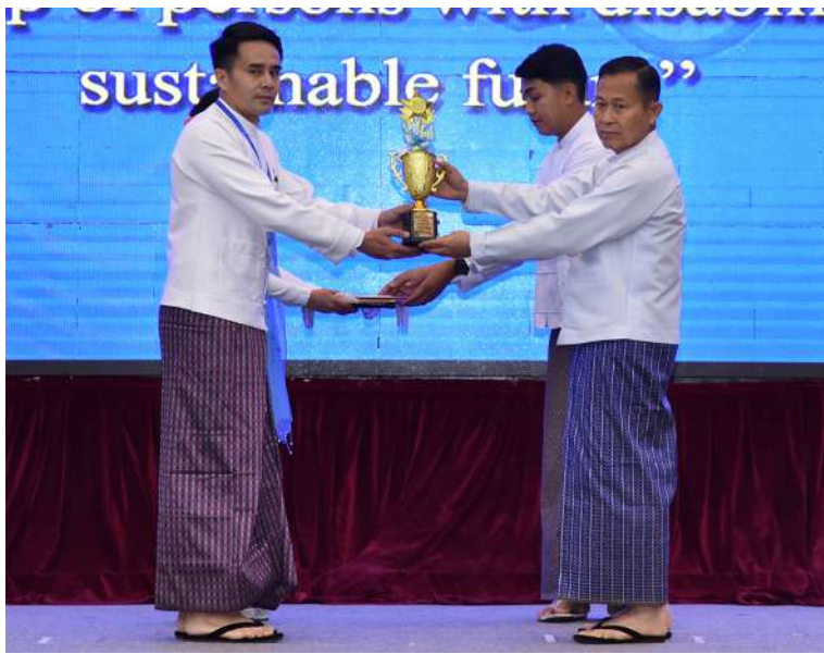
မသန်စွမ်းသူများ၏အခွင့်အရေးများဆိုင်ရာ အမျိုးသားကော်မတီဥက္ကဋ္ဌ နိုင်ငံတော်စီမံအုပ်ချုပ်ရေးကောင်စီဒုတိယဥက္ကဋ္ဌ ဒုတိယဝန်ကြီးချုပ် ဒုတိယဗိုလ်ချုပ်မှူးကြီးစိုးဝင်း အပြည်ပြည်ဆိုင်ရာ မသန်စွမ်းသူများနေ့အထိမ်းအမှတ် အလွတ်တန်းဆောင်းပါးပြိုင်ပွဲတွင် ဆုရရှိသူတစ်ဦးကို ဂုဏ်ပြုဆုတံဆိပ်၊ ဂုဏ်ပြုမှတ်တမ်းလွှာနှင့် ဂုဏ်ပြုဆုငွေများ ပေးအပ်ချီးမြှင့်စဉ်။

အမျိုးအစား ကြီးကြီးမားမားရှိနေသည်ကို တွေ့ရမည်ဖြစ်ကြောင်း။ မသန်စွမ်းသူများ၏ဘဝတွင် ရင်ဆိုင်ကြုံတွေ့ရသည့် အခက်အခဲအတားအဆီးများ၊ တန်းတူညီမျှရပိုင်ခွင့်များ၊ ပူးပေါင်းဆောင်ရွက်မှု စသည့်စီမံခန့်ခွဲမှုများကို လူသားအားလုံးက လက်တွေ့ကျအောင် ဖြေရှင်းဆောင်ရွက်ပေးကြရန်လိုကြောင်း၊ လူလူချင်းတူသော်လည်း ဘဝကံကြမ္မာ အကျိုးပေးကြောင့် ရုပ်ပိုင်းဆိုင်ရာ၊ စိတ်ပိုင်းဆိုင်ရာ ချို့ယွင်းအားနည်းနေသူများကို စာနာထောက်ထားဖေးမကူညီပြီး မသန်သော်လည်း စွမ်းဆောင်ရည်ပြည့်ဝသည့်