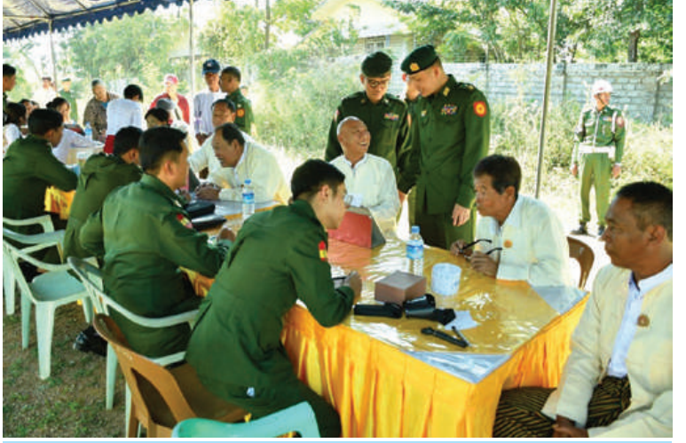
အရှေ့ပိုင်းတိုင်းစစ်ဌာနချုပ် တိုင်းမှူး ဗိုလ်ချုပ်ဇော်မင်းလတ် စစ်မှုထမ်းဟောင်းအဖွဲ့ဝင်များနှင့် မိသားစုဝင်များအား ကျန်းမာရေးစောင့်ရှောက်ပေးနေမှုကို ကြည့်ရှုအားပေးစဉ်။

တည်တံ့ရေးမသန်စွမ်းသူများ ခေါင်းဆောင် နိုင်ငံ့မြှင့်တင်ပေး”နှင့်အညီ မသန်စွမ်းသူများ၏ ဘဝအခြေအနေမြှင့်တင်တိုးတက်စေရေး၊ နောက်ကျမကျန်ရစ်စေရေးအတွက် အားလုံးပိုင်းဝန်းဆောင်ရွက်ကြရမည်ဖြစ်ပြီး မသန်စွမ်းသူများကိုယ်တိုင် ပူးပေါင်း ပါဝင်ဆောင်ရွက်နေမှုကိုလည်း အသိအမှတ်ပြုပါကြောင်းဖြင့် ပြောကြားခဲ့သည်။ ဆက်လက်၍ တိုင်းဒေသကြီးဝန်ကြီးချုပ်၊ တိုင်းဒေသကြီးတရားလွှတ်တော်တရားသူကြီးချုပ်၊ တိုင်းဒေသကြီးဝန်ကြီးများနှင့် တာဝန်ရှိသူများက အပြည်ပြည်ဆိုင်ရာ မသန်စွမ်းသူများနေ့ အထိမ်းအမှတ်အကြိုလှူပွဲများပြုလုပ်ခဲ့ကြောင်း တွင် အမြင်အာရုံမသန်စွမ်းပိုးဘောလ်ပြိုင်ပွဲနှင့် အမျိုးသမီးမိတာ ၁၀၀ အပြေးပြိုင်ပွဲ၊ ကိုယ်အင်္ဂါမသန်စွမ်းစစ်တုရင်ပြိုင်ပွဲ၊ ဝိုးချစ်တာ ၅၀ ပြိုင်ပွဲ၊ ညာဏ်ရည်မသန်စွမ်း အမျိုးသား၊ အမျိုးသမီး မိတာ ၅၀ လမ်းလျှောက်ပြိုင်ပွဲ၊ အကြားအာရုံမသန်စွမ်း အမျိုးသား၊ အမျိုးသမီး မိတာ ၁၀၀ အပြေးပြိုင်ပွဲများတွင် ပထမ၊ ဒုတိယ၊ တတိယဆု ရရှိသူများအား ဆုတံဆိပ်များနှင့် ဂုဏ်ပြုငွေများကိုချီးမြှင့်ခဲ့ကြောင်းနှင့် ၂၀၂၄ ခုနှစ် အပြည်ပြည်ဆိုင်ရာမသန်စွမ်းသူများနေ့ အထိမ်းအမှတ်ဂုဏ်ပြုသဘော Video Clip အား ကြည့်ရှုအားပေးခဲ့ကြောင်း သတင်းရရှိသည်။ မျိုးကျော်