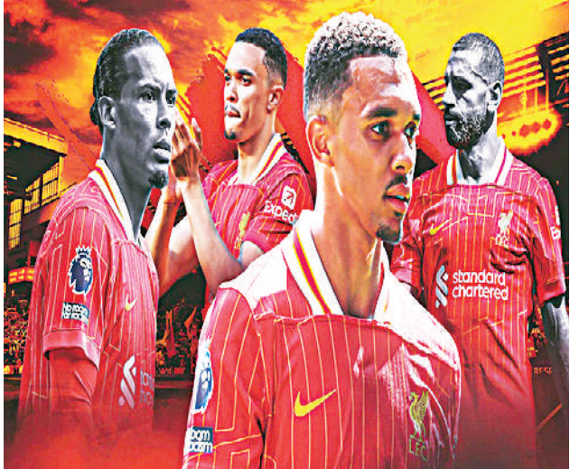
Ref : B/R Football Trs : STA

လက်လွှတ်ရန် နီးစပ်လျက်ရှိနေသည်။ အလားတူ စပါးအသင်းသည်လည်း အသင်းခေါင်းဆောင် ဆွန်ဟောင်မင်နှင့် ယခုနှစ်ဘောလုံးရာသီအကုန်တွင် စာချုပ်သက်တမ်း ကုန်ဆုံးမည့်ဖြစ်သော်လည်း လက်ရှိအချိန်ထိ သက်တမ်းတိုးစာချုပ် ချုပ်ဆိုနိုင်ခြင်းမရှိသေးဘဲ ဆက်လက်ဆွေးနွေးမှုများ လုပ်ဆောင်လျက် ရှိနေကြောင်း သိရသည်။ ယခုနှစ်ဘောလုံးရာသီအကုန်တွင် စာချုပ်သက်တမ်းကုန်ဆုံးမည့် ထိပ်တန်းကစားသမားများမှ သက်ဆိုင်ရာ ကလပ်အသင်းများနှင့် လမ်းခွဲရန် ရေပန်းအစားဆုံးစာရင်းတွင် လီဗာပူးအသင်းမှ ဆာလာဟ်က ထိပ်ဆုံးမှရပ်တည်နေကြောင်း သိရသည်။