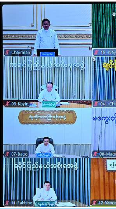
ပြည်ထောင်စုအစိုးရအဖွဲ့ အစည်းအဝေးသို့ နေပြည်တော်ကောင်စီဥက္ကဋ္ဌနှင့် တိုင်းဒေသကြီးနှင့် ပြည်နယ်ဝန်ကြီးချုပ်များက Video Conferencing ဖြင့် တက်ရောက်စဉ်။

အလုပ်သမားရှားပါးမှု ပြဿနာနှင့် ပတ်သက်၍ အချို့လုပ်ငန်းရှင်များ၏တင်ပြ ချက်များအရသိရှိရကြောင်း၊ မိမိတို့နိုင်ငံ၏ လူဦးရေ ၇၀ ရာခိုင်နှုန်းခန့်သည် ကျေးလက် ဒေသများ၌ နေထိုင်ကြပြီး ၅၀ ရာခိုင်နှုန်းခန့် သည် ပညာအရည်အချင်းအားနည်းကြ ကြောင်း၊ ၄၁ ရာခိုင်နှုန်းခန့်သည် လယ်ယာ သစ်တောသားငါးကဏ္ဍတွင် လုပ်ကိုင်ကြသူ များဖြစ်သဖြင့် မိမိတို့အနေဖြင့် လယ်ယာ စိုက်ပျိုးရေးကိုအခြေခံသည့် ကုန်ထုတ်လုပ်မှု မှ အလုပ်အကိုင်များဖော်ဆောင်ပေးနိုင်ရေး လက်ရှိအခြေအနေ၌ မဖြစ်မနေလိုအပ်လျက် ရှိကြောင်း၊ လူဦးရေသန်းပေါင်းများစွာရှိသည့် နိုင်ငံများအနေဖြင့် ပြည်ပသို့သွားရောက် အလုပ်လုပ်ကိုင်ကြသည့်ပမာဏမှာ မသိသာ သော်လည်း မိမိတို့ကဲ့သို့ လူဦးရေနည်းပါး သော နိုင်ငံအတွက်မူလျော့သွားသည်မှာ သိသာကြောင်း၊ အလုပ်လုပ်ကိုင်မည့် စွမ်းအားများ လျော့နည်းသွားသည်ဖြစ် သဖြင့် ထိုကိစ္စနှင့်ပတ်သက်၍ အလုပ်အကိုင်နှင့် လုပ်ခလစာများရရှိရေးကို ဆောင်ရွက်ပေး စေလိုကြောင်း၊ ထို့ကြောင့် တိုင်းဒေသကြီးနှင့် ပြည်နယ်များအလိုက် အနေဖြင့်လည်း အလုပ်အကိုင်အခွင့်အလမ်းများ ဖော်ဆောင် ပေးနိုင်ရန်လိုကြောင်း၊ သို့မှသာ ဒေသ၏ ဖွံ့ဖြိုးတိုးတက်မှုကို ဖော်ဆောင်ပေးနိုင်မည် ဖြစ်ကြောင်း၊ ကုန်ထုတ်လုပ်မှုစွမ်းအားများ မြင့်တက်လာပြီး Supply နှင့် Demand