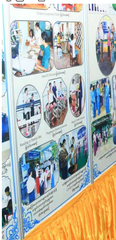
မသန်စွမ်းသူများ၏အခွင့်အရေးများဆိုင်ရာအမျိုးသားကော်မတီဥက္ကဋ္ဌ နိုင်ငံတော်စီမံအုပ်ချုပ်ရေးကောင်စီ ဒုတိယဥက္ကဋ္ဌ ဒုတိယဝန်ကြီးချုပ် ဒုတိယဗိုလ်ချုပ်မှူးကြီးစိုးဝင်း ခင်းကျင်းပြသထားသည့် မသန်စွမ်းသူများနှင့်သက်ဆိုင်သော အထိမ်းအမှတ် ဓာတ်ပုံပြခန်းများကို ကြည့်ရှုစဉ်။

ဖြင့် မသန်စွမ်းသူများ၏အခွင့်အရေးကို မသန်စွမ်းသူများနှင့်အတူ ကူညီဆောင် ရွက်ပေးကြရန် တိုက်တွန်းလိုကြောင်းဖြင့် ပြောကြားသည်။