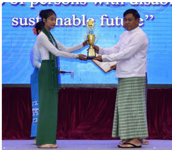
နိုင်ငံတော်စီမံအုပ်ချုပ်ရေးကောင်စီအဖွဲ့ဝင် ဗိုလ်ချုပ်ကြီး တင်အောင်စန်း အခြေခံပညာအထက်တန်းအဆင့် စာစီစာကုံး ပြိုင်ပွဲတွင် ဆုရရှိသူတစ်ဦးကို ဂုဏ်ပြုဆုနှင့် ဂုဏ်ပြုမှတ်တမ်းလွှာ ပေးအပ်စဉ်။

နှစ်ဦးသည် ကျောင်းမတက်ကြဘဲ ၃၆ ရာခိုင်နှုန်းခန့်သာ စာရေးစာဖတ်နိုင်ကြောင်း သိရကြောင်း၊ ထို့ကြောင့် အနာဂတ်တွင် မသန်စွမ်းသူများအတွက် ပညာရေးကို ပိုမိုအလေးထားဆောင်ရွက်သွားကြရမည်ဖြစ်ကြောင်း၊ မသန်စွမ်းသူများအနေဖြင့် အခြေခံပညာကျောင်းများတွင် တက်ရောက်နိုင်ရန် ဆောင်ရွက်ပေးခြင်း၊ အသက်မွေးဝမ်းကျောင်း သင်တန်းများ တက်ရောက်နိုင်ရန် ဆောင်ရွက်ပေးခြင်း၊ မသန်စွမ်းသူများအပေါ် ခွဲခြားမှုမရှိသော သင်ရိုးညွှန်းတမ်းနှင့် အလေ့အကျင့်များ ကျင့်သုံးခြင်း၊ အထူးပညာရေး ဆရာ၊