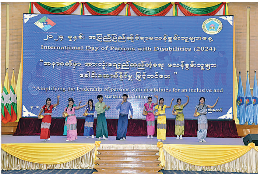
မသန်စွမ်းသူများ၏ အခွင့်အရေးများဆိုင်ရာအမျိုးသားကော်မတီဥက္ကဋ္ဌ နိုင်ငံတော်စီမံအုပ်ချုပ်ရေးကောင်စီ ဒုတိယဥက္ကဋ္ဌ ဒုတိယဝန်ကြီးချုပ် ဒုတိယဗိုလ်ချုပ်မှူးကြီးစိုးဝင်း ၂၀၂၄ ခုနှစ် အပြည်ပြည်ဆိုင်ရာ မသန်စွမ်းသူများနေ့အထိမ်းအမှတ်အခမ်းအနားတွင် မသန်စွမ်းကလေးများ၏ ကပြဖျော်ဖြေတင်ဆက်မှုများကို ကြည့်ရှုအားပေးစဉ်။

နေပြည်တော် ဒီဇင်ဘာ ၃ ၂၀၂၄ ခုနှစ် အပြည်ပြည်ဆိုင်ရာ မသန်စွမ်းသူများနေ့အထိမ်းအမှတ်အခမ်းအနားကို ယနေ့နံနက်ပိုင်းတွင် နေပြည်တော်ရှိ မြန်မာအပြည်ပြည်ဆိုင်ရာကွန်ဗင်းရှင်းဗဟိုဌာန-၂(MICC-II)၌ကျင်းပရာ မသန်စွမ်းသူများ၏ အခွင့်အရေးများဆိုင်ရာ အမျိုးသားကော်မတီဥက္ကဋ္ဌ နိုင်ငံတော်စီမံအုပ်ချုပ်ရေးကောင်စီ ဒုတိယဥက္ကဋ္ဌ ဒုတိယဝန်ကြီးချုပ် ဒုတိယဗိုလ်ချုပ်မှူးကြီးစိုးဝင်း တက်ရောက်အမှာစကားပြောကြားသည်။ အခမ်းအနားသို့ နိုင်ငံတော်စီမံအုပ်ချုပ်ရေးလုပ်ငန်းကော်မတီဝင်များ၊ နိုင်ငံတကာအဖွဲ့အစည်းများမှ ကိုယ်စားလှယ်များ၊ မြန်မာနိုင်ငံမသန်စွမ်းသူများအသင်းချုပ်မှ တာဝန်ရှိသူများ၊ မသန်စွမ်းသူများ၊ ဖိတ်ကြားထားသူများနှင့် တာဝန်ရှိသူများ တက်ရောက်ကြသည်။