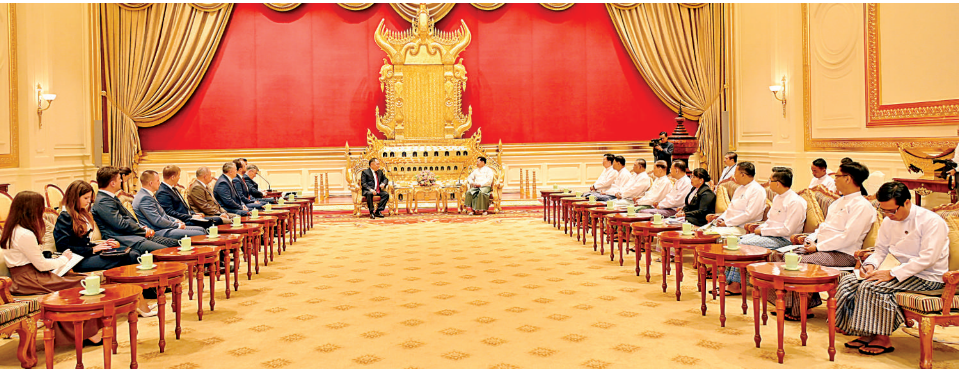
နိုင်ငံတော်စီမံအုပ်ချုပ်ရေးကောင်စီဥက္ကဋ္ဌ နိုင်ငံတော်ဝန်ကြီးချုပ် ဗိုလ်ချုပ်မှူးကြီးမင်းအောင်လှိုင်ထံ ရုရှားဖက်ဒရေးရှင်းနိုင်ငံ ဒူးမားလွတ်တော်ဒုတိယဥက္ကဋ္ဌ H.E. Mr.Sholban Kara-Ool ဦးဆောင်သည့် ကိုယ်စားလှယ်အဖွဲ့က လာရောက်ဂါရဝပြုတွေ့ဆုံစဉ်။