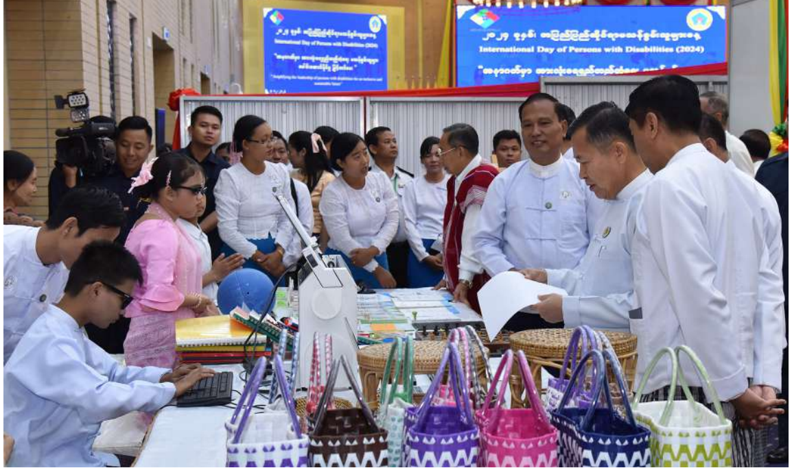
မသန်စွမ်းသူများ၏အခွင့်အရေးများဆိုင်ရာအမျိုးသားကော်မတီဥက္ကဋ္ဌ နိုင်ငံတော်စီမံအုပ်ချုပ်ရေးကောင်စီဒုတိယဥက္ကဋ္ဌ ဒုတိယဝန်ကြီးချုပ် ဒုတိယဗိုလ်ချုပ်မှူးကြီးစိုးဝင်း ခင်းကျင်းပြသထားသည့် မသန်စွမ်းသူများ၏ လက်မှုထုတ်ကုန်ပစ္စည်းများကို ကြည့်ရှုစဉ်။

ထို့နောက် မသန်စွမ်းသူများ၏အခွင့် အရေးများဆိုင်ရာ အမျိုးသားကော်မတီ ဥက္ကဋ္ဌ နိုင်ငံတော်စီမံအုပ်ချုပ်ရေးကောင်စီ ဒုတိယဥက္ကဋ္ဌ ဒုတိယဝန်ကြီးချုပ် ဒုတိယ