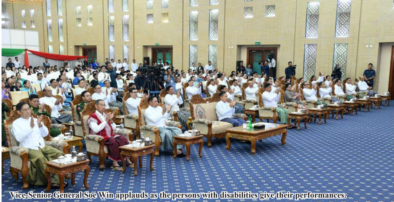
Vice-Senior General Soe Win applauds as the persons with disabilities give their performances.