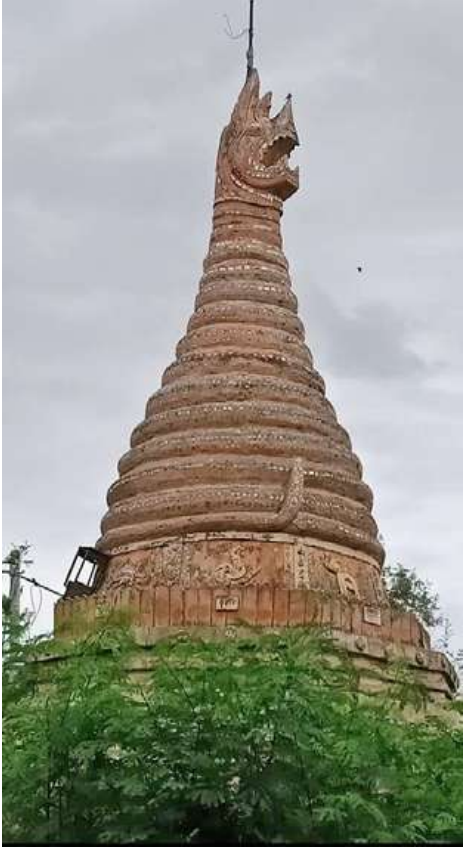
နဂါးပတ်စေတီကို တွေ့ရစဉ်။

ပုဂံ၏အတိတ်သမိုင်းကိုဖော်ထုတ်ရန် ခိုင်မာသောအထောက်အထားများကို ရှာဖွေကြရာတွင် တူးဖော်တွေ့ရှိမှုများအပြင် ကျောက်စာများကိုလည်း အားကိုးအားထားပြုခဲ့ကြရသည်။ ပုဂံရှေးဟောင်းကျောက်စာများတွင် ရေးထိုးခဲ့သည့်မှတ်တမ်းများကို ဖတ်ရှုကာ ပုဂံခေတ်ကာလ၏ သမိုင်းပုံရိပ်များကို သုံးသပ်ပုံဖော်နိုင်ခဲ့သည်။ ထို့ကြောင့် မြန်မာ့စွယ်စုံကျမ်းတွင် ကျောက်စာများသည် ရေးထိုးသောခေတ်က ယုံကြည်မှုအယူဝါဒများ၊ ယဉ်ကျေးမှုအနုပညာများနှင့် လူမှုဆက်ဆံရေးများကို မှန်းဆအကဲခတ်နိုင်သဖြင့် နိုင်ငံသမိုင်းကို များစွာအထောက်အကူဖြစ်ကြောင်း ဖော်ပြထားသည်။