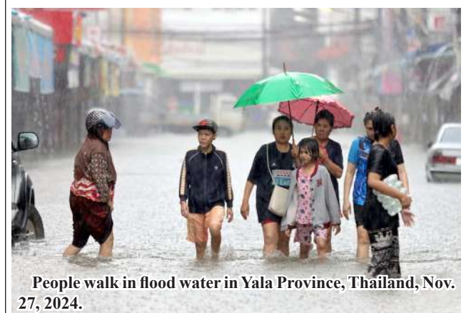
People walk in flood water in Yala Province, Thailand, Nov. 27, 2024.

A moderate northeast monsoon combined with a low-pressure system moving across the lower South China Sea, southern Thailand and Malaysia is expected to bring isolated heavy to very heavy rains to the lower southern region, according to the Thai Meteorological Department.