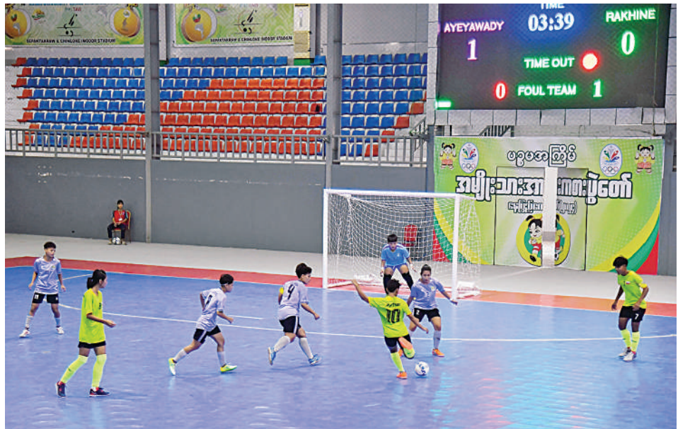
၂၀၂၄ ခုနှစ် ပဉ္စမအကြိမ် အမျိုးသားအားကစားပွဲတော် ပြည်နယ်နှင့်တိုင်းဒေသကြီး အမျိုးသားဖူဆယ်ဘောလုံးပြိုင်ပွဲတွင် ဧရာဝတီတိုင်းဒေသကြီးအသင်းနှင့် ရခိုင်ပြည်နယ်အသင်းတို့ ယှဉ်ပြိုင်ကစားနေမှုကို တွေ့ရစဉ်။