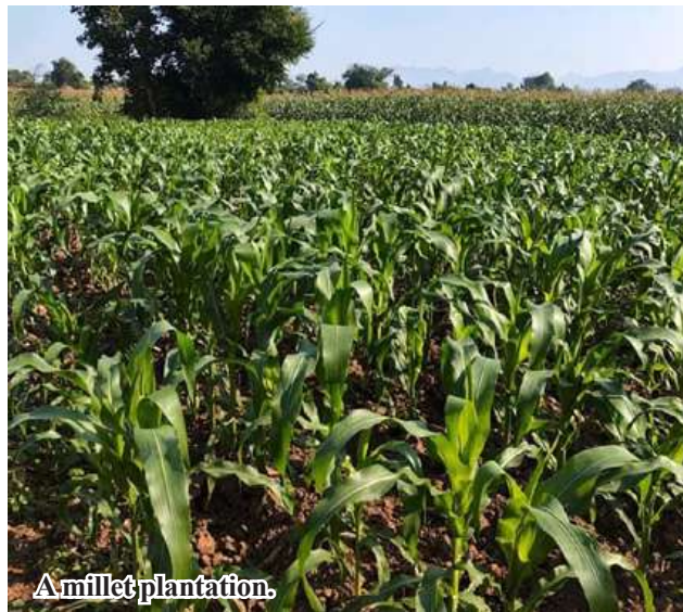
A millet plantation.