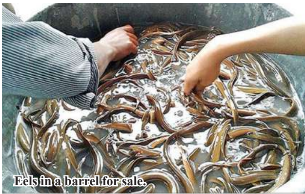
Eels in a barrel for sale.

China, Thailand and Singapore. Eel fetches K16,500 per viss in the market. Kyaw Kyaw Lin