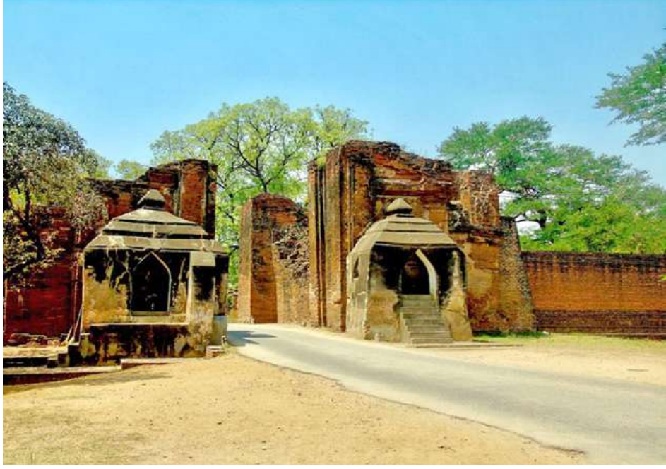
ပုဂံမြို့ဟောင်းရှိ သရပါတ်ခါးကို တွေ့ရစဉ်။

အချို့သော ရာဇဝင်များတွင် ဖော်ပြထားသည်မှာ ပုဂံရွှေပြည်ကြီးအစဖြစ်သောအခါက သမုတိရာဇ်မင်း ပထမတည်ထောင်သော ယုန်လွတ်ကျွန်း ပေါက်ပင် (နောက်ပိုင်း အရိမဒ္ဒနာ)၊ သေဉ်လည်ကြောင်မင်း လက်ထက်တည်သော တမ္ပဝတီ၊ ပျဉ်ပြားမင်း လက်ထက် တမ္ပဝတီမြို့ကြီးတွင် သုံးနှစ်နန်းစံခဲ့၏။