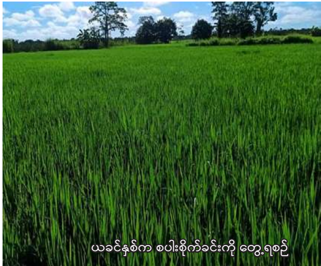
ယခင်နှစ်က စပါးစိုက်ခင်းကို တွေ့ရစဉ်

စီမံခန့်ခွဲရေးဦးစီးဌာနတို့ပူးပေါင်း ဆောင်ရွက်နေကြောင်း သိရသည်။ "မြောင်းမြမြို့နယ်မှာ စပါး ၁၁၃၁၅ ဧက စိုက်ပျိုးသွားမှာဖြစ်ပါတယ်။ စပါးတွေ အပါအဝင် အခြားသီးနှံတွေ လျာထားဧက ပြည့်မီအောင် စိုက်ပျိုးနိုင်ဖို့နဲ့ ပိုးမွှားရောဂါ ကာကွယ်ရေး နည်းပညာတွေကို စပါးမစိုက်မီ ထဲက မြေပြင်ထဲကွင်းဆင်းဆောင်