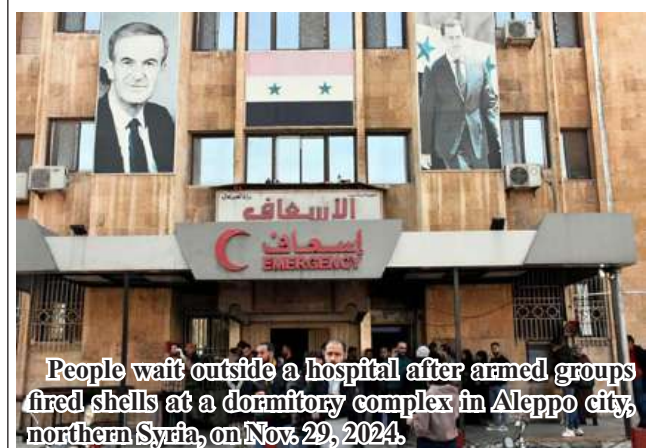
People wait outside a hospital after armed groups fired shells at a dormitory complex in Aleppo city, northern Syria, on Nov. 29, 2024.