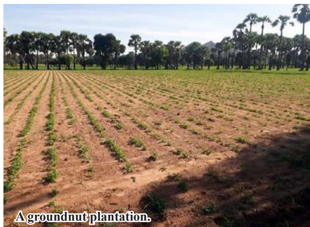
A groundnut plantation.

ing the GAP system have been shown to be of higher quality compared to those grown with other farming methods. These crops not only fetch higher prices in domestic markets but can also be exported to international markets. As a result, farmers using the GAP system are expected to see greater economic benefits, improving their social and economic conditions.