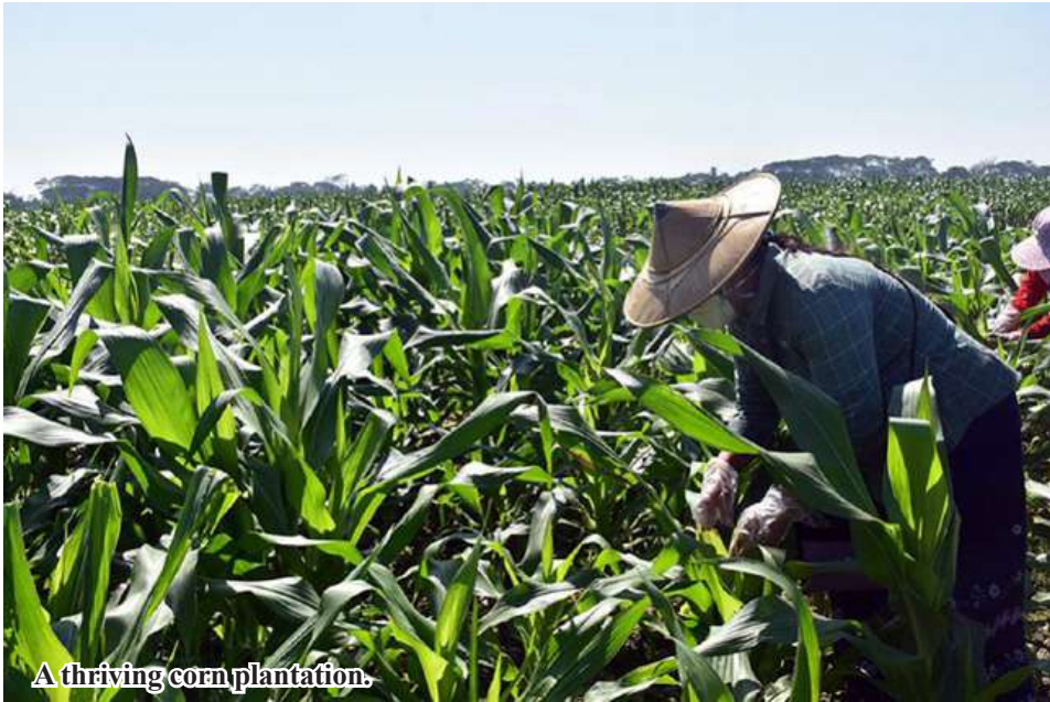
A thriving corn plantation.