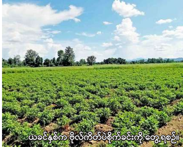
ယခုနှစ်က ဗိုလ်ကိတ်ပဲစိုက်ခင်းကို တွေ့ရစဉ်။

ငရုတ်ကောင်းမြို့တွင် ယခုနှစ် ဆောင်းသီးနှံ စိုက်ပျိုးရာသီ၌ ဗိုလ်ကိတ်ပဲ ၇၁၆ ဧက စိုက်ပျိုးရန် လျာထားပြီး ယခုနှစ် ဒီဇင်ဘာလ ပထမပတ်တွင် စတင်စိုက်ပျိုးသွားမည်ဖြစ်ကြောင်း၊ အဆိုပါ ဗိုလ်ကိတ်ပဲများ ရာနှုန်းပြည့် စိုက်ပျိုးနိုင်ရေး စိုက်ပျိုးရေးဦးစီးဌာန၊ စက်မှုလယ်ယာ