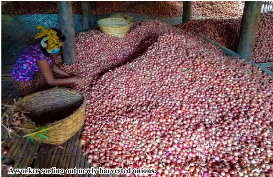
A worker sorting out newly harvested onions.

Monywa December 2 A total of 1,189 acres of onions have been planted in this year winter crops planting season in Monywa District, Sagaing Region,