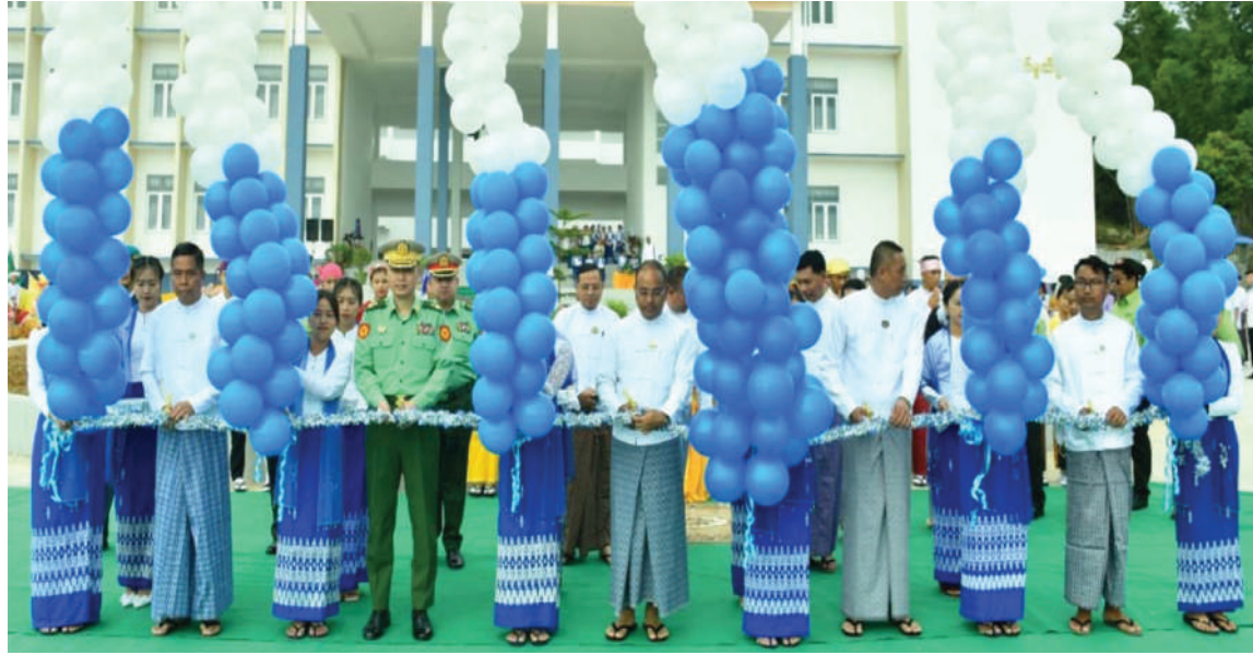
ရှမ်းပြည်နယ်ဝန်ကြီးချုပ် ဦးအောင်အောင်၊ အရှေ့ပိုင်းတိုင်းစစ်ဌာနချုပ် တိုင်းမှူး ဗိုလ်ချုပ်ဇော်မင်းလတ်နှင့် တာဝန်ရှိသူများက တောင်ကြီးမြို့ အစိုးရစက်မှုလက်မှုသိပ္ပံကျောင်း(တောင်ကြီး)ကို ဖွင့်ပွဲပြုလုပ်ပေးစဉ်။

နေပြည်တော် ဒီဇင်ဘာ ၂ ဦးစွာ ပြည်နယ်ဝန်ကြီးချုပ်၊ တိုင်းမှူး ကို အမွှေးနံ့သာရည်များဖြင့် ပက်ဖျန်း ရှမ်းပြည်နယ်(တောင်ပိုင်း) တောင်ကြီး နှင့်တာဝန်ရှိသူများက ဖဲကြီးဖြတ်ဖွင့်လှစ် ပေးကြသည်။ မြို့ အစိုးရစက်မှုလက်မှုသိပ္ပံကျောင်း ပေးပြီး ပြည်နယ်ဝန်ကြီးချုပ်က အစိုးရ ဆက်လက်၍ ပြည်နယ်ဝန်ကြီးချုပ်က (တောင်ကြီး)ဖွင့်ပွဲကို ယနေ့နံနက်ပိုင်းတွင် စက်မှုလက်မှုသိပ္ပံကျောင်း (တောင်ကြီး) အဆိုပါကျောင်း၌ပြုလုပ်ရာ ရှမ်းပြည်နယ် ဆိုင်းဘုတ်ကို စက်လှေတင်ပို့ပေး ကြားပြီး ကျောင်းသား၊ ကျောင်းသူများက ဝန်ကြီးချုပ် ဦးအောင်အောင်၊ အရှေ့ပိုင်း သည်။ ထို့နောက် ပြည်နယ်ဝန်ကြီးချုပ် အကလေးများဖြင့် ကပြဖျော်ဖြေကြသည်။ တိုင်းစစ်ဌာနချုပ် တိုင်းမှူး ဗိုလ်ချုပ် နှင့် တိုင်းမှူးတို့က ဘင်ခရာအဖွဲ့၊ ပန်းဖွား ၎င်းနောက် ပြည်နယ်ဝန်ကြီးချုပ်၊ တိုင်းမှူး နှင့် တာဝန်ရှိသူများက ကျောင်းရန်ပုံငွေ အကနှင့် တိုးနယားအကအဖွဲ့တို့ကို ရုတ်ပြုချီးမြှင့်ငွေများ ပေးအပ်ခဲ့ကြသည်။ အတွက် ထောက်ပံ့ငွေများနှင့် အကအဖွဲ့ များကို ရုတ်ပြုချီးမြှင့်ငွေများပေးအပ်ခဲ့ ကြောင်း သတင်းရရှိသည်။ (၅၀၁)