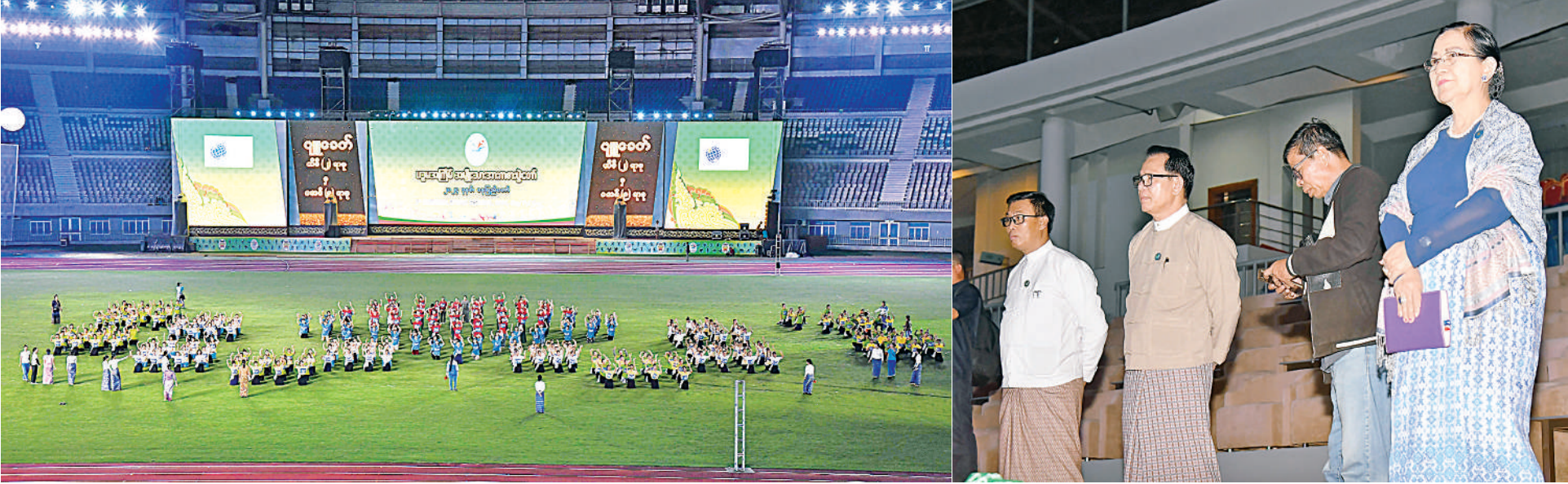
ပြန်ကြားရေးဝန်ကြီးဌာန ပြည်ထောင်စုဝန်ကြီး ဦးမောင်မောင်အုန်း ပဉ္စမအကြိမ် အမျိုးသားအားကစားပွဲတော် ဖွင့်ပွဲပိတ်ပွဲအခမ်းအနားအစီအစဉ်အလိုက် အကြံပြုဆင်ဆောင်ရွက်နေမှုကို ကြည့်ရှုစစ်ဆေးစဉ်။

နေပြည်တော် ဒီဇင်ဘာ ၂ စတင်ယှဉ်ပြိုင်လျက်ရှိရာ ဝန်ကြီးဌာန ဘောလုံးပြိုင်ပွဲကို လေ့ကျင့်ရေးကွင်း လည်းကောင်း၊ပြည်နယ်နှင့်တိုင်းဒေသကြီး သိဒ္ဓိအားကစားကွင်း(B)ရုံ၌လည်းကောင်း၊ ယနေ့တွင် ၂၀၂၄ ခုနှစ် ပဉ္စမအကြိမ် အဆင့် အလွတ်တန်းဘောလုံးပြိုင်ပွဲကို အမှတ်(၃)၊ (၄)တို့တွင်လည်းကောင်း၊ အဆင့် အမျိုးသား၊ အမျိုးသမီး ဖူဆယ် အကြိတ်အနယ်ယှဉ်ပြိုင်ခဲ့ကြသည်။ အမျိုးသားအားကစားပွဲတော် အားကစား ပျဉ်းမနားမြို့နယ်ရှိပြည်သူ့ပေါင်းလောင်း ပြည်နယ်နှင့်တိုင်းဒေသကြီးအဆင့် U-25 ပြိုင်ပွဲကိုဝဏ္ဏသိဒ္ဓိဖူဆယ်ရုံ၌လည်းကောင်း၊ ၂၀၂၄ ခုနှစ် ပဉ္စမအကြိမ် အမျိုးသား နည်းများအလိုက်ပြိုင်ပွဲများကိုသက်ဆိုင်ရာ အားကစားကွင်း၌လည်းကောင်း၊ပြည်နယ် အမျိုးသမီးဘောလုံးပြိုင်ပွဲကို ဘောဂဝတီ ပြည်နယ်နှင့် တိုင်းဒေသကြီး အမျိုးသား၊ အားကစားပွဲတော် ဝန်ကြီးဌာနပေါင်းစုံ နှင့် တိုင်းဒေသကြီးအဆင့် U-21အမျိုးသား ကွင်းနှင့် လယ်ဝေးမြို့နယ်ကွင်းတို့တွင် အမျိုးသမီးဘောလုံးဘောပြိုင်ပွဲကို ဝဏ္ဏ စာမျက်နှာ ၁၆ ကော်လံ ၁ ပ။