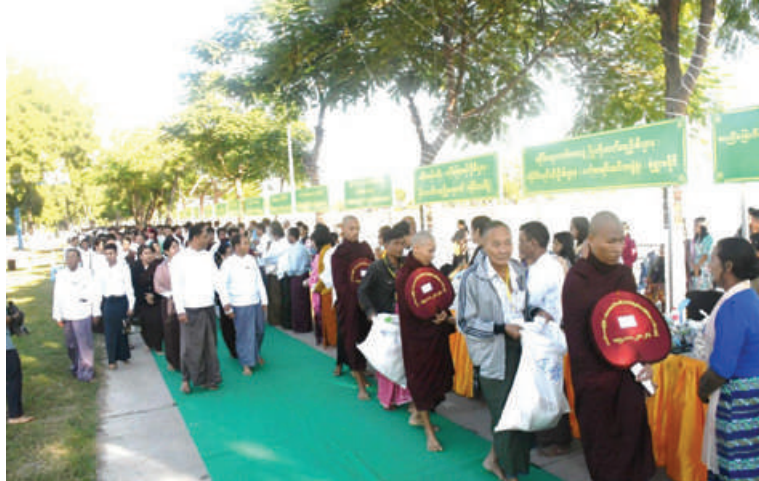
စစ်ကိုင်းတိုင်းဒေသကြီး မုံရွာမြို့၌ သံဃာတော်များအား ဆွမ်းဆန်တော်နှင့် လှူဖွယ်ပစ္စည်းများ လောင်းလှူပွဲကျင်းပစဉ်။

ဒေသကြီးနှင့် ပြည်နယ်အသီးသီး၌ သံဃာတော်များနှင့် သာသနာ့နယ်ဝင် သီလရှင်များအား ဆွမ်းဆန်တော်နှင့် လှူဖွယ်ပစ္စည်းများ ဆက်ကပ်လောင်းလှူပွဲများကို ကျင်းပလျက်ရှိသည်။