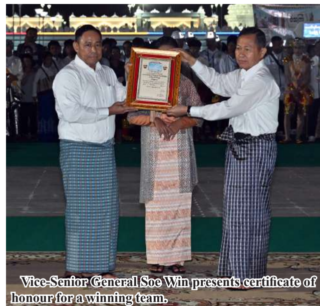
Vice-Senior General Soe Win presents certificate of honour for a winning team.