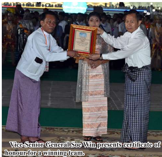
Vice-Senior General Soe Win presents certificate of honour for a winning team.