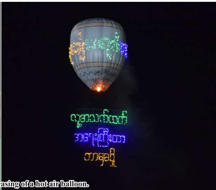
Senior General Min Aung Hlaing and wife Daw Kyu Kyu Hla watch the releasing of a hot air balloon.

from Nay Pyi Taw Council Area and regions and states, and monks and layperson pilgrims.