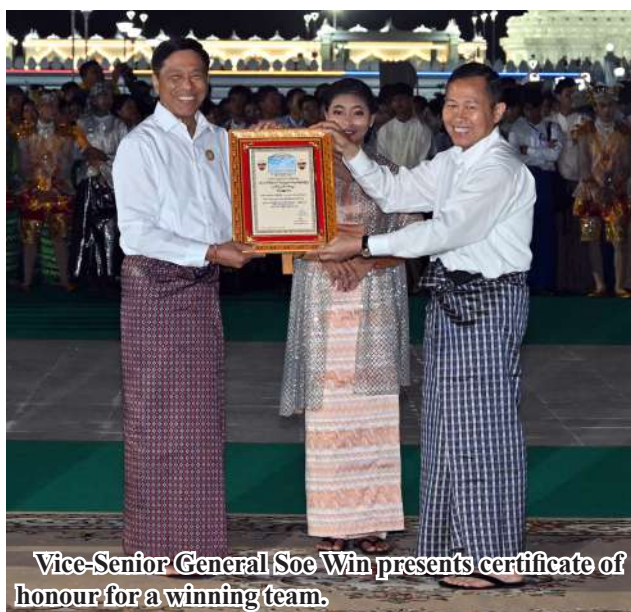
Vice-Senior General Soe Win presents certificate of honour for a winning team.