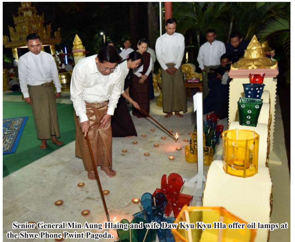
Senior General Min Aung Hlaing and wife Daw Kyu Kyu Hla offer oil lamps at the Shwe Phone Pwint Pagoda.

As Tazaung refers to the beacon of lights and oil lights and Mone means brightness, the festival amounts to a large number of shining lights to the end of the eye sight and pagodas were crowded with people making offerings to Shin Upagutta, holding floating light festivals, offering Matho robes and organizing charity bazaars. Moreover, the situation of the country was peaceful with donors of salad of the bulbs of Mezali trees, people who made donations to anyone who was lucky enough to find them and those who found them.