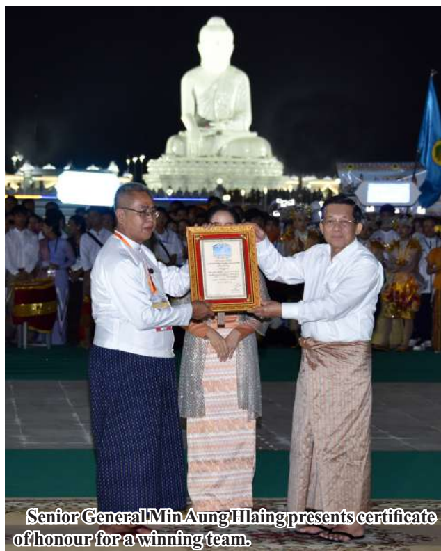
Senior General Min Aung Hlaing presents certificate of honour for a winning team.

Pyi Taw council chair, senior military officers from Office of Commander-in-Chief and wives, the Nay Pyi Taw command commander, officials, participants of hot air balloon releasing, Matho Shwekyia Robes weaving competitions