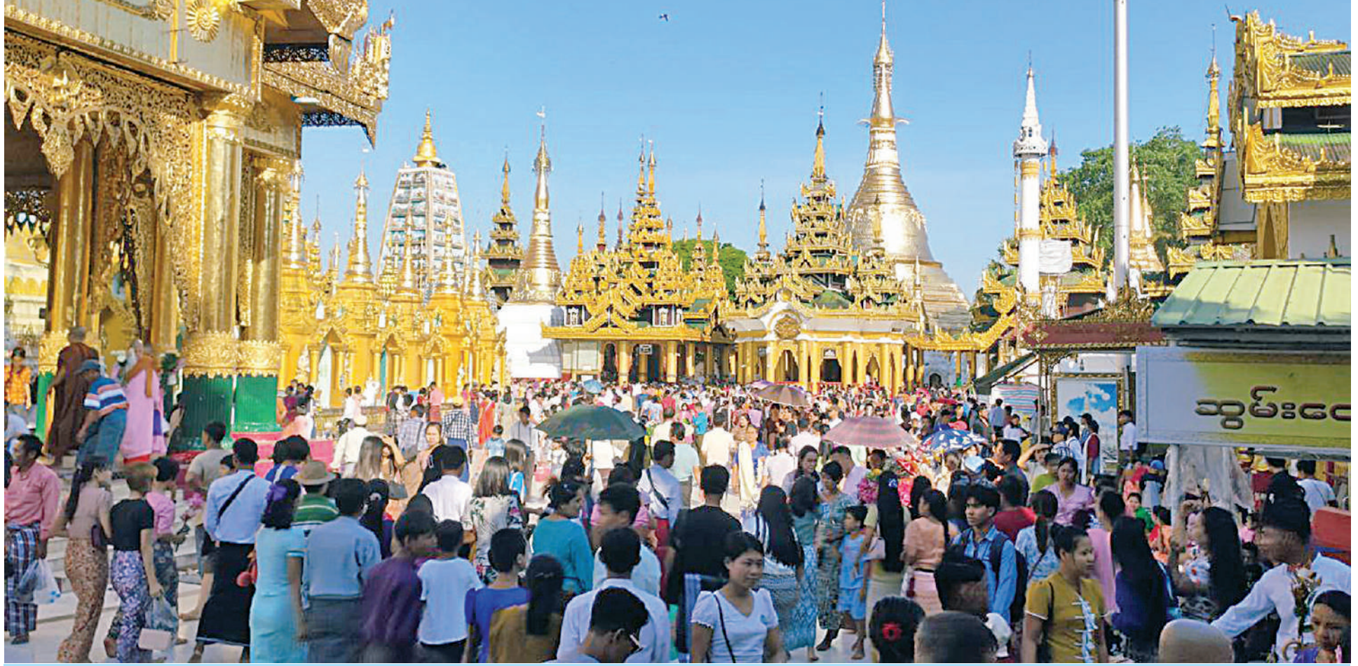
ရန်ကုန်မြို့ရှိ ရွှေတိဂုံစေတီတော်မြတ်ကြီးတွင် ဘုရားဖူးလာပြည်သူများဖြင့် စည်ကားနေမှုကို တွေ့ရစဉ်။

နေပြည်တော် နိုဝင်ဘာ ၁၅ သည့် တန်ဆောင်မုန်းလပြည့်(သာမည တို့ကို မြန်မာ့ယဉ်ကျေးမှုအစဉ်အလာ ကြသည်။ ရှင်အား ရည်မှန်း၍ ဥပုသ်သီလဆောက် ယနေ့သည် ဗုဒ္ဓဘာသာဝင်တို့၏ (ဗလအခါတော်နေ့) ဖြစ်သည်နှင့်အညီ ကောင်းတစ်ရပ်အဖြစ် လက်ဆင့်ကမ်း အဆိုပါနေ့ထူးနေ့မြတ်တွင် ဗုဒ္ဓ တည်ခြင်း၊ပဋ္ဌာန်းဒေသနာတော်နှင့် နေ့ထူးနေ့မြတ်များအနက် တစ်ရက်ဖြစ် တန်ဆောင်တိုင်ပွဲတော်၊ မီးထွန်းပွဲတော် ထိန်းသိမ်းပြီး နှစ်စဉ်ကျင်းပပြုလုပ် ဘာသာဝင်များအနေဖြင့် မြတ်စွာဘုရား စာမျက်နှာ ၁၉ ကော်လံ ၁ ☆