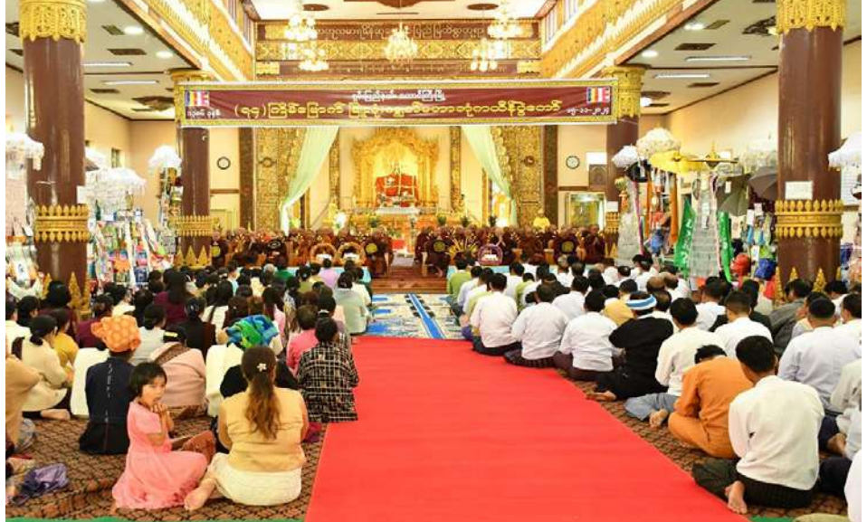
ရှမ်းပြည်နယ်အစိုးရအဖွဲ့က ကြီးမှူးကျင်းပသည့် (၇၄)ကြိမ်မြောက် မြို့လုံးကျွတ် စုပေါင်းမဟာဘုံကထိန် လှူဒါန်းပွဲကျင်းပစဉ်။