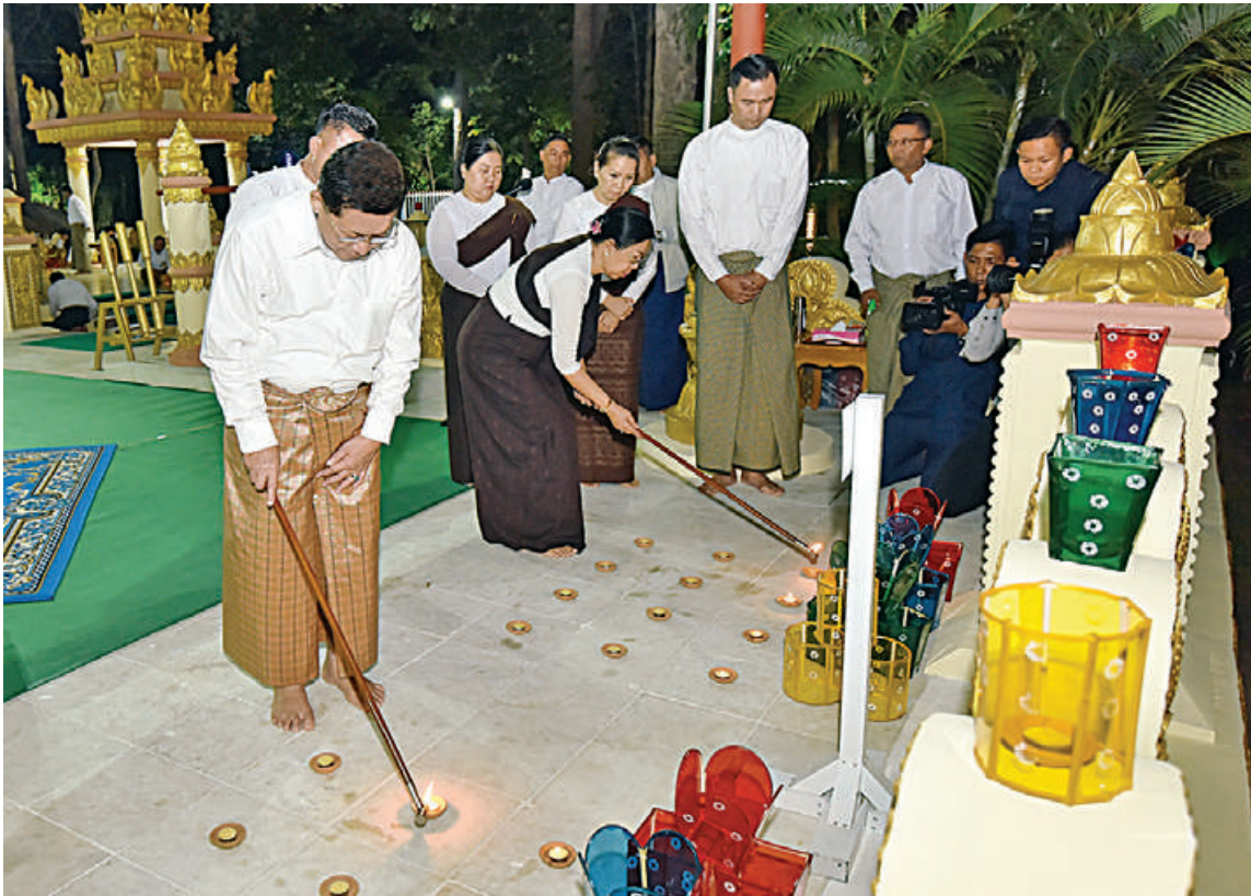
နိုင်ငံတော်စီမံအုပ်ချုပ်ရေးကောင်စီဥက္ကဋ္ဌ တပ်မတော်ကာကွယ်ရေးဦးစီးချုပ် ဗိုလ်ချုပ်မှူးကြီးမင်းအောင်လှိုင်နှင့် ဇနီး ဒေါ်ကြူကြူလှ နေပြည်တော်ကောင်စီနယ်မြေ ဇေယျာသီရိမြို့နယ် ရွှေဘုန်းပွင့်စေတီတော်မြတ်ကြီး၌ ဆီမီးများထွန်းညှိပူဇော်စဉ်။

ထိုသို့ မြန်မာ့ယဉ်ကျေးမှုပွဲတော်ကို ထိန်းသိမ်းဆင်နွှဲလျက်ရှိကြရာ နေပြည် တော်ကောင်စီနယ်မြေ ဇေယျာသီရိမြို့ နယ်အတွင်းရှိ ရွှေဘုန်းပွင့်စေတီတော် မြတ်ကြီးတွင်လည်း ယနေ့ညပိုင်းတွင် နိုင်ငံတော် စီမံအုပ်ချုပ်ရေးကောင်စီ ဥက္ကဋ္ဌ တပ်မတော်ကာကွယ်ရေးဦးစီးချုပ် ဗိုလ်ချုပ်မှူးကြီးမင်းအောင်လှိုင်နှင့် ဇနီး ဒေါ်ကြူကြူလှ၊ နိုင်ငံတော်စီမံအုပ်ချုပ်ရေး ကောင်စီဒုတိယဥက္ကဋ္ဌ ဒုတိယတပ်မတော် ကာကွယ်ရေးဦးစီးချုပ် ကာကွယ်ရေးဦးစီး