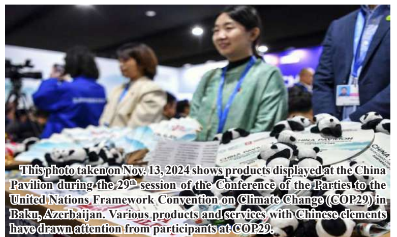
This photo taken on Nov. 13, 2024 shows products displayed at the China Pavilion during the 29th session of the Conference of the Parties to the United Nations Framework Convention on Climate Change (COP29) in Baku, Azerbaijan. Various products and services with Chinese elements have drawn attention from participants at COP29.

He also stressed the need for necessary investments to tackle climate challenges, saying multilateral platforms, like BRICS, are increasingly significant for addressing climate change.