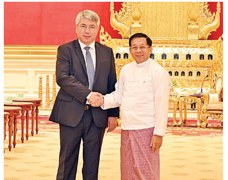
နိုင်ငံတော်စီမံအုပ်ချုပ်ရေးကောင်စီဥက္ကဋ္ဌ နိုင်ငံတော်ဝန်ကြီးချုပ် ဗိုလ်ချုပ်မှူးကြီး မင်းအောင်လှိုင် ရုရှားဖက်ဒရေးရှင်းနိုင်ငံ ဘူရားတီးရားပြည်နယ်အကြီးအကဲ ဘူရားတီးရားပြည်နယ်အစိုးရဥက္ကဋ္ဌ H. E. Mr. Alexey Sambuevich Tsydenov အား ရင်းရင်းနှီးနှီးနှုတ်ဆက်စဉ်။

တိုးတက်စေရေး ပူးပေါင်းဆောင်ရွက်နိုင် သည့်အခြေအနေများ၊ မြန်မာနိုင်ငံက ထွက်ရှိသည့် သစ်တောထွက်ပစ္စည်းများ ဖြင့်သစ်ပါးလွှာနှင့် ပျော့ဖတ်များထုတ်လုပ် နိုင်သည့်အခြေအနေများ၊ ရော်ဘာစိုက်ပျိုး ထုတ်လုပ်မှုနှင့် ဝါစိုက်ပျိုးမှု တိုးတက် ထုတ်လုပ်နိုင်ရေးနှင့် ကုန်ကြမ်းများကို ကုန်ချောအဖြစ် ထုတ်လုပ်နိုင်ရေးပူးပေါင်း ဆောင်ရွက်နိုင်သည့်အခြေအနေများ၊ စက်မှု ကုန်ထုတ်လုပ်ငန်းများတွင် နည်းပညာ မြှင့်တင်မှုများ ပူးပေါင်းဆောင်ရွက်နိုင် သည့်အခြေအနေများ၊ တွင်းထွက်ပစ္စည်း ထုတ်လုပ်မှုလုပ်ငန်း၊ ပို့ဆောင်ရေးလုပ်ငန်း များတွင် နည်းပညာပူးပေါင်းဆောင်ရွက်မှု များ မြှင့်တင်ရေးဆိုင်ရာကိစ္စရပ်များ၊ ခရီးသွားကဏ္ဍများ ဖွံ့ဖြိုးတိုးတက်ရေး ပူးပေါင်းဆောင်ရွက်လျက်ရှိမှုအခြေအနေ များနှင့် တိုက်ရိုက်လေကြောင်းပျံသန်းမှု များ တိုးချဲ့ဆောင်ရွက်ရေးကိစ္စရပ်များ၊ လူသားအရင်းအမြစ် ဖွံ့ဖြိုးတိုးတက်ရေး အတွက် ပညာတော်သင်များစေလွှတ်ရေး နှင့် ပညာရေးကဏ္ဍပူးပေါင်းဆောင်ရွက်မှု မြှင့်တင်ရေးကိစ္စရပ်များ၊ ကျန်းမာရေး ကဏ္ဍတွင် ပူးပေါင်းဆောင်ရွက်မှုများ ပိုမို မြှင့်တင်ဆောင်ရွက်နိုင်သည့် ကိစ္စရပ်များ၊ ဘာသာရေးနှင့် ယဉ်ကျေးမှုဆိုင်ရာများတွင်