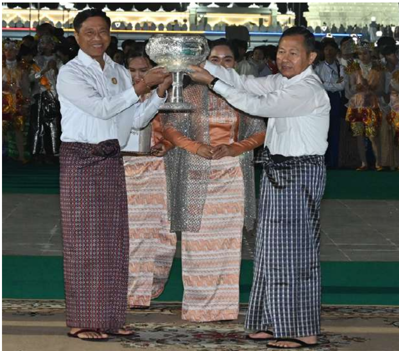
နိုင်ငံတော်စီမံအုပ်ချုပ်ရေးကောင်စီဒုတိယဥက္ကဋ္ဌ ဒုတိယဝန်ကြီးချုပ် ဒုတိယ ဗိုလ်ချုပ်မှူးကြီးစိုးဝင်း စိန်နားပန်မီးပုံးပျံလွှတ်တင်ပူဇော်ပြိုင်ပွဲတွင် ဒုတိယဆုရရှိသည့် လူမှုဝန်ထမ်းကယ်ဆယ်ရေးနှင့် ပြန်လည်နေရာချထားရေးဝန်ကြီးဌာန ကိုယ်စားပြု အသင်းအား ဆုပေးအပ်ခြင်း၊ ဂုဏ်ပြုချီးမြှင့်ငွေနှင့် ဂုဏ်ပြုမှတ်တမ်းလွှာများပေးအပ်ချီးမြှင့်စဉ်။

တနင်္သာရီတိုင်းဒေသကြီး ကိုယ်စားပြုအသင်း အား နိုင်ငံတော်စီမံအုပ်ချုပ်ရေးကောင်စီ ဒုတိယဥက္ကဋ္ဌ ဒုတိယဝန်ကြီးချုပ်ကလည်း ကောင်း ဆုပေးအပ်ခြင်း၊ ဂုဏ်ပြုချီးမြှင့်ငွေနှင့် ဂုဏ်ပြုမှတ်တမ်းလွှာများ ပေးအပ်ချီးမြှင့် ကြသည်။