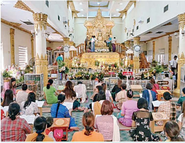
မန္တလေးမြို့ရှိ အောင်တော်မူဘုရား၌ ဘုရားဖူးလာပြည်သူများဖြင့် စည်ကားနေမှုကို တွေ့ရစဉ်။