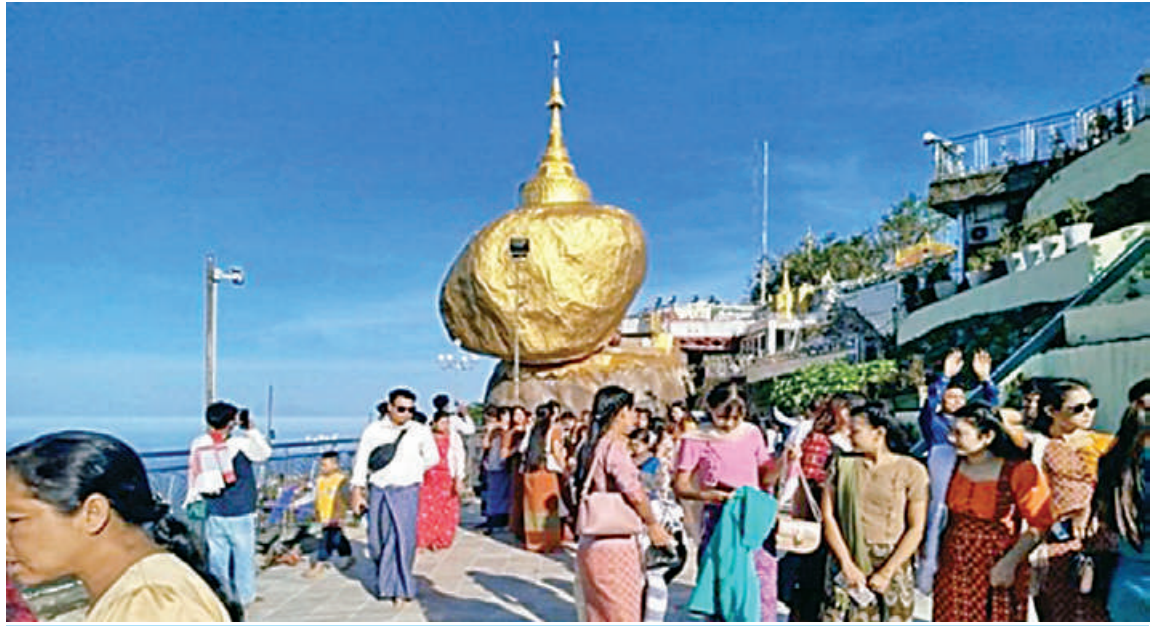
မွန်ပြည်နယ် ကျိုက်ထီးရိုးဆံတော်ရှင်စေတီတော်မြတ်ကြီးတွင် ဘုရားဖူးလာပြည်သူများဖြင့် စည်ကားနေမှုကို တွေ့ရစဉ်။