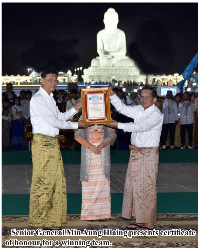
Senior General Min Aung Hlaing presents certificate of honour for a winning team.