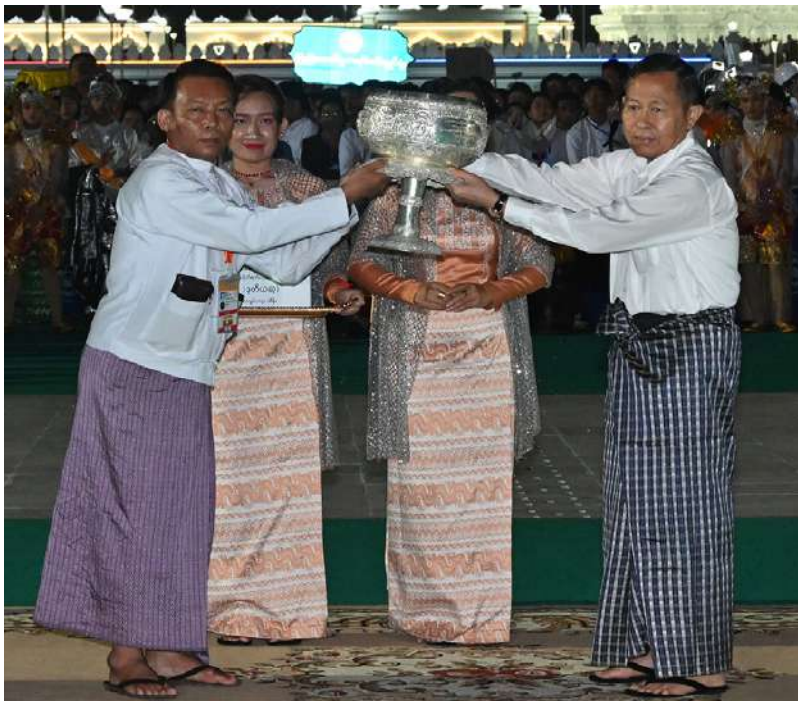
နိုင်ငံတော်စီမံအုပ်ချုပ်ရေးကောင်စီဒုတိယဥက္ကဋ္ဌ ဒုတိယဝန်ကြီးချုပ် ဒုတိယ ဗိုလ်ချုပ်မှူးကြီးစိုးဝင်း မသိုးရွှေကြာသင်္ကန်း ရက်လုပ်ပူဇော်ပြိုင်ပွဲတွင် ဒုတိယဆုရရှိသည့် တနင်္သာရီတိုင်းဒေသကြီး ကိုယ်စားပြုအသင်းအား ဆုပေးအပ်ခြင်း၊ ဂုဏ်ပြုချီးမြှင့်ငွေနှင့် ဂုဏ်ပြုမှတ်တမ်းလွှာများ ပေးအပ်ချီးမြှင့်စဉ်။