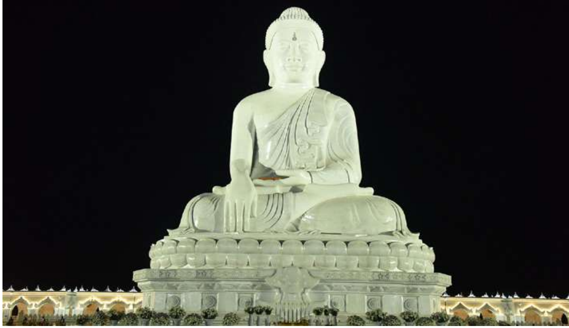
ပြည်ထောင်စုနယ်မြေ နေပြည်တော် ဒက္ခိဏသီရိမြို့နယ် ဗုဒ္ဓဥယျာဉ်ဝတ္ထုကံတော်အတွင်းရှိ မာရဝိဇယဗုဒ္ဓရုပ်ပွားတော်မြတ်ကြီးအား ကြည်ညိုဖွယ်ဖူးတွေ့ရစဉ်။

နေပြည်တော် နိုဝင်ဘာ ၁၅ ပြည်ထောင်စုနယ်မြေ နေပြည်တော် ဒက္ခိဏသီရိမြို့နယ် ဗုဒ္ဓဥယျာဉ်ဝတ္ထုကံတော်အတွင်းရှိ မာရဝိဇယဗုဒ္ဓရုပ်ပွားတော်မြတ်ကြီးအား ဒုတိယအကြိမ် မသိုးရွှေကြာသင်္ကန်းတော် ဆက်ကပ်လှူဒါန်းခြင်း မဟာမင်္ဂလာအခမ်းအနားကို ယနေ့နံနက် မင်္ဂလာအချိန်တွင် ကျင်းပပြုလုပ်ရာ နိုင်ငံတော်စီမံအုပ်ချုပ်ရေးကောင်စီဝင်ဗိုလ်ချုပ်ကြီးညိုစောနှင့် တာဝန်ရှိသူများတက်ရောက်၍ မသိုးရွှေကြာသင်္ကန်းတော်ကို ဆက်ကပ်လှူဒါန်းကြသည်။