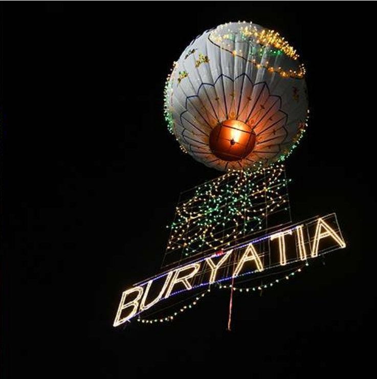
နိုင်ငံတော်စီမံအုပ်ချုပ်ရေးကောင်စီဥက္ကဋ္ဌ နိုင်ငံတော်ဝန်ကြီးချုပ် ဗိုလ်ချုပ်မှူးကြီးမင်းအောင်လှိုင် နှင့် ဇနီး ဒေါ်ကြူကြူလှ၊ ရုရှားဖက်ဒရေးရှင်းနိုင်ငံ ဘူရားတီးရားပြည်နယ် အကြီးအကဲ ဘူရားတီးရား ပြည်နယ်အစိုးရဥက္ကဋ္ဌ H.E. Mr. Alexey Sambuevich Tsydenov နှင့် ချစ်ကြည်ရေး ကိုယ်စားလှယ်အဖွဲ့တို့က ရုရှား-မြန်မာ ချစ်ကြည်ရေး အထိမ်းအမှတ်အဖြစ် မြတ်ရောင်ခြည် စိန်နားပန် မီးပုံးပျံလွှတ်တင်မှုကို ကြည့်ရှုအားပေးကြစဉ်။

၂၆ ရှေ့ဖုံးမှအဆက် နိုင်ငံတော်စီမံအုပ်ချုပ်ရေးကောင်စီဒုတိယ ဥက္ကဋ္ဌဒုတိယဝန်ကြီးချုပ် ဒုတိယ ဗိုလ်ချုပ်မှူးကြီးစိုးဝင်းနှင့် ဇနီး ဒေါ်သန်းသန်း နွယ်၊ ကောင်စီအတွင်းရေးမှူးနှင့် ဇနီး၊