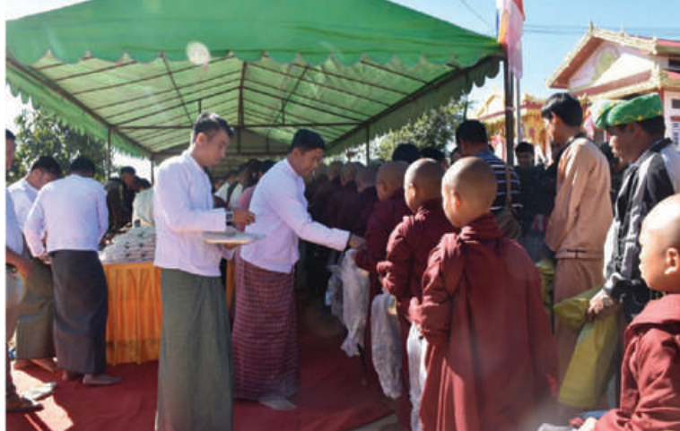
သံဃာတော်များအား အရှေ့အလယ်ပိုင်းတိုင်းစစ်ဌာနချုပ် တိုင်းမှူး ဗိုလ်ချုပ်မျိုးမင်းထွန်း ဆွမ်းဆန်တော်နှင့် လှူဖွယ်ပစ္စည်းများလောင်းလှူစဉ်။

နေပြည်တော် နိုဝင်ဘာ ၁၅ ယနေ့သည် ဗုဒ္ဓဘာသာဝင်တို့၏ နေ့ထူးနေ့မြတ်များအနက် တစ်ရက်ဖြစ်သည့် တန်ဆောင်မုန်းလပြည့် သာမညဖလအခါတော်နေ့ဖြစ်သည်နှင့်အညီ တိုင်း