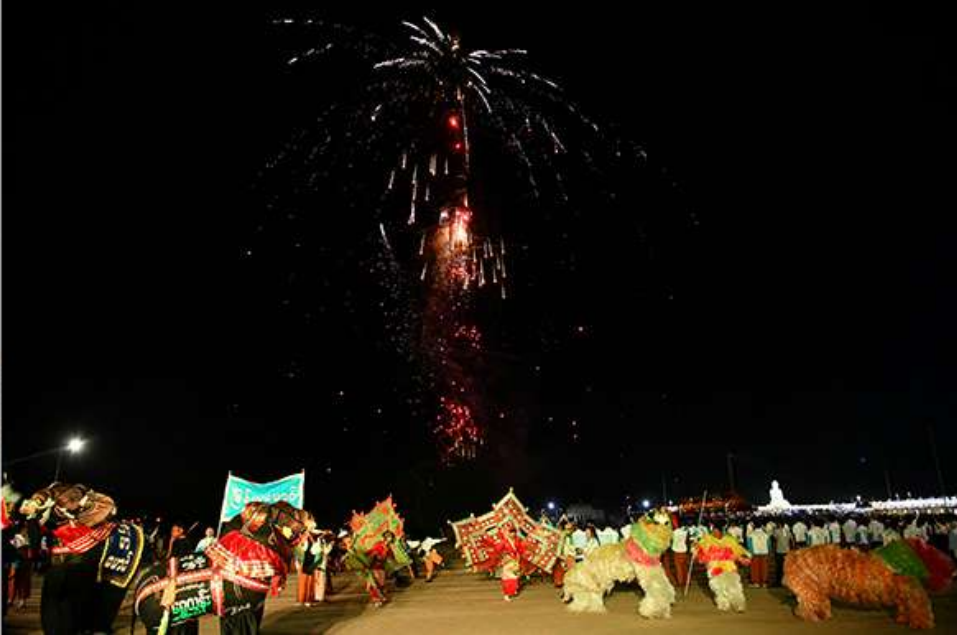
နိုင်ငံတော်စီမံအုပ်ချုပ်ရေးကောင်စီဥက္ကဋ္ဌ နိုင်ငံတော်ဝန်ကြီးချုပ် ဗိုလ်ချုပ်မှူးကြီးမင်းအောင်လှိုင်နှင့်ဇနီး ဒေါ်ကြူကြူလှ၊ ရုရှားဖက်ဒရေးရှင်းနိုင်ငံ ဘူရားတီးရားပြည်နယ်အကြီးအကဲ ဘူရားတီးရားပြည်နယ်အစိုးရဥက္ကဋ္ဌ H.E. Mr. Alexey Sambuevich Tsydenov နှင့် ချစ်ကြည်ရေးကိုယ်စားလှယ်အဖွဲ့တို့က မီးပုံးပျံများလွှတ်တင်ပူဇော်ယှဉ်ပြိုင်ပွဲကို ကြည့်ရှုအားပေးကြစဉ်။