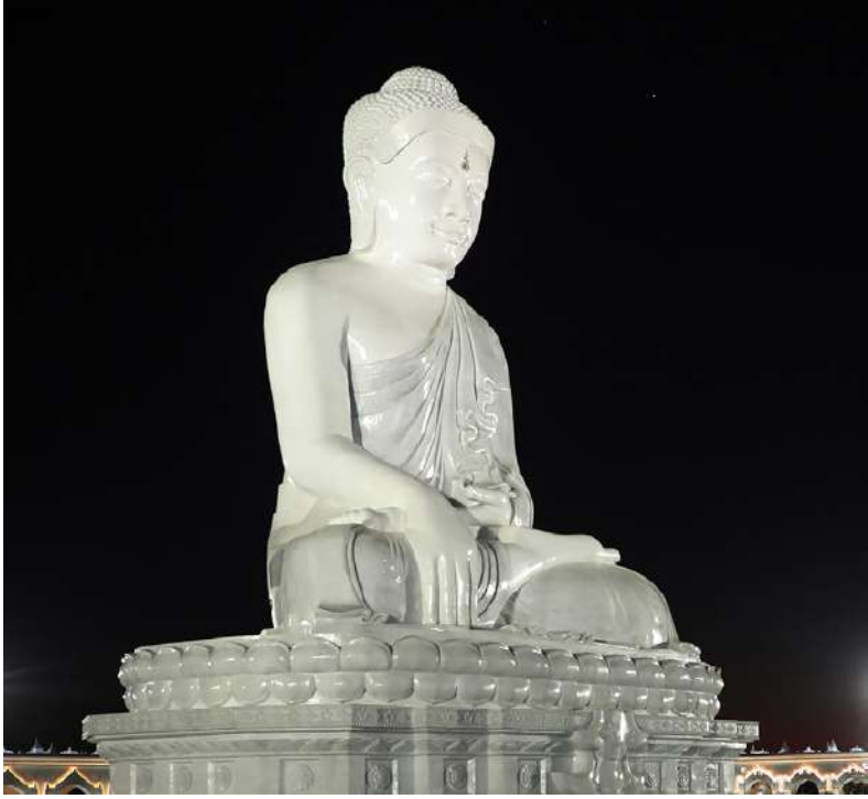
နိုင်ငံတော်စီမံအုပ်ချုပ်ရေးကောင်စီဥက္ကဋ္ဌ နိုင်ငံတော်ဝန်ကြီးချုပ် ဗိုလ်ချုပ်မှူးကြီးမင်းအောင်လှိုင်နှင့် ဇနီး ဒေါ်ကြူကြူလှ မာရဝိဇယဗုဒ္ဓရုပ်ပွားတော်မြတ်ကြီးအား ဆီမီးထွန်းညှိပူဇော်စဉ်။