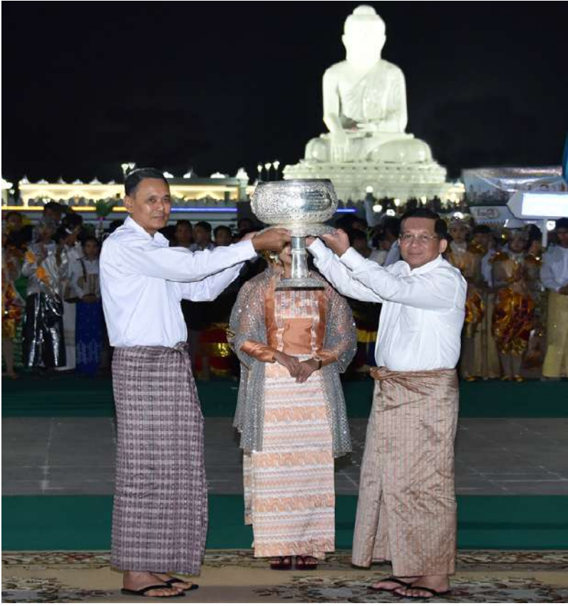
နိုင်ငံတော်စီမံအုပ်ချုပ်ရေးကောင်စီဥက္ကဋ္ဌ နိုင်ငံတော်ဝန်ကြီးချုပ် ဗိုလ်ချုပ်မှူးကြီး မင်းအောင်လှိုင် စိန်နားပန်မီးပုံးပျံလွှတ်တင်ပူဇော်ပြိုင်ပွဲတွင် ပထမဆုရရှိသည့် ကာကွယ်ရေး ဝန်ကြီးဌာန ကာကွယ်ရေးဦးစီးချုပ်ရုံး(ရေ) ကိုယ်စားပြုအသင်းအား ဆုပေးအပ်ခြင်း၊ ဂုဏ်ပြု ချီးမြှင့်ငွေနှင့် ဂုဏ်ပြုမှတ်တမ်းလွှာများ ပေးအပ်ချီးမြှင့်စဉ်။

ယင်းနောက် ပဉ္စမဆုရရှိသည့် နေပြည်တော်ကောင်စီ ကိုယ်စားပြုအသင်း အား ကောင်စီဝင် ဗိုလ်ချုပ်ကြီးမြထွန်းဦး ကလည်းကောင်း၊ စတုတ္ထဆုရရှိသည့် ကချင် ပြည်နယ်ကိုယ်စားပြုအသင်းအား ကောင်စီ တွဲဖက်အတွင်းရေးမှူးက လည်းကောင်း၊ တတိယဆုရရှိသည့် စစ်ကိုင်းတိုင်းဒေသကြီး ကိုယ်စားပြုအသင်းအား ကောင်စီအတွင်း ရေးမှူးကလည်းကောင်း၊ ဒုတိယဆုရရှိသည့်