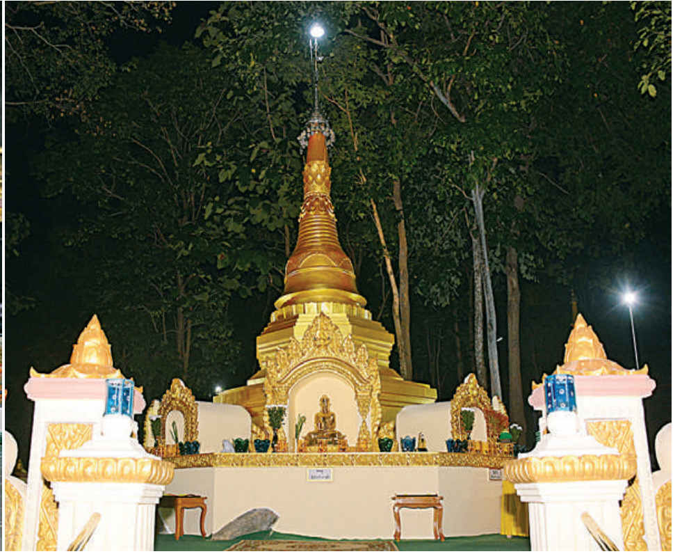
နေပြည်တော်ကောင်စီနယ်မြေ ဇေယျာသီရိမြို့နယ်အတွင်းရှိ ရွှေဘုန်းပွင့်စေတီတော်မြတ်ကြီးအား ဖူးတွေ့ရစဉ်။