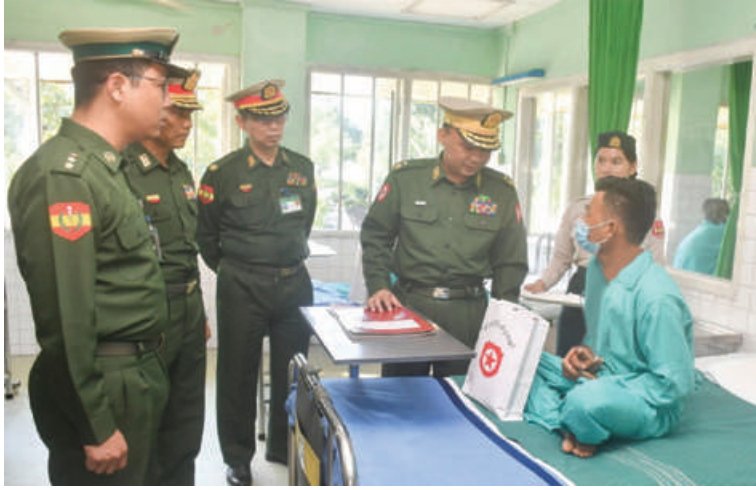
ရန်ကုန်တိုင်းစစ်ဌာနချုပ် တိုင်းမှူး ဗိုလ်ချုပ်ဇော်ဟိန်း ဆေးကုသမှုခံယူနေသူ တစ်ဦးကို ရင်းရင်းနှီးနှီး မေးမြန်းအားပေးစကားပြောကြားစဉ်။

ဆေးရုံကြီး(ခုတင်-၁၀၀၀)၊ လှည်းကူးမြို့၊ နယ်ရှိ တပ်မတော်ဆေးရုံတို့၌ တက်ရောက် ဆေးကုသမှုခံယူလျက်ရှိသော အရာရှိ၊ စစ်သည်၊ မိသားစုများနှင့်ဒေသခံပြည်သူ များကို ယနေ့တွင် ရန်ကုန်တိုင်းစစ်ဌာနချုပ် တိုင်းမှူး ဗိုလ်ချုပ်ဇော်ဟိန်းနှင့် တာဝန်ရှိ သူများက သွားရောက်ကြည့်ရှု၍ တစ်ဦး ချင်း၏ ရောဂါဖြစ်ပွားမှု၊ ဆေးဝါးကုသပေး ထားမှုနှင့် ကျန်းမာရေးတိုးတက်ကောင်း မွန်မှုအခြေအနေများကို ရင်းရင်းနှီးနှီး မေးမြန်းအားပေးစကား ပြောကြားပြီး စားသောက်ဖွယ်ရာများ ပေးအပ်သည်။ ထို့နောက်တိုင်းမှူးနှင့် တာဝန်ရှိသူ များသည် ဆေးရုံအတွင်းလှည့်လည်ကြည့်ရှု ၍ လိုအပ်သည်များ ညှိနှိုင်းဆောင်ရွက် ပေးခဲ့ကြောင်း သတင်းရရှိသည်။ (၅၀၁)