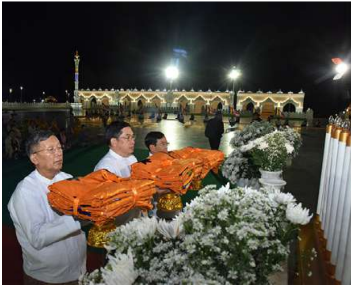
မာရဝိဇယဗုဒ္ဓရုပ်ပွားတော်မြတ်ကြီးအား နိုင်ငံတော်စီမံအုပ်ချုပ်ရေးကောင်စီဝင် ဗိုလ်ချုပ်ကြီးညိုစော၊ ပြည်ထောင်စုဝန်ကြီး ဦးတင်ဦးလွင်နှင့် နေပြည်တော်ကောင်စီဥက္ကဋ္ဌ ဦးသန်းထွန်းဦးတို့က မသိုးရွှေကြာသင်္ကန်းတော်များကို ဆက်ကပ်လှူဒါန်းစဉ်။

မဟာမင်္ဂလာ အခမ်းအနားသို့ နိုင်ငံတော် စီမံအုပ်ချုပ်ရေးကောင်စီဝင်များဖြစ်ကြသည့် ဗိုလ်ချုပ်ကြီးညိုစော၊ ဒေါက်တာဘရွှေ၊ ဦးရွှေကြိမ်းနှင့် ၎င်းတို့၏ဇနီး၊ ပြည်ထောင်စုဝန်ကြီးများ၊ ပြည်ထောင်စု အဆင့်ပုဂ္ဂိုလ်များ၊ နေပြည်တော်ကောင်စီဥက္ကဋ္ဌ၊ ကာကွယ်ရေးဦးစီးချုပ်ရုံးမှ တပ်မတော်အရာရှိကြီးများ၊ နေပြည်တော်တိုင်းစစ်ဌာနချုပ် တိုင်းမှူး၊ ဒုတိယဝန်ကြီးများ၊ ဝတ်အသင်းအဖွဲ့များနှင့် တာဝန်ရှိသူများ တက်ရောက်ကြသည်။