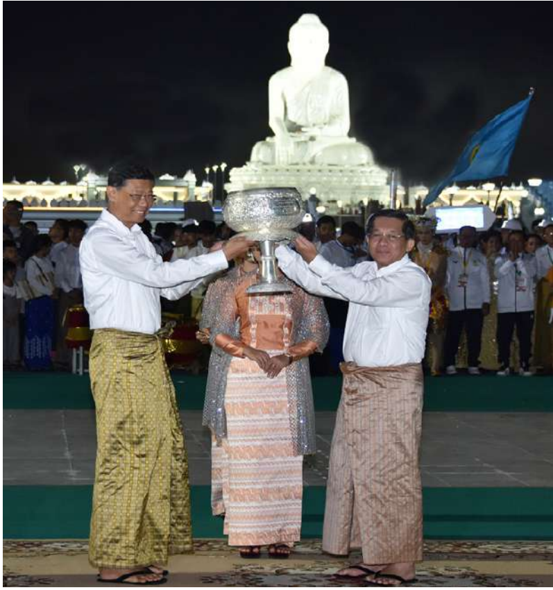
နိုင်ငံတော်စီမံအုပ်ချုပ်ရေးကောင်စီဥက္ကဋ္ဌ နိုင်ငံတော်ဝန်ကြီးချုပ် ဗိုလ်ချုပ်မှူးကြီး မင်းအောင်လှိုင် ညမီးကျည်(ညမီးကြီး) မီးပုံးပျံလွှတ်တင်ပူဇော်ပြိုင်ပွဲတွင် ပထမဆုရရှိသည့် ပို့ဆောင်ရေးနှင့် ဆက်သွယ်ရေးဝန်ကြီးဌာနအသင်းအား ဆုပေးအပ်ခြင်း၊ ဂုဏ်ပြုချီးမြှင့်ငွေနှင့် ဂုဏ်ပြုမှတ်တမ်းလွှာများ ပေးအပ်ချီးမြှင့်စဉ်။