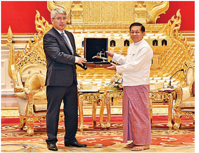
နိုင်ငံတော်စီမံအုပ်ချုပ်ရေးကောင်စီဥက္ကဋ္ဌ နိုင်ငံတော်ဝန်ကြီးချုပ် ဗိုလ်ချုပ်မှူးကြီးမင်းအောင်လှိုင်နှင့် ရုရှားဖက်ဒရေးရှင်းနိုင်ငံ ဘူရားတီးရားပြည်နယ်အကြီးအကဲ ဘူရားတီးရားပြည်နယ်အစိုးရ ဥက္ကဋ္ဌ H. E. Mr. Alexey Sambuevich Tsydenov တို့ အမှတ်တရလက်ဆောင်ပစ္စည်းများ အပြန်အလှန်ပေးအပ်ကြစဉ်။