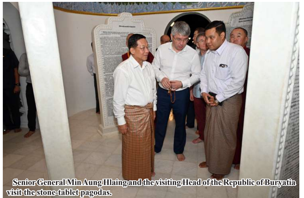
Senior General Min Aung Hlaing and the visiting Head of the Republic of Buryatia visit the stone-tablet pagodas.

Taw Union Territory from 13 to 15 November. During the period, Maha Pathana treatises and religious verses were recited. Moreover, fireworks were displayed with releasing of night flares and Seinnaban hot-air balloons and the second Mathose lotus robe weaving contest for the Buddha image. The precinct of the Buddha image was illuminated with LED blubs. The shops sold MSME products, domestic products, foodstuffs and personal goods as well as Myanmar traditional snacks. Artistes from Fine Arts Department and performer Po Chit theatrical troupe performed entertainment, crowded with pilgrims and people. 100