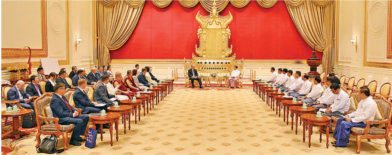
နိုင်ငံတော်စီမံအုပ်ချုပ်ရေးကောင်စီဥက္ကဋ္ဌ နိုင်ငံတော်ဝန်ကြီးချုပ် ဗိုလ်ချုပ်မှူးကြီးမင်းအောင်လှိုင် ရုရှားဖက်ဒရေးရှင်းနိုင်ငံ ဘူရားတီးရားပြည်နယ်အကြီးအကဲ ဘူရားတီးရားပြည်နယ်အစိုးရ ဥက္ကဋ္ဌ H. E. Mr. Alexey Sambuevich Tsydenov ဦးဆောင်သော ကိုယ်စားလှယ်အဖွဲ့ကို လက်ခံတွေ့ဆုံစဉ်။

တွေ့ဆုံပွဲအပြီးတွင် နိုင်ငံတော်စီမံအုပ်ချုပ်ရေးကောင်စီဥက္ကဋ္ဌ နိုင်ငံတော်ဝန်ကြီးချုပ်နှင့် ရုရှားဖက်ဒရေးရှင်းနိုင်ငံ ဘူရားတီးရားပြည်နယ် အကြီးအကဲ ဘူရားတီးရားပြည်နယ်အစိုးရ ဥက္ကဋ္ဌတို့ သည် အမှတ်တရလက်ဆောင်ပစ္စည်းများ အပြန်အလှန်ပေးအပ်ကြပြီး မှတ်တမ်းတင် ဓာတ်ပုံရိုက်ခဲ့ကြသည်။ အဆိုပါ ရုရှားဖက်ဒရေးရှင်းနိုင်ငံ ဘူရားတီးရားပြည်နယ်အကြီးအကဲ ဘူရားတီးရားပြည်နယ်အစိုးရဥက္ကဋ္ဌ ဦးဆောင်သည့် ကိုယ်စားလှယ်အဖွဲ့သည် နိုဝင်ဘာ ၁၂ ရက်တွင် မြန်မာနိုင်ငံသို့ရောက်ရှိခဲ့ပြီး ရောက်ရှိနေချိန်အတွင်း ရန်ကုန်မြို့ရှိ ရွှေတိဂုံစေတီတော်မြတ်ကြီး အပါအဝင် အထင်ကရနေရာများ၊ ဧရာဝတီတိုင်း ဒေသကြီးရှိ ချောင်းသာကမ်းခြေနှင့် အထင်ကရနေရာများသို့ သွားရောက်