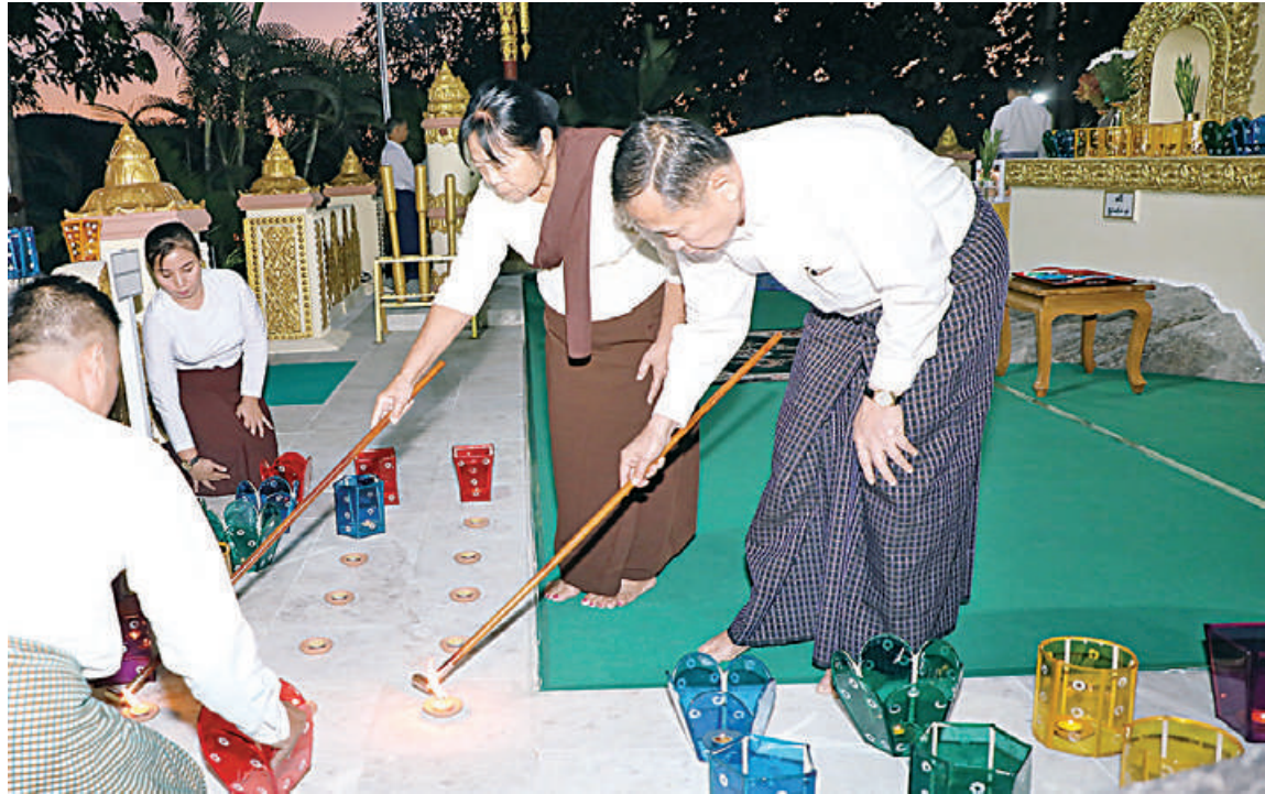
နိုင်ငံတော်စီမံအုပ်ချုပ်ရေးကောင်စီဒုတိယဥက္ကဋ္ဌ ဒုတိယတပ်မတော်ကာကွယ်ရေးဦးစီးချုပ် ကာကွယ်ရေးဦးစီးချုပ်(ကြည်း) ဒုတိယဗိုလ်ချုပ်မှူးကြီးစိုးဝင်းနှင့် ဇနီး ဒေါ်သန်းသန်းနွယ် နေပြည်တော်ကောင်စီနယ်မြေ ဇေယျာသီရိမြို့နယ် ရွှေဘုန်းပွင့်စေတီတော် မြတ်ကြီး၌ ဆီမီးများထွန်းညှိပူဇော်စဉ်။

ကာကွယ်ရေးဦးစီးချုပ်ရုံးမှ အဆင့်မြင့် တပ်မတော်အရာရှိကြီးများနှင့် ဇနီးများ၊ ပြည်ထောင်စုအဆင့်ပုဂ္ဂိုလ်များနှင့် ဇနီး များက စေတီတော်မြတ်အား ဆီမီးများ၊ ရောင်စုံမီးအလှများဖြင့် ထွန်းညှိပူဇော် ခြင်း၊ ပန်း၊ ရေချမ်းကပ်လှူပူဇော်ခြင်း၊ ဆီမီး ၁၀၀၀ ထွန်းညှိပူဇော်ခြင်းများဖြင့် တန်ဆောင်မုန်းလပြည့်(သာမညပလအခါ တော်နေ့) တန်ဆောင်တိုင်မီးထွန်းပွဲတော် ကို ပျော်ရွှင်ကြည်နူးစွာဆင်နွှဲခဲ့ကြသည်။