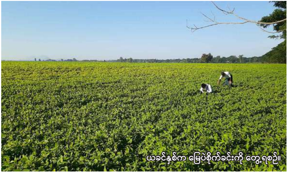
ယခင်နှစ်က မြေပဲစိုက်ခင်းကို တွေ့ရစဉ်။