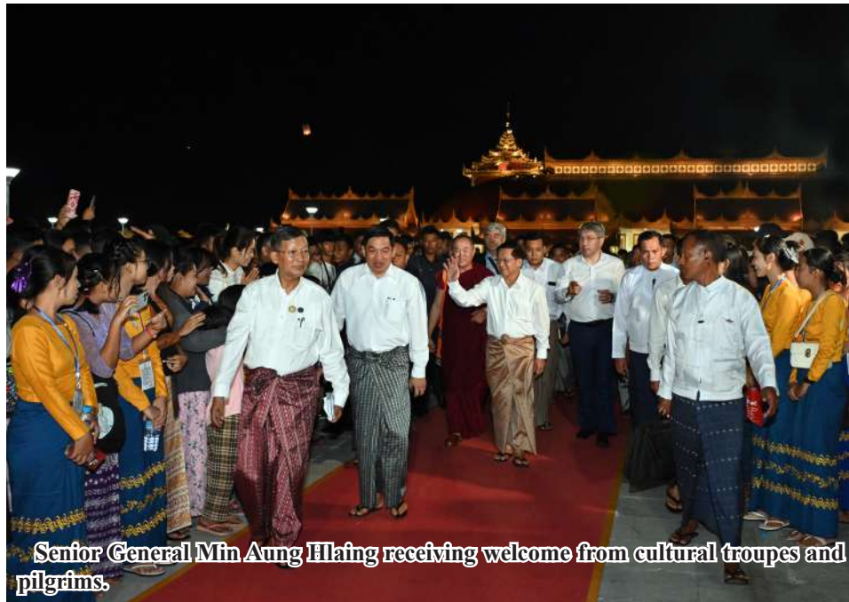
Senior General Min Aung Hlaing receiving welcome from cultural troupes and pilgrims.

Similarly, as it was the Tazaungdaing holidays, in regions and states were moon day of Tazaungmone (Samanaphala Holy Day). crowded with people who were celebrating the full 100