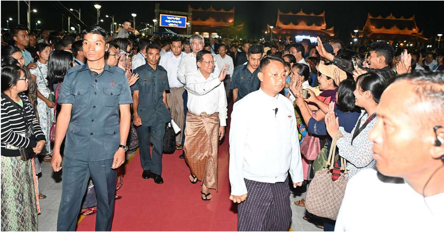
စာမျက်နှာ ၁၇ မှအဆက်

ကောင်စီအဖွဲ့ဝင်များက ဆုဖလား၊ ဂုဏ်ပြုချီးမြှင့်ငွေနှင့် ဂုဏ်ပြုမှတ်တမ်းလွှာများ ပေးအပ်ချီးမြှင့်ကြသည်။