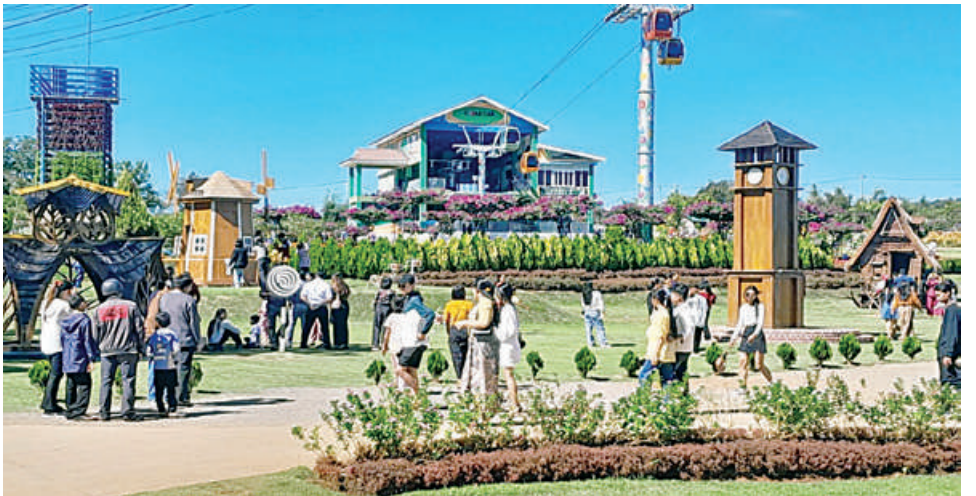
တန်ဆောင်မုန်းလပြည့်(သာမညဖလအခါတော်နေ့)တွင် တိုင်းဒေသကြီးနှင့် ပြည်နယ်အသီးသီးရှိ ဘုရား၊ စေတီပုထိုးများ၊ အပန်းဖြေစခန်းများ၊ ကမ်းခြေများ၊ အများပြည်သူနှင့်သက်ဆိုင်သည့် ပန်းခြံများ၌ လာရောက်အပန်းဖြေကြသူများနှင့် အထူးစည်ကားလျက်ရှိစဉ်။

စာမျက်နှာ ၁၉ မှအဆက် မြတ်ပူဇော်ပွဲနှင့် မီးမျှောပူဇော်ပွဲများကို တော်များတွင်လည်း ပျော်ရွှင်စွာပါဝင် တွေ့ရသည်။ “ဆီမီးတိုင်များ မျက်စိတစ်ဆုံး ပွားများ ကျင်းပခြင်း၊ မသိုးသင်္ကန်းကပ်လှူပူဇော် ဆင်နွှဲကြသူများဖြင့် စည်ကားသိုက်မြိုက် အလားတူ တန်ဆောင်တိုင်ရုံးပိတ် လျက်ကာလဖြစ်သည်နှင့်အညီ တိုင်းဒေသ ရက်ကာလဖြစ်သည်နှင့်အညီ တိုင်းဒေသ ကြီးနှင့် ပြည်နယ်များရှိ အပန်းဖြေစခန်း များ၊ ကမ်းခြေများ၊ အများပြည်သူနှင့် သက်ဆိုင်သည့် ပန်းခြံများ၌ လာရောက် ထွန်းလင်းနေသည်”ဟု ဆိုလိုသည်ဖြစ်၍ ခြင်း၊ ဆွမ်းဆန်တော်လောင်းလှူခြင်းများ ပြုလုပ်ကြရာ အများပြည်သူများစိတ်အေး သုပဒါနပြုကြသူများ၊ ပုံသကူအလှူပြုကြ သူများ၊ ပုံသကူအလှူကောက်ကြသူများ ဖြင့် အေးချမ်းပျော်ရွှင်လျက်ရှိသည်ကို အပန်းဖြေကြသူများနှင့် အထူးစည်ကား လျက်ရှိကာ တန်ဆောင်မုန်းလပြည့်နေ့ အခါသမယကို အများပြည်သူများအနေ ဖြင့် ပျော်ရွှင်ကြည်နူးစွာဆင်နွှဲခဲ့ကြ ကြောင်း သတင်းရရှိသည်။ (၅၀၁)