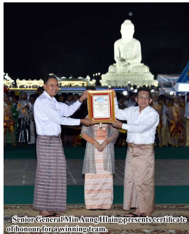
Senior General Min Aung Hlaing presents certificate of honour for a winning team.