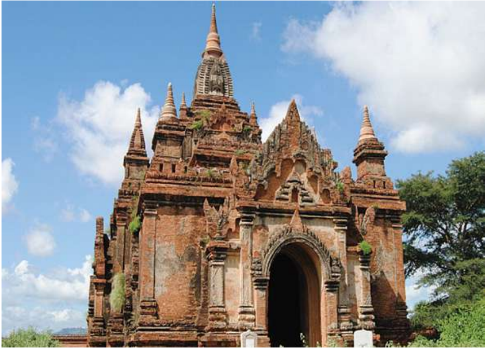
အမတ်ကြီးသိမ်သူရေးထိုးခဲ့သော ကျောက်စာကိုတွေ့ရှိခဲ့သည့် တောင်ဂူနီဘုရား

ကျန်စစ်သားနှင့် အလောင်းစည်သူတို့လက်ထက်က ရှိခဲ့သည့် နိုင်ငံအကျယ်အဝန်းကို ထိန်းသိမ်းပြီး ပိုမိုကျယ်ပြန့်အောင်ထူထောင်နိုင်ခဲ့သည်။