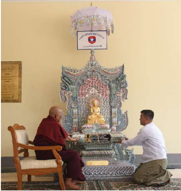
ဆရာတော်ထံ တာဝန်ရှိသူတစ်ဦးက ပဒေသာပင် ဆက်ကပ် လှူဒါန်းစဉ်။