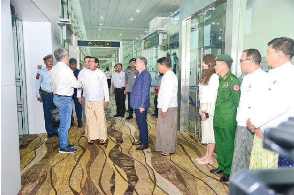
ရန်ကုန် နိုဝင်ဘာ ၁၂ H.E. Mr. Alexey Sambuevich Tsydenov ဦးဆောင်သော ကိုယ်စားလှယ်အဖွဲ့သည် ယနေ့ ညနေပိုင်းတွင် ရန်ကုန်မြို့သို့ ရောက်ရှိကြရာ ရန်ကုန်တိုင်းဒေသကြီးဝန်ကြီးချုပ် ဦးစိုးသိန်းနှင့် (သတင်းစဉ်)