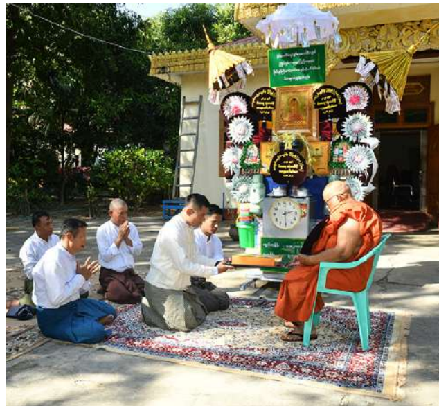
ဆရာတော်ထံ တာဝန်ရှိသူများက ပဒေသာပင် ဆက်ကပ် လှူဒါန်းစဉ်။

စာမျက်နှာ ၁၇ မှအဆက် ပင်စုစုပေါင်း ၉၀၊ ပစ္စည်းတန်ဖိုး နှင့် ၁၃၆၂၉၃၃၉၅ နှင့် ဦးစီးချုပ်ရုံး(ကြည်း) ဝင်းအတွင်းရှိ ငွေသား တန်ဖိုးငွေကျပ် ၁၀၆၉၈၅၀၁၀ ဖြစ်သဖြင့် အနော်ရထာခန်းမမှ ဥပုတသန္တိ စေတီတော်မြတ်ကြီးသို့ မော်တော် ယာဉ်များဖြင့် လှည့်လည်ခဲ့သည်။ ၂၄၃၂၇၈၄၀၅ ကိုလှူဒါန်းခဲ့ကြပြီး ယနေ့ ကျင်းပပြုလုပ်သော သက်ဆိုင်ရာ ဘုန်းတော်ကြီး ကာကွယ်ရေးဦးစီးချုပ်ရုံး(ကြည်း၊ ရုံး၊ ဌာန ရှေး၊ လေ) မိသားစုများ၏ ၂၀၂၄ များအလိုက် မော်တော်ယာဉ် ခုနှစ် မိသားစုမဟာဘုံကထိန် များဖြင့် ဆက်လက်ပို့ဆောင် အလှူတော်မင်္ဂလာ အခမ်းအနား လှူဒါန်းခဲ့ကြကြောင်း သတင်း တွင် ရုံး၊ ဌာနအသီးသီးမှ ပဒေသာ ရရှိသည်။ (၅၀၁)