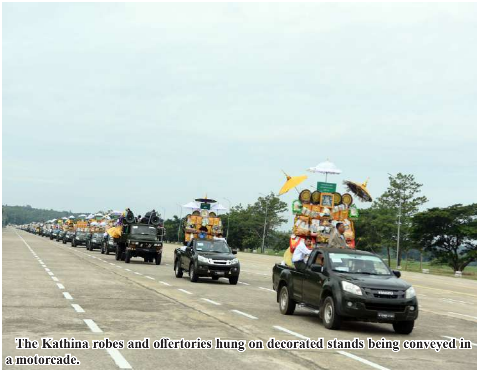
The Kathina robes and offertories hung on decorated stands being conveyed in a motorcade.