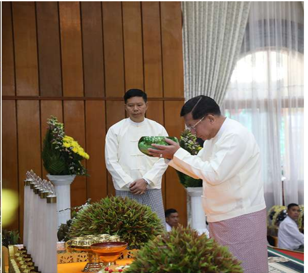
နိုင်ငံတော်စီမံအုပ်ချုပ်ရေးကောင်စီဥက္ကဋ္ဌ တပ်မတော်ကာကွယ်ရေးဦးစီးချုပ် ဗိုလ်ချုပ်မှူးကြီးမင်းအောင်လှိုင် အနော်ရထာခန်းမအတွင်းရှိ ဗုဒ္ဓရုပ်ပွားတော်မြတ်အား ဖူးမြော်ကြည်ညို၍ မြသပိတ်ဆွမ်းတော်နှင့် ပန်း၊ သောက်တော် ရေချမ်း၊ ဆီမီး၊ သစ်သီးတို့ကို ဆက်ကပ်လှူဒါန်းစဉ်။

ဗု ရှေ့ဖုံးမှအဆက် သန်လျင်မြို့ မင်းကျောင်းပထမပြန် စာသင်တိုက် ပမာနနာယက အဂ္ဂမဟာ ပဏ္ဍိတ အဂ္ဂမဟာသဒ္ဓမ္မဇောတိကဇေ ဒေါက်တာ ဘဒ္ဒန္တစန္ဒိမာဘိဝံသ၊ နိုင်ငံတော် သံဃမဟာနာယကအဖွဲ့ အကျိုးတော်ဆောင် မန္တလေးမြို့ မစိုးရိမ်တိုက်သစ် မဟာနာယက ဓမ္မသမိဒ္ဓိကျောင်းဆရာတော် အဂ္ဂမဟာ ပဏ္ဍိတ အဂ္ဂမဟာ သဒ္ဓမ္မဇောတိကဇေ မဟာဓမ္မကထိက ဗဟုဇနဟိတရေ ဘဒ္ဒန္တ ဝါသေဋ္ဌဘိဝံသနှင့် ဥပ္ပါတသန္တိစေတီတော် ဂေါပကအဖွဲ့ ဩဝါဒါစရိယ ဆရာတော်ကြီး များအမှူးပြုသည့် ပင့်ဖိတ်ထားသော ဆရာတော်ကြီး ၂၇ ပါး ကြွရောက်ချီးမြှင့် တော်မူကြပြီး နိုင်ငံတော်စီမံအုပ်ချုပ်ရေး ကောင်စီဥက္ကဋ္ဌ တပ်မတော်ကာကွယ်ရေး