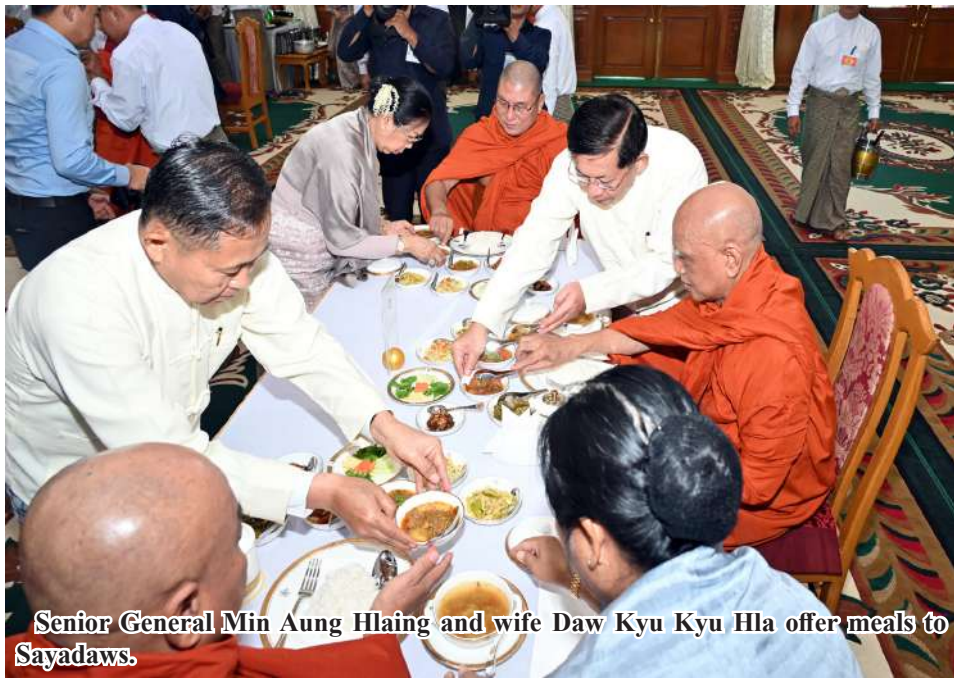
Senior General Min Aung Hlaing and wife Daw Kyu Kyu Hla offer meals to Sayadaws.

After concluding the ceremony with the recitation of