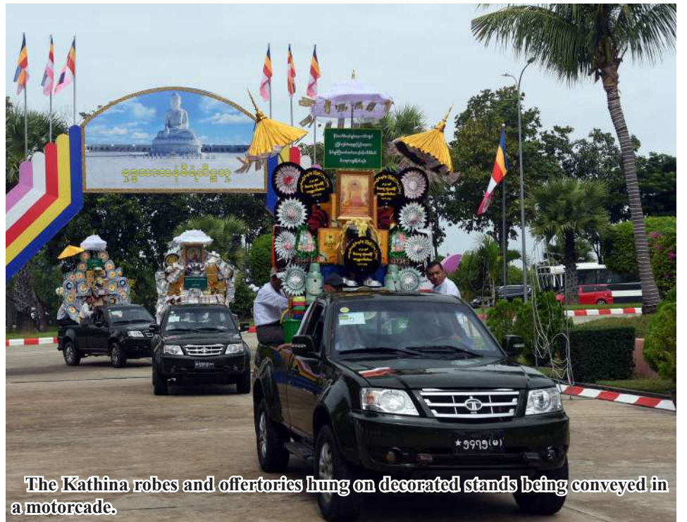
The Kathina robes and offertories hung on decorated stands being conveyed in a motorcade.

From Page 12 Commander-in-Chief (Army) The relevant departments from Anawrahta Hall in the to Uppatasanti Pagoda in a and sections of Office of the compound of the Office of the motorcade on 10 November. Commander-in-Chief (Army,