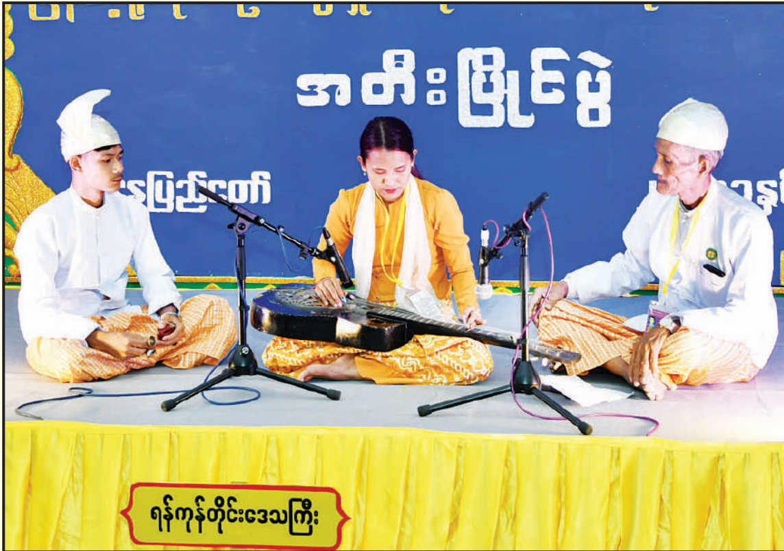
ရန်ကုန်တိုင်းဒေသကြီး