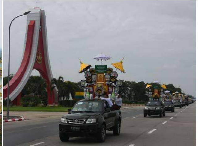
ကာကွယ်ရေးဦးစီးချုပ်ရုံး(ကြည်း၊ ရှေး၊ လေ) မိသားစုများ၏ ၂၀၂၄ ခုနှစ် မိသားစုမဟာဘုံကထိန် အလှူတော်အဖြစ် လှူဒါန်းထားသည့် ပဒေသာပင်များကို ကာကွယ်ရေးဦးစီးချုပ်ရုံး(ကြည်း)ဝင်းအတွင်းရှိ အနော်ရထာခန်းမမှ ဥပုတသန္တိစေတီတော်မြတ်ကြီးသို့ မော်တော်ယာဉ် များဖြင့် လှည့်လည်စဉ်။