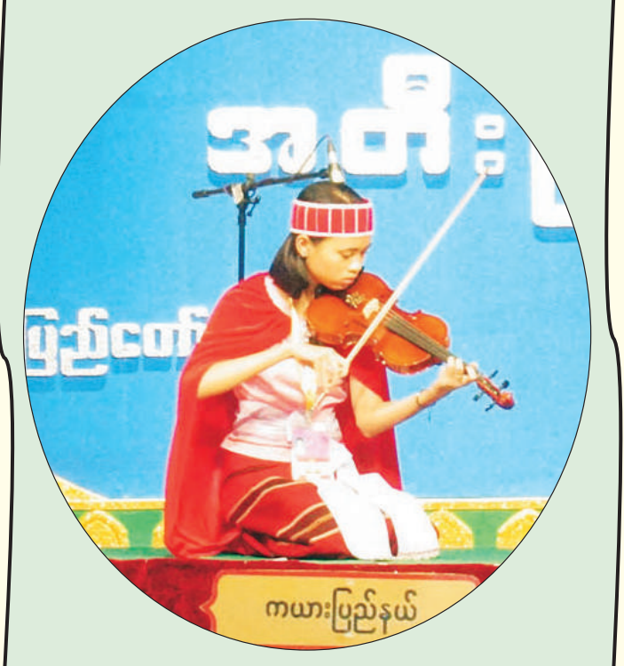
ကယားပြည်နယ်