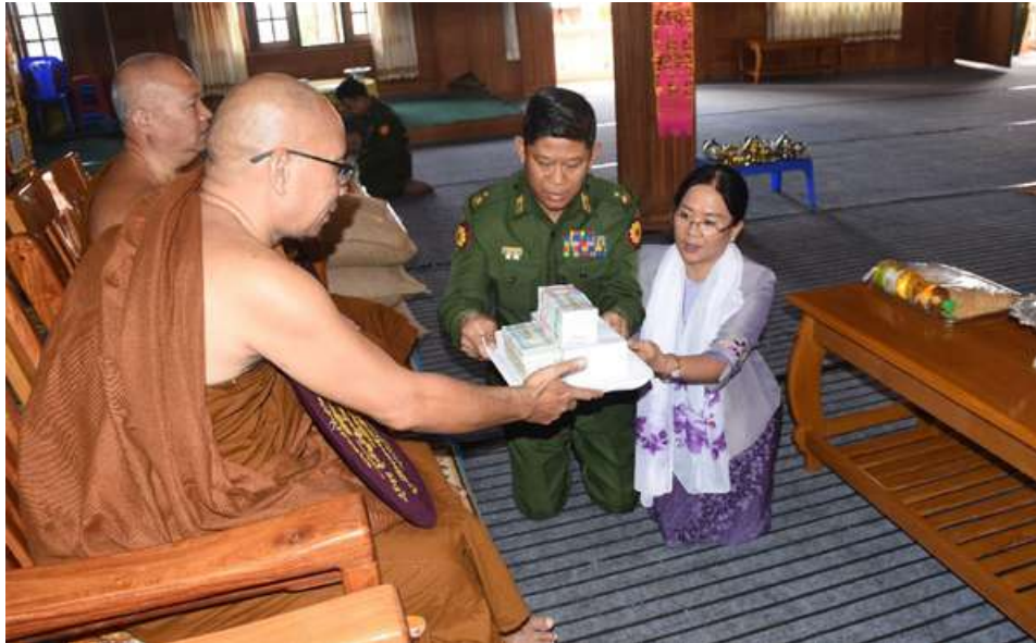
ဆရာတော်ထံ အရှေ့အလယ်ပိုင်းတိုင်းစစ်ဌာနချုပ် တိုင်းမှူး ဗိုလ်ချုပ်မှူးမင်းထွန်း ခိုလှုံမြို့ သီရိမင်္ဂလာကျောင်းတိုက်၌ ဗုဒ္ဓကောလိပ် ငါးထပ်ကျောင်းဆောင်သစ်တည်ဆောက်ရန်အတွက် အလှူငွေများ ဆက်ကပ်လှူဒါန်းစဉ်။

နေပြည်တော် နိုဝင်ဘာ ၁၂ ရှမ်းပြည်နယ်(တောင်ပိုင်း) ခိုလှုံမြို့ရှိ သီရိမင်္ဂလာကျောင်းတိုက်၌ တည်ဆောက်မည့် ဗုဒ္ဓကောလိပ် ငါးထပ်ကျောင်းဆောင်သစ် အလှူငွေလှူဒါန်းခြင်းနှင့် ခိုလှုံမြို့အတွင်းရှိ ဘုန်းတော်ကြီးကျောင်းများသို့ ဆန်၊ ဆီ၊ ကုလားပဲ၊ ကြက်ဥများ လှူဒါန်းပွဲကို ယနေ့နံနက်ပိုင်းတွင် ခိုလှုံမြို့ရှိ သီရိမင်္ဂလာကျောင်းတိုက်၌ ပြုလုပ်ရာ ခိုလှုံမြို့ သီရိမင်္ဂလာကျောင်းတိုက် ဆရာတော်ဘဒ္ဒန္တပညာသီရိအမှူးပြုသော သံဃာတော်များကြွရောက်တော်မူကြပြီး အရှေ့အလယ်ပိုင်းတိုင်းစစ်ဌာနချုပ် တိုင်းမှူး ဗိုလ်ချုပ်မှူးမင်းထွန်းနှင့်အဖွဲ့ဝင်များ တက်ရောက်ကြသည်။