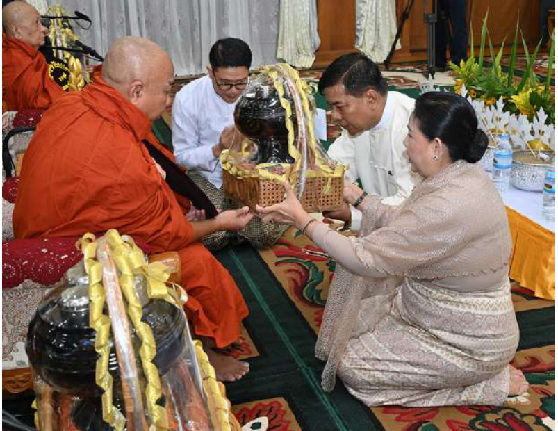
ရေဆင်းကံဦး ကျောင်း ဆရာတော်ထံ နိုင်ငံတော်စီမံ အုပ်ချုပ်ရေး ကောင်စီဝင် ညှိနှိုင်း ကွပ်ကဲရေးမှူး (ကြည်း၊ ရေ လေ) ဗိုလ်ချုပ်ကြီး မောင်မောင်အေးနှင့် ဇနီးတို့က ကထိန်သင်္ကန်းနှင့် လှူဖွယ်ပစ္စည်းများ ဆက်ကပ် လှူဒါန်းစဉ်။