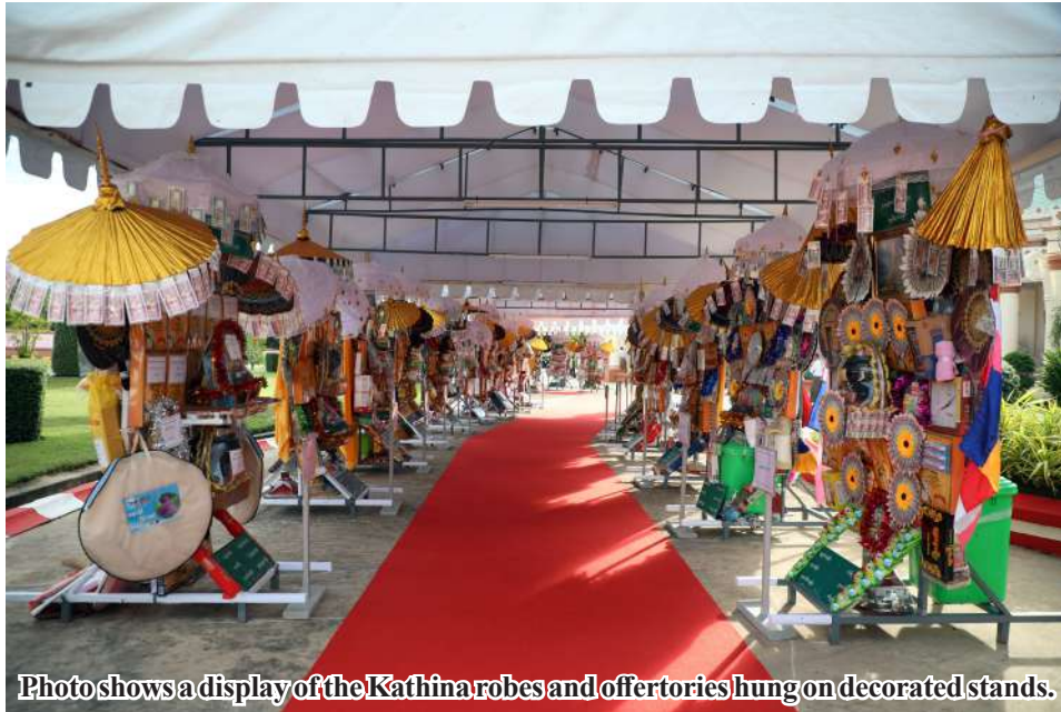
Photo shows a display of the Kathina robes and offertories hung on decorated stands.