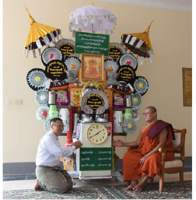
ဆရာတော်ထံ တာဝန်ရှိသူတစ်ဦးက ပဒေသာပင် ဆက်ကပ် လှူဒါန်းစဉ်။

ဘုန်းတော်ကြီး ကျောင်းအသီးသီးသို့ လှူဒါန်းရန် ခင်းကျင်းပြင်ဆင် ထားသည့် ကထိန်လျာ သင်္ကန်း၊လှူဖွယ် ပစ္စည်းများနှင့် ပဒေသာပင်များကို တွေ့ရစဉ်။