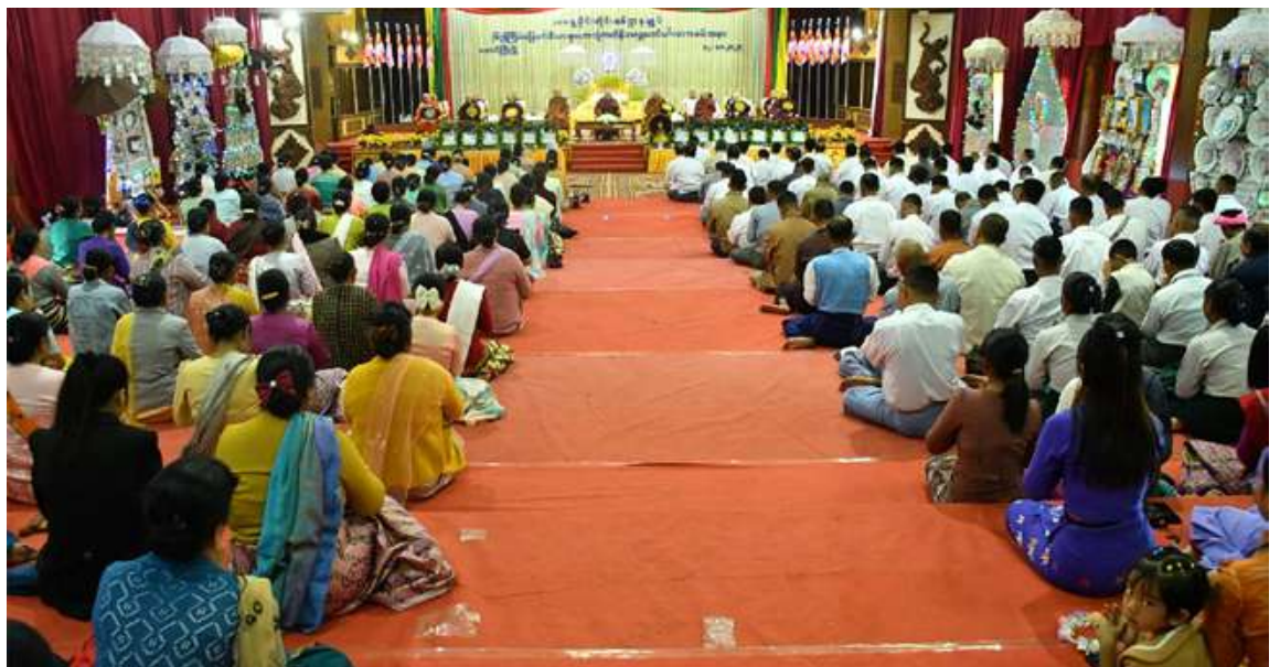
အရှေ့ပိုင်းတိုင်းစစ်ဌာနချုပ်၏ (၆၃)ကြိမ်မြောက် မိသားစုမဟာဘုံကထိန်အလှူတော်မင်္ဂလာ ကျင်းပစဉ်။ ကျော်တန်ဖိုးရှိ ပဒေသာပင် ကိုးခုကို ပဒေသာပင်များကိုသက်ဆိုင်ရာဘုန်းတော် လှူဒါန်းသွားမည်ဖြစ်ကြောင်း သတင်း ဆက်ကပ်လှူဒါန်းနိုင်ခဲ့ပြီး အဆိုပါ ကြီးကျောင်းများသို့ ပို့ဆောင်ဆက်ကပ် ရရှိသည်။ (၅၀၁)

အရှေ့ပိုင်းတိုင်းစစ်ဌာနချုပ်၏ (၆၃) ကြိမ်မြောက် မိသားစုမဟာဘုံကထိန် အလှူတော်မင်္ဂလာတွင် ကထိန်လျာ သင်္ကန်း၊ လှူဖွယ်ပစ္စည်းများနှင့် နဝကမ္မ အလှူငွေ စုစုပေါင်းငွေကျပ် ၂၀၃ သိန်း