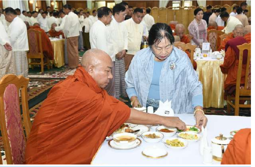
ဆရာတော်၊ သံဃာတော်များအား နိုင်ငံတော်စီမံအုပ်ချုပ်ရေးကောင်စီ ဒုတိယဥက္ကဋ္ဌ ဒုတိယတပ်မတော်ကာကွယ်ရေးဦးစီးချုပ် ကာကွယ်ရေးဦးစီးချုပ်(ကြည်း) ဒုတိယ ဗိုလ်ချုပ်မှူးကြီးစိုးဝင်းနှင့်ဇနီး ဒေါ်သန်းသန်းနွယ်တို့က နေ့ဆွမ်းဆက်ကပ်လှူဒါန်းစဉ်။