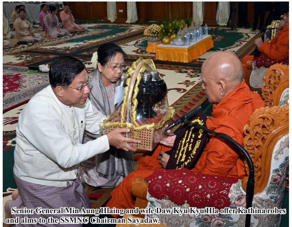
Senior General Min Aung Hlaing and wife Daw Kyu Kyu Hla offer Kathina robes and alms to the SSMNC Chairman Sayadaw.