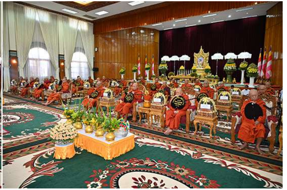
နိုင်ငံတော်သံဃမဟာနာယကအဖွဲ့ဥက္ကဋ္ဌ သန်လျင်မြို့ မင်းကျောင်းပထမပြန်စာသင်တိုက် ပဓာနနာယက အဂ္ဂမဟာပဏ္ဍိတ အဂ္ဂမဟာသဒ္ဓမ္မဇောတိကဇေ ဒေါက်တာ ဘဒ္ဒန္တစန္ဒိမာဘိဝံသထံမှ နိုင်ငံတော်စီမံအုပ်ချုပ်ရေး ကောင်စီဥက္ကဋ္ဌ တပ်မတော်ကာကွယ်ရေးဦးစီးချုပ် ဗိုလ်ချုပ်မှူးကြီးမင်းအောင်လှိုင်၊ဇနီး ဒေါ်ကြူကြူလှနှင့် အခမ်းအနားတက်ရောက်လာကြသည့် ဧည့်ပရိသတ်အပေါင်းတို့က ကိုးပါးသီလခံယူဆောက်တည်ကြစဉ်။