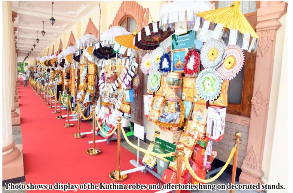
Photo shows a display of the Kathina robes and offertories hung on decorated stands.