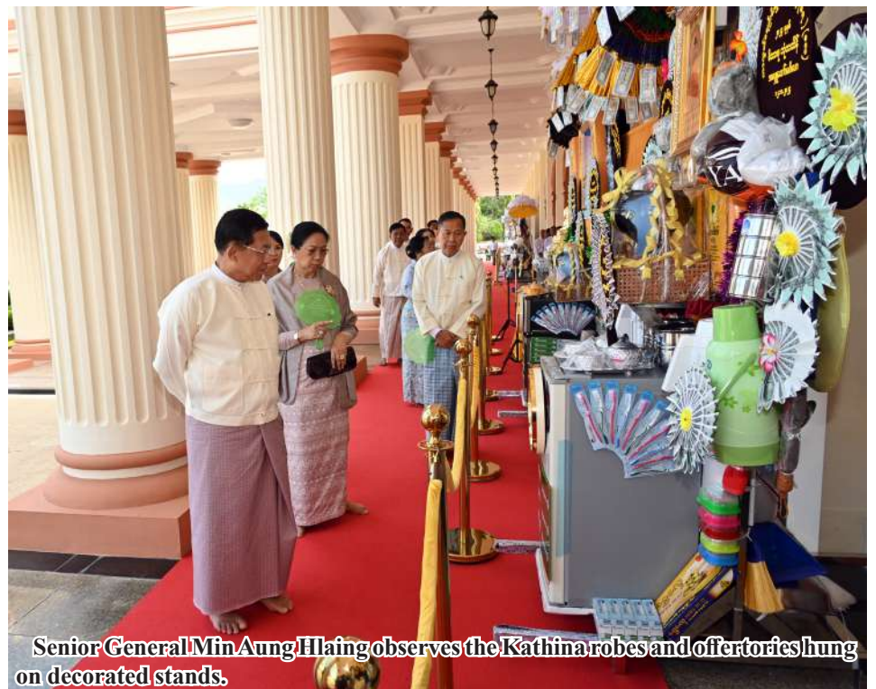
Senior General Min Aung Hlaing observes the Kathina robes and offertories hung on decorated stands.

Chairman Sayadaw. The decorated stands where kathina robes and offertories were hung were conveyed See Page 13