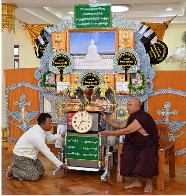
ဆရာတော်ထံ တာဝန်ရှိသူတစ်ဦးက ပဒေသာပင် ဆက်ကပ် လှူဒါန်းစဉ်။