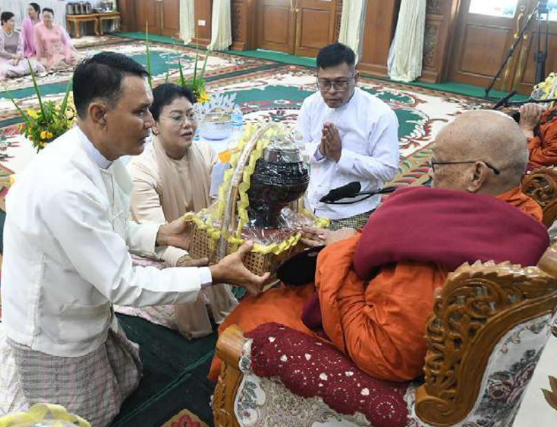
ဆရာတော်ထံ ကာကွယ်ရေး ဦးစီးချုပ်(ရေ) ဒုတိယ ဗိုလ်ချုပ်ကြီးထိန်ဝင်း နှင့်ဇနီးတို့က ကထိန်သင်္ကန်းနှင့် လှူဖွယ်ပစ္စည်းများ ဆက်ကပ် လှူဒါန်းစဉ်။