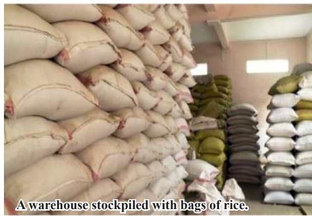
A warehouse stockpiled with bags of rice.

September. Daw Yi Yi Tun commented: "Mawlamyinegyun Township sells agricultural produce including paddy and rice to Yangon market. Kyabyan is included in the premium rice strains. Due to high demand from Yangon market, we sent such kind of paddy. Now, we have many clients. Within a month of September alone, Kyabyan paddy is in high demand." Kyabyan paddy fetches K2.15 million per 100 bas-