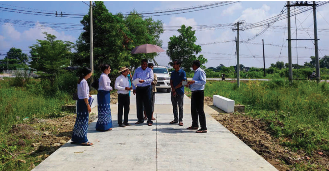
(မြို့ပြ) (တာဝန်)က လုပ်ငန်းဆောင်ရွက် ရှင်းလင်းတင်ပြရာ အင်ဂျင်နီယာချုပ် ဆောင်ရွက်သွားရန်နှင့်လိုအပ်သည်များ ထားရှိမှုအခြေအနေနှင့် ဆက်လက် (မြို့ပြ)က လုပ်ငန်းများ အချိန်မီပြီးစီးရေး၊ ကို မှာကြားခဲ့ကြောင်း သိရသည်။ အောင်မြင်မြတ် (ပြန်/ဆက်)

မှာကြားသည်။ ထို့နောက် အင်ဂျင်နီယာချုပ်(မြို့ပြ) နှင့်အဖွဲ့သည် မအူပင်မြို့နယ် ကျေးလက် လမ်းဖွံ့ဖြိုးရေးဦးစီးဌာနက ၂၀၂၄-၂၀၂၅ ဘဏ္ဍာနှစ် တိုင်းဒေသကြီးငွေလုံးငွေရင်း ခွင့်ပြုရန်ပုံငွေဖြင့်အကောင်အထည်ဖော် ဆောင်ရွက်လျက်ရှိသော ရေလဲကလေး- မလောင်လမ်းကွန်ကရစ်ခင်းခြင်းလုပ်ငန်း၊ ဝိသကြိုကုမ္ပဏီက ဆောင်ရွက်လျက်ရှိ သော မအူပင်ခရိုင်ရုံးအဝင်လမ်းကွန်ကရစ် ခင်းခြင်းလုပ်ငန်းနှင့် မင်းခန့်ဧရာကုမ္ပဏီ က ပြည်ထောင်စုငွေလုံးငွေရင်းခွင့်ပြု ရန်ပုံငွေဖြင့် ဆောင်ရွက်လျက်ရှိသော စည်ပင်ကုန်း-ဘုရားကုန်းလမ်း ကျောက် ချောလမ်းခင်းခြင်းလုပ်ငန်းများကို သွား ရောက် ကွင်းဆင်းကြည့်ရှုစစ်ဆေးရာ မအူပင်ခရိုင်လက်ထောက်ညွှန်ကြားရေး မှူး(မြို့ပြ)နှင့်မအူပင်မြို့နယ်ဦးစီးအရာရှိ