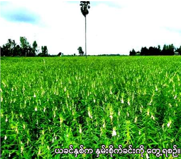
ယခင်နှစ်က နှမ်းစိုက်ခင်းကို တွေ့ရစဉ်။