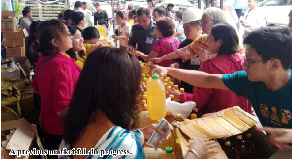
A previous market fair in progress.

Mandalay November 3 The Myanmar Oil Millers' Association has announced that local oil producers will hold a market fair to sell domestically produced edible oils at affordable prices in anticipation of the Tazaungdine Festival. The event will take place at the Yadanabon Super Centre in Mandalay Region. The Myanmar Oil Millers' Association will hold a pre-Tazaungdine domestic cooking oil sale fair on 2 and 3 November at the promotional area of the Yadanabon Super Centre in Mandalay Region. This fair, will be the third