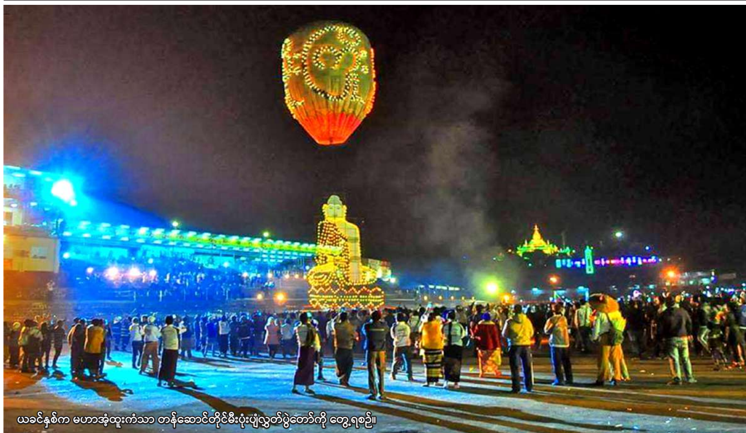
ယခင်နှစ်က မဟာအံ့ထူးကံသာ တန်ဆောင်တိုင်မီးပုံးပျံလွှတ်ပွဲတော်ကို တွေ့ရစဉ်။

စစ်မှန်စည်းကမ်းပြည့်ဝသည့် ပါတီစုံဒီမိုကရေစီစနစ်ခိုင်မာစေရေးနှင့် ဒီမိုကရေစီနှင့် ဖက်ဒရယ် စနစ်ကို အခြေခံသည့် ပြည်ထောင်စုတည်ဆောက်ရေးလုပ်ငန်းစဉ်များကို အရှိန်အဟုန်ဖြင့် ဆက်လက် ဆောင်ရွက်သွားမည်။ ဆန္ဒမဲပေးပိုင်ခွင့်ရှိသူအားလုံး၏အခွင့်အရေးများ နစ်နာမှုမရှိစေရေးနှင့် နည်းလမ်းကျမှန်ကန်မှုရှိ သည့် အထွေထွေရွေးကောက်ပွဲတစ်ရပ်ဖြစ်စေရေးဆောင်ရွက်ခြင်း၊ အရေးပေါ်ကာလဆိုင်ရာပြဋ္ဌာန်း ချက်များနှင့်အညီ ဆောင်ရွက်ခြင်းတို့ပြီးစီးပါက လွတ်လပ်ပြီး တရားမျှတသော ပါတီစုံဒီမိုကရေစီ အထွေထွေရွေးကောက်ပွဲကျင်းပ၍ ထွက်ပေါ်လာသည့်အစိုးရအား နိုင်ငံတော်တာဝန်လွှဲအပ်နိုင်ရေး ဆက်လက်ဆောင်ရွက်သွားမည်။