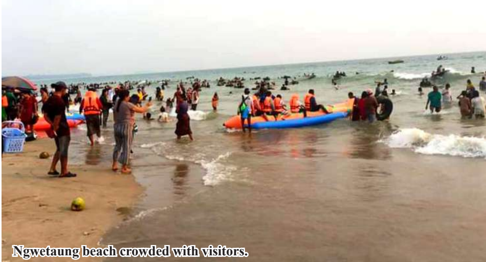
Ngwetaung beach crowded with visitors.