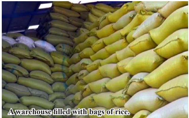
A warehouse filled with bags of rice.