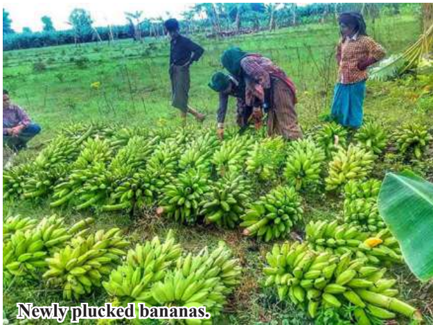
Newly plucked bananas.