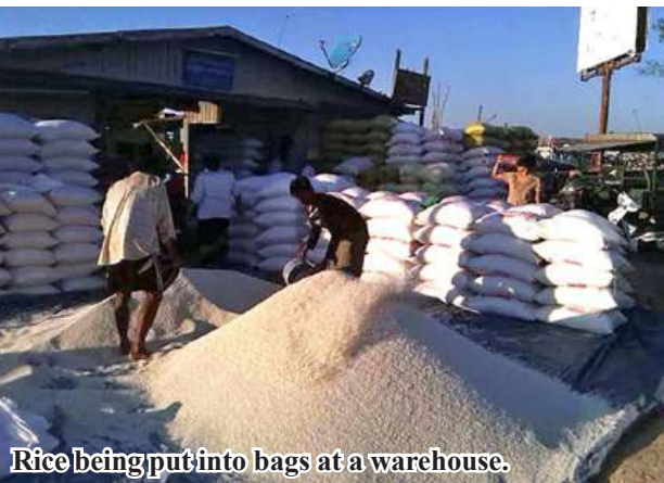
Rice being put into bags at a warehouse.

Bogale October 31 Local businesspersons and farmers from Bogale Township in Ayeyawady Region sent 720,000 bags of 90-day matured rice to Yangon market in September, said Daw Wai Moe, the owner of rice and paddy trading in Bogale Township. They supplied 450,000 bags of same rice to Yangon market in August, compared to 720,000 bags in September. Daw Wai Moe disclosed: "Local businesspersons sell larger bags of rice to Yangon market than August. Despite sending bags of rice to Yangon market, price of rice is stable. Yangon market relies on Bogale Township to purchase 90-day matured rice." At present, 90-day matured rice fetches K110,000 per bag in Yangon market. So, local people who comprise in the production chain of rice are convenient in earning incomes for their livelihoods. Kyaw Kyaw Lin