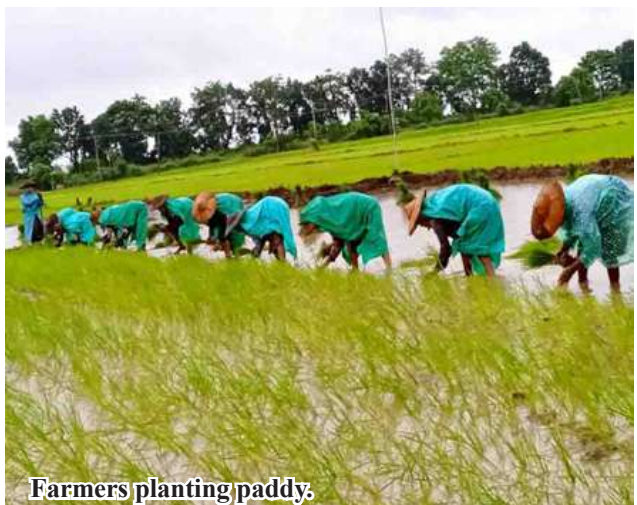
Farmers planting paddy.

Shwethweyin, GW11-GW-1 and other paddy strains in growing monsoon paddy this year. These paddy strains are aligned with the soil and grasp firm market shares. Efforts are being made to produce more than 100 baskets of paddy per acre. Kyaw Kyaw Lin