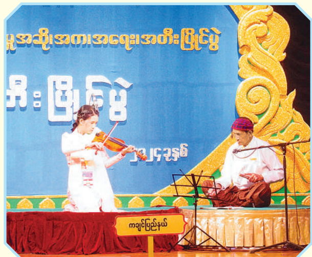
ကချင်ပြည်နယ်