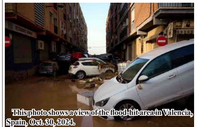
This photo shows a view of the flood-hit area in Valencia, Spain, Oct. 30, 2024.