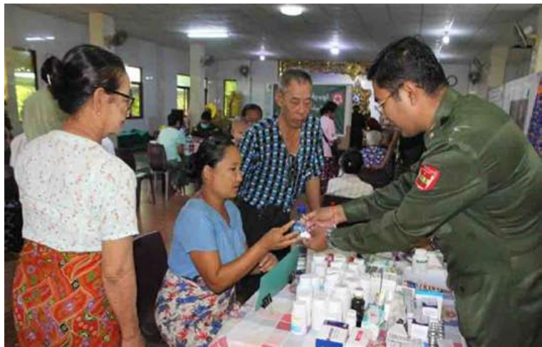
ရန်ကုန်တိုင်းစစ်ဌာနချုပ် နယ်လှည့်ဆေးကုသရေးအဖွဲ့က ဒေသခံပြည်သူများကို ကျန်းမာရေးစောင့်ရှောက်မှုလုပ်ငန်းများ ဆောင်ရွက်ပေးစဉ်။

ကုသရေးအဖွဲ့က သံဃာတော် ၃၅ ပါးတို့ကို ခွဲစိတ်ကုသမှုဆိုင်ရာရောဂါ၊ အရိုးအကြော ရောဂါ၊ အထွေထွေရောဂါတို့နှင့်ပတ်သက် ရှိ လိုအပ်သည့်ကျန်းမာရေးစစ်ဆေးကုသ