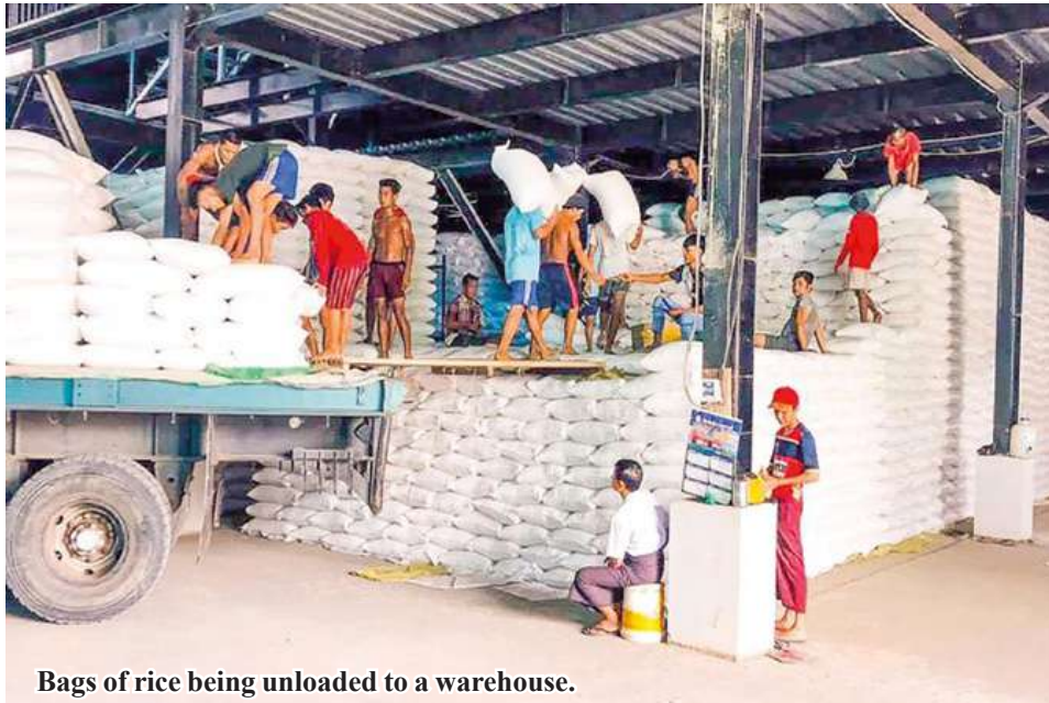
Bags of rice being unloaded to a warehouse.

Pyapon October 31 A total of 65,000 bags of broken rice were shipped from Pyapon Township, Pyapon District, Ayeyawady Region to Yangon during September, said Daw Aye Aye, owner of Pyapon Township's rice trading fair. During August, only up to 50,000 bags of broken rice were transported from