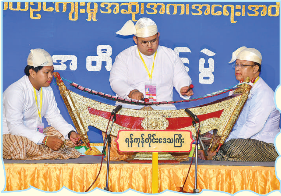
ရန်ကုန်တိုင်းဒေသကြီး