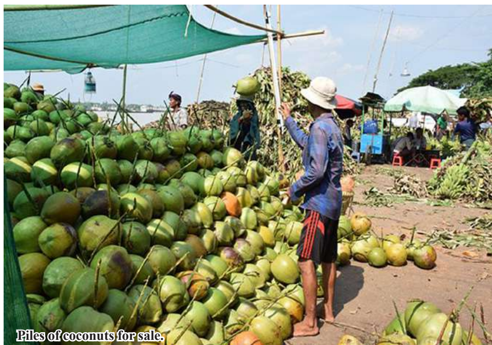
Piles of coconuts for sale.

Mawlamyinegyun October 31 Up to 770,000 coconuts from Mawlamyinegyun Township, Ayeyawady Region were sold to the Yangon market in September, said Daw San Htay, a coconut merchant from Mawlamyinegyun Township's. Only 520,000 coconuts