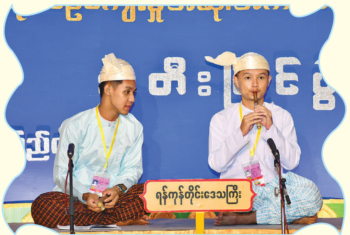
ရန်ကုန်တိုင်းဒေသကြီး