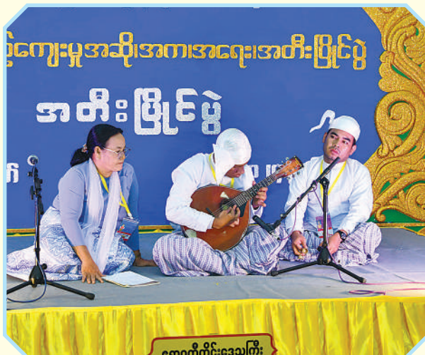
ကရင်တိုင်းဒေသကြီး