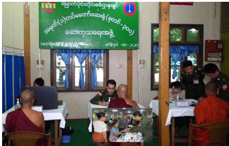
သံဃာတော်များအား မြောက်ပိုင်းတိုင်းစစ်ဌာနချုပ် နယ်လှည့်ဆေးကုသရေးအဖွဲ့က ကျန်းမာရေးစောင့်ရှောက်မှုလုပ်ငန်းများ ဆောင်ရွက်ပေးစဉ်။

နေပြည်တော် အောက်တိုဘာ ၃၁ ဆေးကုသရေးအဖွဲ့က ဆုတောင်းပြည့် ကချင်ပြည်နယ် မြစ်ကြီးနားမြို့ပေါ်ရှိ ကျောင်းတိုက်၌ ကျန်းမာရေးစောင့်ရှောက် သံဃာတော်များကို ယနေ့နံနက်ပိုင်းတွင် မြောက်ပိုင်းတိုင်းစစ်ဌာနချုပ် နယ်လှည့် ထိုသို့ဆောင်ရွက်ပေးရာတွင် ဆေး