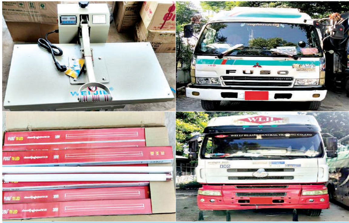
မန္တလေးတိုင်းဒေသကြီး၌ ဖမ်းဆီးရမိမှုကို တွေ့ရစဉ်။

နေပြည်တော် အောက်တိုဘာ ၃၁ တရားမဝင်ကုန်သွယ်မှုတိုက်ဖျက်ရေး ဦးဆောင်ကော်မတီ၏ ကြီးကြပ်ကွပ်ကဲမှုဖြင့် တရားမဝင်ကုန်သွယ်မှုများကို ဥပဒေနှင့်အညီ ထိရောက်စွာတားဆီးအရေးယူနိုင်ရေးဆောင်ရွက်လျက်ရှိသည်။ အောက်တိုဘာ ၃၀ ရက်တွင် ကရင် ပြည်နယ် တရားမဝင်ကုန်သွယ်မှုတိုက်ဖျက်ရေးအဖွဲ့၏ စီမံခန့်ခွဲမှုဖြင့် တာဝန်ကျပူးပေါင်းအဖွဲ့က စစ်ဆေးမှုများ ဆောင်ရွက်ခဲ့ရာ ရဲသာ ယာယီယာဉ်စစ်ကွင်း၌ မော်တော်ယာဉ်တစ်စီးပေါ်မှ တရားဝင်စာရွက်စာတမ်း အထောက်အထားတင်ပြနိုင်ခြင်းမရှိသည့် လုပ်ငန်း သုံးပစ္စည်းနှစ်မျိုး၊ လူသုံးကုန်ပစ္စည်းတစ်မျိုး ခန့်မှန်းတန်ဖိုးငွေကျပ် ၉၄၆၀၀၀ နှင့် အဆိုပါပစ္စည်းများ တင်ဆောင်လာသည့် Nissan UD Truck တစ်စီး ခန့်မှန်းတန်ဖိုးငွေကျပ် ၂၅၀၀၀၀၀ စုစုပေါင်းခန့်မှန်းတန်ဖိုးငွေကျပ် ၃၄၄၆၀၀၀ ကို ဖမ်းဆီးရမိခဲ့ပြီး စာမျက်နှာ ၂၂ ကော်လံ ၁ ☆