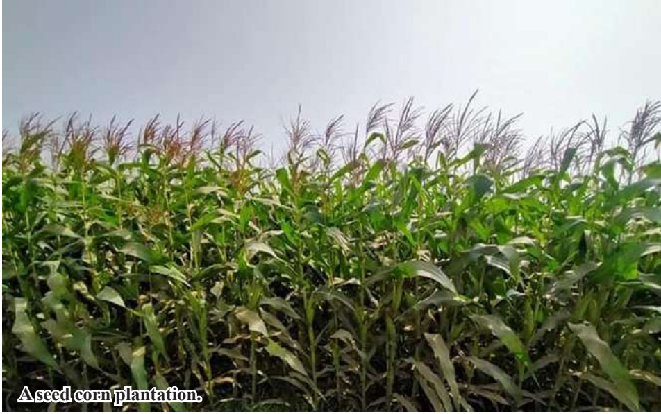
A seed corn plantation.

Myaung October 28 during this year's rain crops planting season, according to the Department of Agriculture for Sagaing District, Sagaing Region A total of 2,162 acres of seed corns have been planted in Myaung Township, Sagaing District, Sagaing Region