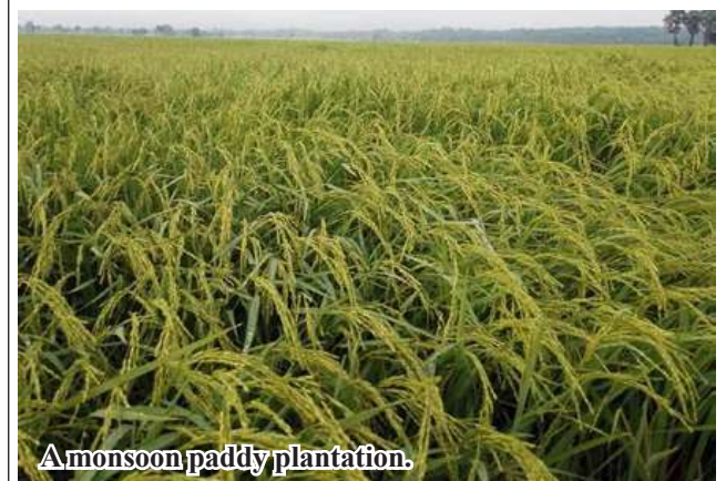
A monsoon paddy plantation.