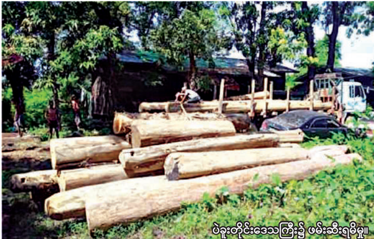
ဝဲနူးတိုင်းဒေသကြီး၌ ဖမ်းဆီးရမိမှု။

နေပြည်တော် အောက်တိုဘာ ၂၈ တရားမဝင်ကုန်သွယ်မှုတိုက်ဖျက်ရေး ဦးဆောင်ကော်မတီ၏ ကြီးကြပ်ကွပ်ကဲမှု ဖြင့် တရားမဝင်ကုန်သွယ်မှုများကို ဥပဒေနှင့်အညီ ထိရောက်စွာတားဆီးအရေးယူ နိုင်ရေးဆောင်ရွက်လျက်ရှိရာ အကောက်ခွန်ဦးစီးဌာန၏ စီမံခန့်ခွဲမှုဖြင့် တာဝန်ကျ ပူးပေါင်းအဖွဲ့က စစ်ဆေးမှုများဆောင်ရွက် ခဲ့ရာ အောက်တိုဘာ ၂၅ ရက်တွင် အေးရှားဝေါလ် ကုန်သေတ္တာစစ်ဆေးရေးစခန်း၌ ကုန်သေတ္တာ ၂၅ လုံးအတွင်းမှ တရားဝင် စာရွက်စာတမ်းအထောက်အထားတင်ပြ နိုင်ခြင်းမရှိသည့် လုပ်ငန်းသုံးပစ္စည်း နှစ်မျိုး၊ စာမျက်နှာ ၁၉ ကော်လံ ၃ ☆