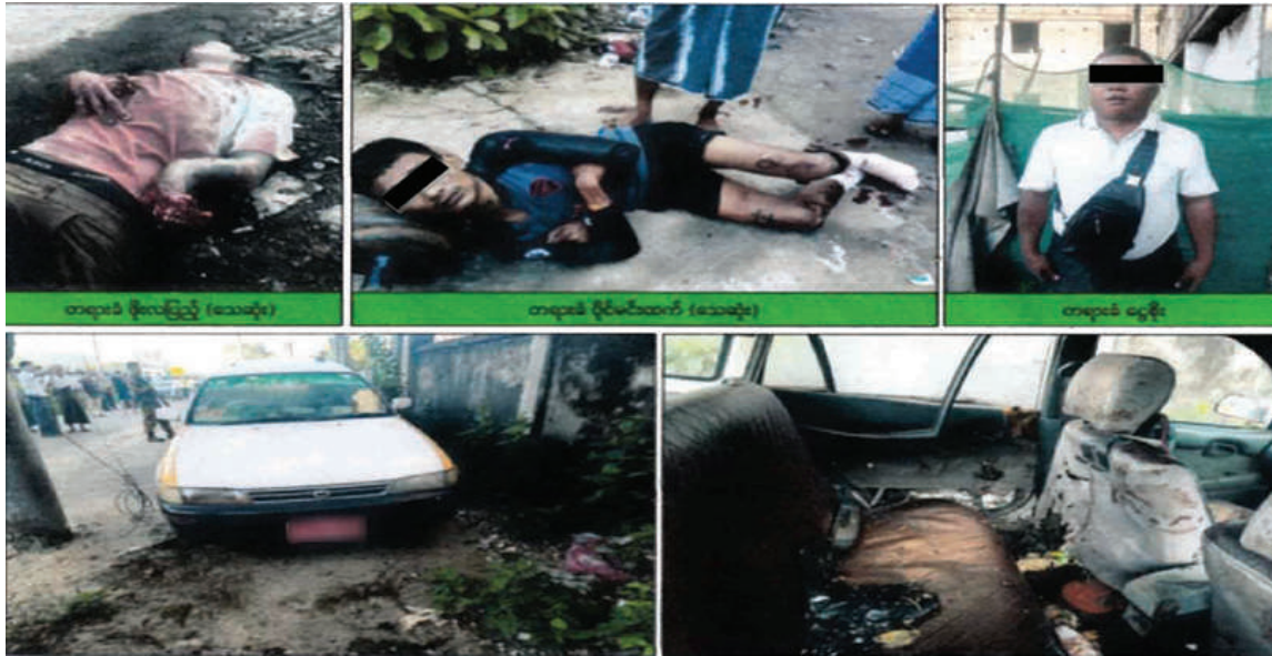
ရန်ကုန်တိုင်းဒေသကြီး ဒဂုံမြို့သစ်(တောင်ပိုင်း)မြို့နယ်၌ မိုင်းထောင်ဖောက်ခွဲရန်လာရောက်စဉ် ပေါက်ကွဲမှုဖြစ်ပွား၍ အမျိုးသားနှစ်ဦးသေဆုံးကာ တစ်ဦးအား လက်လုပ်မိုင်းတစ်လုံးနှင့်အတူ ဖမ်းဆီးရမိမှုမှတ်တမ်းဓာတ်ပုံ။

နေပြည်တော် အောက်တိုဘာ ၂၈ အကြမ်းဖက်သမားများ အနေဖြင့် အေးချမ်းစွာနေထိုင်လျက်ရှိသော ပြည်သူများနှင့် တရားဥပဒေစိုးမိုးရေးအတွက် ပိုင်းဝန်းဆောင်ရွက်နေသော အုပ်ချုပ်ရေးပိုင်းဆိုင်ရာတာဝန်ရှိသူများကို ထိခိုက်ဒဏ်ရာရရှိစေရန်နှင့် အမျိုးပြည်သူသွားလာအသုံးပြုသော လမ်းမကြီးများ၊ ရထား