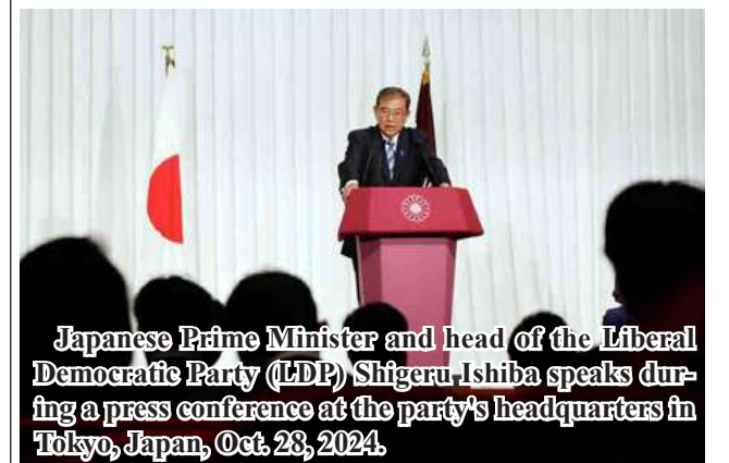
Japanese Prime Minister and head of the Liberal Democratic Party (LDP) Shigeru Ishiba speaks during a press conference at the party's headquarters in Tokyo, Japan, Oct. 28, 2024.

Tokyo October 28 Japanese Prime Minister Shigeru Ishiba on Monday said he will continue as prime minister to lead the government and tackle growing economic and security challenges after his ruling bloc suffered a crushing defeat in the general election the day before.