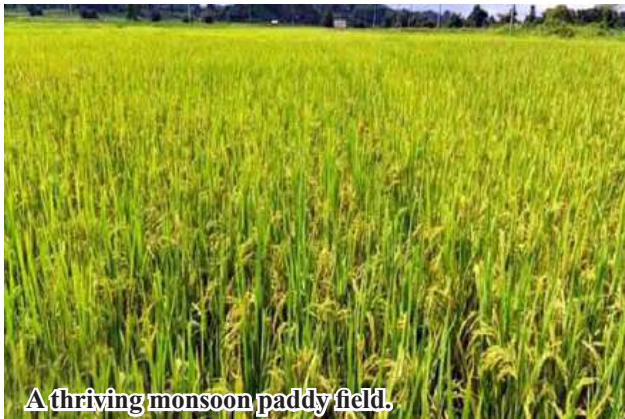
A thriving monsoon paddy field.

During the 2024-2025 rain crops planting season, 40,278 acres of rain rice crops are planned to be planted in Htigyaing Township, and 40,010 acres have been planted since June this year.