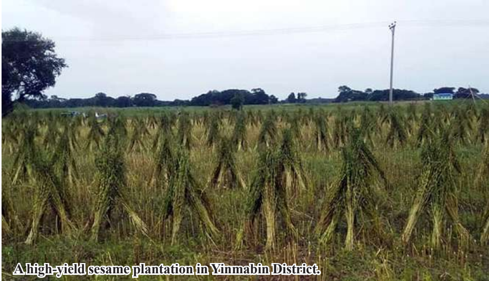
A high-yield sesame plantation in Yinmabin District.

Yinmabin October 28 According to reports from the Department of Agriculture in Yinmabin District, Sagaing Region, the harvest of rain-fed sesame crops, covering 188,434 acres, has been completed this year. During the 2024-2025 planting season, a target of 180,662 acres was set for sesame in Yinmabin District. However, the actual planted area reached