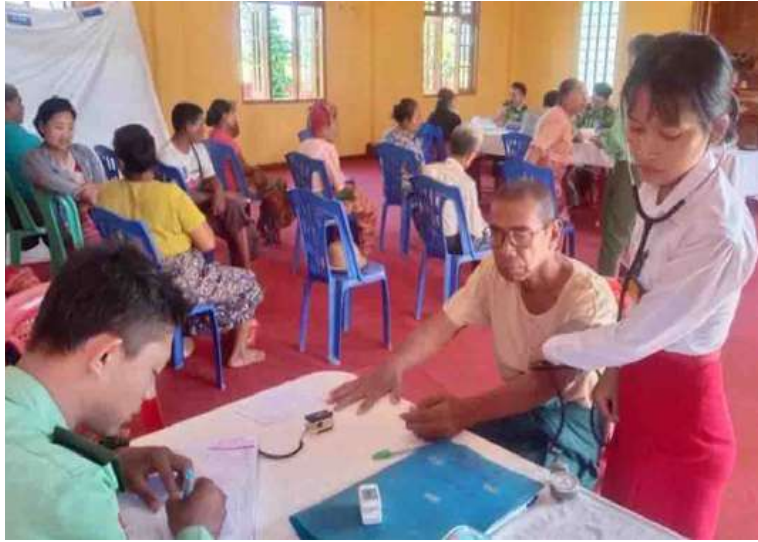
ရန်ကုန်တိုင်းစစ်ဌာနချုပ် နယ်လှည့်ဆေးကုသရေးအဖွဲ့က ဒေသခံပြည်သူများကို ကျန်းမာရေးစောင့်ရှောက်မှုလုပ်ငန်းများ ဆောင်ရွက်ပေးစဉ်။

နေပြည်တော် အောက်တိုဘာ ၂၈ ဥက္ကံကုန်းကျေးရွာမှ ဒေသခံပြည်သူ ရန်ကုန်တိုင်းဒေသကြီး တိုက်ကြီးမြို့ များကို ယနေ့နံနက်ပိုင်းတွင် ရန်ကုန်တိုင်း နယ် ဥက္ကံမြို့ ဥက္ကံကုန်းကျေးရွာအုပ်စု စစ်ဌာနချုပ် နယ်လှည့်ဆေးကုသရေးအဖွဲ့