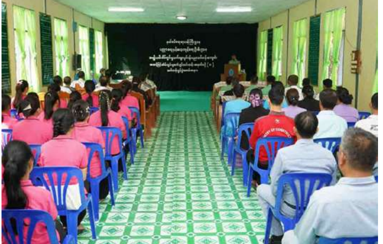
အမျိုးသမီးအိမ်တွင်းမှုသက်မွေးလုပ်ငန်းပညာသင်တန်းကျောင်း၌ အဆင့်မြင့်အိမ်တွင်းမှုစက်ချုပ်သင်တန်းအမှတ်စဉ်(၈) ဖွင့်ပွဲ ကျင်းပစဉ်။

ဒေသဖွံ့ဖြိုးရေးအစီအစဉ်အရ တိုင်းရင်းသားအမျိုးသမီးငယ်များ၏ လူနေမှုဘဝဖွံ့ဖြိုးတိုးတက်လာစေရန်၊ လူမှုစီးပွားဘဝ တိုးတက်မြှင့်တင်မှုအတွက် အမျိုးသမီးများ အိမ်တွင်းမှုသက်မွေးလုပ်ငန်းပညာများကို တတ်မြောက်ကျွမ်းကျင်ပြီး ကိုယ်ပိုင်စီးပွားရေးလုပ်ငန်းများ ထူထောင်နိုင်သည်အထိ လုပ်ကိုင်နိုင်ရန် ရည်ရွယ်၍ နယ်စပ်ရေးရာဝန်ကြီးဌာန ပညာရေးနှင့် လေ့ကျင့်ရေးဦးစီးဌာနက ဖွင့်လှစ်သင်ကြားပေးနေခြင်းဖြစ်ကြောင်းနှင့် ယခုဖွင့်လှစ်သည့် စက်ချုပ်သင်တန်းကို သင်တန်းသူဦးရေ ၃၀ ဖြင့် ၂၀၂၅ ခုနှစ် မတ် ၂၈ ရက်ထိ သင်ကြားပေးသွားမည်ဖြစ်ကြောင်း သတင်းရရှိသည်။ (၅၀၁)