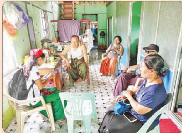
ပြည်မြို့နယ်