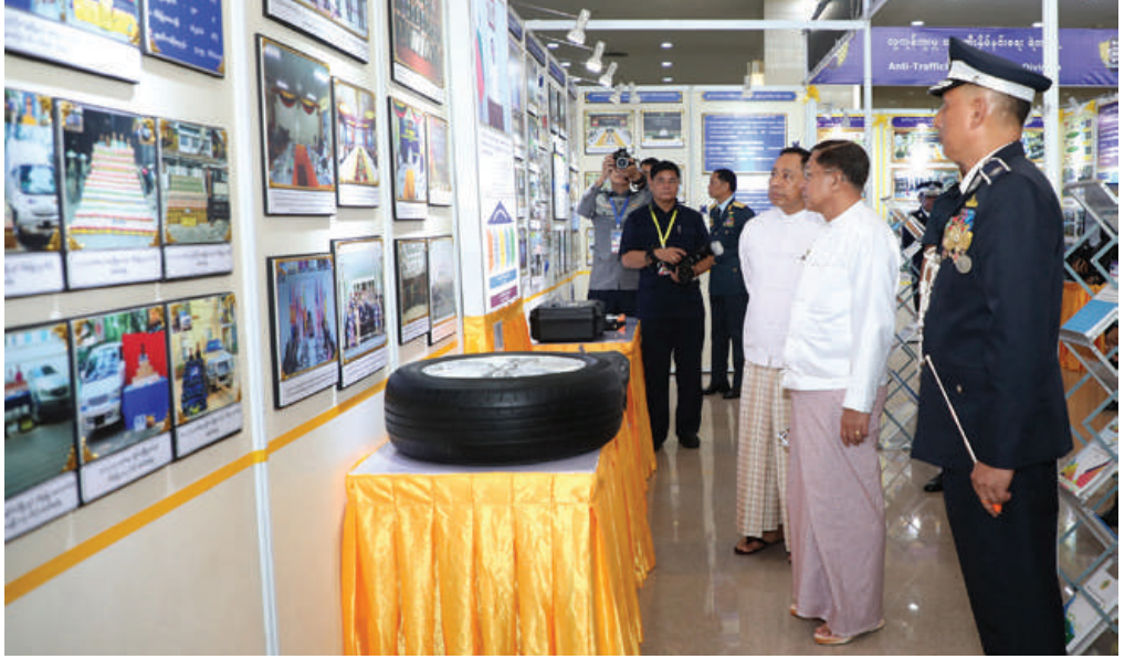
နိုင်ငံတော်စီမံအုပ်ချုပ်ရေးကောင်စီဥက္ကဋ္ဌ နိုင်ငံတော်ဝန်ကြီးချုပ် ဗိုလ်ချုပ်မှူးကြီးမင်းအောင်လှိုင် နှစ် (၆၀)ပြည့် မြန်မာနိုင်ငံရဲတပ်ဖွဲ့နေ့ အထိမ်းအမှတ်ခင်းကျင်းပြသထားသည့်ပြခန်းများကို စိတ်ပါဝင်စားစွာဖြင့် လှည့်လည်ကြည့်ရှုစဉ်။

ကိန်းများတွင် အပြည်ပြည်ဆိုင်ရာအဖွဲ့ (INTERPOL)၊ အာဆီယံရဲအဖွဲ့ (ASEAN-APOL) တို့ဖြင့် ပူးပေါင်းပါဝင်ဆောင်ရွက်လျက်ရှိကြောင်း၊ ဆက်လက်၍လည်း ထိရောက်အောင်မြင်အောင်ဆောင်ရွက်သွားကြရန် မှာကြားလိုကြောင်း။ တပ်ဖွဲ့ဝင်များ၏တာဝန်ထမ်းဆောင်မှုကို နိုင်ငံတော်ကအလေးထား အသိအမှတ်ပြုပြီး မြန်မာနိုင်ငံရဲတပ်ဖွဲ့ဆိုင်ရာစွမ်းရည်သတ္တိနှင့်စွမ်းဆောင်မှုဆိုင်ရာဂုဏ်ထူးဆောင်တံဆိပ်များကို စိစစ်ချီးမြှင့်ပေးလျက်ရှိကြောင်း၊ မိမိကျရာကဏ္ဍတွင် တာဝန်ကျေပွန်စွာထမ်းဆောင်ရင်း အသက်ပေးလျှင်နှင့် ကိုယ်အင်္ဂါအစိတ်အပိုင်း စွန့်လွှတ်သွားခဲ့ရ