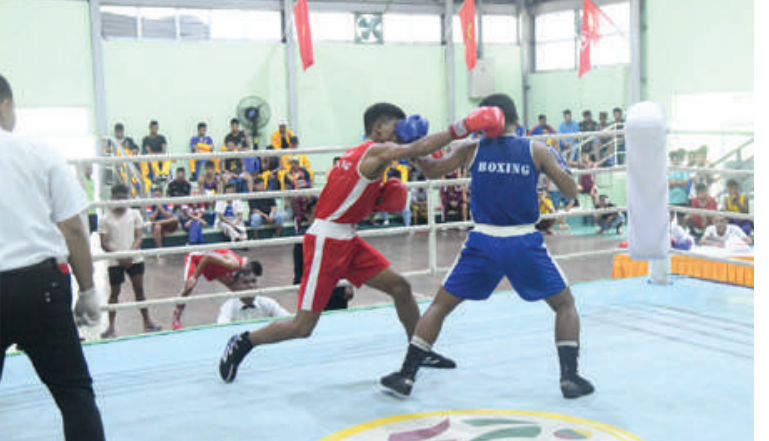
၂၀၂၄ ခုနှစ် တပ်မတော်(ကြည်း၊ ရေ၊ လေ) အားကစားပြိုင်ပွဲများ ပြိုင်ပွဲအမျိုးအစားအလိုက် ယှဉ်ပြိုင်ကစားနေမှုကို တွေ့ရစဉ်။

အသီးသီးပေးအပ်ချီးမြှင့်ကြသည်။ တပ်မတော် ကာကွယ်ရေးဦးစီးချုပ် ဖလား ဘောလုံးပြိုင်ပွဲအဖြစ် ညနေပိုင်း တွင် လေ့ကျင့်ရေးကွင်း(၁)၌ ဒုတိယအဆင့် အုပ်စုပတ်လည် နောက်ဆုံးပွဲစဉ်အဖြစ် အနောက်တောင်တိုင်းစစ်ဌာနချုပ် ကိုယ် စားပြုအသင်းနှင့် ကာကွယ်ရေးဦးစီးချုပ်ရုံး (လေ) ကိုယ်စားပြုအသင်းတို့ ယှဉ်ပြိုင် ကစားခဲ့ရာ နှစ်ဂိုးစီ သရေဖြင့်လည်းကောင်း၊ ဇေယျာသီရိ တပ်မတော်အားကစားကွင်း၌ ဒုတိယအဆင့် အုပ်စုပတ်လည် နောက်ဆုံး ပွဲစဉ်အဖြစ် ရန်ကုန်တိုင်းစစ်ဌာနချုပ် ကိုယ်စားပြုအသင်းနှင့် အလယ်ပိုင်းတိုင်း စစ်ဌာနချုပ် ကိုယ်စားပြုအသင်းတို့ ယှဉ်ပြိုင်ကစားကြရာ ရန်ကုန်တိုင်း စစ်ဌာနချုပ် ကိုယ်စားပြုအသင်းက အလယ်ပိုင်းတိုင်းစစ်ဌာနချုပ် ကိုယ်စားပြု အသင်းကို ငါးဂိုး ဂိုးမရှိဖြင့်လည်းကောင်း အသီးသီးအနိုင်ရရှိခဲ့ကြပြီး အကြိုဗိုလ်လှ ပွဲများသို့ တက်ရောက်ခဲ့ကြသည်။ အကြိုဗိုလ်လှပွဲတွင် ကာကွယ်ရေး