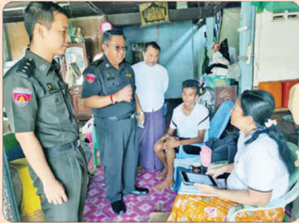
ကော့သောင်းမြို့နယ်