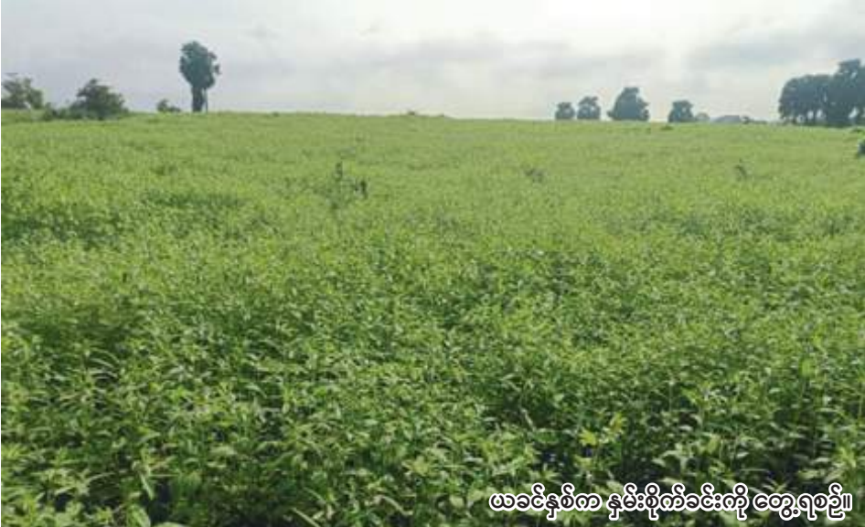
ယခင်နှစ်က နှမ်းစိုက်ခင်းကို တွေ့ရစဉ်။

ကျောက်မြောင်း အောက်တိုဘာ ၁ စစ်ကိုင်းတိုင်းဒေသကြီး ရွှေဘို ခရိုင် ကျောက်မြောင်းမြို့နယ်ခွဲ ၌ ယခုနှစ် ဆောင်းသီးနှံစိုက်ပျိုး ရာသီတွင် ဆောင်းနှမ်း ၁၃၁၂၅ ဧက စိုက်ပျိုးမည်ဖြစ်ကြောင်း ကျောက် မြောင်းမြို့နယ်ခွဲ စိုက်ပျိုးရေးဦးစီး ဌာနမှ သိရသည်။