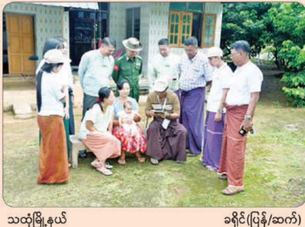
သထုံမြို့နယ်