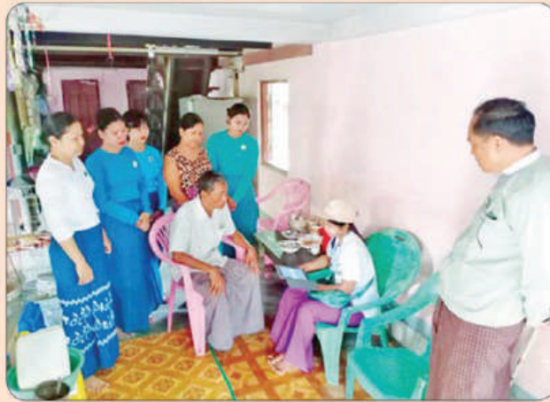
ကျောင်းကုန်းမြို့နယ်