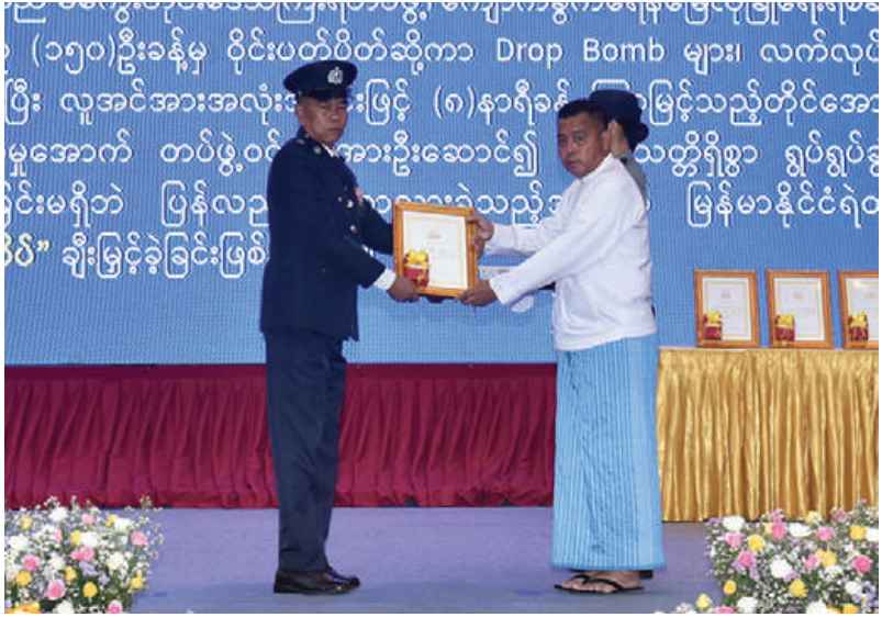
နိုင်ငံတော်စီမံအုပ်ချုပ်ရေးကောင်စီ တွဲဖက်အတွင်းရေးမှူး ဗိုလ်ချုပ်ကြီးရဲဝင်းဦးက စွမ်းရည်သတ္တိဂုဏ်ထူးဆောင်တံဆိပ်ရရှိသူတစ်ဦးအား ဂုဏ်ထူးဆောင်ဆု ပေးအပ်ချီးမြှင့်စဉ်။

ရဲတပ်ဖွဲ့အနေဖြင့် နိုင်ငံပြတ်ကျော်မှုခင်းများကိုတားဆီးနှိမ်နင်းရာတွင် သတင်းလက်ဦးမှ ရယူဆောင်ရွက်နိုင်ရေးအတွက် အိမ်နီးချင်း ငါးနိုင်ငံနှင့်အတူ နယ်စပ်ဆက်ဆံရေးရုံးများ (Border Liaison Offices-BLOs) ကွန်ရက်စနစ်တည်ထောင်ပြီးသတင်းအချက်အလက်များကို အချိန်နှင့်တစ်ပြေးညီ အပြန်အလှန် မျှဝေလှယ်နိုင်ရေးအတွက် BLO အစည်းအဝေးများကိုလည်း အခါအားလျော်စွာ စဉ်ဆက်မပြတ် ကျင်းပပြုလုပ်ဆောင်ရွက်သွားကြရန် မှာကြားလိုကြောင်း။