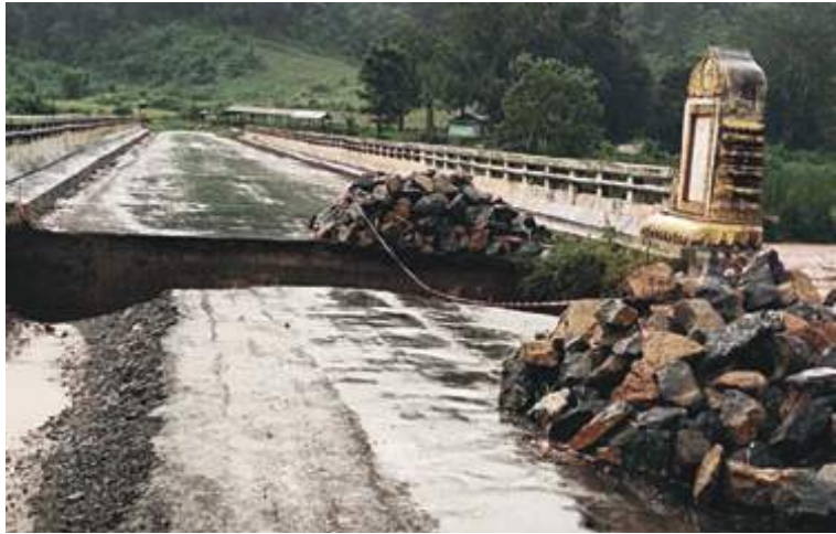
မိုးသည်းထန်စွာရွာသွန်းမှုကြောင့် ရေတိုက်စား၍ပြိုကျပျက်စီးခဲ့သည့် မိုင်းကိုင်း-နမ့်လန်သွားလမ်းပေါ်ရှိ သံကူကွန်ကရစ်တံတားကို တွေ့ရစဉ်။

ကွန်ကရစ်တံတားသည် မွန်းလွဲ ၂ နာရီခန့်တွင် တံတား၏မြောက်ဘက်ခြမ်းရှိချဉ်းကပ်လမ်း အကျယ် ပေ ၃၀၊ အလျား ပေ ၃၀ ရေတိုက်စား၍ ပြိုကျပျက်စီးခဲ့ပြီး ယာဉ်ကြီး/ယာဉ်ငယ်များ ဖြတ်သန်းသွားလာမှုရပ်တန့်ခဲ့ရကြောင်း သိရသည်။ အဆိုပါ ရေတိုက်စားမှုကြောင့် ချဉ်းကပ်လမ်းပျက်စီးခဲ့သည့် သံကူကွန်ကရစ်တံတားကို မိုင်းကိုင်းမြို့နယ် လမ်း/တံတားဦးစီးဌာနမှ ဝန်ထမ်းများနှင့် တာဝန်ရှိသူများက အများပြည်သူများ ဖြတ်သန်းသွားလာနိုင်ရေးအတွက် အမြန်ဆုံး ပြုပြင်ဆောင်ရွက်လျက်ရှိကြောင်း သတင်းရရှိသည်။ (၅၀၁)