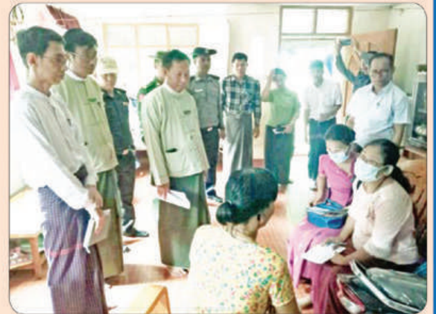
ကျိုက်ထိုမြို့နယ်