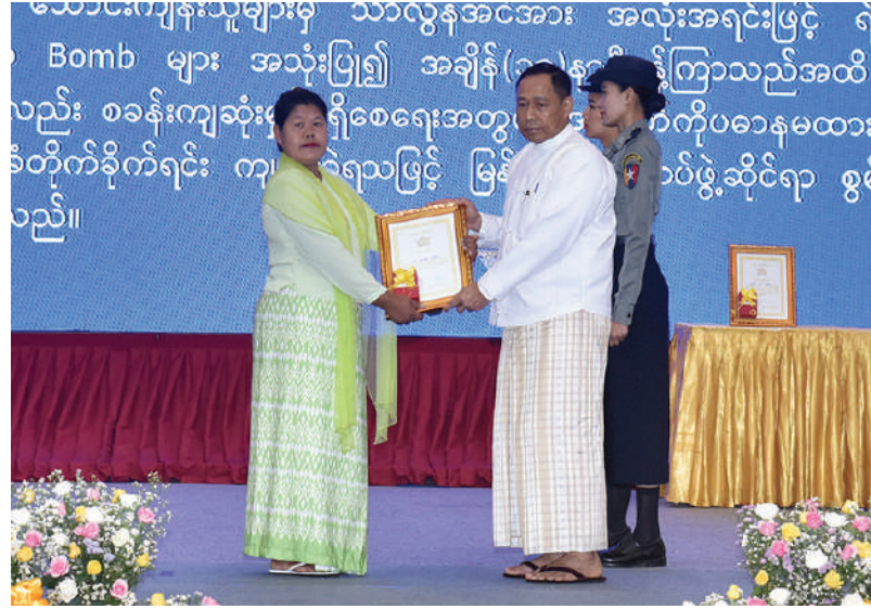
နိုင်ငံတော်စီမံအုပ်ချုပ်ရေးကောင်စီဝင် ပြည်ထဲရေးဝန်ကြီးဌာန ပြည်ထောင်စုဝန်ကြီး ဒုတိယဗိုလ်ချုပ်ကြီးရာပြည့်က စွမ်းရည်သတ္တိဂုဏ်ထူးဆောင်တံဆိပ်ရရှိသူတစ်ဦး၏ မိသားစုဝင်အား ဂုဏ်ထူးဆောင်ဆု ပေးအပ်ချီးမြှင့်စဉ်။

၂၀၂၃ ခုနှစ် အောက်တိုဘာလမှ ၂၀၂၄ ခုနှစ်ဩဂုတ်လထိ မြန်မာနိုင်ငံအတွင်းသို့ နိုင်ငံပေါင်း ၂၈ နိုင်ငံမှတရားမဝင်ဝင်ရောက်လာသည့်နိုင်ငံခြားသား ၅၄၄၃၃ ဦးတို့ကိုလည်း လုပ်ထုံးလုပ်နည်းနှင့်အညီ ပြည်နှင့်ဆောင်ရွက်ခဲ့ပြီးဖြစ်ကြောင်း။ မြန်မာနိုင်ငံအနေဖြင့် မူးယစ်ဆေးဝါးအန္တရာယ်တားဆီးနှိမ်နင်းရေးအတွက် နိုင်ငံတကာအဖွဲ့အစည်းများနှင့်လည်း အနီးကပ်ပူးပေါင်းဆောင်ရွက်လျက်ရှိကြောင်း၊ ၂၀၁၃ ခုနှစ်မှ ၂၀၂၄ ခုနှစ်အတွင်း မူးယစ်ဆေးဝါးတားဆီးနှိမ်နင်းရေး အထူးစစ်ဆင်ရေး “Operation 39/24 (2024)” ကို ဆက်လက်ဆောင်ရွက်လျက်ရှိကြောင်း၊ ၂၀၂၄ ခုနှစ်