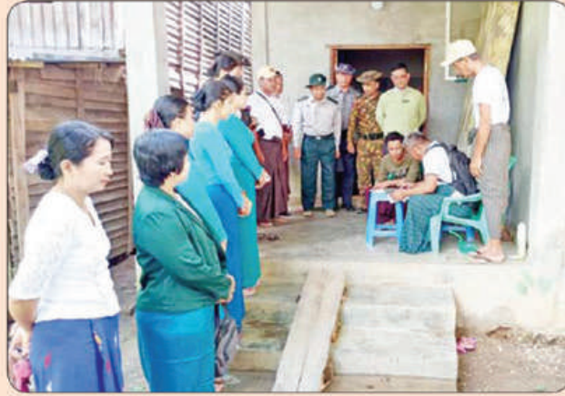
မိုးညိုမြို့နယ်