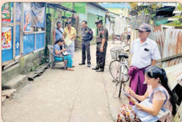
အင်းစိန်မြို့နယ်