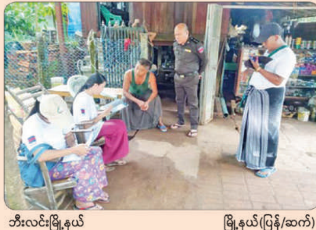
ဘီးလင်းမြို့နယ်