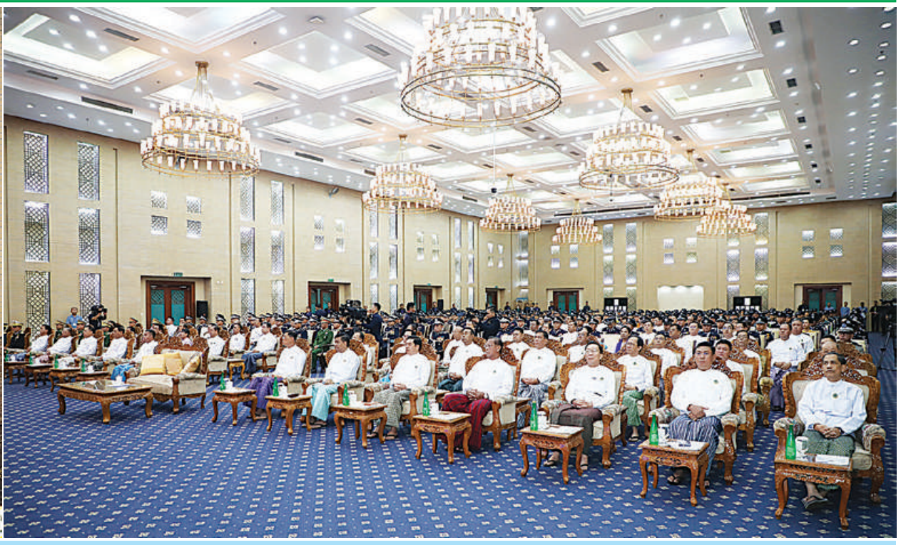
နိုင်ငံတော်စီမံအုပ်ချုပ်ရေးကောင်စီဥက္ကဋ္ဌ နိုင်ငံတော်ဝန်ကြီးချုပ် ဗိုလ်ချုပ်မှူးကြီးမင်းအောင်လှိုင် နှစ်(၆၀)ပြည့် မြန်မာနိုင်ငံရဲတပ်ဖွဲ့ နေ့အခမ်းအနားတွင် မိန့်ခွန်းပြောကြားစဉ်။

နေပြည်တော် အောက်တိုဘာ ၁ ကျင်းပရာ နိုင်ငံတော်စီမံအုပ်ချုပ်ရေးကောင်စီဥက္ကဋ္ဌ ဗိုလ်ချုပ်ကြီးရဲဝင်းဦး၊ ကောင်စီဝင်များပြည်ထောင်စု တော်တိုင်းစစ်ဌာနချုပ် တိုင်းမှူး၊ ဒုတိယဝန်ကြီးများ၊ နှစ်(၆၀)ပြည့် မြန်မာနိုင်ငံရဲတပ်ဖွဲ့ နေ့အခမ်း နိုင်ငံတော်ဝန်ကြီးချုပ် ဗိုလ်ချုပ်မှူးကြီးမင်းအောင်လှိုင် ဝန်ကြီးများနှင့် ပြည်ထောင်စုအဆင့်ပုဂ္ဂိုလ်များ၊ သံတမန်များအပြည်ပြည်ဆိုင်ရာအဖွဲ့အစည်းများမှ အနားကို ယနေ့နံနက်ပိုင်းတွင် နေပြည်တော်ရှိ တက်ရောက်မိန့်ခွန်းပြောကြားသည်။ နေပြည်တော်ကောင်စီဥက္ကဋ္ဌ၊ ကာကွယ်ရေးဦးစီးချုပ် ဖိတ်ကြားထားသောဧည့်သည်တော်များဌာနဆိုင်ရာ မြန်မာအပြည်ပြည်ဆိုင်ရာကွန်ဗင်းရှင်းဗဟိုဌာန-၂၅ အခမ်းအနားသို့ ကောင်စီတွဲဖက်အတွင်းရေးမှူး ရုံးမှ အဆင့်မြင့်တပ်မတော်အရာရှိကြီးများ၊ နေပြည် အကြီးအကဲများ၊ စာမျက်နှာ ၁၆ ကော်လံ ၁ ☆