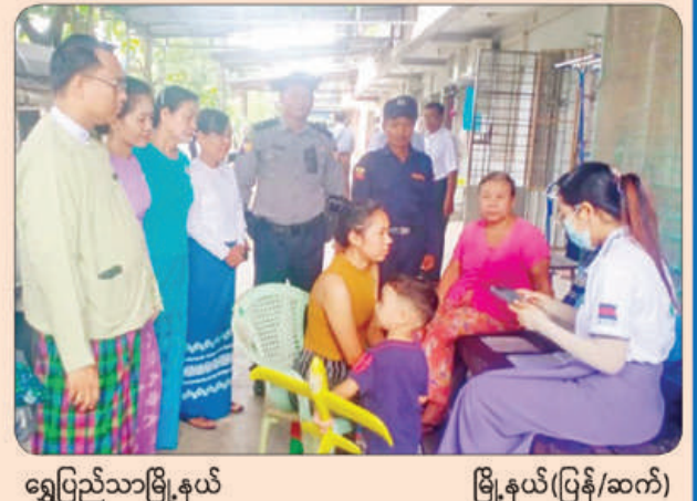
ရွှေပြည်သာမြို့နယ်