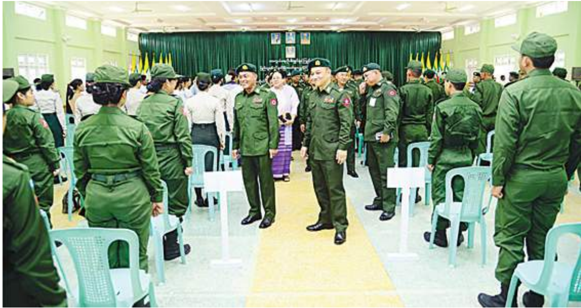
နေပြည်တော်တိုင်းစစ်ဌာနချုပ် တိုင်းမှူး ဗိုလ်ချုပ်စိုးမင်း တက္ကသိုလ်လေ့ကျင့်ရေးတပ်ဖွဲ့ဝင် ဆရာ၊ ဆရာမများနှင့် ကျောင်းသား၊ ကျောင်းသူများကို ရင်းရင်းနှီးနှီးနှုတ်ဆက်စဉ်။

နေပြည်တော် အောက်တိုဘာ ၁ တက္ကသိုလ်များတွင် ပညာသင်ကြား လျက်ရှိသော ကျောင်းသား၊ ကျောင်းသူ များကို အခြေခံစစ်ပညာနှင့် တန်းမြင့် စစ်ပညာသင်တန်းများ သင်ကြားလေ့ကျင့် ပေးခြင်းဖြင့် နိုင်ငံတော်ကာကွယ်ရေး ဆိုင်ရာ အသိအမြင်များရရှိ၍ အနာဂတ် နိုင်ငံတော်၏တာဝန်များ ထမ်းဆောင် သည့်အခါတွင် အထောက်အကူရရှိကာ နိုင်ငံချစ်စိတ်၊ မျိုးချစ်စိတ်များ ပိုမိုရင့်သန် လာစေရန်နှင့် ယုံကြည်ချက်၊ ခံယူချက် မြင့်မားပြီး အရည်အချင်းပြည့်ဝစေရန်