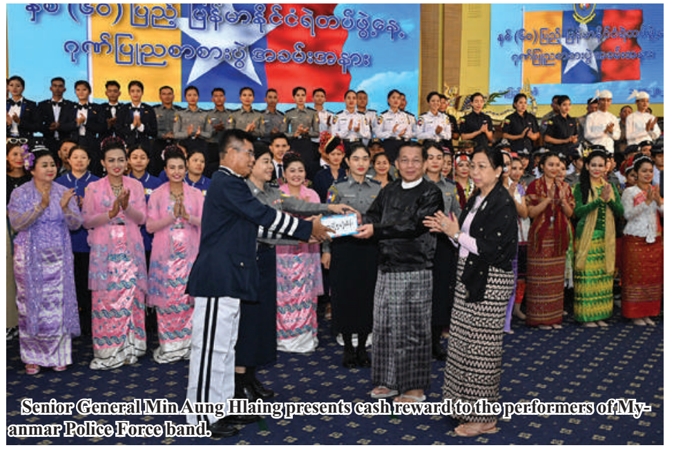
Senior General Min Aung Hlaing presents cash reward to the performers of Myanmar Police Force band.

Before and during the dinner, members from the Myanmar Police Force's band, and the entertainment division artists from the Fire Services Department, and performers from the Fine Arts Department under the Ministry of Religious Affairs and Culture and artists from the Myawady music band under the Directorate of the Public Relations and Psychological Warfare provided musical entertainment.