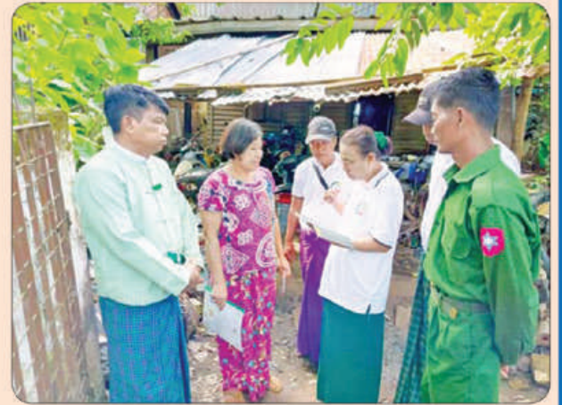
မင်းလှမြို့နယ်