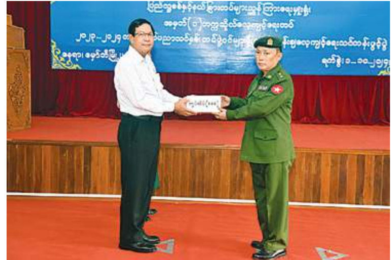
ရန်ကုန်တိုင်းဒေသကြီး ဝန်ကြီးချုပ် ဦးစိုးသိန်း တက္ကသိုလ်လေ့ကျင့်ရေးတပ်ဖွဲ့ဝင် ဆရာ၊ ဆရာမများနှင့် ကျောင်းသား၊ ကျောင်းသူများအတွက် ဂုဏ်ပြုချီးမြှင့်ငွေများ ပေးအပ်စဉ်။

ကို နေပြည်တော်ကောင်စီနယ်မြေတွင် လည်းကောင်း၊ ရန်ကုန်တိုင်းဒေသကြီး မှော်ဘီမြို့နယ်တွင်လည်းကောင်း၊ မန္တလေး တိုင်းဒေသကြီး မြစ်သားမြို့နယ်၊ မိုင်းမော မြို့တွင်လည်းကောင်း၊ ဧရာဝတီတိုင်း ဒေသကြီး ပုသိမ်မြို့တွင်လည်းကောင်း၊ ပဲခူးတိုင်းဒေသကြီး တောင်ငူမြို့တွင် လည်းကောင်း နယ်မြေခံသင်တန်းကျောင်း များ၌ ကျင်းပပြုလုပ်ကြသည်။ အဆိုပါသင်တန်းဖွင့်ပွဲများသို့သက်ဆိုင် ရာ တိုင်းဒေသကြီး ဝန်ကြီးချုပ်များနှင့် တိုင်းစစ်ဌာနချုပ်များမှ တိုင်းမှူးများ၊