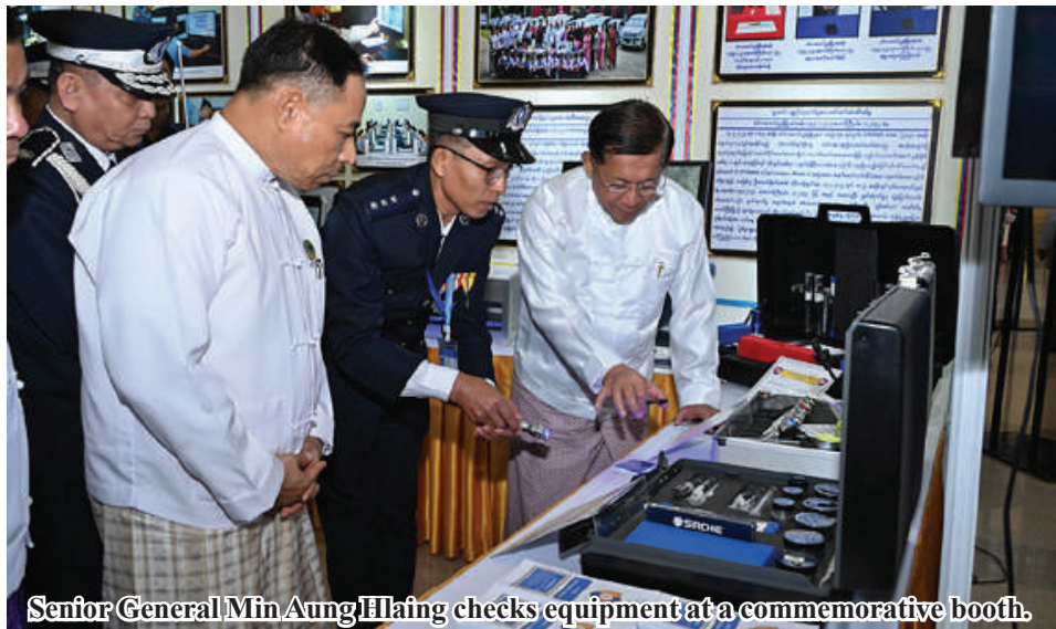
Senior General Min Aung Hlaing checks equipment at a commemorative booth.

The nation recognized the efforts of the anti-human trafficking teams and conferred gallantry performance medals on them. Zeal, perseverance, morale and efforts of police members who sacrificed their lives in the line of duty See Page 14