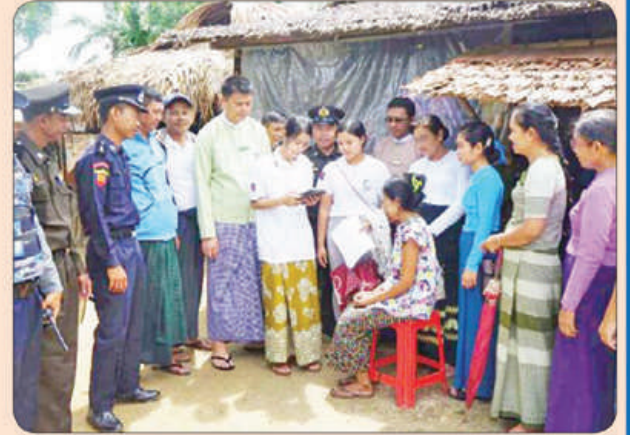
ပုလောမြို့နယ်