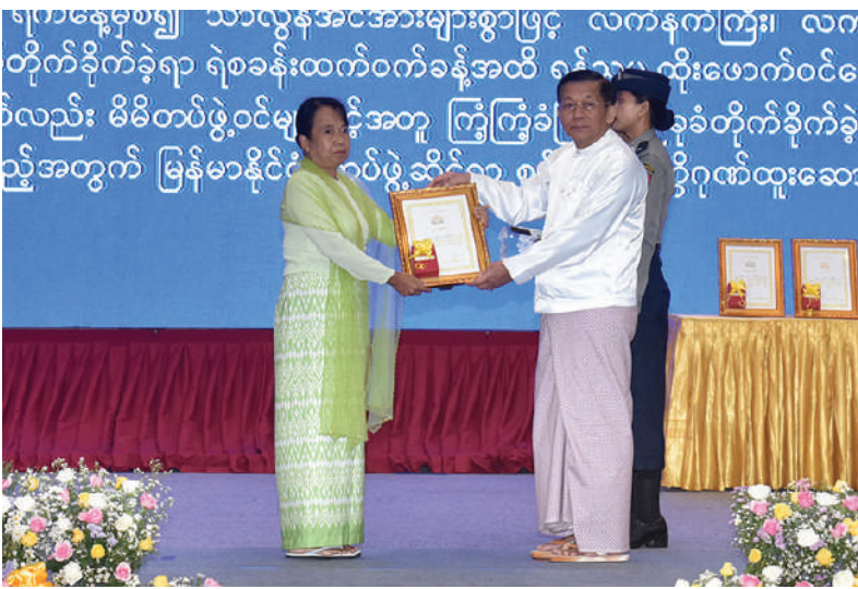
နိုင်ငံတော်စီမံအုပ်ချုပ်ရေးကောင်စီဥက္ကဋ္ဌ နိုင်ငံတော်ဝန်ကြီးချုပ် ဗိုလ်ချုပ်မှူးကြီးမင်းအောင်လှိုင်က စွမ်းရည်သတ္တိဂုဏ်ထူးဆောင်တံဆိပ်ရရှိသူတစ်ဦး၏ မိသားစုဝင်အား ဂုဏ်ထူးဆောင်ဆု ပေးအပ်ချီးမြှင့်စဉ်။

ထို့နောက် နိုင်ငံတော်စီမံအုပ်ချုပ်ရေးကောင်စီဥက္ကဋ္ဌ နိုင်ငံတော်ဝန်ကြီးချုပ် ဗိုလ်ချုပ်မှူးကြီးမင်းအောင်လှိုင်က မိန့်ခွန်းပြောကြားရာတွင် လွတ်လပ်ရေးရပြီးသည့် နောက်ပိုင်းတွင် မြန်မာနိုင်ငံရဲတပ်ဖွဲ့ကိုပြုပြင်ပြောင်းလဲမှုများ ပြုလုပ်ခဲ့ကြကြောင်း၊ တော်လှန်ရေးကောင်စီခေတ် ၁၉၆၄ ခုနှစ်အောက်တိုဘာ ၁ရက်တွင် “ပြည်သူ့ရဲတပ်ဖွဲ့” ဟုခေါ်ဝေါ်သတ်မှတ်ခဲ့ပြီး ရဲတပ်ဖွဲ့နေ့အဖြစ် လည်းစတင်သတ်မှတ်ခဲ့ကြောင်း၊ ၁၉၉၅