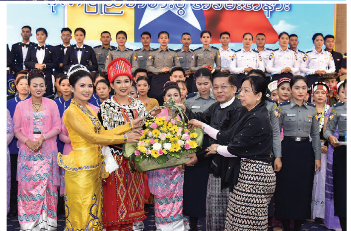
နိုင်ငံတော်စီမံအုပ်ချုပ်ရေးကောင်စီဥက္ကဋ္ဌ နိုင်ငံတော်ဝန်ကြီးချုပ် ဗိုလ်ချုပ်မှူးကြီးမင်းအောင်လှိုင်နှင့်ဇနီး ဒေါ်ကြူကြူလှတို့က သီဆိုတီးမှုတ်ပျော်ဖြေခဲ့ကြသည့် မြန်မာနိုင်ငံရဲတပ်ဖွဲ့ ရဲတီးဝိုင်းနှင့်ဖျော်ဖြေရေးဌာနခွဲကို ဂုဏ်ပြုပန်းခြင်းနှင့် ဂုဏ်ပြုဆုငွေများ ကို ပေးအပ်ချီးမြှင့်စဉ်။ နိုင်ငံရဲတပ်ဖွဲ့ ရဲတီးဝိုင်းနှင့်ဖျော်ဖြေရေးဌာန ဥက္ကဋ္ဌ နိုင်ငံတော်ဝန်ကြီးချုပ်နှင့်ဇနီးတို့က ပေးအပ်ချီးမြှင့်ခဲ့ကြောင်း သတင်း ခွဲကို နိုင်ငံတော်စီမံအုပ်ချုပ်ရေးကောင်စီ ဂုဏ်ပြုပန်းခြင်းနှင့် ဂုဏ်ပြုဆုငွေများကို ရရှိသည်။ (၅၀၁)

တက်ရောက်ကြသည်။ ဦးစွာ နိုင်ငံတော်စီမံအုပ်ချုပ်ရေး ကောင်စီဥက္ကဋ္ဌ နိုင်ငံတော်ဝန်ကြီးချုပ်နှင့် ဇနီး၊ အခမ်းအနား တက်ရောက်လာကြ သူများကို တာဝန်ရှိသူများက ကြိုဆို နှုတ်ဆက်ကြသည်။ ထို့နောက် နိုင်ငံတော်စီမံအုပ်ချုပ်ရေး ကောင်စီဥက္ကဋ္ဌ နိုင်ငံတော်ဝန်ကြီးချုပ်နှင့် ဇနီး၊ အခမ်းအနား တက်ရောက်လာကြ သူများသည် ဂုဏ်ပြုညစာကို အတူတကွ သုံးဆောင်ကြသည်။ ဂုဏ်ပြုညစာ မသုံးဆောင်မီနှင့် သုံးဆောင်နေစဉ်အတွင်း မြန်မာနိုင်ငံ ရဲတပ်ဖွဲ့ ရဲတီးဝိုင်းနှင့် ဖျော်ဖြေရေးဌာနခွဲမှ တပ်ဖွဲ့ဝင်များ၊ မီးသတ်ဦးစီးဌာနမှ အနုပညာရှင်များ၊ သာသနာရေးနှင့် ယဉ်ကျေးမှုဝန်ကြီးဌာန အနုပညာဦးစီး ဌာနမှ အနုပညာရှင်များ၊ ပြည်သူ့ဆက်ဆံ ရေးနှင့် စိတ်ဓာတ်စစ်ဆင်ရေးညွှန်ကြားရေး များရုံး ကွပ်ကဲမှုအောက် မြဝတီတေးဂီတ အဖွဲ့မှ အနုပညာရှင်များက တေးသံသာ များဖြင့် သီဆိုကပြပျော်ဖြေကြသည်။ ဂုဏ်ပြုညစာ သုံးဆောင်အပြီးတွင် သီဆိုတီးမှုတ်ပျော်ဖြေခဲ့ကြသည့် မြန်မာ