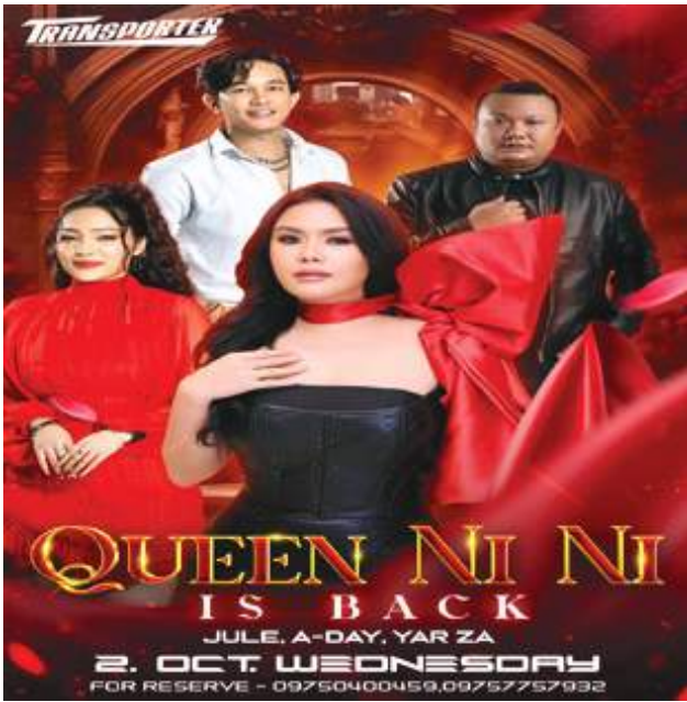
သိရသည်။ "မဆုရတာကြာပြီဖြစ်တဲ့ နီနီ တော့ သီချင်းတွေတင်ကြီးဆိုဖြစ်

ရန်ကုန် အောက်တိုဘာ ၁ တေးသံရှင် နီနီခင်ဇော်၏ တစ်ကိုယ်တော်တေးဂီတဖျော်ဖြေပွဲကို အောက်တိုဘာ ၂ ရက်တွင် ရန်ကုန်တိုင်းဒေသကြီး တောင်ဥက္ကလာပမြို့နယ်ရှိ The Transporter ၌ ပြုလုပ်မည်ဖြစ်ကြောင်း တေးသံရှင် နီနီခင်ဇော်က ပြောပြ၍ သိရသည်။ နိုင်ငံကျော်အမျိုးသမီးတေးသံရှင်တစ်ဦးဖြစ်သည့် တေးသံရှင် နီနီခင်ဇော်၏ တစ်ကိုယ်တော် တေးဂီတဖျော်ဖြေမှုများကို The Transporter တွင် အောက်တိုဘာ ၂ ရက် ညပိုင်းတွင် ပြုလုပ်သွားမည်ဖြစ်ပြီး Transporter Music Band တေးဂီတအဖွဲ့က တီးခတ်ပေးသွားမည်ဖြစ်ကြောင်း