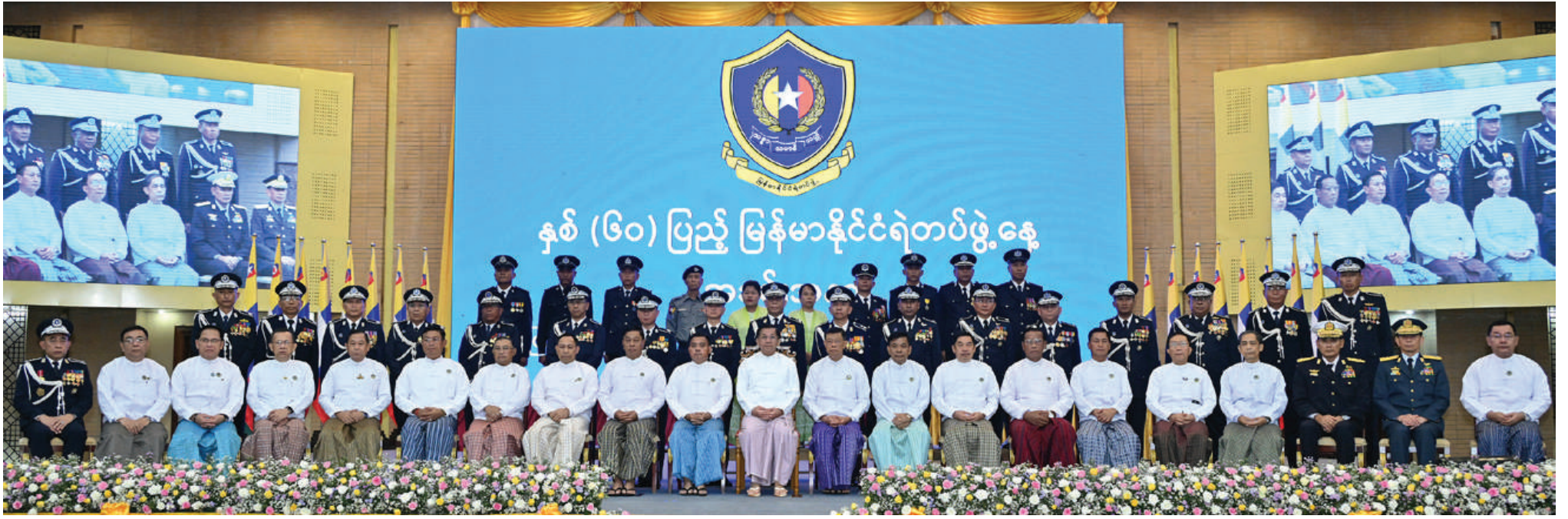
နိုင်ငံတော်စီမံအုပ်ချုပ်ရေးကောင်စီဥက္ကဋ္ဌ နိုင်ငံတော်ဝန်ကြီးချုပ် ဗိုလ်ချုပ်မှူးကြီးမင်းအောင်လှိုင် အခမ်းအနားတက်ရောက်လာကြသူများနှင့်အတူ စုပေါင်းမှတ်တမ်းတင်ဓာတ်ပုံရိုက်စဉ်။

ဇန်နဝါရီ ၁ ရက်မှ ဩဂုတ် ၃၁ ရက်ထိ မြန်မာတစ်နိုင်ငံလုံး မူးယစ်ဆေးဝါးဖမ်းဆီးရမိမှု အနေဖြင့်အမှုပေါင်း ၃၈၃၂ မှု၊ တရားခံ ၅၂၈၆ ဦး စုစုပေါင်းတန်းဖိုးငွေကျပ်ဘီလီယံ ၇၅၀ ကျော်ရှိသည့်မူးယစ်ဆေးဝါးနှင့် မူးယစ်ဆေးဝါးချက်လုပ်ရာတွင်အသုံးပြုသည့်ဆက်စပ်ပစ္စည်းများကိုဖမ်းဆီးအရေးယူနိုင်ခဲ့ကြောင်း။ မြန်မာနိုင်ငံအနေဖြင့် လူကုန်ကူးမှုများကိုထိရောက်စွာအရေးယူနိုင်ရန် ၂၀၂၂ ခုနှစ် ဇွန် ၁၆ ရက်တွင် လူကုန်ကူးမှုတားဆီးနှိမ်နင်းရေးဥပဒေသစ်ကိုပြဋ္ဌာန်းပေးခဲ့ကြောင်း၊ ၂၀၂၃ ခုနှစ် အောက်တိုဘာလမှ ၂၀၂၄ ခုနှစ် ဩဂုတ်လထိ လူကုန်ကူးမှု ၂၇ မှုမှတရားခံကျားဦးရေ ၃၀၊ မ ၆၆ ဦး စုစုပေါင်း ၉၆ ဦး အရေးယူနိုင်ခဲ့ပြီး လူကုန်ကူးခံရသူ ကျား ငါးဦး၊ မ ၄၄ ဦး စုစုပေါင်း ၄၉ ဦးကိုကယ်တင်နိုင်ခဲ့ကြောင်း၊ ဒေသတွင်းလူကုန်ကူးမှုခင်းများနှင့် လူမှောင်ခိုမှုများတားဆီးနှိမ်နင်းရေးစီမံ