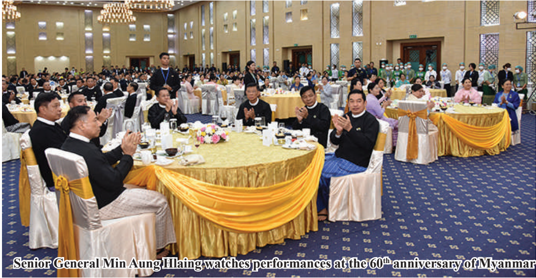
Senior General Min Aung Hlaing watches performances at the 60 th anniversary of Myanmar Police Force Day.