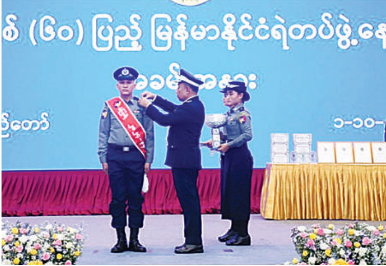
မြန်မာနိုင်ငံရဲတပ်ဖွဲ့ ရဲချုပ် ဒုတိယရဲဗိုလ်ချုပ်ကြီးဝင်းဇော်မိုး စံပြုအဆင့်တိုးဆု ရရှိသူ အရာရှိတစ်ဦးကို အဆင့်တံဆိပ် တပ်ဆင်ပေးစဉ်။

နေပြည်တော် အောက်တိုဘာ ၁ နှစ် (၆၀)ပြည့် မြန်မာနိုင်ငံရဲတပ်ဖွဲ့နေ့ အခမ်းအနားကို ယနေ့နံနက်ပိုင်းတွင် နေပြည်တော်ရှိ မြန်မာအပြည်ပြည် ဆိုင်ရာ ကွန်ဗင်းရှင်းဗဟိုဌာန-၂၅ ကျင်းပ ရာ ပြည်ထဲရေးဝန်ကြီးဌာန မြန်မာနိုင်ငံ ရဲတပ်ဖွဲ့ ရဲချုပ် ဒုတိယရဲဗိုလ်ချုပ်ကြီး ဝင်းဇော်မိုး တက်ရောက်မိန့်ခွန်း ပြောကြားသည်။ အခမ်းအနားသို့ မြန်မာနိုင်ငံရဲတပ်ဖွဲ့ ဒုတိယရဲချုပ်များ၊ ရဲအရာရှိကြီးများ၊ အနုပညာရှင်များ၊ ဆုရရှိသူများနှင့် ဖိတ်ကြားထားသော ဧည့်သည်တော်များ တက်ရောက်ကြသည်။ အခမ်းအနားတွင် မြန်မာနိုင်ငံရဲတပ်ဖွဲ့ ရဲချုပ် ဒုတိယရဲဗိုလ်ချုပ်ကြီးဝင်းဇော်မိုးက