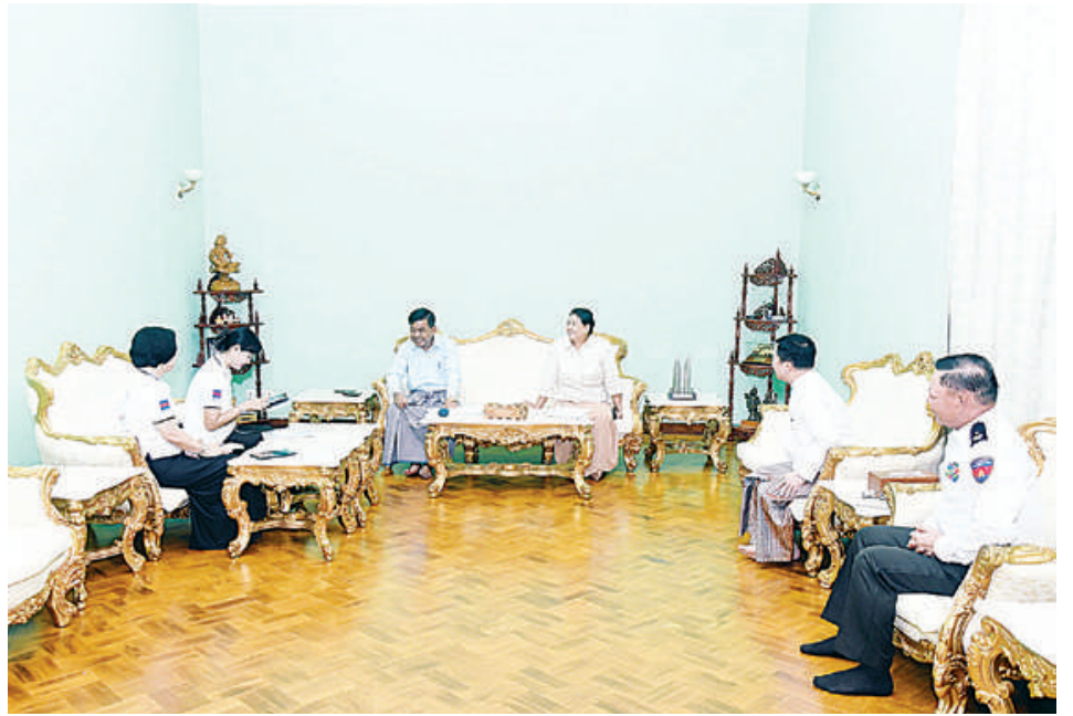
နိုင်ငံတော်စီမံအုပ်ချုပ်ရေးကောင်စီတွဲဖက်အတွင်းရေးမှူး ဗိုလ်ချုပ်ကြီးရဲဝင်းဦး၏ မိသားစုက သန်းခေါင်စာရင်းကောက်ယူရေးအဖွဲ့၏မေးခွန်းများကို ဖြေကြားစဉ်။