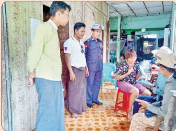
အိမ်မဲမြို့နယ်