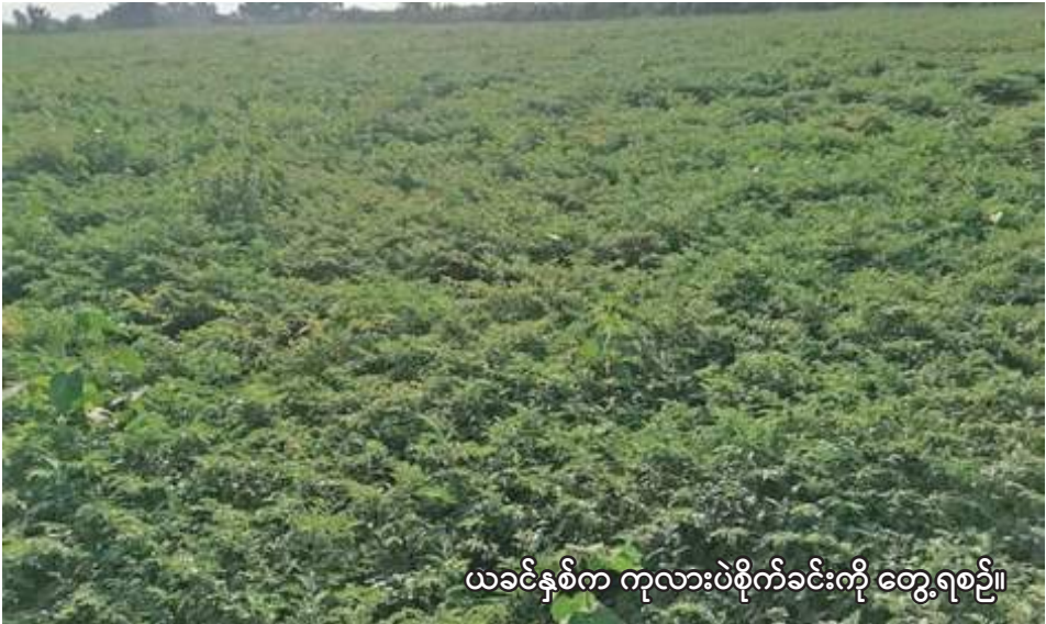
ယခင်နှစ်က ကုလားပဲစိုက်ခင်းကို တွေ့ရစဉ်။

ယင်းမာပင် အောက်တိုဘာ ၁ စစ်ကိုင်းတိုင်းဒေသကြီး ယင်းမာပင်ခရိုင်တွင် ဆောင်းသီးနှံစိုက်ပျိုးရာသီ၌ ကုလားပဲ ၁၃၅၅၇၉ ဧက စိုက်ပျိုးမည်ဖြစ်ကြောင်း ယင်းမာပင်ခရိုင် စိုက်ပျိုးရေးဦးစီးဌာနမှ သိရသည်။