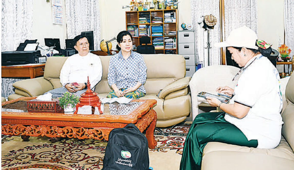
နိုင်ငံတော်စီမံအုပ်ချုပ်ရေးကောင်စီအတွင်းရေးမှူး ဗိုလ်ချုပ်ကြီးအောင်လင်းဒွေး၏ မိသားစုက သန်းခေါင်စာရင်းကောက်ယူရေးအဖွဲ့၏ မေးခွန်းများကို ဖြေကြားစဉ်။

၂၀၁၄ ခုနှစ်တွင် သန်းခေါင်စာရင်းဆိုင်ရာမေးခွန်း ၄၁ ခုကိုသာ မေးမြန်းကောက်ယူခဲ့သော်လည်း ယခု ၂၀၂၄ ခုနှစ်တွင် စာရင်းအချက်အလက်များ ပိုမိုပြီး ပြည့်စုံစေရေးအတွက် မေးခွန်း ၂၇ ခုကို တိုးမြှင့်၍ သန်းခေါင်စာရင်းဆိုင်ရာ မေးခွန်း ၆၈ ခုကို မေးမြန်းကောက်ယူသွားမည်ဖြစ်ကြောင်း သိရှိရသည်။ ထပ်မံတိုးမြှင့်ကောက်ခံမည့် အချက်အလက်များမှ ထင်ရှားသောဥပမာအနေဖြင့် ပညာရေးကဏ္ဍတွင် ကျောင်းဆက်လက်မတက်ရောက်သည့် အဓိကအကြောင်းရင်း၊ အိမ်အကြောင်းအရာကဏ္ဍတွင် အမှိုက်စွန့်ပစ်မှုစနစ်၊ သန့်ရှင်းမှုစနစ် စသည်ဖြင့် တိုးမြှင့်မေးမြန်းထားသည်ကို တွေ့ရှိရပြီး ယင်းအချက်များမှာ ပြည်သူ့လူထု၏ ပညာရေး၊ ကျန်းမာရေး၊ လူမှုရေးကဏ္ဍတို့တွင် အစိုးရက မည်ကဲ့သို့ ဖြည့်ဆည်းပေးရမည်ကို သုံးသပ်သည့် မေးခွန်းများဖြစ်သဖြင့် လက်တွေ့အသုံးဝင်သည့်