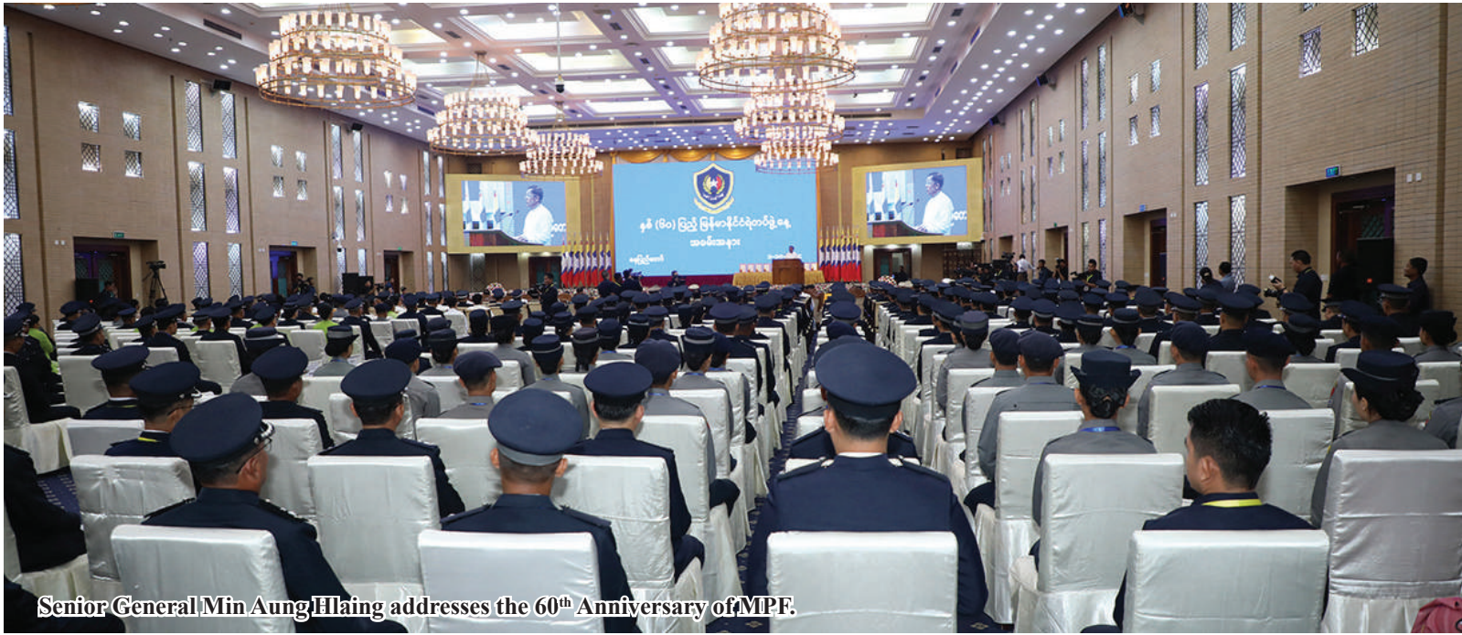
Senior General Min Aung Hlaing addresses the 60 th Anniversary of MPF.