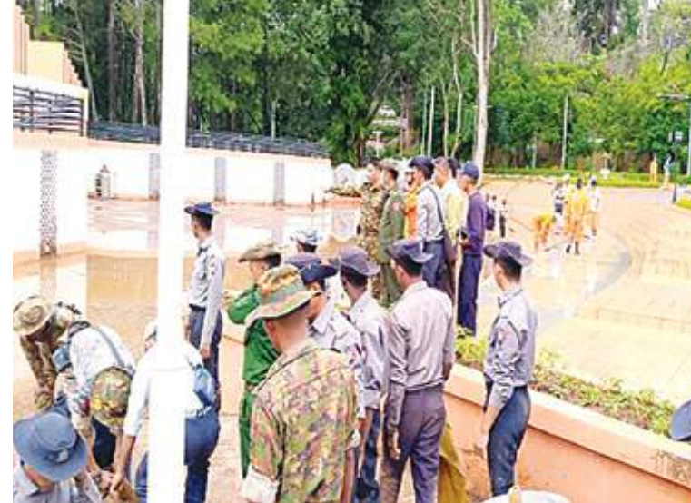
နယ်မြေခံတပ်မတော်သားများ၊ မြန်မာနိုင်ငံရဲတပ်ဖွဲ့ဝင်များနှင့် လူမှုဝန်ထမ်း ကယ်ဆယ်ရေးအဖွဲ့များက သန့်ရှင်းရေးလုပ်ငန်းများ ဆောင်ရွက်ပေးစဉ်။

ခဲ့သည့် နန်းများ၊ သစ်ပင်သစ်ကိုင်းများ ဖယ်ရှားပေးခြင်းအပါအဝင် အခြားလိုအပ် သည့်များကို တပ်မတော်သားများ၊ မြန်မာ နိုင်ငံရဲတပ်ဖွဲ့ဝင်များ၊ မီးသတ်တပ်ဖွဲ့ဝင် များ၊ ကြက်ခြေနီတပ်ဖွဲ့ဝင်များနှင့် လူမှု ဝန်ထမ်းကယ်ဆယ်ရေးအဖွဲ့များက ဒေသခံ ပြည်သူများနှင့်ပူးပေါင်း၍ တက်ကြွစွာ ဆောင်ရွက်ပေးလျက်ရှိသည်။ ထို့ပြင် ယာယီရေဘေးရှောင်စခန်းများ တွင် ရေဘေးသင့်ပြည်သူများကို ကျန်းမာ ရေးအဖွဲ့များက လိုအပ်သည့်ကျန်းမာရေး စောင့်ရှောက်မှုလုပ်ငန်းများနှင့် ကျန်းမာရေး အသိပညာပေး ဟောပြောဆွေးနွေးခြင်း များ ဆောင်ရွက်ပေးပြီး ထောက်ပံ့ပစ္စည်း များ၊ အဝတ်အထည်များ၊ အသုံးအဆောင် ပစ္စည်းများ၊ စားသောက်ဖွယ်ရာများနှင့် အလှူငွေများကို အားတက်သရောပေးအပ် လှူဒါန်းလျက်ရှိသည်။ ထိုသို့ ဆောင်ရွက် နေမှုများကို နေပြည်တော်ကောင်စီဥက္ကဋ္ဌ၊ သက်ဆိုင်ရာ တိုင်းဒေသကြီးနှင့် ပြည်နယ် ဝန်ကြီးချုပ်များနှင့် တာဝန်ရှိသူများက