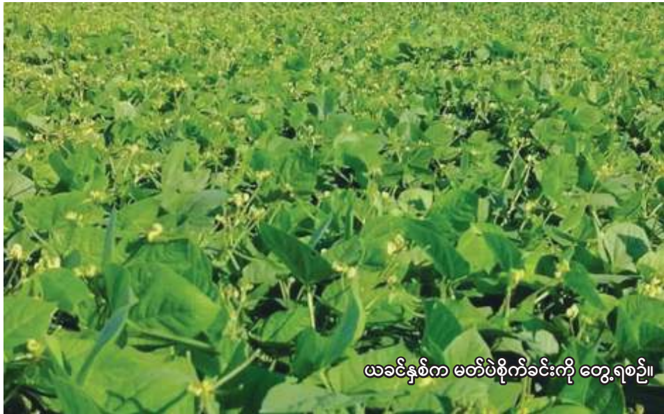
ယခုနှစ်က မတ်ပဲစိုက်ခင်းကို တွေ့ရစဉ်။

ကန့်ဘလူ အောက်တိုဘာ ၁ စစ်ကိုင်းတိုင်းဒေသကြီး ကန့်ဘလူခရိုင်တွင် ယခုနှစ် ဆောင်းသီးနှံစိုက်ပျိုးရာသီ၌ မတ်ပဲ ၅၀၁၆၂ ဧက စိုက်ပျိုးမည်ဖြစ်ကြောင်း ကန့်ဘလူခရိုင် စိုက်ပျိုးရေးဦးစီးဌာနမှ သိရသည်။