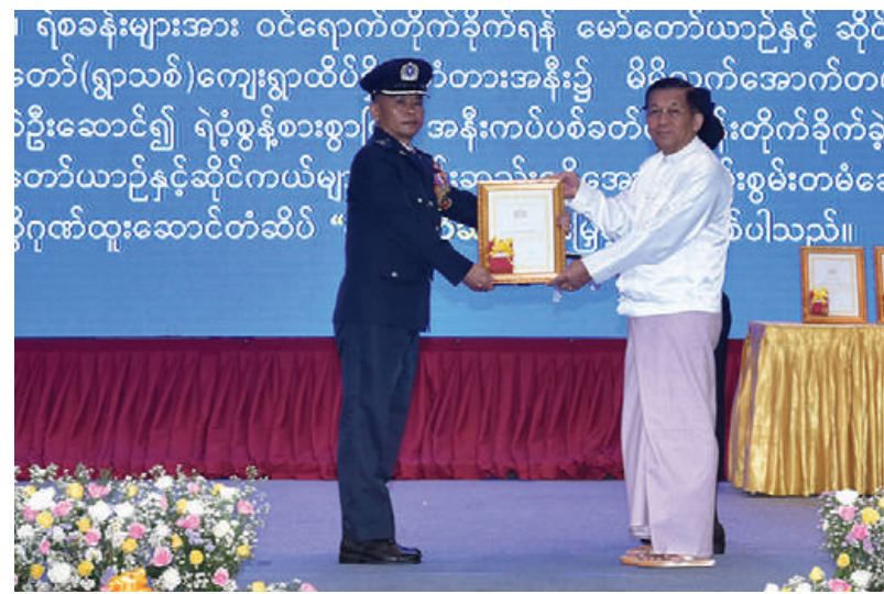
နိုင်ငံတော်စီမံအုပ်ချုပ်ရေးကောင်စီဥက္ကဋ္ဌ နိုင်ငံတော်ဝန်ကြီးချုပ် ဗိုလ်ချုပ်မှူးကြီးမင်းအောင်လှိုင်က စွမ်းရည်သတ္တိဂုဏ်ထူးဆောင်တံဆိပ်ရရှိသူတစ်ဦးအား ဆုပေးအပ်ချီးမြှင့်စဉ်။

ဆေးဝါးနဲ့ စိတ်ကိုပြောင်းလဲစေတတ်သော ဆေးဝါးများအန္တရာယ်ကို တားဆီးနှိမ်နင်းရေး၊ ပြည်သူ့အကျိုးပြုလုပ်ငန်းများဆောင်ရွက်ရေးဆိုသည့် လုပ်ငန်းတာဝန်(၆)ရပ်ကိုလည်း အောင်မြင်အောင်အကောင်အထည်ဖော်ဆောင်ရွက်သွားရမည်ဖြစ်ကြောင်း။ ပြည်ထဲရေးဝန်ကြီးဌာန မြန်မာနိုင်ငံ