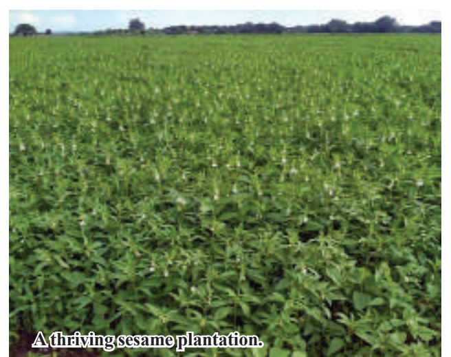
A thriving sesame plantation.

ship Agriculture Department urged local farmers to apply agricultural techniques to expand sown acreage of sesame, and use GAP system and quality strains of crops.