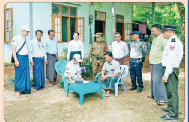
အုတ်ဖိုမြို့နယ်