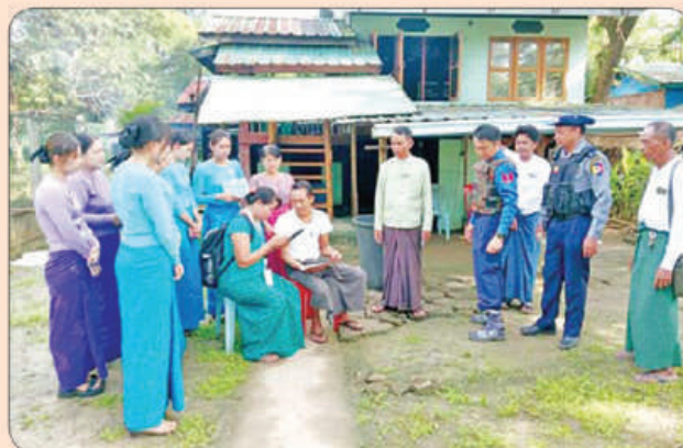
သုံးခွမြို့နယ်