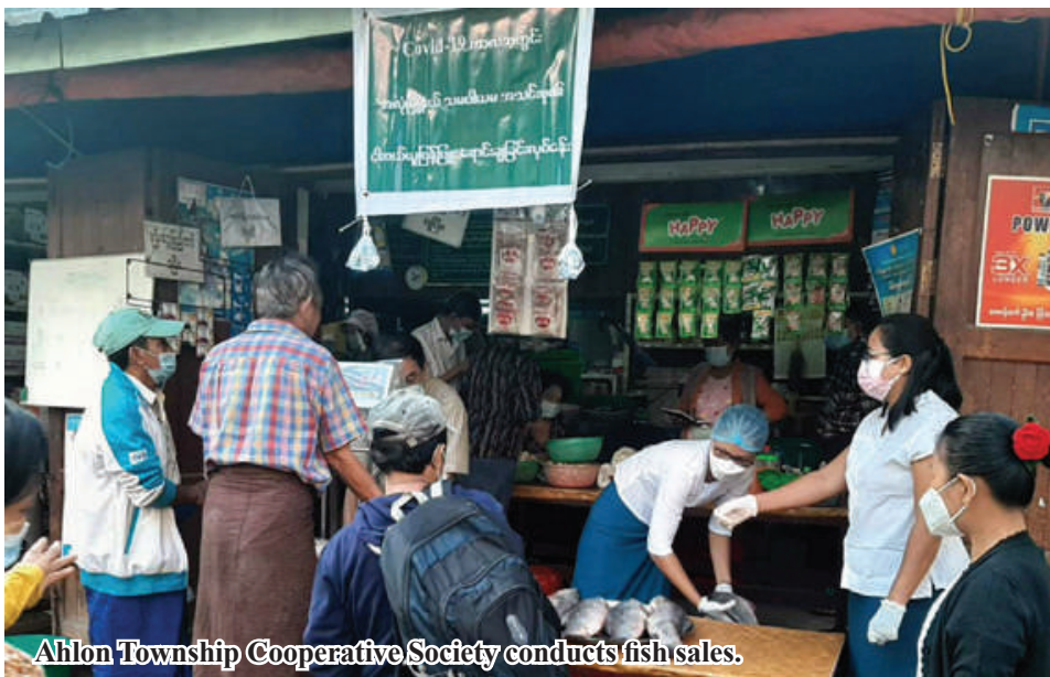
Ahlon Township Cooperative Society conducts fish sales.

Nay Pyi Taw October 1 More than 125 billion kyats have been generated from production, service and trade activities of cooperative societies during the five months