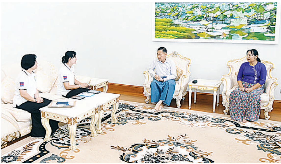
နိုင်ငံတော်စီမံအုပ်ချုပ်ရေးကောင်စီဒုတိယဥက္ကဋ္ဌ ဒုတိယဝန်ကြီးချုပ် ဒုတိယဗိုလ်ချုပ်မှူးကြီးစိုးဝင်း၏ မိသားစုက သန်းခေါင်စာရင်းကောက်ယူရေးအဖွဲ့၏ မေးခွန်းများကို ဖြေကြားစဉ်။

နိုင်ငံတစ်နိုင်ငံသည် သန်းခေါင်စာရင်း ကောက်ယူခြင်းမှရရှိသော လူဦးရေဆိုင်ရာ ကိန်းဂဏန်း အချက်အလက်များအပေါ် အခြေခံ၍ နိုင်ငံ၏လူမှုရေးစီးပွားရေးစီမံခန့်ခွဲရေးဆိုင်ရာကိစ္စရပ်များကို ကဏ္ဍအလိုက် အချိုးညီညီဖွံ့ဖြိုးတိုးတက်စေရန် မူဝါဒများချမှတ်ခြင်း၊ စီမံကိန်းများရေးဆွဲဆောင်ရွက်ခြင်း စသည့်လုပ်ငန်းများကို အကောင်အထည်ဖော် ဆောင်ရွက်ရခြင်း ဖြစ်သဖြင့် လူဦးရေသန်းခေါင်စာရင်း ကောက်ယူခြင်းလုပ်ငန်းကို နိုင်ငံအလိုက် ၁၀ နှစ်လျှင် တစ်ကြိမ် ဆောင်ရွက်လျက်ရှိသည်။ သန်းခေါင်စာရင်းမှ ရရှိသော အချက်အလက်များသည် နိုင်ငံတော်အစိုးရအပါအဝင် ဝန်ကြီးဌာနများနှင့်သာ သက်ဆိုင်ခြင်းမဟုတ်ဘဲ နိုင်ငံအတွင်းရှိ ပြည်သူ့အားလုံးနှင့် သက်ဆိုင်ပြီး လူတစ်ဦးချင်း