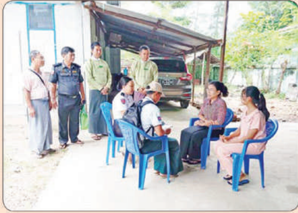
နတ်တလင်းမြို့နယ်