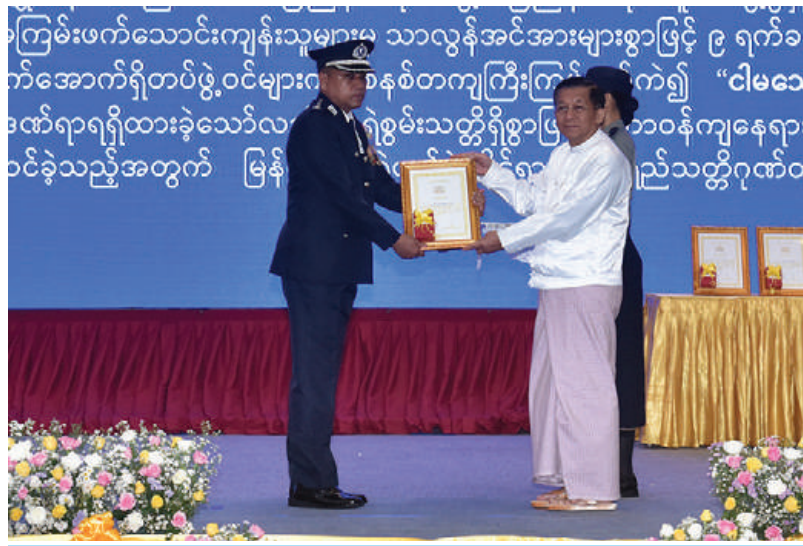
နိုင်ငံတော်စီမံအုပ်ချုပ်ရေးကောင်စီဥက္ကဋ္ဌ နိုင်ငံတော်ဝန်ကြီးချုပ် ဗိုလ်ချုပ်မှူးကြီးမင်းအောင်လှိုင်က စွမ်းရည်သတ္တိဂုဏ်ထူးဆောင်တံဆိပ်ရရှိသူတစ်ဦးအား ဆုပေးအပ်ချီးမြှင့်စဉ်။

ဇန်နဝါရီ ၁ ရက်မှ ဩဂုတ် ၃၁ ရက်ထိ မြန်မာတစ်နိုင်ငံလုံး မူးယစ်ဆေးဝါးဖမ်းဆီးရမိမှု အနေဖြင့်အမှုပေါင်း ၃၈၃၂ မှု၊ တရားခံ ၅၂၈၆ ဦး စုစုပေါင်းတန်းဖိုးငွေကျပ်ဘီလီယံ ၇၅၀ ကျော်ရှိသည့်မူးယစ်ဆေးဝါးနှင့် မူးယစ်ဆေးဝါးချက်လုပ်ရာတွင်အသုံးပြုသည့်ဆက်စပ်ပစ္စည်းများကိုဖမ်းဆီးအရေးယူနိုင်ခဲ့ကြောင်း။ မြန်မာနိုင်ငံအနေဖြင့် လူကုန်ကူးမှုများကိုထိရောက်စွာအရေးယူနိုင်ရန် ၂၀၂၂ ခုနှစ် ဇွန် ၁၆ ရက်တွင် လူကုန်ကူးမှုတားဆီးနှိမ်နင်းရေးဥပဒေသစ်ကိုပြဋ္ဌာန်းပေးခဲ့ကြောင်း၊ ၂၀၂၃ ခုနှစ် အောက်တိုဘာလမှ ၂၀၂၄ ခုနှစ် ဩဂုတ်လထိ လူကုန်ကူးမှု ၂၇ မှုမှတရားခံကျားဦးရေ ၃၀၊ မ ၆၆ ဦး စုစုပေါင်း ၉၆ ဦး အရေးယူနိုင်ခဲ့ပြီး လူကုန်ကူးခံရသူ ကျား ငါးဦး၊ မ ၄၄ ဦး စုစုပေါင်း ၄၉ ဦးကိုကယ်တင်နိုင်ခဲ့ကြောင်း၊ ဒေသတွင်းလူကုန်ကူးမှုခင်းများနှင့် လူမှောင်ခိုမှုများတားဆီးနှိမ်နင်းရေးစီမံ