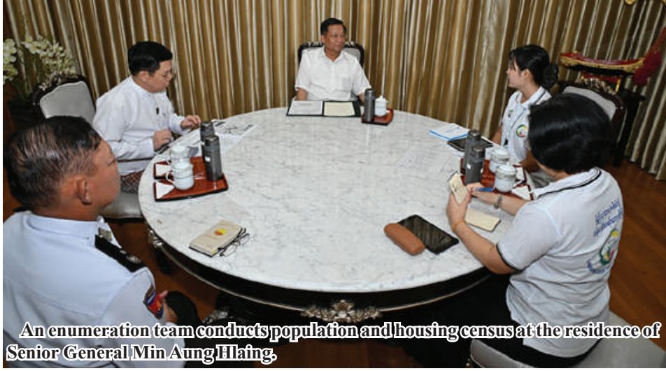
An enumeration team conducts population and housing census at the residence of Senior General Min Aung Hlaing.

Nay Pyi Taw October 1 Population and housing census enumeration began today in the entire Myanmar and it will continue for 15 days till 15 October.