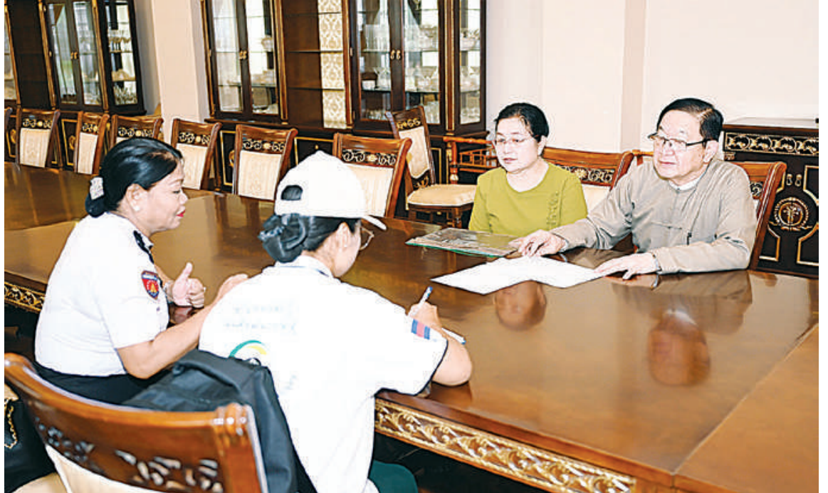
ပြည်သူ့လွှတ်တော်ဥက္ကဋ္ဌ ဦးတီခွန်မြတ်၏ မိသားစုက သန်းခေါင်စာရင်းကောက်ယူရေးအဖွဲ့၏ မေးခွန်းများကို ဖြေကြားစဉ်။

၂၀၂၄ ခုနှစ်အတွက် အလားတူ သန်းခေါင်စာရင်း ကောက်ယူရေးအဖွဲ့သည် နိုင်ငံတော်စီမံအုပ်ချုပ်ရေးကောင်စီဒုတိယဥက္ကဋ္ဌ ဒုတိယဝန်ကြီးချုပ် ဒုတိယဗိုလ်ချုပ်မှူးကြီးစိုးဝင်း၏ မိသားစု လူဦးရေနှင့် အိမ်အကြောင်းအရာသန်းခေါင်စာရင်း၊ ပြည်သူ့လွှတ်တော်ဥက္ကဋ္ဌ ဦးတီခွန်မြတ်၏ မိသားစု လူဦးရေနှင့် အိမ်အကြောင်းအရာသန်းခေါင်စာရင်း၊ ကောင်စီဝင် ဗိုလ်ချုပ်ကြီးမောင်မောင်အေး