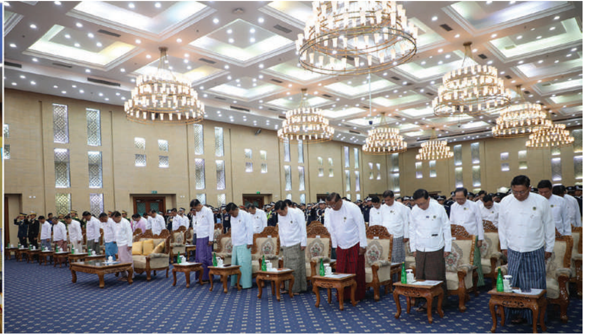
နိုင်ငံတော်စီမံအုပ်ချုပ်ရေးကောင်စီဥက္ကဋ္ဌ နိုင်ငံတော်ဝန်ကြီးချုပ် ဗိုလ်ချုပ်မှူးကြီးမင်းအောင်လှိုင်နှင့် အခမ်းအနားတက်ရောက်လာကြသူများက ပြည်ထောင်စုသမ္မတမြန်မာနိုင်ငံတော်အလံကို အလေးပြုကြစဉ်။