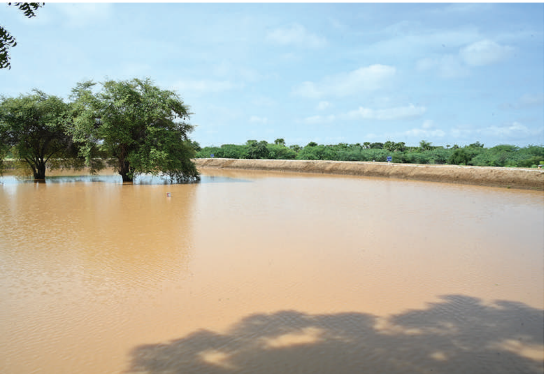
နိုင်ငံတော်စီမံအုပ်ချုပ်ရေးကောင်စီဥက္ကဋ္ဌ နိုင်ငံတော်ဝန်ကြီးချုပ် ဗိုလ်ချုပ်မှူးကြီးမင်းအောင်လှိုင် အရှေ့ဖွားစောကျေးရွာအနီးရှိ ဇေယျဝတီ(ဇေယျဝေရီ)ကန်အတွင်း ရေဝင်ရောက်မှုအခြေအနေကို ကြည့်ရှုစစ်ဆေးခြင်းဖြစ်သည်။

နေပြည်တော် စက်တင်ဘာ ၁၆ နိုင်ငံတော်စီမံအုပ်ချုပ်ရေးကောင်စီဥက္ကဋ္ဌ နိုင်ငံတော်ဝန်ကြီးချုပ် ဗိုလ်ချုပ်မှူးကြီးမင်းအောင်လှိုင်သည် ခရီးစဉ်တွင် လိုက်ပါလာသည့် အဖွဲ့ဝင်များ၊ မန္တလေးတိုင်းဒေသကြီးဝန်ကြီးချုပ်မကွေးတိုင်းဒေသကြီးဝန်ကြီးချုပ်နှင့် တာဝန်ရှိသူများလိုက်ပါ၍ ယနေ့ နံနက်ပိုင်းတွင် မန္တလေးတိုင်းဒေသကြီး ညောင်ဦးခရိုင် ပုဂံရှေးဟောင်းယဉ်ကျေးမှုနယ်မြေအတွင်း ရေကြီးရေလျှံမှုများနှင့် သဘာဝဘေးအန္တရာယ်ကြောင့် ထိခိုက်ပျက်စီးမှုများဖြစ်ပေါ်မှုမရှိစေရေး ရှေးဟောင်းကန်များ ပြန်လည်ပြုပြင်ဆောင်ရွက်လျက်ရှိမှုအခြေအနေများကို သွားရောက်ကြည့်ရှုစစ်ဆေးသည်။ မြကန်ရေလျှောင်တံမံ ဦးစွာ နိုင်ငံတော်စီမံအုပ်ချုပ်ရေးကောင်စီဥက္ကဋ္ဌ နိုင်ငံတော်ဝန်ကြီးချုပ်နှင့် အဖွဲ့ဝင်များသည် မြန်မာ့သက္ကရာဇ် ၄၅၀ ခုနှစ်၊ ခရစ်နှစ် ၁၀၈၈ ခုနှစ်၊ ပုဂံခေတ် ရှေးမြန်မာမင်းများလက်ထက်ကတည်းက ကျန်စစ်သားမင်းကြီးတည်ဆောက်ခဲ့သည့် မြကန်ရေလျှောင်တံမံသို့ ရောက်ရှိကြရာ ရှင်းလင်းဆောင်ခန်းမတွင် သာသနာရေးနှင့်ယဉ်ကျေးမှုဝန်ကြီးဌာန ပြည်ထောင်စုဝန်ကြီး ဦးတင်ဦးလွင်နှင့်တာဝန်ရှိသူများက ပုဂံကမ္ဘာ့အမွေအနှစ်ဒေသရှိ ရှေးဟောင်းရေကန် ၉၁ ကန်အနက် တူးဖော်ပြီး စာမျက်နှာ ၁၆ ကော်လံ ၁