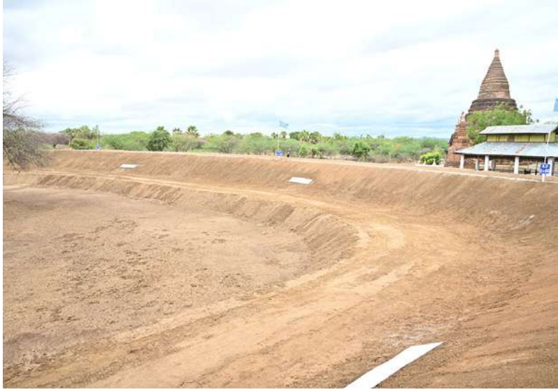
အရှေ့ဖွားစောကျေးရွာအနီးရှိ ဇေယျဝတီ(ဇေယျဝေရီ)ကန်ပြုပြင်ဆောင်ရွက်ထားရှိမှုကို ၂၅-၅-၂၀၂၄ ရက်တွင် တွေ့ရစဉ်။