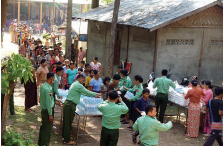
နေပြည်တော်တိုင်းစစ်ဌာနချုပ် ဇေယျာသီရိတပ်နယ် မိသားစုများက ဇေယျာသီရိမြို့နယ် လှေခွင်းတောင်ပရိဝုဏ်အတွင်း သာသနိက အဆောက်အအုံများ၌ ဖွင့်လှစ်ထားရှိသော ရေဘေးရှောင် ယာယီကယ်ဆယ်ရေးစခန်းရှိ ရေဘေးသင့်ပြည်သူများကို ထမင်းထုပ်နှင့် သောက်ရေသန့်ဘူးများ ပေးစေစဉ်။

သွယ်ထားသော သိုက်ချောင်းတံတား(ဆင်သေချောင်းကူး)နှင့် တပ်ကုန်းမြို့နယ် ကင်းသာကျေးရွာအုပ်စု ရန်ကုန်-မန္တလေးလမ်းဟောင်းပေါ်ရှိ နဝင်းချောင်းတံတား(အဆုံ) တံတား သုံးစင်းတို့ကို ယာယီဘေလီတံတား အစားထိုးခြင်းပြီးစီးပြီဖြစ်၍ မော်တော်ယာဉ်များ ဖြတ်သန်းသွားလာနိုင်ပြီဖြစ်သည်။ ထို့ကြောင့် နေပြည်တော်ကောင်စီနယ်မြေအပါအဝင် တိုင်းဒေသကြီးနှင့် ပြည်နယ်အချို့တွင် ရေကြီးရေလျှံမှုကြောင့် ပျက်စီးသွားသည့် တံတားများအနက် တံတားခြောက်စင်းကို ယာယီဘေလီတံတား အစားထိုးခြင်းပြီးစီးပြီဖြစ်၍ ပြုပြင်ရန် ကျန်ရှိနေသည့် တံတားများကိုလည်း အမြန်ဆုံးပြင်ဆင်