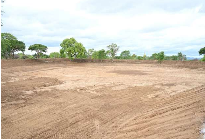
အနောက်ဖွားစောကျေးရွာအနီးရှိ မင်္ဂလာကန်အမှတ်(၃)(မွန်းတိမ်းကန်)ပြုပြင်ဆောင်ရွက်ထားရှိမှုကို ၂၅-၅-၂၀၂၄ ရက်တွင် တွေ့ရစဉ်။

များအတွင်း ရေထိန်းတံခံထိန်းသိမ်းပင်များ စိုက်ပျိုးထားရန်လိုကြောင်း၊ ကန်များအနီးပတ်ဝန်းကျင်တွင် စိုက်ပျိုးသီးနှံစိုက်ပျိုးခြင်းများဆောင်ရွက်မှုကြောင့် ရေကန်အတွင်းသို့ ရေဝင်ရောက်မှုလျော့နည်းနိုင်သည့်အတွက် သီးနှံစိုက်ပျိုးမှုများကို သတ်မှတ်အကွာအဝေးတွင်သာရှိစေရေး စည်းကမ်းများ၊ ဥပဒေများနှင့်အညီ တားမြစ်ဆောင်ရွက်ထားရှိရန်လိုကြောင်း၊ ယခုရေကန်များအတွင်း ယခုကဲ့သို့ ရေများ စုဆောင်းထားရှိနိုင်သည့်အတွက် သုံးရေအတွက် အထောက်အကူပြုစေနိုင်မည်ဖြစ်သကဲ့သို့ ပုဂံဒေသစီမံခန့်ခွဲရေးအတွက်လည်း အကျိုးရှိစေနိုင်မည်ဖြစ်သဖြင့် တံခံများ၊ ရေကန်များကိုစနစ်တကျ ဆက်လက် ထိန်းသိမ်းဆောင်ရွက်သွားကြရန်လိုကြောင်းဖြင့် မှာကြားသည်။