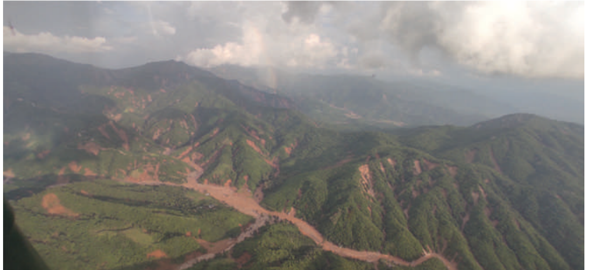
တောင်ကုန်းတောင်တန်းများပေါ်မှ ဖြတ်သန်းစီးဆင်းလာသည့် တောင်ကျချောင်းရေများ အရှိန်အဟုန်ဖြင့် စီးဆင်းခဲ့မှုကို တွေ့ရစဉ်။

စိုက်ပျိုးရေး ညောင်ဦးခရိုင်အတွင်း စိုက်ပျိုးရေးလုပ်ငန်းများနှင့်ပတ်သက်၍ တင်ပြချက်များအရ ပန်းတိုင်ရည်မှန်းချက်များပြည့်မီရန် လိုအပ်နေသေးသည်ကို တွေ့ရှိရကြောင်း၊ မိမိတို့စိုက်ပျိုးသည့် သီးနှံများ ပန်းတိုင်ရည်မှန်းချက် ပြည့်မီအောင် ဆောင်ရွက်မည်ဆိုပါက ဒေသအတွင်း