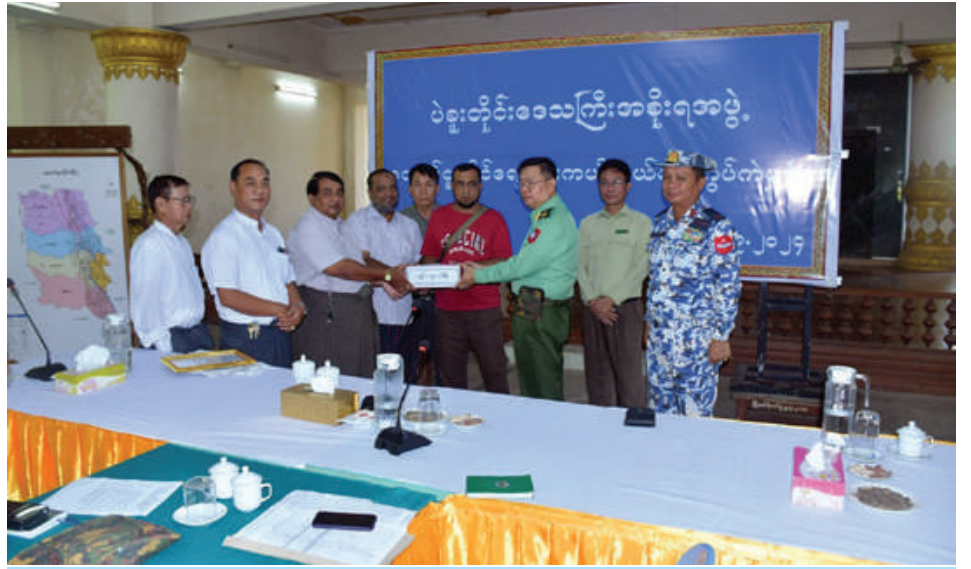
တောင်ပိုင်းတိုင်းစစ်ဌာနချုပ် တိုင်းမှူး ဗိုလ်ချုပ်ကြည်သိုက်ထံ စေတနာရှင်အလှူရှင်များက ရေဘေးသင့် ပြည်သူများအတွက် အလှူငွေများ ပေးအပ်လှူဒါန်းစဉ်။

နေပြည်တော် စက်တင်ဘာ ၁၆ နေပြည်တော်ကောင်စီနယ်မြေ အပါအဝင် တိုင်းဒေသကြီးနှင့် ပြည်နယ်အချို့တွင် မိုးအဆက်မပြတ်ရွာသွန်းမှုများဖြစ်ပွားခဲ့ပြီး ချောင်းရေ မြစ်ရေများမြင့်တက်ကာ မြို့နယ်အချို့ရှိ ရေကြီးရေလျှံမှုဖြစ်ပေါ်ခဲ့သည့် ရပ်ကွက်၊ကျေးရွာများမှ ကူညီရွှေ့ပြောင်းရန် လိုအပ်နေသူများကို အချိန်နှင့်တစ်ပြေးညီ ကူညီကယ်ဆယ်ရွှေ့ပြောင်းပေးခြင်းလုပ်ငန်းများကို အင်တိုက်အားတိုက်တက်ကြွစွာပူးပေါင်းဆောင်ရွက်ပေးလျက်ရှိသည်။ ယနေ့တွင်လည်း ရေကြီးရေလျှံဖြစ်ပေါ်နေသည့်လယ်ဝေးမြို့နယ်၊ ပုဗ္ဗသီရိမြို့နယ်နှင့် ဇေယျာသီရိမြို့နယ်၊ ရှမ်းပြည်နယ်(အရှေ့ပိုင်း) တာချီလိတ်မြို့