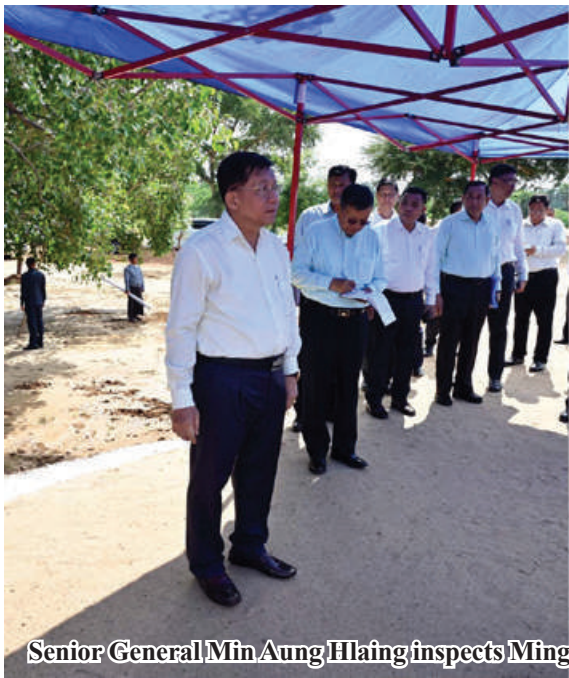
Senior General Min Aung Hlaing inspects Mingala Lake.

After hearing the reports, the Senior General gave guidance on needs to seek the best ways for having dense forests in addition to applying