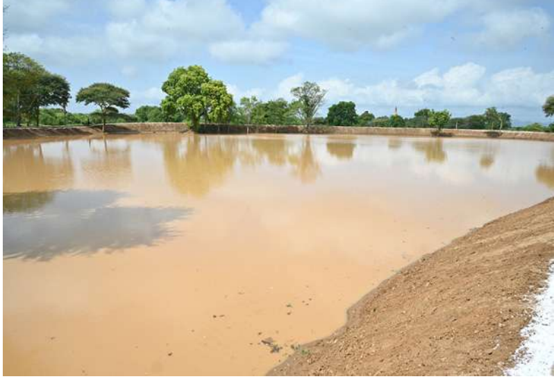
အနောက်ဖွားစောကျေးရွာအနီးရှိ မင်္ဂလာကန်အမှတ်(၃)(မွန်းတိမ်းကန်) ရေဝင်ရောက်မှုအခြေအနေကို တွေ့ရစဉ်။

ပုဂံကမ္ဘာ့အမွေအနှစ်ဒေသ ရေရှည်တည်တံ့ခိုင်မြဲရေး၊ ရေကြီးရေလျှံမှုမဖြစ်ပေါ်စေရေး၊ စီမံခန့်ခွဲမှုမရှိမီခရီးသွားများအား ဆွဲဆောင်နိုင်ရေးအတွက် ရှေးဟောင်းရေကန်များ ပြန်လည်တူးဖော်ပြုပြင်ထိန်းသိမ်းခြင်းလုပ်ငန်းများကို နိုင်ငံတော်စီမံအုပ်ချုပ်ရေးကောင်စီဥက္ကဋ္ဌ နိုင်ငံတော်ဝန်ကြီးချုပ်၏ လမ်းညွှန်ချက်နှင့်အညီ တာဝန်ရှိသူများက စီမံချက်ဖြင့်ဆောင်ရွက်လျက်ရှိပြီး ထာဝရကုသိုလ်ဖြစ်သည့် ရေကန်များပြုပြင်ထိန်းသိမ်းခြင်းလုပ်ငန်းများတွင် စေတနာရှင်ပြည်သူများအနေဖြင့်လည်း တစ်တပ်တစ်အား ပါဝင်လှူဒါန်းကုသိုလ်ယူလျက်ရှိကြောင်း သတင်းရရှိသည်။