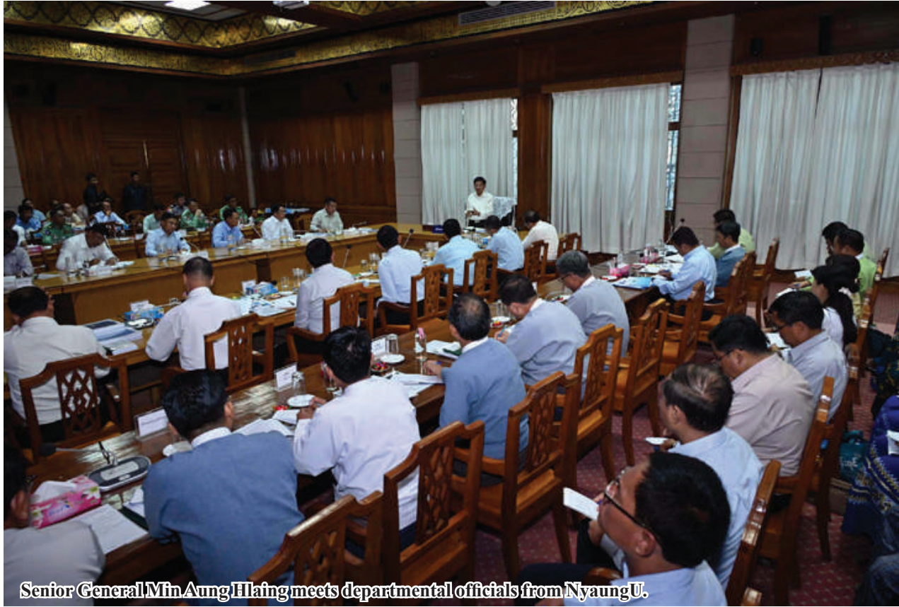
Senior General Min Aung Hlaing meets departmental officials from NyaungU.