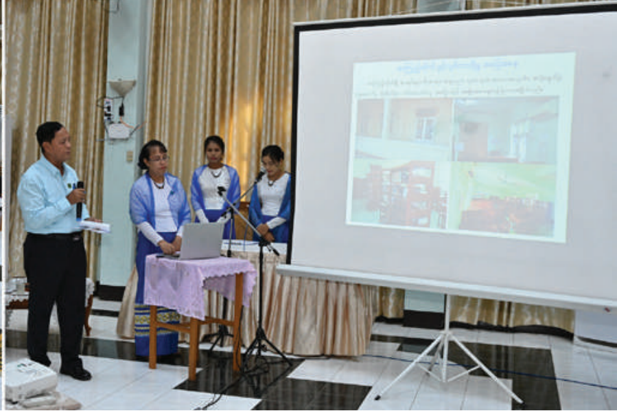
နိုင်ငံတော်စီမံအုပ်ချုပ်ရေးကောင်စီဥက္ကဋ္ဌ နိုင်ငံတော်ဝန်ကြီးချုပ် ဗိုလ်ချုပ်မှူးကြီးမင်းအောင်လှိုင်အား ပြည်ထောင်စုဝန်ကြီး ဦးလှမိုးက ယွန်းပညာကောလိပ်၏ လုပ်ငန်းများဆောင်ရွက်နေမှု အခြေအနေများနှင့် ပတ်သက်၍ ရှင်းလင်းတင်ပြစဉ်။

နေပြည်တော် စက်တင်ဘာ ၁၆ နိုင်ငံတော် စီမံအုပ်ချုပ်ရေးကောင်စီ ဥက္ကဋ္ဌ နိုင်ငံတော်ဝန်ကြီးချုပ် ဗိုလ်ချုပ်မှူးကြီးမင်းအောင်လှိုင်သည် ခရီး စဉ်တွင် လိုက်ပါလာသည့် အဖွဲ့ဝင်များ၊ မန္တလေးတိုင်းဒေသကြီး ဝန်ကြီးချုပ်၊ မကွေးတိုင်းဒေသကြီး ဝန်ကြီးချုပ်နှင့် တာဝန်ရှိသူများလိုက်ပါ၍ ယနေ့မွန်လွဲပိုင်း တွင် မန္တလေးတိုင်းဒေသကြီး ညောင်ဦး ခရိုင်အတွင်းရှိ ဌာနဆိုင်ရာတာဝန်ရှိသူများ အား ပုဂံရှေးဟောင်းယဉ်ကျေးမှုနယ်မြေ ပုဂံယဉ်ကျေးမှုပြတိုက်၌ တွေ့ဆုံ၍ ဒေသ ဖွံ့ဖြိုးတိုးတက်ရေးဆိုင်ရာများကို ဆွေးနွေး ပြောကြားသည်။