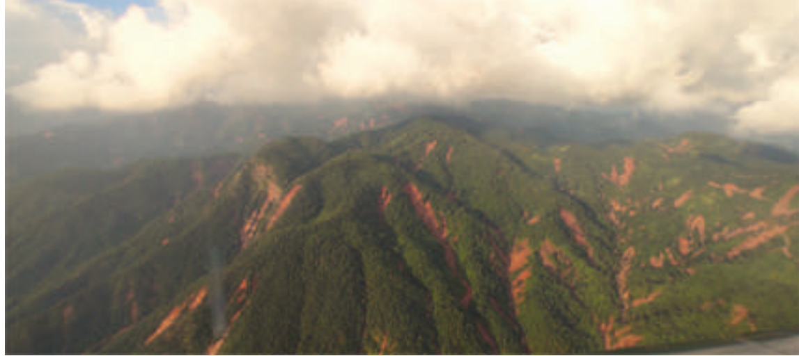
ရှမ်းကုန်းပြင်မြင့်နှင့် ဆက်စပ်တောင်ကုန်းတောင်တန်းများပေါ်မှ ရေများစီးဆင်းတိုက်စားခဲ့မှုကြောင့် တောင်ပြို၊ မြေပြိုမှုများ ဖြစ်ပေါ်နေမှုကို တွေ့ရစဉ်။

တွင် ဖြစ်ပေါ်တိုးတက်နေသည့်အခြေအနေအရ ပညာဓေတံ၊ IT နည်းပညာ၊ AI နည်းပညာဓေတံတွင် လူတိုင်း အလယ်တန်းအဆင့်အထိ ပညာတတ်မြောက်ရန် လိုအပ်ကြောင်း၊ ထို့ကြောင့် ညောင်ဦးခရိုင်အတွင်း ပညာရေးကို အားပေးဆောင်ရွက်ကြစေရေး တာဝန်ထမ်းဆောင်နေကြသည့် ဌာနဆိုင်ရာဝန်ထမ်းများအနေဖြင့် အသိပညာပေးခြင်း၊ ထိန်းကျောင်းတည့်မတ်ပေးခြင်းတို့ကို ဆောင်ရွက်ပေးသွားရန်လိုကြောင်း၊ ပညာတတ်မှသာ အတွေးအခေါ်များ ကောင်းမွန်တိုးတက်လာပြီး စဉ်းစားဆင်ခြင်တုံတရားများလည်း မြင့်မားလာမည်ဖြစ်ကြောင်း။