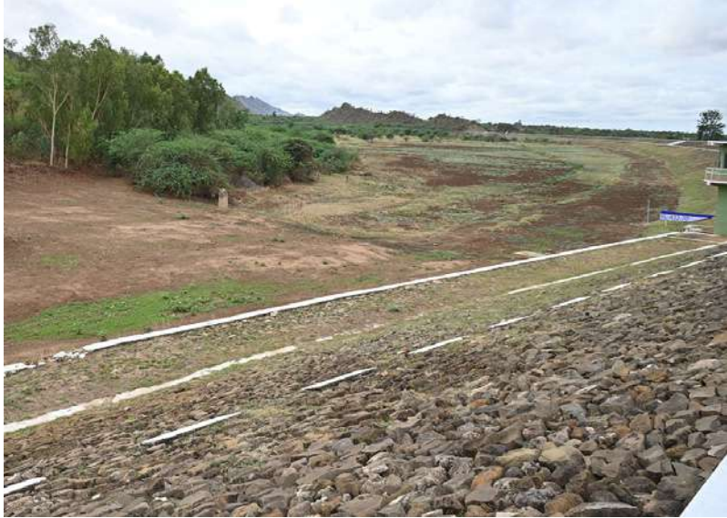
မြကန်ရေလှောင်တံခံ ပြုပြင်ဆောင်ရွက်ထားရှိမှုကို ၂၅-၅-၂၀၂၄ ရက်တွင် တွေ့ရစဉ်။