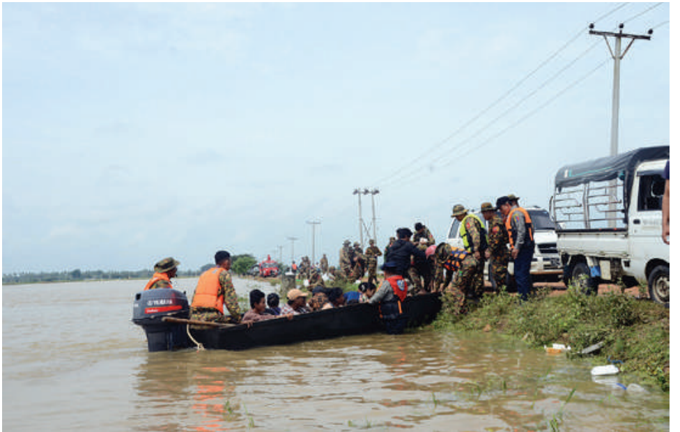
နယ်မြေခံတပ်မတော်သားများ၊ မြန်မာနိုင်ငံရဲတပ်ဖွဲ့ဝင်များ၊ မီးသတ်တပ်ဖွဲ့ဝင်များ၊ ကြက်ခြေနီတပ်ဖွဲ့ဝင်များနှင့် ပရဟိတအသင်းအဖွဲ့များက ရေဘေးသင့်ပြည်သူများကို ကူညီကယ်ဆယ်ရေးလုပ်ငန်းများ ဆောင်ရွက်ပေးစဉ်။

နေပြည်တော် စက်တင်ဘာ ၁၆ တောင်တရုတ်ပင်လယ်ပြင်တွင် ဖြစ်ပေါ်ခဲ့သော တိုင်းဖွန်းမုန်တိုင်း ရာဂါ၏ အရှိန်နှင့်ဘင်္ဂလားပင်လယ်အော်အနောက် အလယ်ပိုင်းနှင့် အနောက်မြောက်ပိုင်းတို့ တွင် ဖြစ်ပေါ်နေသော မုန်တိုင်းငယ်၏ အရှိန်ကြောင့် နေပြည်တော်ကောင်စီ နယ်မြေအပါအဝင် တိုင်းဒေသကြီးနှင့် ပြည်နယ်အချို့တွင် မိုးအဆက်မပြတ် ရွာသွန်းခဲ့ပြီး ရေကြီးရေလျှံမှုများဖြစ်ပေါ်ခဲ့သည်။