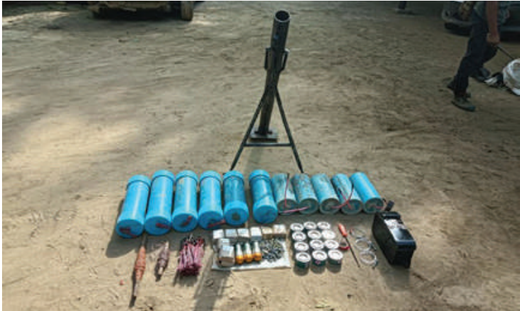
တောင်သာမြို့နယ်အတွင်း ခိုအောင်းနေသော PDF အမည်ခံအကြမ်းဖက်သမားများထံမှ သိမ်းဆည်းရမိသည့် လက်နက်၊ ခဲယမ်းများ၊ ဆက်စပ်ပစ္စည်းများ မှတ်တမ်းဓာတ်ပုံ။

နေပြည်တော် စက်တင်ဘာ ၁၆ မန္တလေးတိုင်းဒေသကြီး တောင်သာ မြို့နယ်အတွင်းရှိ ကျေးရွာအချို့တွင် PDF အမည်ခံ အကြမ်းဖက်သမားများသည် ဒေသခံပြည်သူများအား ဖမ်းဆီးသတ်ဖြတ် ခြင်း၊ ဆက်ကြေးကောက်ခြင်း၊ လူနေအိမ် များနှင့် အစိုးရ၏အုပ်ချုပ်မှုယန္တရားများ ရပ်တန့်စေရန် ဌာနဆိုင်ရာအဆောက် အအုံများကို မီးရှို့ဖျက်ဆီးခြင်း၊ မိုင်းထောင် ခြင်းစသည့် အကြမ်းဖက်အဖျက်အမှောင့် လုပ်ငန်းများကို လုပ်ဆောင်လျက်ရှိသည်။ ထိုသို့ အကြမ်းဖက်လုပ်ရပ်များ လုပ်ဆောင်နေသည့် PDF အမည်ခံ အကြမ်းဖက်သမားများကို ဒေသခံပြည်သူ လူထုက ရွံရှာမုန်းတီးလျက်ရှိပြီး တပ်မတော်၏ အကြမ်းဖက်ချေမှုန်းရေး စစ်ဆင်ရေး (Counter-Terrorism Operation) ကို ဆောင်ရွက်မှုတွင် ပူးပေါင်း