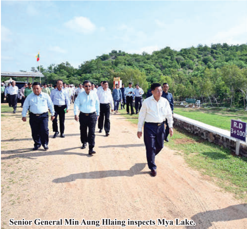
Senior General Min Aung Hlaing inspects Mya Lake.