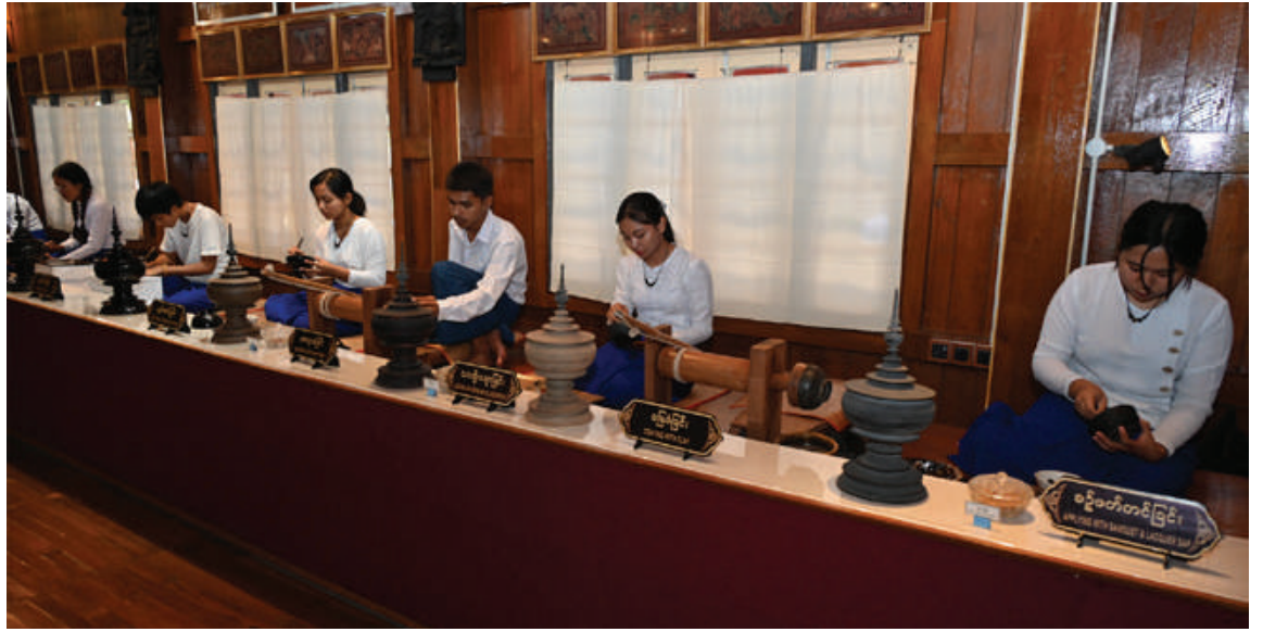
ယွန်းပညာကောလိပ်ရှိ သင်တန်းသား၊ သင်တန်းသူများ၏ ယွန်းနည်းစဉ်အဆင့်ဆင့်အား လက်တွေ့ဆောင်ရွက်နေမှုကို တွေ့ရစဉ်။

လုပ်ငန်းများကို နိုင်ငံတော်အနေဖြင့် မူဝါဒအဖြစ် ချမှတ်ဆောင်ရွက်လျက်ရှိကြောင်း၊ စာကြည့်တိုက်များဖွင့်လှစ်ခြင်းဖြင့် ပညာသင်ကြားခြင်းမပြုနိုင်တော့သည့် အရွယ်သို့ ရောက်ရှိနေသူများအနေဖြင့် ၁၁၀ တိုးတက်ရေးအတွက် သိရှိရန်လိုအပ်သည့် အသိပညာများ၊ အတတ်ပညာများကို လေ့လာ ဆည်းပူးနိုင်မည်ဖြစ်ကြောင်း၊ အခြေခံပညာကျောင်းများ၌ စာကြည့်တိုက်များ ဖွင့်လှစ်ခြင်းဖြင့်လည်း ကလေးငယ်များ၏ စာဖတ်ခြင်းအလေ့အကျင့်ကောင်းနှင့် စာဖတ်စွမ်းအားများ တိုးတက်လာပြီး ဗဟုသုတအသိအမြင်များ ပိုမိုသိရှိလာမည်ဖြစ်ကြောင်း၊ ပညာရည်မြင့်မားရေးသည် တိုင်းပြည်၏ အနာဂတ်ကို တည်ဆောက်နိုင်ရေး ပုံဖော်နေခြင်းပင် ဖြစ်ကြောင်း၊ ထို့ကြောင့် ဌာနဆိုင်ရာ