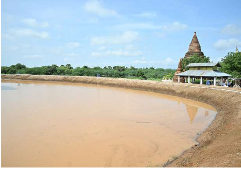
အရှေ့ဖွားစောကျေးရွာအနီးရှိ ဇေယျဝတီ(ဇေယျဝေရီ)ကန် ရေဝင်ရောက်မှုအခြေအနေကို တွေ့ရစဉ်။

ကောင်စီဥက္ကဋ္ဌ နိုင်ငံတော်ဝန်ကြီးချုပ်နှင့် အဖွဲ့ဝင်များသည် အနောက်ဖွားစောကျေးရွာ အနီးရှိ မင်္ဂလာကန်အမှတ်(၃) (မွန်းတိမ်းကန်)အတွင်း ရေဝင်ရောက်မှုအခြေအနေများကို သွားရောက်ကြည့်ရှုစစ်ဆေးရာ တာဝန်ရှိသူများက ရေဝင်ရောက်လျက်ရှိမှုအခြေအနေများကို ရှင်းလင်းတင်ပြသည်။