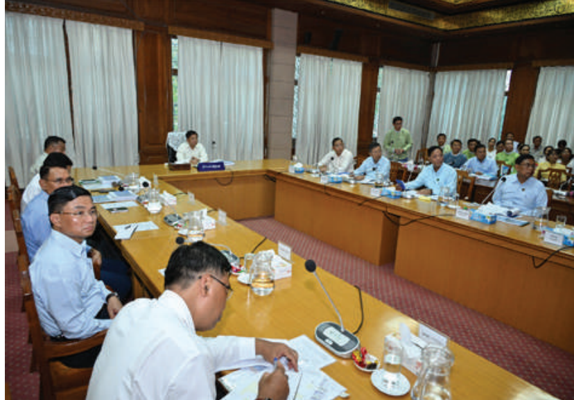
နိုင်ငံတော်စီမံအုပ်ချုပ်ရေး ကောင်စီဥက္ကဋ္ဌ နိုင်ငံတော်ဝန်ကြီးချုပ် ဗိုလ်ချုပ်မှူးကြီး မင်းအောင်လှိုင်အား ညောင်ဦးခရိုင်စီမံခန့်ခွဲရေး အဖွဲ့ဥက္ကဋ္ဌ ခရိုင်အုပ်ချုပ်ရေးမှူး ဦးစောထွန်းဝင်းက ညောင်ဦးခရိုင်အတွင်း ဒေသဖွံ့ဖြိုးတိုးတက်ရေး လုပ်ငန်းများဆောင်ရွက် လျက်ရှိမှု အခြေအနေများနှင့် ပတ်သက်၍ ရှင်းလင်း တင်ပြစဉ်။