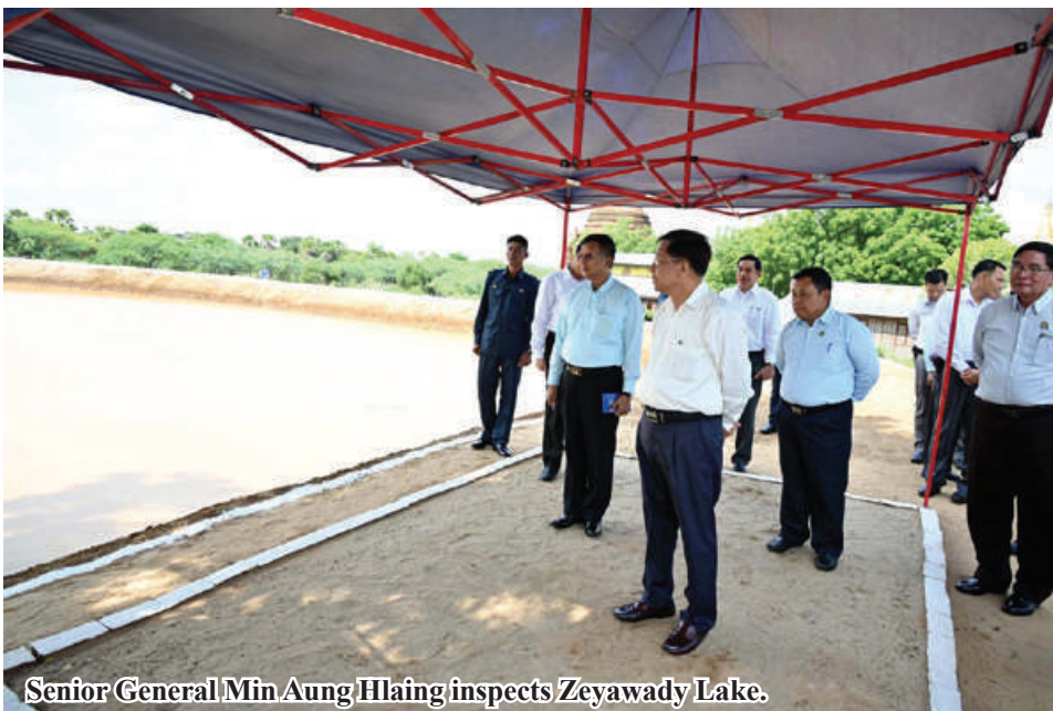
Senior General Min Aung Hlaing inspects Zeyawady Lake.

accomplishment of the guidance given by the Senior General on his tour of Bagan ancient cultural zone in May 2024 to green Bagan region and ensure proper flow of water, facts about the emerald lake, maintenance for its in successive eras, lesser storage of water at the emerald lake due to some water leakage and vapouring based on the geophysical survey, and undertaking of necessary maintenance for the lake, and inflow of water to the lake.