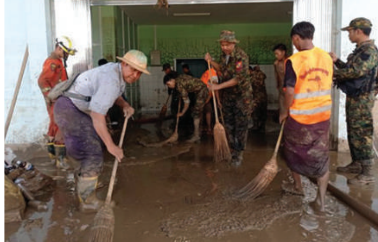
အလယ်ပိုင်းတိုင်းစစ်ဌာနချုပ် မိတ္ထီလာတပ်နယ်မှ တာဝန်ရှိသူများနှင့်ဌာနဆိုင်ရာ အဖွဲ့အစည်းများက သာစည်မြို့နယ် လှိုင်းတက်ကျေးရွာအုပ်စု လှိုင်းတက်ကျေးရွာ ၁၆ ခုတင်ဆုံ တိုက်နယ်ဆေးရုံသို့သွားရောက်၍ သန့်ရှင်းရေးလုပ်ငန်းများ ဆောင်ရွက်ပေးစဉ်။

နယ်၊ မန္တလေးတိုင်းဒေသကြီး သာစည်မြို့နယ်နှင့် ပဲခူးတိုင်းဒေသကြီး တောင်ငူမြို့နယ်၊ ရေတာရှည်မြို့နယ်နှင့် အုတ်တင်းမြို့နယ်များအတွင်းရှိ ရပ်ကွက်၊ ကျေးရွာများမှ ရေဘေးသင့်ပြည်သူများအား တပ်မတော်သားများ၊ မြန်မာနိုင်ငံရဲတပ်ဖွဲ့ဝင်များ၊ မီးသတ်တပ်ဖွဲ့ဝင်များ၊ ကြက်ခြေနီတပ်ဖွဲ့ဝင်များနှင့် လူမှုဝန်ထမ်းကယ်ဆယ်ရေးအဖွဲ့များက ကူညီကယ်ဆယ်ရွှေ့ပြောင်းပေးခြင်းလုပ်ငန်းများ ဆောင်ရွက်ပေးခြင်းနှင့် ရေများပြန်လည်ကျဆင်းသွားသည့် နေရာများရှိ လမ်း၊ တံတားများ၊ ရပ်ကွက်၊ ကျေးရွာများအတွင်း၌ တင်ကျန်ခဲ့သည့် နွန်းများ၊ သစ်ပင်သစ်ကိုင်းများဖယ်ရှားပေးခြင်းအပါအဝင် သန့်ရှင်းရေးလုပ်ငန်းများကို ဒေသခံပြည်သူများနှင့်ပူးပေါင်း၍ တက်ကြွစွာ ဆောင်ရွက်ပေးလျက်