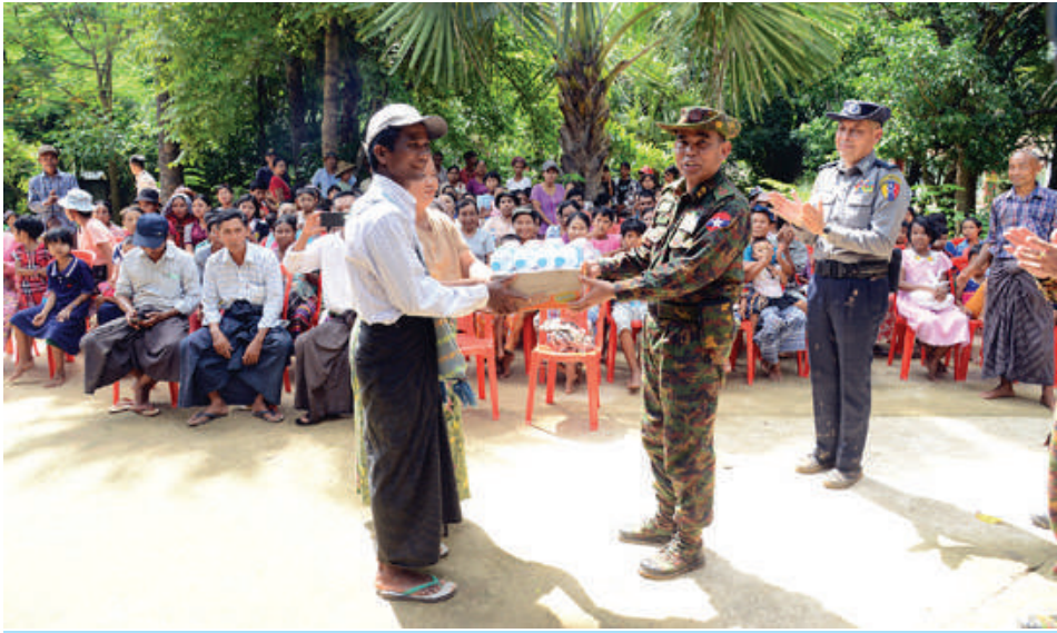
ကာကွယ်ရေးဦးစီးချုပ်ရုံး(ကြည်း)မှ ဒုတိယဗိုလ်ချုပ်ကြီးဖုန်းမြတ် ရေဘေးသင့်ပြည်သူများကို စားသောက်ဖွယ်ရာများနှင့် ရေသန့်ဘူးများ ထောက်ပံ့ပေးအပ်စဉ်။