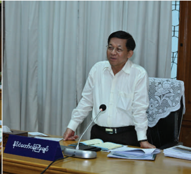
နိုင်ငံတော်စီမံအုပ်ချုပ်ရေး ကောင်စီဥက္ကဋ္ဌ နိုင်ငံတော်ဝန်ကြီးချုပ် ဗိုလ်ချုပ်မှူးကြီး မင်းအောင်လှိုင် ညောင်ဦးခရိုင်အတွင်းရှိ ဌာနဆိုင်ရာ တာဝန်ရှိသူများနှင့် တွေ့ဆုံ၍ ဒေသဖွံ့ဖြိုးတိုးတက်ရေး ဆိုင်ရာများကို ဆွေးနွေးပြောကြားစဉ်။