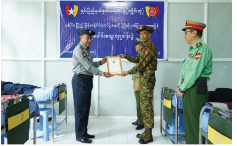
ကြိုဒေသတိုင်းစစ်ဌာနချုပ် တိုင်းမှူး ဗိုလ်မှူးချုပ်စိုးလှိုင် သွေးအလှူရှင်များအတွက် ဂုဏ်ပြုမှတ်တမ်းလွှာနှင့် ချီးမြှင့်ငွေများပေးအပ်စဉ်။

လှူဒါန်းနေမှုများကို လိုက်လံကြည့်ရှုအားပေးပြီး သွေးအလှူရှင်များအတွက် အာဟာရဖြည့်စားသောက်ဖွယ်ရာများ၊ ဂုဏ်ပြုမှတ်တမ်းလွှာနှင့် ဂုဏ်ပြုချီးမြှင့်ငွေများပေးအပ်သည်။ အဆိုပါ သွေးလှူဒါန်းပွဲတွင် ရဲတပ်ဖွဲ့ဝင် ၃၂ ဦးနှင့် မှီခိုသူမိသားစုဝင် ၁၃ ဦး စုစုပေါင်း ၄၅ ဦးတို့က အိုသွေး ၁၉ ပုလင်း၊ အေးသွေး ၁၄ ပုလင်း၊ ဘီသွေး ၁၁ ပုလင်းနှင့် အေဘီသွေး တစ်ပုလင်းတို့ကို လှူဒါန်းခဲ့ကြောင်း သတင်းရရှိသည်။ (၅၀၁)