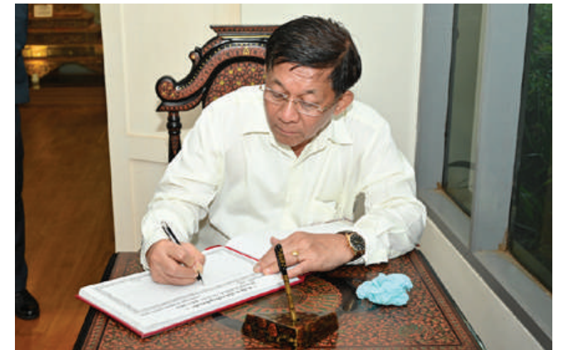
နိုင်ငံတော်စီမံအုပ်ချုပ်ရေးကောင်စီဥက္ကဋ္ဌ နိုင်ငံတော်ဝန်ကြီးချုပ် ဗိုလ်ချုပ်မှူးကြီး မင်းအောင်လှိုင် ယွန်းပညာကောလိပ် ဧည့်သည်တော်မှတ်တမ်းစာအုပ်တွင် မှတ်တမ်း တင် လက်မှတ်ရေးထိုးစဉ်။

နိုင်ငံတော်စီမံအုပ်ချုပ်ရေး ကောင်စီဥက္ကဋ္ဌ နိုင်ငံတော်ဝန်ကြီးချုပ် ဗိုလ်ချုပ်မှူးကြီး မင်းအောင်လှိုင် ယွန်းပညာကောလိပ်ရှိ ဆရာ၊ ဆရာမများနှင့် ကျောင်းသား၊ ကျောင်းသူများအတွက် ချီးမြှင့်ငွေများ ပေးအပ်စဉ်။