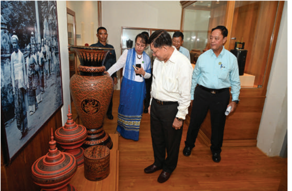
နိုင်ငံတော်စီမံအုပ်ချုပ်ရေးကောင်စီဥက္ကဋ္ဌ နိုင်ငံတော်ဝန်ကြီးချုပ် ဗိုလ်ချုပ်မှူးကြီးမင်းအောင်လှိုင် ယွန်းပြတိုက်အတွင်း ခင်းကျင်းပြသထားသည့် ယွန်းထည်များကို ပြခန်းတစ်ခုချင်းစီအလိုက် စိတ်ဝင်တစား လှည့်လည်ကြည့်ရှုစဉ်။