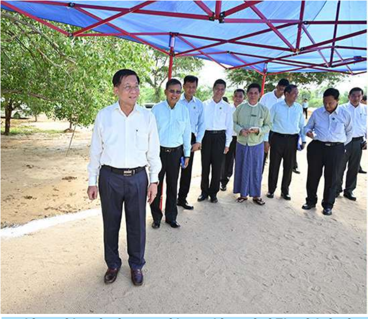
နိုင်ငံတော်စီမံအုပ်ချုပ်ရေးကောင်စီဥက္ကဋ္ဌ နိုင်ငံတော်ဝန်ကြီးချုပ် ဗိုလ်ချုပ်မှူးကြီးမင်းအောင်လှိုင် အနောက်ဖွားစောကျေးရွာအနီးရှိ မင်္ဂလာကန်အမှတ်(၃)(မွန်းတိမ်းကန်)အတွင်း ရေဝင်ရောက်မှုအခြေအနေကို ကြည့်ရှုစစ်ဆေးစဉ်။