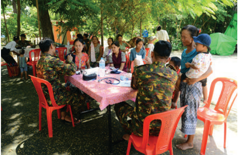
နယ်မြေခံဆေးကုသရေးအဖွဲ့က ရေဘေးသင့်ပြည်သူများကို ကျန်းမာရေးစောင့်ရှောက်မှုလုပ်ငန်းများ ဆောင်ရွက်ပေးစဉ်။

ထောက်ပံ့ငွေများကို လိုက်လံပေးအပ်လျက်ရှိသည်။ ထိုသို့ ဆောင်ရွက်ပေးနေမှုများကို နေပြည်တော်ကောင်စီဥက္ကဋ္ဌကာကွယ်ရေးဦးစီးချုပ်ရုံး(ကြည်း)မှ ဒုတိယဗိုလ်ချုပ်ကြီးဖုန်းမြတ်နှင့် သက်ဆိုင်ရာတိုင်းစစ်ဌာနချုပ်များမှ တိုင်းမှူးများနှင့် တာဝန်ရှိသူများက သွားရောက်ကြည့်ရှုအားပေးပြီး ရေဘေးသင့် ပြည်သူများအတွက် ထောက်ပံ့ပစ္စည်းများ၊ အဝတ်အထည်များနှင့် စားသောက်ဖွယ်ရာများ ပေးအပ်၍ ရင်းရင်းနှီးနှီးအားပေးစကားများ ပြောကြားကာ လိုအပ်သည်များပေါင်းစပ်ညှိနှိုင်း ဆောင်ရွက်ပေးခဲ့ကြကြောင်း သတင်းရရှိသည်။ (၅၀၁)