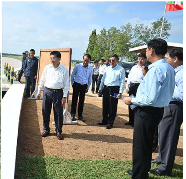
နိုင်ငံတော်စီမံအုပ်ချုပ်ရေးကောင်စီဥက္ကဋ္ဌ နိုင်ငံတော်ဝန်ကြီးချုပ် ဗိုလ်ချုပ်မှူးကြီးမင်းအောင်လှိုင် တရုတ်တောင်စိမ်းလန်းစိုပြည်ရေးလုပ်ငန်းစီမံကိန်း ဆောင်ရွက်လျက်ရှိမှု အခြေအနေကို ကြည့်ရှုစစ်ဆေးစဉ်။