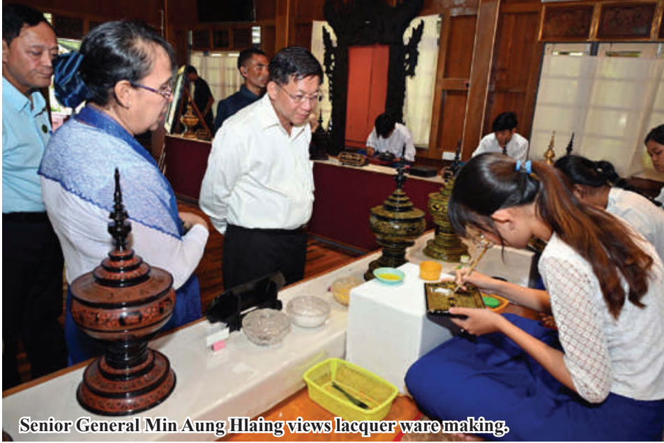
Senior General Min Aung Hlaing views lacquer ware making.

From Page 13 Rural Development U Hla Moe first explained the primary responsibilities of the college, the vocational training courses offered, the recognition of the National Skills Standards Authority (NSSA) for the lacquer ware industry, the operations of libraries, dormitories, train-