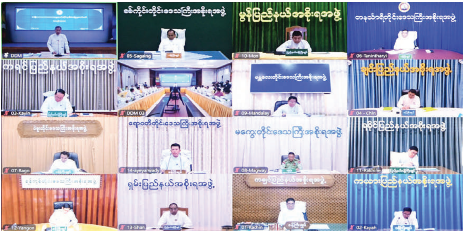
အမျိုးသားသဘာဝဘေးအန္တရာယ်ဆိုင်ရာ စီမံခန့်ခွဲမှုကော်မတီအစည်းအဝေး (၂/၂၀၂၄)သို့ တိုင်းဒေသကြီး၊ ပြည်နယ်ဝန်ကြီးချုပ်များနှင့် တာဝန်ရှိသူများက ဗီဒီယိုကွန်ဖရင့်စနစ်ဖြင့် တက်ရောက်ကြသည်။

ယခုဗီယက်နမ်နိုင်ငံသို့ ဝင်ရောက်တိုက်ခတ်ခဲ့သည့် ရာဂီတိုင်းဖွန်းမုန်တိုင်းကြီးသည် အားအလွန်ကောင်းစွာဖြင့် စက်တင်ဘာ ၇ ရက်တွင် တစ်နာရီလျှင် မိုင် ၁၃၀ ထိတိုက်ခတ်ခဲ့ရာ အဆိုပါ မုန်တိုင်းအရှိန်ကြောင့် အကြွင်းကျန်