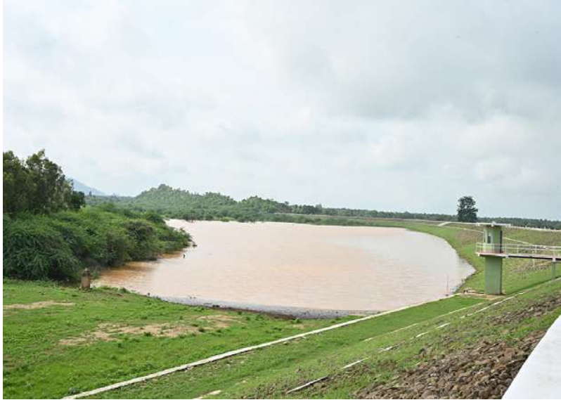
မြကန်ရေလှောင်တံခံ ရေဝင်ရောက်မှု အခြေအနေကို တွေ့ရစဉ်။

များအတွင်း ရေထိန်းတံခံထိန်းသိမ်းပင်များ စိုက်ပျိုးထားရန်လိုကြောင်း၊ ကန်များအနီးပတ်ဝန်းကျင်တွင် စိုက်ပျိုးသီးနှံစိုက်ပျိုးခြင်းများဆောင်ရွက်မှုကြောင့် ရေကန်အတွင်းသို့ ရေဝင်ရောက်မှုလျော့နည်းနိုင်သည့်အတွက် သီးနှံစိုက်ပျိုးမှုများကို သတ်မှတ်အကွာအဝေးတွင်သာရှိစေရေး စည်းကမ်းများ၊ ဥပဒေများနှင့်အညီ တားမြစ်ဆောင်ရွက်ထားရှိရန်လိုကြောင်း၊ ယခုရေကန်များအတွင်း ယခုကဲ့သို့ ရေများ စုဆောင်းထားရှိနိုင်သည့်အတွက် သုံးရေအတွက် အထောက်အကူပြုစေနိုင်မည်ဖြစ်သကဲ့သို့ ပုဂံဒေသစီမံခန့်ခွဲရေးအတွက်လည်း အကျိုးရှိစေနိုင်မည်ဖြစ်သဖြင့် တံခံများ၊ ရေကန်များကိုစနစ်တကျ ဆက်လက် ထိန်းသိမ်းဆောင်ရွက်သွားကြရန်လိုကြောင်းဖြင့် မှာကြားသည်။