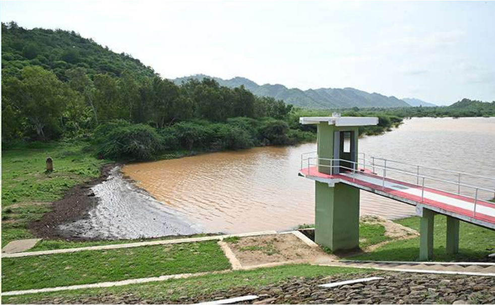
နိုင်ငံတော်စီမံအုပ်ချုပ်ရေးကောင်စီဥက္ကဋ္ဌ နိုင်ငံတော်ဝန်ကြီးချုပ် ဗိုလ်ချုပ်မှူးကြီးမင်းအောင်လှိုင် ပုဂံရှေးဟောင်းယဉ်ကျေးမှုနယ်မြေရှိ မြန်မာ့ရေလျှောင်တမ်းဧရိယာအတွင်း လှည့်လည်ကြည့်ရှုစဉ်။

ရှင်သန်ဖြစ်ထွန်းမှု၊ မိတ္ထီလာမြို့နယ် ကျောက်ပန်းတောင်းမြို့နယ်နှင့် ညောင်ဦးမြို့နယ်တို့၌ ယခုနှစ် မိုးရာသီတွင် မိတ္ထီလာ-ကျောက်ပန်းတောင်း-ညောင်ဦး ကားလမ်း ဘေးဝဲယာ စိမ်းလန်းစိုပြည်ရေး တစ်အုပ်တစ်မစိုက်ခင်းများ တည်ဆောက်ထားမှု အခြေအနေများကို တာဝန်ရှိသူများက ရှင်းလင်းတင်ပြကြသည်။