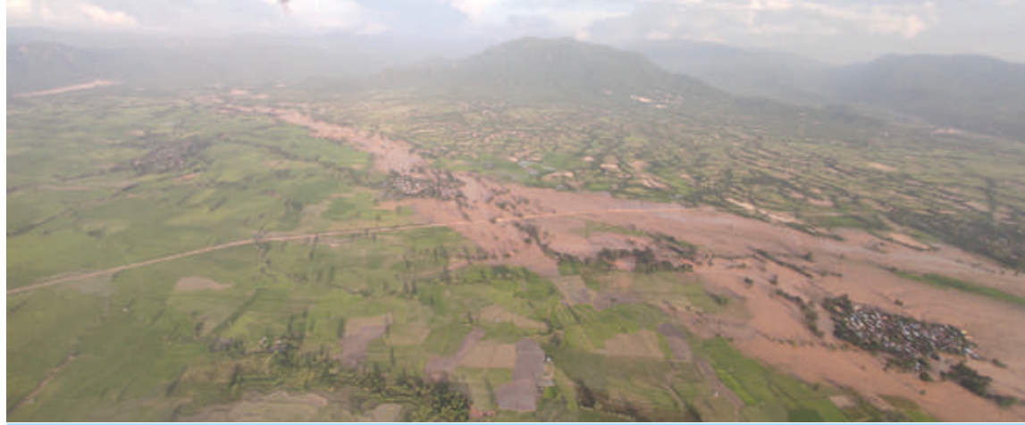
ရေတိုက်စားရာလမ်းကြောင်းတစ်လျှောက် ရေဖုံးလွှမ်းမှုများနှင့် ရေပြန်လည်ကျဆင်းသွားပြီးနောက် သဲနုန်းများ၊ အပျက်အစီးများ ဖြစ်ပေါ်လျက်ရှိနေမှု၊ စိုက်ကေအများအပြား ပျက်စီးခဲ့မှုနှင့် အချို့သောကျေးရွာများ ရေဖုံးလွှမ်းထိခိုက်ပျက်စီးနေမှုကို တွေ့ရစဉ်။

ဖြစ်သကဲ့သို့ စာဖတ်ရန်လည်းလိုအပ်မည်ဖြစ်သဖြင့် စာကြည့်တိုက်များ ဖွံ့ဖြိုးတိုးတက်ရေးနှင့် စာဖတ်ရုံနှင့်မြှင့်တင်ရေး