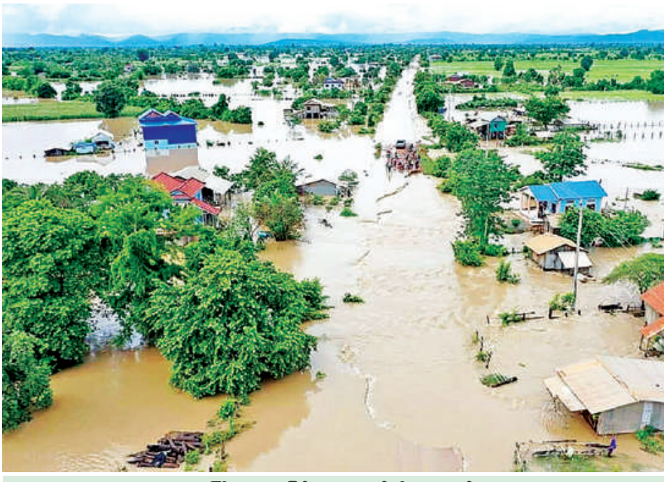
ရေကြီးရေလျှံမှုဖြစ်ပွားနေသည်ကို တွေ့ရစဉ်။

ရေသေသည် အန္တရာယ်ဖြစ်နိုင်ခြေနည်းပြီး အရှိန်အဟုန်နှင့် စီးဆင်းနေသော ရေကမူ အန္တရာယ် ရှိနိုင်သည်ကိုသတိပြုကြရန်လိုအပ်သည်။