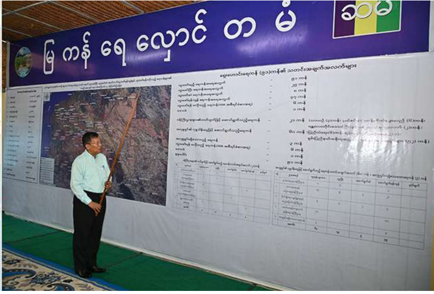
နိုင်ငံတော်စီမံအုပ်ချုပ်ရေးကောင်စီဥက္ကဋ္ဌ နိုင်ငံတော်ဝန်ကြီးချုပ် ဗိုလ်ချုပ်မှူးကြီးမင်းအောင်လှိုင်အား သာသနာရေးနှင့်ယဉ်ကျေးမှုဝန်ကြီးဌာန ပြည်ထောင်စုဝန်ကြီး ဦးတင်ဦးလွင်က ပုဂံကမ္ဘာ့အမွေအနှစ်ဒေသရှိ ရှေးဟောင်းရေကန် ၉၁ ကန်အနက် တူးဖော်ပြီးတူးဖော်ဆဲ၊ ဆက်လက်တူးဖော်ရန်ကျန်ရှိသည့် ရေကန်များ၏ အခြေအနေများနှင့် ပတ်သက်၍ ရှင်းလင်းတင်ပြစဉ်။

ရှေး ဖုံးမှအဆက် တူးဖော်ဆဲ၊ ဆက်လက်တူးဖော်ရန်ကျန်ရှိသည့် တူးဖော်ရန် မလိုသည့်ရေကန်များ၏ အခြေအနေများ၊ ဝန်ကြီးဌာနများက တာဝန်ယူ ဆောင်ရွက်သည့်ရေကန်များနှင့် အလှူရှင်များ၏ လှူဒါန်းငွေများဖြင့် ဆောင်ရွက်သည့် ရေကန်များ၏အခြေအနေများ၊ ရေဝင်ရေထွက်လမ်းကြောင်းများကို လိုအပ်သည့် ပြုပြင်ထိန်းသိမ်းမှုများ ဆောင်ရွက်ထားရှိသောကြောင့် ရာဂီမုန်တိုင်းဖြစ်ပေါ်ခဲ့ချိန် မိုးသည်းထန်စွာရွာသွန်းခဲ့ချိန်၌ သတ်မှတ်လမ်းကြောင်းများအတိုင်းစီးဝင်ခဲ့မှု၊ ပုဂံ ရှေးဟောင်းယဉ်ကျေးမှု နယ်မြေအတွင်း စက်တင်ဘာ ၁၁ ရက်နှင့် ၁၂ ရက်တို့တွင် မိုးရေချိန် စုစုပေါင်း ၁၀ ဒသမ ၇၁ လက်မထိ ရှိခဲ့သော်လည်း ရေဝင်ရေထွက်လမ်းကြောင်းများရှင်းလင်းခြင်းနှင့် ရေကန်များကိုကြိုတင်