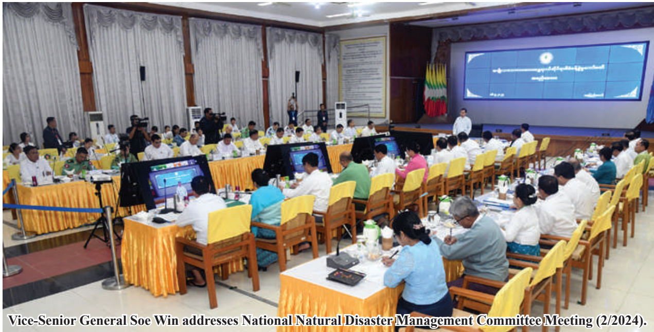
Vice-Senior General Soe Win addresses National Natural Disaster Management Committee Meeting (2/2024).