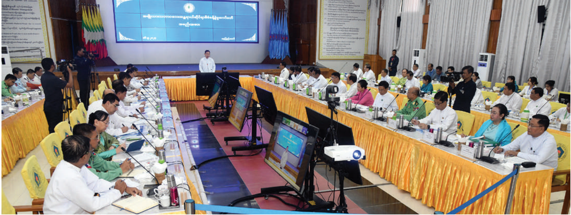
အမျိုးသားသဘာဝဘေးအန္တရာယ်ဆိုင်ရာစီမံခန့်ခွဲမှုကော်မတီဥက္ကဋ္ဌ နိုင်ငံတော်စီမံအုပ်ချုပ်ရေးကောင်စီ ဒုတိယဥက္ကဋ္ဌ ဒုတိယဝန်ကြီးချုပ် ဒုတိယဗိုလ်ချုပ်မှူးကြီးစိုးဝင်း အမျိုးသားသဘာဝဘေးအန္တရာယ်ဆိုင်ရာ စီမံခန့်ခွဲမှုကော်မတီအစည်းအဝေး(၂/၂၀၂၄)တွင် အမှာစကားပြောကြားစဉ်။