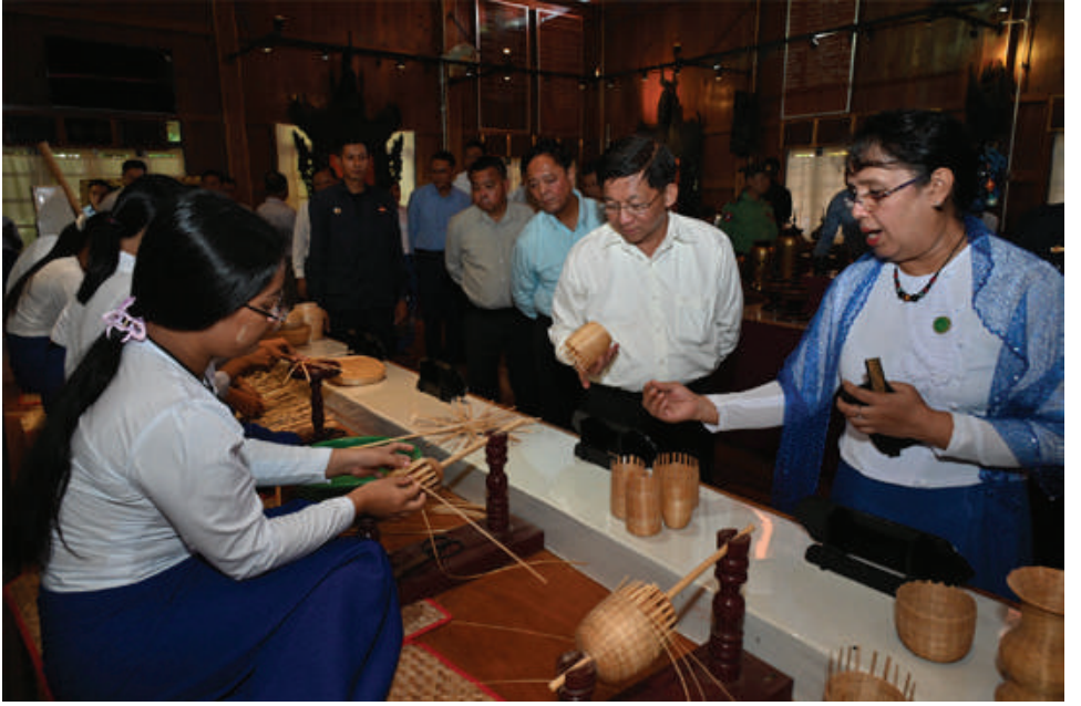
နိုင်ငံတော်စီမံအုပ်ချုပ်ရေးကောင်စီဥက္ကဋ္ဌ နိုင်ငံတော်ဝန်ကြီးချုပ် ဗိုလ်ချုပ်မှူးကြီးမင်းအောင်လှိုင် သင်တန်းသား၊ သင်တန်းသူများ၏ ယွန်းနည်းစဉ်အဆင့်ဆင့်အား လက်တွေ့ဆောင်ရွက်နေမှုများကို လှည့်လည်ကြည့်ရှုစဉ်။