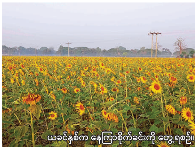
ယခင်နှစ်က နေကြာစိုက်ခင်းကို တွေ့ရစဉ်။

ပွင့်ဖြူမြို့နယ်တွင် ဒေသခံတောင်သူများကပြည်တွင်းစားသုံးဆီဖူလုံစေရန်နှင့် သီးနှံဝင်ငွေတိုးပွားစေရန်အတွက်စိုက်ပျိုးစရိတ်အကုန်အကျသက်သာသည့် ဆီထွက်သီးနှံနေကြာကို မိုးရာသီနှင့်ဆောင်းရာသီတွင် အဓိကစိုက်ပျိုးကြကြောင်း၊ ယခုနှစ် ဆောင်းသီးနှံစိုက်ပျိုးရာသီတွင်လည်း ဆီထွက်သီးနှံနေကြာ ၁၂၈၀၅ ဧက