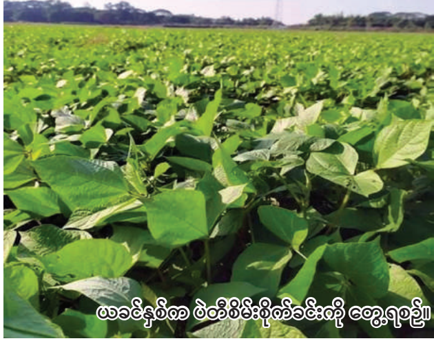
ဖာခင်နယ်စာ ပဲတီစိမ်းစိုက်ခင်းကို တွေ့ရပေသည်။

ကောလင်း စက်တင်ဘာ ၁၁ ရှမ်းပြည်နယ် (တောင်ပိုင်း) လင်းခေခရိုင် မောက်မယ်မြို့နယ် ကျေးလက်ဒေသဖွံ့ဖြိုးတိုးတက်ရေးဦးစီးဌာနက နောင်ဗိုကျေးရွာ၌ ဒုတိယအကြိမ် မြစ်စိမ်း ရောင်ကျေးရွာ စီမံကိန်းအရင်း မပျောက် လည်ပတ်ရန်ပုံငွေ ထုတ်ချေးခြင်းကို စက်တင်ဘာ ၁၀ ရက် နံနက်ပိုင်းက အဆိုပါ ကျေးရွာ၌ ကျင်းပပြုလုပ်ခဲ့ကြောင်း သိရသည်။