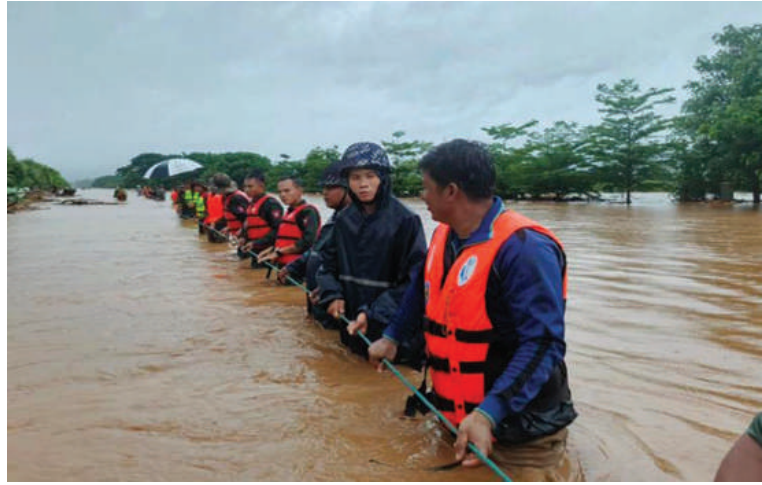
နယ်မြေခံတပ်မတော်သားများ၊ မြန်မာနိုင်ငံရဲတပ်ဖွဲ့ဝင်များ၊ မီးသတ်တပ်ဖွဲ့ဝင်များ၊ ကြက်ခြေနီတပ်ဖွဲ့ဝင်များနှင့် ပရဟိတအသင်းအဖွဲ့များက နေပြည်တော်ကောင်စီနယ်မြေ ပုဗ္ဗသီရိမြို့နယ် ဥယျာဉ်စုကျေးရွာအုပ်စု ဆင်တံကြီးရွာနှင့် ဇေယျာသီရိမြို့နယ် သိုက်ချောင်းကျေးရွာသို့ ဆက်သွယ်ထားသော ကွန်ကရစ်လမ်း(မြို့ပတ်လမ်း) ရေကျော်သဖြင့် ကူညီကယ်ဆယ်ရေးလုပ်ငန်းများ ဆောင်ရွက်ပေးစဉ်။