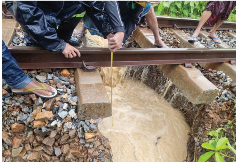
ရန်ကုန်-မန္တလေးရထားလမ်းပိုင်း ရှမ်းရွာနှင့်ပျော်ဘွယ်ဘူတာအကြား ရထားလမ်းတာပေါင်များရေတိုက်စားပြီး ထူးပေါက်မှုအခြေအနေကို တွေ့ရစဉ်။