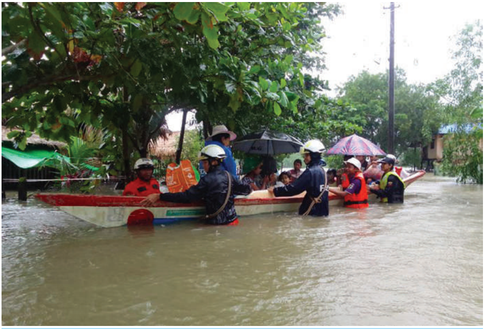
ကျိုက်ထိုမြို့နယ်အတွင်း ကဒတ်ချောင်းရေမြင့်တက်လာမှုကြောင့် ရေကြီးရေလျှံမှုဖြစ်ပွားသည့် နေရာများတွင် လူမှုကူညီရေးအသင်းအဖွဲ့များက ကူညီကယ်ဆယ်ရေးလုပ်ငန်းများ ဆောင်ရွက်စဉ်။

နေပြည်တော် စက်တင်ဘာ ၁၁ တောင်တရုတ်ပင်လယ်ပြင်တွင် ဖြစ်ပေါ်ခဲ့သော တိုင်းဖွန်းမုန်တိုင်း ရာဂီ၏အရှိန်နှင့် ဘင်္ဂလားပင်လယ်အော်အနောက်အလယ်ပိုင်းနှင့် အနောက်မြောက်ပိုင်းတို့တွင် ဖြစ်ပေါ်နေသော မုန်တိုင်းငယ်၏အရှိန်ကြောင့် နေပြည်တော်ဝန်းကျင်တွင် စက်တင်ဘာ ၈ ရက်တွင် နေရာကျကျ၊ ၉ ရက်တွင် နေရာစိပ်စိပ်၊ ၁၀ ရက်နှင့် ၁၁ ရက်တို့တွင် နေရာအနှံ့အပြားမိုးအဆက်မပြတ်ရွာသွန်းခဲ့ပြီး ယနေ့တွင် မိုးရေချိန်အနည်းဆုံး သူညီ ၁၁ မ ၆၇ လက်မမှ အများဆုံး ၄၃၀ မ ၂၁ လက်မထိ ရွာသွန်းခဲ့ကာ နေပြည်တော် ကောင်စီနယ်မြေအတွင်း ဖြတ်သန်းစီးဆင်းလျက်ရှိသည့် ငလိုက်ချောင်း၊ ဆင်သေချောင်းနှင့်ပေါင်းလောင်းမြစ်တို့တွင် မြစ်ရေများ အဆက်မပြတ်မြင့်တက်လျက်ရှိသည်။ ထိုသို့ မိုးအဆက်မပြတ်ရွာသွန်းမှုများကြောင့် ချောင်းရေနှင့် မြစ်ရေများအဆက်မပြတ်မြင့်တက်လာမှုနှင့်အတူ နေပြည်တော်ကောင်စီနယ်မြေအတွင်း ရေကြီးရေလျှံမှုများဖြစ်ပေါ်ခဲ့ပြီး တပ်ကုန်းမြို့နယ်တွင် ယနေ့နံနက်ပိုင်းမှစတင်၍ ရေများ မြင့်တက်လာ