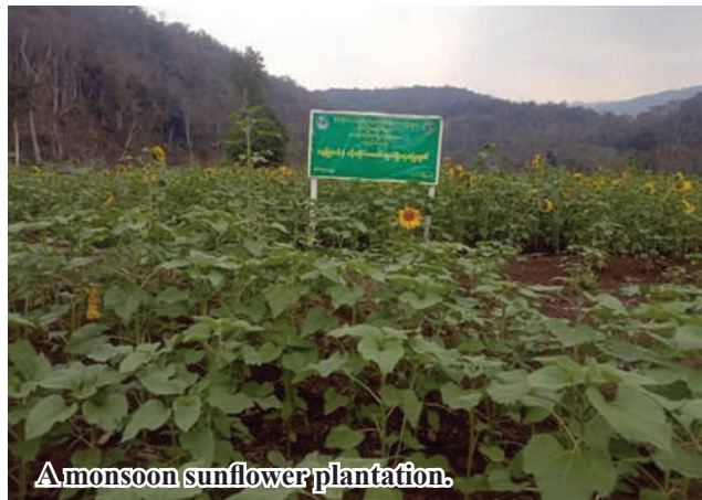
A monsoon sunflower plantation.

the expansion of sunflower cultivation and training courses are being conducted at a high speed for the employees and the farmers who will grow sunflowers to improve their performance. 206