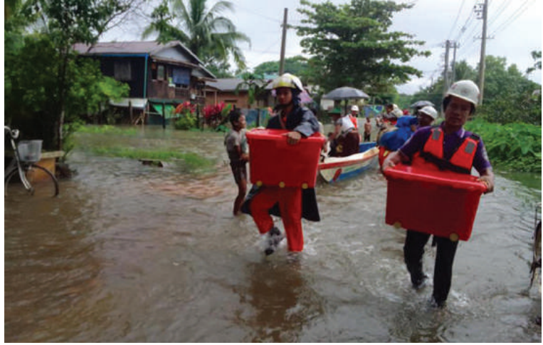
ကျိုက်ထိုမြို့နယ်အတွင်း ကဒတ်ချောင်းရေမြင့်တက်လာမှုကြောင့် ရေကြီးရေလျှံမှုဖြစ်ပွားသည့်နေရာများတွင် လူမှုကူညီရေးအသင်းအဖွဲ့များက ကူညီကယ်ဆယ်ရေးလုပ်ငန်းများ ဆောင်ရွက်စဉ်။

ဆိုင်ရာတာဝန်ရှိသူများ၊ တပ်မတော်သားများ၊ မြန်မာနိုင်ငံရဲတပ်ဖွဲ့ဝင်များ၊ မီးသတ်တပ်ဖွဲ့ဝင်များ၊ ကြက်ခြေနီတပ်ဖွဲ့ဝင်များနှင့် ပရဟိတအသင်းအဖွဲ့များက ကူညီကယ်ဆယ်ရေးလုပ်ငန်းများကို အချိန်နှင့်တစ်ပြေးညီ တက်တက်ကြွကြွ ကူညီဆောင်ရွက်ပေးလျက်ရှိသည်။ ယခုကဲ့သို့ မိုးအဆက်မပြတ်ရွာသွန်းမှုများကြောင့် မြစ်ချောင်းများအတွင်း ရေကြီးရေလျှံမှုများဖြစ်ပေါ်လာနိုင်သဖြင့် မြစ်ချောင်းများတစ်လျှောက်ရှိ မြေနိမ့်ပိုင်းဧရိယာများနှင့် ကျေးရွာများတွင် နေထိုင်ကြသော ဒေသခံပြည်သူများအနေဖြင့် ရေဘေးအန္တရာယ်သတိပြုနေထိုင်နိုင်ရေး အသိပေးနှိုးဆော်တိုက်တွန်းထားကြောင်း သတင်းရရှိသည်။ (၅၀၁)