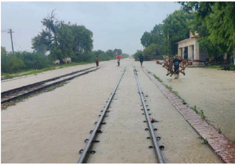
ရန်ကုန်-မန္တလေးရထားလမ်းပိုင်း ရွှေဒါး-ပျော်ဘွယ်ဘူတာအကြားနှင့် ပျော်ဘွယ်ဘူတာရထားလမ်းရေကျော်မှုအခြေအနေကို တွေ့ရစဉ်။

တံတားအမှတ်(၄၈)၏ ရွှေညောင်ဘက် တာပေါင်အား ရေတိုက်စားနေခြင်း၊ ကမ်းကပ်ခံရေတိုက်စားခြင်းနှင့် ရထားလမ်း ကလေး-မြင်းဒိုက်ဘူတာအကြား ခြောက်