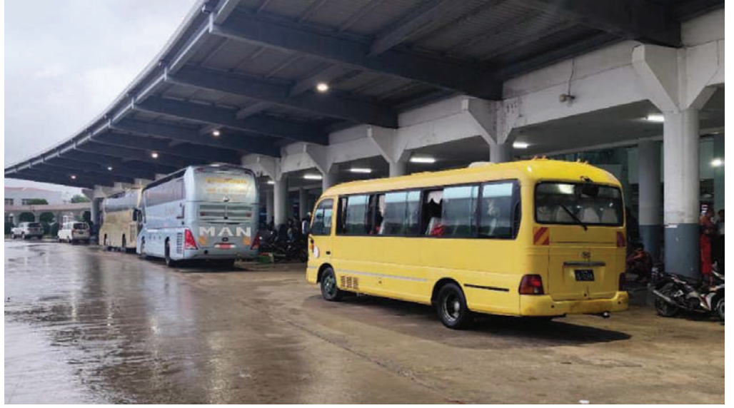
ရန်ကုန်-မန္တလေး အမှတ်(၁၁)အဆန် လူစီးအမြန်ရထားစီးခရီးသည်များကို နေပြည်တော်ဘူတာမှ မန္တလေးသို့ မော်တော်ယာဉ်များဖြင့် ပို့ဆောင်ပေးနေမှုကို တွေ့ရစဉ်။