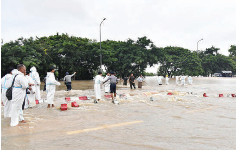
နယ်မြေခံတပ်မတော်သားများနှင့် ဌာနဆိုင်ရာတာဝန်ရှိသူများက နေပြည်တော်ကောင်စီနယ်မြေအတွင်းရှိ ရေကြီးရေလျှံမှုဖြစ်ပွားလျက်ရှိသည့်နေရာများတွင် ကူညီကယ်ဆယ်ရေးလုပ်ငန်းများ ဆောင်ရွက်ပေးစဉ်။