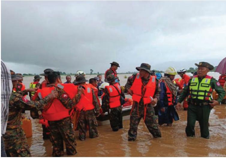
နယ်မြေခံတပ်မတော်သားများက နေပြည်တော်ကောင်စီနယ်မြေ ပုဗ္ဗသီရိမြို့နယ် ဥယျာဉ်စုကျေးရွာအုပ်စု ဆင်တံကြီးရွာနှင့် ဇေယျာသီရိမြို့နယ် သိုက်ချောင်းကျေးရွာသို့ ဆက်သွယ်ထားသော ကွန်ကရစ်လမ်း(မြို့ပတ်လမ်း) ရေကျော်သဖြင့် ကူညီကယ်ဆယ်ရေးလုပ်ငန်းများ ဆောင်ရွက်ပေးစဉ်။

ထို့အတူ မွန်ပြည်နယ် ကျိုက်ထိုမြို့နယ်တွင် မိုးသည်းထန်စွာရွာသွန်းမှုကြောင့် ကော့ထင်းကျေးရွာအုပ်စု ရန်ကုန်-မော်လမြိုင်သွား ကားလမ်း၊ ရေကျော်မှုဖြစ်ပွားခဲ့သည်။ အဆိုပါကားလမ်းရေကျော်နေမှုကြောင့် ယာဉ်များပုံမှန်သွားလာနိုင်ရေး၊ ပိတ်ဆို့မှုဖြစ်ပေါ်စေရေး၊ လမ်းကြောင်းရှင်းလင်းရေးနှင့် ရေလမ်းကြောင်းပြသရန်အတွက် ဌာနဆိုင်ရာအဖွဲ့အစည်းများနှင့် ပရဟိတအဖွဲ့များက ပူးပေါင်းဆောင်ရွက်