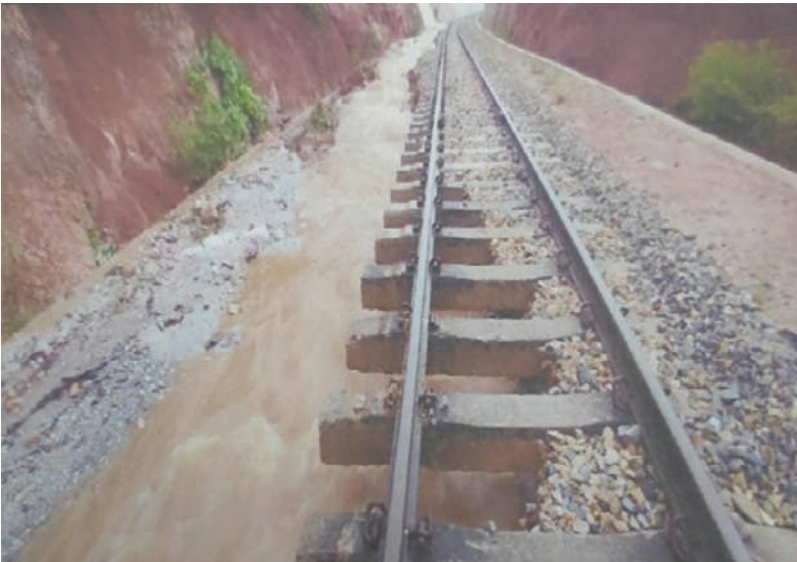
ရွှေညောင်-တောင်ကြီးလမ်းပိုင်း၊ ထီသိမ်-ပေါမူကြား တာပေါင်ရေတိုက်စားမှုအခြေအနေကို တွေ့ရစဉ်။