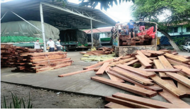
နေပြည်တော် စက်တင်ဘာ ၁၁ သယ်ယူပို့ဆောင်ရေးနှင့် သဘာဝပတ်ဝန်းကျင်