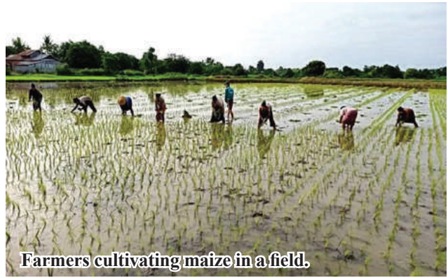
Farmers cultivating maize in a field.

Maize yields more than 50 baskets per acre, costing K500,000 per acre, and corns, 15,000 pieces of corns per acres with more than K500,000 cost. 206