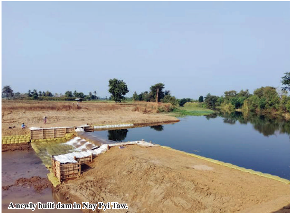
A newly built dam in Nay Pyi Taw.

Nay Pyi Taw September 11 The Department of Irrigation and Water Utilization Management stated that eleven dams have been built in Nay Pyi Taw Council Area, these facilities irrigated more than 1,200 acres of summer crops. Nay Pyi Taw Council Area has more than 320,000 acres of cultivable lands