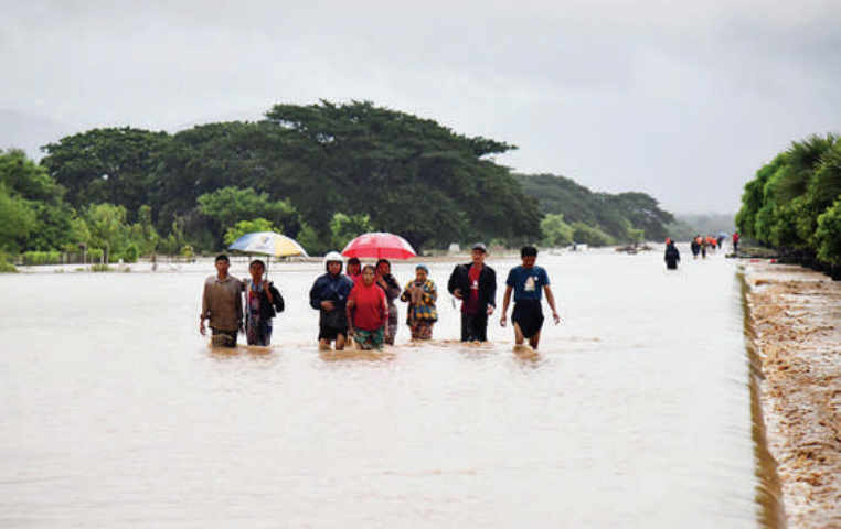
နယ်မြေခံတပ်မတော်သားများနှင့် ဌာနဆိုင်ရာတာဝန်ရှိသူများက နေပြည်တော်ကောင်စီနယ်မြေအတွင်းရှိ ရေကြီးရေလျှံမှုဖြစ်ပွားလျက်ရှိသည့်နေရာများတွင် ကူညီကယ်ဆယ်ရေးလုပ်ငန်းများ ဆောင်ရွက်ပေးစဉ်။