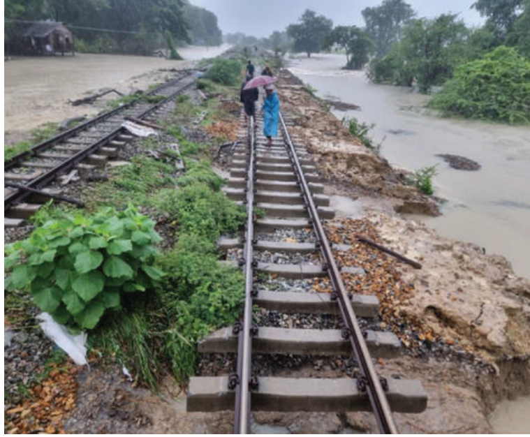
သာစည်-ရွှေညောင်လမ်းပိုင်း လှိုင်းတက်နှင့် ဘုရားငါးဆူကြား တံတားရေတိုက်စားမှုအခြေအနေကို တွေ့ရစဉ်။