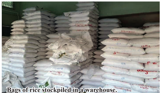
Bags of rice stockpiled in a warehouse.

gon. The rice is commonly shipped in containers. The demand for rice started increasing significantly from the first week of August, and the business owners continue to consistently sell and transport rice. Since there have been no obstacles, traders are able to sell and transport smoothly." It was reported that the rice transported from Pyapon Township to Yangon was priced at 55,000 kyats per bag of rice. Due to increased sales and good prices, rice and paddy traders, trading business owners, freight handlers, and truck drivers are all experiencing favorable conditions. KKL