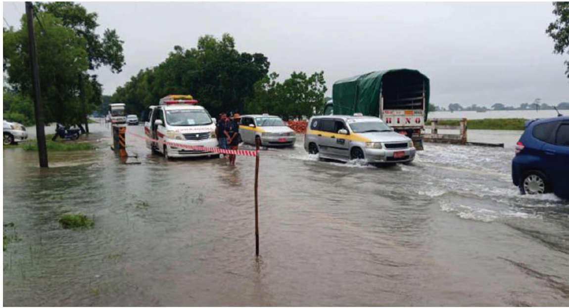
ကျိုက်ထိုမြို့နယ် ရန်ကုန်-မော်လမြိုင်သွားကားလမ်းရေကျော်မှုကို တွေ့ရစဉ်။

နှင့် ၂၈၅/၉)ကြား အမှတ်(၁)သံလမ်းပေါ်ရှိ သံပေါင်တံတားဒေါက်တိုင်မှာ ရေတိုက်စားမှုကြောင့် ပြုတ်ထွက်သွားသဖြင့် မီးရထားလိုင်းများပြေးဆွဲခြင်းကို ယာယီရပ်နားထားကြောင်း၊ မီးရထားများပုံမှန်ပြေးဆွဲနိုင်ရန်အတွက် သံပေါင်တံတားကို သက်ဆိုင်ရာတာဝန်ရှိသူများက အမြန်ဆုံးပြင်ဆင်ဆောင်ရွက်သွားမည်ဖြစ်ကြောင်း သိရသည်။ အလားတူ ရှမ်းပြည်နယ်(တောင်ပိုင်း) ပအိုဝ်းကိုယ်ပိုင်အုပ်ချုပ်ခွင့်ရဒေသ ဟိုပုံးမြို့နယ်တွင် မိုးအဆက်မပြတ်ရွာသွန်းမှုကြောင့် ရေကြီးရေလျှံမှုဖြစ်ပွားကာ အခြေခံပညာစာသင်ကျောင်းအချို့ယာယီပိတ်ထားရကြောင်း သိရသည်။ ထိုသို့ ရေကြီးရေလျှံမှုများဖြစ်ပေါ်နေသည့်နေရာများသို့ ဒေသအလိုက် ဌာန