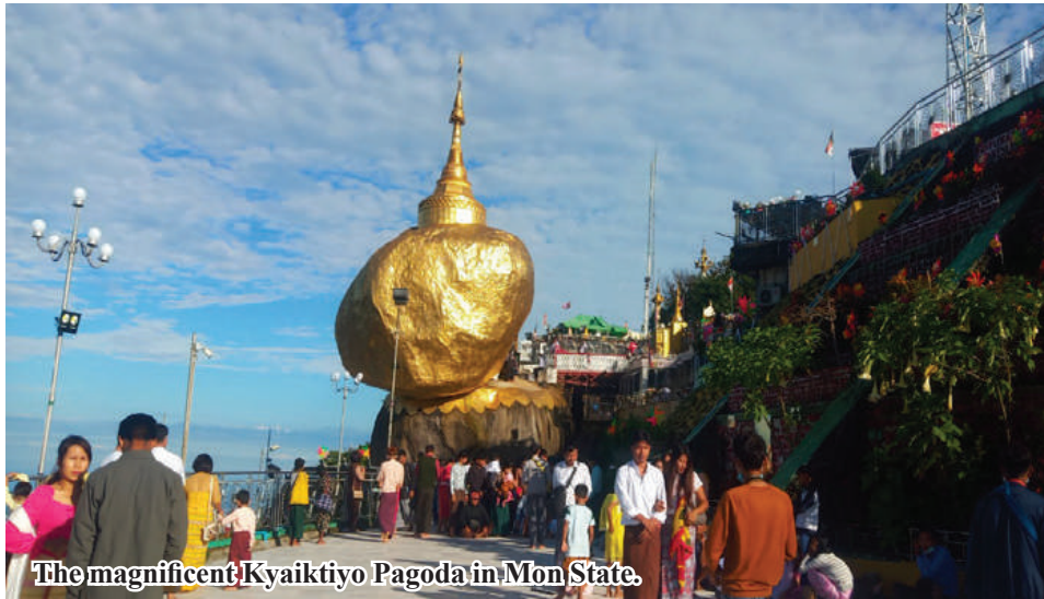
The magnificent Kyaiktiyo Pagoda in Mon State.

Kyaikto September 11 U Soe Hla, Chairman of the Pagoda Board of Trustees. A total of 1,700 local and some 300 foreign travellers visited Kyaiktiyo Pagoda in Kyaikto Township of Mon state in August 2024, according to