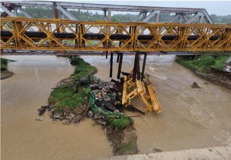
ရန်ကုန်-မန္တလေးရထားလမ်းပိုင်း ရှမ်းရွာနှင့်ရမည်းသင်းဘူတာအကြားရေတိုက်စားမှုကြောင့် တံတားအမှတ်(၅၂၉) LST ဒေါက်တိုင်ပြတ်ထွက်မှုအခြေအနေကို တွေ့ရစဉ်။

မန္တလေးတိုင်းဒေသကြီးနှင့်ရှမ်းပြည်နယ်အတွင်း မိုးများအဆက်မပြတ်ရွာသွန်းမှုကြောင့် ရန်ကုန်-မန္တလေးရထားလမ်းပိုင်းအတွင်း သာစည်မြို့နယ် ရှမ်းရွာဘူတာယာခင်းနှင့် ရှမ်းရွာ-ပျော်ဘွယ်လမ်းပိုင်းအတွင်း ခုနစ်နေရာတို့တွင် သံလမ်းပေါ်ရေကျော်ခြင်းနှင့် ရထားလမ်းတာပေါင်ထူးပေါက်ခြင်း၊ ရှမ်းရွာနှင့်ရမည်းသင်းဘူတာအကြား ရှစ်နေရာတို့၌ ရထားလမ်းရေတိုက်စားခြင်း၊ တံတားအမှတ်(၅၁၅)အဆန်လမ်းစွန်းခံနေရာရေတိုက်စားခြင်း၊တံတားအမှတ်(၅၂၉)ဒေါက်တိုင်ပြတ်ထွက်ခြင်းနှင့်မန္တလေးဘက်ခြမ်းတံတား ရေတိုက်စားခြင်း၊ တပ်ကုန်း-မကျည်းပင် ဘူတာအကြား၊ မကျည်းပင်-ညောင်လွန်ဘူတာအကြားနှင့် ညောင်လွန်ဘူတာယာခင်းအတွင်း ရထားလမ်းပေါ်ရေကျော်နေခြင်း၊ ရမည်းသင်း-အင်ကြင်းကန်ဘူတာအကြား ရထားလမ်းတာပေါင်ထူးပေါက်ခြင်းတို့အပြင် ဝမ်းတွင်းမြို့နယ် သပြေတောင်း-သဲတောဘူတာအကြား တံတားအမှတ်(၆၉၁) အစုန်၊အဆန် တံတားများ၏ အောက်ခြေရေထိရန် ကိုးပေနှစ်လက်မခန့်သာလိုတော့သဖြင့် ရထားဖြတ်သန်းရန် အန္တရာယ်ရှိနိုင်ခြင်းနှင့် သာစည်-ရွှေညောင် လမ်းပိုင်းအတွင်း သာစည်-လှိုင်းတက်ဘူတာအကြားတံတားအမှတ်(၃၀)လှိုင်းတက်-ဘုရားငါးဆူဘူတာအကြား တံတားအမှတ်(၃၄)နှင့်(၃၅)တို့၏ တံတားတာပေါင်များ ရေတိုက်စားနေခြင်း၊ ဘုရားငါးဆူ-ယင်းမာပင် ဘူတာအကြား