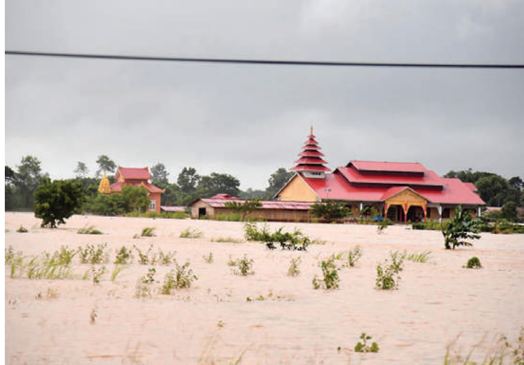
နေပြည်တော်ကောင်စီနယ်မြေအတွင်း ရေကြီးရေလျှံမှုဖြစ်ပွားသည့်နေရာကို တွေ့ရစဉ်။