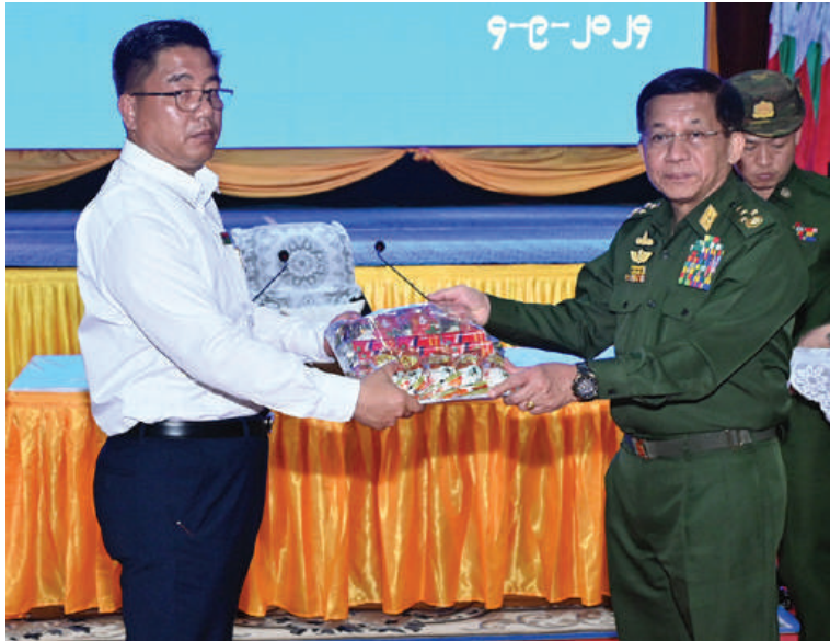
နိုင်ငံတော်စီမံအုပ်ချုပ်ရေးကောင်စီဥက္ကဋ္ဌ နိုင်ငံတော်ဝန်ကြီးချုပ် ဗိုလ်ချုပ်မှူးကြီးမင်းအောင်လှိုင်က ကယားပြည်နယ်အစိုးရအဖွဲ့ဝင်များ၊ ပြည်နယ်အဆင့်ဌာနဆိုင်ရာတာဝန်ရှိသူများအတွက် စားသောက်ဖွယ်ရာပစ္စည်းများနှင့်ထောက်ပံ့ရေးပစ္စည်းများကို ပေးအပ်စဉ်။