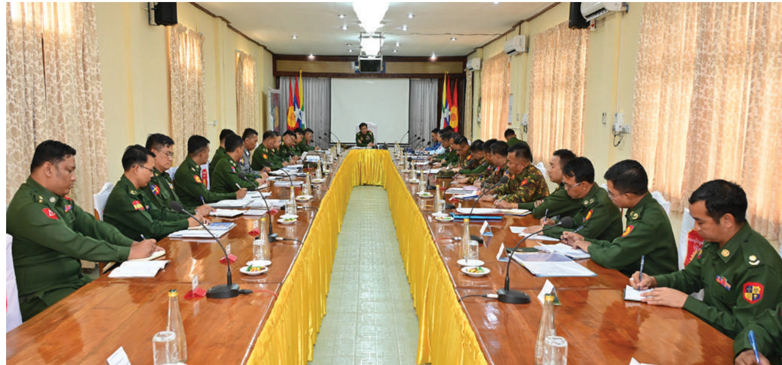
နိုင်ငံတော်စီမံအုပ်ချုပ်ရေးကောင်စီဥက္ကဋ္ဌ တပ်မတော်ကာကွယ်ရေးဦးစီးချုပ် ဗိုလ်ချုပ်မှူးကြီးမင်းအောင်လှိုင် ဒေသကွပ်ကဲမှုစစ်ဌာနချုပ်(လှိုင်ကော်)နယ်မြေအတွင်း နယ်မြေတည်ငြိမ်အေးချမ်းရေးဆိုင်ရာဆောင်ရွက်ထားရှိမှုများနှင့်ပတ်သက်၍ ရှင်းလင်းတင်ပြမှုများအပေါ် လမ်းညွှန်မှာကြားစဉ်။

နေပြည်တော် စက်တင်ဘာ ၄ နိုင်ငံတော်စီမံအုပ်ချုပ်ရေးကောင်စီဥက္ကဋ္ဌ တပ်မတော်ကာကွယ်ရေးဦးစီးချုပ် ဗိုလ်ချုပ်မှူးကြီး မင်းအောင်လှိုင်သည် ကာကွယ်ရေးဦးစီးချုပ်(ရေ) ဒုတိယဗိုလ်ချုပ်ကြီးထိန်ဝင်း၊ ကာကွယ်ရေးဦးစီးချုပ်(လေ) ဗိုလ်ချုပ်ကြီးထွန်းအောင်၊ ပြည်ထောင်စုအဆင့်ပုဂ္ဂိုလ်များကာကွယ်ရေးဦးစီးချုပ်ရုံးမှ အဆင့်မြင့်တပ်မတော်