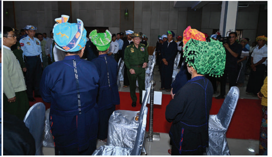
နိုင်ငံတော်စီမံအုပ်ချုပ်ရေးကောင်စီဥက္ကဋ္ဌ နိုင်ငံတော်ဝန်ကြီးချုပ် ဗိုလ်ချုပ်မှူးကြီးမင်းအောင်လှိုင် အခမ်းအနားတက်ရောက်လာကြသည့် ကယားပြည်နယ်အစိုးရအဖွဲ့ဝင်များ၊ ပြည်နယ်အဆင့်ဌာနဆိုင်ရာတာဝန်ရှိသူများ၊ မြို့မိမြို့ဖများနှင့် ဒေသခံပြည်သူများအား ရင်းရင်းနှီးနှီးဆက်စဉ်။