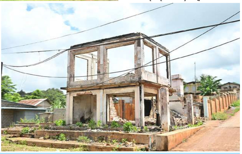
ပအိုဝ်းကိုယ်ပိုင်အုပ်ချုပ်ခွင့်ရဒေသ ဆီဆိုင်မြို့တွင် အကြမ်းဖက်သမားများ၏ အကြမ်းဖက်လုပ်ရပ်များကြောင့် ထိခိုက်ပျက်စီးခဲ့ရသည့် အဆောက်အအုံများကို တွေ့ရစဉ်။