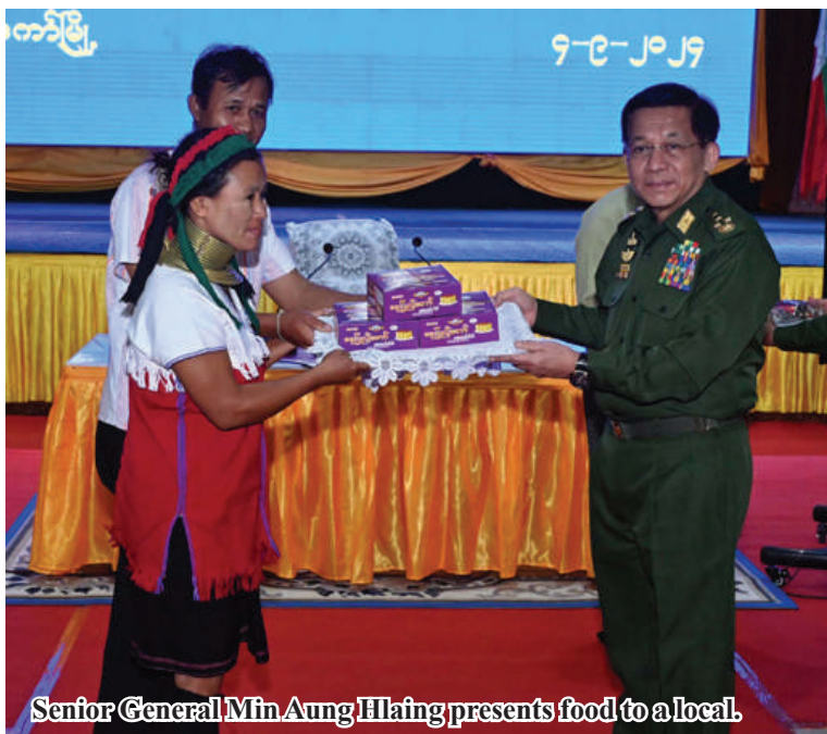
Senior General Min Aung Hlaing presents food to a local.

Restoration work will be carried out on the roads, bridges, and communication infrastructure in the Loikaw region that were damaged due to the destructive activities of insurgents. The government prioritizes issues of public concern. Just as the government is constructing, local citizens are also expected to protect and manage their region with their own knowledge and spirit. See Page 12