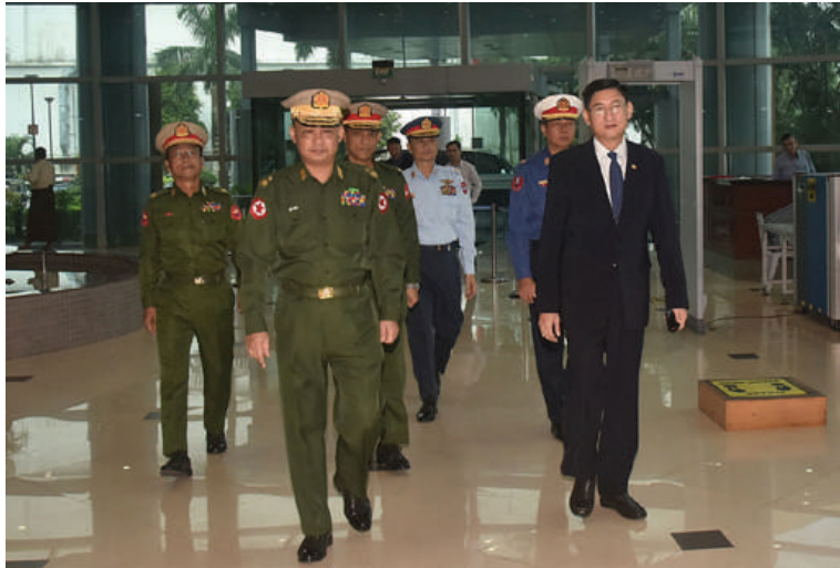
ကာကွယ်ရေးဦးစီးချုပ်မှ ဒုတိယဗိုလ်ချုပ်ကြီးစိုးမင်းဦးအား ရန်ကုန်တိုင်းစစ်ဌာနချုပ် တိုင်းမှူးနှင့် တာဝန်ရှိသူများက လေဆိပ်၌ ပို့ဆောင်နှုတ်ဆက်စဉ်။