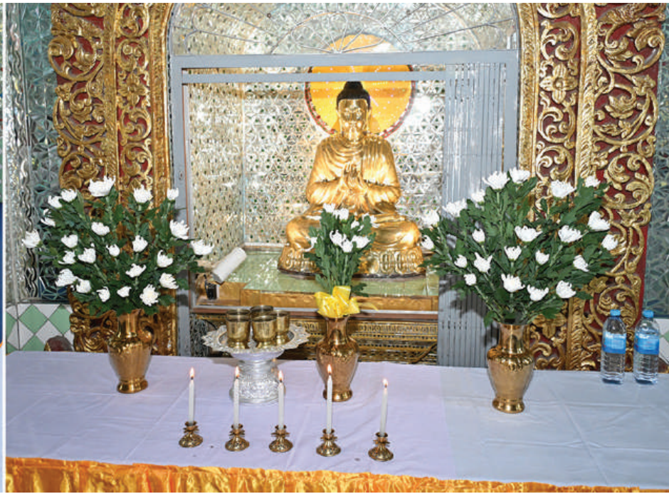
နိုင်ငံတော်စီမံအုပ်ချုပ်ရေးကောင်စီဥက္ကဋ္ဌ နိုင်ငံတော်ဝန်ကြီးချုပ် ဗိုလ်ချုပ်မှူးကြီးမင်းအောင်လှိုင် လှိုင်ကော်မြို့ ကျက်သရေဆောင် သမိုင်းဝင်ဆုတောင်းပြည့် မြို့နယ် ရွှေစေတီတော်မြတ်ကြီးအတွင်းရှိ ဗုဒ္ဓရုပ်ပွားတော်မြတ်အား ဖူးမြော်ကြည်ညို၍ ပန်း၊ ရေချမ်း၊ ဆီမီးများ ကပ်လှူပူဇော်စဉ်။

ဝန်ကြီးချုပ်သည် တက်ရောက်လာကြသည့် ကယားပြည်နယ်အစိုးရအဖွဲ့ဝင်များ၊ ပြည်နယ်အဆင့် ဌာနဆိုင်ရာတာဝန်ရှိသူများ၊ မြို့မိမြို့ဖများနှင့် ဒေသခံပြည်သူများကို ရင်းရင်းနှီးနှီးနှုတ်ဆက်သည်။