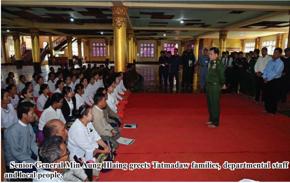
Senior General Min Aung Hlaing greets Tatmadaw families, departmental staff and local people.