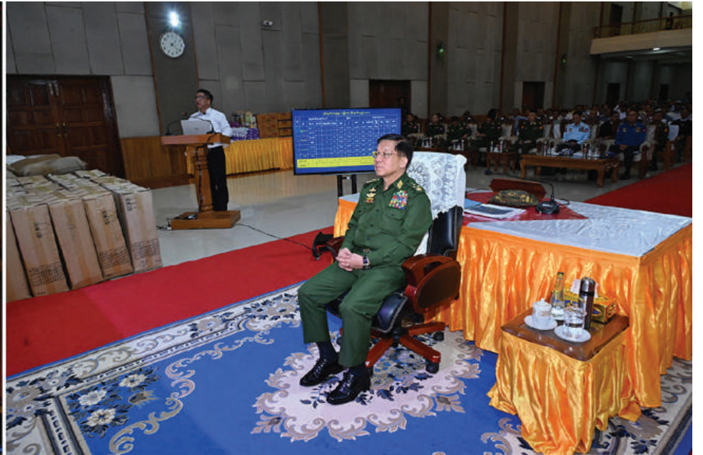
နိုင်ငံတော်စီမံအုပ်ချုပ်ရေးကောင်စီဥက္ကဋ္ဌ နိုင်ငံတော်ဝန်ကြီးချုပ် ဗိုလ်ချုပ်မှူးကြီးမင်းအောင်လှိုင်အား ကယားပြည်နယ်ဝန်ကြီးချုပ် ဦးဇော်မျိုးတင်က ဒေသဆိုင်ရာအချက်အလက်များ၊ ဒေသဖွံ့ဖြိုးရေးနှင့် ပြန်လည်ထူထောင်ရေးလုပ်ငန်းများ ဆောင်ရွက်လျက်ရှိမှုအခြေအနေများနှင့်ပတ်သက်၍ ရှင်းလင်းတင်ပြစဉ်။