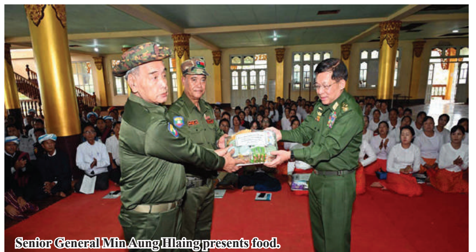
Senior General Min Aung Hlaing presents food.