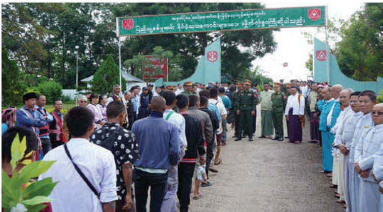
ကြိုဂံဒေသတိုင်းစစ်ဌာနချုပ် တိုင်းမှူး ဗိုလ်မှူးချုပ်စိုးလှိုင်နှင့် တာဝန်ရှိသူများက ပြည်သူ့စစ်မှုထမ်းသင်တန်း အမှတ်စဉ်(၅/၂၀၂၄)သို့ တက်ရောက်မည့် နိုင်ငံ့ သားကောင်းရတနာများကို ဂုဏ်ပြုကြိုဆိုစဉ်။

နေပြည်တော် စက်တင်ဘာ ၄ ဧရာဝတီတိုင်းဒေသကြီး အတွင်းမှ ပြည်သူ့စစ်မှုထမ်းသင်တန်း အမှတ်စဉ် (၅/၂၀၂၄)သို့ တက်ရောက်မည့် နိုင်ငံ့သား ကောင်းရတနာများကို ယနေ့တိုင် အနောက် တောင်တိုင်းစစ်ဌာနချုပ် တပ်နယ် အားကစားရုံ၌ တိုင်းဒေသကြီးဝန်ကြီးချုပ် ဦးတင်မောင်ဝင်း၊ တိုင်းမှူး ဗိုလ်ချုပ် ဝေလင်းနှင့်တာဝန်ရှိသူများက သွားရောက် တွေ့ဆုံအမှာစကားပြောကြားသည်။ ထိုသို့တွေ့ဆုံရာတွင် ပြည်သူ့စစ်မှု ထမ်းသင်တန်း အမှတ်စဉ်(၅/၂၀၂၄)သို့ တက်ရောက်မည့် နိုင်ငံ့သားကောင်း ရတနာများကို ထောက်ပံ့ပစ္စည်းများ