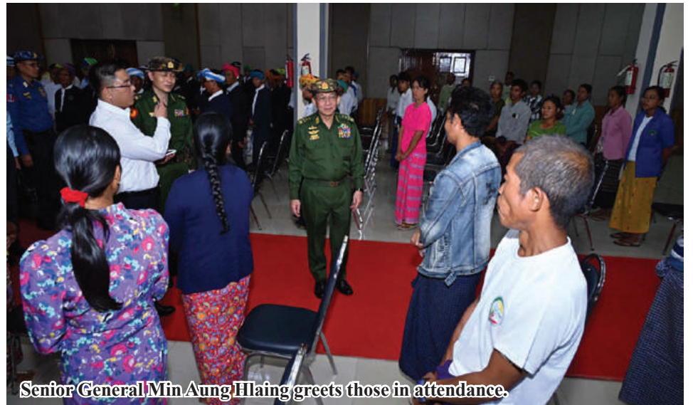
Senior General Min Aung Hlaing greets those in attendance.

Finally, the Senior General circumambulated the pagoda in a clockwise direction to pay homage and struck the bell in reverence.