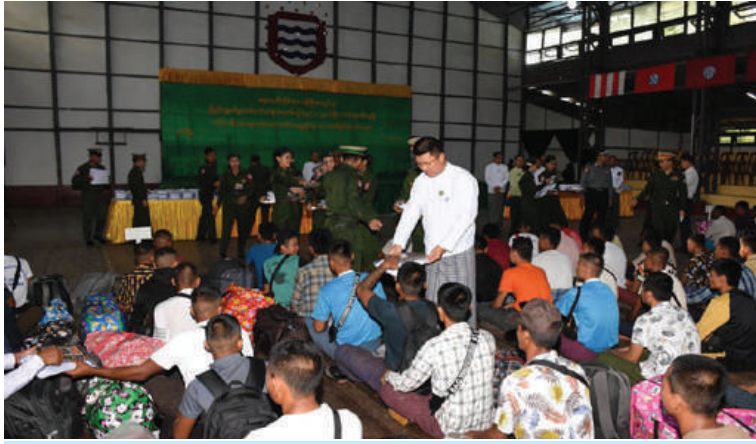
ဧရာဝတီတိုင်းဒေသကြီးဝန်ကြီးချုပ်ဦးတင်မောင်ဝင်း ပြည်သူ့စစ်မှုထမ်းသင်တန်း အမှတ်စဉ်(၅/၂၀၂၄)သို့ တက်ရောက်မည့် နိုင်ငံ့သားကောင်းရတနာများကို ထောက်ပံ့ပစ္စည်းများ ပေးအပ်စဉ်။

ပေးအပ်ပြီး တိုင်းဒေသကြီးဝန်ကြီးချုပ်၊ တိုင်းမှူးနှင့်တာဝန်ရှိသူများက သင်တန်း သားများနှင့် ရင်းရင်းနှီးနှီးတွေ့ဆုံအားပေး စကားပြောကြားကာ လိုအပ်သည်များ ပေါင်းစပ်ညှိနှိုင်းဆောင်ရွက်ပေးသည်။ အလားတူ ရှမ်းပြည်နယ်(အရှေ့ပိုင်း) ကျိုင်းတုံမြို့ရှိ နယ်မြေခံသင်တန်း၌ ပြည်သူ့စစ်မှုထမ်းသင်တန်း အမှတ်စဉ် (၅/၂၀၂၄)သို့တက်ရောက်မည့် နိုင်ငံ့သား ကောင်းရတနာများကို ကြိုဂံဒေသတိုင်း စစ်ဌာနချုပ် တိုင်းမှူး ဗိုလ်မှူးချုပ်စိုးလှိုင် နှင့် တာဝန်ရှိသူများက သွားရောက်ဂုဏ်ပြု ကြိုဆိုကြပြီး လိုအပ်သည်များ ပေါင်းစပ် ညှိနှိုင်းဆောင်ရွက်ပေးခဲ့ကြောင်း သတင်း ရရှိသည်။ (၅၀၁)