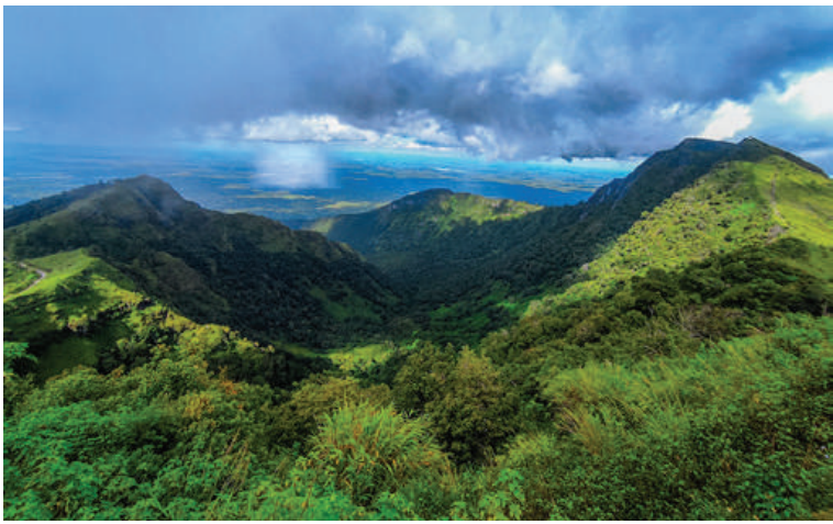
ပုပ္ပားတောင်အမျိုးသားဘူမိဥယျာဉ်တွင် တွေ့ရှိရသော မြေအောက်ရေအဖျားများဖြစ်သော ပုပ္ပားတောင်ထိပ်၊ မီးတောင်ပြာ ကျောက်နှင့် ဧရာဝတီသဲကျောက်လွှာ၊ ဧရာဝတီကျောက်လွှာ၊ တောင်နီတောင် ချယ်ဆီဒိုနီနှင့် မြေစေးတွင်းထွက်၊ ပရ ဆေးဥယျာဉ်နှင့်ပညာပေးပြခန်း၊ စန္ဒကူး တောနှင့်မြန်မာ့ရွှေသမင်ခြံ၊ ငှက်သိုက် ချောက်ကမ်းပါး၊ ကုန်းပြင်မြင့်ချော်လွှာ ရှုခင်းသွား၊ ဗဆော့ဆန်သောချော်ရည်စီး ကြောင်းနေရာ၊ တောင်ပေါ်ရွာ(တောင်) ရှုခင်းသွား၊ ပုပ္ပားတောင်ကလပ်အင်ကြင်း ကျောက်၊ တောင်နားတောင်ရှုခင်းသွား၊ ပုပ္ပားတောင်မကြီး မီးတောင်ဝနှင့် ဂဲမိုးအိုင် လေ့လာရေးနေရာများသို့ စိတ်လက်ပေါ့ပါးစွာ လာရောက် အပန်းဖြေ ကြည့်ရှုလေ့လာနိုင်မည်ဖြစ် ကြောင်း သိရသည်။ (သတင်းစဉ်)

နိုင်ငံအဆင့်အရေးပါသော ဘူမိဥယျာဉ် တစ်ခုဖြစ်သည်။ နိုင်ငံတော်၏ ရေရှည် မျှော်မှန်းချက်တွင် နိုင်ငံဧရိယာ၏ ၁၀ ရာခိုင်နှုန်းကို သဘာဝထိန်းသိမ်းရေးနယ် မြေများအဖြစ် ဖွဲ့စည်းနိုင်ရေးဆောင်ရွက် လျက်ရှိပြီး ယနေ့အချိန်ထိ သဘာဝထိန်း သိမ်းရေးနယ်မြေ ၅၉ ခု၊ နိုင်ငံဧရိယာ၏ ၆ ဒသမ ၄၂ ရာခိုင်နှုန်းကို ဖွဲ့စည်းသတ်မှတ် ပြီးဖြစ်ရာ အမျိုးသားအဆင့်ဘူမိဥယျာဉ်မှ တစ်ဆင့် ကမ္ဘာ့အဆင့်ဘူမိဥယျာဉ်အဖြစ် သတ်မှတ်ခံရရေးကို ကြိုးပမ်းဆောင်ရွက် လျက်ရှိသည်။ ပုပ္ပားတောင် အမျိုးသားဘူမိဥယျာဉ် တွင် ဘူမိနယ်မြေ ၁၅၅ ဖြင့် ဖွဲ့စည်းထားပြီး အဆိုပါဘူမိဥယျာဉ်သည် မြန်မာနိုင်ငံတွင် ပထမဆုံးသော အမျိုးသားအဆင့် ဘူမိ ဥယျာဉ်တစ်ခုလည်းဖြစ်သည်။ ပြည်တွင်း၊ ပြည်ပ ခရီးသွားများအနေ