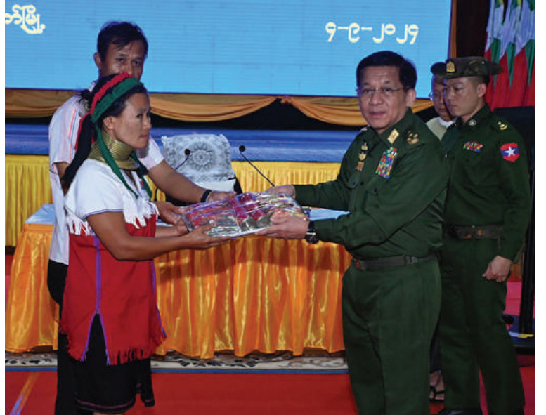
နိုင်ငံတော်စီမံအုပ်ချုပ်ရေးကောင်စီဥက္ကဋ္ဌ နိုင်ငံတော်ဝန်ကြီးချုပ် ဗိုလ်ချုပ်မှူးကြီးမင်းအောင်လှိုင်က ယာယီနေရပ်စွန့်ခွာပြည်သူများအတွက် စားသောက်ဖွယ်ရာပစ္စည်းများနှင့် ထောက်ပံ့ရေးပစ္စည်းများကို ပေးအပ်စဉ်။

ပျက်စီးခဲ့မှုနှင့် ပြန်လည်ပြင်ဆင်ရေးလုပ်ငန်းများ ဆောင်ရွက်ပေးလျက်ရှိမှု၊ လှိုင်ကော်လေဆီပုံ ပြန်လည်ပြင်ဆင်ရေးလုပ်ငန်းများ ဆောင်ရွက်လျက်ရှိမှု၊ ခရီးသည်ယာဉ်လိုင်းများနှင့် ကုန်တင်ယာဉ်များ ပြန်လည်ပြေးဆွဲလျက်ရှိမှု၊ ဆက်သွယ်ရေးတာဝါတိုင်နှင့် မိုဘိုင်းဆက်သွယ်ရေးစခန်းများ ပြန်လည်ပြင်ဆင်ရေးလုပ်ငန်းများဆောင်ရွက်လျက်ရှိမှု၊ ယာယီနေရပ်စွန့်ခွာပြည်သူများနှင့် ဌာနဆိုင်ရာဝန်ထမ်းများအား ထောက်ပံ့ပေးမှု၊ လုံခြုံရေးလုပ်ငန်းများ ဆောင်ရွက်လျက်ရှိမှု၊ သီရိမင်္ဂလာဈေးအသစ် ပြန်လည်တည်ဆောက်နိုင်ရေး ဆောင်ရွက်လျက်ရှိမှု၊ လှိုင်ကော်မြို့အား မြို့အင်္ဂါရပ်နှင့်အညီဖြစ်စေရေးဆောင်ရွက်လျက်ရှိမှုနှင့်အားကစားနှင့် ယောပွဲရွှင်ပွဲများ ပြုလုပ်ပေးလျက်ရှိမှု အခြေအနေများနှင့်ပတ်သက်၍ ရှင်းလင်း