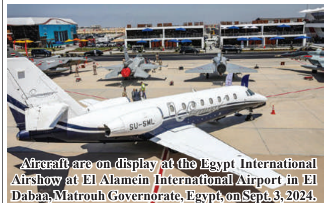
Aircraft are on display at the Egypt International Airshow at El Alamein International Airport in El Dabaa, Matrouh Governorate, Egypt, on Sept. 3, 2024.