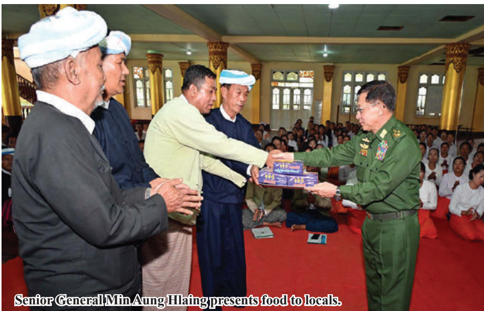
Senior General Min Aung Hlaing presents food to locals.