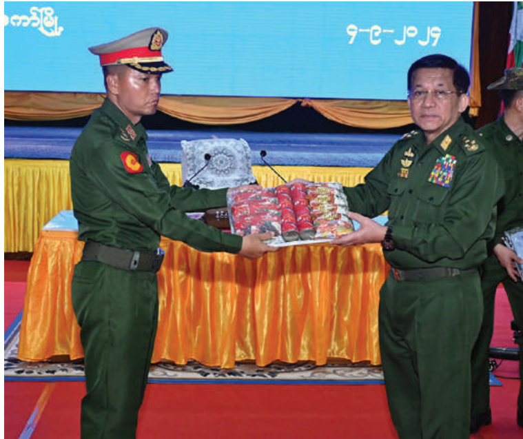
နိုင်ငံတော်စီမံအုပ်ချုပ်ရေးကောင်စီဥက္ကဋ္ဌ နိုင်ငံတော်ဝန်ကြီးချုပ် ဗိုလ်ချုပ်မှူးကြီးမင်းအောင်လှိုင်က နယ်မြေခံလုံခြုံရေးတပ်ဖွဲ့ဝင်များအတွက် စားသောက်ဖွယ်ရာပစ္စည်းများနှင့် ထောက်ပံ့ရေးပစ္စည်းများကို ပေးအပ်စဉ်။

ပတ်သက်၍ ရှင်းလင်းတင်ပြသည်။ ဒေသတွင်နေထိုင်သူများက ဒေသ၏ အကျိုးစီးပွားကို ထိခိုက်ပျက်စီးအောင် လုပ်ဆောင်ခြင်းသည် အလွန်ဆိုးရွားသည့်လုပ်ရပ်ဖြစ် ထို့နောက် နိုင်ငံတော်စီမံအုပ်ချုပ်ရေးကောင်စီဥက္ကဋ္ဌ နိုင်ငံတော်ဝန်ကြီးချုပ်က အမှာစကားပြောကြားရာတွင် မကြာသေးမီကာလက လှိုင်ကော်ဒေသအတွင်း KNDF အဖွဲ့နှင့် PDF အမည်ခံကြမ်းဖက်သမားများ၏ အကြမ်းဖက်တိုက်ခိုက်မှုများကြောင့် လှိုင်ကော်မြို့အပါအဝင် မြို့ရွာများထိခိုက်ပျက်စီးခဲ့ကြောင်း၊ ထိုသို့ ဆောင်ရွက်ခြင်းသည် ကယားပြည်နယ်အတွင်းနေထိုင်သည့် လက်နက်ကိုင်အကြမ်းဖက်သောင်းကျန်းသူများက တိုက်ခိုက်သည့်လုပ်ရပ်ဖြစ်သဖြင့် ဆိုးရွားသည့်လုပ်ရပ်များပင်ဖြစ်ကြောင်း၊ ဒေသတစ်ခုဖွံ့ဖြိုးတိုးတက်ရေး၊ တည်ငြိမ်အေးချမ်းရေးအတွက် ၎င်းဒေသ