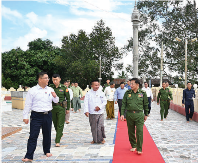
နိုင်ငံတော်စီမံအုပ်ချုပ်ရေးကောင်စီဥက္ကဋ္ဌ နိုင်ငံတော်ဝန်ကြီးချုပ် ဗိုလ်ချုပ်မှူးကြီးမင်းအောင်လှိုင် လှိုင်ကော်မြို့ကျက်သရေဆောင် သမိုင်းဝင်ဆုတောင်းပြည့် မြို့နယ်ရွှေစေတီတော်မြတ်ကြီးအား လက်ယာရစ် လှည့်လည်ဖူးမြော်ကြည့်ပါစဉ်။