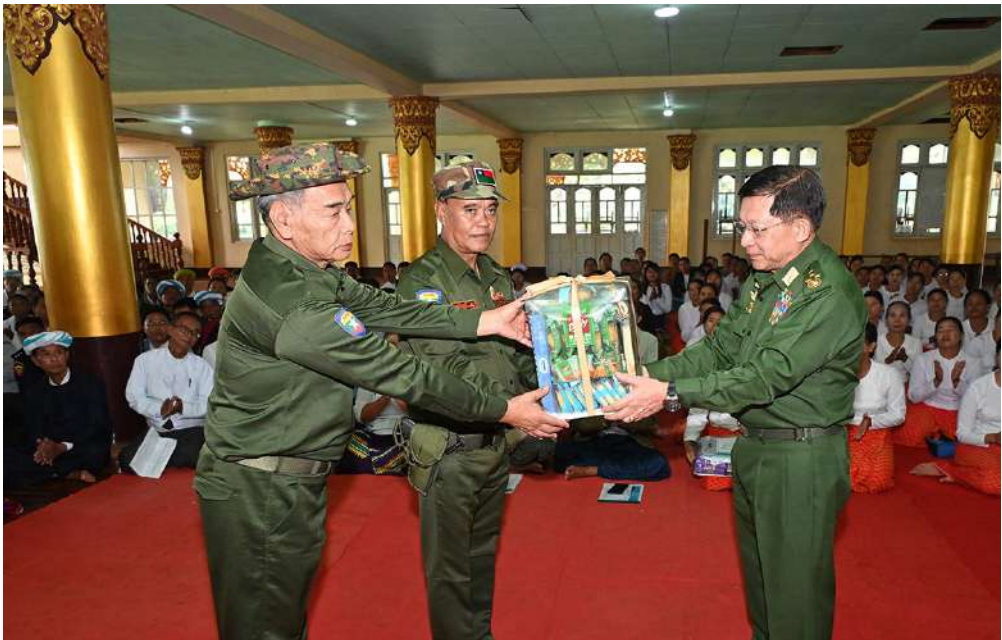
နိုင်ငံတော်စီမံအုပ်ချုပ်ရေးကောင်စီဥက္ကဋ္ဌ နိုင်ငံတော်ဝန်ကြီးချုပ် ဗိုလ်ချုပ်မှူးကြီးမင်းအောင်လှိုင် ဒေသခံ ပြည်သူများအတွက် စားသောက်ဖွယ်ရာများနှင့် ထောက်ပံ့ရေးပစ္စည်းများကို ပေးအပ်စဉ်။