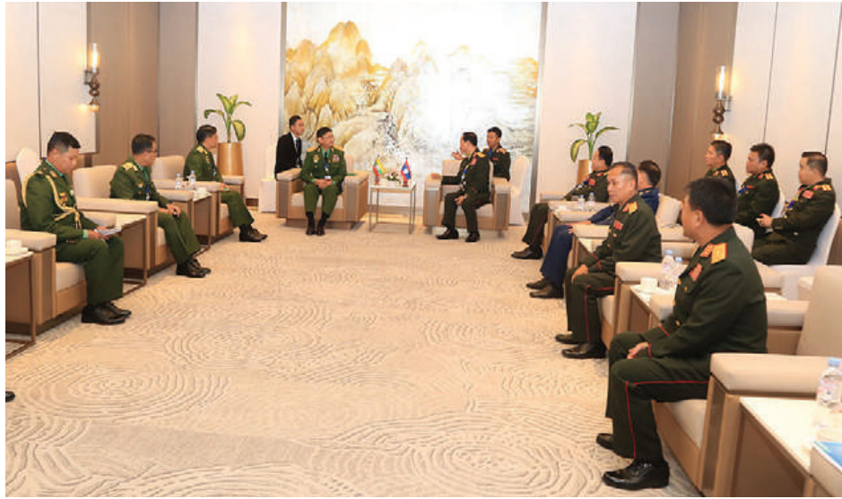
ကာကွယ်ရေးဦးစီးချုပ်မှ ဒုတိယဗိုလ်ချုပ်ကြီးစိုးမင်းဦးနှင့် လာအိုအမျိုးသားကာကွယ်ရေးဝန်ကြီးဌာန ဒုတိယဝန်ကြီးနှင့် စစ်ဦးစီးဌာနအကြီးအကဲ Lieutenant General Khamlieng Outhakaisone တို့ တွေ့ဆုံဆွေးနွေးစဉ်။

နေပြည်တော် စက်တင်ဘာ ၄ လာအိုပြည်သူ့ဒီမိုကရက်တစ်သမ္မတနိုင်ငံက အိမ်ရှင်အဖြစ်လက်ခံကျင်းပမည့် (၂၁)ကြိမ်မြောက် အာဆီယံ တပ်မတော်ကာကွယ်ရေးဦးစီးချုပ်များ အစည်းအဝေး 21 st ASEAN Chiefs Of Defence Forces Meeting (ACDFM-21)သို့ နိုင်ငံတော်စီမံ