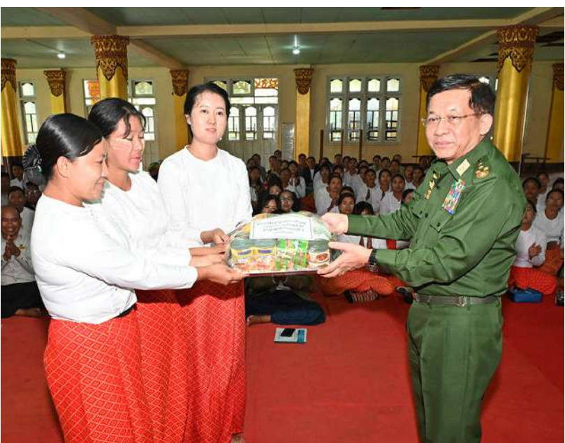
နိုင်ငံတော်စီမံအုပ်ချုပ်ရေးကောင်စီဥက္ကဋ္ဌ နိုင်ငံတော်ဝန်ကြီးချုပ် ဗိုလ်ချုပ်မှူးကြီးမင်းအောင်လှိုင် နယ်မြေခံတပ်မတော်သားများနှင့် မိသားစုဝင်များအတွက် စားသောက်ဖွယ်ရာများနှင့် ထောက်ပံ့ရေးပစ္စည်းများကို ပေးအပ်စဉ်။

စနစ်များ၊ ယာဉ်ရပ်နားရန်နေရာများမှအစ စနစ်တကျတွက်ချက်၍ ထည့်သွင်းစဉ်းစား ဆောင်ရွက်ပြီးစီးမှု အခြေအနေများကို တာဝန်ရှိသူများက ရှင်းလင်းတင်ပြကြသည်။ ရှင်းလင်းတင်ပြမှုများအပေါ် နိုင်ငံတော်စီမံအုပ်ချုပ်ရေးကောင်စီဥက္ကဋ္ဌ နိုင်ငံတော်ဝန်ကြီးချုပ်က လိုအပ်သည်များ မှာကြားသည်။ ယင်းနောက် နိုင်ငံတော်စီမံအုပ်ချုပ်ရေးကောင်စီဥက္ကဋ္ဌ နိုင်ငံတော်ဝန်ကြီးချုပ်နှင့် အဖွဲ့ဝင်များသည် ဆီဆိုင်မြို့ မြို့ပြနှင့် အိမ်ရာဖွံ့ဖြိုးရေးဦးစီးဌာန ဝန်ထမ်းအငှား အိမ်ရာသို့ရောက်ရှိကြရာ အကြမ်းဖက်သမားများ၏ အဖျက်အမှောင့်လုပ်ရပ်များကြောင့် ထိခိုက်ပျက်စီးခဲ့ရမှုများနှင့် ပြန်လည်ပြင်ဆင်ဆောင်ရွက်ပြီးစီးမှု အခြေအနေများကို တာဝန်ရှိသူများက ရှင်းလင်းတင်ပြကြသည်။ နိုင်ငံတော်စီမံအုပ်ချုပ်ရေးကောင်စီဥက္ကဋ္ဌ နိုင်ငံတော်ဝန်ကြီးချုပ်က လိုအပ်သည်များ မှာကြားသည်။ ထို့နောက် နိုင်ငံတော်စီမံအုပ်ချုပ်ရေးကောင်စီဥက္ကဋ္ဌ နိုင်ငံတော်ဝန်ကြီးချုပ်နှင့် အဖွဲ့ဝင်များသည် ဝေနေရာမကျောင်းတိုက်သို့