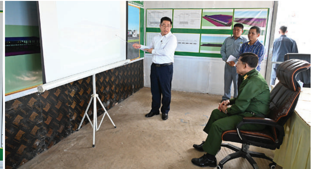
နိုင်ငံတော်စီမံအုပ်ချုပ်ရေးကောင်စီဥက္ကဋ္ဌ နိုင်ငံတော်ဝန်ကြီးချုပ် ဗိုလ်ချုပ်မှူးကြီးမင်းအောင်လှိုင်အား ကယားပြည်နယ်ဝန်ကြီးချုပ် ဦးဇော်မျိုးတင်က အဆင့်မြင့်သီရိမင်္ဂလာဈေးအသစ်ပြန်လည်တည်ဆောက်ရန်ဆောင်ရွက်နေမှုအခြေအနေများနှင့်ပတ်သက်၍ ရှင်းလင်းတင်ပြစဉ်။

စာမျက်နှာ ၁၈ မှအဆက် ထို့ကြောင့် ဒေသအတွင်းတည်ငြိမ်အေးချမ်းရေးနှင့်ဒေသခံများ၏ လုံခြုံရေးကို ဖျက်ဆီးနေသည့် ဒေသတွင်းနေထိုင်သော လက်နက်ကိုင်အဖွဲ့အစည်းများ၏ အကြမ်းဖက်လုပ်ဆောင်မှုများ လျော့ပါးစေရေးအတွက် ပြည်သူများအနေဖြင့် ၎င်းတို့သက်ဆိုးရှည်စေမည့်ကိစ္စရပ်များကိုပိုင်းဝန်းတားဆီးဆောင်ရွက်ပေးကြစေလိုကြောင်း၊ အကြမ်းဖက်သောင်းကျန်းသူများအနေဖြင့် မြို့ရွာများရှိ ပြည်သူလူထုများ၏ နေအိမ်များ၌ ဝင်ရောက်နေထိုင်၍ အကာအကွယ်ယူတိုက်ခိုက်ကြခြင်းဖြစ်ကြောင်း၊ ၎င်းတို့ယာယီအားဖြင့် ထိန်းသိမ်းထားသည့် မြို့ရွာများ၊ နေရာဒေသများတွင်လည်း ပြည်သူလူထုကိုအကာအကွယ်