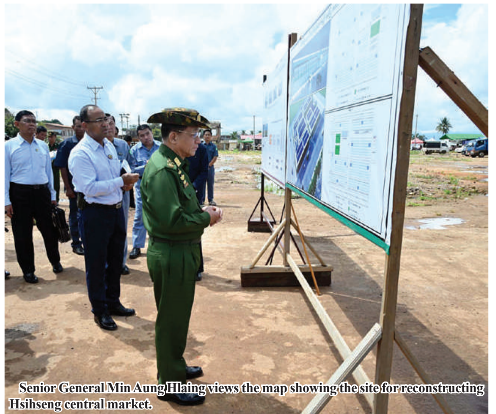
Senior General Min Aung Hlaing views the map showing the site for reconstructing Hsihseng central market.

After that, the Chairman of the State Administration