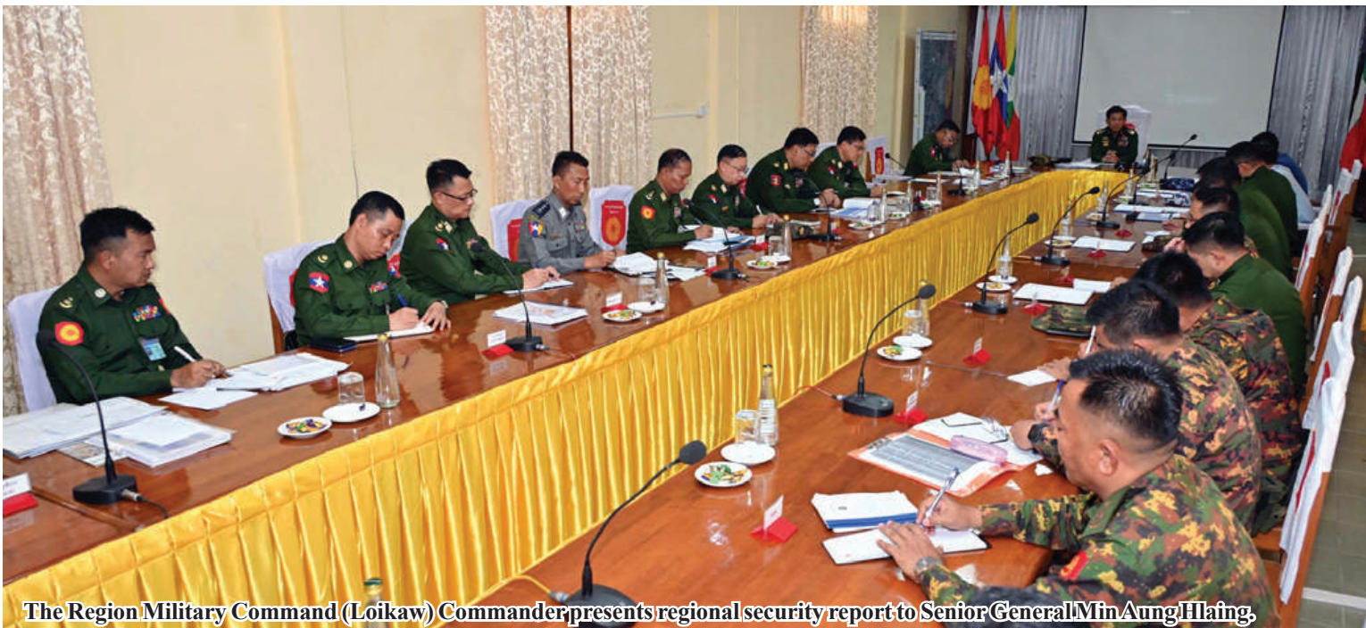
The Region Military Command (Loikaw) Commander presents regional security report to Senior General Min Aung Hlaing.