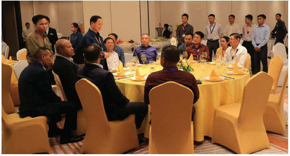
ကာကွယ်ရေးဦးစီးချုပ်မှ ဒုတိယဗိုလ်ချုပ်ကြီးစိုးမင်းဦး (၂၁)ကြိမ်မြောက် အာဆီယံ တပ်မတော်ကာကွယ်ရေးဦးစီးချုပ်များအစည်းအဝေး အထိမ်းအမှတ် ကြိုဆိုညှိစာစားပွဲ အခမ်းအနားသို့ တက်ရောက်စဉ်။

၁၂ နာရီ မိနစ် ၄၀ တွင် ရောက်ရှိကြရာ လာအိုအမျိုးသား ကာကွယ်ရေးဝန်ကြီးဌာနမှ တာဝန်ရှိသူများ၊ လာအိုနိုင်ငံဆိုင်ရာ မြန်မာနိုင်ငံသံအမတ်ကြီး ဦးအောင်ကို၊ မြန်မာစစ်သံ(ကြည်း၊ရေလေ)ဗိုလ်မှူးချုပ် ခင်မောင်စိုးနှင့် တာဝန်ရှိသူများက Wattay အပြည်ပြည်ဆိုင်ရာလေဆိပ်တွင် ကြိုဆိုခဲ့ကြသည်။ ယင်းနောက် ကာကွယ်ရေးဦးစီးချုပ်မှ ဒုတိယဗိုလ်ချုပ်ကြီးစိုးမင်းဦး ဦးဆောင်သော မြန်မာ့တပ်မတော်ကိုယ်စားလှယ်အဖွဲ့ကို လာအိုအမျိုးသား ကာကွယ်ရေးဝန်ကြီးဌာန ဒုတိယဝန်ကြီးနှင့် စစ်ဦးစီးဌာနအကြီးအကဲ Lieutenant General Khamlieng Outhakaisone က လက်ခံတွေ့ဆုံခဲ့ပြီး နှစ်နိုင်ငံတပ်မတော်နှစ်ရပ်အကြား ချစ်ကြည်ရင်းနှီးမှု ပိုမိုတိုးမြှင့်ဆောင်ရွက်ရေးနှင့် ပူးပေါင်းဆောင်ရွက်ရေးကိစ္စရပ်များကို ရင်းနှီးပွင့်လင်းစွာ ဆွေးနွေးခဲ့ကြသည်။ ဆက်လက်၍ ကာကွယ်ရေးဦးစီးချုပ်မှ ဒုတိယဗိုလ်ချုပ်ကြီးစိုးမင်းဦးသည် ဗီယင်ကျန်းမြို့ Latsavong Wanda Vista Hotel ၌ လာအိုအမျိုးသား ကာကွယ်ရေးဝန်ကြီးဌာန ဒုတိယဝန်ကြီးနှင့် စစ်ဦးစီးဌာနအကြီးအကဲ Lieutenant General Khamlieng Outhakaisone က တည်ခင်းဧည့်ခံသည့် (၂၁)ကြိမ်မြောက် အာဆီယံတပ်မတော်ကာကွယ်ရေးဦးစီးချုပ်များအစည်းအဝေး အထိမ်းအမှတ် ကြိုဆိုညှိစာစားပွဲ အခမ်းအနားသို့ တက်ရောက်သည်။ အဆိုပါ လုတ်ပြုညှိစာစားပွဲသို့ ကာကွယ်ရေးဦးစီးချုပ်မှ ဒုတိယဗိုလ်ချုပ်ကြီးစိုးမင်းဦးနှင့်အတူ မြန်မာ့တပ်မတော် ကိုယ်စားလှယ်အဖွဲ့ဝင်များ၊ အာဆီယံနိုင်ငံများမှတပ်မတော်ကာကွယ်ရေးဦးစီးချုပ်များနှင့် ဇနီးများ၊ ကိုယ်စားလှယ်အဖွဲ့ဝင်များ ပါဝင်တက်ရောက်ခဲ့ကြကြောင်း သတင်းရရှိသည်။ (၅၀၁)