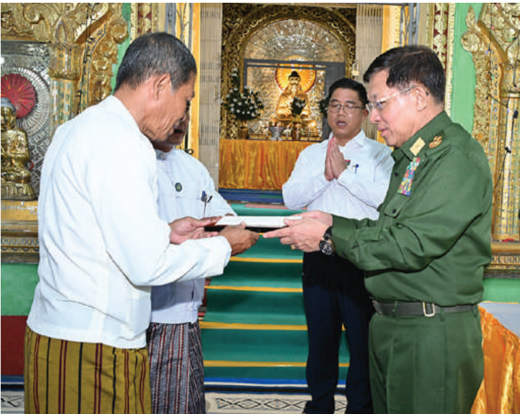
နိုင်ငံတော်စီမံအုပ်ချုပ်ရေးကောင်စီဥက္ကဋ္ဌ နိုင်ငံတော်ဝန်ကြီးချုပ် ဗိုလ်ချုပ်မှူးကြီးမင်းအောင်လှိုင် လှိုင်ကော်မြို့ကျက်သရေဆောင် သမိုင်းဝင်ဆုတောင်းပြည့် မြို့နယ် ရွှေစေတီတော်မြတ်ကြီး ဘက်စုံပြုပြင်မွမ်းမံရန်အတွက် စုပေါင်းအလှူငွေများ ပေးအပ်လှူဒါန်းစဉ်။

ကျန်းမာရေးမြှင့်တင်မှုနှင့် ပတ်သက်၍ တပ်မတော်အနေဖြင့် ပြည်သူ့ဆေးကုသမှုဖြင့်တင်ရေးလုပ်ငန်းများကို လှိုင်ကော်ဒေသတွင် စတင်ဆောင်ရွက်ခဲ့ခြင်းဖြစ်ကြောင်း၊ ထိုသို့ဆောင်ရွက်ချိန်တွင်လည်း မိမိကိုယ်တိုင်လာရောက်၍ ပညာရေး၊ ကျန်းမာရေးနှင့် ဒေသဖွံ့ဖြိုးတိုးတက်ရေးလုပ်ငန်းများကို ဆွေးနွေးပြောကြားခဲ့ကြောင်း၊ ယခုအခါတွင်လည်း နိုင်ငံတော်အနေဖြင့် ပြည်သူများ၏ ကျန်းမာရေးကဏ္ဍမြှင့်တင်ရေး ဆောင်ရွက်ပေးလျက်ရှိကြောင်း၊ ပြည်သူများအနေဖြင့်လည်း ကျန်းမာရေးနှင့် ညီညွတ်သည့် နေထိုင်စားသောက်မှုပုံစံဖြစ်ရန်လိုကြောင်း၊ ကျန်းမာရေးကိုထိခိုက်စေနိုင်သည့် သောက်စားမှုများ၊ စားသောက်မှုများမဖြစ်အောင် ဆောင်ရွက်ခြင်းဖြင့် တစ်ဦးချင်းစီ၏ လူမှုစီးပွားဘဝများ တိုးတက်လာမည်ဖြစ်ပြီး ကျန်းမာမှု အလုပ်လုပ်နိုင်မည်၊ ကျန်းမာမှု ပညာသင်ကြားနိုင်မည်ဖြစ်ကြောင်း၊ ထို့ကြောင့် ကျန်းမာရေးအသိဖြင့် အကျိုးရှိအောင် ဆောင်ရွက်ကြစေလိုကြောင်း။