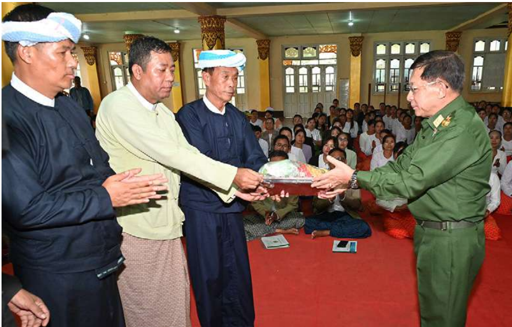
နိုင်ငံတော်စီမံအုပ်ချုပ်ရေးကောင်စီဥက္ကဋ္ဌ နိုင်ငံတော်ဝန်ကြီးချုပ် ဗိုလ်ချုပ်မှူးကြီးမင်းအောင်လှိုင် ဆီဆိုင်မြို့မှ ဌာနဆိုင်ရာတာဝန်ရှိသူများ၊ နယ်မြေခံတပ်မတော်သားများနှင့် မိသားစုဝင်များ၊ မြန်မာနိုင်ငံရဲတပ်ဖွဲ့ဝင်များ၊ ပြည်သူ့စစ်(ဌာန)တပ်ဖွဲ့ဝင်များ၊ မြို့မမြို့ဖများနှင့် တာဝန်ရှိသူများအား ရင်းရင်းနှီးနှီး တွေ့ဆုံစဉ်။

များနှင့် တာဝန်ရှိသူများအား ရင်းရင်းနှီးနှီး တွေ့ဆုံ၍ ပအိုဝ်းကိုယ်ပိုင်အုပ်ချုပ်ခွင့်ဒေသသည် ရေခဲမြေခဲကောင်းကို ပိုင်ဆိုင်ထားသည့် ဒေသဖြစ်ပြီး ဖွံ့ဖြိုးတိုးတက်ရေးကို အောင်မြင်စွာဆောင်ရွက်နိုင်မည့် အလားအလာကောင်းများကို ပိုင်ဆိုင်ထားသည့် ဒေသတစ်ခုလည်းဖြစ်ကြောင်း၊ သို့သော်လည်း အစဉ်အဆက်တည်ငြိမ်အေးချမ်း၍ ရိုးသားအေးချမ်းစွာနေထိုင်ခဲ့သော ပအိုဝ်းတိုင်းရင်းသားတို့၏ ဆီဆိုင်ဒေသသည် PNLO အကြမ်းဖက်အဖွဲ့၏ အခွင့်အလမ်းတစ်ခုကိုမျှော်မှန်းပြီး ဆောင်ရွက်သည့် မိုက်မဲသည့် အကြမ်းဖက်လုပ်ရပ်ကြောင့် ယခုကဲ့သို့ ထိခိုက်ပျက်စီးမှုများဖြစ်ပေါ်ခဲ့ကြောင်း၊ ဒေသတစ်ခု နိုင်ငံတစ်ခုဖွံ့ဖြိုးတိုးတက်ရန်အတွက်မှာ ရပ်တန့်နေ၍မရဘဲ ရှေ့သို့အစဉ်အဆက် ဆက်လက်လှမ်းချီနေရမည်၊ အလုပ်လုပ်နေရမည်ဖြစ်ကြောင်း၊ ရပ်တန့်နေပါက မိမိတို့အနေဖြင့် နောက်တွင် ကျန်နေခဲ့မည်ဖြစ်ကြောင်း၊ ယခုကဲ့သို့သော