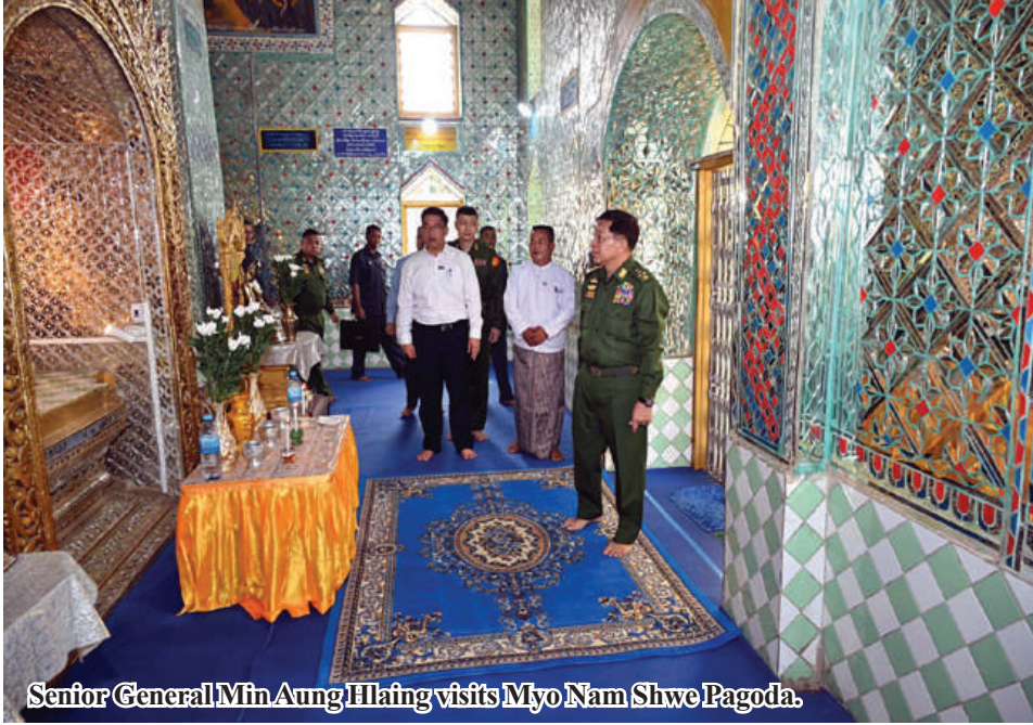
Senior General Min Aung Hlaing visits Myo Nam Shwe Pagoda.