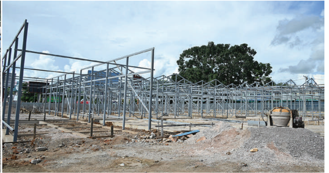
နိုင်ငံတော်စီမံအုပ်ချုပ်ရေးကောင်စီဥက္ကဋ္ဌ နိုင်ငံတော်ဝန်ကြီးချုပ် ဗိုလ်ချုပ်မှူးကြီးမင်းအောင်လှိုင် အကြမ်းဖက်သမားများ၏ အကြမ်းဖက်လုပ်ရပ်များကြောင့် ပျက်စီးခဲ့ရသည့် လှိုင်ကော်မြို့ သီရိမင်္ဂလာဈေးအား အဆင့်မြင့်သီရိမင်္ဂလာဈေးအသစ်အဖြစ် တည်ဆောက်နေမှုအခြေအနေအား သွားရောက်ကြည့်ရှုစစ်ဆေးစဉ်။