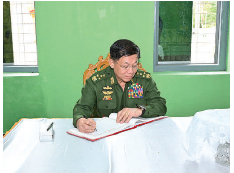
နိုင်ငံတော်စီမံအုပ်ချုပ်ရေးကောင်စီဥက္ကဋ္ဌ နိုင်ငံတော်ဝန်ကြီးချုပ် ဗိုလ်ချုပ်မှူးကြီးမင်းအောင်လှိုင် လှိုင်ကော်မြို့ကျက်သရေဆောင် သမိုင်းဝင်ဆုတောင်းပြည့် မြို့နယ် ရွှေစေတီတော်မြတ်ကြီးရှိ ဧည့်သည်တော်မှတ်တမ်းစာအုပ်တွင် မှတ်တမ်းတင်လက်မှတ်ရေးထိုးစဉ်။

အသိစိတ်ဓာတ်ဖြင့် ကိုယ်စီထိန်းသိမ်း ရောက်နေထိုင်၍ လုပ်ငန်းတာဝန်ထမ်းဆောင်ရွက်ကြစေလိုကြောင်း၊ အကြမ်းဖက်ဆောင်ရွက်မှုကို မိမိအနေဖြင့်ဂုဏ်ယူအသိသောင်းကျန်းသူများအနေဖြင့် ပြည်နယ်အမှတ်ပြုချီးကျူးပါကြောင်း။