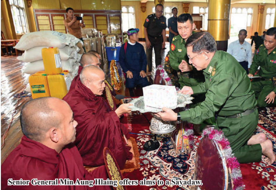
Senior General Min Aung Hlaing offers alms to a Sayadaw.