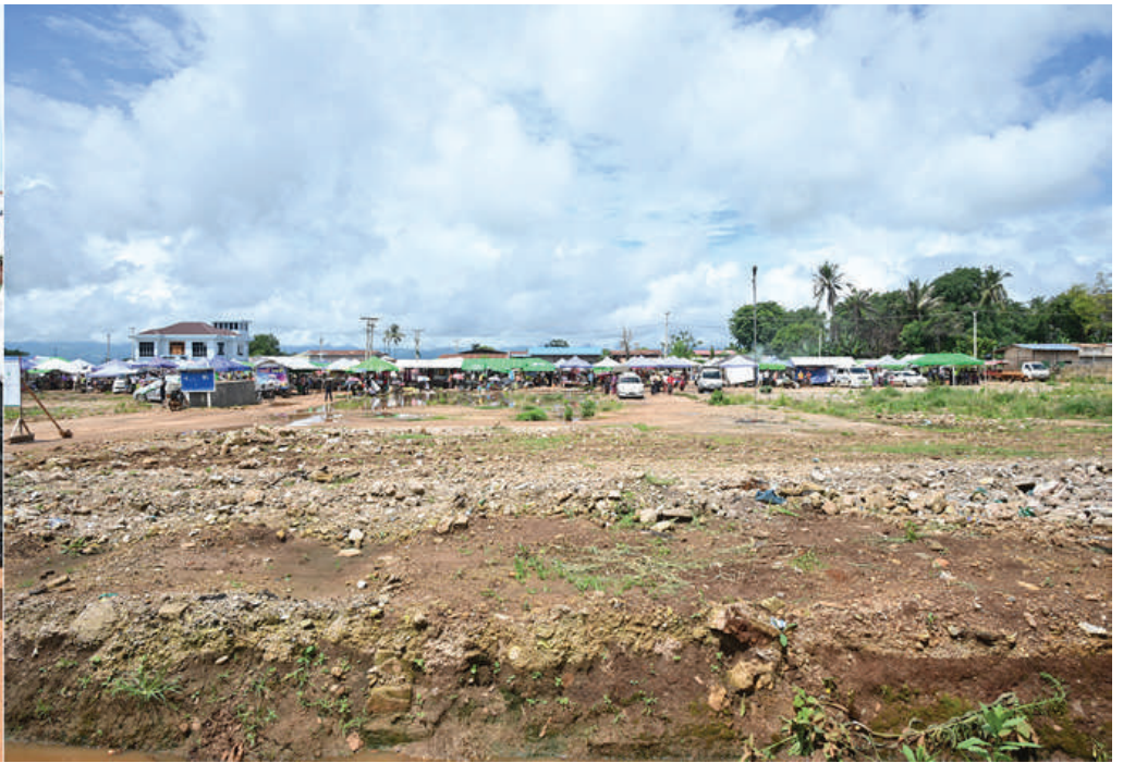
နိုင်ငံတော်စီမံအုပ်ချုပ်ရေးကောင်စီဥက္ကဋ္ဌ နိုင်ငံတော်ဝန်ကြီးချုပ် ဗိုလ်ချုပ်မှူးကြီးမင်းအောင်လှိုင် ဆီဆိုင်မြို့ မြို့မဈေးအား အသစ်ပြန်လည်တည်ဆောက်မည့်နေရာကို ကြည့်ရှုစစ်ဆေးစဉ်။

နေပြည်တော် စက်တင်ဘာ ၄ ရှမ်းပြည်နယ်(တောင်ပိုင်း) ပအိုဝ်း ကိုယ်ပိုင်အုပ်ချုပ်ခွင့်ရဒေသ ဟိုပုံးမြို့နယ် နှင့် ဆီဆိုင်မြို့နယ်များအတွင်း ဒေသ ကောင်းစားရေးဟုသုံးနှုန်း၍ အမှန်တကယ် တွင် အဖျက်အမှောင့်လုပ်ရပ်များကိုသာ စဉ်ဆက်မပြတ်လုပ်ဆောင်လျက်ရှိသည့် PNLO အဖွဲ့၊ KNDF အဖွဲ့နှင့် PDF အမည်ခံ အကြမ်းဖက်သမားများသည် ဒေသခံ တိုင်းရင်းသားပြည်သူများ နေထိုင်ရာ မြို့ရွာ၊ ရပ်ကွက်များတွင် တိုက်ပွဲများဖော် ဆောင်ခြင်း၊ သာသနာအဆောက်အအုံ များနှင့် စာသင်ကျောင်းများအတွင်းသို့ Drop Bomb များဖြင့် ပစ်ချတိုက်ခိုက်ခြင်း၊ လက်နက်ကြီးများဖြင့် ပစ်ခတ်တိုက်ခိုက် ခြင်း စသည့် အကြမ်းဖက်လုပ်ရပ်များကို လုပ်ဆောင်ခဲ့မှုကြောင့် ထိခိုက်ပျက်စီး ဆုံးရှုံးမှုများဖြစ်ပေါ်ခဲ့ရသည်။ ထိုသို့ ထိခိုက်ပျက်စီးခဲ့ရသည့် ဆီဆိုင် ဒေသတွင် ပြန်လည်ထူထောင်ရေးလုပ်ငန်း များဆောင်ရွက်နေသည့် အခြေအနေများ ကို ယနေ့နံနက်ပိုင်းတွင် နိုင်ငံတော်စီမံ အုပ်ချုပ်ရေးကောင်စီဥက္ကဋ္ဌ နိုင်ငံတော် ဝန်ကြီးချုပ်ဗိုလ်ချုပ်မှူးကြီးမင်းအောင်လှိုင် သည် ခရီးစဉ်တွင် လိုက်ပါလာသည့် အဖွဲ့ ဝင်များ၊ ရှမ်းပြည်နယ်ဝန်ကြီးချုပ်၊ အရှေ့ ပိုင်းတိုင်းစစ်ဌာနချုပ် တိုင်းမှူးနှင့် တာဝန် ရှိသူတို့ လိုက်ပါ၍ သွားရောက်ကြည့်ရှု စစ်ဆေးသည်။ စာမျက်နှာ ၁၆ ကော်လံ ၁