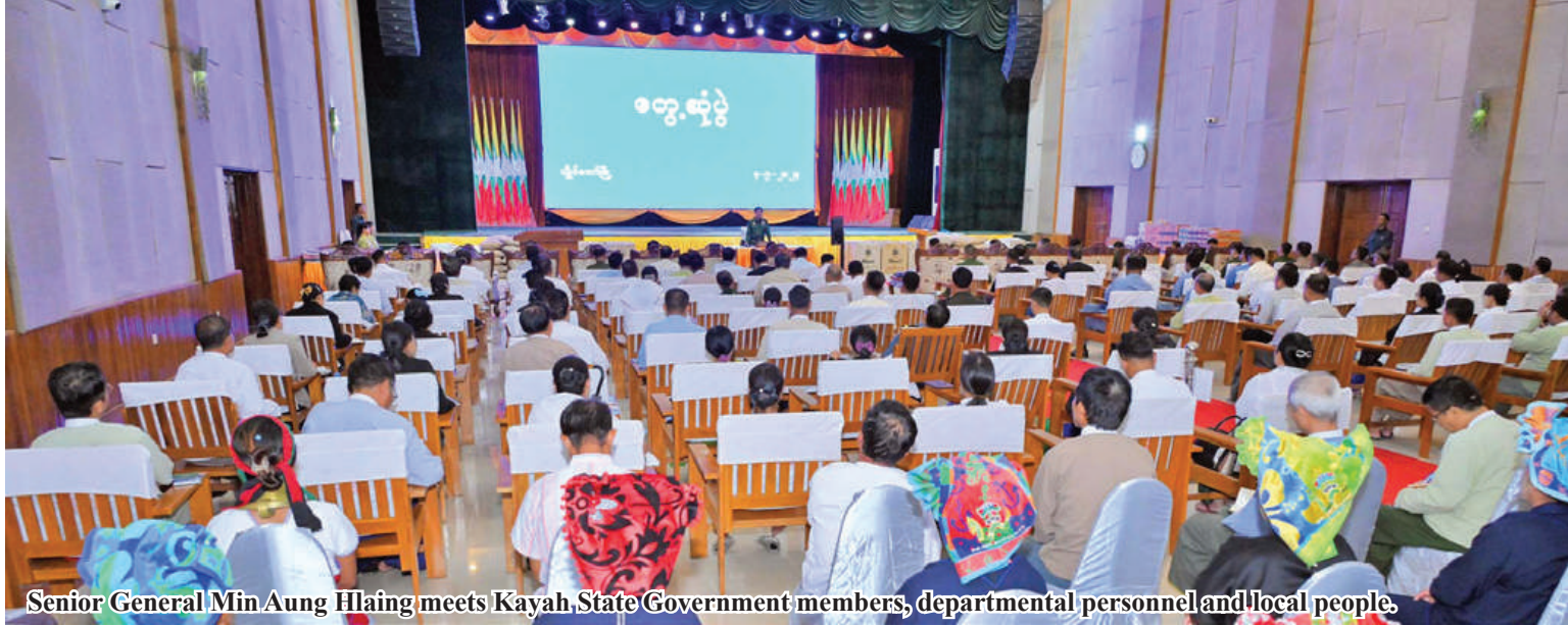
Senior General Min Aung Hlaing meets Kayah State Government members, departmental personnel and local people.

Nay Pyi Taw September 4 Chairman of State Administration Council Prime Minister Senior General Min Aung Hlaing met members of Kayah State cabinet, state level departmental officials, local elders and local people at Kayah State government office this afternoon and discussed regional development.