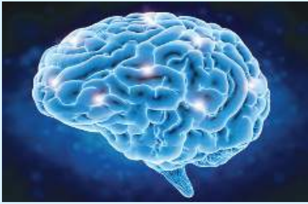
လမ်းလျှောက်ခြင်းဟာ မိမိ တို့ရဲ့ ဦးနှောက်တွေအတွက် ဟော်မုန်းထွက်ရှိလေ မိမိတို့မှာ လျှော့ချပေးနိုင်ပါတယ်။

အကျိုးကျေးဇူးများစွာ ပေးစွမ်း ရှိတဲ့ စိတ်ဖိစီးမှုတွေ လျော့ကျ တယ်လို့ သုတေသနတစ်ခုမှာ လေ့လာတွေ့ရှိရပါတယ်။ ဖော်ပြထားပါတယ်။ ဒါ့အပြင် အဲဒီဟော်မုန်းက လမ်းလျှောက်တဲ့ အခါမှာ ဦးနှောက်ရဲ့ အလုံးစုံကျန်းမာရေး အန်ဒေါဖင်လိုခေါ်တဲ့ ဟော်မုန်း ထွက်ရှိမှု မြင့်တက် အပြင် ဒီမန်းရှားလိုခေါ်တဲ့ မုန်းတစ်မျိုးထွက်ရှိမှု မြင့်တက် အပြင် ဒီမန်းရှားလိုခေါ်တဲ့ လာပါတယ်။ အဲဒီဟော်မုန်းက မှတ်ဉာဏ်ချို့ယွင်းရှားသွပ်ခြင်း နာကျင်မှုဝေဒနာကို သက်သာ ရောဂါနဲ့ အယ်စီဒ်မားရောဂါ စေတဲ့ဟော်မုန်းပါ။ အန်ဒေါဖင် တို့ ဖြစ်ပွားနိုင်ခြေကိုတောင်မှ လျှော့ချပေးနိုင်ပါတယ်။