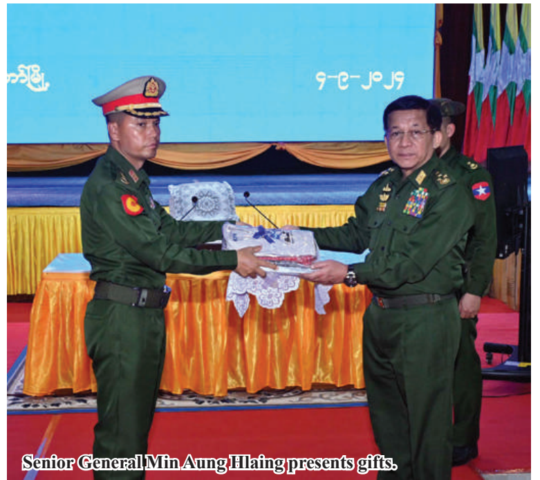
Senior General Min Aung Hlaing presents gifts.

The whole region will achieve progress if there is area-wise development in education field. The country faced weakness in the education sector, and the gov-