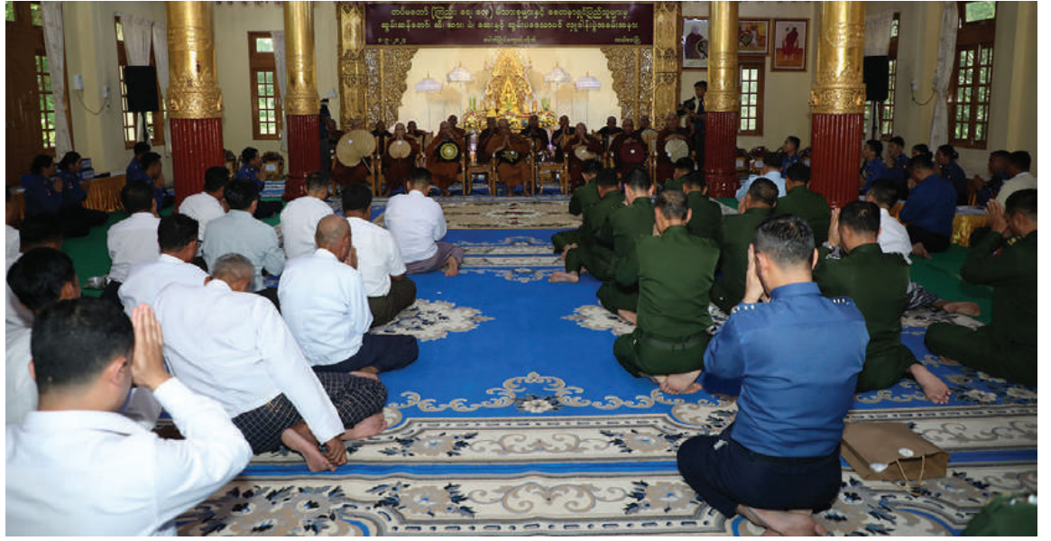
နေပြည်တော် လယ်ဝေးမြို့ ပေါက်မြိုင်ပရိယတ္တိစာသင်တိုက်ပဓာနနာယကဆရာတော် ဘဒ္ဒန္တဇနိန္ဒထံမှ တက်ရောက်လာ ကြသည့် ဧည့်ပရိသတ်များက ငါးပါးသီလခံယူဆောက်တည်ကြစဉ်။