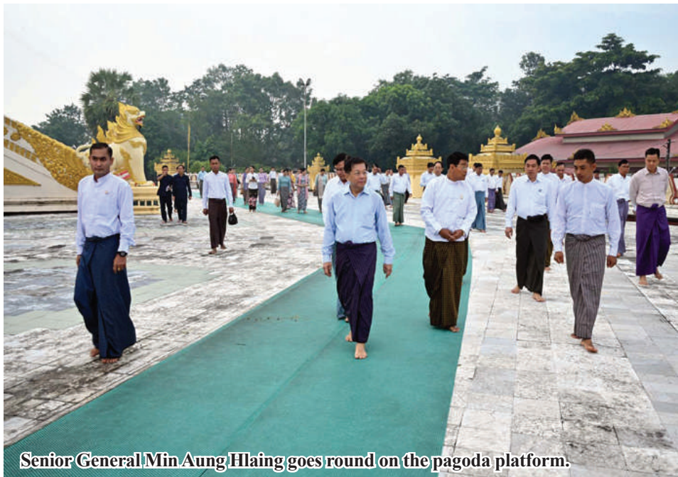
Senior General Min Aung Hlaing goes round on the pagoda platform.

kanda and supplicated matters related to flourishing