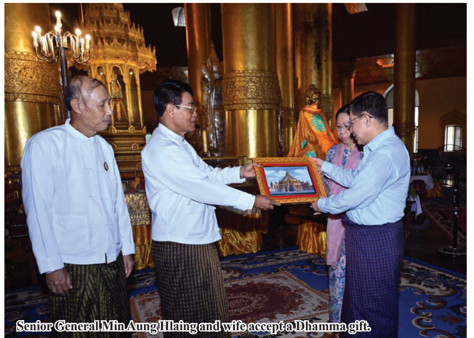
Senior General Min Aung Hlaing and wife accept a Dhamma gift.

round the pagoda counter clockwise, inspected the all-round renovation of the pagoda and gave instructions on cleanliness and renovation of the pagoda.