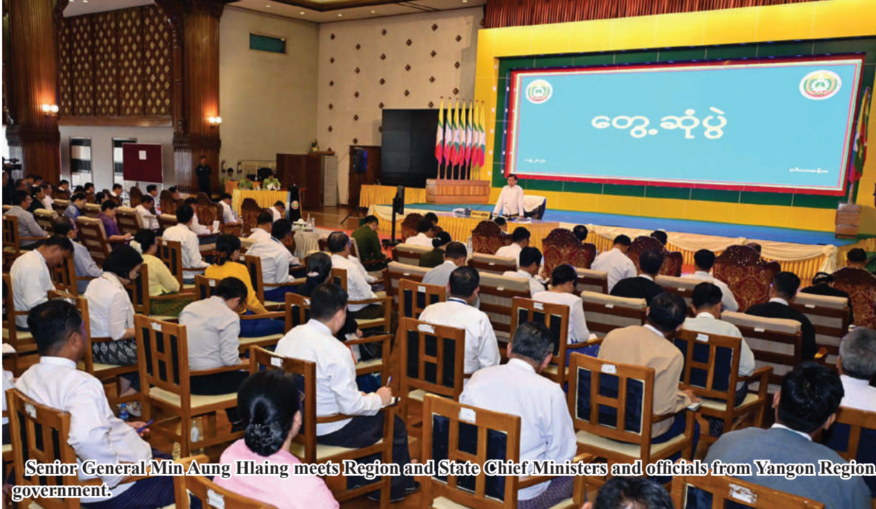
Senior General Min Aung Hlaing meets Region and State Chief Ministers and officials from Yangon Region government.

Nay Pyi Taw September 1 Chairman of State Administration Council Prime Minister Senior General Min Aung Hlaing met region/state chief ministers, members of Yangon Region cabinet, region level departmental officials at Mingala Hall of Yangon Region government office this morning and discussed regional development.