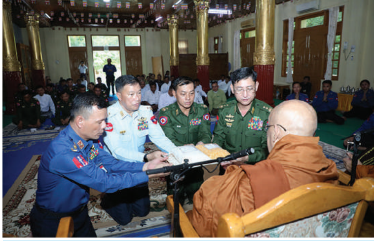
နေပြည်တော် လယ်ဝေးမြို့ ပေါက်မြိုင်ပရိယတ္တိစာသင်တိုက်ပဓာနနာယက ဆရာတော် ဘဒ္ဒန္တဇနိန္ဒထံ တပ်မတော်(ကြည်း၊ ရေ၊ လေ) မိသားစုများနှင့် အလှူရှင်များက လှူဒါန်းသော ဆွမ်းဆန်တော်နှင့် ဆီ၊ ဆား၊ ပဲ၊ ဆေးများကို ကာကွယ်ရေးဦးစီးချုပ်ရုံး(ကြည်း)မှ စစ်ရေးချုပ် ဒုတိယဗိုလ်ချုပ်ကြီးစိုးမင်းဦးနှင့် တပ်မတော်(ကြည်း၊ ရေ၊ လေ)မှ အရာရှိကြီးများက ဆက်ကပ်လှူဒါန်းစဉ်။