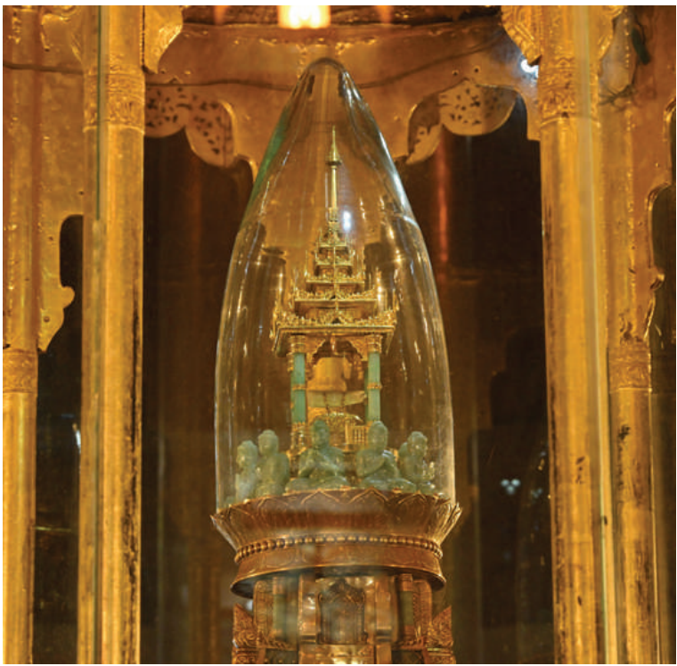
နိုင်ငံတော်စီမံအုပ်ချုပ်ရေးကောင်စီဥက္ကဋ္ဌ နိုင်ငံတော်ဝန်ကြီးချုပ် ဗိုလ်ချုပ်မှူးကြီး မင်းအောင်လှိုင်နှင့် ဇနီး ဒေါ်ကြူကြူလှတို့က စွယ်တော်မြတ်စေတီတော်ကြီး တွင် ကိန်းဝပ်စံပယ်တော်မူလျက်ရှိသည့် မြတ်ဗုဒ္ဓ၏စွယ်တော်ပွားကို ဖူးမြော် ကြည်ညိုစဉ်။

နေပြည်တော် စက်တင်ဘာ ၁ မွမ်းမံရန်အတွက် တပ်မတော်(ကြည်း၊ ရေ၊ များက လက်ခံရယူကြပြီး ဓမ္မလက်ဆောင် နိုင်ငံတော် စီမံအုပ်ချုပ်ရေးကောင်စီ (လေ) မိသားစုများက လှူဒါန်းသည့် များ ပြန်လည်ပေးအပ်သည်။ ဥက္ကဋ္ဌ နိုင်ငံတော်ဝန်ကြီးချုပ် အလှူငွေများနှင့် စုပေါင်းအလှူတော်ငွေ ထို့နောက် နိုင်ငံတော်စီမံအုပ်ချုပ်ရေး ဗိုလ်ချုပ်မှူးကြီးမင်းအောင်လှိုင်သည် ဇနီး များကို ပေးအပ်လှူဒါန်းရာ ဂေါပကအဖွဲ့ဝင် ကောင်စီဥက္ကဋ္ဌ စာမျက်နှာ ၁၉ သို့