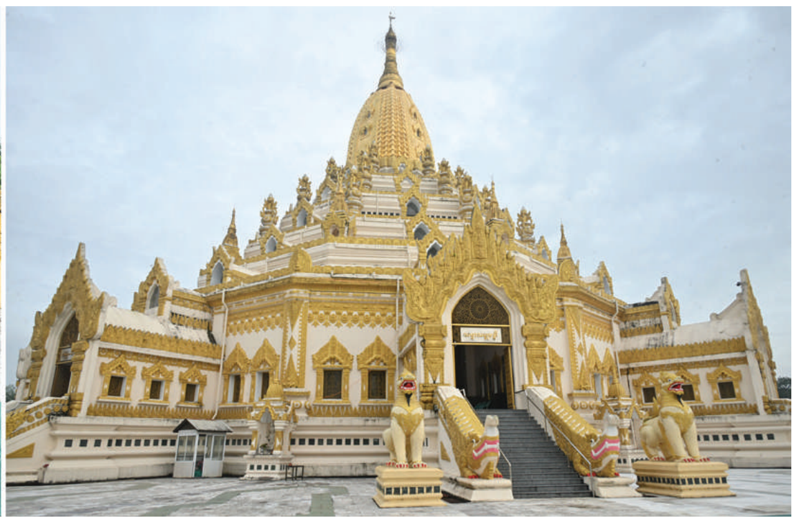
နိုင်ငံတော်စီမံအုပ်ချုပ်ရေးကောင်စီဥက္ကဋ္ဌ နိုင်ငံတော်ဝန်ကြီးချုပ် ဗိုလ်ချုပ်မှူးကြီးမင်းအောင်လှိုင် စွယ်တော်မြတ်စေတီတော်အား လက်ယာရစ်လှည့်လည်ဖူးမြော်ကြည်ညိုစဉ်။

ဒေါ်ကြူကြူလှ၊ ခရီးစဉ်တွင် လိုက်ပါလာ သည့် အဖွဲ့ဝင်များနှင့် တာဝန်ရှိသူများ လိုက်ပါ၍ ယနေ့နံနက်ပိုင်းတွင် ရန်ကုန် တိုင်းဒေသကြီး မရမ်းကုန်းမြို့နယ် ဓမ္မပါလကုန်းတော်ပေါ်၌ တည်ထား ကိုးကွယ်သည့် စွယ်တော်မြတ်စေတီ တော်(ရန်ကုန်)သို့ သွားရောက်ဖူးမြော် ကြည်ညိုသည်။ ဦးစွာ နိုင်ငံတော်စီမံအုပ်ချုပ်ရေး ကောင်စီဥက္ကဋ္ဌ နိုင်ငံတော်ဝန်ကြီးချုပ်နှင့် ဇနီး၊ အဖွဲ့ဝင်များကို ဂေါပကအဖွဲ့ဝင်များ က ကြိုဆိုနုတ်ဆက်ကြသည်။ ထို့နောက် စွယ်တော်မြတ်စေတီတော်အား ဖူးမြော် ကြည်ညိုကာ ပန်း၊ ရေချမ်း၊ ဆီမီးနှင့် သစ်သီးဆွမ်းကပ်လှူပူဇော်ကြသည်။ ယင်းနောက် နိုင်ငံတော်စီမံအုပ်ချုပ်ရေး ကောင်စီဥက္ကဋ္ဌ နိုင်ငံတော်ဝန်ကြီးချုပ်နှင့် ဇနီးတို့က စေတီတော်ကြီး ဘက်စုံပြင်