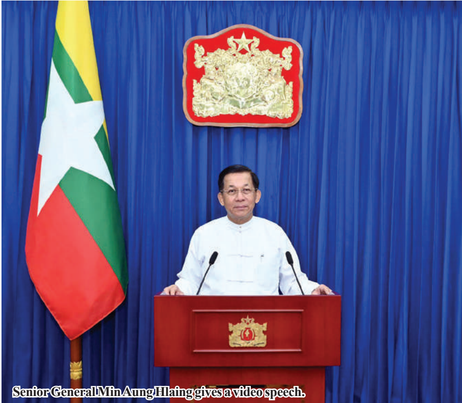
Senior General Min Aung Hlaing gives a video speech.

I extend greetings to all esteemed Myanmar people and all national brethren with best wishes for enjoying all auspiciousnesses and physical and mental well-being.