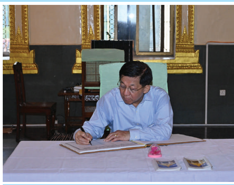
နိုင်ငံတော်စီမံအုပ်ချုပ်ရေးကောင်စီဥက္ကဋ္ဌ နိုင်ငံတော်ဝန်ကြီးချုပ် ဗိုလ်ချုပ်မှူးကြီး မင်းအောင်လှိုင် စွယ်တော်မြတ်စေတီတော်ကြီး ဧည့်သည်တော်မှတ်တမ်းစာအုပ်တွင် လက်မှတ်ရေးထိုးပူဇော်စဉ်။

ဒေါ်ကြူကြူလှ၊ ခရီးစဉ်တွင် လိုက်ပါလာ သည့် အဖွဲ့ဝင်များနှင့် တာဝန်ရှိသူများ လိုက်ပါ၍ ယနေ့နံနက်ပိုင်းတွင် ရန်ကုန် တိုင်းဒေသကြီး မရမ်းကုန်းမြို့နယ် ဓမ္မပါလကုန်းတော်ပေါ်၌ တည်ထား ကိုးကွယ်သည့် စွယ်တော်မြတ်စေတီ တော်(ရန်ကုန်)သို့ သွားရောက်ဖူးမြော် ကြည်ညိုသည်။ ဦးစွာ နိုင်ငံတော်စီမံအုပ်ချုပ်ရေး ကောင်စီဥက္ကဋ္ဌ နိုင်ငံတော်ဝန်ကြီးချုပ်နှင့် ဇနီး၊ အဖွဲ့ဝင်များကို ဂေါပကအဖွဲ့ဝင်များ က ကြိုဆိုနုတ်ဆက်ကြသည်။ ထို့နောက် စွယ်တော်မြတ်စေတီတော်အား ဖူးမြော် ကြည်ညိုကာ ပန်း၊ ရေချမ်း၊ ဆီမီးနှင့် သစ်သီးဆွမ်းကပ်လှူပူဇော်ကြသည်။ ယင်းနောက် နိုင်ငံတော်စီမံအုပ်ချုပ်ရေး ကောင်စီဥက္ကဋ္ဌ နိုင်ငံတော်ဝန်ကြီးချုပ်နှင့် ဇနီးတို့က စေတီတော်ကြီး ဘက်စုံပြင်