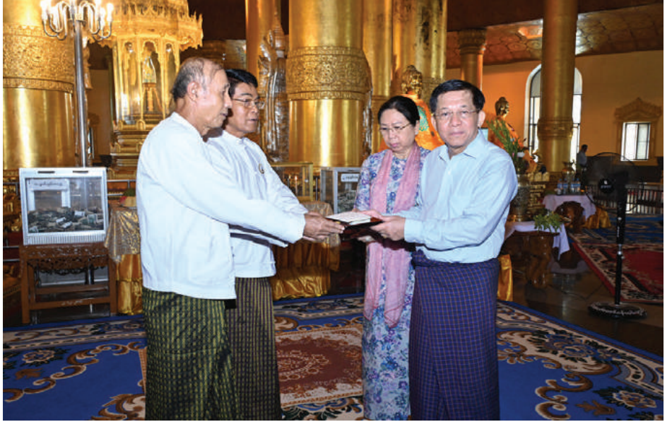
နိုင်ငံတော်စီမံအုပ်ချုပ်ရေးကောင်စီဥက္ကဋ္ဌ နိုင်ငံတော်ဝန်ကြီးချုပ် ဗိုလ်ချုပ်မှူးကြီးမင်းအောင်လှိုင်နှင့် ဇနီး ဒေါ်ကြူကြူလှတို့က စွယ်တော်မြတ်စေတီတော်ကြီး ဘက်စုံပြုပြင်မွမ်းမံရန်အတွက် တပ်မတော်(ကြည်း၊ ရေ၊ လေ) ဗိသားစုများက လှူဒါန်းသည့် အလှူငွေများနှင့် စုပေါင်းအလှူတော်ငွေများကို ပေးအပ်လှူဒါန်းရာ ဂေါပကအဖွဲ့ဝင်များက လက်ခံရယူစဉ်။

စာမျက်နှာ ၁၈ မှအဆက် နိုင်ငံတော်ဝန်ကြီးချုပ်နှင့် အဖွဲ့ဝင်များသည် စေတီတော်ကြီးတွင် ကိန်းဝပ်စံပယ်တော်မူလျက်ရှိသည့် မြတ်ဗုဒ္ဓ၏စွယ်တော်ပွားကို ဖူးမြော်ကြည့်ညှိကြသည်။ ၎င်းနောက် နိုင်ငံတော်စီမံအုပ်ချုပ်ရေးကောင်စီဥက္ကဋ္ဌ နိုင်ငံတော်ဝန်ကြီးချုပ်က စေတီတော်ကြီး ဧည့်သည်တော်မှတ်တမ်းစာအုပ်တွင် လက်မှတ်ရေးထိုးပူဇော်သည်။ ယင်းနောက် နိုင်ငံတော်စီမံအုပ်ချုပ်ရေးကောင်စီဥက္ကဋ္ဌ နိုင်ငံတော်ဝန်ကြီးချုပ်သည် စေတီတော်မြတ်အား လက်ယာရစ်လှည့်လည်ပူဇော်၍ စေတီတော်ကြီး ရေရှည်တည်တံ့ခိုင်မြဲရေး ထိန်းသိမ်းဆောင်ရွက်ထားရှိမှု အခြေအနေများကို ကြည့်ရှုကာ စေတီတော်မြတ်ကြီး အမြဲသန့်ရှင်းသာယာပြီး ကြည်ညိုဖွယ်ဖြစ်စေ စေရေးအတွက် ဆောင်ရွက်ရန်၊ စေတီတော်ကြီး ရင်ပြင်တော်သန့်ရှင်းရေးအပါအဝင် ဘက်စုံပြုပြင်မွမ်းမံရန် လိုအပ်သည်များကို လမ်းညွှန်မှာကြားသည်။ ထို့နောက် နိုင်ငံတော်စီမံအုပ်ချုပ်ရေး