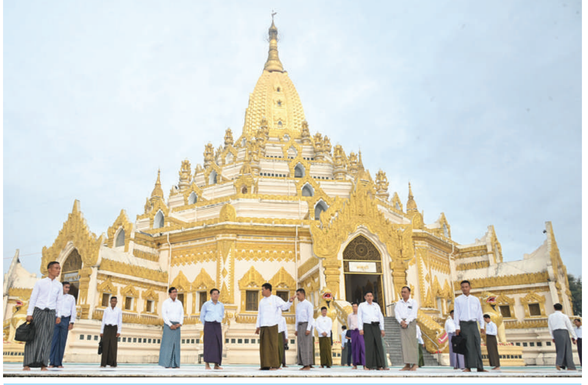
နိုင်ငံတော်စီမံအုပ်ချုပ်ရေးကောင်စီဥက္ကဋ္ဌ နိုင်ငံတော်ဝန်ကြီးချုပ် ဗိုလ်ချုပ်မှူးကြီးမင်းအောင်လှိုင် စွယ်တော်မြတ်စေတီတော်အား လက်ယာရစ်လှည့်လည်ဖူးမြော်ကြည့်ညှိ၍ စေတီတော်ကြီး ရေရှည်တည်တံ့ခိုင်မြဲရေး ထိန်းသိမ်းဆောင်ရွက်ထားရှိမှုအခြေအနေများကို ကြည့်ရှုစဉ်။