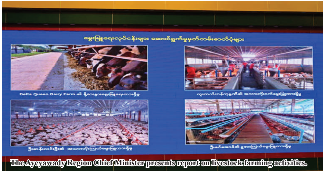
The Ayeeyawady Region Chief Minister presents report on livestock farming activities.