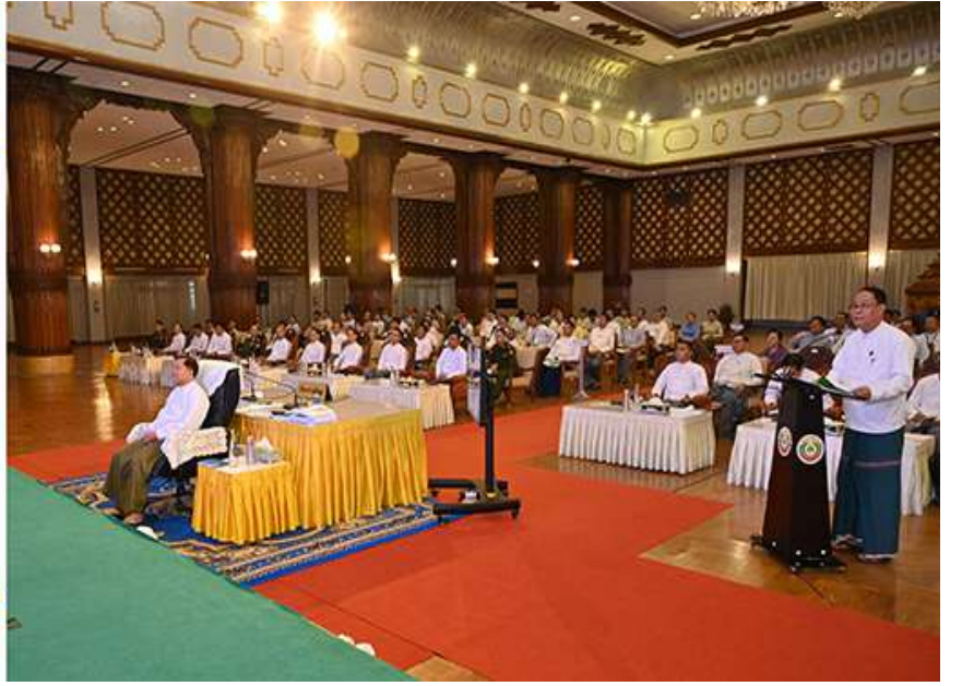
နိုင်ငံတော်စီမံအုပ်ချုပ်ရေးကောင်စီဥက္ကဋ္ဌ နိုင်ငံတော်ဝန်ကြီးချုပ် ဗိုလ်ချုပ်မှူးကြီးမင်းအောင်လှိုင်အား ကရင်ပြည်နယ်ဝန်ကြီးချုပ် ဦးစောမြင့်ဦးက ဒေသဆိုင်ရာအချက်အလက်များနှင့် ဒေသဖွံ့ဖြိုးတိုးတက်ရေး ဆောင်ရွက် နေမှုများအား ရှင်းလင်းတင်ပြစဉ်။

ရှိကြောင်း၊ ပညာတတ်များ ပေါ်ကြွယ်ဝရေး ပြည်နယ်နှင့် တိုင်းဒေသကြီးအလိုက်လည်း ကြိုးပမ်း ဆောင်ရွက်ကြစေလိုကြောင်းဖြင့် ပြောကြားသည်။