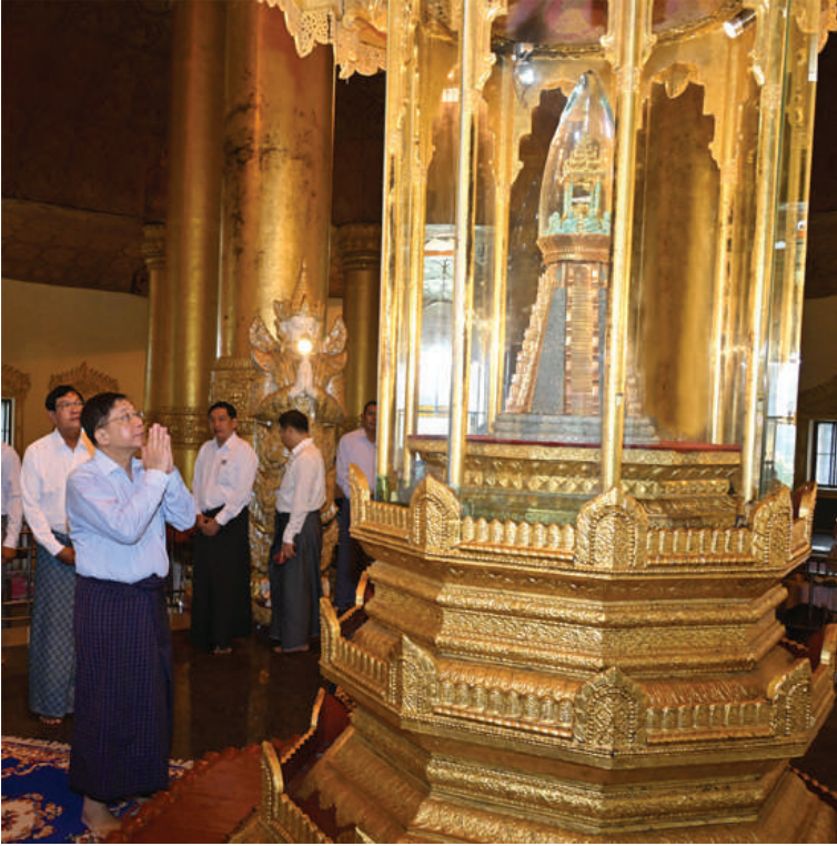
နိုင်ငံတော်စီမံအုပ်ချုပ်ရေးကောင်စီဥက္ကဋ္ဌ နိုင်ငံတော်ဝန်ကြီးချုပ် ဗိုလ်ချုပ်မှူးကြီး မင်းအောင်လှိုင် စွယ်တော်မြတ်စေတီတော်ကြီးတွင် ကိန်းဝပ်စံပယ်တော်မူလျက်ရှိသည့် မြတ်ဗုဒ္ဓ၏စွယ်တော်ပွားကို ဖူးမြော်ကြည့်ညှိစဉ်။