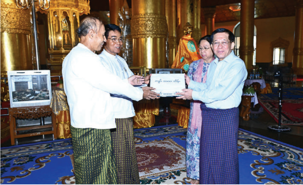
နိုင်ငံတော်စီမံအုပ်ချုပ်ရေးကောင်စီဥက္ကဋ္ဌ နိုင်ငံတော်ဝန်ကြီးချုပ် ဗိုလ်ချုပ်မှူးကြီးမင်းအောင်လှိုင်နှင့် ဇနီး ဒေါ်ကြူကြူလှတို့က စွယ်တော်မြတ်စေတီတော်ကြီး ဘက်စုံပြုပြင်မွမ်းမံရန်အတွက် တပ်မတော်(ကြည်း၊ ရေ၊ လေ) ဗိသားစုများက လှူဒါန်းသည့် အလှူငွေများနှင့် စုပေါင်းအလှူတော်ငွေများကို ပေးအပ်လှူဒါန်းရာ ဂေါပကအဖွဲ့ဝင်များက လက်ခံရယူစဉ်။