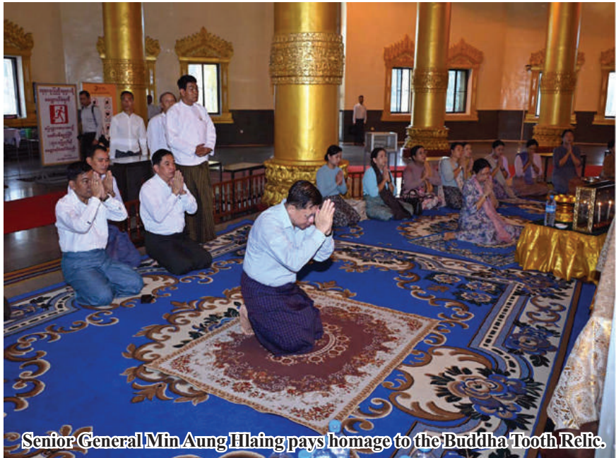
Senior General Min Aung Hlaing pays homage to the Buddha Tooth Relic.