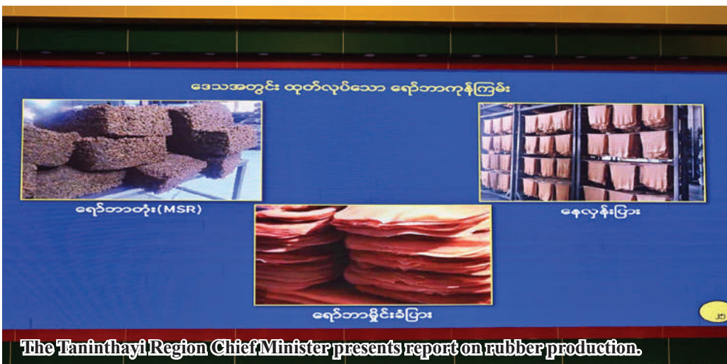
The Taninthayi Region Chief Minister presents report on rubber production.

try's economic development. He emphasized that every country in the world desires economic growth and development. A strong economy is the foundation for political stability and peace, enabling citizens to live and work with peace of mind and in good health. Therefore, the economy and politics are mutually dependent, and every citizen has a responsibility for the nation's economic development. From the time of gaining independence to the present day, our country has experienced various political systems. Along with these changes in political systems, there have also been changes in economic systems. While there have been some advancements in the economy, there have also been many instances where the expected level of success was not achieved. It is evident that economic weaknesses have led to political issues, such as economic decline and limited job opportunities. We must learn