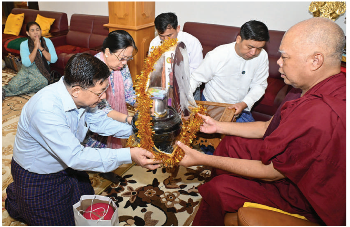
အပြည်ပြည်ဆိုင်ရာထေရဝါဒဗုဒ္ဓသာသနာပြုတက္ကသိုလ် ပါမောက္ခချုပ်ဆရာတော် အဂ္ဂမဟာပဏ္ဍိတ အဂ္ဂမဟာသဒ္ဓမ္မဇောတိကဓဇ မဟာဓမ္မကထိက ဗဟုဇနဟိတရ ဒေါက်တာဘဒ္ဒန္တဆေကိန္ဒထံ နိုင်ငံတော်စီမံအုပ်ချုပ်ရေးကောင်စီဥက္ကဋ္ဌ နိုင်ငံတော်ဝန်ကြီးချုပ် ဗိုလ်ချုပ်မှူးကြီးမင်းအောင်လှိုင်နှင့် ဇနီး ဒေါ်ကြူကြူလှတို့က လှူဖွယ်ပစ္စည်းများနှင့် နဝကမ္မအလှူတော်ငွေများ ဆက်ကပ်လှူဒါန်းစဉ်။

ကောင်စီဥက္ကဋ္ဌ နိုင်ငံတော်ဝန်ကြီးချုပ်သည် စေတီတော်ကြီးရှိ ခေါင်းလောင်းတော်အား ထိုးခတ်ပူဇော်သည်။ ၎င်းနောက် နိုင်ငံတော်စီမံအုပ်ချုပ်ရေးကောင်စီဥက္ကဋ္ဌ နိုင်ငံတော်ဝန်ကြီးချုပ်နှင့် ဇနီးအဖွဲ့ဝင်များသည် အပြည်ပြည်ဆိုင်ရာ ထေရဝါဒဗုဒ္ဓသာသနာပြုတက္ကသိုလ် ပါမောက္ခချုပ်ဆရာတော်အဂ္ဂမဟာပဏ္ဍိတ အဂ္ဂမဟာသဒ္ဓမ္မဇောတိကဓဇ မဟာဓမ္မကထိက ဗဟုဇနဟိတရ ဒေါက်တာ ဘဒ္ဒန္တဆေကိန္ဒအား သွားရောက်ဖူးမြော်ကြည့်ညှိ၍ ဗုဒ္ဓသာသနာတော် ထွန်းကားပြန့်ပွားရေးဆိုင်ရာများ၊ ပညာရေးကဏ္ဍဖွံ့ဖြိုးတိုးတက်ရေးဆိုင်ရာများကို တင်ပြလျှောက်ထားကာ ဆရာတော်ကြီး၏ မိန့်ကြားမှုများကို နာယူသည်။ ထို့နောက် နိုင်ငံတော်စီမံအုပ်ချုပ်ရေးကောင်စီဥက္ကဋ္ဌ နိုင်ငံတော်ဝန်ကြီးချုပ်နှင့် ဇနီးတို့က ဆရာတော်ကြီးထံ လှူဖွယ်ပစ္စည်းများနှင့် နဝကမ္မအလှူတော်ငွေများကို ဆက်ကပ်လှူဒါန်းခဲ့ကြောင်း သတင်းရရှိသည်။ (၅၀၁)