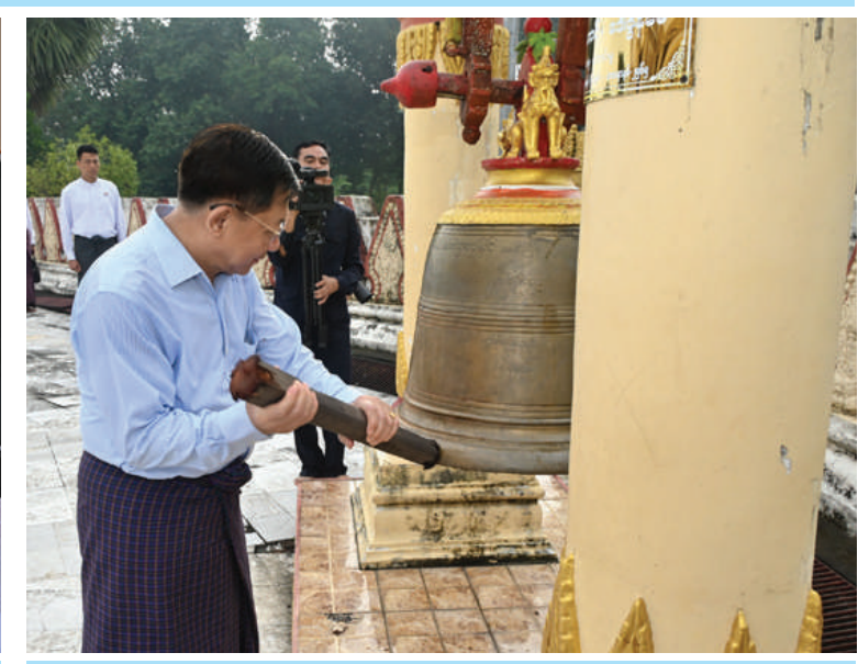
နိုင်ငံတော်စီမံအုပ်ချုပ်ရေးကောင်စီဥက္ကဋ္ဌ နိုင်ငံတော်ဝန်ကြီးချုပ် ဗိုလ်ချုပ်မှူးကြီး မင်းအောင်လှိုင် စွယ်တော်မြတ်စေတီတော်ကြီးရှိ ခေါင်းလောင်းတော်အား ထိုးခတ် ပူဇော်စဉ်။