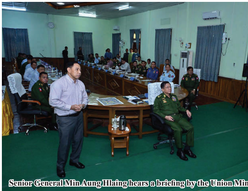
Senior General Min Aung Hlaing hears a briefing by the Union Minister for Home Affairs.

and research on the city's walls should be conducted systematically by experts. He stated that the restora-