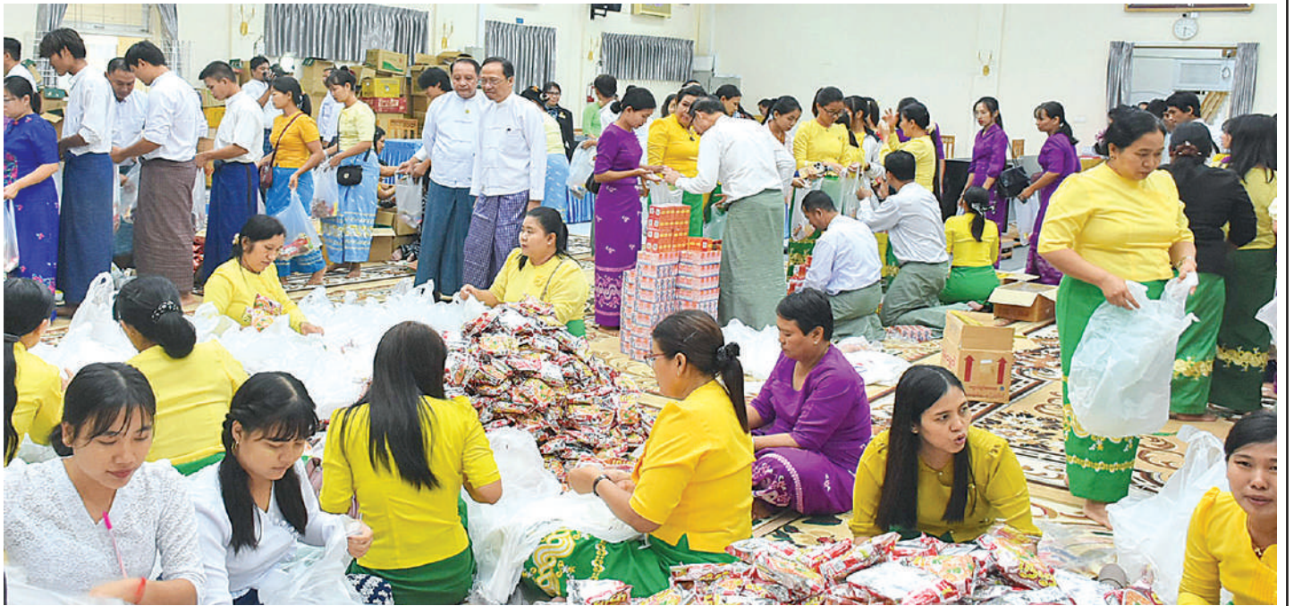
နိုင်ငံတော်ကာကွယ်ရေးနှင့်လုံခြုံရေးတာဝန်များကို စွမ်းစွမ်းတစ်ထမ်းဆောင်လျက်ရှိသော လုံခြုံရေးတပ်ဖွဲ့ဝင်များထံပေးပို့ရန် စားသောက်ဖွယ်ရာများ ထုပ်ပိုးနေမှုကို တွေ့ရစဉ်။

အာဏာရပါတီရဲ့ကိုယ်စားလှယ်ကများလို့ ကိုယ်စား လှယ်တွေလို့သုံးလိုက်တာပါ။ သူတို့မှာသင်္ခါရဝရှိစိတ် အမှန်တကယ်ရှိရင် တပ်မတော်ဆိုတာ နိုင်ငံမှာမရှိ မဖြစ်တဲ့အဖွဲ့အစည်းပါလား။ ဒီအဖွဲ့အစည်းရှိနေလို့ အချုပ်အခြာအာဏာပိုင် မြန်မာနိုင်ငံဆိုတာရှိနေပါ လားဆိုတဲ့စိတ်ရှိသင့်ပါလျက်မရှိခဲ့ဘူး။ ဘာကြောင့် မရှိရသလဲ။