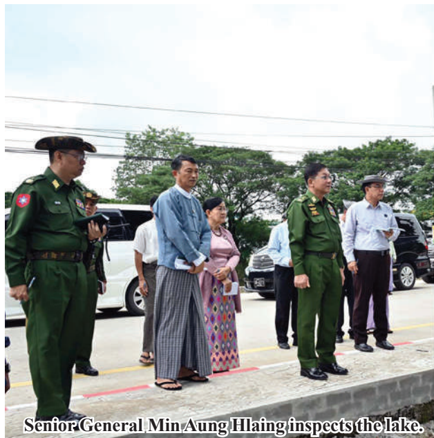
Senior General Min Aung Hlaing inspects the lake.