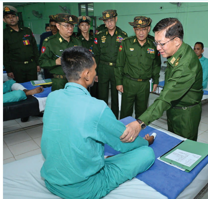
ဒဏ်ရာရရှိခဲ့မှုအခြေအနေများ၊ ရောဂါ ဆောင်ရွက်ပေးသည်။ ကုသပျောက်ကင်းမှု အခြေအနေများကို ယင်းနောက် နိုင်ငံတော်စီမံအုပ်ချုပ်ရေး တစ်ဦးချင်းလိုက်လံတွေ့ဆုံ၍ ရင်းနှီး ကောင်စီဥက္ကဋ္ဌ တပ်မတော်ကာကွယ်ရေး ဦးစီးချုပ်နှင့် အဖွဲ့ဝင်များသည် ဆေးရုံ ပြောကြားကာ အရာရှိ၊ စစ်သည်များနှင့် တက်ရောက် ကုသမှုခံယူလျက်ရှိသည့် အရာရှိ၊ စစ်သည်များနှင့် မြန်မာနိုင်ငံ မြန်မာနိုင်ငံရဲတပ်ဖွဲ့ဝင်များ၏ တင်ပြချက် များအပေါ် လိုအပ်သည်များ ဖြည့်ဆည်း ရဲတပ်ဖွဲ့ဝင်များကို ဂုဏ်ပြုချီးမြှင့်ငွေနှင့်

များကိုဖော်ထုတ်၍ အကြမ်းဖက်မှုလုပ်ရပ် များ လျော့နည်းပပျောက်သွားအောင် ဆောင်ရွက်သွားရန်လိုကြောင်း၊ နယ်မြေ တည်ငြိမ်အေးချမ်းရေးနှင့် လမ်းပန်း ဆက်သွယ်မှုများ လုံခြုံချောမွေ့ကောင်းမွန် စေရေးအတွက် ဆောင်ရွက်ရာတွင် ရေရှည် အတွက် ထည့်သွင်းစဉ်းစားဆောင်ရွက် သွားရန်လိုကြောင်းနှင့် အခြားနယ်မြေ ဒေသလုံခြုံရေးနှင့် တည်ငြိမ်အေးချမ်းရေး ဆိုင်ရာများနှင့်ပတ်သက်၍ လိုအပ်သည် များကို လမ်းညွှန်မှာကြားခဲ့သည်။ ထို့နောက် နိုင်ငံတော်စီမံအုပ်ချုပ်ရေး ကောင်စီဥက္ကဋ္ဌ တပ်မတော်ကာကွယ်ရေး ဦးစီးချုပ်နှင့် အဖွဲ့ဝင်များသည် တောင်ငူ မြို့ရှိ နယ်မြေခံတပ်မတော်ဆေးရုံ၌ တက်ရောက် ကုသမှုခံယူလျက်ရှိသည့် နိုင်ငံတော်ကာကွယ်ရေးနှင့် လုံခြုံရေး တာဝန်များထမ်းဆောင်စဉ် ထိခိုက်ဒဏ်ရာ ရရှိခဲ့သော အရာရှိ၊ စစ်သည်များနှင့် မြန်မာနိုင်ငံရဲတပ်ဖွဲ့ဝင်များကို သွားရောက် ကြည့်ရှုအားပေးစကားပြောကြားသည်။ ထိုသို့အားပေးစကားပြောကြားရာတွင် ဦးစွာ နိုင်ငံတော်စီမံအုပ်ချုပ်ရေးကောင်စီ ဥက္ကဋ္ဌ တပ်မတော်ကာကွယ်ရေးဦးစီးချုပ် သည် နိုင်ငံတော်ကာကွယ်ရေးနှင့်လုံခြုံရေး တာဝန်များထမ်းဆောင်စဉ် ထိခိုက် ဒဏ်ရာရရှိခဲ့သော အရာရှိ၊ စစ်သည်များ နှင့် မြန်မာနိုင်ငံရဲတပ်ဖွဲ့ဝင်များအား ထိခိုက်