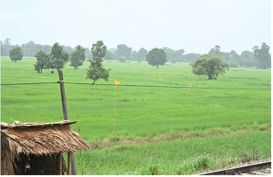
နိုင်ငံတော်စီမံအုပ်ချုပ်ရေးကောင်စီဥက္ကဋ္ဌ နိုင်ငံတော်ဝန်ကြီးချုပ် ဗိုလ်ချုပ်မှူးကြီးမင်းအောင်လှိုင် တောင်ငူဘူတာရုံ(အသစ်) တည်ဆောက်မည့်နေရာကို ကြည့်ရှု စစ်ဆေးစဉ်။