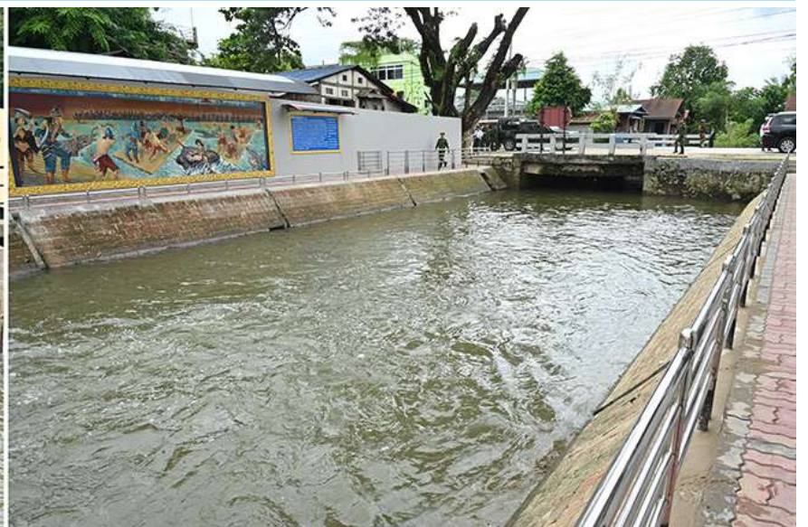
နိုင်ငံတော်စီမံအုပ်ချုပ်ရေးကောင်စီဥက္ကဋ္ဌ နိုင်ငံတော်ဝန်ကြီးချုပ် ဗိုလ်ချုပ်မှူးကြီးမင်းအောင်လှိုင် တောင်ငူမြို့၊ ကော့မတီမြို့ဟောင်း အရှေ့ဘက်ကျုံးနေရာရှိ ယိုးဒယားပေါက် နေရာတွင် လှည့်လည်ကြည့်ရှုစစ်ဆေးစဉ်။