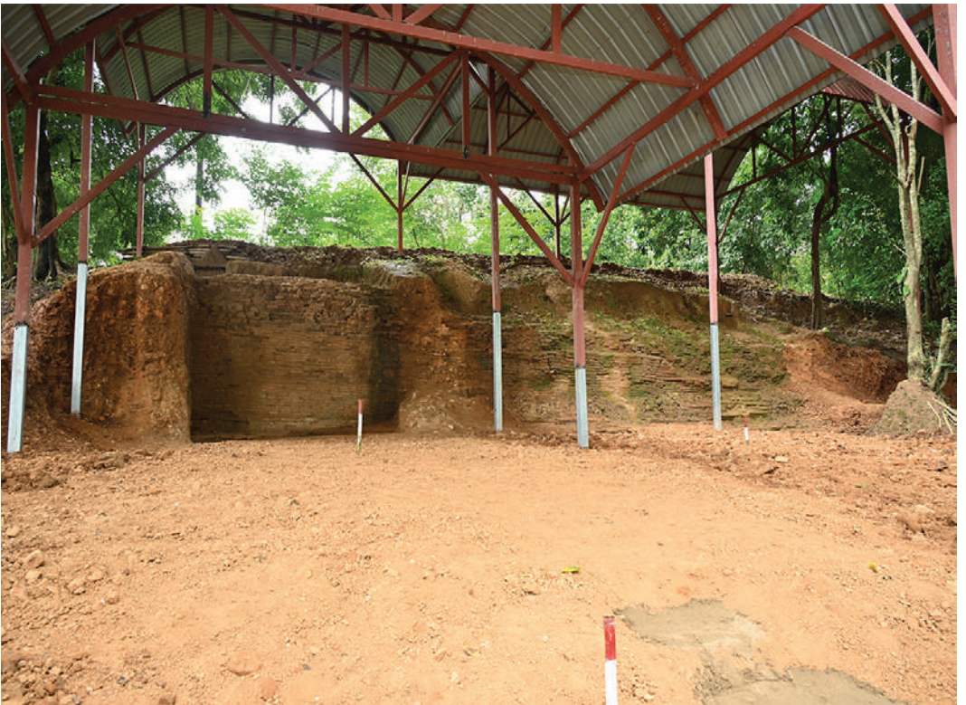
နိုင်ငံတော်စီမံအုပ်ချုပ်ရေးကောင်စီဥက္ကဋ္ဌ နိုင်ငံတော်ဝန်ကြီးချုပ် ဗိုလ်ချုပ်မှူးကြီးမင်းအောင်လှိုင် တောင်ငူမြို့၊ ကေတုမတီမြို့ဟောင်း မြို့ရိုးတူးဖော်ထိန်းသိမ်းထားရှိမှုအခြေအနေများကို လှည့်လည်ကြည့်ရှုစစ်ဆေးစဉ်။

နေပြည်တော် ဩဂုတ် ၂၃ နိုင်ငံတော်စီမံအုပ်ချုပ်ရေးကောင်စီဥက္ကဋ္ဌ နိုင်ငံတော်ဝန်ကြီးချုပ် ဗိုလ်ချုပ်မှူးကြီးမင်းအောင်လှိုင်သည် ယနေ့နံနက်ပိုင်းတွင် ကောင်စီတွဲဖက်အတွင်းရေးမှူး ဗိုလ်ချုပ်ကြီးရဲဝင်းဦး၊ ကောင်စီဝင်များဖြစ်ကြသည့် ဗိုလ်ချုပ်ကြီးမြထွန်းဦး၊ ဗိုလ်ချုပ်ကြီးမောင်မောင်အေးနှင့် ဒုတိယဗိုလ်ချုပ်ကြီးရာပြည့်၊ ပြည်ထောင်စုဝန်ကြီးများဖြစ်ကြသည့် ဦးမင်းနောင်နှင့် ဦးမျိုးသန့်၊ ကာကွယ်ရေးဦးစီးချုပ်ရုံးမှ အဆင့်မြင့်တပ်မတော်အရာရှိကြီးများနှင့် တာဝန်ရှိသူများလိုက်ပါ၍ တောင်ငူမြို့၊ ကေတုမတီမြို့ဟောင်း ရှေးဟောင်း နိုင်ငံတော်ဝန်ကြီးချုပ်နှင့်အဖွဲ့ဝင်များသည် တောင်ငူမြို့ရှိ နယ်မြေခံလေတပ်စခန်းဌာနချုပ်သို့ ရောက်ရှိကြရာ ပဲခူးတိုင်းဒေသကြီး ဝန်ကြီးချုပ် ဦးမျိုးဆွေဝင်း၊ တောင်ပိုင်းတိုင်းစစ်ဌာနချုပ် တိုင်းမှူး ဗိုလ်ချုပ်ကြည်သိုက်နှင့် စာမျက်နှာ ၁၆ ကော်လံ ၁