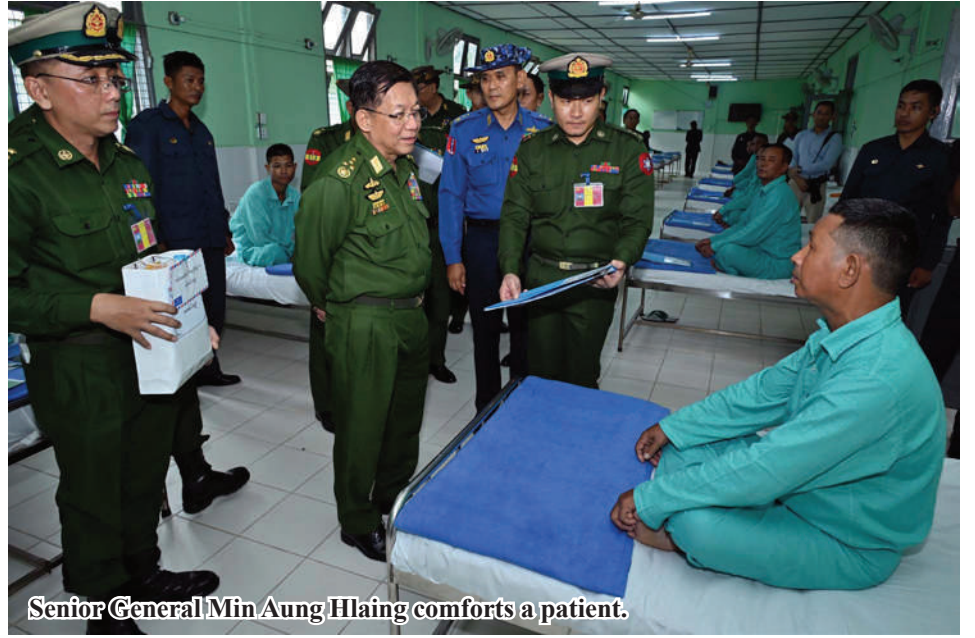
Senior General Min Aung Hlaing comforts a patient.