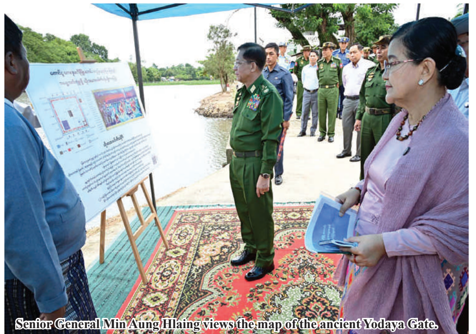
Senior General Min Aung Hlaing views the map of the ancient Yodaya Gate.

due to various reasons, are reopened, extra classes must be opened. If students are taught so that they actually