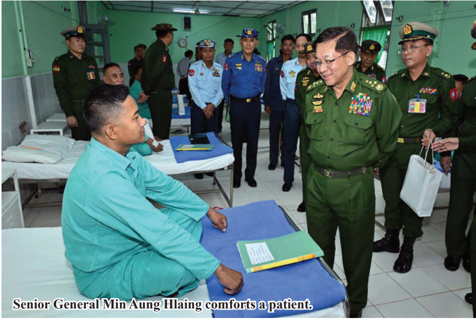
Senior General Min Aung Hlaing comforts a patient.