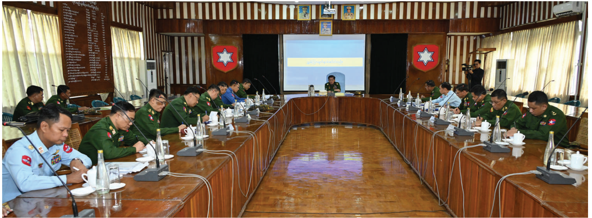
နိုင်ငံတော်စီမံအုပ်ချုပ်ရေးကောင်စီဥက္ကဋ္ဌ တပ်မတော်ကာကွယ်ရေးဦးစီးချုပ် ဗိုလ်ချုပ်မှူးကြီးမင်းအောင်လှိုင် တောင်ပိုင်းတိုင်းစစ်ဌာနချုပ်အတွင်း နယ်မြေတည်ငြိမ်အေးချမ်းရေးဆိုင်ရာ ဆောင်ရွက်ထားရှိမှု များနှင့်ပတ်သက်၍ ရှင်းလင်းတင်ပြမှုများအပေါ် လမ်းညွှန်မှာကြားစဉ်။

☆ ကျော့ဖုံးမှအဆက် နယ်မြေ တည်ငြိမ်အေးချမ်းရေးဆိုင်ရာ ဆောင်ရွက်ထားရှိမှုများကို စစ်ဆေးသည်။ ဦးစွာ တောင်ပိုင်းတိုင်းစစ်ဌာနချုပ် အစည်းအဝေးခန်းမတွင် တိုင်းမှူး ဗိုလ်ချုပ်ကြည်သိုက်က တောင်ပိုင်းတိုင်းစစ်ဌာနချုပ် နယ်မြေအတွင်း EAO အဖွဲ့အချို့နှင့် PDF အမည်ခံ အကြမ်းဖက်သောင်းကျန်းသူ များက နယ်မြေတည်ငြိမ်အေးချမ်းမှု ပျက်ပြားအောင် ဆောင်ရွက်နေမှုအခြေအနေများ၊ အများပြည်သူသွားလာလျက် ရှိသည့် ဆက်သွယ်ရေးလမ်းကြောင်းများ၊ တံတားများနှင့် မီးရထားလမ်းများကို မိုင်းထောင်ဖောက်ခွဲလျက်ရှိမှုအခြေအနေ များနှင့် တပ်မတော်နှင့် မြန်မာနိုင်ငံ ရဲတပ်ဖွဲ့ဝင်များအနေဖြင့် နယ်မြေတည်ငြိမ် အေးချမ်းရေးအတွက် လုံခြုံရေးလုပ်ငန်း များ ဆောင်ရွက်လျက်ရှိမှုအခြေအနေများ နှင့်ပတ်သက်၍ ရှင်းလင်းတင်ပြသည်။ ရှင်းလင်းတင်ပြမှုများအပေါ် နိုင်ငံတော် စီမံအုပ်ချုပ်ရေးကောင်စီဥက္ကဋ္ဌ တပ်မတော် ကာကွယ်ရေးဦးစီးချုပ်က အများပြည်သူ လုံခြုံရေးနှင့် ဒေသအတွင်းတည်ငြိမ် အေးချမ်းရေးအတွက် လုံခြုံရေးလုပ်ငန်း များကို စနစ်တကျဆောင်ရွက်သွားရန် လိုကြောင်း၊ အကြမ်းဖက်မှုလုပ်ငန်းများ နှင့်ဆက်စပ်လျက်ရှိသည့် အကြမ်းဖက် သောင်းကျန်းသူများ၏ သတင်းကွင်းဆက်