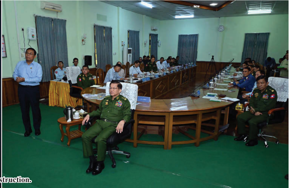
Senior General Min Aung Hlaing hears a briefing by the Union Minister for Construction.