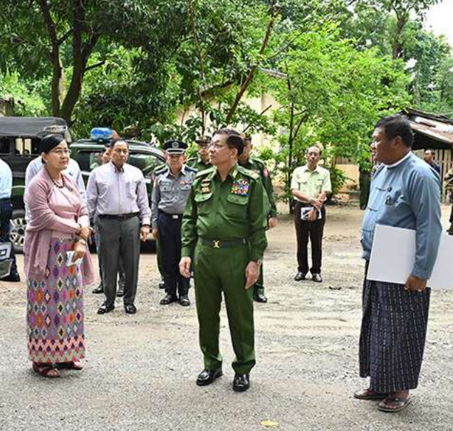
နိုင်ငံတော်စီမံအုပ်ချုပ်ရေးကောင်စီဥက္ကဋ္ဌ နိုင်ငံတော်ဝန်ကြီးချုပ် ဗိုလ်ချုပ်မှူးကြီးမင်းအောင်လှိုင် တောင်ငူမြို့ ကေတုမတီမြို့ဟောင်း မြို့ရိုးအရှေ့တောင်ထောင့်ရှိ မြို့လေးခံတပ် နေရာတွင် လှည့်လည်ကြည့်ရှုစစ်ဆေးစဉ်။

ဖော်ထုတ်ရေး လျာထားဆောင်ရွက်လျက် ရှိမှုအခြေအနေများကိုလည်းကောင်း၊ ပဲခူး တိုင်းဒေသကြီး ဝန်ကြီးချုပ်ဦးမျိုးဆွေဝင်းက တောင်ငူခရိုင် ဒေသဆိုင်ရာအချက်အလက် များနှင့် ဒေသဖွံ့ဖြိုးတိုးတက်ရေးဆောင်ရွက် ထားရှိမှု အခြေအနေများကိုလည်းကောင်း အသီးသီးရှင်းလင်းတင်ပြကြသည်။ ရှင်းလင်းတင်ပြမှုများအပေါ် နိုင်ငံတော် စီမံအုပ်ချုပ်ရေးကောင်စီဥက္ကဋ္ဌ နိုင်ငံတော် ဝန်ကြီးချုပ်က မြို့ရိုးနှင့်ပတ်သက်၍ တူးဖော်သုတေသနပြုလုပ်ငန်းများ ဆောင် ရွက်ရာတွင် ကျွမ်းကျင်သူများဖြင့်စနစ်တကျ ဆောင်ရွက်ရန်လိုကြောင်း၊ မြို့ရိုးများ၊ မြို့ရိုး ဝင်ပေါက်များနှင့် တံတားများကို ပြန်လည် ပြုပြင်ထိန်းသိမ်းတည်ဆောက်မှုများ ပြုလုပ် ရာတွင် ဖြစ်နိုင်ဖွယ်ရာအချက်အလက်များ နှင့်အညီ ဆောင်ရွက်သွားရန်လိုကြောင်း၊ ကျုံးနှင့်တံတားများကို ဦးစားပေးအနေဖြင့်