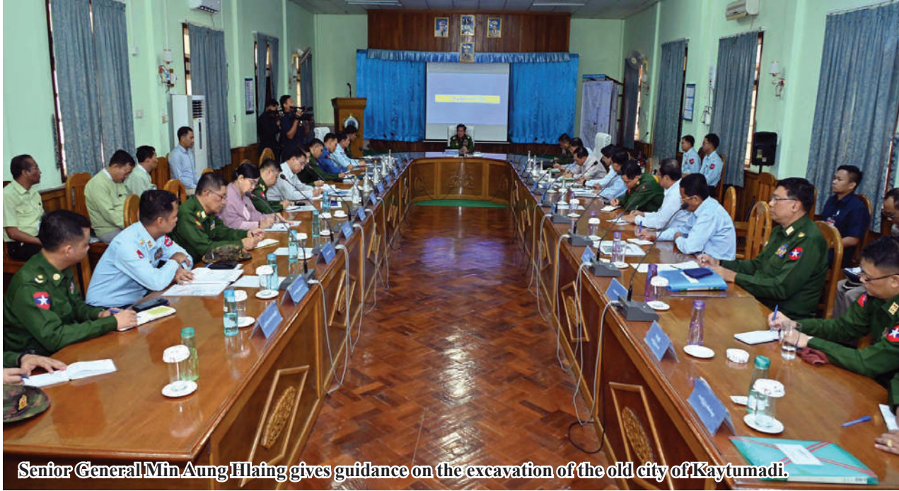
Senior General Min Aung Hlaing gives guidance on the excavation of the old city of Kaytumadi.