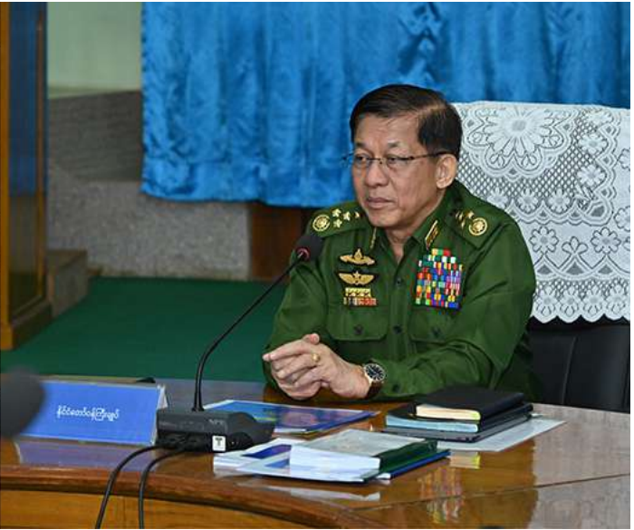
နိုင်ငံတော်စီမံအုပ်ချုပ်ရေးကောင်စီဥက္ကဋ္ဌ နိုင်ငံတော်ဝန်ကြီးချုပ် ဗိုလ်ချုပ်မှူးကြီးမင်းအောင်လှိုင် တောင်ငူမြို့ နယ်မြေခံလေတပ်စခန်းဌာနချုပ် အစည်းအဝေးခန်းမ၌ တာဝန်ရှိသူ များကို တွေ့ဆုံအမှာစကားပြောကြားစဉ်။