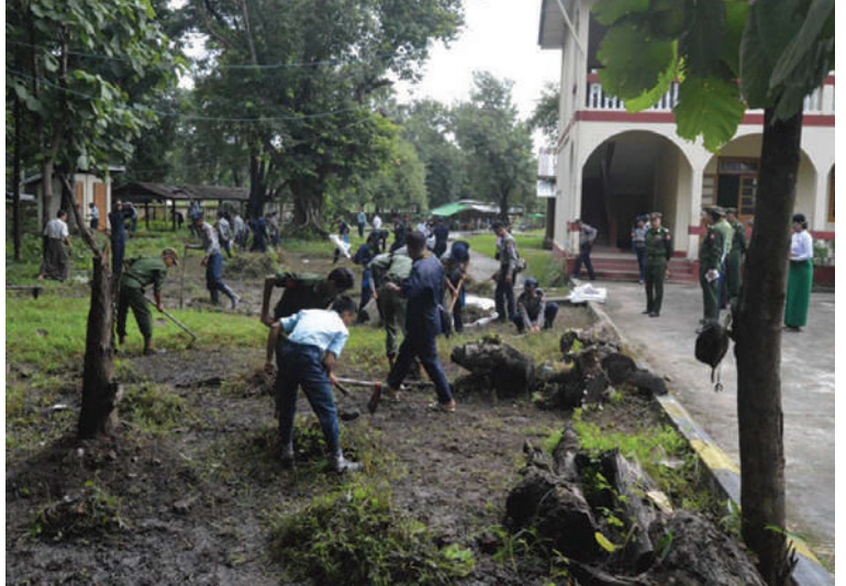
တောင်ပိုင်းတိုင်းစစ်ဌာနချုပ်မှ နယ်မြေခံတပ်မတော်သားများ၊ ဌာနဆိုင်ရာဝန်ထမ်းများက အခြေခံပညာကျောင်း၌ စုပေါင်းသန့်ရှင်းရေးဆောင်ရွက်ကြစဉ်။

မြို့နယ် အပါအဝင် မြို့နယ် ၁၃ မြို့နယ်တို့ရှိ အခြေခံပညာကျောင်းများ၌လည်းကောင်း၊ ပဲခူးတိုင်းဒေသကြီး တောင်ငူမြို့ရှိ အခြေခံပညာအထက်တန်းကျောင်း(နတ်စင်ကုန်း)၌လည်းကောင်း စာသင်ကျောင်းများအတွင်း၊ အပြင်ရှိ ချုံနွယ်ပေါင်းမြက်များ ခုတ်ထွင်ရှင်းလင်းခြင်း၊ အမှိုက်များရှင်းလင်းခြင်းနှင့် ရေနုတ်မြောင်းများ ရေစီးရေလာကောင်းမွန်စေရေးတို့အတွက် နယ်မြေခံတပ်မတော်သားများက မြန်မာနိုင်ငံရဲတပ်ဖွဲ့ဝင်များ၊ မီးသတ်တပ်ဖွဲ့ဝင်များ၊ စစ်မှုထမ်းဟောင်းအဖွဲ့ဝင်များ၊ ပြည်သူ့စစ်(ဌာန)တပ်ဖွဲ့ဝင်များ၊ ဌာနဆိုင်ရာဝန်ထမ်းများ၊ ဒေသခံပြည်သူများနှင့်အတူ စုပေါင်းဆောင်ရွက်ပေးကြသည်။ ယင်းသို့ ဆောင်ရွက်နေမှုများကို သက်ဆိုင်ရာတိုင်းစစ်ဌာနချုပ်များမှ တိုင်းမှူးများနှင့်တာဝန်ရှိသူများက လိုက်လံကြည့်ရှုအားပေးပြီး လိုအပ်သည်များ ညှိနှိုင်းဆောင်ရွက်ပေးခဲ့ကြကြောင်း သတင်းရရှိသည်။ (၅၀၁)