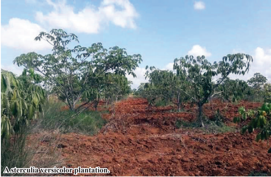
Asterculia versicolor plantation.

Shwebo August 17 Sagain Region. Statistics of Shwebo District Agriculture Department stated that a total of 3,182 acres of Sterculia versicolor plants in Shwebo District of