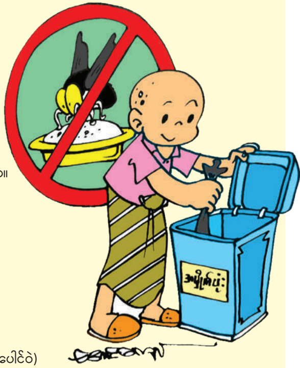
သုတလင်း (ဆင်ပေါင်ဝဲ)