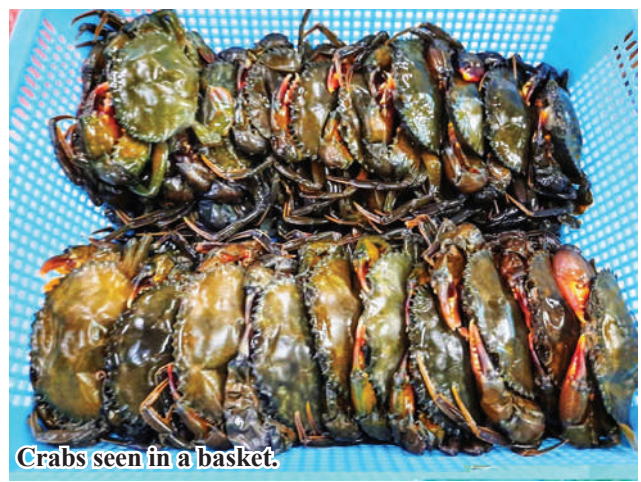
Crabs seen in a basket.

"We are selling aquatic products, including crabs, from Bogale Township to the Yangon market. Currently, in August, the fishery products shipped from this side are being bought from the Yangon market. The reason why the business is good is because of a domestic and foreign market. With the good purchase, the entrepreneurs are doing more business," she said. Fishery products including crabs from Bogale Township are being transported to the Yangon market, and the price of crabs is