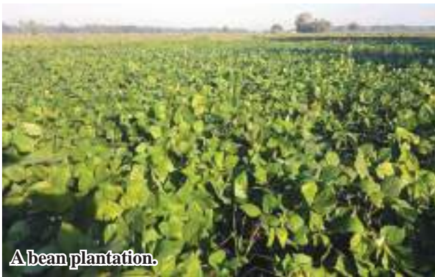
A bean plantation.