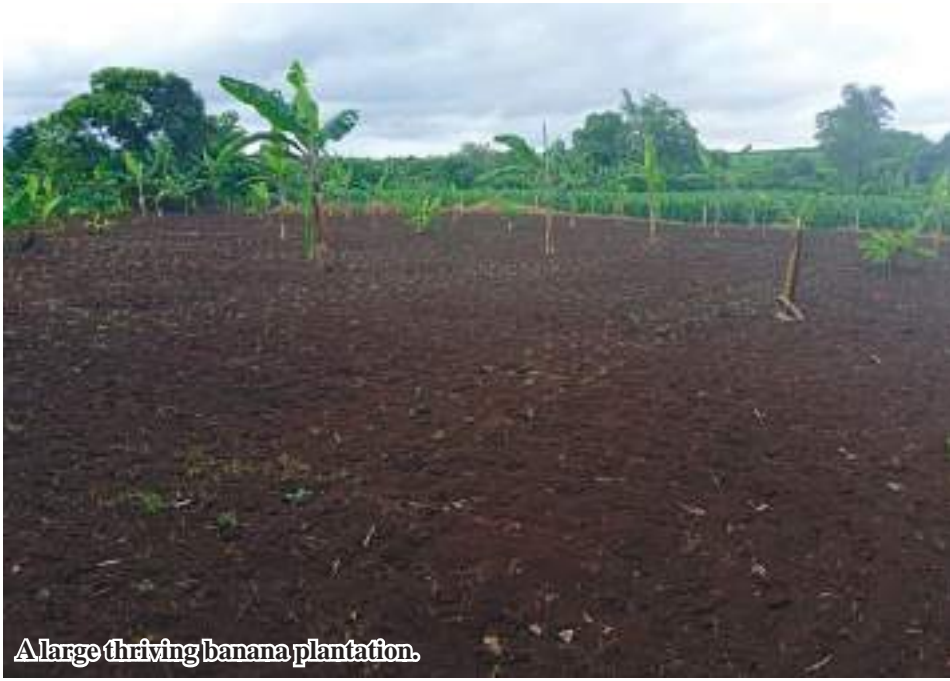
A large thriving banana plantation.

farmers plant banana on the dykes of farmlands where spraying at the farmlands can affect banana plants.”