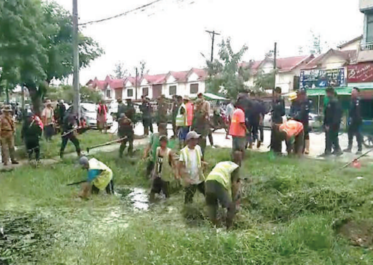
ရန်ကုန်တိုင်းစစ်ဌာနချုပ်မှ နယ်မြေခံတပ်မတော်သားများ၊ ဌာနဆိုင်ရာဝန်ထမ်းများက အခြေခံပညာကျောင်း၌ စုပေါင်းသန့်ရှင်းရေးဆောင်ရွက်ကြစဉ်။