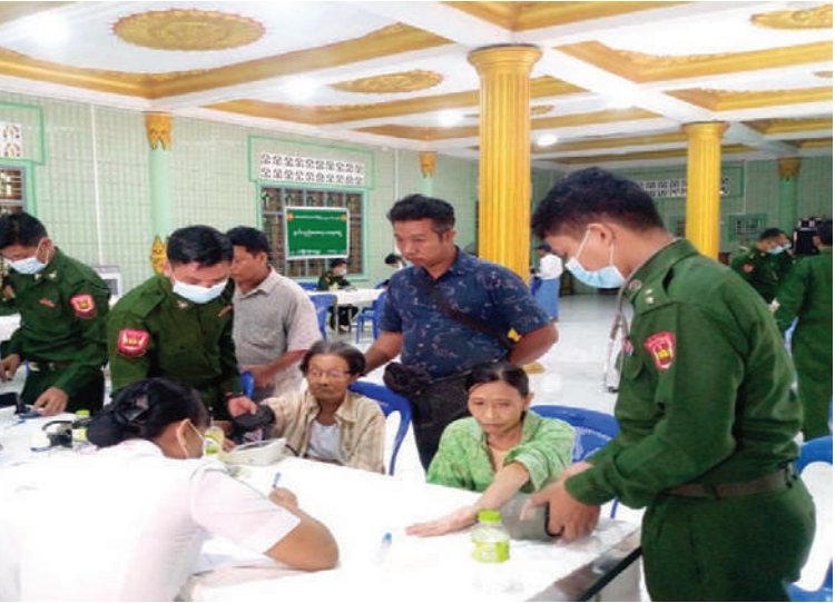
ရန်ကုန်တိုင်းစစ်ဌာနချုပ် နယ်လှည့်ဆေးကုသရေးအဖွဲ့က ဒေသခံပြည်သူများကို ကျန်းမာရေးစောင့်ရှောက်မှုလုပ်ငန်းများ ဆောင်ရွက်ပေးစဉ်။ (၅၀၁)

ရောဂါ၊ အထွေထွေရောဂါတို့နှင့်ပတ်သက်၍ လိုအပ်သည့် ကျန်းမာရေးစစ်ဆေးကုသပေးခြင်းများဆောင်ရွက်ပေးပြီး ကျန်းမာရေးဆိုင်ရာ အသိပညာပေးခြင်းများဟောပြောဆွေးနွေးကာ ဆေးရုံတက်ရောက်ကုသရန် လိုအပ်သည့် သံဃာတော်များအား နယ်မြေခံတပ်မတော်ဆေးရုံသို့ တက်ရောက်ကုသနိုင်ရေး စီစဉ်ဆောင်ရွက်ပေးသည်။ ယင်းသို့ ဆောင်ရွက်ပေးနေမှုများကို သက်ဆိုင်ရာ တပ်နယ်များမှတာဝန်ရှိသူများက သွားရောက်ကြည့်ရှုအားပေးပြီး လိုအပ်သည်များ ညှိနှိုင်းဖြည့်ဆည်းဆောင်ရွက်ပေးကာ သံဃာတော်များအား လှူဖွယ်ဝတ္ထုပစ္စည်းများ ဆက်ကပ်လှူဒါန်းခဲ့ကြောင်း သတင်းရရှိသည်။