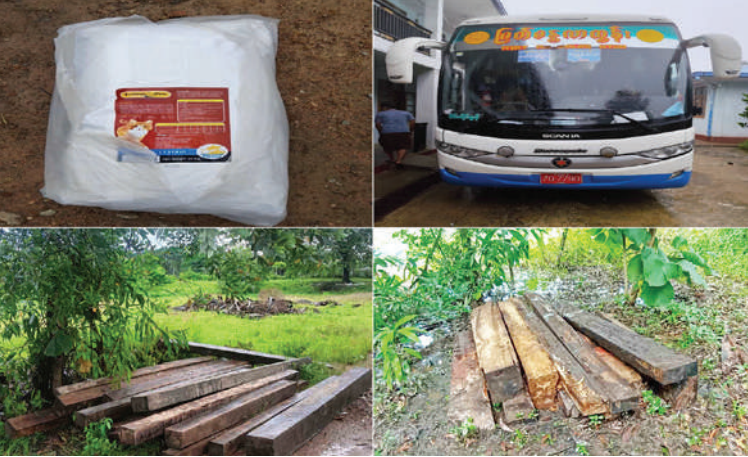
ပဲခူးတိုင်းဒေသကြီး၌ ဖမ်းဆီးရမိမှု။

နေပြည်တော် ဩဂုတ် ၁၇ ရက်တွင် အကောက်ခွန်ဦးစီးဌာန၏ စီမံခန့်ခွဲမှုဖြင့် တာဝန်ကျပူးပေါင်းအဖွဲ့များက စစ်ဆေးမှုများ ဆောင်ရွက်ရာတွင် မရမ်းချောင့် အမြဲတမ်းစစ်ဆေးရေးစခန်း၌ မော်လမြိုင်မြို့မှ ရန်ကုန်မြို့သို့ မောင်းနှင်လာသော စာမျက်နှာ ၂၂ ကော်လံ ၁ ✨