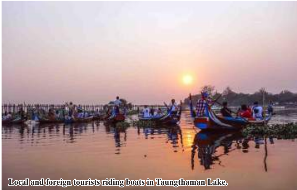
Local and foreign tourists riding boats in Taungthaman Lake.

“Travellers at home and abroad visit Taungthaman Lake and Bridge. At present, they take relaxation by riding boat in the lake. As now is time of rising water level in the Ayeyawady River, water level in the lake is also high,” he explained.