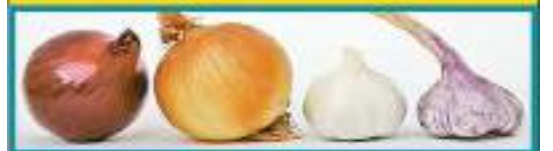
ကြက်သွန်ဖြူနှင့် ကြက်သွန်နီစားသုံးပေးခြင်းဖြင့် နှလုံးနှင့်အဆုတ် အတွက် အထူးကောင်းမွန်သည်။