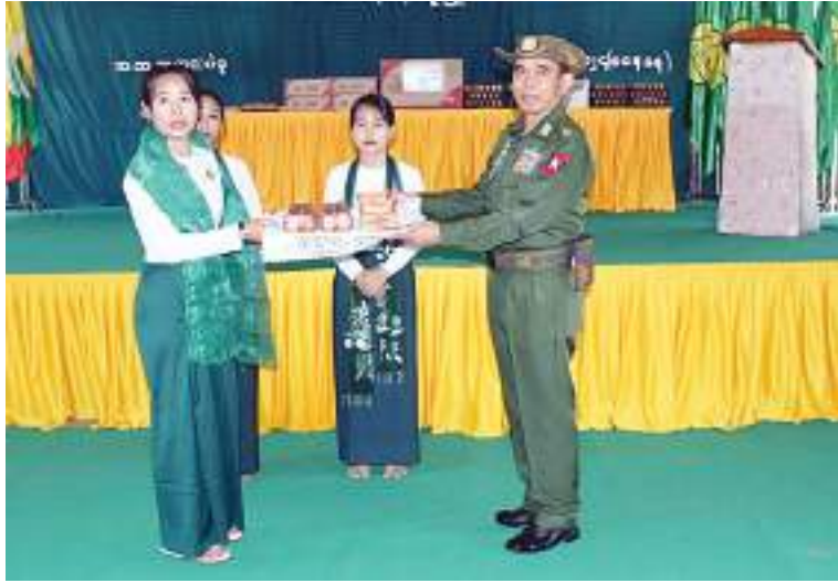
ကာကွယ်ရေးဦးစီးချုပ်ရုံး(ကြည်း)မှ ဒုတိယဗိုလ်ချုပ်ကြီးဖုန်းမြတ် ဆရာ၊ ဆရာမများအား စားသောက်ဖွယ်ရာများ ထောက်ပံ့ပေးအပ်စဉ်။

နေပြည်တော် ဩဂုတ် ၁၁ ပဲခူးတိုင်းဒေသကြီး ပဲခူးမြို့နယ် အတွင်း မိုးသည်းထန်စွာရွာသွန်းခဲ့မှုကြောင့် ရေဘေးအန္တရာယ်ရှိသည့် နေရာများမှ ပဲခူးမြို့ရှိ ပုညကောရီဆုတောင်းပြည့်စာသင်တိုက်သို့ ယာယီရွှေ့ပြောင်းနေထိုင်နေသည့် ရေဘေးသင့်ပြည်သူများကို ဩဂုတ် ၁၀ ရက် နံနက်ပိုင်းတွင် ကာကွယ်ရေးဦးစီးချုပ်ရုံး (ကြည်း)မှ ဒုတိယဗိုလ်ချုပ်ကြီးဖုန်းမြတ်၊ တောင်ပိုင်းတိုင်းစစ်ဌာနချုပ် တိုင်းမှူး ဗိုလ်ချုပ်ကြည်သိုက်နှင့် တာဝန်ရှိသူများက သွားရောက်ကြည့်ရှု အားပေးစကားပြောကြားပြီး ရေဘေးသင့်ပြည်သူများအတွက် စားသောက်ဖွယ်ရာများ ထောက်ပံ့ပေးအပ်သည်။ ထို့နောက် ကာကွယ်ရေးဦးစီးချုပ်ရုံး (ကြည်း)မှ ဒုတိယဗိုလ်ချုပ်ကြီးဖုန်းမြတ်၊ တိုင်းမှူးနှင့် တာဝန်ရှိသူများက ရေကြီးရေလျှံမှုများဖြစ်ပေါ်ခဲ့သည့် အမှတ်(၁၀)