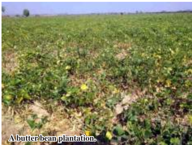
A butter bean plantation.