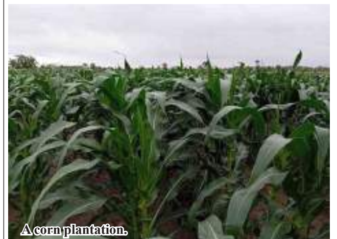
A corn plantation.

U Thein Khaing, Head of Township Agriculture Department said: “Local farmers have grown 950 acres of corns exceeding the target of 500 acres. Our department disseminates agricultural techniques to local farmers to boost production.” The township yields more than 50 baskets of maize per acre, costing K500,000 per acre whereas local farmers produce 15,000 pieces of corns per acre, spending more than K500,000 per acre. 206