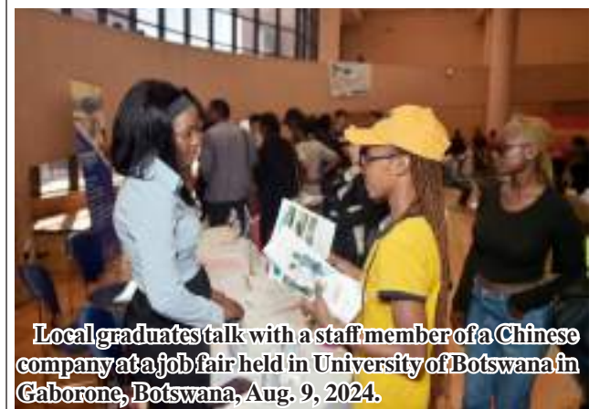
Local graduates talk with a staff member of a Chinese company at a job fair held in University of Botswana in Gaborone, Botswana, Aug. 9, 2024.