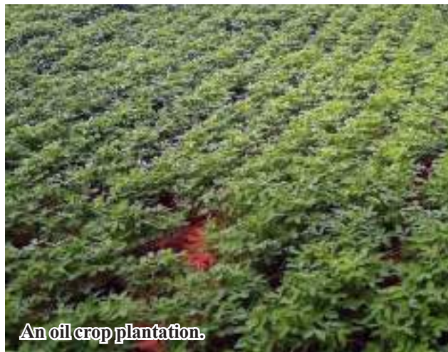
An oil crop plantation.

providing knowledge to oil crop farmers in Kyunhla Township on how to expand acreage, how to grow using GAP methods, how to grow good varieties, and how to grow varieties with good yields. 206