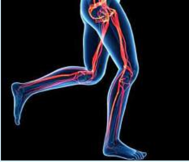
မိမိတို့ရဲ့ ခန္ဓာကိုယ်မှာ ကြွက်သားတွေကလည်း ပိုမို အဆီပိုတွေ မရှိတော့ဘူးဆိုရင် ပေါ့လွင်လာပြီး သန်မာလာမှာ

ဖြစ်ပါတယ်။ ဒီလို ဖြစ်ချင်တယ်ဆိုရင် တော့ တစ်ရက်ကို ခြေလှမ်းရေ ၁၀၀၀ လောက် လမ်းလျှောက် ပေးရုံနဲ့တင် ရရှိနိုင်ပါတယ်။ ဒီထက်ပိုပြီး ပြင်းထန်တဲ့ လေ့ကျင့်ခန်းမျိုးလိုချင်တယ်ဆိုရင်တော့ တောင်တက်လမ်း လျှောက်ခြင်းကိုလည်း ကြိုးစား ကြည့်သင့်ပါတယ်။ ဒါ့အပြင် စက္ကန့် ၃၀မှ ၁ မိနစ်၊ ၂ မိနစ်အထိ ခပ်မြန်မြန်လမ်း လျှောက်ပြီး ပုံမှန်လမ်းပြန် လျှောက်ခြင်း၊ အဲဒီနောက် ခပ် မြန်မြန်ပြန်ပြီး လမ်းလျှောက်ခြင်း လိုမျိုးလေ့ကျင့်ခန်းတွေကလည်း ထိရောက်မှုရှိလှပါတယ်။ လမ်းလျှောက်ခြင်းဟာ သင့် ခန္ဓာကိုယ်တစ်လျှောက်မှာရှိတဲ့ ကြွက်သားတွေရဲ့ တင်းအားကို တိုးမြှင့်စေတာသာဖြစ်ပါတယ်။ လမ်းလျှောက်ခြင်းဟာ ပြင်း ထန်တဲ့ လေ့ကျင့်ခန်းမဟုတ်တဲ့ အတွက် ကြွက်သားတွေနာကျင် ခြင်းမရှိစေပါဘူး။ ဒါ့ကြောင့် အနာတရဖြစ်တာမျိုး၊ နောက် တစ်ခေါက် လမ်းလျှောက်ဖို့ အတွက် ကြွက်သားတွေနာလို့ မလျှောက်နိုင်တာမျိုးလည်း မဖြစ် စေပါဘူး။