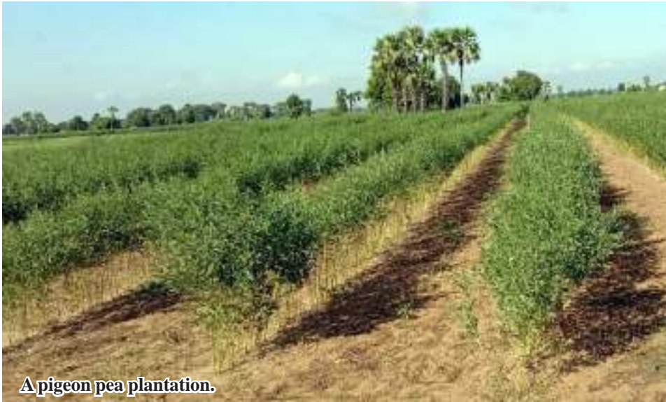
A pigeon pea plantation.

Kawlin August 11 Statistics of Kawlin District Agriculture Department of Sagaing Region stated that local farmers planted 420 acres of pigeon pea this monsoon. The district earmarked