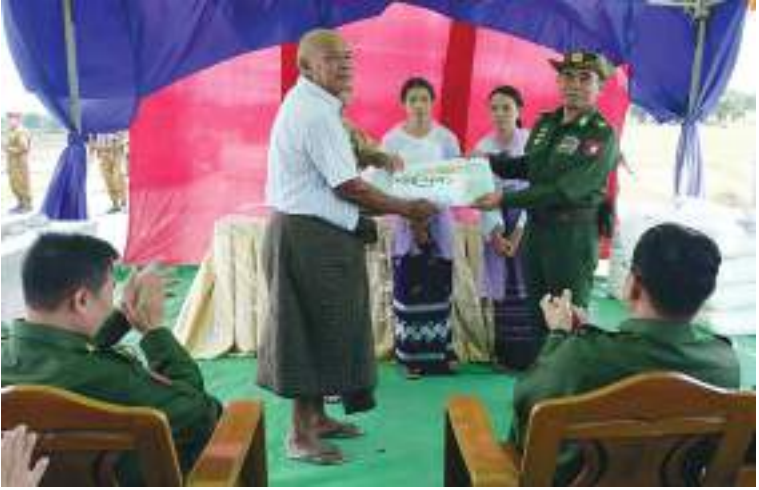
ကာကွယ်ရေးဦးစီးချုပ်ရုံး(ကြည်း)မှ ဒုတိယဗိုလ်ချုပ်ကြီးဖုန်းမြတ် မိုးစပါးရေကြီးနစ်မြုပ်တောင်သူများအား သွင်းအားစုဓာတ်မြေဩဇာများ ထောက်ပံ့ပေးအပ်စဉ်။

၎င်းနောက်ကာကွယ်ရေးဦးစီးချုပ်ရုံး (ကြည်း)မှ ဒုတိယဗိုလ်ချုပ်ကြီးဖုန်းမြတ်နှင့် တိုင်းမှူးတို့က မိုးစပါးရေကြီးနစ်မြုပ်တောင်သူများအား သွင်းအားစုဓာတ်မြေဩဇာများ အသီးသီးထောက်ပံ့ပေးအပ်ပြီး မိုးစပါးပြန်လည်စိုက်ပျိုးမှုများကို ကြည့်ရှုအားပေးခဲ့ကြကြောင်း သတင်းရရှိသည်။ (၅၀၁)