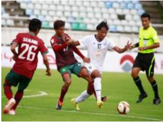
မိနစ်တွင် မျိုးဆက်ပိုင်က အနိုင်ဂိုး သွင်းယူနိုင်ခဲ့သည့်အတွက် ပွဲပြီးဆုံးချိန်တွင် ဒဂုံပေါ့အသင်းက မြဝတီအက်ဖ်စီအသင်းကို နှစ်ဂိုး တစ်ဂိုးဖြင့် အနိုင်ရရှိခဲ့ကာ အဆိုပါ

ကစားသမားများ အဆုံးသတ်ပိုင်း အားနည်းမှုများကြောင့် ဂိုးသွင်း ယူနိုင်ခြင်းမရှိခဲ့ဘဲ ပထမပိုင်းတွင် ဂိုးမရှိ သရေရလဒ်ဖြင့် ပြီးဆုံးခဲ့သည်။ ထို့နောက် ဒုတိယပိုင်း ပြန်လည် စတင်ချိန်တွင် လိုအပ်နေသည့် ဦးဆောင်ဂိုးများအတွက် နှစ်သင်းစလုံး တိုက်စစ်မြှင့်ကစားခဲ့ရာ ပွဲချိန် ၅၂ မိနစ်တွင် ရဲမိုးယံက မြဝတီအက်ဖ်စီအသင်းအတွက် ဦးဆောင်ဂိုးသွင်းယူနိုင်ခဲ့သည်။ ဦးဆောင်ဂိုးခွင့်ပြုပေးခဲ့ရပြီးနောက် ဒဂုံပေါ့အသင်းက ပြန်လည်တိုက်စစ်ဆင် ဖိအားပေးကစားခဲ့ရာ ပွဲချိန် ၇၉ မိနစ်တွင် Mogyu က ဒဂုံပေါ့အသင်းအတွက် ချေပဂိုးသွင်းယူနိုင်ခဲ့ပြီး ပွဲချိန် ၉၄