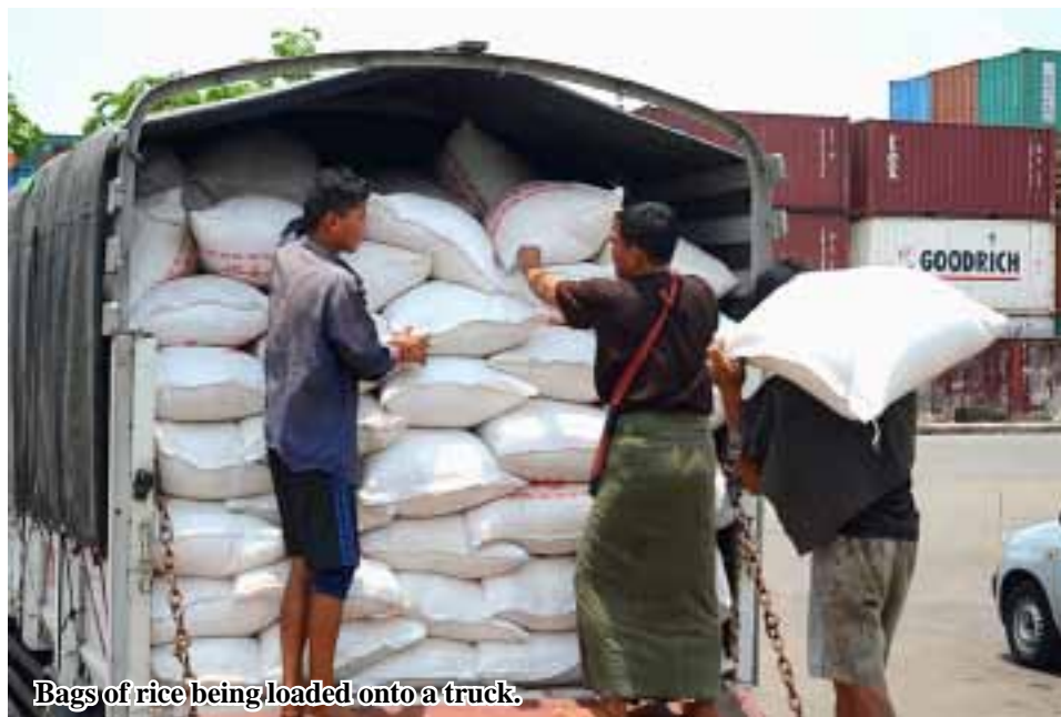
Bags of rice being loaded onto a truck.