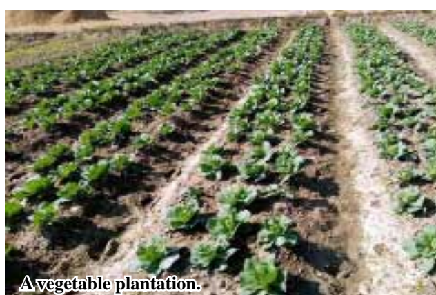
A vegetable plantation.

Kawlin August 9 mustard, chilli, spicy, potato, cabbage, eggplant, Chinese cabbage and cauliflower. According to the statistics of Kawlin District Agriculture Department, a total of 2,046 acres of vegetables have been planted in the district of Sagaing Region this monsoon. The district earmarked 2,675 acres of vegetables this monsoon. Starting from May this year, Kawlin Township has grown 474 acres of vegetables, Wuntho Township 1,385 acres and Pinlebu Township 471 acres, totalling 2,675 acres. This year, relevant township agriculture department conducted training courses for local farmers and agricultural staff to have improved capacity, agricultural techniques, and production of healthy and fresh vegetables for consumers. 206