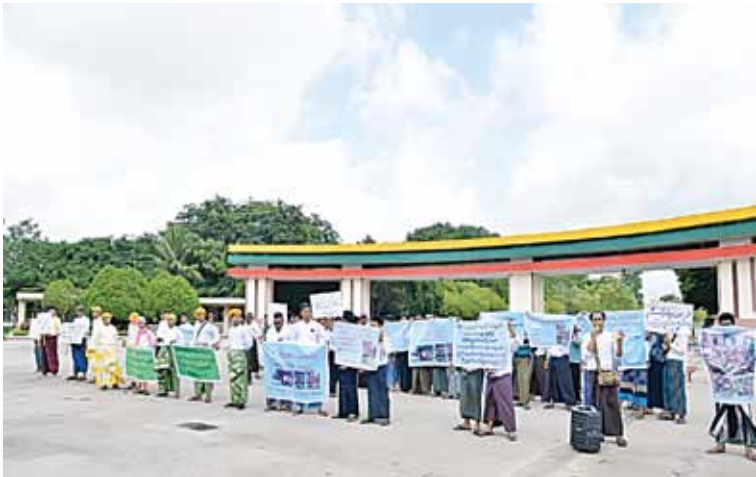
နေပြည်တော်ကောင်စီနယ်မြေ ဧပျူသီရိမြို့နယ် သပြေကုန်းရပ်ကွက် မြို့တော် ခန်းမရှေ့တွင် MNDAA အကြမ်းဖက်သောင်းကျန်းသူအဖွဲ့၏ အကြမ်းဖက်လုပ်ရပ် များအား ကန့်ကွက်ရှုတ်ချ ဆန္ဒထုတ်ဖော်ပွဲပြုလုပ်စဉ်။

နေပြည်တော် ဩဂုတ် ၉ ရှမ်းပြည်နယ်(မြောက်ပိုင်း)ရှိ အပြစ်မဲ့ အရပ်သားပြည်သူများအပေါ် MNDAA အကြမ်းဖက် သောင်းကျန်းသူများ၏ အကြမ်းဖက်လုပ်ရပ်များအား ကန့်ကွက် ရှုတ်ချဆန္ဒထုတ်ဖော်ပွဲကို ယနေ့နံနက် ပိုင်းတွင် နေပြည်တော်ကောင်စီနယ်မြေ ဧပျူသီရိမြို့နယ် သပြေကုန်းရပ်ကွက် မြို့တော်ခန်းမရှေ့တွင် မြန်မာနိုင်ငံဟာသ ပညာရှင်များ အစည်းအရုံး(ဗဟို)က ဦးဆောင်၍ပြုလုပ်သည်။