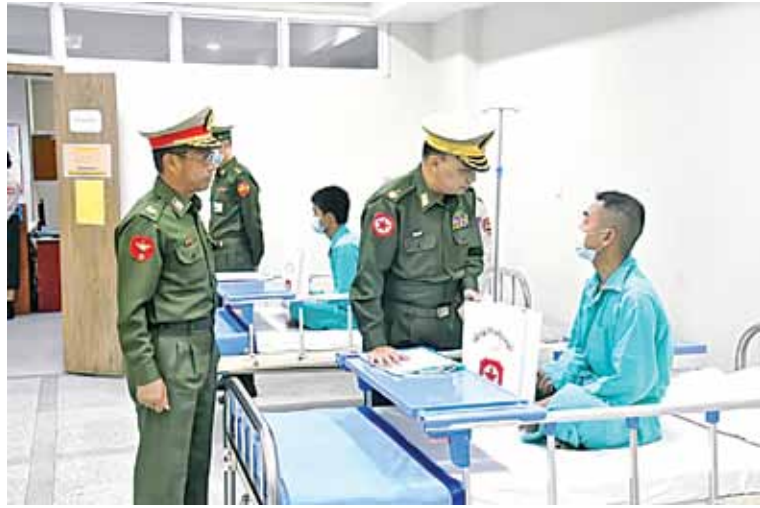
ရန်ကုန်တိုင်းစစ်ဌာနချုပ် တိုင်းမှူး ဗိုလ်ချုပ်ဇော်ဟိန်း ဆေးကုသမှုခံယူနေသူတစ်ဦးကို ရင်းရင်းနှီးနှီး မေးမြန်းအားပေးစကားပြောကြားစဉ်။

နေပြည်တော် ဩဂုတ် ၉ - တနင်္သာရီတိုင်းဒေသကြီး ထားဝယ်မြို့ရှိ တပ်မတော်ဆေးရုံ၌ တက်ရောက်ဆေးကုသမှုခံယူလျက်ရှိသော အရာရှိ၊ စစ်သည်၊ မိသားစုများနှင့် ဒေသခံပြည်သူများကို ယနေ့မွန်းလွဲပိုင်းတွင် ကမ်းရိုးတန်းဒေသတိုင်းစစ်ဌာနချုပ် တိုင်းမှူး