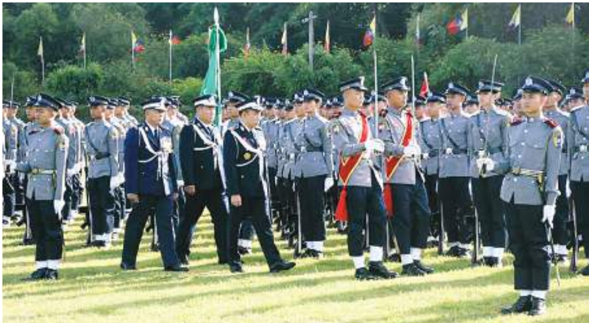
ပြည်ထဲရေးဝန်ကြီးဌာန မြန်မာနိုင်ငံရဲတပ်ဖွဲ့ ရဲချုပ် ဒုတိယရဲဗိုလ်ချုပ်ကြီးဝင်းဇော်မိုး သင်တန်းဆင်းတပ်ခွဲကို စစ်ဆေးစဉ်။

ရဲမှူးချုပ်ဝင်းထွန်းနှင့် ရဲအရာရှိကြီးများ၊ ဖိတ်ကြားထားသူများ တက်ရောက်ခဲ့ကြပြီး အဆိုပါ ဒုတိယရဲအုပ်လောင်းသင်တန်း အမှတ်စဉ်(၁၁၇)ရဲဗလတပ်ခွဲတွင် တပ်တွင်း ဘွဲ့ရအမျိုးသား ၂၁၇ ဦး၊ တပ်တွင်းဘွဲ့ရ အမျိုးသမီး ၁၂၉ ဦး စုစုပေါင်း ၃၄၆ ဦးတို့ကို သင်တန်းဆင်းပေးခဲ့ကြောင်း သတင်းရရှိ သည်။ (၅၀၁)