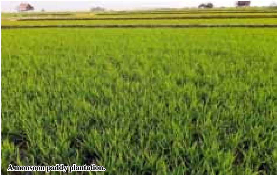
A monsoon paddy plantation.