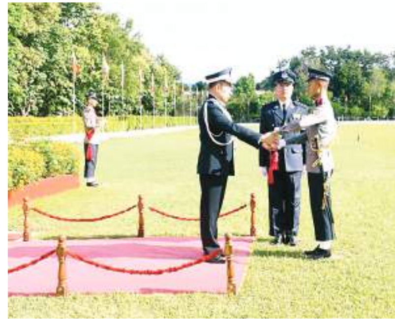
ပြည်ထဲရေးဝန်ကြီးဌာန မြန်မာနိုင်ငံရဲတပ်ဖွဲ့ ရဲချုပ် ဒုတိယရဲဗိုလ်ချုပ်ကြီးဝင်းဇော်မိုး ထူးချွန်ဆုရရှိသူတစ်ဦးကို ဆုပေးအပ်ချီးမြှင့်စဉ်။

အိမ်ပြင်ပ၌ထွန်းသော မီးများကို နေ့အလင်းရောင်ရှိချိန်တွင် ပိတ်ထားခြင်းဖြင့် လျှပ်စစ်ကို ချွေတာပါ။