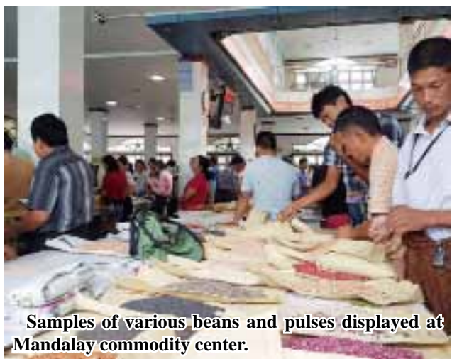
Samples of various beans and pulses displayed at Mandalay commodity center.

On 29 July, black sesame got K525,000 per bag, white sesame K395,000 per bag, brown sesame 350,000 and 184