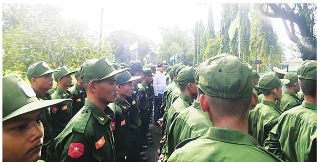
ရန်ကုန်တိုင်းစစ်ဌာနချုပ် ပြည်သူ့စစ်မှုထမ်းသင်တန်းအမှတ်စဉ်(၄)မှ သင်တန်းသားများအား တာဝန်ရှိသူများက ရင်းရင်းနှီးနှီးလိုက်လံနှုတ်ဆက်စဉ်။