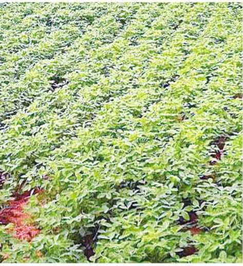
နိုင်ရေး၊ GAP နည်းစနစ်များဖြင့် စိုက်ပျိုး များစိုက်ပျိုးနိုင်ရေးတို့အတွက် အသိပညာ နိုင်ရေး၊ မျိုးကောင်းမျိုးသန့်များစိုက်ပျိုး ပေးဆောင်ရွက်လျက်ရှိကြောင်း သိရသည်။ နိုင်ရေး၊ အထွက်နှုန်းကောင်းမွန်သည့်မျိုး (၂၀၆)

၇၂၄၃ ဧက၊ နှမ်း ၁၁ ဧက၊ နေကြာ ၄၈ ဧက စုစုပေါင်း ၇၃၀၂ ဧကတို့ဖြစ်ကြောင်း သိရသည်။ ယခုနှစ် မိုးသီးနှံစိုက်ပျိုးရာသီ၌ ကျွန်းလှမြို့နယ်တွင် ဆီထွက်သီးနှံစုံစိုက်ပျိုး ရန်အတွက် သီးနှံအလိုက် လျာထားမှု အနေဖြင့် မြေပဲ ၇၂၂၃ ဧက၊ နှမ်း ဧက ၂၀ နှင့် နေကြာ ၇၁ ဧက စုစုပေါင်း ၇၃၀၄ ဧကတို့ဖြစ်ကြောင်း သိရသည်။ ယခုနှစ် ကျွန်းလှမြို့နယ်တွင် ဆီထွက် သီးနှံစိုက်ပျိုးတောင်သူများကို မြို့နယ်စိုက် ပျိုးရေးဦးစီးဌာနမှ စိုက်ကတိုးချဲ့စိုက်ပျိုး