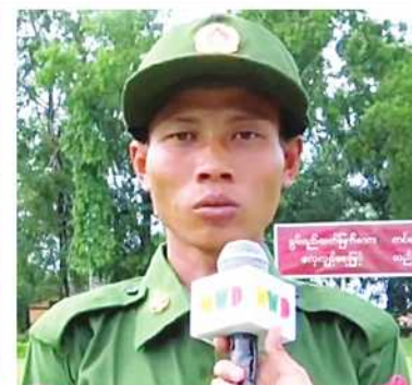
အတွက်ကို တာဝန်တွေ ထမ်းဆောင်စေချင်ပါတယ်။”ဟု ပြောသည်။ (၅၀၁)