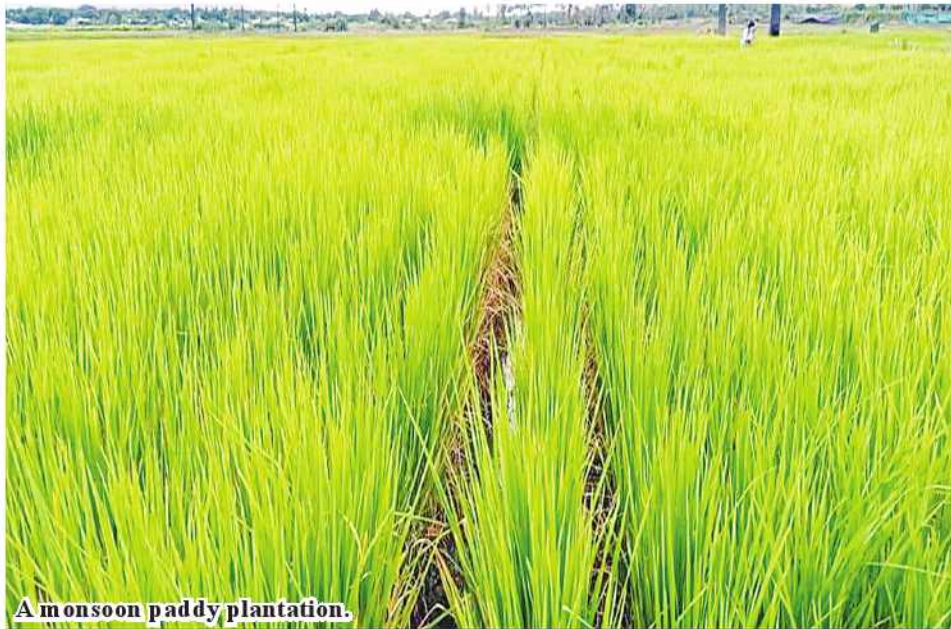
A monsoon paddy plantation.

Myinmu August 5 of Agriculture for Sagaing District. A total of 398 acres of rain-fed rice have been planted in Myinmu Township, Sagaing District, Sagaing Region, according to statistics from Department of Agriculture for Sagaing District. During the 2024-2025 rain crops planting season, 12,133 acres of rain-rice are planned to be planted in Myinmu Township, and 398 acres have been planted since June of this year. "We will provide the necessary technology and types to irrigate the rain-fed rice target. We are conducting fieldwork