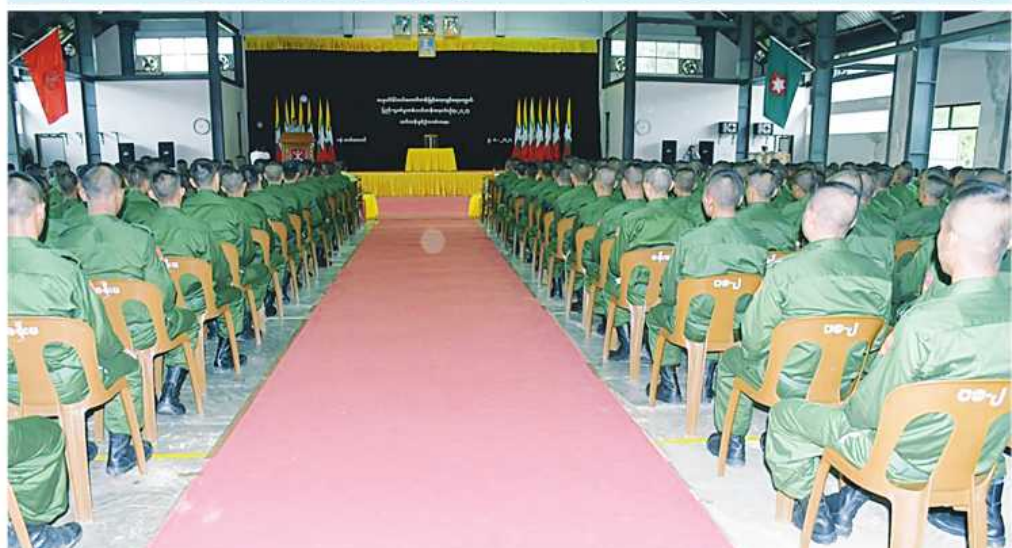
တောင်ပိုင်းတိုင်းစစ်ဌာနချုပ်၌ ပြည်သူ့စစ်မှုထမ်းသင်တန်းအမှတ်စဉ်(၄) သင်တန်းဖွင့်ပွဲ ကျင်းပစဉ်။