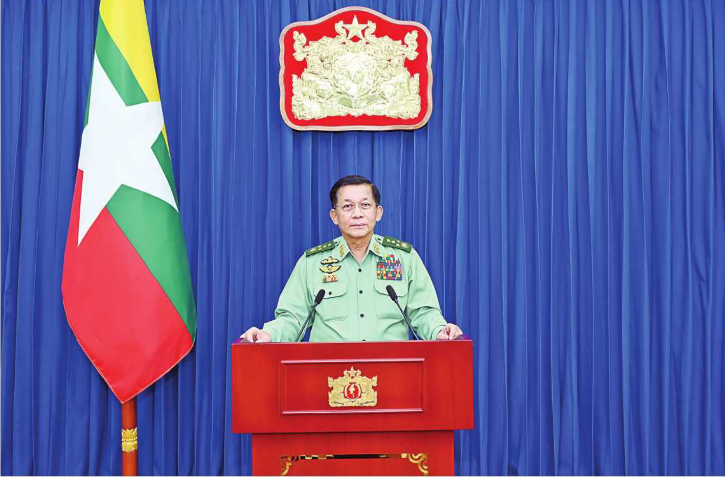
နိုင်ငံတော်စီမံအုပ်ချုပ်ရေးကောင်စီဥက္ကဋ္ဌ တပ်မတော်ကာကွယ်ရေးဦးစီးချုပ် ဗိုလ်ချုပ်မှူးကြီးမင်းအောင်လှိုင် နိုင်ငံတော်၏လုံခြုံရေးဆိုင်ရာအခြေအနေများနှင့်ပတ်သက်၍ ပြောကြားစဉ်။

ချစ်ခင်လေးစားရပါတဲ့ မိဘပြည်သူများခင်ဗျာ-ယခုကာလများအတွင်း နိုင်ငံတော်မှာဖြစ်ပေါ်ခဲ့တဲ့အခြေအနေများကို ဆက်စပ်တင်ပြလိုပါတယ်။ အချို့အခြေအနေများကို အမျိုးသားကာကွယ်ရေးနှင့်လုံခြုံရေးကောင်စီအစည်းအဝေးမှာ ကျွန်တော်တင်ပြခဲ့ပြီးလည်းဖြစ်ပါတယ်။ ၂၀၂၀ ပြည့်နှစ် ရွေးကောက်ပွဲမှာ NLD ပါတီရဲ့ မဲမသမာမှု ၁၁ သန်းကျော်ပြုလုပ်ခဲ့မှုတွေကြောင့် နိုင်ငံတော်မှာမတည်မငြိမ်မှုတွေဖြစ်ပေါ်လာခဲ့ပါတယ်။ ဒါ့ကြောင့်နိုင်ငံတော်ရဲ့ ယာယီသမ္မတကနေ အမျိုးသားကာကွယ်ရေးနှင့်လုံခြုံရေးကောင်စီအစည်းအဝေးခေါ်ယူပြီး တပ်မတော်ကို ဖွဲ့စည်းပုံအခြေခံဥပဒေနှင့်အညီ နိုင်ငံတော်ရဲ့တာဝန်ကို ထိန်းသိမ်းစေခဲ့ပါတယ်။ တပ်မတော်အနေနဲ့ စစ်ဘက်၊ အရပ်ဘက်ပူးပေါင်းပြီး နိုင်ငံတော်စီမံအုပ်ချုပ်ရေးကောင်စီကို ဖွဲ့စည်းကာ တာဝန်ထမ်းဆောင်ခဲ့ပါတယ်။ နိုင်ငံတော်ရဲ့တာဝန် စတင်ထမ်းဆောင်ချိန်ကတည်းက ရွေးကောက်ပွဲတစ်ရပ် ပြန်လည်ကျင်းပပေးရေးသည် အန္တိမရည်မှန်းချက်ဖြစ်တယ်လို့ တိုင်းသိပြည်သိကြေညာခဲ့ပါတယ်။ ဒီလိုနိုင်ငံရေးအပြောင်းအလဲဖြစ်ပြီးချိန်မှာ သာမန်ဆန္ဒပြုရာကနေ တဖြည်းဖြည်းမင်းမဲ့စရိုက်ဆန်တဲ့ စာမျက်နှာ ၁၆ ကော်လံ ၁ ပု