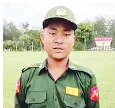
ပေးမှာဖြစ်ပါတယ်။ နောင်ဝင်မယ့်အငယ်တွေလည်း ဘာမှမကြောက်ပါနဲ့ အကုန်လုံး

ပါတယ်။ ဝမ်းလည်းဝမ်းသာပါတယ်။ ကိုယ့်ကိုယ်ကိုယ် ဂုဏ်ယူပီပါတယ်။ ကျွန်တော်ကတော့ ဒီသင်တန်းဆင်းပြီး သွားလို့ ကျရာနေရာမှာ ကြိုက်တဲ့တာဝန်ကိုပေးပါ။ ကျွန်တော်တို့ဘက်က အတတ်နိုင်ဆုံး ကျွန်တော်တို့မှာရှိတဲ့ ခွန်အားတွေနဲ့ နိုင်ငံအတွက် သယ်ပိုးဆောင်ရွက်သွားမယ်ပေါ့။ ကျွန်တော်တို့ တပ်မတော်ဆိုတာ မရှိလို့လည်း မဖြစ်ဘူး။ ရှိရမယ်။ ကိုယ့်နိုင်ငံအတွက် တပ်မှမရှိရင်လည်း ဘယ်သူမှ ကာကွယ်မှာမဟုတ်ဘူး။ တပ်ကတစ်ကားပေးမှာဖြစ်ပါတယ်။ နောင်ဝင်မယ့်အငယ်တွေလည်း ဘာမှမကြောက်ပါနဲ့ အကုန်လုံး