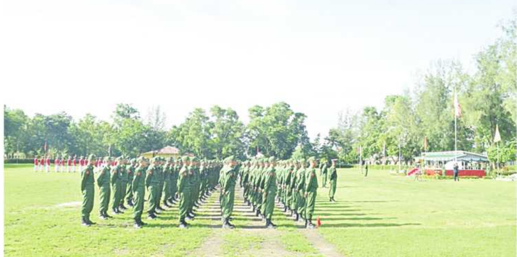
အနောက်တောင်တိုင်းစစ်ဌာနချုပ်၌ ပြည်သူ့စစ်မှုထမ်းသင်တန်းအမှတ်စဉ်(၄) သင်တန်းဖွင့်ပွဲ ကျင်းပစဉ်။