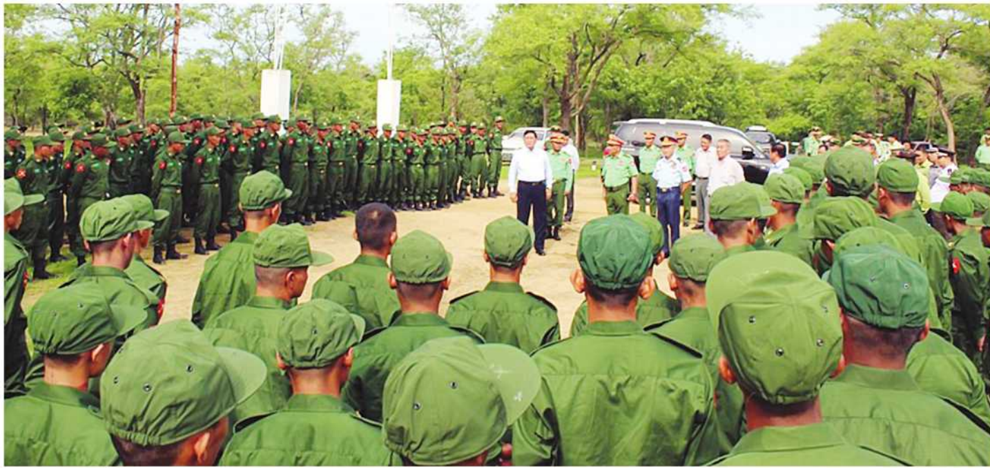
မကွေးတိုင်းဒေသကြီးဝန်ကြီးချုပ် ဦးတင့်လွင်နှင့် တာဝန်ရှိသူများက ပြည်သူ့စစ်မှုထမ်းသင်တန်းအမှတ်စဉ်(၄)မှ သင်တန်းသားများကို ရင်းရင်းနှီးနှီး လိုက်လံနှုတ်ဆက်စဉ်။

နေပြည်တော်၊ ဩဂုတ် ၅ - နိုင်ငံတော်ကာကွယ်ရေးနှင့် လုံခြုံရေးတာဝန်ထမ်းဆောင်နိုင်ရန်အတွက် ပြည်သူ့စစ်မှုထမ်းသင်တန်းအမှတ်စဉ်(၄)တွင် ပါဝင်တက်ရောက်ကြမည့်အရည်အချင်းကိုကန့်သတ်နိုင်သည့်အားဖြင့် သက်ဆိုင်ရာတိုင်းစစ်ဌာနချုပ်နယ်မြေများရှိ