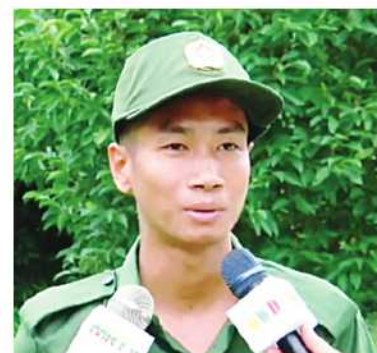
ကျွန်တော်တို့လိုပဲ ညီအစ်ကိုတွေ သိုက်သိုက် ဝန်းဝန်းနဲ့ လာရောက်ပြီးတော့ ဒီနိုင်ငံ