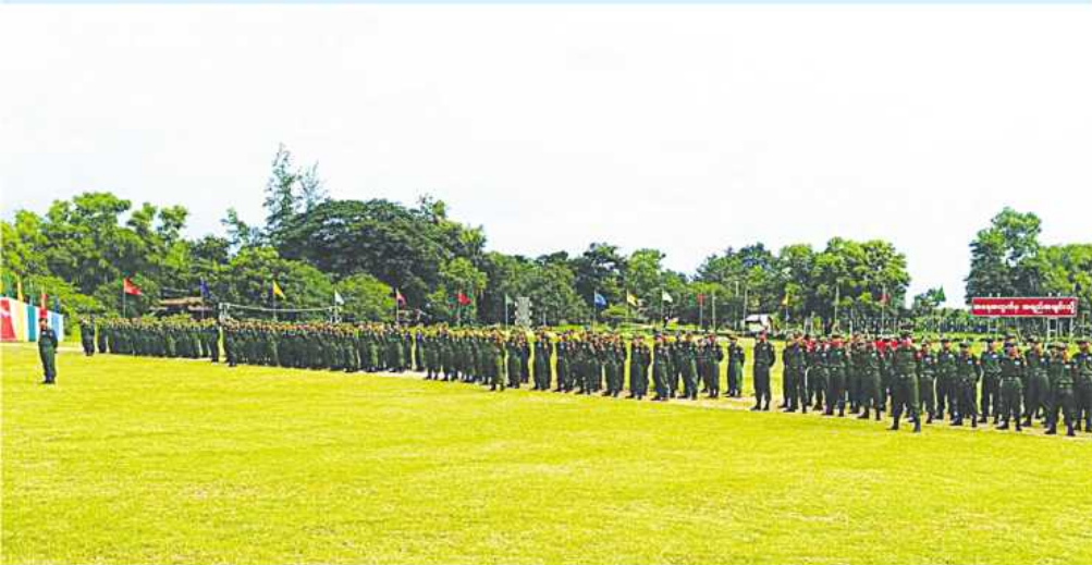
အလယ်ပိုင်းတိုင်းစစ်ဌာနချုပ်၌ ပြည်သူ့စစ်မှုထမ်းသင်တန်းအမှတ်စဉ်(၄) သင်တန်းဖွင့်ပွဲ ကျင်းပစဉ်။

★ ကျော့မှူးမှအဆက် သင်တန်းသားများကို တွေ့ဆုံကာ သင်တန်းသားများအတွက် ဂုဏ်ပြုချီးမြှင့် ငွေများနှင့် ထောက်ပံ့ပစ္စည်းများ ပေးအပ် ကြပြီး သင်တန်းသားများကို ရင်းရင်းနှီးနှီး လိုက်လံနှုတ်ဆက်အားပေးကြသည်။ ပြည်ထောင်စုမပြိုကွဲရေး၊ တိုင်းရင်းသား စည်းလုံးညီညွတ်မှုမပြိုကွဲရေးနှင့် အချုပ် အခြာအာဏာတည်တံ့ခိုင်မြဲရေး ဟူသည့်