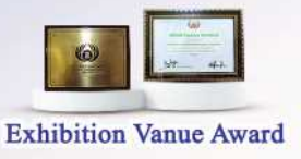
Exhibition Vanue Award

ရန်ပုံငွေအဖွဲ့အစည်း(၁၂၀၀)(တစ်ပွဲပိုင်းဖြန့်ဖြူး) ဖြစ်ပြီး အခမ်းအနားများနှင့်ဖျော်ဖြေရေးပွဲများအတွက် လှူဒါန်း(၆၆၀၀+၂၀၀)ထိဆောင်ရွက်နိုင်ပါသည်။