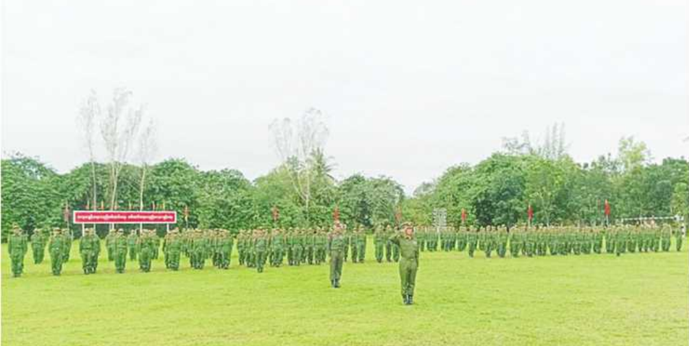
အရှေ့တောင်တိုင်းစစ်ဌာနချုပ်၌ ပြည်သူ့စစ်မှုထမ်းသင်တန်းအမှတ်စဉ်(၄) သင်တန်းဖွင့်ပွဲ ကျင်းပစဉ်။