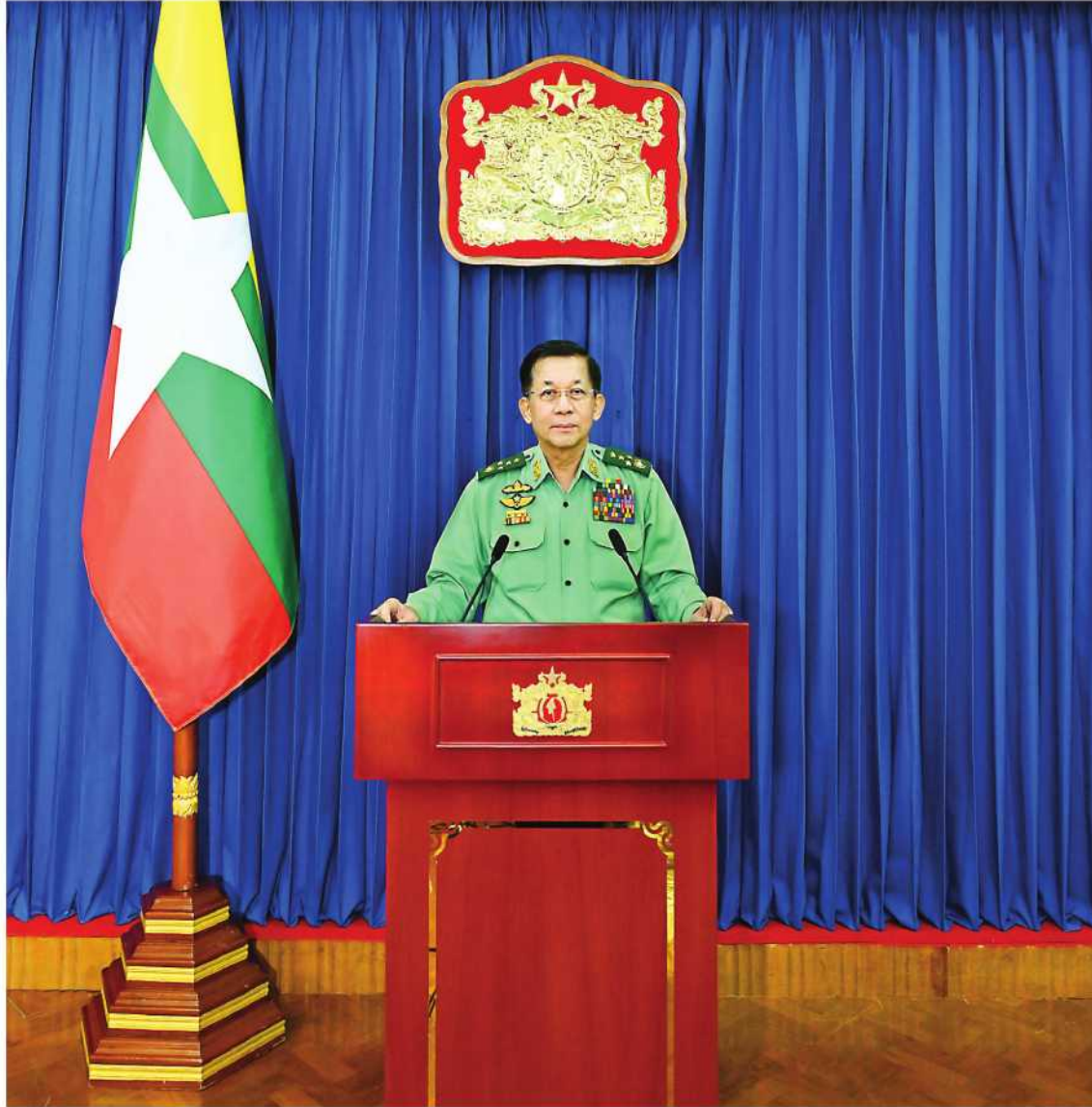
Senior General Min Aung Hlaing delivers at the speech.

MNDAA, TNLA and AA insurgents refused the offer of