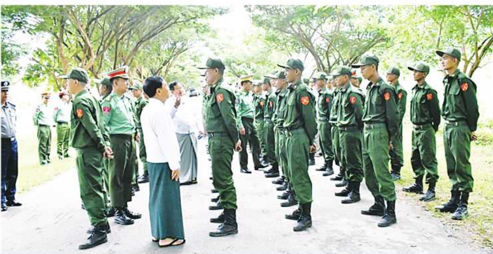
နေပြည်တော်ကောင်စီဥက္ကဋ္ဌ ဦးသန်းထွန်းဦး ပြည်သူ့စစ်မှုထမ်း သင်တန်းအမှတ်စဉ်(၄)မှ သင်တန်းသားများအား ရင်းရင်းနှီးနှီးလိုက်လံနှုတ်ဆက်စဉ်။