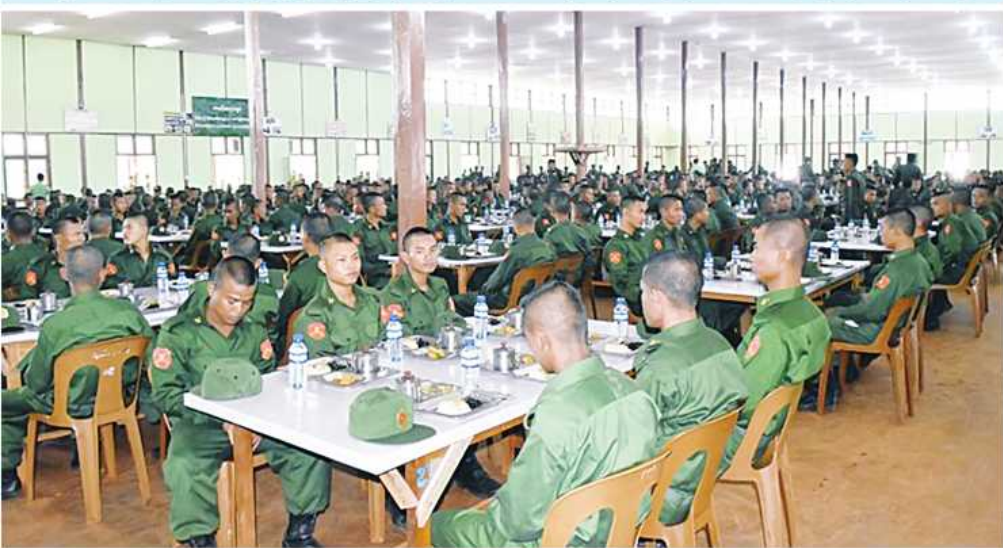
အရှေ့ပိုင်းတိုင်းစစ်ဌာနချုပ် ပြည်သူ့စစ်မှုထမ်းသင်တန်းအမှတ်စဉ်(၄) သင်တန်းသားများအား နေ့လယ်စာဖြင့် ဧည့်ခံကျွေးမွေးစဉ်။