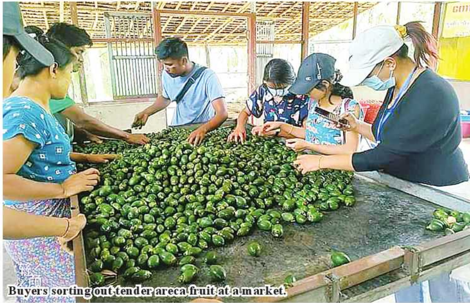
Buyers sorting out tender areca fruit at a market.