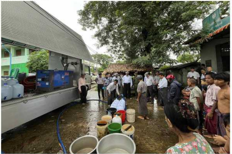
သယ်ယူပို့ဆောင်ပေးရန် တာဝန်ရှိသူများကို မှာကြားသည်။ ထို့နောက် တိုင်းဒေသကြီးဝန်ကြီးချုပ်နှင့်အဖွဲ့သည် အမှတ်(၃)အခြေခံပညာ အထက်တန်းကျောင်း၌ မီးသတ်တပ်ဖွဲ့ဝင်

ပဲခူးတိုင်းဒေသကြီး ဝန်ကြီးချုပ် ဦးမျိုးဆွေဝင်းသည် တိုင်းဒေသကြီးဝန်ကြီးများလိုက်ပါလျက် ယနေ့နံနက်ပိုင်းက ပဲခူးမြို့နယ်အတွင်း ပြန်လည်ထူထောင်ရေးလုပ်ငန်းများ အရှိန်အဟုန်ဖြင့် ဆောင်ရွက်နေမှုများကို သွားရောက်ကြည့်ရှုအားပေးသည်။ ရှေးဦးစွာ တိုင်းဒေသကြီးဝန်ကြီးချုပ် ဦးမျိုးဆွေဝင်းသည် တိုင်းဒေသကြီးဝန်ကြီးများနှင့်အတူ ပဲခူးမြို့နယ် ကမာနတ်ကျေးရွာ အုပ်စု၌ တိုင်းဒေသကြီးအစိုးရအဖွဲ့၏ အစီအစဉ်ဖြင့် ရေသန့်စက်တပ်ယာဉ်ဖြင့် သောက်ရေသန့်များ ဖြန့်ဖြူးပေးနေမှုကို သွားရောက်ကြည့်ရှုအားပေးပြီး ရေကြီးနစ်မြုပ်ခဲ့သည့် ရပ်ကွက်၊ ကျေးရွာများကို အလှည့်ကျဖြန့်ဖြူးပေးနိုင်ရေး ကြိုးတင်အသိပေးခြင်းများ ဆောင်ရွက်သွားရန်၊ မီးသတ်ရေယာဉ်များဖြင့် ရေအဆက်မပြတ်