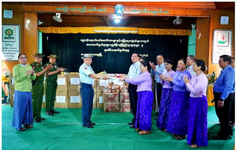
အောင်မြင်ပါစေ၊ တပ်မတော်သားများရဲ့ အောင်မြင်မှု ပြည်သူလူထုရဲ့ ငြိမ်းချမ်းမှု တွေကို စောင့်မျှော်လျက် တပ်မတော်သားများကိုချစ်တဲ့ ပြည်သူတွေ အများကြီးရှိနေ

ဆောင်ရွက်နေမှုကို မကွေးတိုင်းဒေသကြီး ဝန်ကြီးချုပ် ဦးတင့်လွင်၊ အနောက်ပိုင်း လေတပ်ကွပ်ကဲမှုဌာနချုပ်မှူး ဗိုလ်ချုပ် သိန်းထွန်းဦး၊ တိုင်းဒေသကြီးဝန်ကြီးများနှင့် တာဝန်ရှိသူများက ကြည့်ရှုအားပေးကြသည်။ နိုင်ငံတော်လုံခြုံရေး၊ နယ်မြေကာကွယ်ရေးအတွက် အသက်ကိုပစာနမတားဘဲ စွန့်လွှတ်စွန့်စားကာ ရှေ့တန်းတွင် တိုက်ပွဲဝင်နေကြသည့် တပ်မတော်သားများနှင့် လုံခြုံရေးတပ်ဖွဲ့ဝင်များအတွက် ငါးနီတူးခြောက်ကြော်၊ အသားတုနှင့် ငရုတ်သီးခြောက်ကြော်များအပြင် ပဲကြော်၊ မြေပဲဆားလှော်၊ ပုန်းရည်ကြီး၊ အသင့်စားခေါက်ဆွဲထုပ်၊ စုပေါက်ဖိမိ၊ ဆေးပေါ့လိပ်များနှင့်အတူ ဌာနဆိုင်ရာဝန်ထမ်းများနှင့် ပြည်သူများက “တရားသောစစ် အမြန်ဆုံး