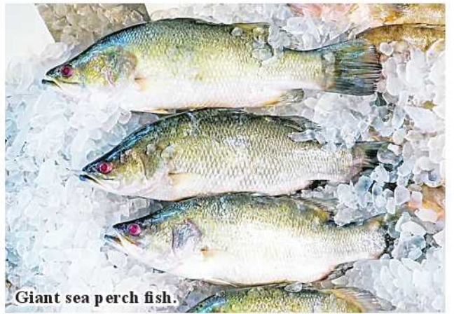
Giant sea perch fish.