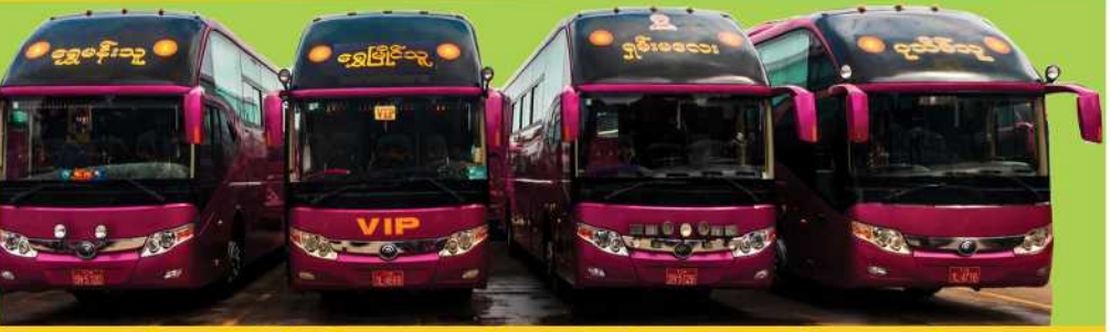
ဘေးကင်း လုံခြုံစိတ်ချ တာဝန်ယူမှုပြည့်ဝသော ခရီးသွားဝန်ဆောင်မှု