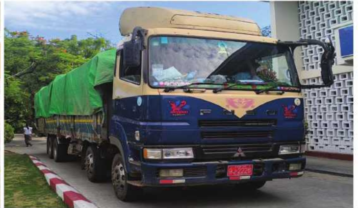
မန္တလေးတိုင်းဒေသကြီး၌ ဖမ်းဆီးရမိမှု။