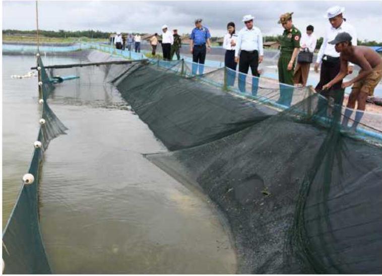
ရန်ကုန် ဩဂုတ် ၄

ရန်ကုန်တိုင်းဒေသကြီး ဝန်ကြီးချုပ် ဦးစိုးသိန်းနှင့် တိုင်းဒေသကြီးအစိုးရအဖွဲ့ဝင် များသည် တိုင်းဒေသကြီး ဌာနဆိုင်ရာ တာဝန်ရှိသူများလိုက်ပါ၍ ယနေ့နံနက်ပိုင်းက တွံ့တေးမွေးမြူရေးရန်အတွင်း လုပ်ငန်းရှင်များ၏ တိရစ္ဆာန်များ မွေးမြူထားရှိမှုနှင့် တိရစ္ဆာန်များအတွက် လိုအပ်သည့် အစားအစာအပင်များ စိုက်ပျိုးထားရှိမှုများကို ကြည့်ရှုစစ်ဆေးကြသည်။ ဦးစွာ တိုင်းဒေသကြီးဝန်ကြီးချုပ်နှင့် အဖွဲ့သည် တွံ့တေးမြို့နယ် ကန်ကြီးကုန်းကျေးရွာတွင် ကန်ကြီးကုန်းရေလှောင်တံပ် ပြန်လည်ပြုပြင်မည်လုပ်ငန်းခွင်နှင့် တစ်ပိုင်တစ်နိုင် စိုက်ပျိုးမွေးမြူရေးလုပ်ငန်းများကို