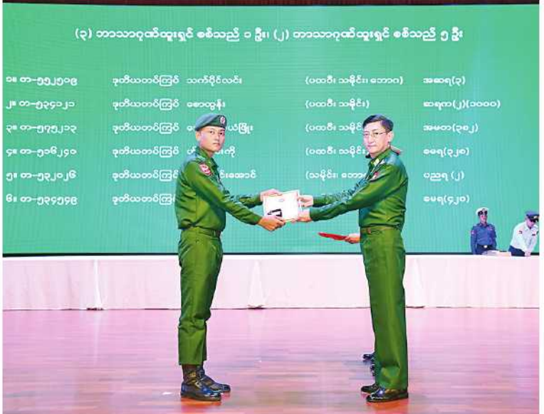
စစ်ရေးရပ် ဒုတိယဗိုလ်ချုပ်ကြီးမင်းအောင်လှိုင်က သုံးဘာသာဂုဏ်ထူးရရှိသူ ဒုတိယတပ်ကြပ် သက်ပိုင်လင်းအား ဂုဏ်ပြုတံဆိပ်၊ ဂုဏ်ပြုဆုနှင့် ဂုဏ်ပြုမှတ်တမ်းလွှာ ပေးအပ် ချီးမြှင့်စဉ်။

လွှာများ ပေးအပ်ချီးမြှင့်သည်။ ယင်းနောက် နိုင်ငံတော်စီမံအုပ်ချုပ်ရေး ကောင်စီဒုတိယဥက္ကဋ္ဌ ဒုတိယတပ်မတော် ကာကွယ်ရေးဦးစီးချုပ် ကာကွယ်ရေးဦးစီးချုပ် (ကြည်း) ဒုတိယဗိုလ်ချုပ်မှူးကြီးစိုးဝင်း က ၂၀၂၃-၂၀၂၄ ပညာသင်နှစ်တွင် တပ်မတော်ပညာရေးကျောင်းများမှ အောင် ချက်အကောင်းဆုံး ပထမ၊ ဒုတိယ၊ တတိယ ဆုရရှိသည့် ပညာရေးကျောင်းများမှ