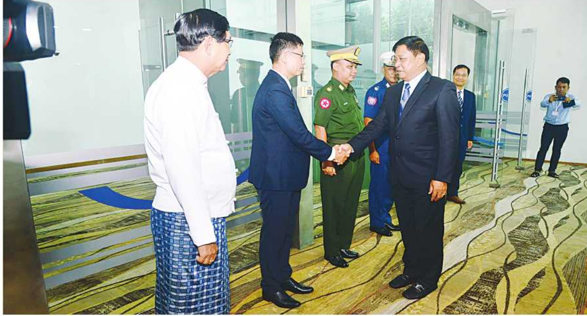
နိုင်ငံတော်စီမံအုပ်ချုပ်ရေးကောင်စီအဖွဲ့ဝင် ဒုတိယဝန်ကြီးချုပ်နှင့်ကာကွယ်ရေးဝန်ကြီးဌာန ပြည်ထောင်စုဝန်ကြီး ပိုလ်ချုပ်ကြီးတင်အောင်စန်းအား ရန်ကုန်တိုင်းဒေသကြီးဝန်ကြီးချုပ်၊ ရန်ကုန်တိုင်းစစ်ဌာနချုပ်တိုင်းမှူး၊ မြန်မာနိုင်ငံဆိုင်ရာ ဗီယက်နမ်ဆိုရှယ်လစ်သမ္မတနိုင်ငံ စစ်သံမှူးနှင့် သံရုံးမှတာဝန်ရှိသူများက ရန်ကုန်အပြည်ပြည်ဆိုင်ရာလေဆိပ်၌ ဝိုင်းဆောင်ခွတ်ဆက်စဉ်။

နေပြည်တော် ၇ ဇူလိုင် ၂၄ နိုင်ငံတော် စီမံအုပ်ချုပ်ရေးကောင်စီ အဖွဲ့ဝင် ဒုတိယဝန်ကြီးချုပ်နှင့် ကာကွယ်ရေးဝန်ကြီးဌာန ပြည်ထောင်စုဝန်ကြီး ပိုလ်ချုပ်ကြီးတင်အောင်စန်း ဦးဆောင်သော ကိုယ်စားလှယ်အဖွဲ့သည် ဗီယက်နမ် ကွန်မြူနစ်ပါတီ အထွေထွေအတွင်းရေးမှူးနှင့် သမ္မတဟောင်း ငုယင်ဖုကျောက်၏ နိုင်ငံတော်စွာပဒ်အခမ်းအနားသို့ တက်ရောက်ရန်အတွက် ယနေ့ညနေပိုင်းတွင် ရန်ကုန်မြို့မှ ဗီယက်နမ်ဆိုရှယ်လစ်သမ္မတ