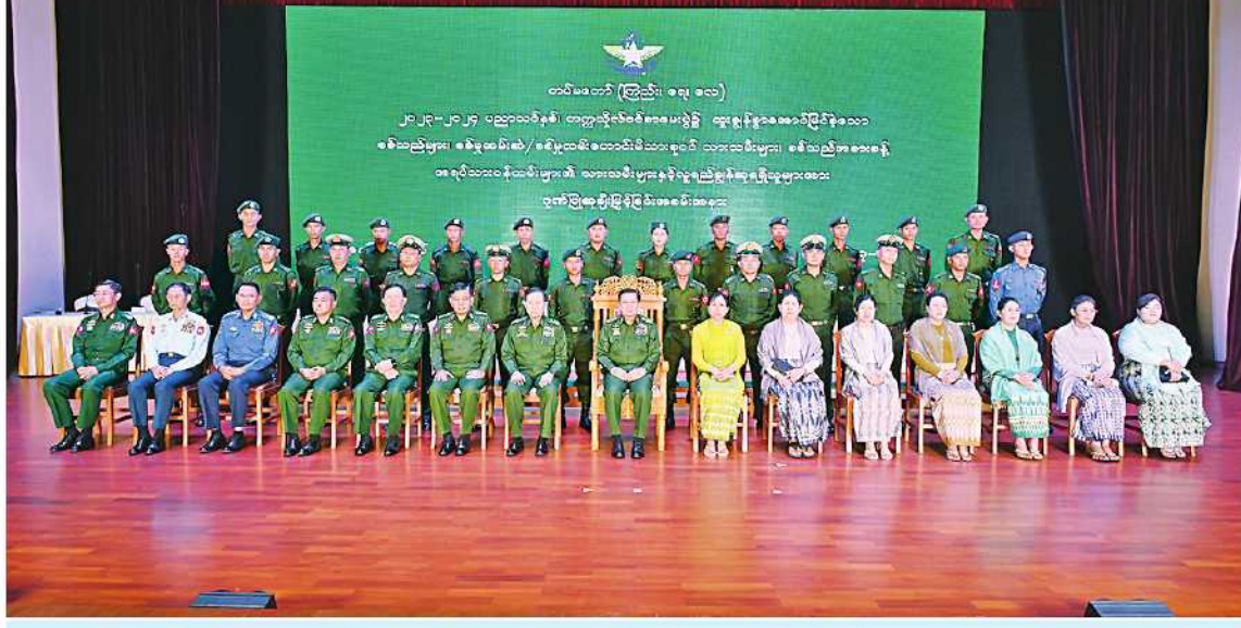
နိုင်ငံတော်စီမံအုပ်ချုပ်ရေးကောင်စီဥက္ကဋ္ဌ တပ်မတော်ကာကွယ်ရေးဦးစီးချုပ် ဗိုလ်ချုပ်မှူးကြီးမင်းအောင်လှိုင်နှင့်ဇနီး ဒေါ်ကြူကြူလှ၊ အဖွဲ့ဝင်များက ထူးချွန်ဂုဏ်ထူးရ စစ်သည်များနှင့်အတူ အမှတ်တရစုပေါင်းမှတ်တမ်းတင်ဓာတ်ပုံရိုက်စဉ်။

အထက်တန်းကျောင်း (မင်္ဂလာဒုံ)တို့သည် လည်း အောင်မြင်မှုပမာဏမှာ ၉၅ ရာခိုင်နှုန်း ကျော်ထိဖြစ်ခဲ့သည်ကို တွေ့ရှိရကြောင်း၊ ထိုကဲ့သို့ အောင်မြင်မှုများနှင့် ဂုဏ်ထူးရ သူများစွာကို မွေးထုတ်ပေးနိုင်ခဲ့သည့် အတွက် များစွာဂုဏ်ယူမိကြောင်းကို ပြောကြားလိုကြောင်း။ မိမိတို့နိုင်ငံတွင် ပညာရေးကဏ္ဍ ပိုမို ကျယ်ပြန့်လာစေရေး ပုဂ္ဂလိကကိုယ်ပိုင် ကျောင်းများကို ၂၀၁၂-၂၀၁၃ ပညာ သင်နှစ်ကစပြီး ဖွင့်လှစ်ခဲ့ပြီဖြစ်ကြောင်း၊ ပုဂ္ဂလိကကိုယ်ပိုင်ကျောင်းများ ပေါ်ပေါက် လာသော်လည်း အခြေခံပညာကဏ္ဍတွင် ပြည်သူ့လူထုအများစုသည် အစိုးရအခြေခံ ပညာကျောင်းများ၌ အဓိကတက်ရောက် ပညာသင်ကြားကြကြောင်း၊ တပ်မတော်သား သားသမီးများသည်လည်း နိုင်ငံ့ဝန်ထမ်း