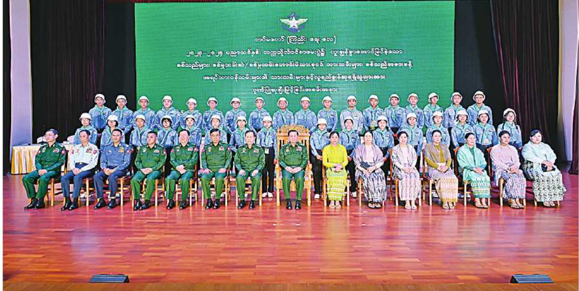
နိုင်ငံတော်စီမံအုပ်ချုပ်ရေးကောင်စီဥက္ကဋ္ဌ တပ်မတော်ကာကွယ်ရေးဦးစီးချုပ် ဗိုလ်ချုပ်မှူးကြီးမင်းအောင်လှိုင်နှင့်ဇနီး ဒေါ်ကြူကြူလှ၊ အဖွဲ့ဝင်များက လူရည်ချွန်ဆုရရှိသူများနှင့်အတူ အမှတ်တရစုပေါင်းမှတ်တမ်းတင်ဓာတ်ပုံရိုက်စဉ်။

သားသမီးများဖြစ်ကြသဖြင့် နိုင်ငံတော် အစိုးရ၏အခြေခံကျောင်းများတွင် အလေး ထားတက်ရောက် ပညာသင်ကြားကြရ ကြောင်း၊ ယခုထူးချွန်ဆုရသူအများစုသည် အစိုးရအခြေခံပညာ ကျောင်းများတွင် တက်ရောက်ပညာသင်ကြားပြီး ထူးချွန် အောင်မြင်ခဲ့ကြသူများဖြစ်ကြောင်း၊ ကိုယ်တိုင် ကြိုးစားအားထုတ်မှုမှ ရရှိခဲ့ကြသူများဖြစ် ကြောင်း၊ ထို့ပြင် နှစ်စဉ်တက္ကသိုလ်ဝင် စာမေးပွဲ အောင်ချက်များတွင်လည်း တပ်မတော် အခြေခံပညာအထက်တန်း