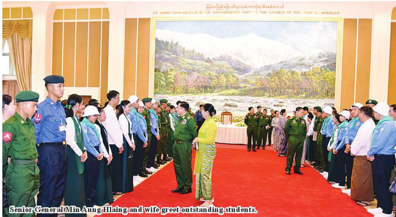
Senior General Min Aung Hlaing and wife greet outstanding students.

Nay Pyi Taw July 24 A ceremony to honour soldiers of Tatmadaw (Army, Navy and Air) and children of in-service Tatmadaw members, war veterans, substitute civilian service persons who passed the matriculation examination for academic year 2023-2024 with flying colours and qualified for outstanding students was held at Zeyathiri Villa here this afternoon, addressed by Chairman of State Administration Council Commander-in-Chief of Defence Services Senior General Min Aung Hlaing, who gave away honorary awards.