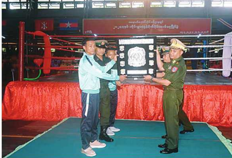
အနောက်တောင်တိုင်းစစ်ဌာနချုပ် တိုင်းမှူး ဝိုလ်ချုပ်ဝေလင်း ခိုင်းဆုရရှိသည့် အသင်းကို ခိုင်းဆုပေးအပ်ရီးမြှင့်စဉ်။

နေပြည်တော် ဇူလိုင် ၂၄ နေပြည်တော်တိုင်းစစ်ဌာနချုပ် ၂၀၂၄ ခုနှစ် တိုင်းမှူးခိုင်းလက်ဝှေ့ပြိုင်ပွဲ ပိုလ်လှပွဲနှင့် ဆုပေးပွဲကို ယနေ့ညနေပိုင်းတွင် တိုင်းစစ်ဌာနချုပ် ပုဗ္ဗသီရိအားကစားခန်းမ၌ပြုလုပ်ရာ တိုင်းမှူး ဝိုလ်ချုပ်စိုးမင်းနှင့် အရာရှိ၊ စစ်သည်၊ မိသားစုများ၊ ဒိုင်အဖွဲ့ဝင်များ၊ ပြိုင်ပွဲဝင်အားကစားသမားများနှင့် အားကစားဝါသနာရှင်များ တက်ရောက်ကြသည်။