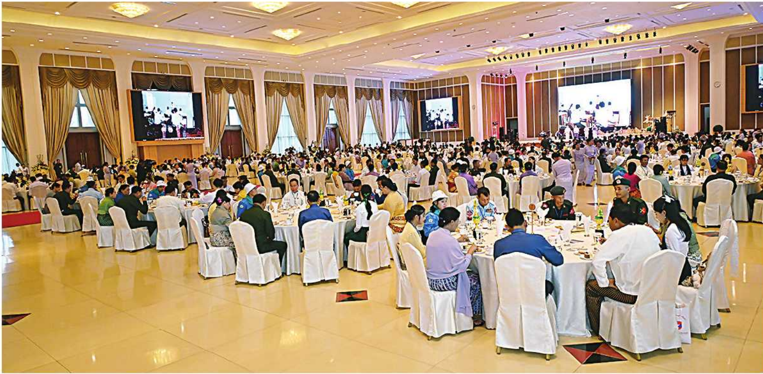
နိုင်ငံတော်စီမံအုပ်ချုပ်ရေးကောင်စီဥက္ကဋ္ဌ တပ်မတော်ကာကွယ်ရေးဦးစီးချုပ် ဗိုလ်ချုပ်မှူးကြီးမင်းအောင်လှိုင်နှင့်ဇနီး ဒေါ်ကြူကြူလှတို့က အခမ်းအနားတက်ရောက်လာကြသူများ၊ ဆရာမများ၊ ကျောင်းသား၊ ကျောင်းသူများ၊ မိဘများနှင့် ဆရာ၊ ဆရာမများအား စားသောက်ဖွယ်ရာများဖြင့် တည်ခင်းစဉ်စဉ်။