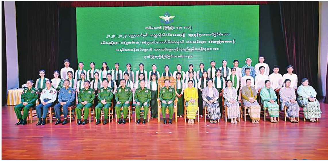
နိုင်ငံတော်စီမံအုပ်ချုပ်ရေးကောင်စီဥက္ကဋ္ဌ တပ်မတော်ကာကွယ်ရေးဦးစီးချုပ် ဗိုလ်ချုပ်မှူးကြီးမင်းအောင်လှိုင်နှင့်ဇနီး ဒေါ်ကြူကြူလှ၊ အဖွဲ့ဝင်များက ထူးချွန်ဂုဏ်ထူးရ ကျောင်းသား၊ကျောင်းသူများနှင့်အတူ အမှတ်တရစုပေါင်းမှတ်တမ်းတင်ဓာတ်ပုံရိုက်စဉ်။