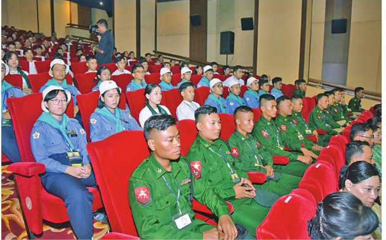
၂၀၂၃-၂၀၂၄ ပညာသင်နှစ် တက္ကသိုလ်ဝင်စာမေးပွဲ၌ ထူးချွန်စွာအောင်မြင်ခဲ့သည့် တပ်မတော်(ကြည်း၊ ရေ၊ လေ)မှ စစ်သည်များ၊ စစ်မှုထမ်းဆံ၊ စစ်မှုထမ်းဟောင်းမိသားစုဝင်များ၊ စစ်သည်အစားခန့် အရပ်သားဝန်ထမ်းများ၏ သားသမီးများနှင့် လူရည်ချွန်ဆုရရှိသော ကျောင်းသား၊ ကျောင်းသူများအား ဂုဏ်ပြုဆုချီးမြှင့်ခြင်းအခမ်းအနားသို့ တက်ရောက်လာကြသူ များကို တွေ့ရစဉ်။