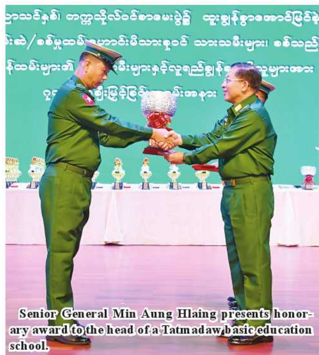
Senior General Min Aung Hlaing presents honorary award to the head of a Tatmadaw basic education school.

subjects after the completion of KG+9. It also made those who have completed