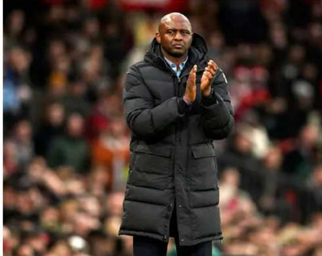
Ref : Xinhua Trs : ML

ပဲရစ် ဂူလိုင် ၁၉ အတူ ၁၉၉၈ ကမ္ဘာ့ဖလားနှင့် နည်းပြဖီအဲရာသည် ပြီးခဲ့သည့် ၂၀၀၀ ပြည့်နှစ် ယူရိုချန်ပီယံဆု တို့ကို ဆွတ်ခူးခဲ့သည့်အပြင် ကလပ် အသင်းများဖြစ်သည့် အာဆင်နယ်၊ ကလပ် စတုရန်းဂံအသင်းနှင့် ဂျူဗင်တပ်၊ အင်တာမီလန်၊ ပူးပေါင်းခဲ့ပြီး သုံးနှစ်စာချုပ် မန်စီးစီးအသင်းတို့နှင့်အတူ ပရီးမီးယားလိဂ်ဖလား တစ်ကြိမ်၊ အက်ဖ်တစ်ရာသီ တာဝန်ယူအပြီးတွင် အသင်းနှင့် နှစ်ပတ်သဘောတူ လမ်းခွဲခဲ့ကြောင်း ဖီအဲရာက ထုတ်ဖော်ပြောကြားခဲ့သည်။ လက်ရှိတွင် အမေရိကန် အသင်းက ကိုပါအမေရိကဖလား ပြိုင်ပွဲ အုပ်စုအဆင့်မှ ထွက်ခွာခဲ့ ရသည့်အတွက် နည်းပြဘာဟက် တာကို ထုတ်ပယ်ခဲ့ပြီးနောက် နည်းပြသစ်အဖြစ် ဖီအဲရာကို ခန့်အပ်ရန် ရွေးချယ်ထားသော ကြောင့် နည်းပြဖီအဲရာက စတုရန်းဂံအသင်းနှင့် ညှိနှိုင်းမှု ပြုလုပ်ခဲ့ရာ ကြာသပတေးနေ့က နှစ်ပတ်သဘောတူ လမ်းခွဲခဲ့ ကြောင်း သိရသည်။ အသက် ၄၈ နှစ်ရှိ နည်းပြ ဖီအဲရာသည် ကစားသမားဘဝတွင် အောင်မြင်မှုများစွာ ရရှိခဲ့သူဖြစ်ပြီး ပြင်သစ် လက်ရွေးစင်အသင်းနှင့်