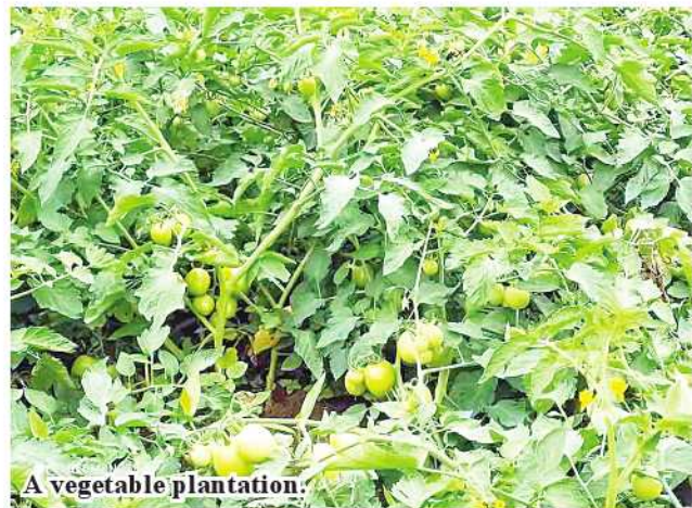
A vegetable plantation.

partment helps local farmers to apply correct agricultural techniques, prevent pests and use natural fertilizers and pesticides. 206