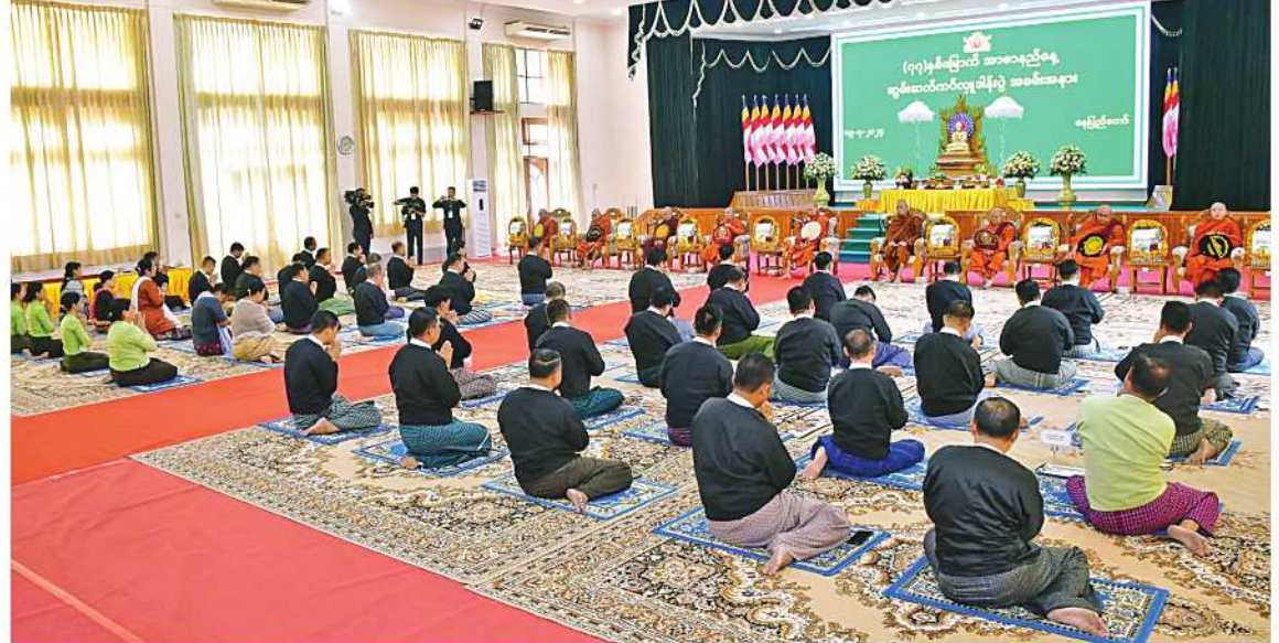
နေပြည်တော်စည်ပင်သာယာရေး ကျောင်းတိုက် ပဓာနနာယကဆရာတော် ကော်မတီ ဒုတိယမြို့တော်ဝန်၊ အမြဲတမ်းအတွင်းဝန်နှင့် ဌာနဆိုင်ရာအကြီးအကဲများ တက်ရောက်ကြည့်ကြည့်ကြသည်။

နေပြည်တော် ရူလိုင် ၁၉ (၇၇)နှစ်မြောက် အာဇာနည်နေ့တွင် နိုင်ငံတော်အတွက် အသက်ပေးလှူသွားကြသည့် အာဇာနည်ခေါင်းဆောင်ကြီးများအား ရည်စူးကုသိုလ်ပြုအမှုပေးဝေခြင်း အခမ်းအနားကို ယနေ့နံနက် ၁၀ နာရီတွင် နေပြည်တော်ကောင်စီရုံး ဇမ္ဗူသီရိခန်းမ၌ ကျင်းပသည်။