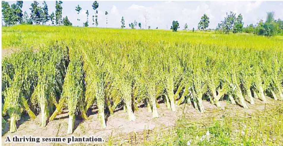
A thriving sesame plantation.

system for boosting per-acre yield of sesame.”