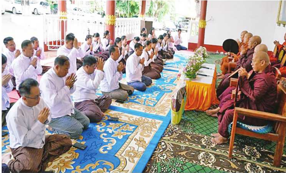
ရှမ်းပြည်နယ်(အရှေ့ပိုင်း) ကျိုင်းတုံမြို့၊ ခေမရဋ္ဌဗျာဒိတ်တော်ပေး ရပ်တော်မူဘုရားကြီး၏ (၃၁)ကြိမ်မြောက် အသံမစဲမဟာပဋ္ဌာန်းကျမ်းမြတ် ရွတ်ဖတ်ပူဇော်ပွဲ၊ ပဋ္ဌာန်းသိမ်းအောင်ပွဲ ကျင်းပစဉ်။