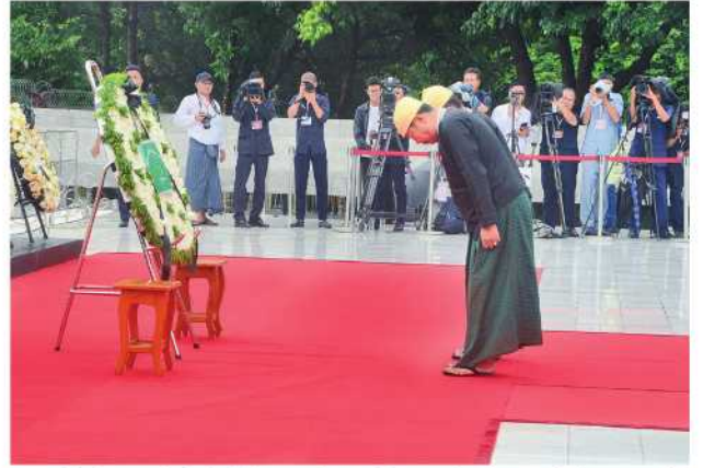
ပြည်ထောင်စုကြံ့ခိုင်ရေးနှင့် ဖွံ့ဖြိုးရေးပါတီမှ ကိုယ်စားလှယ် များက လွမ်းသူ့ပန်းဈေးချ အလေးပြုစဉ်။