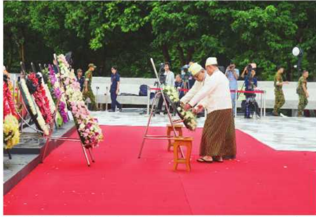
မြန်မာနိုင်ငံ စစ်မှထမ်းဟောင်းအဖွဲ့မှ တာဝန်ရှိသူများက လွမ်းသူ့ ပန်းဈေးချ အလေးပြုစဉ်။