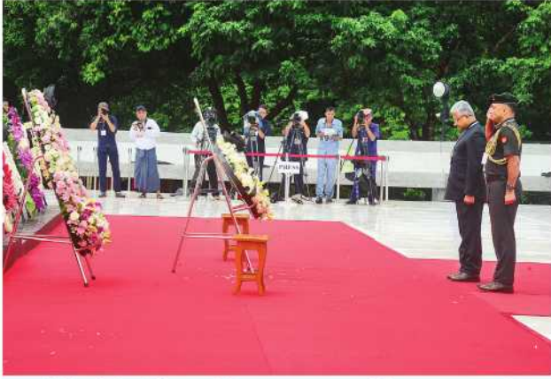
မြန်မာနိုင်ငံဆိုင်ရာ အိန္ဒိယသံရုံးမှ တာဝန်ရှိသူများက လွမ်းသူ့ ပန်းဈေးချ အလေးပြုစဉ်။