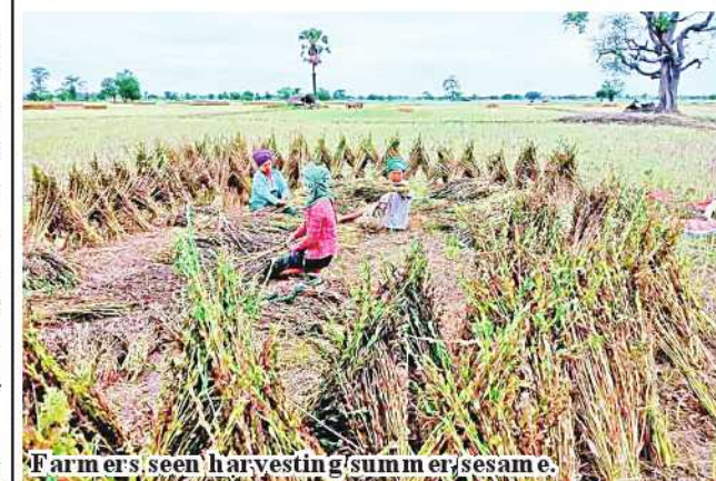
Farmers seen harvesting summer sesame.