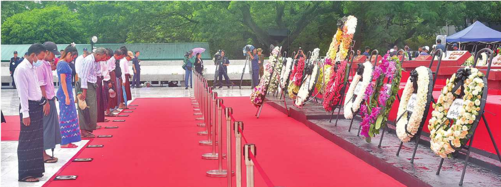
အာဇာနည်မိမိမာန်တွင် လာရောက် ဂီရဝပြုကြသည့် ရဟန်းစုင်လူများ၊ ကျောင်းသား၊ ကျောင်းသူများနှင့် ပြည်သူများကို တွေ့ရစဉ်။