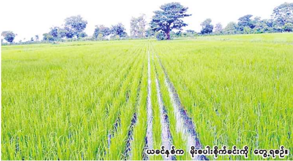
ယခင်နှစ်က မိုးစပါးစိုက်ခင်းကို တွေ့ရစဉ်။

ကျွန်းလှ ရုလိုင် ၁၉ စစ်ကိုင်းတိုင်းဒေသကြီး ကန့် ၂၄၀၉၇ ကေ စိုက်ပျိုးရန်လျာထား တာလူခရိုင် ကျွန်းလှမြို့နယ်တွင် ယခုနှစ် မိုးသီးနှံစိုက်ပျိုးရာသီ၌ မိုးစပါး ကေ ၇၅၄၀ ထိ စိုက်ပျိုးပြီး စီးပြီဖြစ်ကြောင်း ကျွန်းလှမြို့နယ် စိုက်ပျိုးရေးဦးစီးဌာနမှ သိရသည်။ ယခုနှစ် မိုးသီးနှံစိုက်ပျိုးရာသီ၌