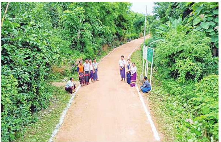
လမ်းပန်းဆက်သွယ်ရေး ပိုမိုကောင်းမွန် ဖူလုံစွာရရှိလာပြီဖြစ်ကြောင်း သိရသည်။ လာပြီး သန့်ရှင်းသောသောက်သုံးရေကို သုတ

အကျယ် ၁၂ ပေ၊ အမြင့်ခြောက်လက်မရှိ မြေနီကျောက်စရစ်ခင်းခြင်းလုပ်ငန်းနှင့် ရေသန့်စင်စနစ်တပ်ဆင်ခြင်းလုပ်ငန်းကို မြစ်မီးရောင်ကျေးရွာစီမံကိန်းအတိုးရငွေကျပ် ၁၄ ဒသမ ၂ သန်းဖြင့် ၂၀၂၄ ခုနှစ် မေလ စတင်အသုံးပြုမှု စတင်ဆောင်ရွက်ခဲ့ရာ ယခုအခါ လုပ်ငန်းများအားလုံး ရာနှုန်းပြည့်ဆောင်ရွက်ပြီးစီးပြီဖြစ်ကြောင်း သိရသည်။ ကျီးပင်စုကျေးရွာတွင် မြေနီကျောက်စရစ်ခင်းခြင်းနှင့် ရေသန့်စင်စနစ်တပ်ဆင်ခြင်းလုပ်ငန်းများ ရာနှုန်းပြည့်ဆောင်ရွက်ပြီးစီးမှုကြောင့် ကျေးရွာနေပြည်သူများ