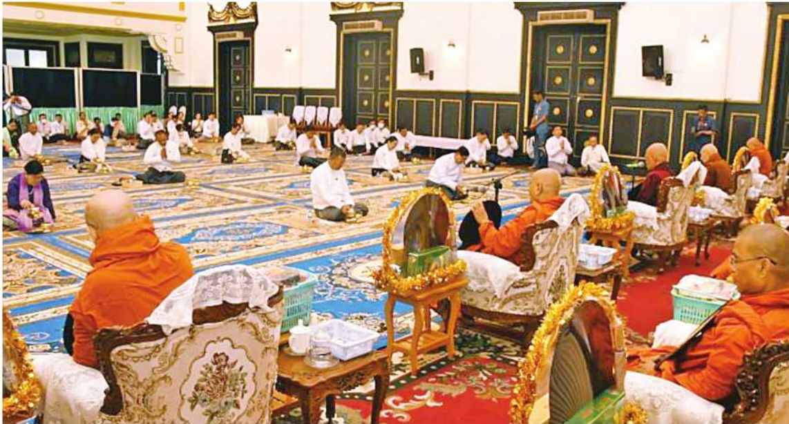
ရန်ကုန် ရူလိုင် ၁၉ (၂၀၂၄ ခုနှစ် (၇၇)နှစ်မြောက် အာဇာနည် နေ့တွင် ကျဆုံးလေပြီသော အာဇာနည် ခေါင်းဆောင်ကြီးများအား ရည်စူး၍ ဆွမ်းဆက်ကပ်ခြင်း၊ အလှူဒါနပြု အမှုပေးဝေခြင်းအခမ်းအနားကို ယနေ့နံနက် ၁၀ နာရီခွဲတွင် ရန်ကုန်မြို့တော်စည်ပင်သာယာရေးကော်မတီ မြို့တော်ခန်းမ ပထမထပ်ရှိ အစည်းအဝေးခန်းမ၌ ကျင်းပသည်။