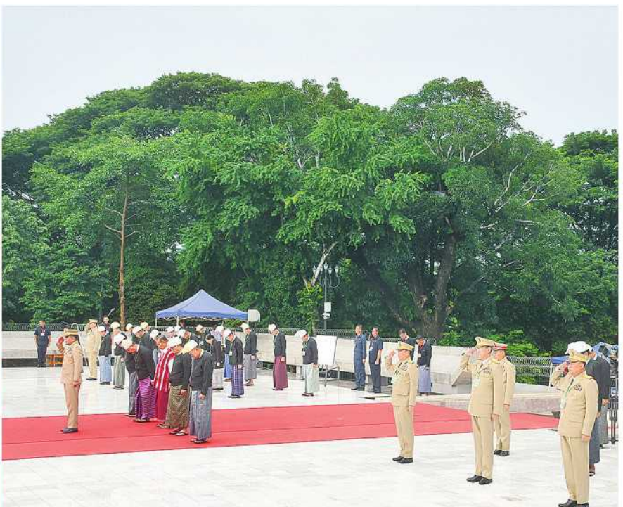
နိုင်ငံတော်စီမံအုပ်ချုပ်ရေးကောင်စီအဖွဲ့ဝင် ညှိနှိုင်းကွပ်ကဲရေးမှူး(ကြည်း၊ ရေ၊ လေ) ဗိုလ်ချုပ်ကြီးမောင်မောင်အေး (၇၇)နှစ်မြောက် အာဇာနည်နေ့အခမ်းအနားသို့ တက်ရောက်လာကြသူများနှင့်အတူ ဗိုလ်ချုပ်အောင်ဆန်းနှင့်တကွ အာဇာနည်ခေါင်းဆောင်ကြီးများ၏ ဂုဏ်ဓာတ်နှင့် ပြည်ထောင်စုသမ္မတမြန်မာနိုင်ငံတော်၏ လွမ်းသူပန်းခွေချ၍ အလေးပြုကြစဉ်။

နေပြည်တော် ဇူလိုင် ၁၉ (ကြည်း၊ ရေ၊ လေ) ဗိုလ်ချုပ်ကြီးမောင်မောင်အေး တက်ရောက်လာကြသူများနှင့်အတူ ညှိနှိုင်းကွပ်ကဲရေးမှူး (ကြည်း၊ ရေ၊ လေ) ဗိုလ်ချုပ်ကြီးမောင်မောင်အေး တက်ရောက်လာကြသူများနှင့်အတူ ပြည်ထောင်စုသမ္မတမြန်မာနိုင်ငံတော်၏ လွမ်းသူပန်းခွေချ၍ အလေးပြုကြစဉ်။