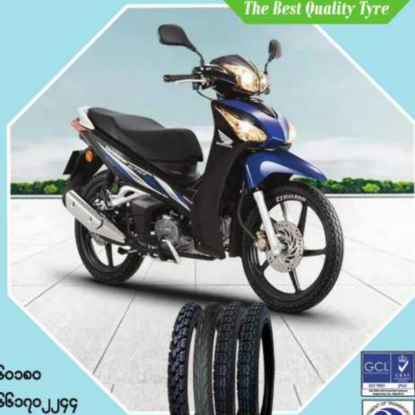
The Best Quality Tyre

ပင်ရင်းအရောင်းဌာန - ဇုန်း - ၀၉ ၂၅၄၂၇၂၀၄၃၊ ၀၉ ၄၅၃၂၅၅၅၅၅ KHA YAE PIN MART - မင်္ဂလာဒုံ၊ ပြည်လမ်း၊ ရန်ကုန်မြို့၊ ဇုန်း - ၀၉ ၆၇၀၄၄၃၅၅၅ STARMART nine mile Showroom - (၉)မိုင်၊ ပြည်လမ်း၊ ရန်ကုန်မြို့၊ ဇုန်း - ၀၉ ၃၀၆၆၀၀၀ STARMART MANDALAY Wholesale - ဂြင်လမ်းနှင့်မြင်းလမ်းထောင့်၊ မန္တလေးမြို့၊ ဇုန်း - ၀၉ ၆၆၀၇၀၂၂၄၄ STARMART Nay Pyi Taw - ရန်ကုန် - မန္တလေးလမ်းဟောင်း၊ ရွာကောက်ရပ်၊ ပျဉ်းမနား၊ ဇုန်း - ၀၉ ၆၈၅၁၀၉၀၇၇