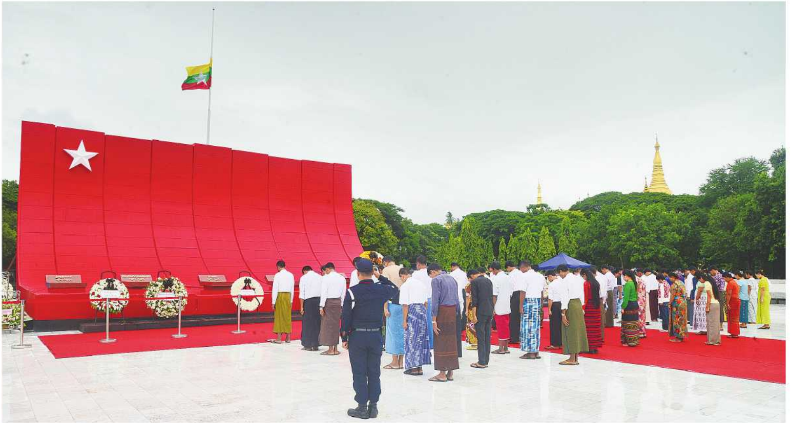
အာဇာနည်မိမိမာန်တွင် လာရောက်ဂီရဝပြုကြသည့် ရဟန်းစုင်လူများ၊ ကျောင်းသား၊ ကျောင်းသူများနှင့် ပြည်သူများကို တွေ့ရစဉ်။