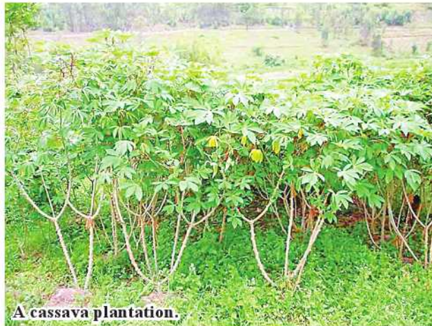
A cassava plantation.