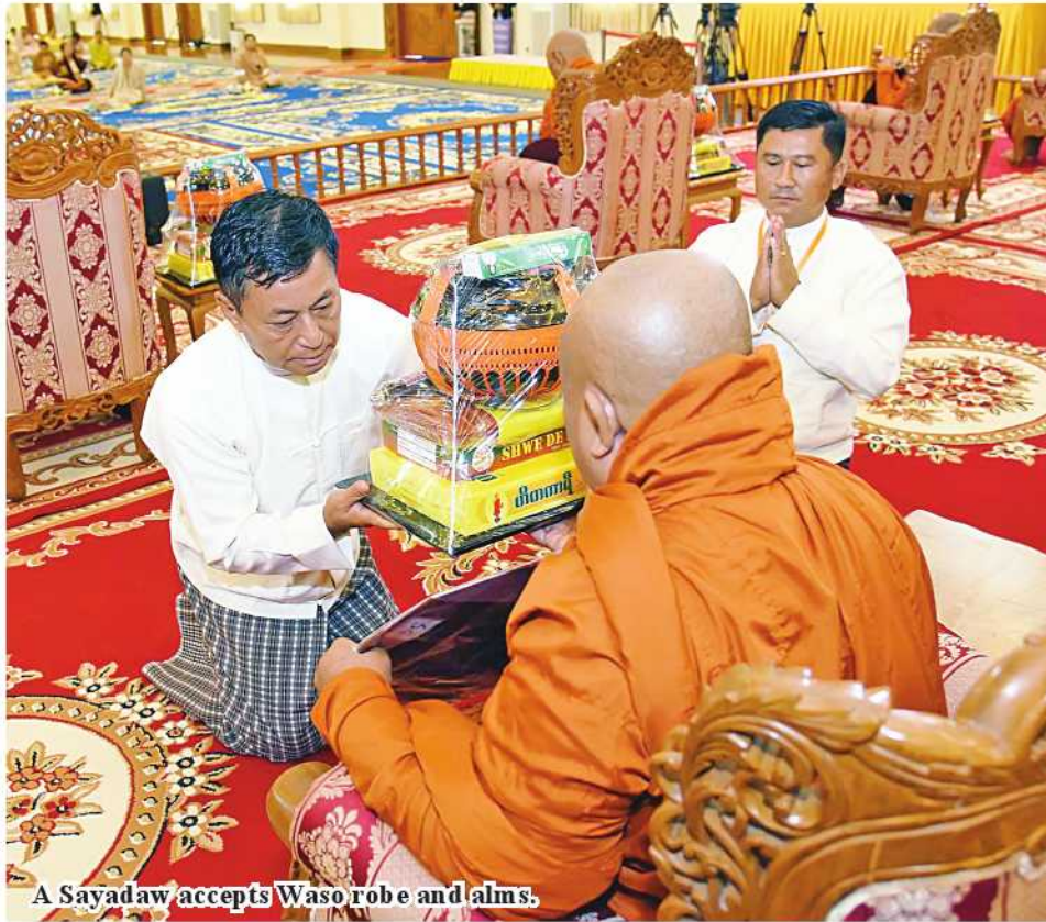
A Sayadaw accepts Waso robe and alms.