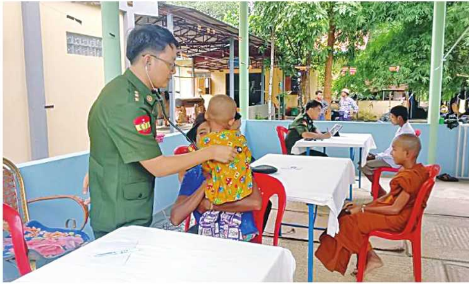
သံဃာတော်များနှင့် ဒေသခံပြည်သူများကို ရန်ကုန်တိုင်းစစ်ဌာနချုပ် နယ်မြေစံဆေးကုသရေးအဖွဲ့က ကျန်းမာရေးစောင့်ရှောက်မှုလုပ်ငန်းများ ဆောင်ရွက်ပေးစဉ်။

နေပြည်တော် ရူလိုင် ၁၆ ရန်ကုန်တိုင်းဒေသကြီး တိုက်ကြီးမြို့နယ် တာခွကျေးရွာအုပ်စု ပိတောက်တန်းကျေးရွာနှင့် ပတ်ဝန်းကျင်ကျေးရွာများမှ သံဃာတော်များနှင့် ဒေသခံပြည်သူများကို ယနေ့နံနက်ပိုင်းတွင် ရန်ကုန်တိုင်းစစ်ဌာနချုပ် နယ်မြေစံဆေးကုသရေးအဖွဲ့က ပိတောက်တန်းကျေးရွာရှိ ရွှေပင်ဝင်း