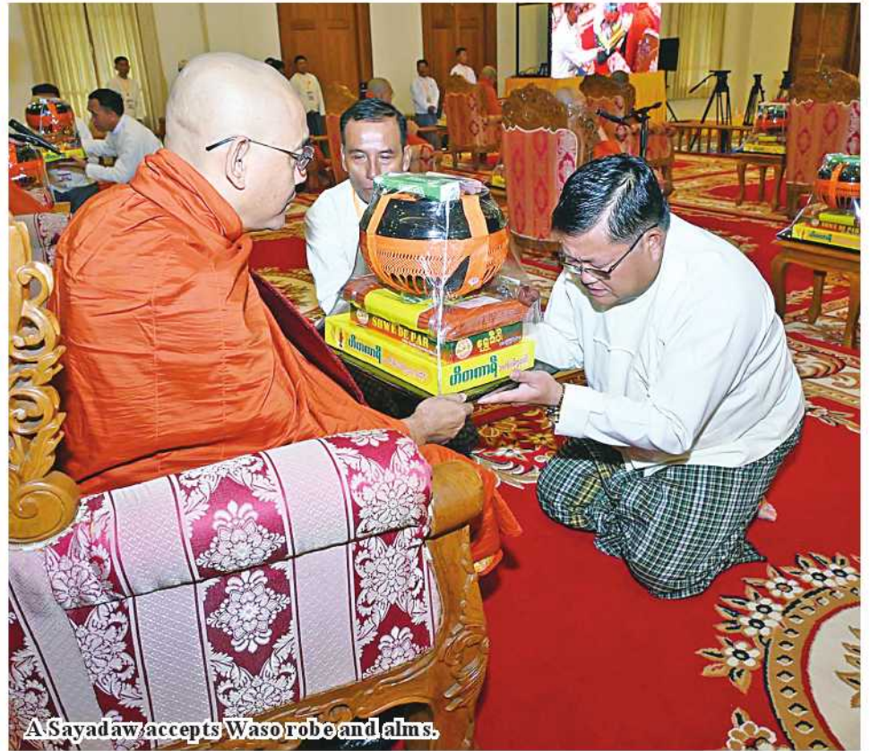
A Sayadaw accepts Waso robe and alms.