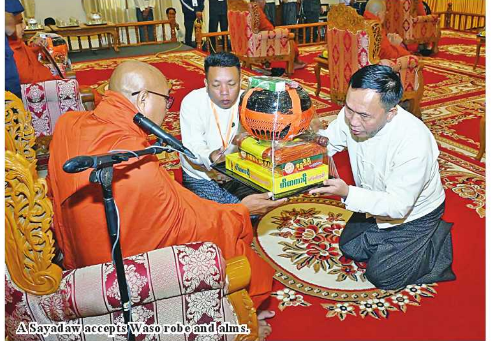
A Sayadaw accepts Waso robe and alms.