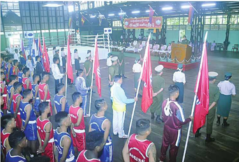
ကမ်းရိုးတန်းဒေသ တိုင်းစစ်ဌာနချုပ် တိုင်းမှူးခိုင်း လက်တွေ့ပြိုင်ပွဲ ဖွင့်ပွဲကျင်းပစဉ်။

နေပြည်တော် ရူလိုင် ၁၆ ကမ်းရိုးတန်းဒေသ တိုင်းစစ်ဌာနချုပ် ၂၀၂၄ ခုနှစ် တိုင်းမှူးခိုင်း လက်တွေ့ပြိုင်ပွဲ ဖွင့်ပွဲကို ယနေ့မနက်လွှဲပိုင်းတွင် တိုင်းစစ်ဌာနချုပ် တိုင်းရန်အောင်ခန်းမ၌ ပြုလုပ်ရာ တိုင်းမှူး ဗိုလ်မှူးချုပ်ပြည့်စုံလင်းနှင့်တာဝန်ရှိသူများ၊ အရာရှိ၊ စစ်သည်၊ မိသားစုဝင်