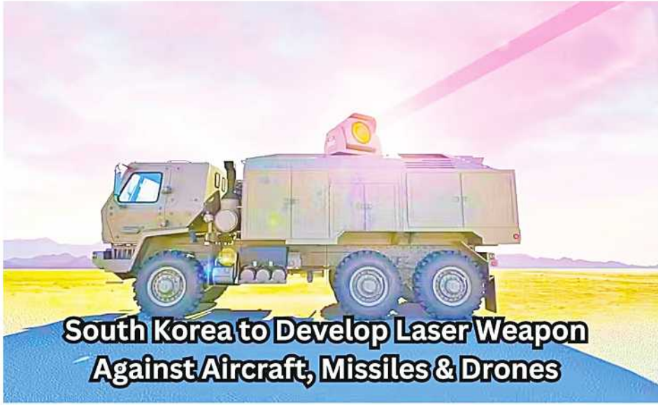
South Korea to Develop Laser Weapon Against Aircraft, Missiles & Drones

တောင်ကိုရီးယားနိုင်ငံသည် ခြိမ်းခြောက်မှုမြင့်တက်လာသော မြောက်ကိုရီးယား၏ ဒရုန်းများကို ကြားဖြတ်တိုက်ခိုက်နိုင်ရေးအတွက် ၂၀၂၄ ခုနှစ်အတွင်း လေဆာလက်နက်များ ထုတ်လုပ်ရန်ကြိုးပမ်းနေသည့်အတွက် စစ်ဘက်တွင် ၎င်းလက်နက်များ အသုံးပြုမည့် ကမ္ဘာ့ပထမဆုံးနိုင်ငံဖြစ်လာတော့မည် ဖြစ်ကြောင်း တိုင်းပြည်၏ စစ်လက်နက်ပစ္စည်းများ ဝယ်ယူရေးအာဏာပိုင်အဖွဲ့ (DAPA)က ဇူလိုင်လ ၁၁ ရက်တွင် ပြောကြားသွားခဲ့သည်။