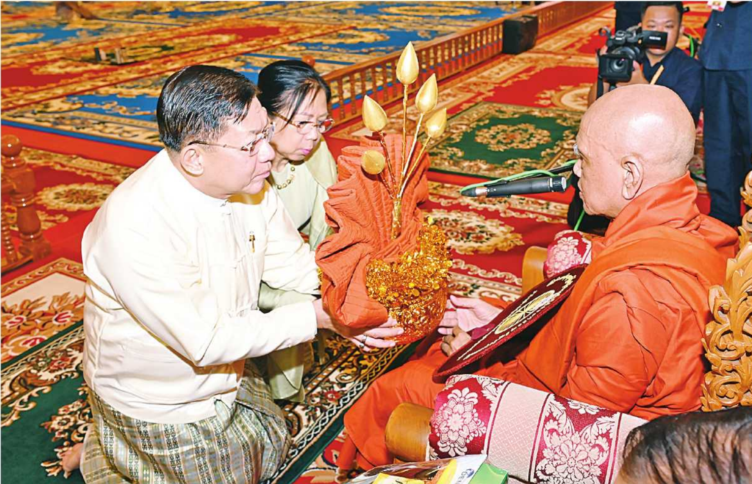
နိုင်ငံတော်သံဃမဟာနာယကအဖွဲ့ဥက္ကဋ္ဌ ရန်ကုန်တိုင်းဒေသကြီး သန်လျင်မြို့ မင်းကျောင်းပထမပြန်စာသင်တိုက် ပဓာနနာယက အဂ္ဂမဟာပဏ္ဍိတ အဂ္ဂမဟာသဒ္ဓမ္မဇောတိကဓဇ ဒေါက်တာ ဘဒ္ဒန္တစန္ဒိမာဘိဝံသထံ နိုင်ငံတော်စီမံအုပ်ချုပ်ရေးကောင်စီဥက္ကဋ္ဌ နိုင်ငံတော်ဝန်ကြီးချုပ် ဗိုလ်ချုပ်မှူးကြီးမင်းအောင်လှိုင်နှင့် ဇနီး ဒေါ်ကြူကြူလှတို့က ဝါဆိုသင်္ကြန်ဆက်ကပ်လှူဒါန်းစဉ်။

နေပြည်တော် ရုလိုင် ၁၆ ပြည်ထောင်စုသမ္မတမြန်မာနိုင်ငံတော် နိုင်ငံတော်စီမံအုပ်ချုပ်ရေးကောင်စီ၏ ၂၀၂၄ ခုနှစ် ဝါဆိုသင်္ကြန်ဆက်ကပ်လှူဒါန်းပွဲ မဟာမင်္ဂလာအခမ်းအနားကို ယနေ့နံနက်ပိုင်းတွင် နေပြည်တော်ကောင်စီနယ်မြေဥပဒေဌာနဌာနဌာနဌာနတော်မြတ်ကြီး ပရိဝုဏ်တော်အတွင်းရှိ သာသနာ့မဟာဓိပနိတော်ကြီး၌ကျင်းပပြုလုပ်ရာ နိုင်ငံတော်စီမံအုပ်ချုပ်ရေးကောင်စီဥက္ကဋ္ဌ နိုင်ငံတော်ဝန်ကြီးချုပ် ဗိုလ်ချုပ်မှူးကြီးမင်းအောင်လှိုင်နှင့် ဇနီး ဒေါ်ကြူကြူလှတို့ တက်ရောက်ကြည့်ညှိပြီး ဝါဆိုသင်္ကြန်နှင့် လှူဖွယ်ပစ္စည်းများ ဆက်ကပ်လှူဒါန်းကြသည်။ အဆိုပါအခမ်းအနားသို့ နိုင်ငံတော်သံဃမဟာနာယကအဖွဲ့ဥက္ကဋ္ဌ ရန်ကုန်တိုင်းဒေသကြီးသန်လျင်မြို့မင်းကျောင်းပထမပြန်စာသင်တိုက် ပဓာနနာယက အဂ္ဂမဟာပဏ္ဍိတ အဂ္ဂမဟာသဒ္ဓမ္မဇောတိကဓဇ ဒေါက်တာ ဘဒ္ဒန္တစန္ဒိမာဘိဝံသထံ နိုင်ငံတော်သံဃမဟာနာယကအဖွဲ့အကျိုးတော်ဆောင် မန္တလေးမြို့ မစိုးရိမ်တိုက်သစ်မဟာနာယက စာမျက်နှာ ၁၆ ကော်လံ ၁၂၆