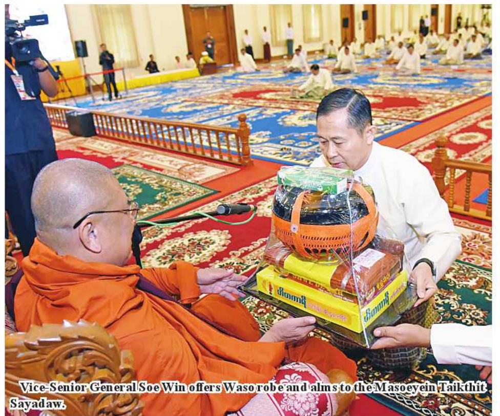
Vice-Senior General Soe Win offers Waso robe and alms to the Masoeyin Taikthit Sayadaw.