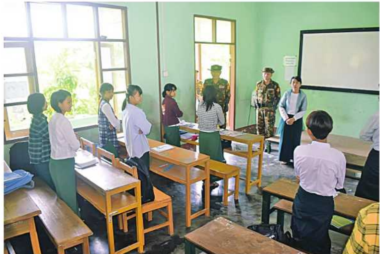
အရှေ့ပိုင်းတိုင်းစစ်ဌာနချုပ် တိုင်းမှူး ဗိုလ်ချုပ်ဇော်မင်းလတ် ကျောင်းသားကျောင်းသူများ ပညာသင်ကြားနေမှုကို ကြည့်ရှုအားပေးစဉ်။

နေပြည်တော် ရူလိုင် ၁၆ ကယားပြည်နယ် လွိုင်ကော်မြို့ ဒေါ်နိုးကူးရပ်ကွက် အမှတ်(၇)အခြေခံပညာအထက်တန်းကျောင်းရှိ ဆရာ၊ ဆရာမများအား ဆန်း၊ ဆီနှင့် စားသောက်ဖွယ်ရာများပေးအပ်ခြင်းကို ယနေ့နံနက်ပိုင်းတွင် အဆိုပါကျောင်းရှိ ဒွေးမယ်နောဆောင်၌ ပြုလုပ်ရာ အရှေ့ပိုင်းတိုင်းစစ်ဌာနချုပ် တိုင်းမှူး ဗိုလ်ချုပ်ဇော်မင်းလတ်နှင့် တာဝန်ရှိသူများ၊ ကျောင်းအုပ်ဆရာမကြီးနှင့်ဆရာ၊ဆရာမများ တက်ရောက်ကြသည်။