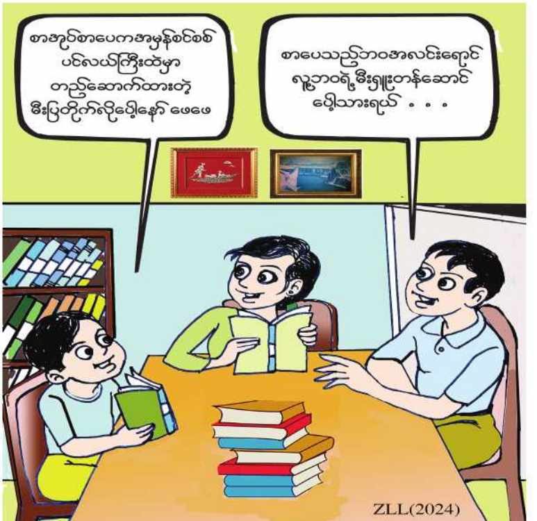
စာအုပ်စာပေကဏ္ဍမှစစ်စစ် ပင်လယ်ကြီးထဲမှာ တည်ဆောက်ထားတဲ့ မီးပြတိုက်ဗိုလ်ချုပ် ဖေဖေ စာပေသည့်ဘဝအလင်းရောင် ရွှေဘဝရဲ့ မီးရှူးတန်ဆောင် ပျံသားရယ် . . .

ရာသီ၌ ဝါသီးနှံစိုက်ပျိုးရန်အတွက် မြို့နယ်အလိုက် လျာထားမှုအနေဖြင့် စစ်ကိုင်းမြို့နယ်တွင် ၁၈၄၀၆ ဧက၊ မြင်းမူမြို့နယ်တွင် ၂၃၁၅၇ ဧကနှင့်မြောက်မြို့နယ်တွင် ၅၆၉၇ ဧက စုစုပေါင်း ဧက ၄၇၂၆၀ တို့ဖြစ်ကြောင်း သိရသည်။ ယခုနှစ် စစ်ကိုင်းခရိုင်တွင် ဝါသီးနှံစိုက်တောင်သူများကို သက်ဆိုင်ရာ မြို့နယ်စိုက်ပျိုးရေးဦးစီးဌာနအနေဖြင့် ဝါမျိုးကောင်းမျိုးသန့်များရရှိစေရန်၊ ဝါသီးနှံဖြစ်ထွန်းအောင်မြင်စေရန်၊ ပိုးမွှားရောဂါကြိုတင်ကာကွယ်နိုင်စေရန်၊ အထွက်နှုန်းကောင်းမွန်စေရန် စိုက်နည်းစနစ်မှန်ကန်စေရန် ပညာပေးလုပ်ငန်းများဆောင်ရွက်ပေးလျက်ရှိကြောင်း သိရသည်။ (၂၀၆)