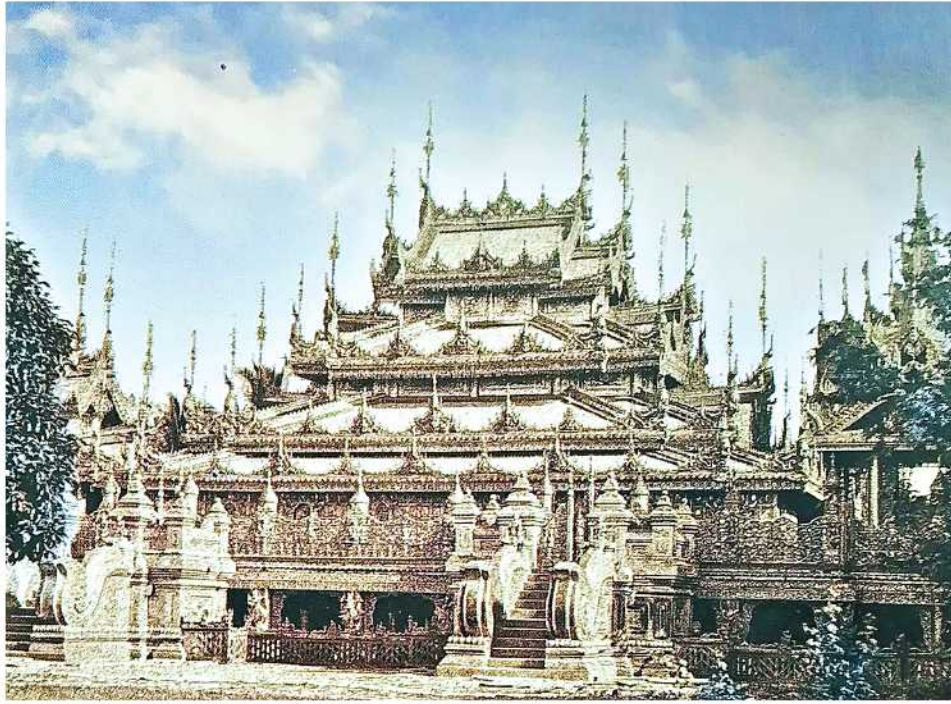
ပျောက်ကွယ်ခဲ့သော တော်ဝင်ကျွန်းဘုန်းကြီးကျောင်းများစာအုပ်တွင် ဖော်ပြထားသည့် သမီးတော်ကျောင်းပုံကို တွေ့ရစဉ်။

မြန်မာဘုရင်များ၏ တော်ဝင်ထီးနန်းခေတ်တွင် ဘုရင်၏မိဖုရားများကို နန်းရံမိဖုရား၊ မိဖုရားငယ်နှင့် ကိုယ်လုပ်တော်ဟု ယေဘုယျအားဖြင့် ခွဲခြားနိုင်သည်။ ၁၈ ရာစုနှောင်းပိုင်းတွင် ကုန်းဘောင်ဘုရင်များသည် မိဖုရားများအဖြစ် ဆောင်တော်မိဖုရားနှင့် ရွှေရေးဆောင်မိဖုရားတို့ကိုပါ ထည့်သွင်းခဲ့သည်။