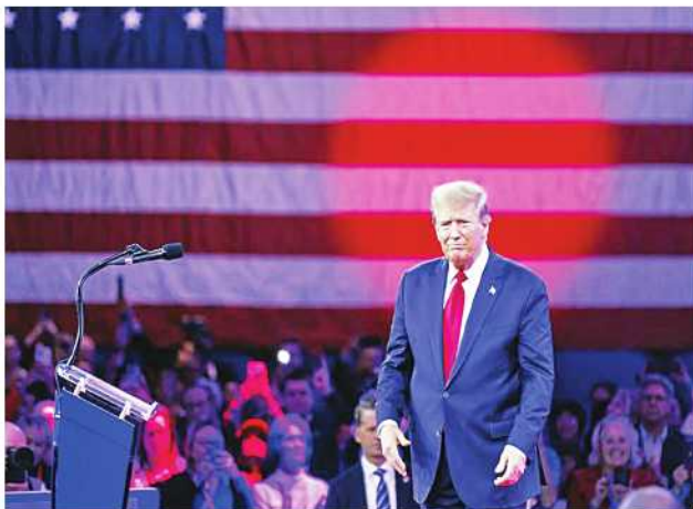
Milwaukee July 16 Former President Donald Trump, who has been the presumptive Republican nominee for months, received enough delegate votes on Monday to officially become the party's nominee. Former U.S. President Donald Trump attends the Conservative Political Action Conference (CPAC) at National Harbor in Maryland, the United States, Feb. 24, 2024.

can nominee for months, received enough delegate votes on Monday to officially become the party's nominee.