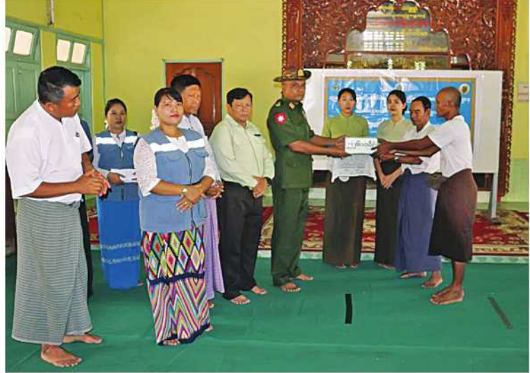
တောင်ပိုင်းတိုင်းစစ်ဌာနချုပ် နယ်မြေစံတပ်နယ်မှ တာဝန်ရှိသူများက လူမှုဝန်ထမ်း၊ ကယ်ဆယ်ရေးနှင့် ပြန်လည်နေရာချထားရေးဝန်ကြီးဌာနက ထောက်ပံ့လျှာဒါနိုင်းသည် အလှူငွေများကို ပေးအပ်စဉ်။

အဆိုပါ ရေဘေးသင့်ပြည်သူများကို ယနေ့နံနက်ပိုင်းတွင် နယ်မြေစံတပ်နယ်မှ တာဝန်ရှိသူများက ကြာနီကန်ရပ်ကွက် ရွှေမျက်မှန်ဘုရားဝင်းအတွင်းရှိ ဓမ္မာရုံ၌ သွားရောက်တွေ့ဆုံ အားပေးစကားပြောကြားပြီး ရေဘေးသင့်ပြည်သူအိမ်ထောင်စု ၁၃၆ စု လူဦးရေ ၅၃၀ တို့အတွက် လူမှုဝန်ထမ်းကယ်ဆယ်ရေးနှင့် ပြန်လည်နေရာချထားရေးဝန်ကြီးဌာနက ထောက်ပံ့လျှာဒါနိုင်းသည် အလှူငွေများကို ပေးအပ်ခဲ့ကြောင်း သတင်းရရှိသည်။ (၅၀၁)