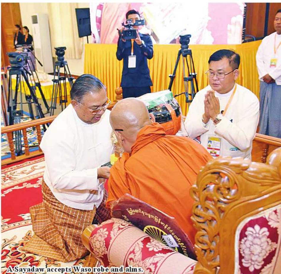
A Sayadaw accepts Waso robe and alms.