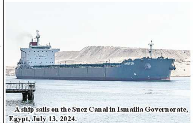
A ship sails on the Suez Canal in Ismailia Governorate, Egypt, July 13, 2024.