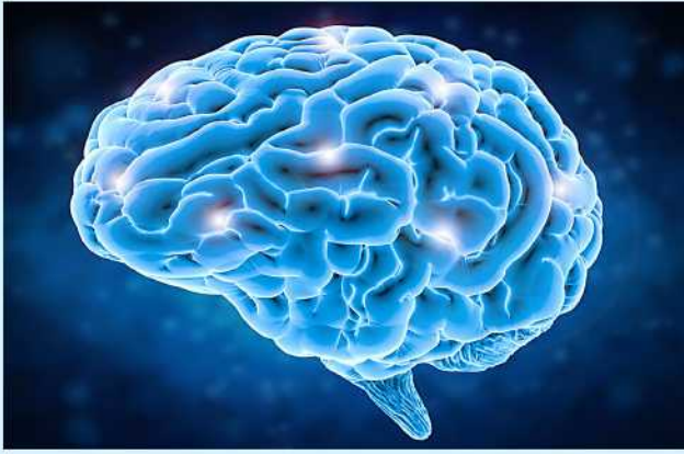
လမ်းလျှောက်ခြင်းဟာ မိမိ တို့ရဲ့ ဦးနှောက်တွေအတွက်

အကျိုးကျေးဇူးများစွာ ပေးစွမ်း ရှိတဲ့ စိတ်ဖိစီးမှုတွေ လျော့ကျ တယ်လို့ သုတေသနတစ်ခုမှာ လေ့လာတွေ့ရှိရပါတယ်။ ဖော်ပြထားပါတယ်။ ဒါ့အပြင် အဲဒီဟော်မုန်းက လမ်းလျှောက်တဲ့ အခါမှာ ဦးနှောက်ရဲ့ အလုံးစုံကျန်းမာရေး အန်ဒေါ့ဖင်လို့ခေါ်တဲ့ ဟော် မုန်းတစ်မျိုးထွက်ရှိမှု မြင့်တက် လာပါတယ်။ အဲဒီဟော်မုန်းက နာကျင်မှုဝေဒနာကို သက်သာ စေတဲ့ဟော်မုန်းပါ။ အန်ဒေါ့ဖင် ဟော်မုန်းထွက်ရှိလေ မိမိတို့မှာ လျော့ချပေးနိုင်ပါတယ်။