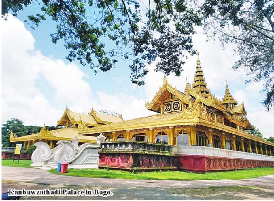
Kanbawzathadi Palace in Bago.