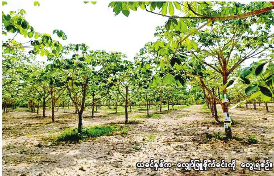
ယခင်နှစ်က လျှော်ဖြူစိုက်ပျိုးရေးကို တွေ့ရစဉ်။

စစ်ကိုင်း ရုအိုင် ၁၄ စစ်ကိုင်းတိုင်းဒေသကြီး စစ်ကိုင်းခရိုင်တွင် ယခုနှစ် မိုးသီးနှံ စိုက်ပျိုးရာသီ၌ လျှော်ဖြူ ၂၆၉၄ ဧက စိုက်ပျိုးပြီးစီးပြီဖြစ်ကြောင်း စစ်ကိုင်းခရိုင် စိုက်ပျိုးရေးဦးစီးဌာနမှ သိရသည်။ စစ်ကိုင်းခရိုင်တွင် မိုးသီးနှံ စိုက်ပျိုးရာသီ၌ လျှော်ဖြူ ၂၆၉၄ ဧက စိုက်ပျိုးရန် လျာထားပြီး