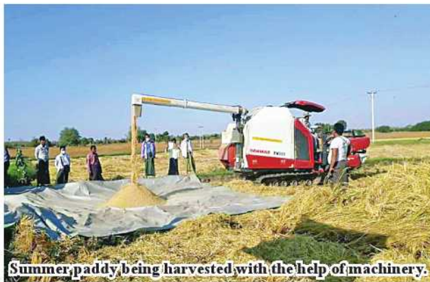
Summer paddy being harvested with the help of machinery.

Officials of relevant township agriculture department and local people joined hands