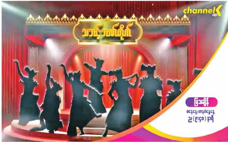
ပြသချိန် ၀၆:၄၅၊ ၀၉:၄၅၊ ၁၂:၄၅၊ ၃:၄၅၊ ၆:၄၅