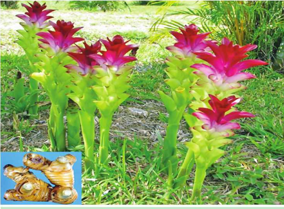
ဆေးဖက်ဝင် မာလာဖူးပင်ကို တွေ့ရစဉ်။

ရွှေရောင်လိဝင်းဝါနေသော ရွှေဖရုံသီးကို လူတော်တော်များများ စားသုံးလေ့ရှိသော်လည်း ရွှေဖရုံ ပင်၏အညွန့်(ဖရုံညွန့်)ကို စားသုံးဖူးသူနည်းသည်။ အကြောင်းမှာ ဖရုံညွန့်၊ ဖရုံရွက်က နုသောအညွန့် အခက်ကိုသာ စားသုံးရ၍ အတော်အတန် ရှားပါးသည် ဟုဆိုနိုင်သည်။ သို့သော် မိုးဥတုရောက်လျှင် ဖရုံညွန့် များ ဝေဝေဆာဆာ ထွက်လာလေ့ရှိရာ ဖရုံညွန့်ကြိုက် သူများအတွက် အခွင့်ကောင်းဖြစ်သည်။ နူးညံ့၍ အရသာချိုမြိန်ရသော ဖရုံအရွက်၊ ဖရုံညွန့်နှင့်အပွင့် တို့ကို ကြော်၍သော်လည်းကောင်း၊ ဟင်းချို၊ စွပ်ပြုတ်၊ အသုပ်သုပ်၍သော်လည်းကောင်း၊ ရေနွေးမြော၍