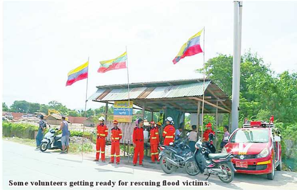
Some volunteers getting ready for rescuing flood victims.

Mandalay July 14 Water level of the Ayeyawady River at Mandalay Port exceeds the danger level, and departmental officials are ready to conduct search and rescue measures. The search and rescue teams formed in Mandalay Region have been ready to carry out rescue measures with the use of 32 motor schooners while local authorities inform local people about flooding information. "This morning, firefighters are serving sentry duties