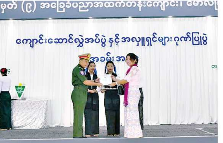
အရှေ့တောင်တိုင်းစစ်ဌာနချုပ် တိုင်းမှူး ဗိုလ်မှူးချုပ်ကျော်လင်းမောင် အလှူရှင်တစ်ဦးကို ဂုဏ်ပြုမှတ်တမ်းလွှာပေးအပ်စဉ်။

နေပြည်တော် ၇ ဇူလိုင် ၁၄ - မွန်ပြည်နယ် မော်လမြိုင်မြို့ အမှတ်(၉) အခြေခံပညာ အထက်တန်းကျောင်း၊ ကျောင်းဆောင်သစ်လွှဲအပ်ပွဲကို ယနေ့နံနက်ပိုင်းတွင် အဆိုပါကျောင်းရှိဦးသာညွှန်းဆောင်၌ပြုလုပ်ရာ ပြည်နယ်ဝန်ကြီးချုပ်ဦးအောင်ကြည်သိန်း၊ အရှေ့တောင်တိုင်းစစ်ဌာနချုပ် တိုင်းမှူး ဗိုလ်မှူးချုပ်ကျော်လင်းမောင်နှင့် ဌာနဆိုင်ရာ တာဝန်ရှိသူများ၊ အလှူရှင်များ၊ ဆရာ၊ ဆရာမများ၊ ကျောင်းသား၊ ကျောင်းသူများ၊ ကျောင်းအကျိုးတော်ဆောင်များ၊ မိဘအုပ်ထိန်းသူများနှင့် ဖိတ်ကြားထားသူများ တက်ရောက်ကြသည်။ ဦးစွာ ပြည်နယ်ဝန်ကြီးချုပ်၊ တိုင်းမှူးနှင့် တာဝန်ရှိသူများက ကျောင်းဆောင်သစ်ကို ဖဲကြိုးဖြတ်ဖွင့်လှစ်ပေးပြီး ကမ္ဘာ့ပတ်ဝန်းကျင်ထိန်းသိမ်းရေးအဖွဲ့မှ အမွေအနှစ်သားများကို ပတ်ဖျန်းပေးကြသည်။ ထို့နောက် ကျောင်းသား၊ ကျောင်းသူများက ပြန်မာ့ကျောင်းသီချင်းဖြင့် သီဆိုဖျော်ဖြေကြသည်။ ၎င်းနောက် ပြည်နယ်ဝန်ကြီးချုပ်က အဖွင့်အမှာစကားပြောကြားပြီး ကျောင်းအကျိုးတော်ဆောင်နာယကက အဆောက်အအုံနှင့်ပတ်သက်၍ ရှင်းလင်းပြောကြားကာ ကျောင်းအုပ်ဆရာမကြီးက ကျေးဇူးတင်စကားပြန်လည်ပြောကြားသည်။ ထို့နောက် ကျောင်းဆောင်သစ်ကို ကျောင်းအကျိုးတော်ဆောင်အဖွဲ့မှ ပညာရေးဌာနသို့ လွှဲပြောင်းပေးအပ်ရာ တာဝန်ရှိသူများက လက်ခံရယူကြသည်။ ယင်းနောက် ပြည်နယ်ဝန်ကြီးချုပ်၊ တိုင်းမှူးနှင့် တာဝန်ရှိသူများက အလှူရှင်များကို ဂုဏ်ပြုမှတ်တမ်းလွှာများပေးအပ်ကြပြီး ကျောင်းသား၊ ကျောင်းသူများ၏ သီဆိုဖျော်ဖြေမှုများကို ကြည့်ရှုအားပေးကာ စုပေါင်းဓာတ်ပုံရိုက်ခဲ့ကြကြောင်း သတင်းရရှိသည်။ (၅၀၀)