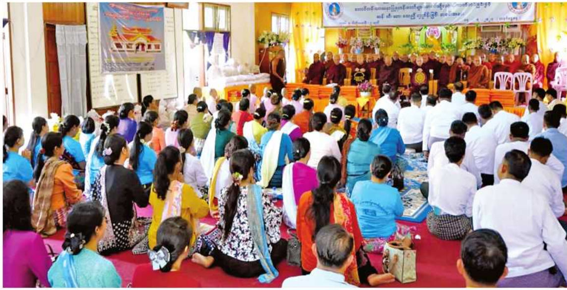
ကျိုင်းတုံမြို့ ရပ်တော်မူထေရဝါဒ ဗုဒ္ဓသာသနာပြု(ဗဟို)ကျောင်း၌ သံဃာတော်များအား ဝါဆိုသင်တန်းဆက်ကပ်ခြင်းနှင့် လှူဖွယ်ပစ္စည်းများ ဆက်ကပ်လှူဒါန်းပွဲကျင်းပစဉ်။