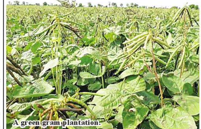
A green gram plantation.

“At a time when Ayeyawady River has high water level, it may cause high current and whirlpools. Hence, vessels should not cross the whirlpools. They have to check their engine power and current speed in travelling,” he noted. 184