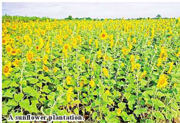
A sunflower plantation.