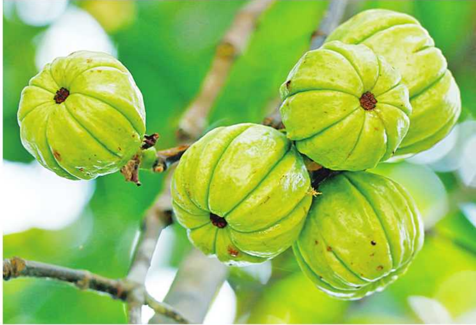
ဆေးဖက်ဝင် မက်လင်ချဉ်သီးကို တွေ့ရစဉ်။

တိုင်းရင်းဆေးတွင် အိမ်သုံးဆေးအဖြစ် အသုံးများသော ဆေးအမှတ်(၁)သေမှပုတိက သလိပ်ပုပ်ပျောက်ဆေးကို လူသိများသောအရပ်ခေါ်အမည် “မက်လင်ချဉ်” ဆေးဖြစ်သည်။ အချို့ကလည်း ချဉ်ပြုံးပြုံးဖြင့် လျက်ကောင်းသောဆေးဖြစ်သဖြင့် “မက်လင်ချဉ်လျက်ဆား” ဟုလည်း ခေါ်ဝေါ်ကြသည်။