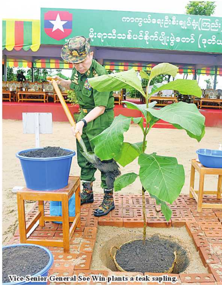
Vice-Senior General Soe Win plants a teak sapling.