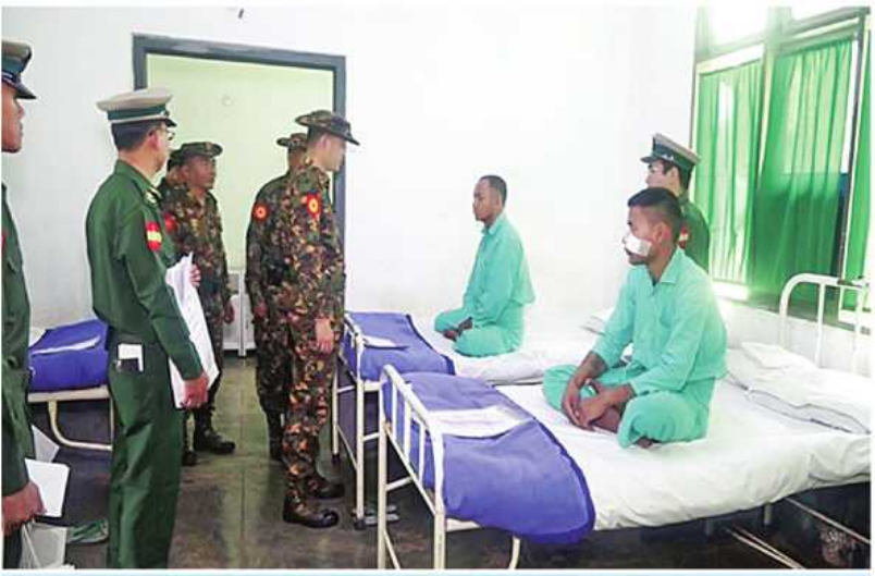
အရှေ့ပိုင်းတိုင်းစစ်ဌာနချုပ် တိုင်းမှူး ဗိုလ်ချုပ်ဇော်မင်းလတ် ဆေးကုသမှုခံယူနေသူများကို ရင်းရင်းနှီးနှီးမေးမြန်းအားပေးစကားပြောကြားစဉ်။

နေပြည်တော် ဇူလိုင် ၁၂ ကယားပြည်နယ် လွိုင်ကော်မြို့ရှိ တပ်မတော်ဆေးရုံ၊ ရှမ်းပြည်နယ်(တောင်ပိုင်း) ခိုလှုံမြို့ရှိ တပ်မတော်ဆေးရုံ၊ မွန်ပြည်နယ် မော်လမြိုင်မြို့ရှိ တပ်မတော်ဆေးရုံ၊ ရန်ကုန်တိုင်းဒေသကြီး မင်္ဂလာဒုံမြို့နယ်ရှိ တပ်မတော်အစိုးရောဂါအထူးကုဆေးရုံကြီး (ခုတင်-၅၀၀)နှင့် တပ်မတော်ဆေးရုံကြီး(ခုတင်-၁၀၀၀)၊ ရောဂါတိုင်းဒေသကြီး ပုသိမ်မြို့ရှိ နယ်မြေခံဆေးတပ်ရင်း၊ပဲခူးတိုင်းဒေသကြီး တောင်ငူမြို့နှင့် ပြည်မြို့တို့ရှိ တပ်မတော်ဆေးရုံများ၌ တက်ရောက်ဆေးကုသမှု ခံယူနေသော သံယာတော်များ၊ အရာရှိ၊ စစ်သည်၊ မိသားစုဝင်များ၊ ပြည်သူ့စစ်(ဌာန)တပ်ဖွဲ့ဝင်များ၊ စစ်မှုထမ်းတောင်းအဖွဲ့ဝင်များ၊