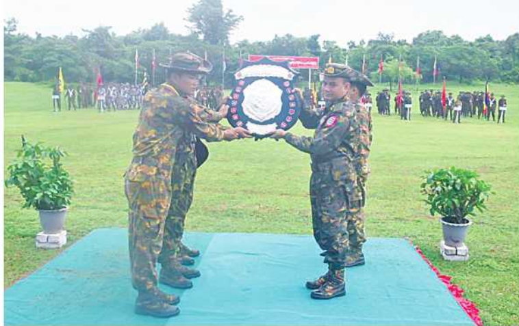
အနောက်တောင်တိုင်းစစ်ဌာနချုပ် တိုင်းမှူး ခိုင်းချုပ်ဝေလင်း ဟင်္သာတ တပ်နယ်အသင်းကို ခိုင်းဆုပေးအပ်ရုံဖြင့်စဉ်။

နေပြည်တော် ရူလိုင် ၁၂ အနောက်တောင် တိုင်းစစ်ဌာနချုပ် ၂၀၂၄ ခုနှစ် တိုင်းမှူးတံခွန်စိုက်ခိုင်း သေနတ်ပစ်ပြိုင်ပွဲဆုပေးပွဲကို ယနေ့နံနက်ပိုင်းတွင် နယ်မြေခံသင်တန်းကျောင်း