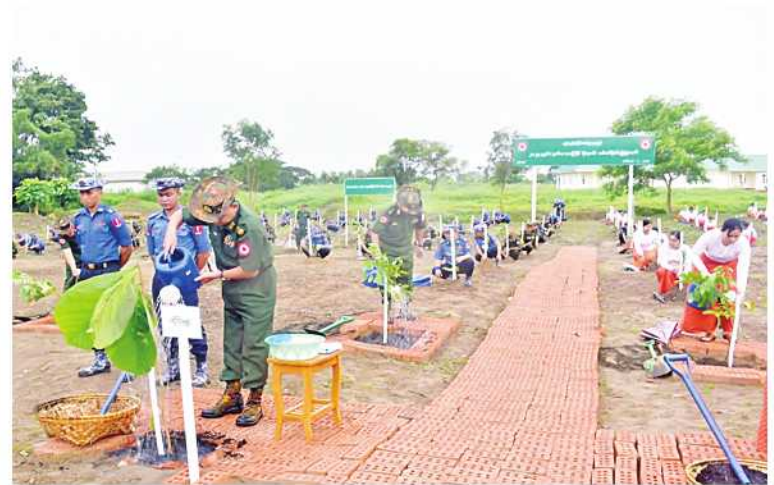
ရန်ကုန်တိုင်းစစ်ဌာနချုပ်၌ ၂၀၂၄ ခုနှစ် ဒုတိယအကြိမ် မိုးရာသီသစ်ပင်စိုက်ပျိုးပွဲ ကျင်းပစဉ်။

တပ်မတော်တစ်ရပ်လုံးအနေဖြင့် ယနေ့တွင် စုစုပေါင်းသစ်ပင် ၁၆၂၅၂၀ ကို စုပေါင်းစိုက်ပျိုးပေးနိုင်ခဲ့