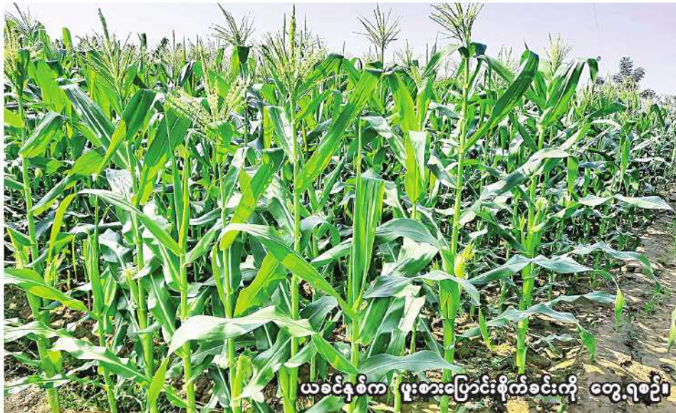
ယခင်နှစ်က ဖူးစားပြောင်းစိုက်ခင်းကို တွေ့ရစဉ်။