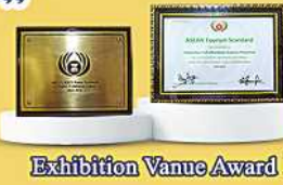
Exhibition Vanue Award