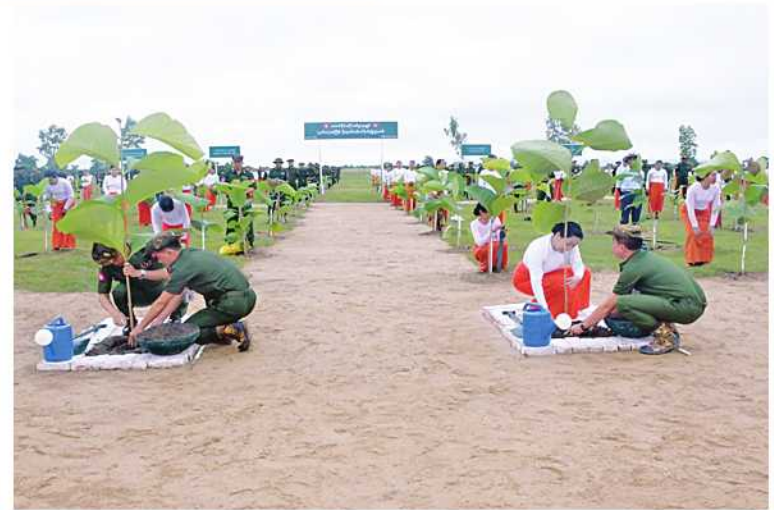
တောင်ပိုင်းတိုင်းစစ်ဌာနချုပ်၌ ၂၀၂၄ ခုနှစ် ဒုတိယအကြိမ် မိုးရာသီသစ်ပင်စိုက်ပျိုးပွဲ ကျင်းပစဉ်။

နိုင်ငံ့ဝန်ထမ်းများအား မည်သည့်နည်းလမ်းဖြင့်မဆို ခြိမ်းခြောက်ခြင်း၊ တာဝန်ထမ်းဆောင်မှုအား နှောင့်ယှက်ခြင်းများ ဆောင်ရွက်ပါက တည်ဆဲဥပဒေများနှင့်အညီ အရေးယူခံရနိုင်ပါသည်။