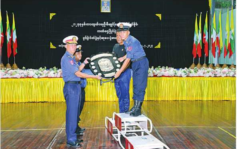
ကာကွယ်ရေးဦးစီးချုပ်(ရေ)ကိုယ်စား ရောဂါတိုင်းဒေသကြီးစခန်းဌာနချုပ် ဌာနချုပ်မှူး ဝိုင်းလှပွဲနှင့် ဆုပေးပွဲအသင်းကို ခိုင်းဆုပေးအပ်ချီးမြှင့်စဉ်။

ထွန်းတင်ခန်းမ၌ ပြုလုပ်ရာ ကာကွယ်ရေးဦးစီးချုပ်(ရေ)ကိုယ်စား ရောဂါတိုင်းဒေသကြီး စခန်းဌာနချုပ် ဌာနချုပ်မှူး ဝိုင်းလှပွဲနှင့် ဆုပေးပွဲကို ယနေ့ညနေပိုင်းတွင် ရောဂါတိုင်းဒေသကြီး သီဟသူရ