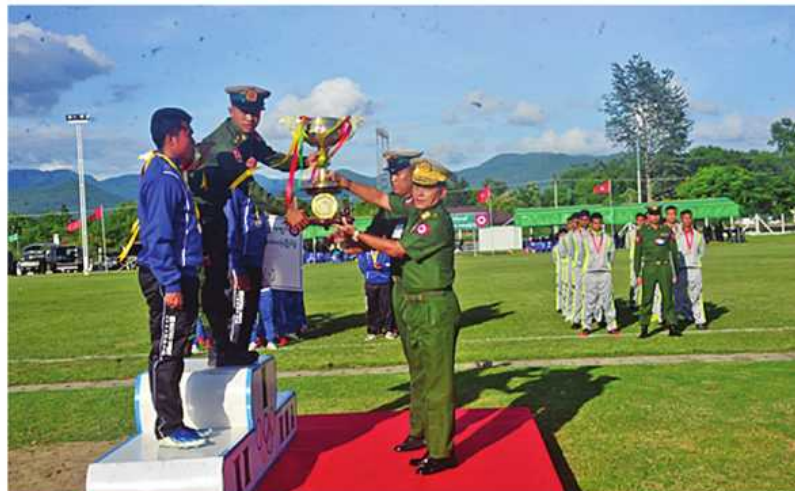
နေပြည်တော်တိုင်းစစ်ဌာနချုပ် တိုင်းမှူး ဗိုလ်ချုပ်ဇော်မင်း တံခွန်စိုက်ဖလားရရှိသည့်အသင်းကို တံခွန်စိုက်ဖလားပေးအပ်ချီးမြှင့်စဉ်။

နေပြည်တော် ဇူလိုင် ၁၂ နေပြည်တော်တိုင်း စစ်ဌာနချုပ် ၂၀၂၄ ခုနှစ် တိုင်းမှူးဖလားဘောလုံးပြိုင်ပွဲ ဝိုင်းလှပွဲနှင့် ဆုပေးပွဲကို ယနေ့ညနေပိုင်းတွင် နေပြည်တော်ကောင်စီနယ်မြေ လေယာဇာနည်မြို့နယ်ရှိ လေယာဇာနည်အားကစားကွင်း၌ ပြုလုပ်ရာ တိုင်းမှူး ဗိုလ်ချုပ်ဇော်မင်းနှင့် အရာရှိ စစ်သည်၊ မိသားစုများ၊ ဒိုင်အဖွဲ့ဝင်များ၊ ပြိုင်ပွဲဝင်အသင်းများနှင့် အားကစားဝါသနာရှင်များ တက်ရောက်ကြသည်။ ဦးစွာ တိုင်းမှူးနှင့် တက်ရောက်လာကြသူများက ပြိုင်ပွဲဝင်အသင်းများ၏ဝိုင်းလှပွဲပွဲစဉ် ယှဉ်ပြိုင်ကစားမှုများကို ကြည့်ရှုအားပေးကြသည်။ ထို့နောက် ဆုပေးပွဲကို ဆက်လက်ပြုလုပ်ရာ ဒိုင်အဖွဲ့ဝင်များ၊ တစ်ဦးချင်းဆုရရှိကြသူများ၊ အသင်းလိုက်ဆုရရှိကြသူများနှင့် တံခွန်စိုက်ဖလားရရှိသော အသင်းတို့ကို တိုင်းမှူးနှင့်တာဝန်ရှိသူများက တံခွန်စိုက်ဖလား၊ ဆင့်ပွားဖလားနှင့် ဂုဏ်ပြုဆုများ အသီးသီးပေးအပ်ချီးမြှင့်ကြသည်။ အဆိုပါဘောလုံးပြိုင်ပွဲကို တိုင်းစစ်ဌာနချုပ်ကွပ်ကဲမှုအောက် တပ်ရင်းတပ်ဖွဲ့များမှ ပြိုင်ပွဲဝင်အသင်း ၁၂ သင်းဖြင့် ဇွန် ၂၈ ရက်မှ ယနေ့ထိ ကျင်းပပြုလုပ်ခဲ့ခြင်းဖြစ်ကြောင်း သတင်းရရှိသည်။ (၅၀၁)