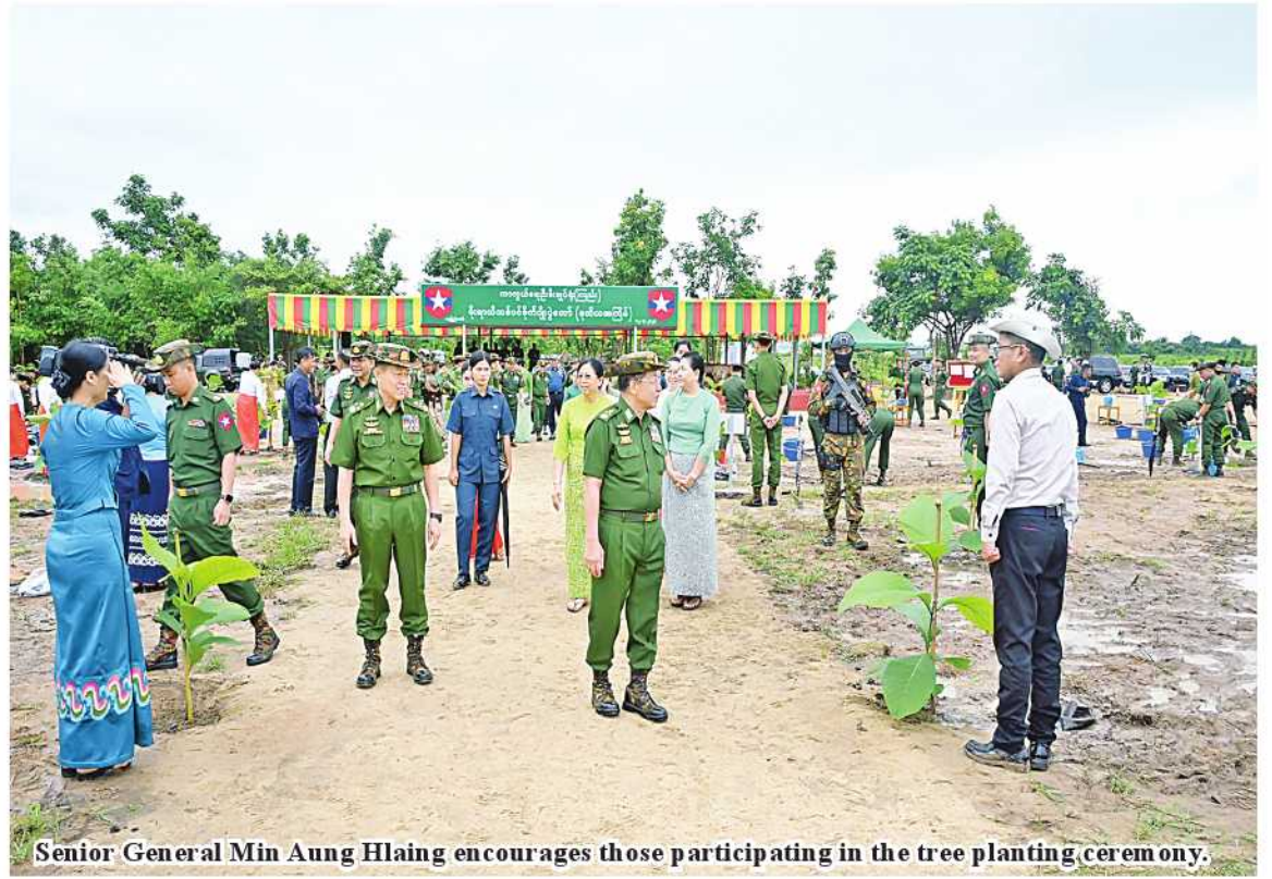
Senior General Min Aung Hlaing encourages those participating in the tree planting ceremony.

Nay Pyi Taw July 12 Families of Office of Commander-in-Chief (Army, Navy and Air) and all military commands are planting trees in large groups at the monsoon tree-planting ceremonies held since