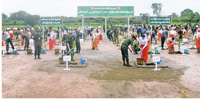
အနောက်တောင်တိုင်းစစ်ဌာနချုပ်၌ ၂၀၂၄ ခုနှစ် ဒုတိယအကြိမ် မိုးရာသီသစ်ပင်စိုက်ပျိုးပွဲ ကျင်းပစဉ်။

တိုင်းစစ်ဌာနချုပ်၌ ၁၁၃၁၃ ပင်၊ ကမ်းရိုးတန်းဒေသတိုင်းစစ်ဌာနချုပ်၌ ၉၈၄၃ ပင်၊ ရန်ကုန်တိုင်းစစ်ဌာနချုပ်၌ ၁၅၂၄၁ ပင်၊ အနောက်တောင်တိုင်းစစ်ဌာနချုပ်၌ အပင် ၅၄၉၀၊ အနောက်ပိုင်းတိုင်းစစ်ဌာနချုပ်၌ အပင် ၄၆၄၀၊ အနောက်မြောက်တိုင်းစစ်ဌာနချုပ်၌ ၁၂၆၆၇ ပင်၊ အလယ်ပိုင်းတိုင်းစစ်ဌာနချုပ်၌ ၃၄၃၁၅ ပင်နှင့် တောင်ပိုင်းတိုင်းစစ်ဌာနချုပ်၌ ၁၅၃၅၂ ပင်တို့ကို တိုင်းပွားများနှင့် တာဝန်ရှိသူများက စုပေါင်းစိုက်ပျိုးခဲ့ကြပြီး ယနေ့တွင် တပ်မတော်အနေဖြင့် ကာကွယ်ရေးဦးစီးချုပ်ရုံး(ကြည်း၊ ရေ၊ လေ) မိသားစုဝင်များအပါအဝင် တိုင်းစစ်ဌာနချုပ်အသီးသီးနှင့် တပ်ရင်း၊ တပ်ဖွဲ့များ၌ စုစုပေါင်း သစ်ပင် ၁၆၂၅၂၀ ကို စိုက်ပျိုးခဲ့ကြကြောင်း သတင်းရရှိသည်။ (၅၀၁)