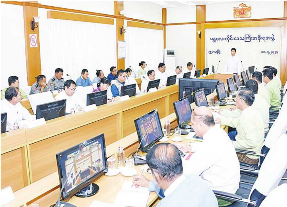
မန္တလေး ဇူလိုင် ၁၂

၂၀၂၄ ခုနှစ် (၂၅)ကြိမ်မြောက် မြန်မာ့ရိုးရာယဉ်ကျေးမှု အဆို၊ အက၊ အရေး၊ အတီးပြိုင်ပွဲ(ပဟိုအဆင့်)၌ မန္တလေးတိုင်းဒေသကြီးကိုယ်စားပြု ပါဝင်ယှဉ်ပြိုင်နိုင်ရေးနှင့် တိုင်းဒေသကြီးအဆင့်ပြိုင်ပွဲအတွက် ပထမအကြိမ် လုပ်ငန်းညှိနှိုင်းအစည်းအဝေးကို ဇူလိုင် ၁၁ ရက် မွန်းလွဲပိုင်းက မန္တလေးတိုင်းဒေသကြီးအစိုးရအဖွဲ့ရုံး အစည်းအဝေးခန်းမတွင် ကျင်းပသည်။ အဆိုပါ အစည်းအဝေးသို့ (၂၅)ကြိမ်မြောက် မြန်မာ့ရိုးရာယဉ်ကျေးမှု အဆို၊ အက၊ အရေး၊ အတီးပြိုင်ပွဲကျင်းပရေးဦးစီးကော်မတီဥက္ကဋ္ဌ မန္တလေးတိုင်းဒေသကြီးဝန်ကြီးချုပ်ဦးမျိုးအောင်၊ တိုင်းဒေသကြီးဝန်ကြီးများ၊ ပြိုင်ပွဲကျင်းပရေးဦးစီးကော်မတီ၊ ဆပ်ကော်မတီမှ တာဝန်ရှိသူများနှင့် ဖိတ်ကြားထားသူများ တက်ရောက်ကြသည်။