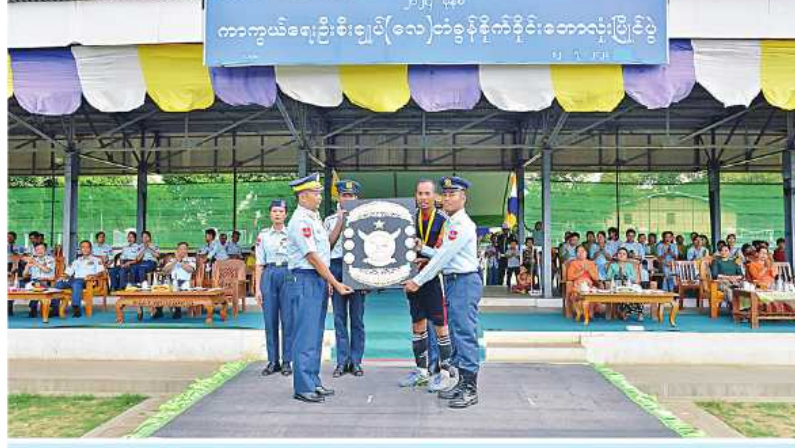
ကာကွယ်ရေးဦးစီးချုပ်(လေ)ကိုယ်စား လေကြောင်းအတတ်သင်လေတပ်စခန်းဌာနချုပ် ဌာနချုပ်မှူး ဝိုင်းလှပွဲနှင့် ဆုပေးပွဲအသင်းကို ခိုင်းဆုပေးအပ်ချီးမြှင့်စဉ်။

နေပြည်တော် ဇူလိုင် ၁၂ ၂၀၂၄ ခုနှစ် ကာကွယ်ရေးဦးစီးချုပ်(လေ) တံခွန်စိုက်ခိုင်း ဘောလုံးပြိုင်ပွဲဝိုင်းလှပွဲနှင့် ဆုပေးပွဲကို ယနေ့ညနေပိုင်းတွင် မန္တလေးတိုင်းဒေသကြီး မိတ္ထီလာမြို့ရှိ မြေပြင်အတတ်သင် လေတပ်စခန်းဌာနချုပ်၌ ကျင်းပပြုလုပ်ရာ လေကြောင်းအတတ်သင်လေတပ်စခန်းဌာနချုပ် ဌာနချုပ်မှူး ဝိုင်းလှပွဲနှင့် ဆုပေးပွဲကို ဆက်လက်ပြုလုပ်ရာ ဒိုင်အဖွဲ့ဝင်များ၊ တစ်ဦးချင်းဆုရရှိကြသူများ၊ အသင်းလိုက်ဆုရရှိကြသူများနှင့် ခိုင်းဆုရရှိသည့် လေကြောင်းအတတ်သင် လေတပ်စခန်းဌာနချုပ်ဘောလုံးအသင်းတို့ကို ကာကွယ်ရေးဦးစီးချုပ်(လေ)ကိုယ်စား လေကြောင်းအတတ်သင်လေတပ်စခန်းဌာနချုပ် ဌာနချုပ်မှူးနှင့် တာဝန်ရှိသူများက ခိုင်းဆုနှင့်ဂုဏ်ပြုဆုများ အသီးသီးပေးအပ်ချီးမြှင့်ကြသည်။ အဆိုပါ ၂၀၂၄ ခုနှစ် ကာကွယ်ရေးဦးစီးချုပ်(လေ) တံခွန်စိုက်ခိုင်း ဘောလုံးပြိုင်ပွဲကို လေတပ်စခန်းဌာနချုပ်နှင့် လေတပ်စခန်းအသီးသီးတို့မှ ပြိုင်ပွဲဝင်အသင်း ၁၂ သင်းတို့ဖြင့် ဇွန် ၂၈ ရက်မှ ယနေ့ထိ ယှဉ်ပြိုင်ကစားခဲ့ခြင်းဖြစ်ကြောင်း သတင်းရရှိသည်။ (၅၀၁)