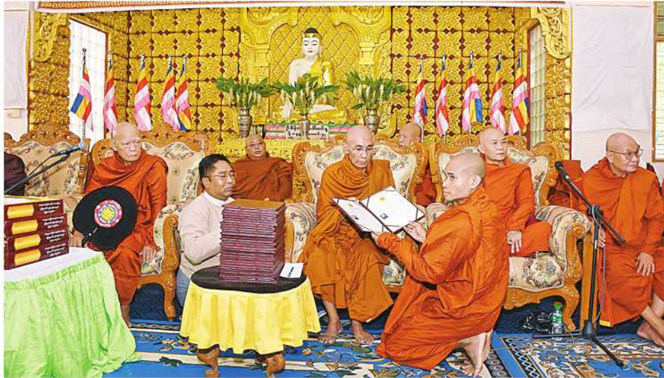
မန္တလေး ရူလိုင် ၁၂

မန္တလေးတိုင်းဒေသကြီးဝန်ကြီးချုပ် ဦးမျိုးအောင်သည် တိုင်းဒေသကြီးဝန်ကြီးများနှင့် တာဝန်ရှိသူများ လိုက်ပါပြီး ယနေ့နံနက်ပိုင်းက အောင်မြေသာစံမြို့နယ် ရှိ မန္တလေးတိုင်းဒေသကြီး ကျောင်းထိုင်ဘုန်းကြီး သင်တန်းကျောင်းသို့ ရောက်ရှိပြီး ကျောင်းအုပ်ဆရာ တော် အဂ္ဂမဟာပဏ္ဍိတ ဘဒ္ဒန္တကေသဝအား ဖူးမြော်၍ လှူဖွယ်ပစ္စည်းများ ဆက်ကပ်လှူဒါန်းသည်။