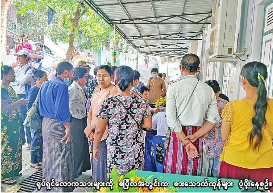
ရပ်ရှင်လောကသားများကို ပြေလအတွင်းက စားသောက်ကုန်များ ပံ့ပိုးနေစဉ်။

ရန်ကုန် ရုလိုင် ၁၂ မြန်မာနိုင်ငံ ရပ်ရှင်အစည်းအရုံးက ရပ်ရှင်လောကသားများကို (၁၅) ကြိမ်မြောက်အဖြစ် ဆန်၊ ဆီ၊ ပဲ အပါအဝင် စားသောက်ကုန်များ ပံ့ပိုးသွားမည်ဖြစ်ကြောင်း