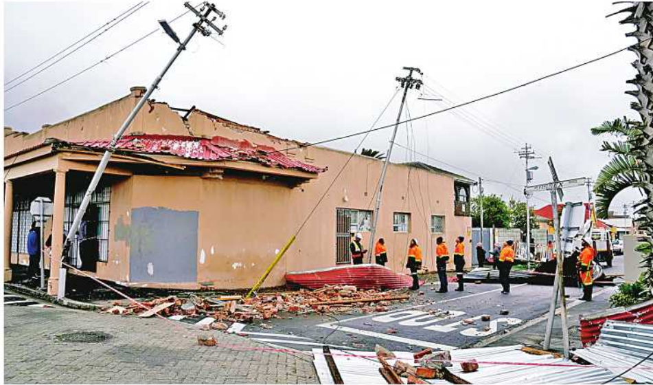
ပရိတိုးရီးယား ဇူလိုင် ၁၂

တောင်အာဖရိကနိုင်ငံ ကိပ်တောင်းမြို့တွင် ဇူလိုင် ၁၁ ရက် အစောပိုင်းက အားကောင်းသည့် မုန်တိုင်းတိုက်ခတ်မှု ဖြစ်ပွားခဲ့ပြီး လေတိုက်နှုန်း ပြင်းထန်ခဲ့သောကြောင့် လူနေအိမ်တချို့ပျက်စီးခဲ့ကြောင်း တောင်အာဖရိကအာဏာပိုင်အဖွဲ့အစည်းက ထုတ်ပြန်ခဲ့သည်။