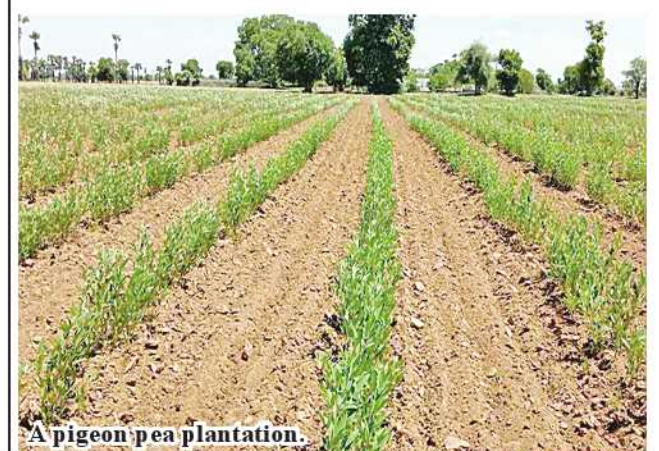
A pigeon pea plantation.

The department has issued relevant insemination equipment for cattle in 11 districts. Technicians and veterinarians perform the insemination in villages. 185