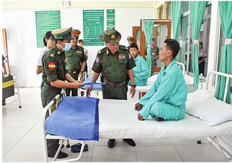
အရှေ့တောင်တိုင်းစစ်ဌာနချုပ် တိုင်းမှူး ဗိုလ်မှူးချုပ်ကျော်လင်းမောင် ဆေးကုသမှုခံယူနေသူများကို ရင်းရင်းနှီးနှီးမေးမြန်းအားပေးစကားပြောကြားစဉ်။

မြန်မာနိုင်ငံရဲ့တပ်ဖွဲ့ဝင်များနှင့်ဒေသခံပြည်သူများကို ဇူလိုင် ၁၁ ရက်နှင့် ယနေ့တို့တွင် သက်ဆိုင်ရာတိုင်းစစ်ဌာနချုပ်အသီးသီးမှ တိုင်းမှူးများနှင့် တာဝန်ရှိသူများက သွားရောက်ကြည့်ရှု၍ တစ်ဦးချင်း၏ရောဂါဖြစ်ပွားမှု၊ဆေးဝါးကုသပေးထားမှုနှင့် ကျန်းမာရေးတိုးတက်ကောင်းမွန်မှုအခြေအနေများကို ရင်းရင်းနှီးနှီးမေးမြန်းအားပေးစကားပြောကြားပြီး အာဟာရဖြည့်စားသောက်ဖွယ်ရာများနှင့်ထောက်ပံ့ငွေများ ပေးအပ်ကြသည်။ ထို့နောက် တိုင်းမှူးများနှင့် တာဝန်ရှိသူများသည် ဆေးရုံများအတွင်း လှည့်လည်ကြည့်ရှု၍ လိုအပ်သည်များ ညှိနှိုင်းဆောင်ရွက်ပေးခဲ့ကြကြောင်း သတင်းရရှိသည်။ (၅၀၁)