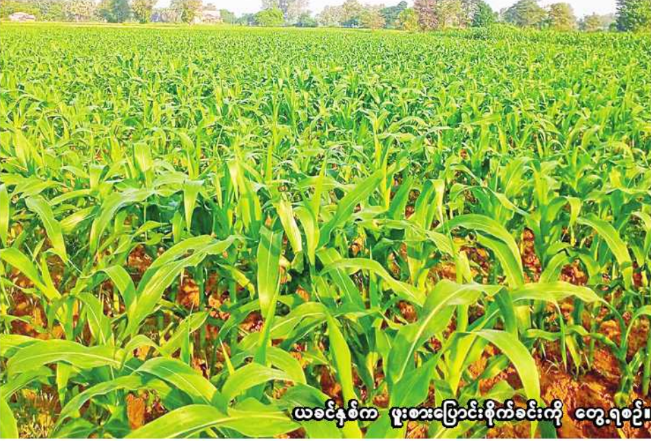
ယခင်နှစ်က ဖူးစားပြောင်းစိုက်ခင်းကို တွေ့ရစဉ်။