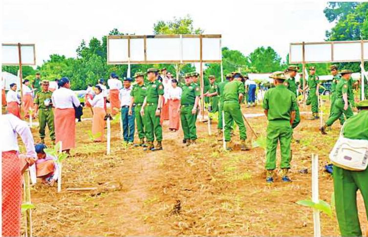
အရှေ့အလယ်ပိုင်းတိုင်းစစ်ဌာနချုပ်၌ ၂၀၂၄ ခုနှစ် ဒုတိယအကြိမ် မိုးရာသီသစ်ပင်စိုက်ပျိုးပွဲ ကျင်းပစဉ်။

ရေဆင်းဆည်ပတ်ဝန်းကျင်၌ သဘာဝပတ်ဝန်းကျင်နှင့် ဂေဟစနစ်ထိန်းသိမ်းရေးအတွက် ကာကွယ်ရေးဦးစီးချုပ်ရုံး (ကြည်း၊ ရေ၊ လေ) မိသားစုများအနေဖြင့် ၂၀၁၁ ခုနှစ်မှ ၂၀၂၄ ခုနှစ် ဒုတိယအကြိမ် သစ်ပင်စိုက်ပျိုးပွဲထိ သစ်ပင်စိုက်ပျိုးပွဲတော် စုစုပေါင်း အကြိမ် ၄၀ ကျင်းပပြုလုပ်၍ ရတနာတန်းဝင်ပင်၊ နှစ်ရှည်သီးနှံပင်နှင့် အရိပ်ရလေကာပင် စုစုပေါင်း ၁၉၈၅၅ ပင်ကို စိုက်ပျိုးခဲ့ပြီးဖြစ်သည်။