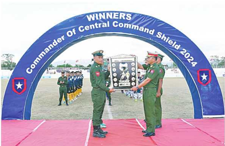
အလယ်ပိုင်းတိုင်းစစ်ဌာနချုပ်မှ တာဝန်ရှိသူတစ်ဦးက ခိုင်းဆုရရှိသည့်အသင်းကို ခိုင်းဆုပေးအပ်ရုံဖြင့်စဉ်။

နေပြည်တော် ရူလိုင် ၁၂ အလယ်ပိုင်းတိုင်းစစ်ဌာနချုပ် ၂၀၂၄ ခုနှစ် တိုင်းမှူးခိုင်းဘောလုံးပြိုင်ပွဲ ပိုလ်လုပွဲနှင့်ဆုပေးပွဲကို ယနေ့မနက်တွင် မင်းမန္တလာအားကစားကွင်း၌ ပြုလုပ်ရာ တပ်နယ်မှ တာဝန်ရှိသူများ၊ အရာရှိ၊ စစ်သည်၊ မိသားစုများ၊ ခိုင်အဖွဲ့ဝင်များ၊ ပြိုင်ပွဲဝင် အားကစားသမားများနှင့် အားကစားဝါသနာရှင်များ တက်ရောက်ကြသည်။ ဦးစွာ တက်ရောက်လာကြသူများက ပိုလ်လုပွဲ ပွဲစဉ်ဖြစ်သည့် မန္တလေးတပ်နယ်မှ ပြိုင်ပွဲဝင်အသင်း ၁၂ သင်းဖြင့် ရွန် ၂၈ ရက်မှ ယနေ့ထိ ကျင်းပပြုလုပ်ခဲ့ခြင်းအသင်းနှင့် ပြင်ဦးလွင်တပ်နယ်အသင်းတို့ ဖြစ်ကြောင်း သတင်းရရှိသည်။ (၅၀၁)