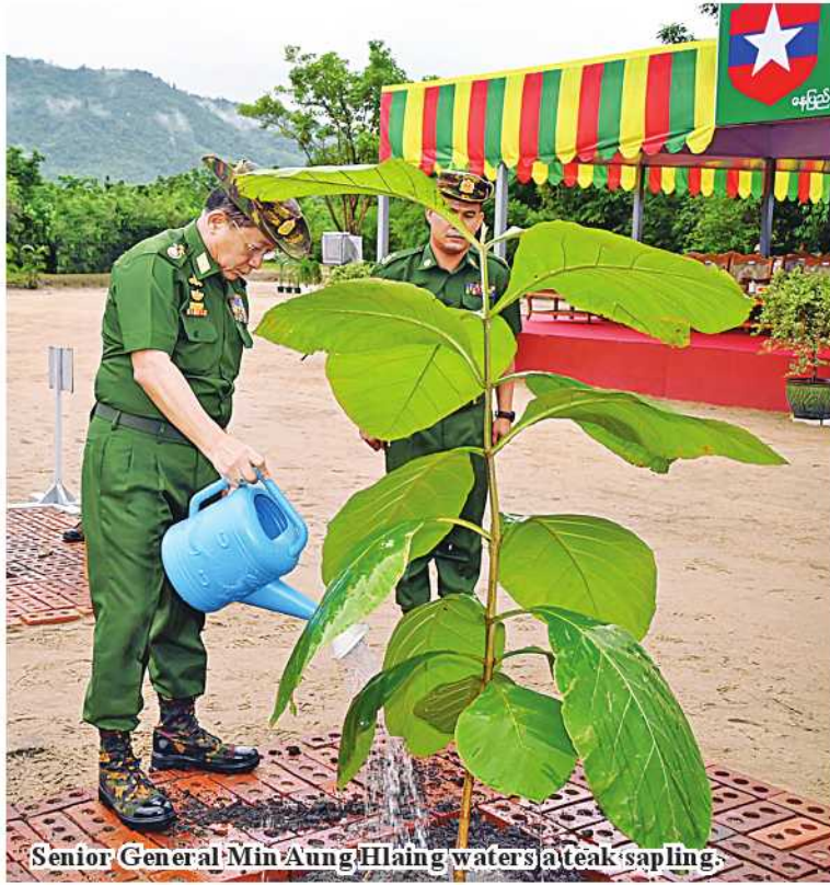
Senior General Min Aung Hlaing waters a teak sapling.