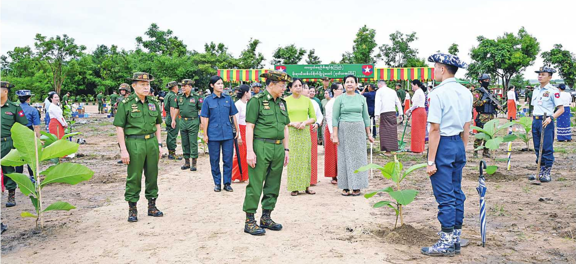
နိုင်ငံတော်စီမံအုပ်ချုပ်ရေးကောင်စီဥက္ကဋ္ဌ တပ်မတော်ကာကွယ်ရေးဦးစီးချုပ် ဗိုလ်ချုပ်မှူးကြီးမင်းအောင်လှိုင်နှင့် ဇနီး ဒေါ်ကြူကြူလှ၊ အဖွဲ့ဝင်များက အရာရှိ၊ စစ်သည်၊ မိသားစုများ၏ စုပေါင်းသစ်ပင်စိုက်ပျိုးနေမှုကို လှည့်လည်ကြည့်ရှုအားပေးစဉ်။

နေပြည်တော် ဇူလိုင် ၁၂ အကူဖြစ်စေရန်၊ အရိပ်အာဝါသရရှိ ရည်ရွယ်၍ ကာကွယ်ရေးဦးစီးချုပ်ရုံး ၂၀၁၁ ခုနှစ်မှစ၍ နှစ်စဉ် မိုးရာသီ ယနေ့တွင် ၂၀၂၄ ခုနှစ် ကာကွယ်ရေး သဘာဝပတ်ဝန်းကျင်အား ထိန်းသိမ်း စေရန်၊ နိုင်ငံစီးပွားရေးအတွက် တစ်ဖက် (ကြည်း၊ ရေ၊ လေ) မိသားစုများနှင့် တစ်အုပ်တစ်မ သစ်ပင်စိုက်ပျိုးပွဲများ ပြီးစီးချုပ်ရုံး (ကြည်း၊ ရေ၊ လေ) မိသားစု နိုင်စေရန်နှင့် ရာသီဥတုကို အထောက် တစ်လမ်းမှ အထောက်အကူဖြစ်စေရန် တိုင်းစစ်ဌာနချုပ် အသီးသီးတွင် ကျင်းပပြုလုပ်လျက်ရှိသည်။ များ၏ စာမျက်နှာ ၁၆ ကော်လံ ၁၂၁