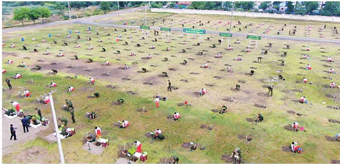
အလယ်ပိုင်းတိုင်းစစ်ဌာနချုပ်၌ ၂၀၂၄ ခုနှစ် ဒုတိယအကြိမ် မိုးရာသီသစ်ပင်စိုက်ပျိုးပွဲ ကျင်းပစဉ်။