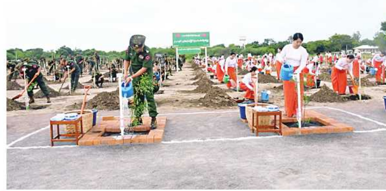
အနောက်မြောက်တိုင်းစစ်ဌာနချုပ်၌ ၂၀၂၄ ခုနှစ် ဒုတိယအကြိမ် မိုးရာသီသစ်ပင်စိုက်ပျိုးပွဲ ကျင်းပစဉ်။