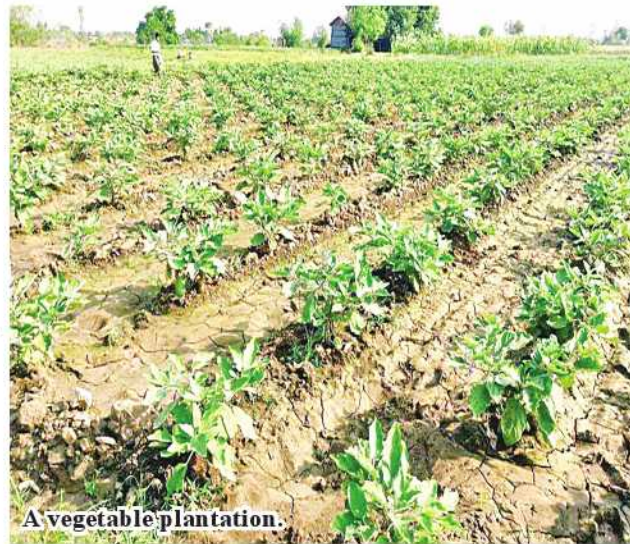
A vegetable plantation.