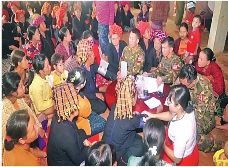
အရှေ့ပိုင်းတိုင်းစစ်ဌာနချုပ် နယ်လှည့်ဆေးကုသရေးအဖွဲ့က ဒေသခံပြည်သူများကို ကျန်းမာရေးစောင့်ရှောက်မှုလုပ်ငန်းများ ဆောင်ရွက်ပေးစဉ်။

ကုသရေးအဖွဲ့က ဒေသခံပြည်သူဦးရေ ၂၀၀ တို့ကို သွေးတိုးရောဂါ၊ ဆီးချိုရောဂါ၊ ဆီးကျောက်တည်ရောဂါ၊ အရေပြားရောဂါ၊ ခါးနာရောဂါ၊ အထွေထွေရောဂါတို့နှင့် ပတ်သက်၍ လိုအပ်သည့် ကျန်းမာရေး စစ်ဆေးကုသပေးခြင်းများ ဆောင်ရွက်ပေးပြီး ဆေးရုံတက်ရောက်ကုသရန် လိုအပ်သောလူနာများအား နယ်မြေခံတပ်မတော်ဆေးရုံသို့ တက်ရောက်ကုသနိုင်ရေး စီစဉ်ဆောင်ရွက်ပေးသည်။ ယင်းသို့ ဆောင်ရွက်နေမှုများကို တိုင်းမှူး ဗိုလ်ချုပ် ဇော်မင်းလတ်နှင့် အဖွဲ့ဝင်များက သွားရောက်ကြည့်ရှုအားပေးပြီး သုဝဏ္ဏရာမလွယ်ထွဲကျောင်း ကျောင်းထိုင်ဆရာတော်အား ဖူးမြော်ကြည်ညိုကာ လှူဖွယ်ပစ္စည်းများ ဆက်ကပ်လှူဒါန်းသည်။ ထို့နောက် တိုင်းမှူးနှင့်အဖွဲ့ဝင်များသည် လွယ်ထွဲကျေးရွာရှိ ဒေသခံပြည်သူများကို တွေ့ဆုံအားပေးစကားပြောကြားပြီး ဆန်၊ ဆီနှင့် စားသောက်ဖွယ်ရာများ ထောက်ပံ့ပေးအပ်ခဲ့ကြောင်း သတင်းရရှိသည်။ (၅၀၁)