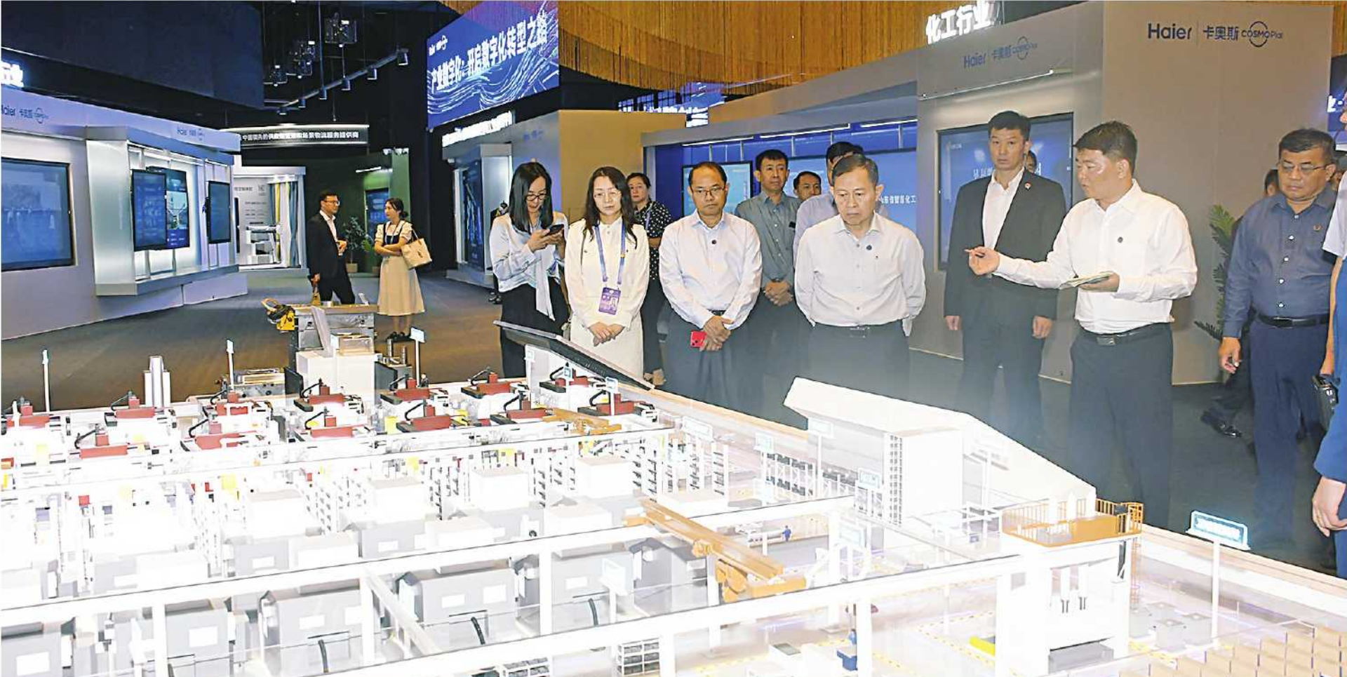
နိုင်ငံတော်စီမံအုပ်ချုပ်ရေးကောင်စီ ဒုတိယဥက္ကဋ္ဌ ဒုတိယဝန်ကြီးချုပ် ဒုတိယဗိုလ်ချုပ်မှူးကြီးစိုးဝင်း ချင်းတောင်ဟိုင်အယ်အဖွဲ့(Qingdao Haier Group)အတွင်း လှည့်လည်ကြည့်ရှုလေ့လာစဉ်။

နေပြည်တော် ရုလိုင် ၉ အုပ်ချုပ်ရေးကောင်စီ ဒုတိယဥက္ကဋ္ဌ လှယ်အဖွဲ့သည် ယနေ့နံနက်ပိုင်းတွင် Group)နှင့် ချင်းတောင်သုတေသနနှင့် opment center)တို့သို့ လှည့်လည် တရုတ်ပြည်သူ့သမ္မတနိုင်ငံ ချင်းတောင် ဒုတိယဝန်ကြီးချုပ် ဒုတိယဗိုလ်ချုပ်မှူးကြီး ချင်းတောင်မြို့အတွင်းရှိ ချင်းတောင် ဖွံ့ဖြိုးတိုးတက်မှုစင်တာ (Qingdao ကြည့်ရှုလေ့လာကြသည်။ မြို့၌ ရောက်ရှိနေသည့် နိုင်ငံတော်စီမံ စိုးဝင်း ဦးဆောင်သော မြန်မာကိုယ်စား ဟိုင်အယ်အဖွဲ့ (Qingdao Haier Hisense Research and Devel- စာမျက်နှာ ၁၆ ကော်လံ ၁၂၁