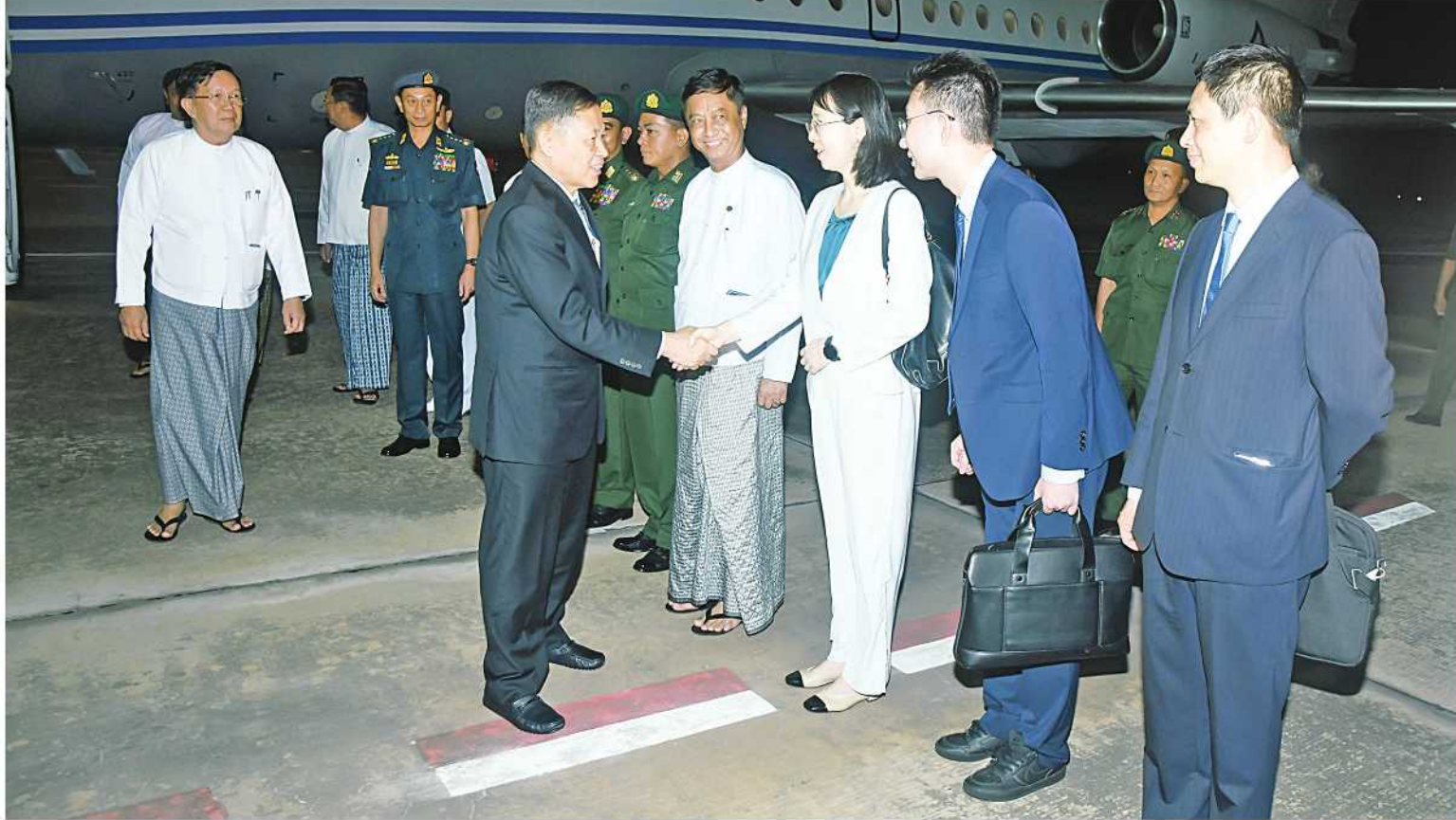
နေပြည်တော် ရူလိုင် ၉ ရှန်ဟိုင်း ပူးပေါင်းဆောင်ရွက်ရေးအဖွဲ့ (SCO) ၏ စိမ်းလန်းသောဖွံ့ဖြိုးတိုးတက်မှုပိုရမ်သို့ တက်ရောက်ခဲ့သည့် နိုင်ငံတော် စီမံအုပ်ချုပ်ရေးကောင်စီ ဒုတိယဥက္ကဋ္ဌ ဒုတိယဝန်ကြီးချုပ် ဒုတိယဗိုလ်ချုပ်မှူးကြီးစိုးဝင်း ဦးဆောင်သော မြန်မာကိုယ်စားလှယ်အဖွဲ့သည် ယနေ့ဒေသစံတော်ချိန် ညနေ ၄ နာရီခွဲတွင် စာမျက်နှာ ၁၆ ကော်လံ ၃ ☆

နိုင်ငံတော်စီမံအုပ်ချုပ်ရေးကောင်စီ ဒုတိယဥက္ကဋ္ဌ ဒုတိယဝန်ကြီးချုပ် ဒုတိယဗိုလ်ချုပ်မှူးကြီး စိုးဝင်းအား နိုင်ငံတော် စီမံအုပ်ချုပ်ရေးကောင်စီ အတွင်းရေးမှူး ဒုတိယဗိုလ်ချုပ်ကြီး အောင်လင်းဒွေး၊ ကောင်စီအဖွဲ့ဝင်များ၊ ပြည်ထောင်စုဝန်ကြီးများနှင့် တာဝန်ရှိသူများက နေပြည်တော်လေဆိပ်၌ ကြိုဆိုနှုတ်ဆက်ကြစဉ်။