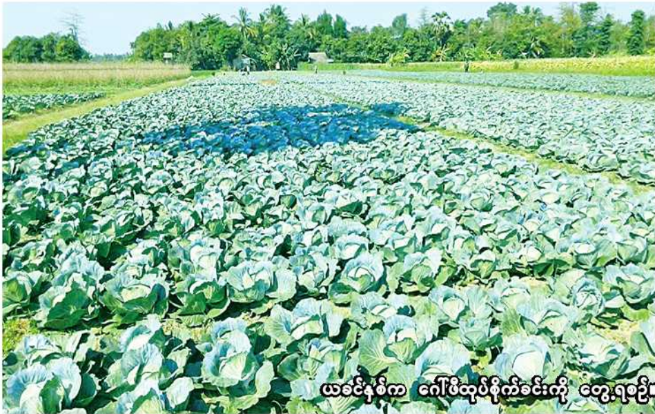
ယခင်နှစ်က ဂေါ်ဖီထုပ်စိုက်ခင်းကို တွေ့ရစဉ်ပါ။