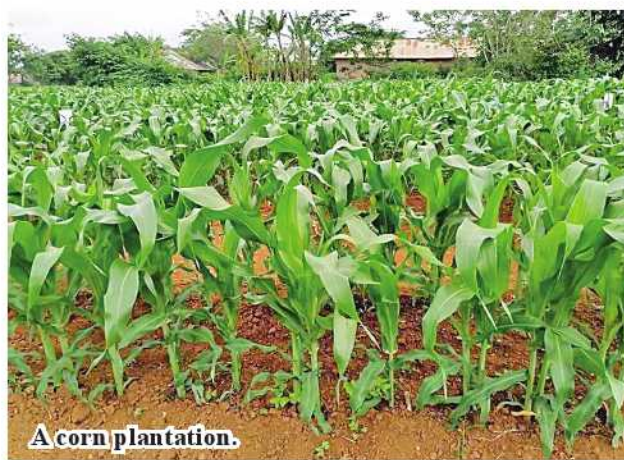
A corn plantation.

The township agriculture department conducts training courses for local farmers, field demonstrations, prevention of pests and use of