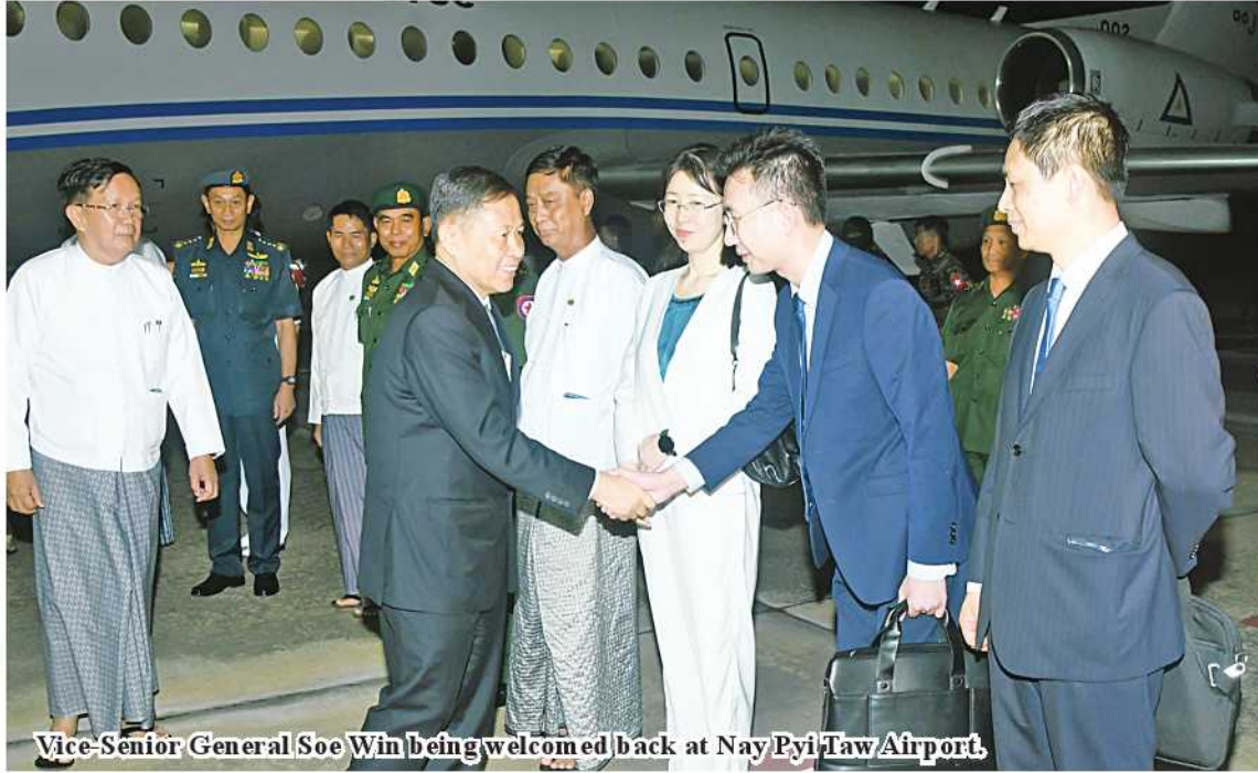
Vice-Senior General Soe Win being welcomed back at Nay Pyi Taw Airport.

Nay Pyi Taw July 9 Vice Chairman of the State Administration Council Deputy Prime Minister Vice-Senior General Soe Win, which attended the Green Development Forum of the Shanghai Cooperation Organization