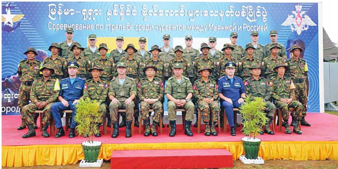
မြန်မာ-ရုရှား နှစ်နိုင်ငံ ဗိုလ်လောင်းများ သေနတ်ပစ်ပြိုင်ပွဲတွင် စုပေါင်းမှတ်တမ်းတင်ဓာတ်ပုံရိုက်စဉ်။

နေပြည်တော် ၇ ဇူလိုင် ၉ မြန်မာနိုင်ငံက အိမ်ရှင်အဖြစ် ကျင်းပ သည့် မြန်မာ-ရုရှား နှစ်နိုင်ငံ ဗိုလ်လောင်း များ သေနတ်ပစ်ပြိုင်ပွဲကို ဗဟူးတပ်မြို့ တပ်မတော်(ကြည်း) ဗိုလ်သင်တန်းကျောင်း (ဗဟူး)ရှိ မိတာ ၆၀၀ အာဆီယံစက်ပစ်ကွင်း ၌ ဇူလိုင် ၇ ရက်မှ ၉ ရက်ထိ ကျင်းပခဲ့ရာ