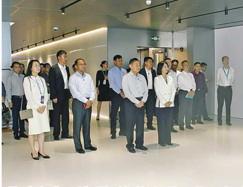
Vice-Senior General Soe Win visits Qingdao Hisense Research and Development Center.