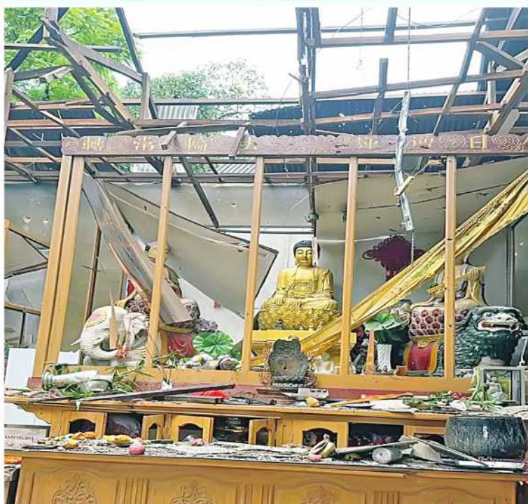
MNDA အကြမ်းဖက်သောင်းကျန်းသူများက လားရှိုးမြို့အတွင်းသို့ ရှေ့တိုက်ခွဲ များ၊ Drop Bomb များဖြင့် ပစ်ခတ်တိုက်ခိုက်မှုကြောင့် တရုတ်ဖာရူန့်ဘုံကျောင်း ထိခိုက်ပျက်စီးခဲ့မှု မှတ်တမ်းဓာတ်ပုံ။

နောက်ပိုင်းမှာ MNDA ဟာ ကိုးကန့် နယ်မြေ အထူးဒေသ(၁)ရရှိရေးဆိုပြီး လုပ်ဆောင်လာပါတယ်။ အကြမ်းဖက် NUG အဖွဲ့နဲ့တွေ့ဆုံပြီး သူတို့နယ်မြေကို လိုက်ပြတာတွေ၊ ဆွေးနွေးတာတွေလုပ်လာ တဲ့အပြင် ကိုးကန့်ဒေသရဲ့ ပြင်ပကိုပါ ဆက်လက်နယ်မြေချဲ့ထွင် တိုက်ခိုက်လာ တာတွေ့ရပါတယ်။ NUG အဖွဲ့ရဲ့ အသံ ကိုလိုက်ပြီး ပြောကြားနေတာကိုလည်း တွေ့ရပါတယ်။ ကိုးကန့်နယ်မြေထဲက ကလေးငယ်များပါမကျန် လူသစ်စုဆောင်း တာတွေ၊ ကိုးကန့်ဒေသအတွင်းမှာ အလုပ် လုပ်ကိုင်ခဲ့ကြတဲ့ ဗမာအပါအဝင် တိုင်းရင်း သားအလုပ်သမားတွေကို ဖမ်းဆီးပြီး MNDA ထဲကိုသွင်းပြီး တိုက်ပွဲဝင်ခိုင်း တာတွေလုပ်ဆောင်ခဲ့ပါတယ်။ စာသင် ကျောင်းတွေကို ပိတ်ပင်တာတွေ၊ ပညာ သင်ကြားမှု ပိတ်ပင်တာတွေကိုလည်း ပြုလုပ်ခဲ့ပါတယ်။ TNLA အဖွဲ့အနေနဲ့ လည်း အလားတူလုပ်ဆောင်ခဲ့ပါတယ်။ နောက်ပိုင်းမှာ အဲဒီဒေသမှာရှိတဲ့ သူတို့ လက်နက်ကိုင်အဖွဲ့အချင်းချင်း နယ်မြေ