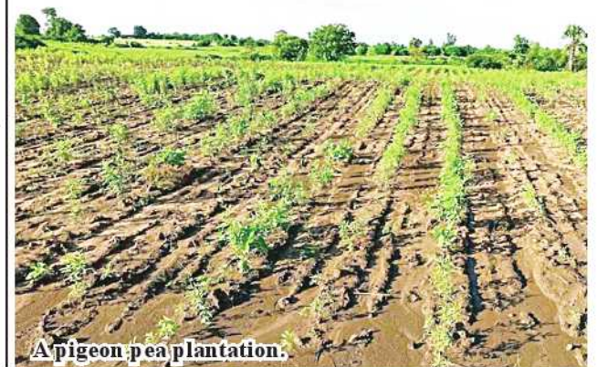
A pigeon pea plantation.