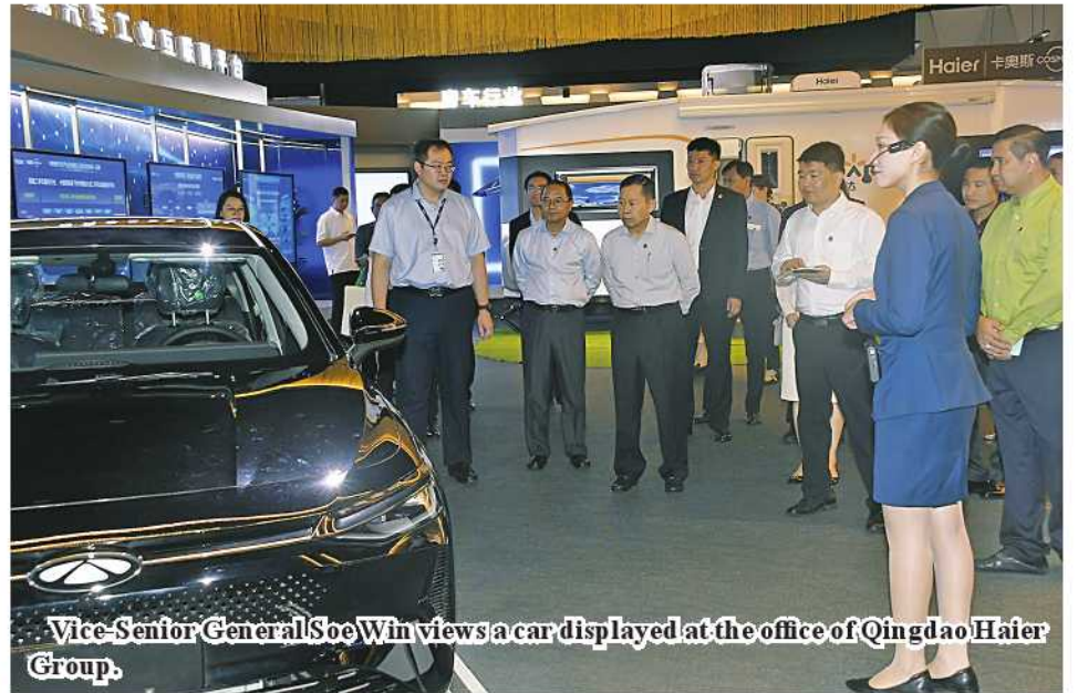
Vice-Senior General Soe Win views a car displayed at the office of Qingdao Haier Group.

history of the centre to the Vice-Senior General and conducted round the modern