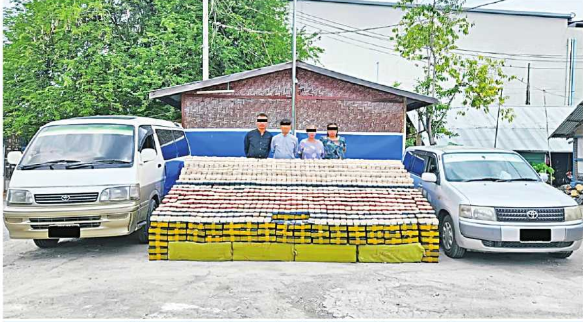
မြစ်မှုကျူးလွန်သူများကို မော်တော်ယာဉ်၊ ဘိန်းဖြူများနှင့်အတူ တွေ့ရစဉ်။

နေပြည်တော် ရူလိုင် ၉ မိုးခိုင်း၊ နန်းအေးဖောင်၊ နန်းယိမ်းအွပ်စုစုပေါင်းဒေသကာလတန်ဖိုးငွေကျပ် ၂ ပူးယစ်ဆေးဝါး တားဆီးနိုင်ရန်ရေးနှင့် ထွန်းလင်းအောင်တို့ လေးဦးနှင့်အတူ ရဲတပ်ဖွဲ့မှ တပ်ဖွဲ့ဝင်များပါဝင်သော SUPER CUSTOM ယာဉ်ပေါ်မှ ပလတ်ပူးပေါင်းအဖွဲ့သည် ရူလိုင် ၅ ရက် ညနေ ၃ နာရီတွင် မန္တလေးတိုင်းဒေသကြီးစစ်ဆေးဖော်ထုတ်ချက်အရ ချမ်းမြသာစည်မြို့နယ် ဆ/၂ ရပ်ကွက် ၇၁ လမ်းရှိ ကြိုတင်သတင်းရရှိထားသည့် ထွန်းလင်းအောင် ငှားရမ်းနေထိုင်သည့် TOYOTA PROBOX မော်တော်ယာဉ်နှင့် SUPER CUSTOM မော်တော်ယာဉ် နှင့်အတူ ရှာဖွေစစ်ဆေးခဲ့ရာ တို့ရောက်ရှိလာ၍ ထပ်မံသိမ်းဆည်းရမိခဲ့သဖြင့် ကီလို ထပ်မံသိမ်းဆည်းရမိခဲ့သဖြင့် သတင်းရရှိသည်။ (၅၀၁)