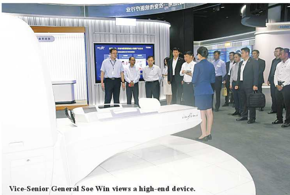
Vice-Senior General Soe Win views a high-end device.

Then, the delegation led by the Vice-Senior General attended the luncheon hosted by Mayor of Qingdao Mr. Zhao Haoshi at the Qingdao Sea View Garden Hotel. 100