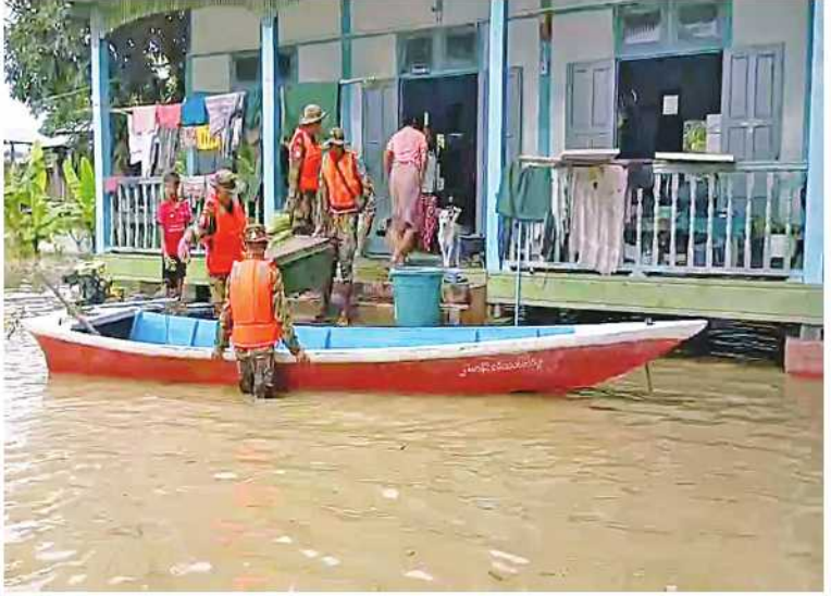
အနောက်မြောက်တိုင်းစစ်ဌာနချုပ်မှ နယ်မြေခံတပ်မတော်သားများက ရေဘေးသင့်ပြည်သူများကို ရေဘေးလွတ်ရာသို့ ကူညီရွှေ့ပြောင်းပေးစဉ်။

နေပြည်တော် ရူလိုင် ၉ မြို့နယ် ကျောက်တောင်ရပ်ကွက်၊ တံတားစစ်ကိုင်းတိုင်းဒေသကြီးအတွင်း၌ မိုးဦးရပ်ကွက်၊ ကျောက်မြောင်းရပ်ကွက်၊ သည်းထန်စွာ ရွာသွန်းမှုကြောင့် ချင်းတွင်းအောင်မင်္ဂလာရပ်ကွက်၊ သရက်ကုန်းမြစ်ရေမြင့်တက်ကာ ခန္တီးမြို့နယ်နှင့် ရပ်ကွက်၊ စွယ်တော်ရပ်ကွက်၊ညောင်ပင်သာမော်လိုက်မြို့နယ်တို့အတွင်းရှိ ရပ်ကွက်၊ ရပ်ကွက်၊ တွန်းပင်ကျေးရွာနှင့် တိန်းသာကျေးရွာတို့ရှိ ရေဘေးသင့်ပြည်သူများကို ကျေးရွာတို့ရှိ ရေဘေးသင့်ပြည်သူများကို ကူညီကယ်ဆယ်ရေး လုပ်ငန်းများ ဆောင်ရွက်ပေးလျက် ရှိသည်။ ထိုသို့ဆောင်ရွက်ပေးလျက်ရှိရာ ယနေ့တွင် နယ်မြေခံတပ်မတော်သားများနှင့် ဌာနဆိုင်ရာ တာဝန်ရှိသူများက မော်လိုက်ရရှိသည်။ (၅၀၁)