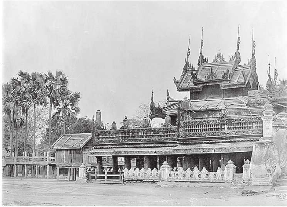
အမည်မသိဓာတ်ပုံဆရာရိုက်ကူးခဲ့သည့် မဟာဝေယန်ဘုံကျော်(မိုးကောင်း)ကျောင်း

မြန်မာမူပိုင်သုကာလက်ရာ ဘုန်းကြီးကျောင်း အများစုကို ကုန်းဘောင်ခေတ်နှောင်းပိုင်း ရတနာပုံ ခေတ်တွင် ကျွန်းသစ်ဖြင့် အများဆုံးတည်ဆောက် ခဲ့သည်။ သို့သော် ရတနာပုံခေတ်မတိုင်မီ အမရပူရခေတ်တွင်လည်း တော်ဝင်မိသားစုများတည် ဆောက်လှူဒါန်းခဲ့သည့် သစ်သားဘုန်းကြီးကျောင်း များလည်းရှိခဲ့သည်။