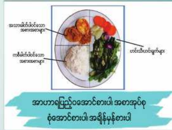
အာဟာရပြည့်ဝအောင်စားပါ၊ အစာအုပ်စု စုံအောင်စားပါ၊ အချိန်မှန်စားပါ