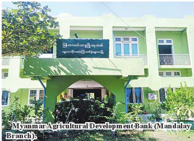
Myanmar Agricultural Development Bank (Mandalay Branch)

In disbursement of loans, K150,000 per acre of paddy and K100,000 per acre of groundnut, green gram, sesame, cotton, chickpea, black