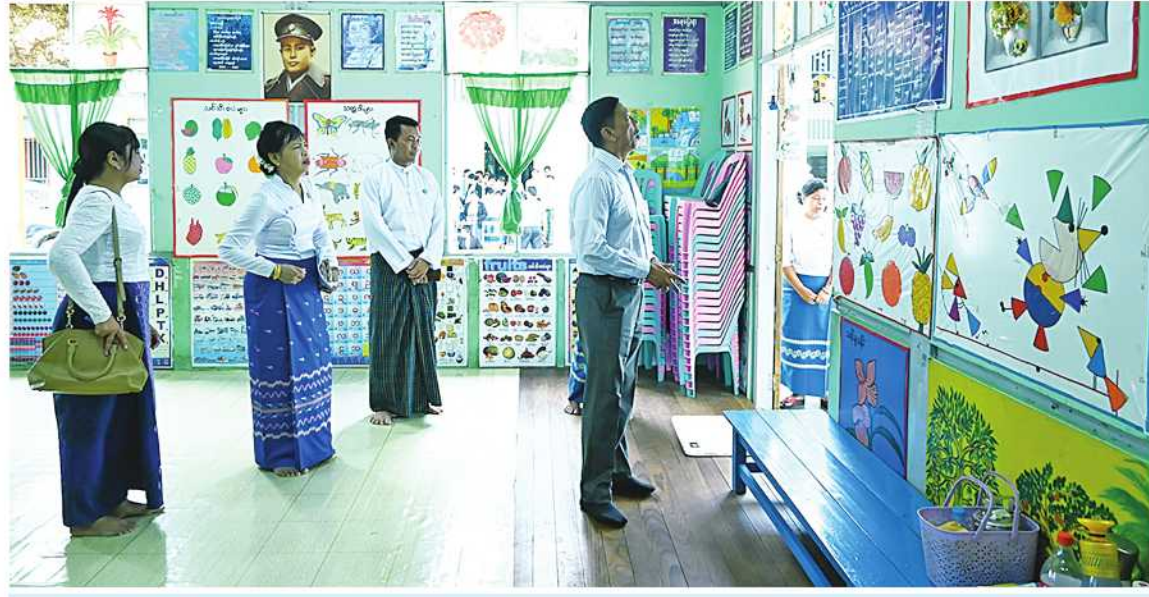
ပြည်ထောင်စုဝန်ကြီး ဒေါက်တာစိုးဝင်း မြစ်ကြီးနားမြို့ အမှတ်(၁)မူလတန်းကြိုကျောင်းအတွင်း ကြည့်ရှုစစ်ဆေးစဉ်။

ထို့နောက် ပြည်ထောင်စုဝန်ကြီးသည် မြစ်ကြီးနားမြို့ မူလတန်းကြိုကျောင်း အမှတ်(၁)သို့သွားရောက်ပြီး ကလေးများ အတွက် သင်ထောက်ကူပစ္စည်းများထားရှိ မှု စာသင်ဆောင်များ၊စားသောက်ခန်းများ၊ မီးဖိုဆောင်နှင့် ကစားကွင်းများကို ကြည့်ရှု ကာ အသက် သုံးနှစ်မှ ငါးနှစ်အရွယ် မူကြို ကလေးငယ်များငယ်စဉ်ကပင် ဗလငါးတန် ဖွံ့ဖြိုးရေး၊ စည်းကမ်းလိုက်နာတတ်ရေး၊ ဘက်စုံကျန်းမာရေးတို့အတွက် စနစ်တကျ လေ့ကျင့်သင်ကြားပေးကြရန် မှာကြားခဲ့ ကြောင်း သတင်းရရှိသည်။ (သတင်းစဉ်)