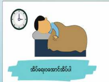
အိပ်ရေးဝအောင်အိပ်ပါ