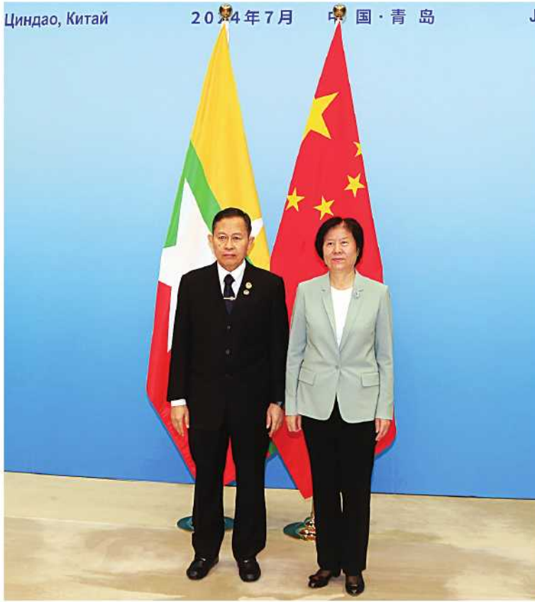
နိုင်ငံတော်စီမံအုပ်ချုပ်ရေးကောင်စီဒုတိယဥက္ကဋ္ဌ ဒုတိယဝန်ကြီးချုပ် ဒုတိယဗိုလ်ချုပ်မှူးကြီး ဖိုးဝင်းနှင့် တရုတ်ပြည်သူ့နိုင်ငံရေးအတိုင်ပင်ခံကွန်ဖရင့်၏ အမျိုးသားကော်မတီဒုတိယဥက္ကဋ္ဌ နှင့် ရှန်ဟိုင်းပူးပေါင်းဆောင်ရွက်ရေးအဖွဲ့(SCO)၏ အိမ်နီးချင်းကောင်း၊ မိတ်ဆွေ ဆက်ဆံရေးနှင့် ပူးပေါင်းဆောင်ရွက်မှုကော်မရှင်ဥက္ကဋ္ဌ Ms. Shen Yueyue တို့ မှတ်တမ်းတင်ဓာတ်ပုံရိုက်စဉ်။

၎င်း ရှေ့မှအဆက် တရုတ်နိုင်ငံဆိုင်ရာ မြန်မာသံအမတ်ကြီး ဦးတင်မောင်ဆွေ၊ သံတမန်ရေးရာဦးစီးဌာန ညွှန်ကြားရေးမှူးချုပ် ဦးဇော်ထွန်းဦး၊ စစ်သံမှူး ဗိုလ်မှူးချုပ်ဇော်ဇော်နိုင်နှင့် တာဝန်ရှိသူများ တက်ရောက်ကြပြီး တရုတ် ပြည်သူ့ နိုင်ငံရေးအတိုင်ပင်ခံကွန်ဖရင့်၏ အမျိုးသားကော်မတီ ဒုတိယဥက္ကဋ္ဌနှင့် ရှန်ဟိုင်း ပူးပေါင်းဆောင်ရွက်ရေးအဖွဲ့ (SCO)၏ အိမ်နီးချင်းကောင်း၊ မိတ်ဆွေ ဆက်ဆံရေးနှင့် ပူးပေါင်းဆောင်ရွက်မှုကော်မရှင်ဥက္ကဋ္ဌ Ms. Shen Yueyue နှင့်