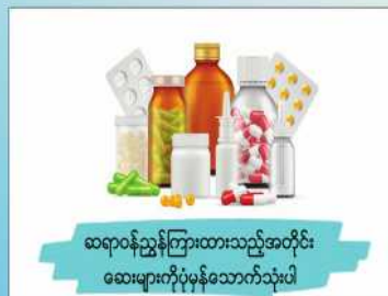
ဆရာဝန်ညွှန်ကြားထားသည့်အတိုင်း ဆေးများကိုပုံမှန်သောက်သုံးပါ