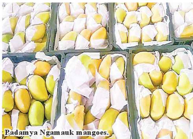
Padamya Ngamauk mangoes.

Mandalay July 7 Myanmar's Padamya Ngamauk mango fetches good price in export market this year, said U Kyaw Soe Naing, Secretary of Myanmar Mango Market and Technological Development Association (Mandalay). At present, Seintalone and Shwehintha mangoes gradually fade out in the market. Now, Padamya Ngamauk mango is exported to Chinese market. This year, one 16-kg basket of mango fetches 100-120 yuan. "Starting from this month, Padamya Ngamauk mango flows into the market. Two to three truckloads of mango entered China. Quality mango fetches good prices. Hence, farmers need to take care of their fruits to have quality ones. If plucking and packaging are proper, the fruits can fetch good prices," he added. Myanmar exports Seintalone, Shwehintha, Yinkwe, Nadamya Ngamauk and