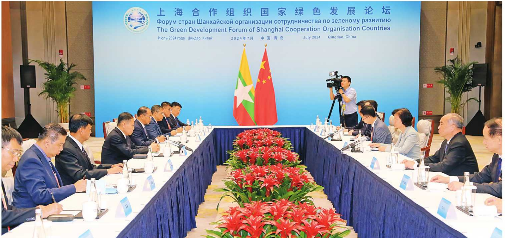
နိုင်ငံတော်စီမံအုပ်ချုပ်ရေးကောင်စီ ဒုတိယဥက္ကဋ္ဌ ဒုတိယဝန်ကြီးချုပ် ဒုတိယဗိုလ်ချုပ်မှူးကြီးစိုးဝင်း မြန်မာ-တရုတ် နှစ်နိုင်ငံတွေ့ဆုံဆွေးနွေးပွဲအခမ်းအနားသို့ တက်ရောက်စဉ်။

နေပြည်တော် ရုလိုင် ၇ မြို့၌ ရောက်ရှိနေသည့် နိုင်ငံတော်စီမံ ညနေ ၅ နာရီတွင် Qingdao International Conference Center ရှိ အခမ်းအနားသို့ တက်ရောက်သည်။ သယံဇာတနှင့် သဘာဝပတ်ဝန်းကျင် ရှန်ဟိုင်း ပူးပေါင်းဆောင်ရွက်ရေး အုပ်ချုပ်ရေးကောင်စီ ဒုတိယဥက္ကဋ္ဌ ဒုတိယဝန်ကြီးချုပ် ဒုတိယဗိုလ်ချုပ်မှူးကြီး Anren ခန်းမ၌ ကျင်းပသည့် မြန်မာ-တရုတ် နှစ်နိုင်ငံတွေ့ဆုံဆွေးနွေးပွဲ ဥက္ကဋ္ဌ ဒုတိယဝန်ကြီးချုပ်နှင့်အတူ စာမျက်နှာ ၁၈ ကော်လံ ၁၂၅