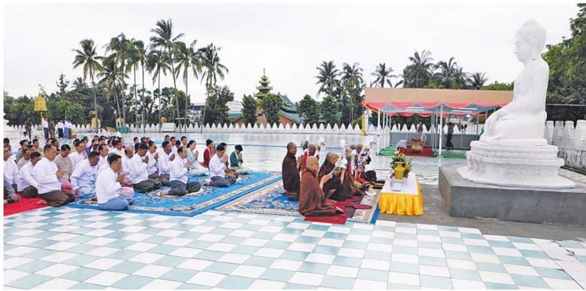
စစ်တွေမြို့ လောကနန္ဒာစေတီတော် မြတ်ကြီးပရိဝုဏ်အတွင်းရှိ မာရဝိဇယပုဒ္ဓ ဆင်းတုတော်မြတ်ကြီးနှင့် အဘယရာဇမုနိ ပုဒ္ဓဆင်းတုတော်မြတ်ကြီး နှစ်ဆူတို့အား ပုဒ္ဓါဘိသေကအနေကဇာတင်ပူဇော်စဉ်။