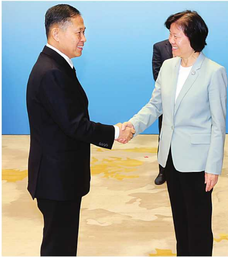
နိုင်ငံတော်စီမံအုပ်ချုပ်ရေးကောင်စီဒုတိယဥက္ကဋ္ဌ ဒုတိယဝန်ကြီးချုပ် ဒုတိယဗိုလ်ချုပ်မှူးကြီး ဖိုးဝင်း တရုတ်ပြည်သူ့နိုင်ငံရေးအတိုင်ပင်ခံကွန်ဖရင့်၏ အမျိုးသားကော်မတီဒုတိယဥက္ကဋ္ဌ နှင့် ရှန်ဟိုင်းပူးပေါင်းဆောင်ရွက်ရေးအဖွဲ့(SCO)၏ အိမ်နီးချင်းကောင်း၊ မိတ်ဆွေ ဆက်ဆံရေးနှင့် ပူးပေါင်းဆောင်ရွက်မှုကော်မရှင်ဥက္ကဋ္ဌ Ms. Shen Yueyue အား ရင်းရင်းနှီးနှီးနှုတ်ဆက်စဉ်။

၎င်း ရှေ့မှအဆက် တရုတ်နိုင်ငံဆိုင်ရာ မြန်မာသံအမတ်ကြီး ဦးတင်မောင်ဆွေ၊ သံတမန်ရေးရာဦးစီးဌာန ညွှန်ကြားရေးမှူးချုပ် ဦးဇော်ထွန်းဦး၊ စစ်သံမှူး ဗိုလ်မှူးချုပ်ဇော်ဇော်နိုင်နှင့် တာဝန်ရှိသူများ တက်ရောက်ကြပြီး တရုတ် ပြည်သူ့ နိုင်ငံရေးအတိုင်ပင်ခံကွန်ဖရင့်၏ အမျိုးသားကော်မတီ ဒုတိယဥက္ကဋ္ဌနှင့် ရှန်ဟိုင်း ပူးပေါင်းဆောင်ရွက်ရေးအဖွဲ့ (SCO)၏ အိမ်နီးချင်းကောင်း၊ မိတ်ဆွေ ဆက်ဆံရေးနှင့် ပူးပေါင်းဆောင်ရွက်မှုကော်မရှင်ဥက္ကဋ္ဌ Ms. Shen Yueyue နှင့်