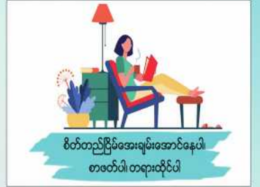
စိတ်တည်ငြိမ်စေရမ်းအောင်နေပါ၊ စာဖတ်ပါ၊ တရားထိုင်ပါ