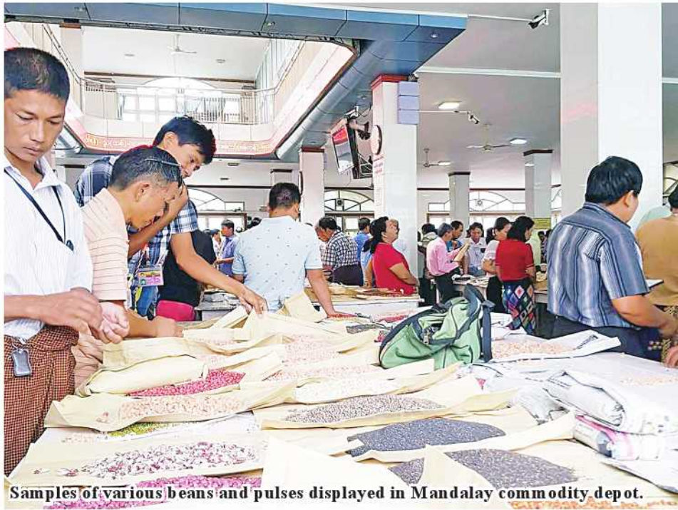
Samples of various beans and pulses displayed in Mandalay commodity depot.