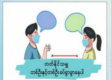
တတ်နိုင်သမျှ တစ်ဦးနှင့်တစ်ဦး ဝယ်ခွာခွာနေပါ