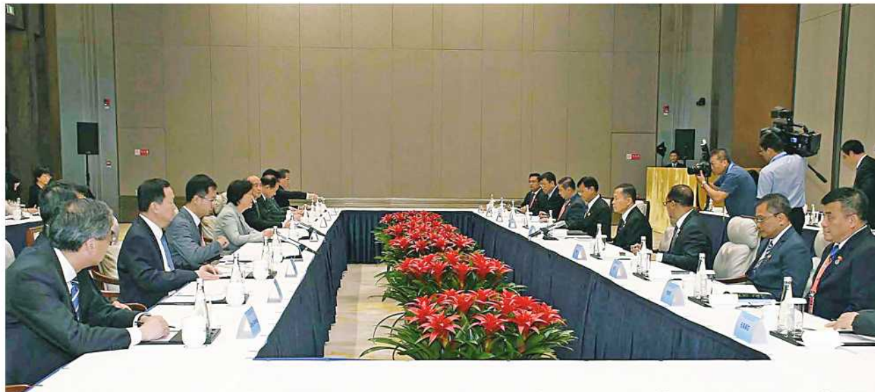
Vice Chairman of State Administration Council Deputy Prime Minister Vice-Senior General Soe Win attends the Myanmar-China meeting.

Nay Pyi Taw July 7 Vice Chairman of State Administration Council Deputy Prime Minister Vice-Senior General Soe Win who was in Qingdao to attend green development forum of Shanghai Coop-