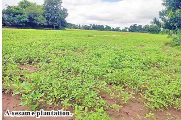
A sesame plantation.

Wetlet July 7 but local farmers have planted more than 13,000 acres of monsoon sesame against the target. Our department helps local farmers expand sown acreage of sesame, produce high per-acre yield and use GAP systems." Township Agriculture Department raises farmers awareness for expanding sown acreage of sesame, use of agricultural techniques and quality strains of crops. The crops produced in GAP system fetch good prices in the market and have a chance to foreign market share. So, local farmers will have improved economy with socioeconomic development.206