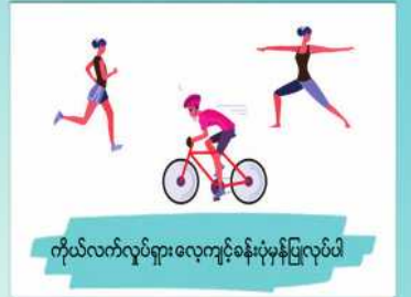
ကိုယ်လက်လှုပ်ရှားလေ့ကျင့်ခန်းပုံမှန်ပြုလုပ်ပါ