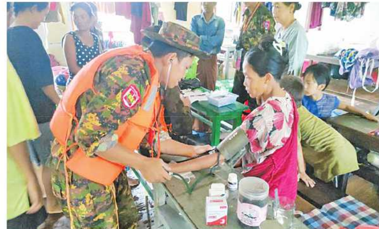
အနောက်မြောက်တိုင်းစစ်ဌာနချုပ်မှ နယ်မြေခံတပ်မတော်သားများက ရေဘေးသင့်ပြည်သူများကို ကျန်းမာရေးစောင့်ရှောက်မှုလုပ်ငန်းများ ဆောင်ရွက်ပေးစဉ်။

များနှင့် မြသိန်းတန်ဘုရားကုန်း၊ တပ်ဦးနန္ဒဝန်ဘုန်းတော်ကြီးကျောင်း၊ ထေရဝါဒဗုဒ္ဓသာသနာပြုကျောင်းနှင့် အခြေခံပညာအလယ်တန်းကျောင်း (ဇီးဖြူကုန်း)တို့၌ ရွှေ့ပြောင်းနေထိုင်နေသည့် ရေဘေးသင့်ပြည်သူများကို လိုအပ်သည့်ကျန်းမာရေးစောင့်ရှောက်မှုလုပ်ငန်းများနှင့်စားသောက်ဖွယ်ရာများ ထောက်ပံ့ပေးအပ်လျက်ရှိကြောင်း သတင်းရရှိသည်။ (၅၀၀)