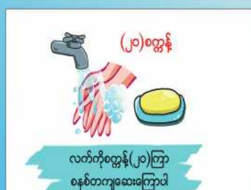
လက်ကိုကြိတ် (၂၀)ကြိတ် စနစ်တကျဆေးကြောပါ