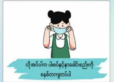
လိုအပ်ပါက ဝါးစပ်နှင့်နာခေါင်းစည်းကို စနစ်တကျတတ်ပါ