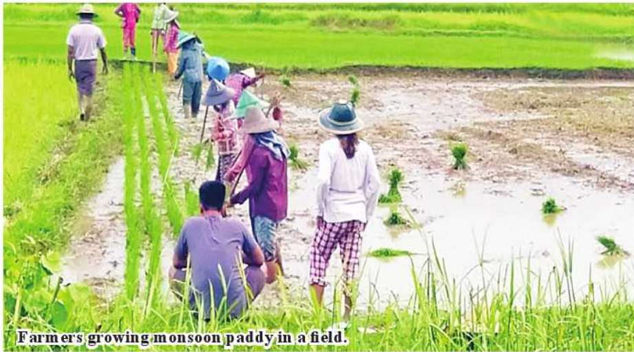
Farmers growing monsoon paddy in a field.