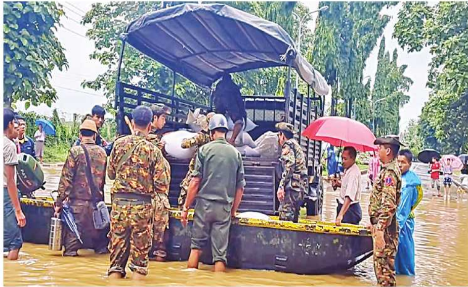
မြောက်ပိုင်းတိုင်းစစ်ဌာနချုပ်မှ နယ်မြေခံတပ်မတော်သားများက မြစ်ကြီးနားမြို့ပေါ်ရှိ ရေဘေးလွတ်ရာနေရာများသို့ ပစ္စည်းများကူညီရွှေ့ပြောင်းပေးစဉ်။