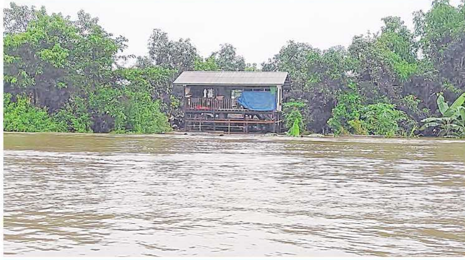
ခန္တီးမြို့နယ်အတွင်း၌ ရင်းတွင်းမြစ်ရေမြင့်တက်မှုကြောင့် မြစ်ရေဝင်ရောက်နေမှုကို တွေ့ရစဉ်။