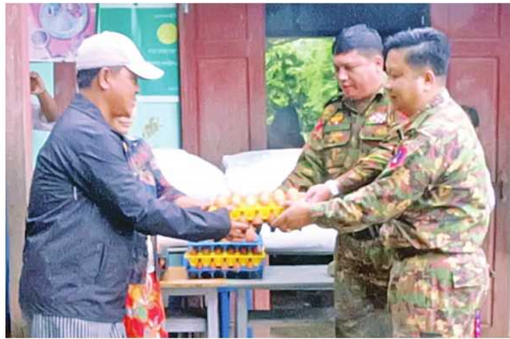
မြောက်ပိုင်းတိုင်းစစ်ဌာနချုပ်မှ တာဝန်ရှိသူများက မြစ်ကြီးနားမြို့နယ်အတွင်းရှိ ရေဘေးသင့်ပြည်သူများကို စားသောက်ဖွယ်ရာများထောက်ပံ့ပေးအပ်စဉ်။