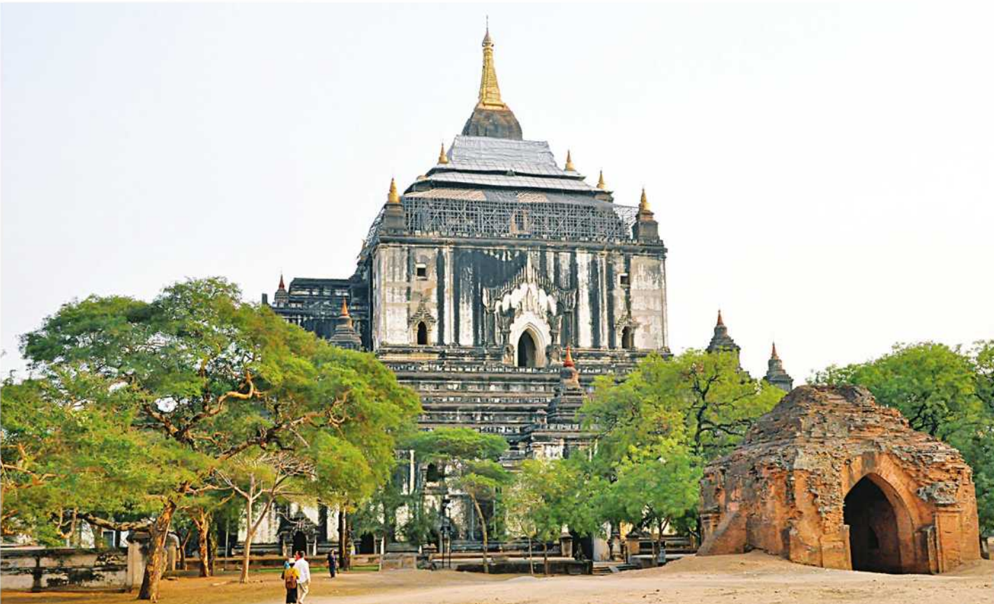
မန္တလေးတိုင်းဒေသကြီး ပုဂံရှေးဟောင်းယဉ်ကျေးမှုအမွေအနှစ်ဒေသရှိ သဗ္ဗညုဘုရားကို တွေ့ရစဉ်။

ရန်ကုန် ရုလိုင် ၂ မူအမွေအနှစ်များရေရှည်တည်တံ့စေရန် ထိန်းသိမ်းဆောင်ရွက်လျက်ရှိသည်။ မန္တလေးတိုင်းဒေသကြီးရှိ ကမ္ဘာ့အမွေအနှစ် စာရင်းဝင် ပုဂံရှေးဟောင်းယဉ်ကျေးမှုအမွေအနှစ် ဒေသကို သန့်ရှင်းသာယာလှပပြီး ခြပ်ရိုယဉ်ကျေးမှုအမွေအနှစ်များ ရေရှည်တည်တံ့စေရန် ထိန်းသိမ်းဆောင်ရွက်လျက်ရှိသည်။ မန္တလေးတိုင်းဒေသကြီးရှိ ကမ္ဘာ့အမွေအနှစ် စာရင်းဝင် ပုဂံရှေးဟောင်းယဉ်ကျေးမှုအမွေအနှစ် ဒေသကို သန့်ရှင်းသာယာလှပပြီး ခြပ်ရိုယဉ်ကျေးမှုအမွေအနှစ်များ ရေရှည်တည်တံ့စေရန် ထိန်းသိမ်းဆောင်ရွက်လျက်ရှိသည်။