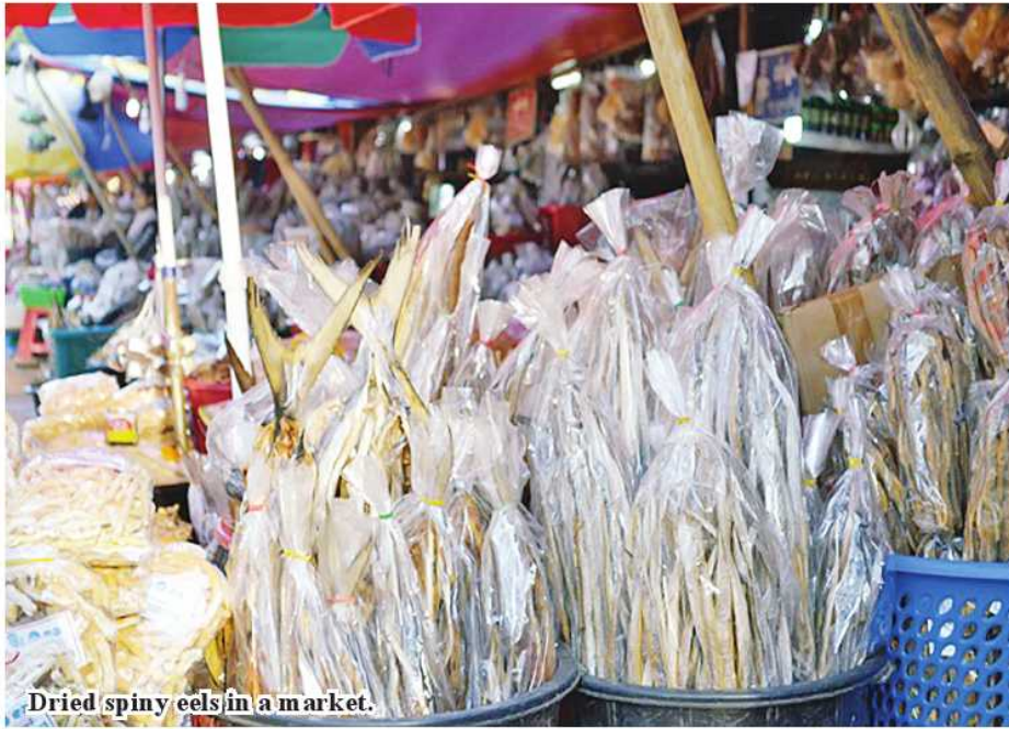
Dried spiny eels in a market.

Bogalay July 2 During the month of June, 90,000 viss of dried spiny eels were exported from Bogalay Township, Pyapon District, Ayeyawady Region to the Yangon market, according to Daw Thiri,