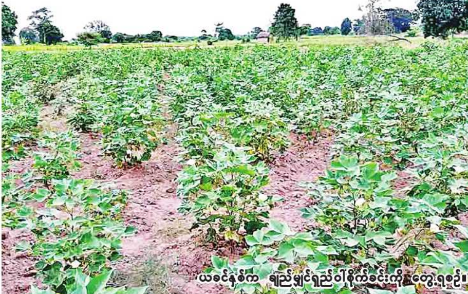
ယခင်နှစ်က ချည်မျှင်ရှည်ဝါစိုက်ပျိုးခဲ့တဲ့ ဧကရေစဉ်။