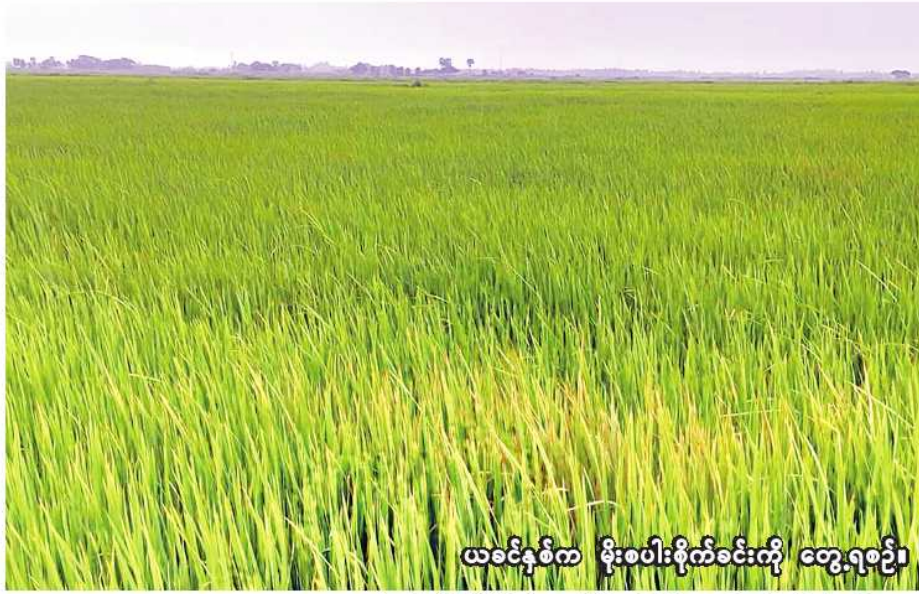
ယခင်နှစ်က မိုးစပါးစိုက်ခင်းကို တွေ့ရစဉ်။

ရွှေဘို ရူလိုင် ၂ စစ်ကိုင်းတိုင်းဒေသကြီး ရွှေဘိုခရိုင် ရွှေဘိုမြို့နယ်တွင် ယခုနှစ် မိုးသီးနှံစိုက်ပျိုးရာသီ၌ မိုးစပါး ၁၀၉၄၉၅ ဧက စိုက်ပျိုးသွားမည် ဖြစ်ကြောင်း ရွှေဘိုမြို့နယ်စိုက်ပျိုးရေးဦးစီးဌာနမှ သိရသည်။ ယခင်နှစ် မိုးသီးနှံစိုက်ပျိုးရာသီ၌ ရွှေဘိုမြို့နယ်တွင် မိုးစပါး ၁၀၅၀၈၃၃ ဧကစိုက်ပျိုးနိုင်ခဲ့ပြီး