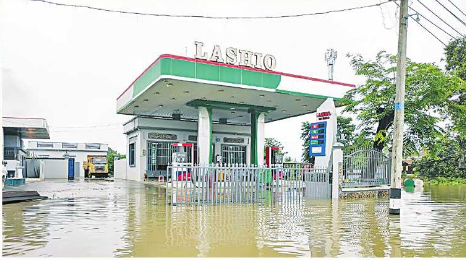
ခန္တီးမြို့နယ်အတွင်း၌ ရင်းတွင်းမြစ်ရေမြင့်တက်မှုကြောင့် မြစ်ရေဝင်ရောက်နေမှုကို တွေ့ရစဉ်။

တာဝန်ရှိသူများက သွားရောက်ကြည့်ရှုအားပေးပြီး ရေဘေးသင့်ပြည်သူများအတွက် စားသောက်ဖွယ်ရာများထောက်ပံ့ပေးအပ်သည်။ အလားတူ စစ်ကိုင်းတိုင်းဒေသကြီးအတွင်း၌လည်း မိုးသည်းထန်စွာ ရွာသွန်းမှု