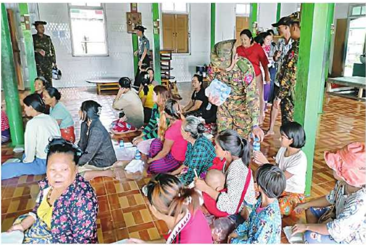
အနောက်မြောက်တိုင်းစစ်ဌာနချုပ်မှ နယ်မြေခံတပ်မတော်သားများက ခန္တီးမြို့နယ်အတွင်းရှိ ရေဘေးသင့်ပြည်သူများကို စားသောက်ဖွယ်ရာများထောက်ပံ့ပေးအပ်စဉ်။

ကချင်ပြည်နယ်အတွင်း မိုးသည်းထန်စွာ ရွာသွန်းမှုများကြောင့် ရေဝင်တိမ်မြောက် မြင့်တက်လျက်ရှိပြီး မြစ်ကြီးနားမြို့ပေါ်ရှိ ရပ်ကွက်များနှင့် ကျေးရွာများအတွင်း၌ ရေကြီးရေလျှံမှုများ ဖြစ်ပေါ်လျက်ရှိသည်။ အဆိုပါ ရေဝင်ရောက်မှုများဖြစ်ပေါ်လျက်ရှိသည့် ရပ်ကွက်၊ ကျေးရွာများမှ ပြည်သူများကို ယနေ့တွင်လည်း နယ်မြေခံတပ်မတော်သားများ၊ မြန်မာနိုင်ငံရဲတပ်ဖွဲ့ဝင်များ၊ မီးသတ်တပ်ဖွဲ့ဝင်များနှင့် ဌာနဆိုင်ရာဝန်ထမ်းများက ရေဘေးလွတ်ရာသို့ ရွှေ့ပြောင်းပေးပြီး လိုအပ်သည့်ကူညီကယ်ဆယ်ရေးလုပ်ငန်းများ ဆောင်ရွက်ပေးလျက်ရှိသည်။ ထိုသို့ဆောင်ရွက်ပေးနေမှုများကို မြောက်ပိုင်းတိုင်းစစ်ဌာနချုပ်မှ