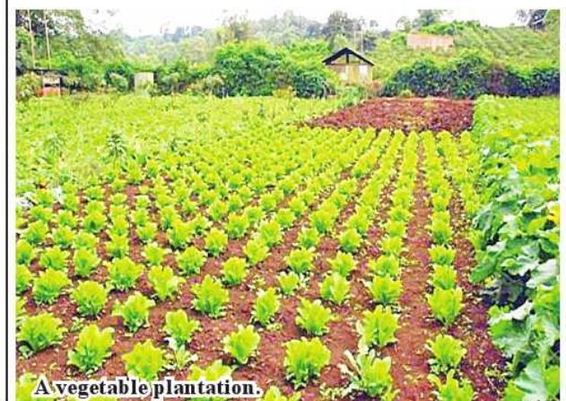
A vegetable plantation.