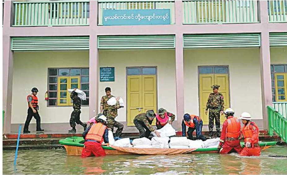
အနောက်မြောက်တိုင်းစစ်ဌာနချုပ်မှ နယ်မြေခံတပ်မတော်သားများ၊ မီးသတ်တပ်ဖွဲ့ဝင်များနှင့် ဌာနဆိုင်ရာဝန်ထမ်းများက ခန္တီးမြို့နယ် စာသင်ကျောင်းအတွင်းရှိ ပစ္စည်းများကို ရေဘေးလွတ်ရာသို့ ကူညီရွှေ့ပြောင်းပေးစဉ်။