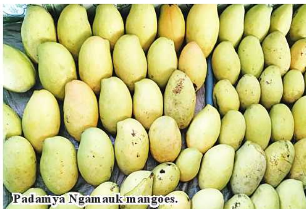
Padamya Ngamauk mangoes.