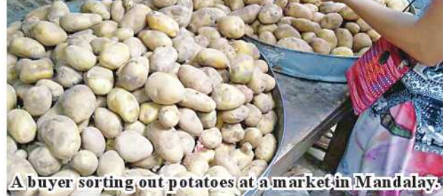
A buyer sorting out potatoes at a market in Mandalay.

potatoes but the potatoes imported from China are being traded in Mandalay market. 184