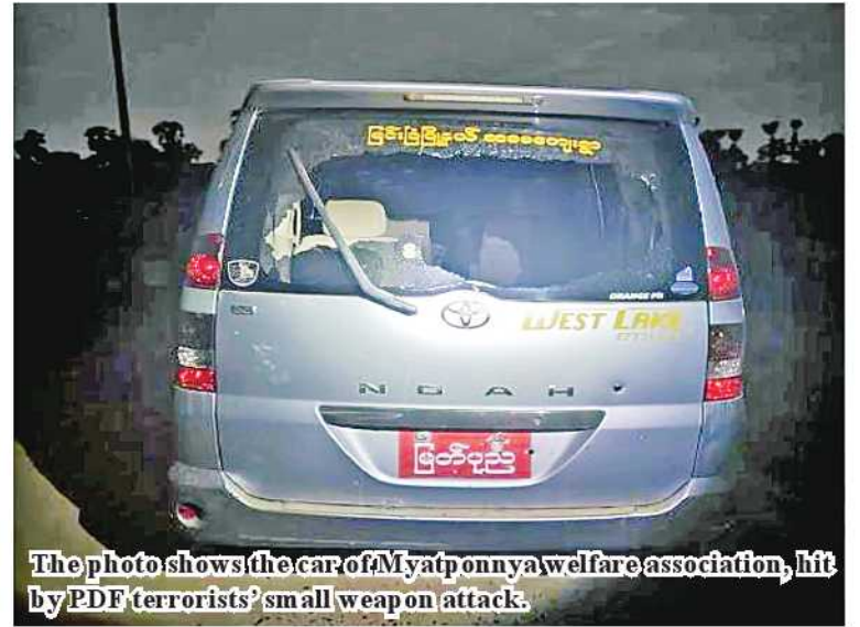
The photo shows the car of Myatponnya welfare association, hit by PDF terrorists' small weapon attack.