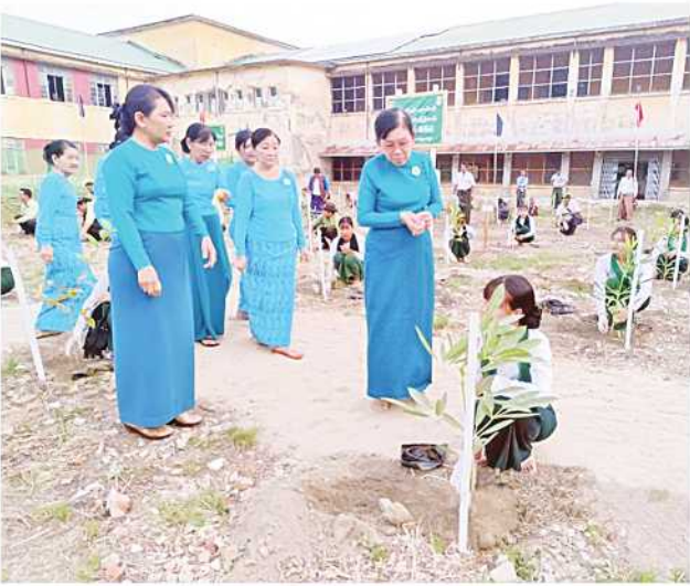
မန္တလေးပညာရေးဒီဂရီကောလိပ်တွင် မိုးရာသီသစ်ပင်စိုက်ပျိုးပွဲကျင်းပနေကြောင်း ဖော်ပြရန် ရေးရာအဖွဲ့ဥက္ကဋ္ဌ၊ ခရိုင်အဆင့် အုပ်ချုပ်ရေးအဖွဲ့ဥက္ကဋ္ဌနှင့် အဖွဲ့အမျိုးသမီးရေးရာအဖွဲ့ဥက္ကဋ္ဌများနှင့် မြို့နယ် အမျိုးသမီးရေးရာအဖွဲ့ဝင်များ၊ ချမ်းအေးသာစံမြို့နယ် အမျိုးသမီးရေးရာအဖွဲ့ဝင်များ၊ မဟာအောင်မြေခရိုင် စီမံအုပ်ချုပ်ရေးအဖွဲ့ဥက္ကဋ္ဌနှင့် အဖွဲ့ဝင်များ၊ ခရိုင်၊ မြို့နယ်အဆင့် ဌာန

မန္တလေးတိုင်းဒေသကြီး မဟာအောင်မြေခရိုင် စီမံအုပ်ချုပ်ရေးအဖွဲ့က မြန်မာအမျိုးသမီးများနေ့ကို ကြိုဆိုဂုဏ်ပြုသောအားဖြင့် ၂၀၂၄ ခုနှစ် မိုးရာသီသစ်ပင်စိုက်ပျိုးပွဲကို ယနေ့ နံနက် ၇ နာရီက မဟာအောင်မြေခရိုင် ချမ်းအေးသာစံမြို့နယ် မန္တလေးပညာရေးဒီဂရီကောလိပ်ဝင်းအတွင်း၌ ကျင်းပပြုလုပ်ခဲ့ကြောင်း သိရသည်။