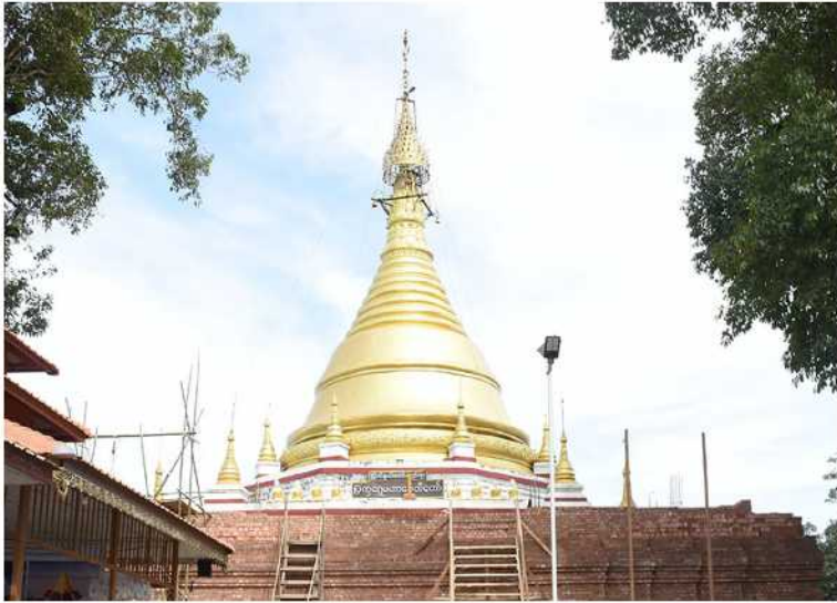
မန္တလေး ဇွန် ၂၃

မန္တလေးတိုင်းဒေသကြီး ကျောက်ဆည်ခရိုင် မြစ်သားမြို့နယ် ကုမဲမြို့အရှေ့တောင်ဘက် ကိုးမိုင်ခန့်အကွာ မြို့သုခရွာအနီး မြန်မာပြည်အလယ်ဗဟိုချက် ပြက္ခဒိန်တော်အား ပြန်လည်ပြုပြင်မွမ်းမံခြင်း လုပ်ငန်းများ ဆောင်ရွက်လျက်ရှိရာ မန္တလေးတိုင်းဒေသကြီးဝန်ကြီးချုပ် ဦးမျိုးအောင်သည် တိုင်းဒေသကြီးဝန်ကြီးများနှင့် တာဝန်ရှိသူများလိုက်ပါပြီး ယနေ့နံနက်ပိုင်းက သွားရောက်ဖူးမြော်ကြည့်ရှုသည်။