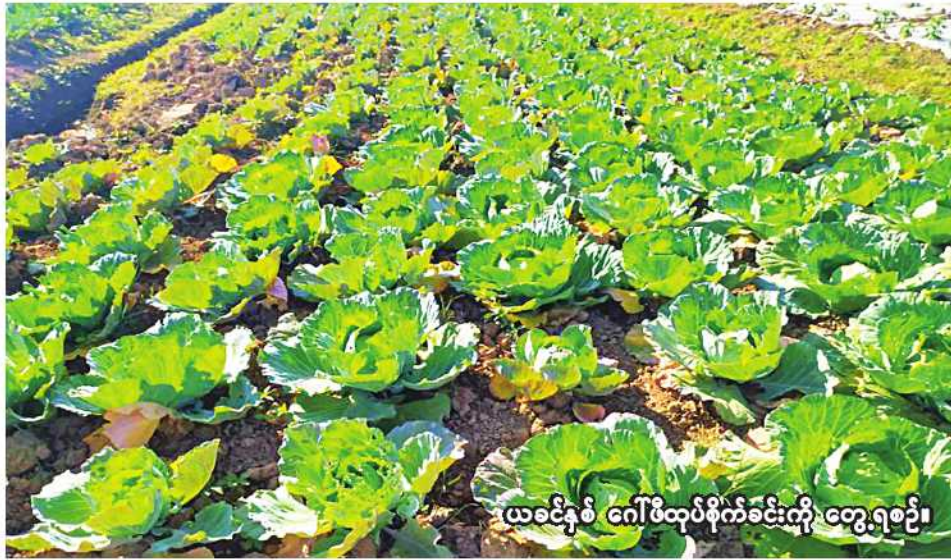
ယခင်နှစ် ဂေါ်ဖီထုပ်စိုက်ခင်းကို တွေ့ရစဉ်။