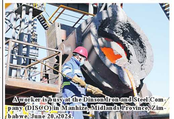
A worker is busy at the Dinson Iron and Steel Company (DISCO) in Manhize, Midlands Province, Zimbabwe, June 20, 2024.