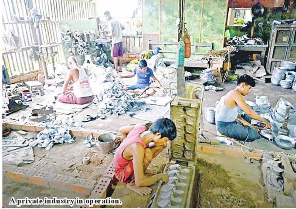
A private industry in operation.

Nay Pyi Taw June 23 at home. Businesspersons in Myanmar are operating MSME industries depending on their businesses. Up to May