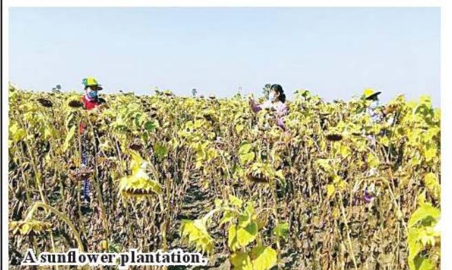
A sunflower plantation.

The harvest of the sunflowers made by the townships in Yinmabin District is 18,561 acres in Yinmabin Township, 16,897 acres in Kani Township, 17,242 acres in Salingyi Township, and 30,982 acres in Pale Township, totaling 83,682 acres. In order to expand the cultivation of sunflower in Yinmabin District, the relevant township Department of Agriculture has speeded up the educational courses, and provided the educational courses for the staff and sunflower growers to improve their performance and health.