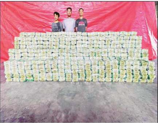
၂၀၂၃ ခုနှစ် ဒီဇင်ဘာလအတွင်း AA တပ်ဖွဲ့ဝင်များနှင့်အတူ ဖမ်းဆီးရမိသည့် မူးယစ်ဆေးဝါးများ

ရကြောင်း၊ လက်နက်မှောင်ခိုဝိုင်းများနဲ့ ချိတ်ဆက်ပြီး လက်နက်နဲ့ စိတ်ကြွဆေးပြား အလဲအလှယ်ပြုလုပ်လေ့ရှိကြောင်း၊ မူးယစ်