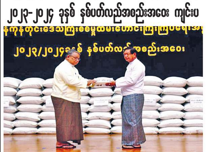
ရန်ကုန်တိုင်းဒေသကြီးဝန်ကြီးချုပ် ဦးစိုးသိန်း စစ်မှုထမ်းဟောင်းကြီးကြပ်ရေးအဖွဲ့ ကို ရုံးမြင့်ငွေများ ပေးအပ်စဉ်။

နေပြည်တော် ၈ ဇူလိုင် ၂၀၂၄ မြန်မာနိုင်ငံ စစ်မှုထမ်းဟောင်းအဖွဲ့၊ ရန်ကုန်တိုင်းဒေသကြီး စစ်မှုထမ်းဟောင်း ကြီးကြပ်ရေးအဖွဲ့ ၂၀၂၃-၂၀၂၄ ခုနှစ် နှစ်ပတ်လည်အစည်းအဝေးကို ယနေ့ နံနက်ပိုင်းတွင် ရန်ကုန်တိုင်းစစ်ဌာနချုပ်ရှိ အနော်ရထာခန်းမ၌ ပြုလုပ်ရာ ရန်ကုန်တိုင်း ဒေသကြီးဝန်ကြီးချုပ် ဦးစိုးသိန်း၊ ရန်ကုန်တိုင်း စစ်ဌာနချုပ်တိုင်းမှူး ဗိုလ်ချုပ်ဇော်ဟိန်းနှင့် တာဝန်ရှိသူများ၊ မြန်မာနိုင်ငံစစ်မှုထမ်းဟောင်း အဖွဲ့ ဗဟိုဌာနချုပ်မှ တာဝန်ရှိသူများနှင့် ရန်ကုန်တိုင်းဒေသကြီး စစ်မှုထမ်းဟောင်း ကြီးကြပ်ရေးအဖွဲ့များ တက်ရောက်ကြသည်။ ဦးစွာ ရန်ကုန်တိုင်းဒေသကြီး စစ်မှုထမ်း ဟောင်းကြီးကြပ်ရေးအဖွဲ့ နာယက