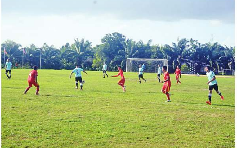
ကမ်းရိုးတန်းဒေသတိုင်းစစ်ဌာနချုပ် ၂၀၂၄ ခုနှစ် တိုင်းမှူးခိုင်းဘောလုံးပြိုင်ပွဲ အဖွင့် ပွဲစဉ်ဖြစ် ကမ်းရိုးတန်းဒေသတိုင်းစစ်ဌာနချုပ် (စခန်းရုံး)အသင်းနှင့် ဗြိတိလေတပ်စခန်း ဌာနချုပ်အသင်းတို့ ယှဉ်ပြိုင်ကစားကြစဉ်။

နေပြည်တော် ဇွန် ၁၃ ကမ်းရိုးတန်းဒေသတိုင်းစစ်ဌာနချုပ် ၂၀၂၄ ခုနှစ် တိုင်းမှူးခိုင်း ဘောလုံးပြိုင်ပွဲ ဖွင့်ပွဲကို ယနေ့ညနေပိုင်းတွင် တိုင်းစစ် ဌာနချုပ် အားကစားကွင်း၌ ပြုလုပ်ရာ တိုင်းမှူး ဗိုလ်မှူးချုပ်ပြည့်စုံလင်းနှင့် တာဝန်ရှိသူများ၊ ဌာနဆိုင်ရာတာဝန်ရှိသူ များ၊ အရာရှိ၊ စစ်သည်၊ မိသားစုများ၊ ဒိုင်အဖွဲ့ဝင်များ၊ ပြိုင်ပွဲဝင်အားကစားသမား များနှင့် အားကစားဝါသနာရှင်များ တက်ရောက်ကြသည်။ ဦးစွာ တိုင်းမှူးက အမှာစကား ပြောကြားသည်။ ထို့နောက် တိုင်းမှူးနှင့် တက်ရောက်လာသူများက အဖွင့်ပွဲစဉ် ဖြစ်သည့် ကမ်းရိုးတန်းဒေသတိုင်း စစ်ဌာနချုပ် (စခန်းရုံး)အသင်းနှင့် ဗြိတိ လေတပ်စခန်းဌာနချုပ်အသင်းတို့ ယှဉ်ပြိုင် ကစားနေမှုများကို ကြည့်ရှုအားပေးကြသည်။ အဆိုပါ တိုင်းမှူးခိုင်းဘောလုံးပြိုင်ပွဲ ကို တိုင်းစစ်ဌာနချုပ်ကွပ်ကဲမှုအောက် တပ်နယ် တပ်ရင်း၊ တပ်ဖွဲ့များမှ ပြိုင်ပွဲဝင် အသင်း ရှစ်သင်းဖြင့် ဇွန် ၂၄ ရက်ထိ ယှဉ်ပြိုင်ကစားသွားမည်ဖြစ်ကြောင်း သတင်း ရရှိသည်။ (၅၀၀)