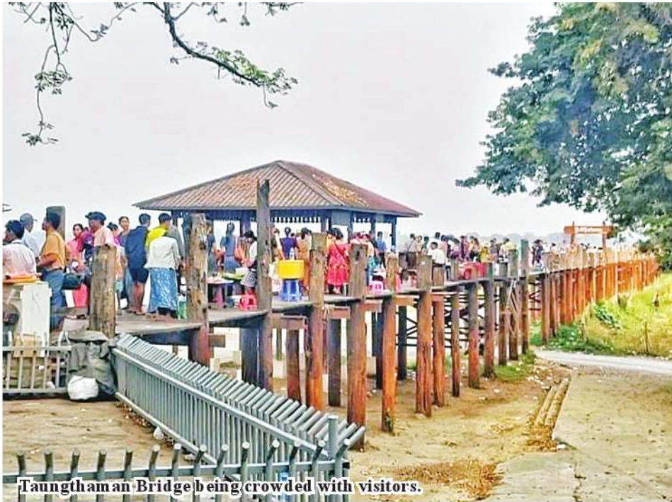
Taungthaman Bridge being crowded with visitors.

man Lake is attracting local and foreign travellers. As it is a great tourist destination in Mandalay Region, number of local and foreign travellers resurged again.