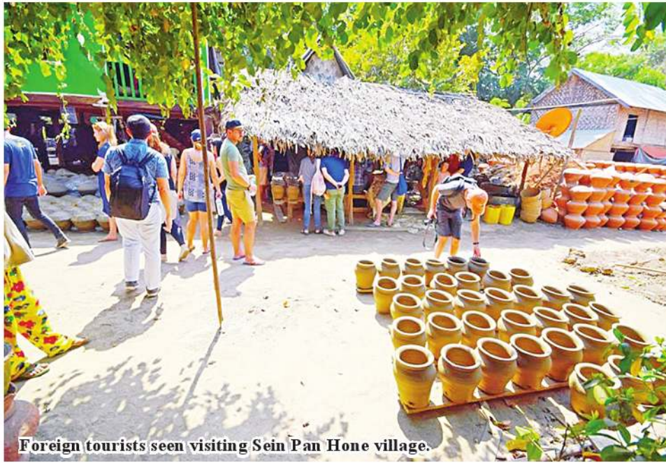
Foreign tourists seen visiting Sein Pan Hone village.

Mandalay June 13 U Maung Maung Lay, the leader of the Irrawaddy Dolphin Conservation Group, said Sein Pan Gone Village, which has developed village-based tourism, has seen a large number of domestic travellers visiting it, said