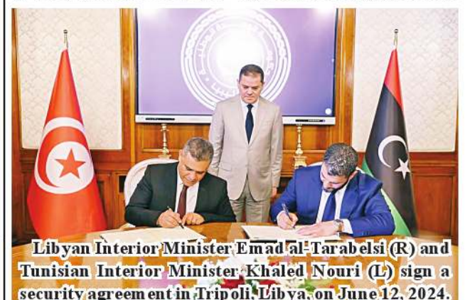
Libyan Interior Minister Emad al-Tarabetsi (R) and Tunisian Interior Minister Khaled Nouri (L) sign a security agreement in Tripoli, Libya, on June 12, 2024.

For his part, Tunisian Interior Minister Khaled Nouri expressed Tunisia's commitment to enhancing cooperation with Libya and addressing challenges impacting the flow of passengers through the border crossings. Xinhua