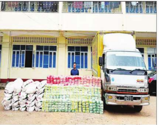
၂၀၂၃ ခုနှစ် ဒီဇင်ဘာလအတွင်း AA တပ်ဖွဲ့ဝင်များနှင့်အတူ ဖမ်းဆီးရမိသည့် မူးယစ်ဆေးဝါးများ

ထွက်ရှိတဲ့ စိတ်ကြွဆေးပြားများနဲ့ အိုက်စ် တွေကို မန္တလေးမှတစ်ဆင့် ရေလမ်း ကြောင်းမှ ပြည်ပနိုင်ငံများသို့ တင်ပို့ရန် အတွက် ရန်ကင်းဆိပ်ကမ်းများအသုံးပြုပြီး ရခိုင်ကမ်းရိုးတန်းပင်လယ်ပြင်မှတစ်ဆင့် မလေးရှား၊ အင်ဒိုနီးရှားတို့သို့ တင်ပို့ပါ သည်။ ကုန်းလမ်းကြောင်းကိုတော့ မန္တလေးမှ တစ်ဆင့် မိတ္ထီလာ၊ ပျော်ဘွယ်၊ မကွေး၊ ပဒိုနီးလမ်းအတိုင်း ကျောက်တော်၊ မြောက်ဦးမြို့တို့မှ ဘင်္ဂလားဒေ့ရှ်နိုင်ငံ အတွင်းသို့ တင်ပို့လျက်ရှိပါတယ်။