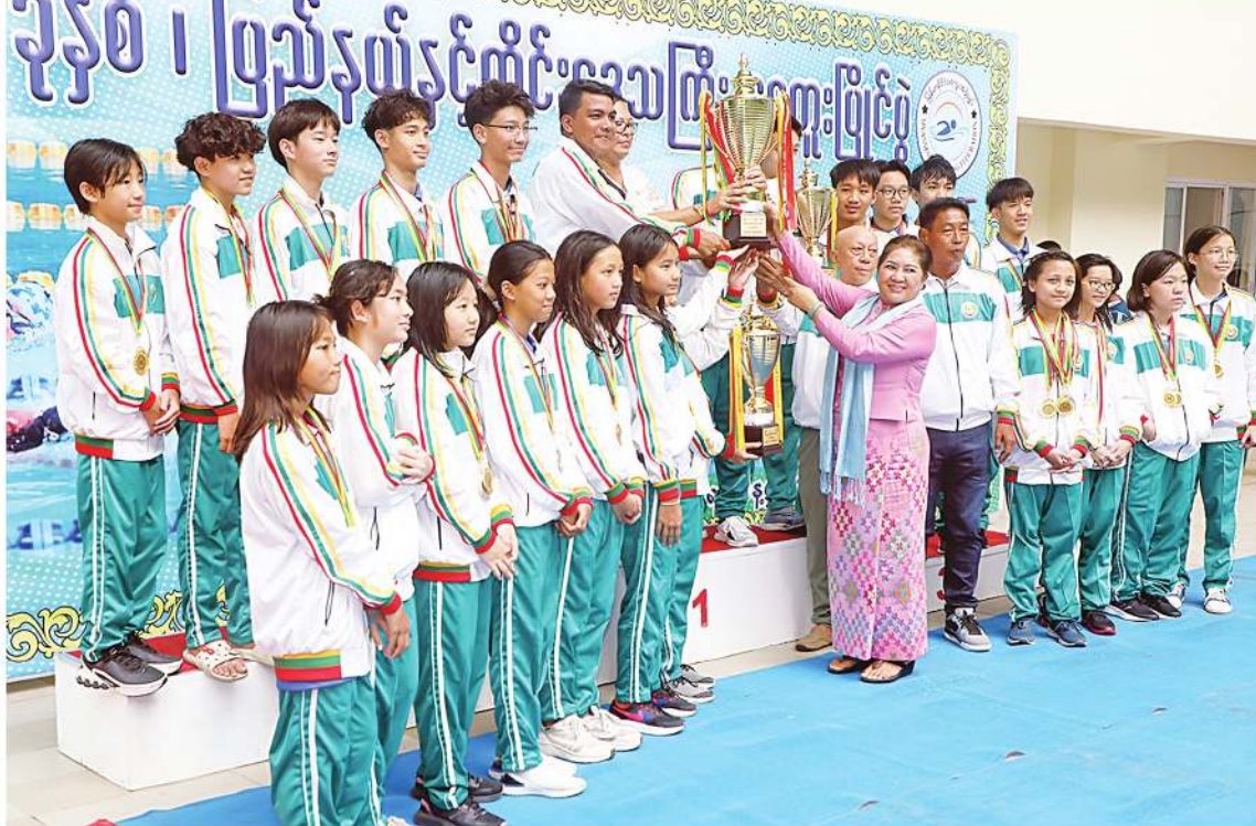
နေပြည်တော် ဇွန် ၁၃ ၂၀၂၄ ခုနှစ် ပြည်နယ်နှင့်တိုင်းဒေသကြီး ရေကူးပြိုင်ပွဲပိုလ်လုပွဲနှင့် ဆုချီးမြှင့်ပွဲအခမ်းအနားကို ယနေ့မွန်းလွဲပိုင်းတွင် နေပြည်တော်ရှိ ဝဏ္ဏသိဒ္ဓိရေကူးကန်၌ အုပ်ချုပ်ရေးကောင်စီအဖွဲ့ဝင်များဖြစ်ကြ ကျင်းပရာ နိုင်ငံတော်စီမံအုပ်ချုပ်ရေးကောင်စီအဖွဲ့ဝင်များ တက်ရောက်ကြည့်ရှုအားပေးကြသည်။ အခမ်းအနားသို့ နိုင်ငံတော်စီမံအုပ်ချုပ်ရေးကောင်စီအဖွဲ့ဝင်များဖြစ်ကြ များ၊ စာမျက်နှာ ၁၈ ကော်လံ ၁ ☆