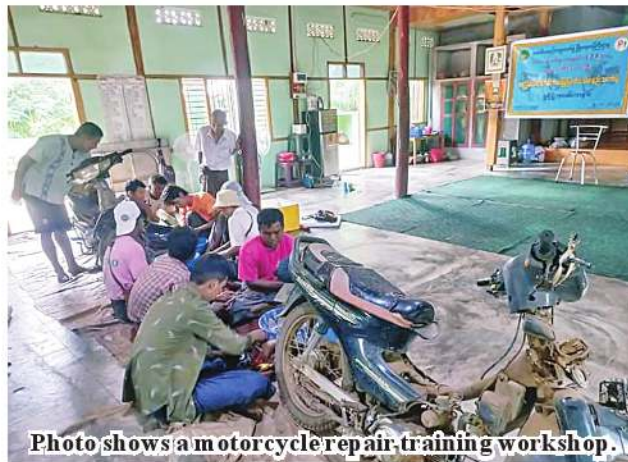
Photo shows a motorcycle repair training workshop.

conducted in collaboration with partner organizations. So far, we have conducted 10 livelihood support training sessions. The duration of each course varies depending on the type of training. Graduates of these courses have been able to start their own businesses in their local areas. We provide training for both urban and rural residents, with a focus on going to rural areas to teach technical skills. These courses allow families to stay together and start their own businesses, leading to more job opportunities and increased income through the production and sale of