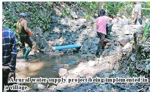
A rural water supply project being implemented in a village.

At present, tender has been invited for the project in 2024-25 financial year. 336