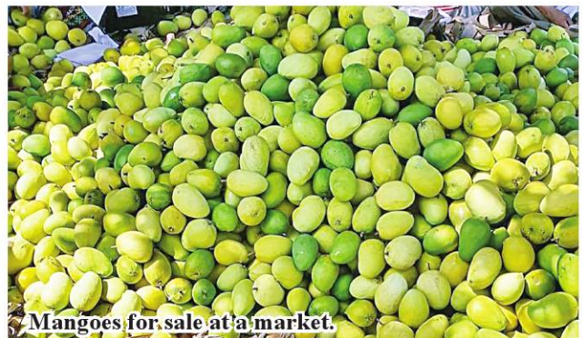
Mangoes for sale at a market.

with trainees how to preserve mango and mango products, and how to produce the mango value-added products with the modern packaging system. The value-added products will benefit trainees and mango farms farmers and owners. 185