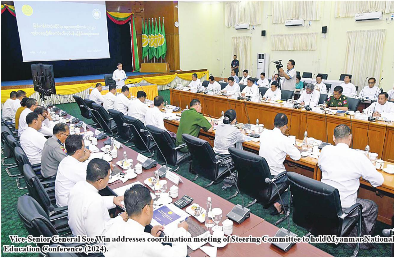
Vice-Senior General Soe Win addresses coordination meeting of Steering Committee to hold Myanmar National Education Conference (2024).

Nay Pyi Taw June 12 The Steering Committee to hold Myanmar National Education Conference (2024) held a coordination meeting at the Ministry of Education here this afternoon, addressed by Chairman of the steering committee Vice Chairman of State Administration Council Deputy Prime Minister Vice-Senior General Soe Win. Present were union ministers, the Nay Pyi Taw Council chair, deputy ministers, Nay Pyi Taw Council member, permanent secretaries, directors general and officials. In his speech, the Vice-Senior General said SAC of Republic of Union of Myanmar is implementing the nine adopted objectives, and to successfully implement the social objectives: To implement a multi-education system that addresses all segments of society, nurturing intellectual and intelligent capacities among the entire population and producing a significant pool of skilled technicians crucial for the manufacturing sector; and To nurture the youth sector, bringing out versatile, physically strong, knowledgeable,