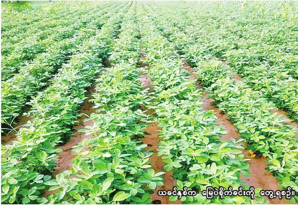
ယခုနှစ်က မြေပဲစိုက်ခင်းကို တွေ့ရစဉ်။

ခင်ဦး ဇွန် ၁၂ ကေထိ စိုက်ပျိုးပြီးစီးပြီဖြစ်ကြောင်း ခင်ဦးမြို့နယ် စိုက်ပျိုးရေး စိုက်ပျိုးရန် လျာထားပြီး ယခုနှစ် မေလမှစတင်စိုက်ပျိုးခဲ့ရာ ယနေ့ထိ မြေပဲ ၉၃၆၅ ဧကထိ စိုက်ပျိုးပြီးစီးပြီဖြစ်