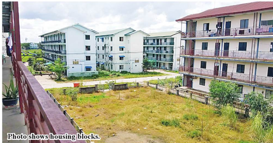
Photo shows housing blocks.