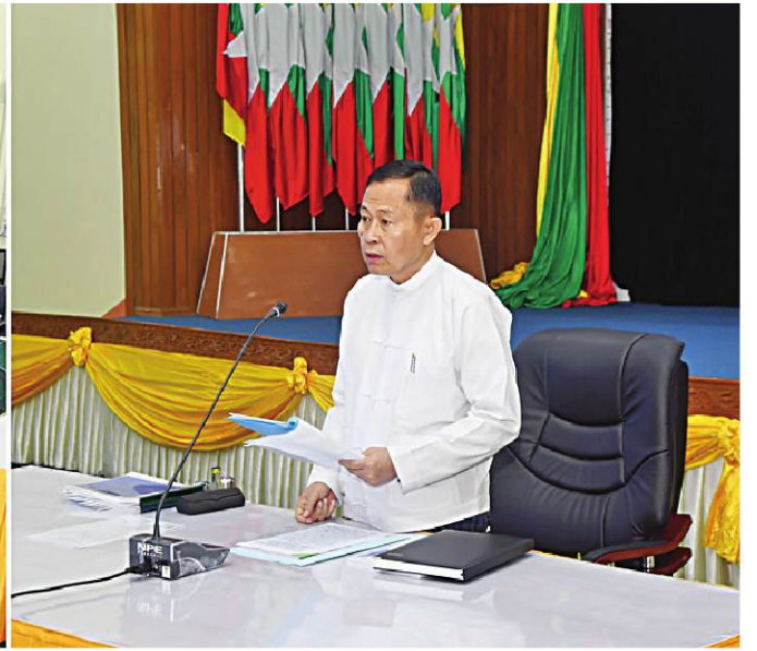
မြန်မာနိုင်ငံလုံးဆိုင်ရာ ပညာရေးညီလာခံ(၂၀၂၄) ကျင်းပရေးဦးစီးကော်မတီဥက္ကဋ္ဌ နိုင်ငံတော်စီမံအုပ်ချုပ်ရေးကောင်စီဒုတိယဥက္ကဋ္ဌ ဒုတိယဝန်ကြီးချုပ် ဒုတိယဗိုလ်ချုပ်မှူးကြီးစိုးဝင်း မြန်မာနိုင်ငံလုံးဆိုင်ရာပညာရေးညီလာခံ(၂၀၂၄) ကျင်းပရေးဦးစီးကော်မတီညှိနှိုင်းအစည်းအဝေးတွင် အမှာစကားပြောကြားစဉ်။