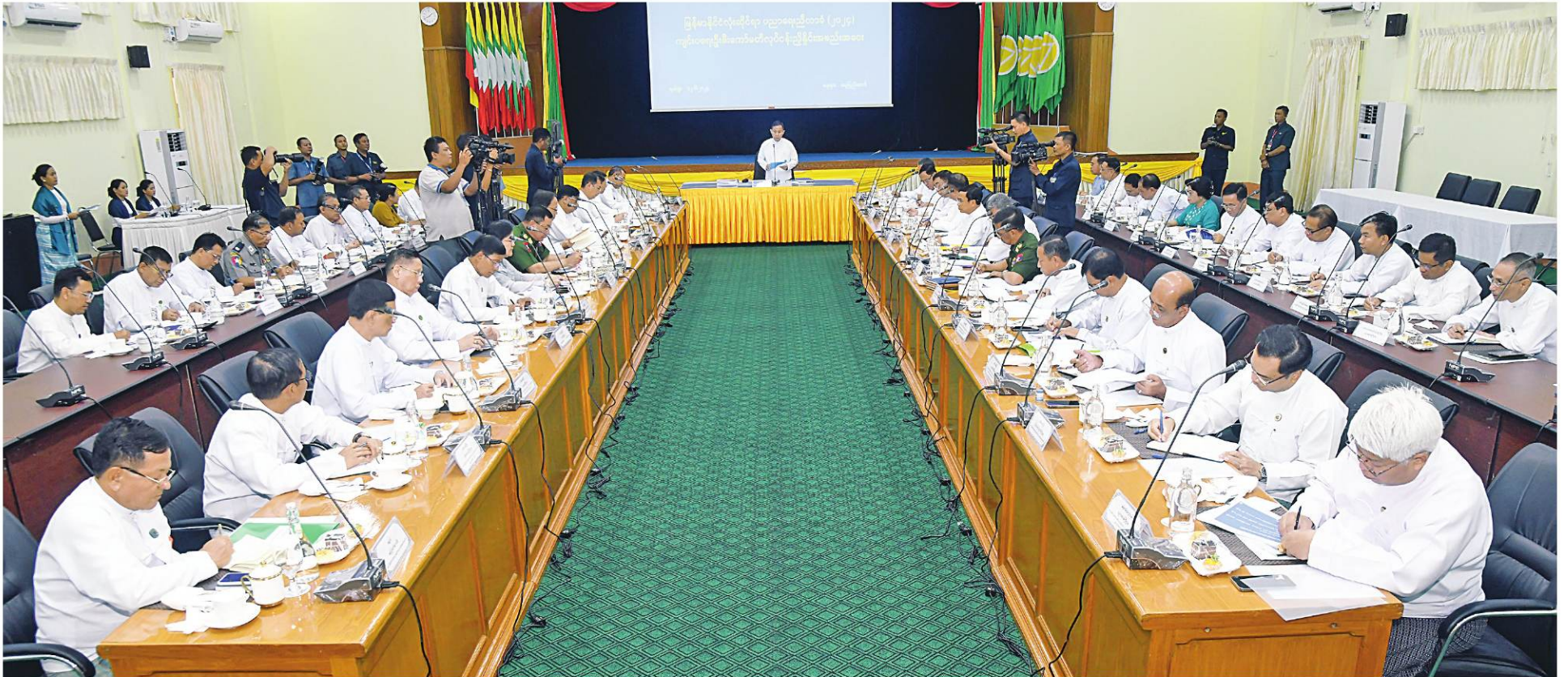
မြန်မာနိုင်ငံလုံးဆိုင်ရာပညာရေးညီလာခံ(၂၀၂၄)ကျင်းပရေးဦးစီးကော်မတီဥက္ကဋ္ဌ နိုင်ငံတော်စီမံအုပ်ချုပ်ရေးကောင်စီ ဒုတိယဥက္ကဋ္ဌ ဒုတိယဝန်ကြီးချုပ် ဒုတိယဗိုလ်ချုပ်မှူးကြီးစိုးဝင်း မြန်မာနိုင်ငံလုံးဆိုင်ရာပညာရေးညီလာခံ(၂၀၂၄)ကျင်းပရေးဦးစီးကော်မတီ ညှိနှိုင်းအစည်းအဝေးတွင် အမှာစကားပြောကြားစဉ်။

နေပြည်တော် ဇွန် ၁၂ ပညာရေးဝန်ကြီးဌာန အစည်းအဝေးခန်းမ၌ ဒုတိယဝန်ကြီးချုပ် ဒုတိယဗိုလ်ချုပ်မှူးကြီးစိုးဝင်း နေပြည်တော်ကောင်စီဝင်၊ အမြဲတမ်းအတွင်းဝန် မြန်မာနိုင်ငံလုံးဆိုင်ရာ ပညာရေးညီလာခံ ကျင်းပရာ မြန်မာနိုင်ငံလုံးဆိုင်ရာပညာရေး တက်ရောက်အမှာစကားပြောကြားသည်။ များ၊ ညွှန်ကြားရေးမှူးချုပ်များနှင့် တာဝန်ရှိသူများ (၂၀၂၄)ကျင်းပရေးဦးစီးကော်မတီ ညှိနှိုင်းအစည်း ညီလာခံ(၂၀၂၄)ကျင်းပရေးဦးစီးကော်မတီဥက္ကဋ္ဌ အစည်းအဝေးသို့ ပြည်ထောင်စုဝန်ကြီးများ၊ တက်ရောက်ကြသည်။ အဝေးကို ယနေ့မွန်းလွဲပိုင်းတွင် နေပြည်တော်ရှိ နိုင်ငံတော်စီမံအုပ်ချုပ်ရေးကောင်စီ ဒုတိယဥက္ကဋ္ဌ နေပြည်တော်ကောင်စီဥက္ကဋ္ဌ၊ ဒုတိယဝန်ကြီးများ၊ စာမျက်နှာ ၁၈ ကော်လံ ၁၂၉