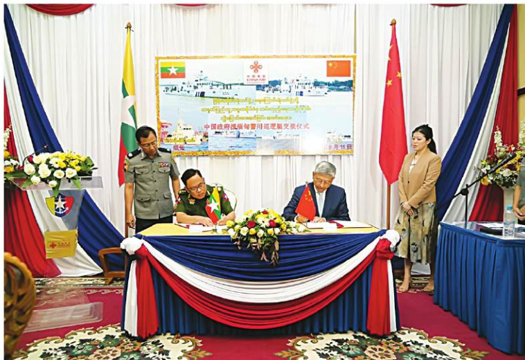
မြန်မာနိုင်ငံရဲတပ်ဖွဲ့ ရေကြောင်းရဲတပ်ဖွဲ့သို့ တရုတ်ပြည်သူ့သမ္မတနိုင်ငံက ကင်းလှည့်ရေယာဉ် ခြောက်စီး လွှဲပြောင်းပေးအပ်ခြင်း အခမ်းအနားကျင်းပပြုလုပ်စဉ်။

နေပြည်တော် ၉ နံ ၁၁ ပြည်ထဲရေးဝန်ကြီးဌာန မြန်မာနိုင်ငံရဲတပ်ဖွဲ့ ရေကြောင်းရဲတပ်ဖွဲ့သို့ တရုတ်ပြည်သူ့သမ္မတနိုင်ငံက အကူအညီပေးအပ်သည့် ကင်းလှည့်ရေယာဉ် ခြောက်စီးလွှဲပြောင်းပေးအပ်ခြင်း အခမ်းအနားကို ယနေ့နံနက်ပိုင်းတွင် ရန်ကုန်မြို့ အမှတ်(၃) ရေကြောင်း ရဲကွပ်ကဲမှုအဖွဲ့ခွဲပွားရုံး (ဝါးတန်း)၌ ကျင်းပပြုလုပ်ခဲ့သည်။ အခမ်းအနားသို့ ပြည်ထဲရေးဝန်ကြီးဌာန ဒုတိယဝန်ကြီး မြန်မာနိုင်ငံရဲတပ်ဖွဲ့ ရဲချုပ် ဒုတိယဗိုလ်ချုပ်ကြီးနီလင်းအောင်၊ ပြည်ထဲရေးဝန်ကြီးဌာန ဒုတိယဝန်ကြီး မြန်မာနိုင်ငံရဲတပ်ဖွဲ့ ရဲချုပ် ဒုတိယဗိုလ်ချုပ်ကြီးနီလင်းအောင်နှင့် တရုတ်ပြည်သူ့သမ္မတနိုင်ငံ သံအမတ်ကြီး H.E Mr. Chen Hai တို့ဦးဆောင်၍ အခမ်းအနား တက်ရောက်လာကြသူများသည် လမ်းမတော်မြို့နယ် ကျန်းမာရေး