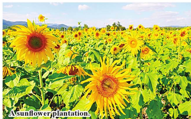
A sunflower plantation.

In Magway Region, 78 private beekeepers are operating more than 13,000 beehives and six beekeeping farms of the township produce honey yearly.