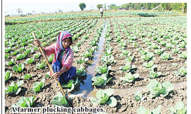
A farmer plucking cabbages.