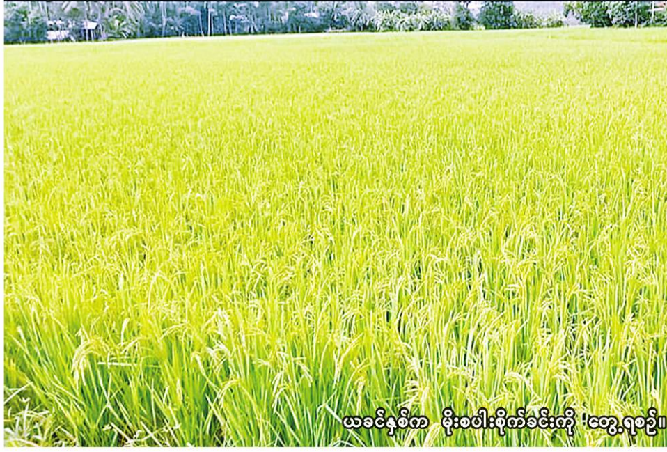
ယခုနှစ်က မိုးစပါးစိုက်ခင်းကို တွေ့ရစဉ်။