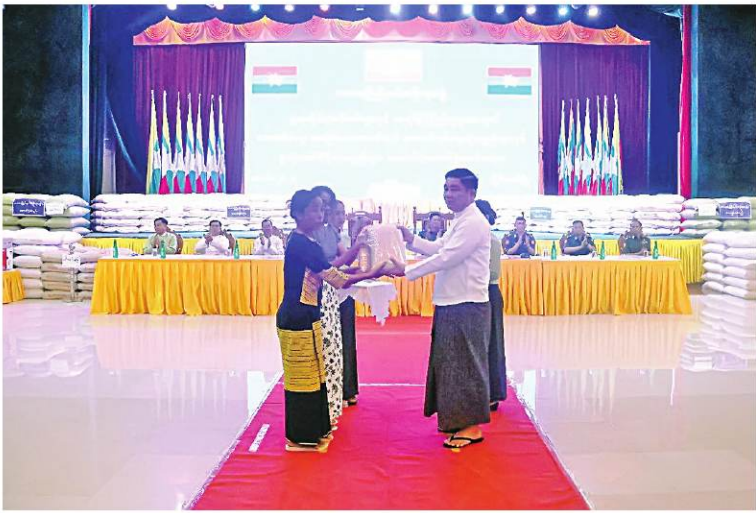
ကယားပြည်နယ်ဝန်ကြီးချုပ် ဦးစော်မျိုးတင် ဌာနဆိုင်ရာဝန်ထမ်းများနှင့် ယာယီနေရပ်စွန့်ခွာသူ ဒေသခံပြည်သူများကို အခြေခံစားသောက်ကုန်များ ထောက်ပံ့ပေးအပ်စဉ်။

နေပြည်တော် ဇွန် ၁၁ ကယားပြည်နယ်အစိုးရအဖွဲ့က ဌာနဆိုင်ရာဝန်ထမ်းများနှင့် ယာယီနေရပ်စွန့်ခွာသူ ဒေသခံပြည်သူများအား ထောက်ပံ့ပေး အခြေခံစားသောက်ကုန်၊ ဆောက်လုပ်ရေးပစ္စည်းများနှင့် ရုံးသုံးစက်ကိရိယာပစ္စည်းများ ထောက်ပံ့ပေးအပ်ပွဲကို ယနေ့မနက် ၉ နာရီခွဲတွင် ကယားပြည်နယ် ခန်းမ၌ ပြုလုပ်ရာ ကယားပြည်နယ်ဝန်ကြီးချုပ် ဦးစော်မျိုးတင်၊ ကာကွယ်ရေးဦးစီးချုပ်ကြီး(ကြည်း)မှ ဗိုလ်ချုပ်ဗိုလ်မှူးကြီး ဦးစိုးဝင်းတို့က ကယားပြည်နယ်အတွင်း နယ်မြေတည်ငြိမ်အေးချမ်းစေရေးနှင့် ဒေသဖွံ့ဖြိုးတိုးတက်ရေးအတွက် ဒေသခံပြည်သူများနှင့်ပူးပေါင်း၍ ကြိုးပမ်းအရေးပိုင်တိုင်းစစ်ဌာနချုပ် တိုင်းမှူး ဆောင်ရွက်လျက်ရှိသည့် အခြေအနေများ