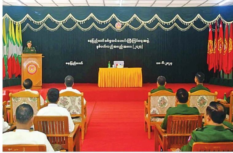
နေပြည်တော်စစ်မှုထမ်းဟောင်းကြီးကြပ်ရေးအဖွဲ့ နှစ်ပတ်လည်အစည်းအဝေး (၂၀၂၄) ကျင်းပစဉ်။

နေပြည်တော် ၉ နံနက် ၁၁ မြန်မာနိုင်ငံ စစ်မှုထမ်းဟောင်းအဖွဲ့ နေပြည်တော်စစ်မှုထမ်းဟောင်းကြီးကြပ်ရေးအဖွဲ့နှစ်ပတ်လည် အစည်းအဝေး(၂၀၂၄) ကို ယနေ့နံနက်ပိုင်းတွင် နေပြည်တော်တိုင်းစစ်ဌာနချုပ် ပုဗ္ဗသီရိတပ်နယ်ရှိ နယ်မြေခွဲတပ်ရင်းခန်းမ၌ ပြုလုပ်ရာ နေပြည်တော်စစ်မှုထမ်းဟောင်းကြီးကြပ်ရေးအဖွဲ့နာယက နေပြည်တော်တိုင်းစစ်ဌာနချုပ်တိုင်းမှူး ဗိုလ်ချုပ်စိုးမင်းနှင့် အဖွဲ့ဝင်များ၊ နေပြည်တော် စစ်မှုထမ်းဟောင်းကြီးကြပ်ရေးအဖွဲ့ဥက္ကဋ္ဌနှင့် စစ်မှုထမ်းဟောင်းအဖွဲ့ဝင်များ တက်ရောက်ကြသည်။ ဦးစွာ တိုင်းမှူးက အမှာစကားပြောကြားသည်။ ထို့နောက် စစ်မှုထမ်းဟောင်းအဖွဲ့ဝင်များအတွက် စားသောက်ဖွယ်ရာများ ပေးအပ်ရာ နေပြည်တော် စစ်မှုထမ်းဟောင်းကြီးကြပ်ရေးကော်မတီဥက္ကဋ္ဌက လက်ခံရယူသည်။ ယင်းနောက် တိုင်းမှူးနှင့် တာဝန်ရှိသူ