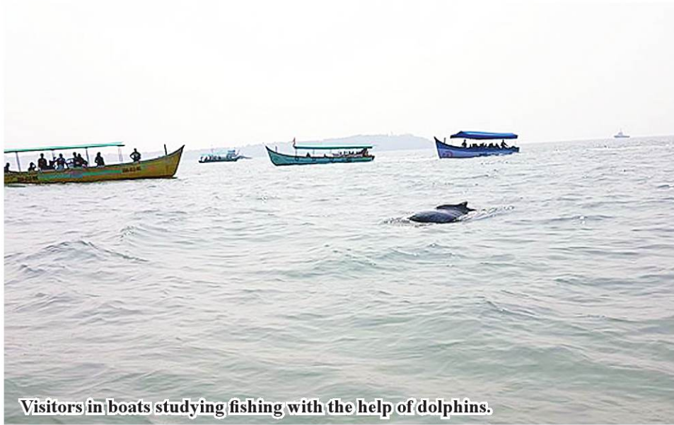
Visitors in boats studying fishing with the help of dolphins.