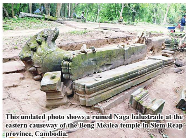
This undated photo shows a ruined Naga balustrade at the eastern causeway of the Beng Mealea temple in Siem Reap province, Cambodia.

Phnom Penh June 11 Cambodia has prepared to restore the structure of the eastern causeway of Beng Mealea temple in the famed Angkor Archaeological Park, under the Lancang-Mekong Cooperation (LMC) Special Fund, the APSARA National Authority (ANA) said in a news release on Tuesday.