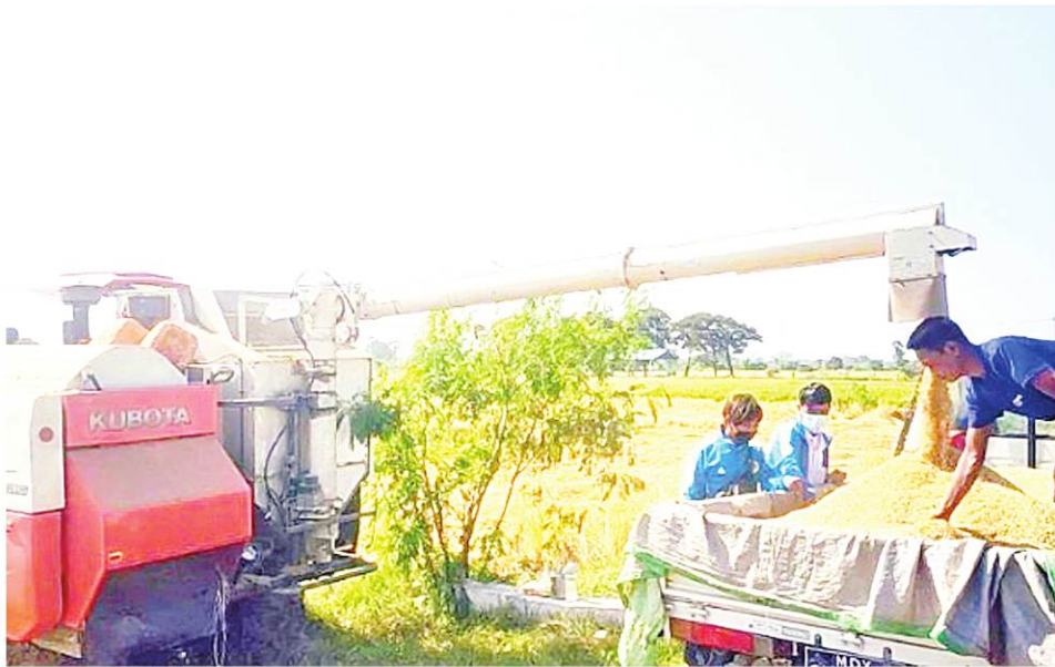
ပုသိမ် ဇွန် ၁၁