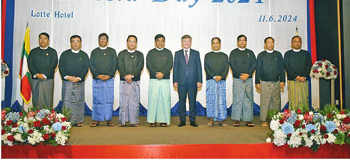
နိုင်ငံတော်စီမံအုပ်ချုပ်ရေးကောင်စီအဖွဲ့ဝင် ညွှန်ကြားရေးမှူးချုပ်ကြီး(ကြည်း၊ ရေ၊ လေ) ဗိုလ်ချုပ်ကြီးမောင်မောင်အေး၊ မြန်မာနိုင်ငံဆိုင်ရာ ရုရှားဖက်ဒရေးရှင်းနိုင်ငံသံအမတ်ကြီး H. E. Mr. Iskander Azizov နှင့် အစမ်းအနားတက်ရောက်လာကြသူများ စုပေါင်းမှတ်တမ်းတင် ဓာတ်ပုံရိုက်စဉ်။