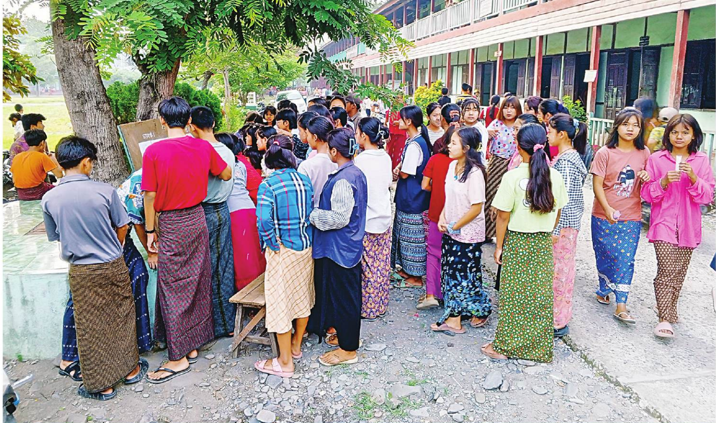
၂၀၂၄ ခုနှစ် တက္ကသိုလ်ဝင်စာမေးပွဲအောင်စာရင်းကို ကျောင်းသား၊ ကျောင်းသူများနှင့် ကျောင်းသားမိဘများ လာရောက်ကြည့်ရှုနေမှုကို တွေ့ရစဉ်။

နေပြည်တော် ဇွန် ၁၁ | ကျင်းပဆောင်ရွက်ပေးခဲ့သည့် တက္ကသိုလ်ဝင်စာမေးပွဲအောင်စာရင်းများကို ယနေ့နံနက်ပိုင်းတွင် ကောင်စီအပါအဝင် တိုင်းဒေသကြီးနှင့် ပြည်နယ်တစ်နိုင်ငံလုံးအတွက် တစ်ပြိုင်တည်းဖြင့် အပြီးအတွင်းရှိ ကျောင်းများ၌ ထုတ်ပြန်ကြေညာသည်။