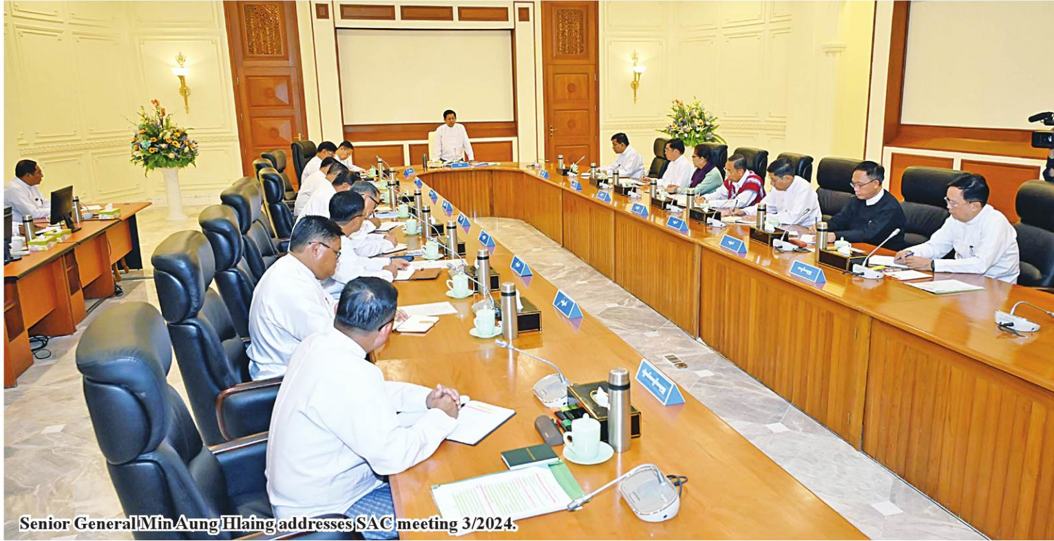
Senior General Min Aung Hlaing addresses SAC meeting 3/2024.

Citizens are the supporters of national development, but negative minded citizens are destructive to the country; terrorists must be opposed with people's power