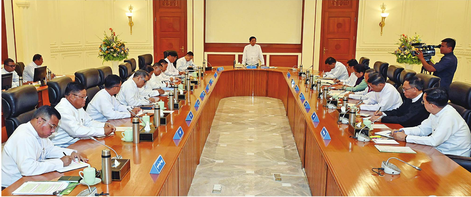
နိုင်ငံတော်စီမံအုပ်ချုပ်ရေးကောင်စီဥက္ကဋ္ဌ နိုင်ငံတော်ဝန်ကြီးချုပ် ဗိုလ်ချုပ်မှူးကြီးမင်းအောင်လှိုင် နိုင်ငံတော်စီမံအုပ်ချုပ်ရေးကောင်စီအစည်းအဝေး(၃/ ၂၀၂၄)တွင် အမှာစကားပြောကြားစဉ်။

နိုင်ငံတစ်ခုတိုးတက်ကောင်းမွန်ရေးအတွက် နိုင်ငံတွင် နေထိုင်ကြသူများက ဆောင်ရွက်ခြင်းဖြစ်သကဲ့သို့ နိုင်ငံကို ပျက်စီးအောင် အဖျက်သမားစိတ်ဓာတ်ရှိသည့် ၎င်းနိုင်ငံသားများကပင်ပြုလုပ်ခြင်းဖြစ်၊ အဖျက်သမားများကို လူထုအားဖြင့် ဆန့်ကျင်ရန်လို