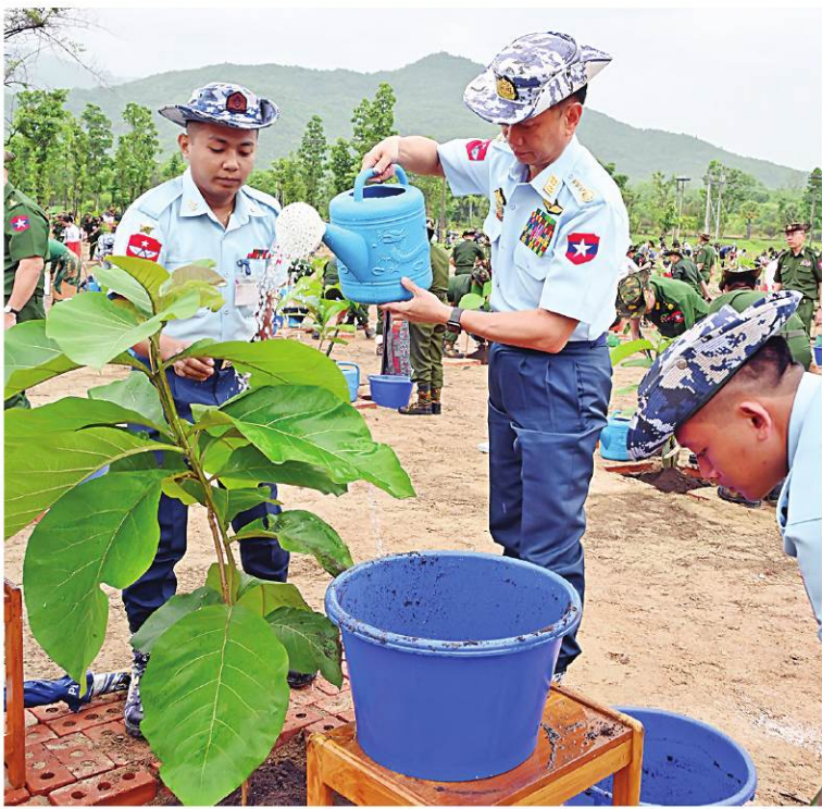
စာမျက်နှာ ၁၇ မှအဆက် စုပေါင်းသစ်ပင်စိုက်ပျိုးနေမှုကို လှည့်လည်ကြည့်ရှုအားပေးကြသည်။

၂၀၁၁ ခုနှစ်မှ ၂၀၂၄ ခုနှစ် ပထမအကြိမ် သစ်ပင်စိုက်ပျိုးပွဲအထိ ရေဆင်းဆည် ပတ်ဝန်းကျင်၌ ရတနာတန်းဝင်ပင်၊ နှစ်ရှည်သီးနှံပင်နှင့် အရိပ်ရလေကာပင် စုစုပေါင်း ၁၉၆၄၂၅ ပင်အား စိုက်ပျိုးခဲ့ပြီးဖြစ်