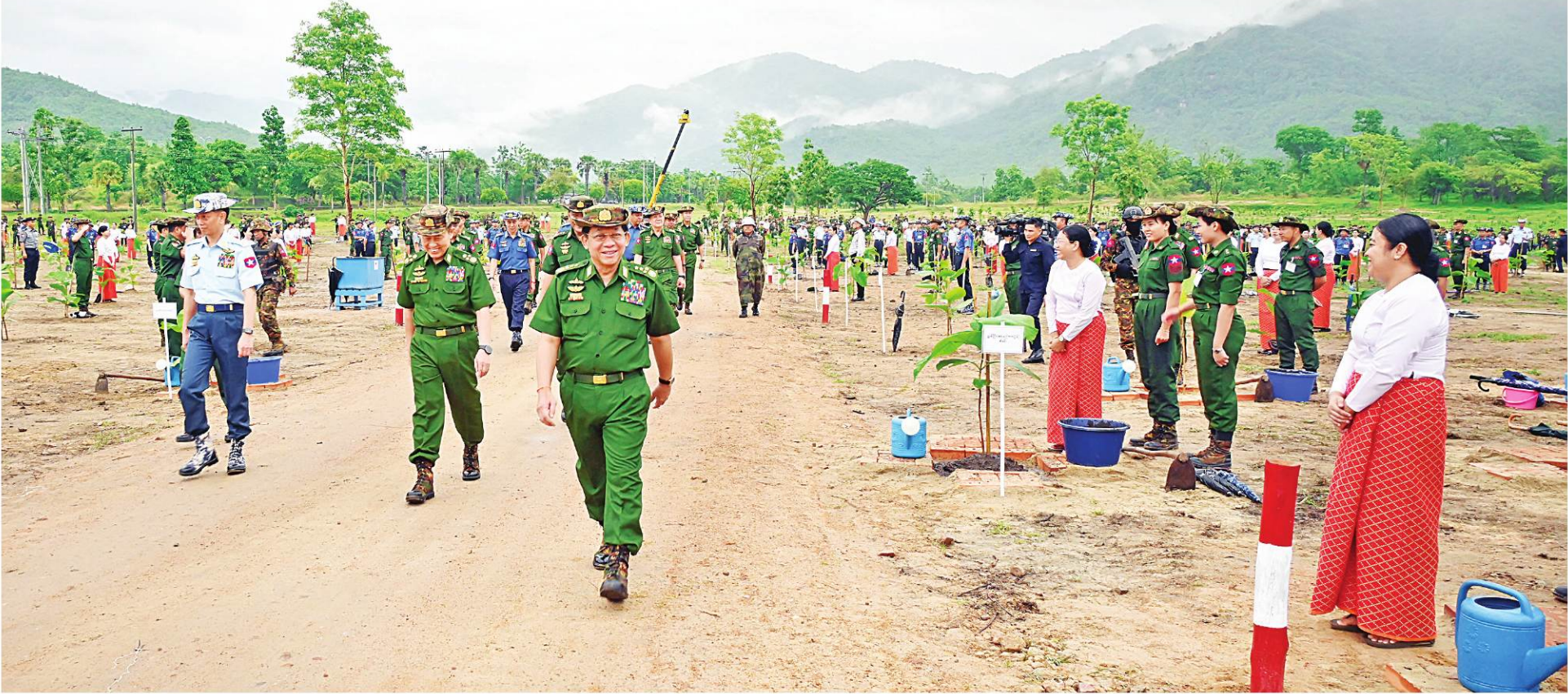
နိုင်ငံတော်စီမံအုပ်ချုပ်ရေးကောင်စီဥက္ကဋ္ဌ တပ်မတော်ကာကွယ်ရေးဦးစီးချုပ် ဗိုလ်ချုပ်မှူးကြီးမင်းအောင်လှိုင် အရာရှိ၊ စစ်သည်၊ မိသားစုများ၏ စုပေါင်းသစ်ပင်စိုက်ပျိုးနေမှုကို လှည့်လည်ကြည့်ရှုအားပေးစဉ်။

နေပြည်တော် ဇွန် ၇ တစ်ဖက်တစ်လမ်းမှ အထောက်အကူဖြစ်စေရန် တစ်မသစ်ပင်စိုက်ပျိုးပွဲများ ကျင်းပပြုလုပ်လျက် အကြိမ် မိုးရာသီသစ်ပင်စိုက်ပျိုးပွဲအခမ်းအနားကို နေပြည်တော် ဇေယျာသီရိမြို့နယ် ရေဆင်းဆည် နှင့်ရာသီဥတုကို အထောက်အကူဖြစ်စေရန်အရိပ် (လေ) မိသားစုများနှင့် တိုင်းစစ်ဌာနချုပ်အသီးသီး ယနေ့တွင် ၂၀၂၄ ခုနှစ် ကာကွယ်ရေးဦးစီး အနီး၌ ကျင်းပပြုလုပ်ရာ စာမျက်နှာ ၁၆ ကော်လံ ၁၂။