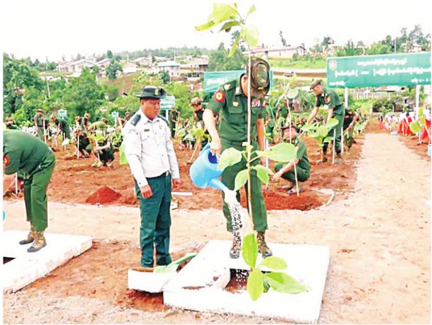
အရှေ့အလယ်ပိုင်းတိုင်းစစ်ဌာနချုပ်၌ ၂၀၂၄ ခုနှစ် ပထမအကြိမ် မိုးရာသီသစ်ပင်စိုက်ပျိုးပွဲအခမ်းအနားကျင်းပစဉ်။