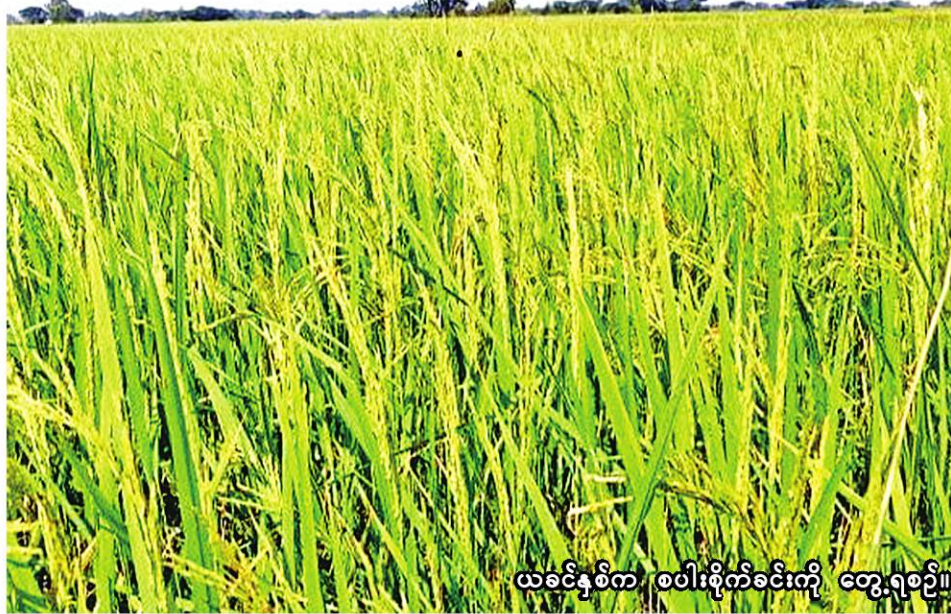
ယခင်နှစ်က စပါးစိုက်ခင်းကို တွေ့ရစဉ်။