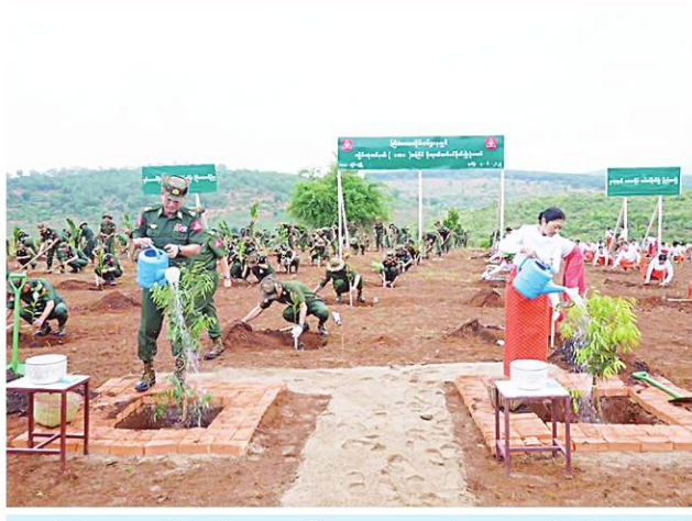
ကြိမ်ဒေသတိုင်းစစ်ဌာနချုပ်၌ ၂၀၂၄ ခုနှစ် ပထမအကြိမ် မိုးရာသီ သစ်ပင်စိုက်ပျိုးပွဲအခမ်းအနားကျင်းပစဉ်။