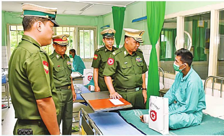
ရန်ကုန်တိုင်းစစ်ဌာနချုပ် တိုင်းမှူး ဗိုလ်ချုပ်ဇော်ဟိန်း ဆေးကုသမှုခံယူနေသူတစ်ဦးကို ရင်းရင်းနှီးနှီး မေးမြန်းအားပေးစကား ပြောကြားစဉ်။

နေပြည်တော် ၇ ဇွန် ၇ ကချင်ပြည်နယ် မြစ်ကြီးနားမြို့ရှိ တပ်မတော်ဆေးရုံ၊ ရန်ကုန်တိုင်းဒေသကြီး မင်္ဂလာဒုံမြို့နယ်ရှိ တပ်မတော်အရိုးရောဂါ အထူးကုဆေးရုံကြီး(ခုတင်-၅၀၀) နှင့် တပ်မတော်ဆေးရုံကြီး(ခုတင်-၁၀၀၀)၊ စစ်ကိုင်းတိုင်းဒေသကြီး ကလေးမြို့ရှိ တပ်မတော်ဆေးရုံတို့၌ တက်ရောက်ဆေးကုသမှုခံယူနေသော အရာရှိ၊ စစ်သည်၊ မိသားစုဝင်များ၊ ပြည်သူ့စစ်(ဌာန) တပ်ဖွဲ့ဝင်များ၊ စစ်မှုထမ်းဟောင်းအဖွဲ့ဝင်များ၊ မြန်မာနိုင်ငံရဲတပ်ဖွဲ့ဝင်များနှင့် ဒေသခံ ပြည်သူများကို ယနေ့တွင် သက်ဆိုင်ရာ