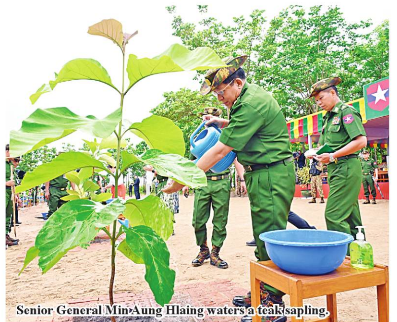
Senior General Min Aung Hlaing waters a teak sapling.

Then, the Senior General and wife grew a teak sapling. Next, the Vice-Senior General and wife, the Chief of the General Staff