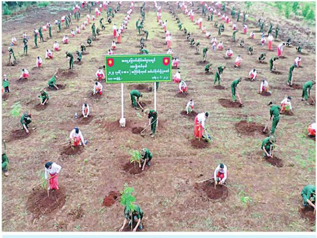
အရှေ့မြောက်တိုင်းစစ်ဌာနချုပ်၌ ၂၀၂၄ ခုနှစ် ပထမအကြိမ် မိုးရာသီ သစ်ပင်စိုက်ပျိုးပွဲအခမ်းအနားကျင်းပစဉ်။