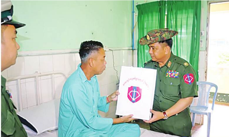
အနောက်မြောက်တိုင်းစစ်ဌာနချုပ်မှ တာဝန်ရှိသူတစ်ဦးက ဆေးကုသမှုခံယူနေသူတစ်ဦးကို အာဟာရဖြည့် စားသောက်ဖွယ်ရာများနှင့် ထောက်ပံ့ငွေများ ပေးအပ်စဉ်။

ထို့နောက် တိုင်းမှူးများနှင့် တာဝန်ရှိသူများသည် ဆေးရုံများအတွင်း လှည့်လည်ကြည့်ရှု၍ လိုအပ်သည်များ ညှိနှိုင်းဆောင်ရွက်ပေးခဲ့ကြကြောင်း သတင်းရရှိသည်။ (၅၀၁)