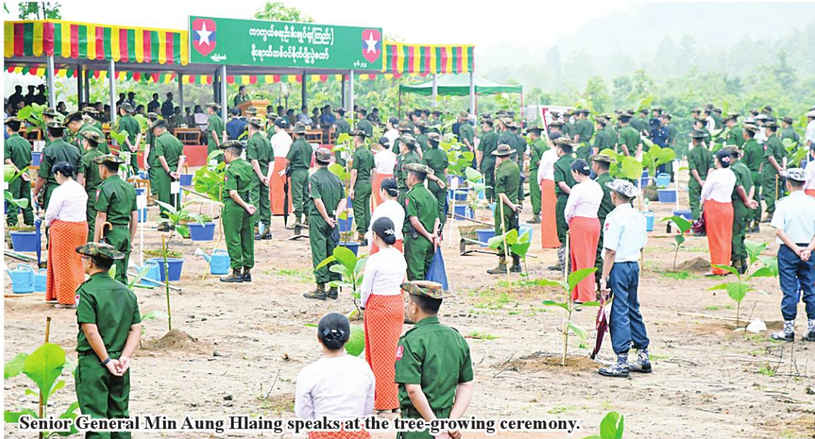
Senior General Min Aung Hlaing speaks at the tree-growing ceremony.