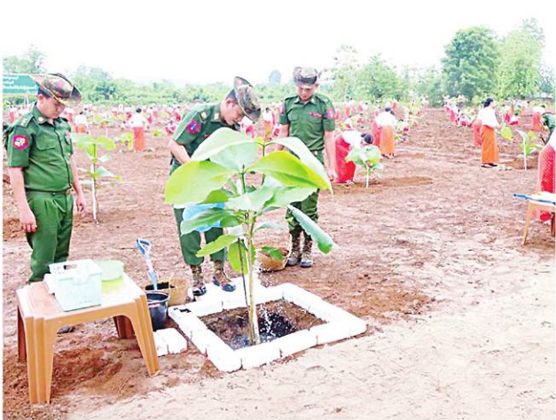
မြောက်ပိုင်းတိုင်းစစ်ဌာနချုပ်၌ ၂၀၂၄ ခုနှစ် ပထမအကြိမ် မိုးရာသီ သစ်ပင်စိုက်ပျိုးပွဲအခမ်းအနားကျင်းပစဉ်။