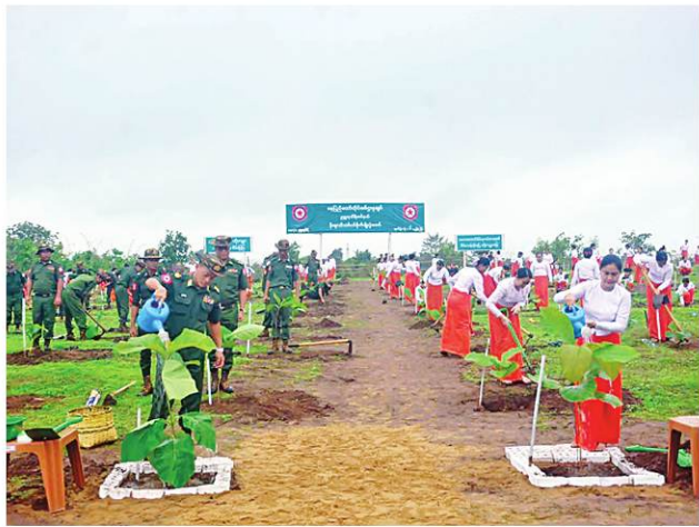
နေပြည်တော်တိုင်းစစ်ဌာနချုပ်၌ ၂၀၂၄ ခုနှစ် ပထမအကြိမ် မိုးရာသီ သစ်ပင်စိုက်ပျိုးပွဲအခမ်းအနားကျင်းပစဉ်။