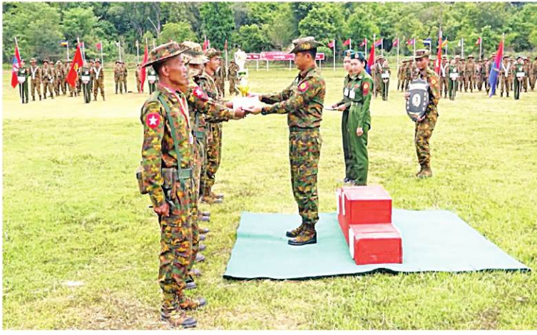
အရှေ့အလယ်ပိုင်းတိုင်းစစ်ဌာနချုပ် တိုင်းမှူး ဗိုလ်ချုပ်မှူးမင်းထွန်း ခိုင်းဆုရရှိသည့် အသင်းကို ခိုင်းဆုပေးအပ်ချီးမြှင့်စဉ်။

နေပြည်တော် ၇ ဇွန် ၇ အရှေ့အလယ်ပိုင်းတိုင်းစစ်ဌာနချုပ် ၂၀၂၄ ခုနှစ် တိုင်းမှူးခိုင်း အမျိုးသား အမျိုးသမီး သေနတ်ပစ်ပြိုင်ပွဲ ပိတ်ပွဲနှင့် ဆုပေးပွဲကို ယနေ့နံနက်ပိုင်းတွင် ကျင်းပတောင်းမြို့ရှိ နယ်မြေခံသင်တန်း ကျောင်းစက်ပစ်ကွင်း၌ ပြုလုပ်ရာ တိုင်းမှူး ဗိုလ်ချုပ်မှူးမင်းထွန်းနှင့် တာဝန်ရှိသူများ၊ အရာရှိ၊ စစ်သည်၊ မိသားစုဝင်များနှင့် ပြိုင်ပွဲဝင်အသင်းများ တက်ရောက်ကြသည်။ ဦးစွာ တိုင်းမှူးနှင့် တက်ရောက်လာသူများက ပြိုင်ပွဲဝင်အသင်းများ၏ ယှဉ်ပြိုင်ပစ်ခတ်နေမှုများကို ကြည့်ရှုအားပေးသည်။ ထို့နောက် ဆုပေးပွဲကိုဆက်လက်ပြုလုပ်ရာ တစ်ဦးချင်း ဆုရရှိသူများ၊ အသင်းလိုက် ဆုများနှင့် ခိုင်းဆုရရှိသောအသင်းများကို ဆုများ အသီးသီးပေးအပ်ချီးမြှင့်သည်။