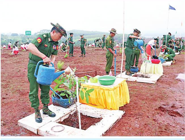
အရှေ့ပိုင်းတိုင်းစစ်ဌာနချုပ်၌ ၂၀၂၄ ခုနှစ် ပထမအကြိမ် မိုးရာသီ သစ်ပင်စိုက်ပျိုးပွဲအခမ်းအနားကျင်းပစဉ်။