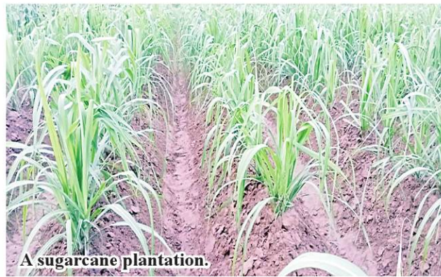
A sugarcane plantation.

Local farmers have to cost K600,000 to K700,000 per acre of sugarcane in cultivation but it yields 30 tons