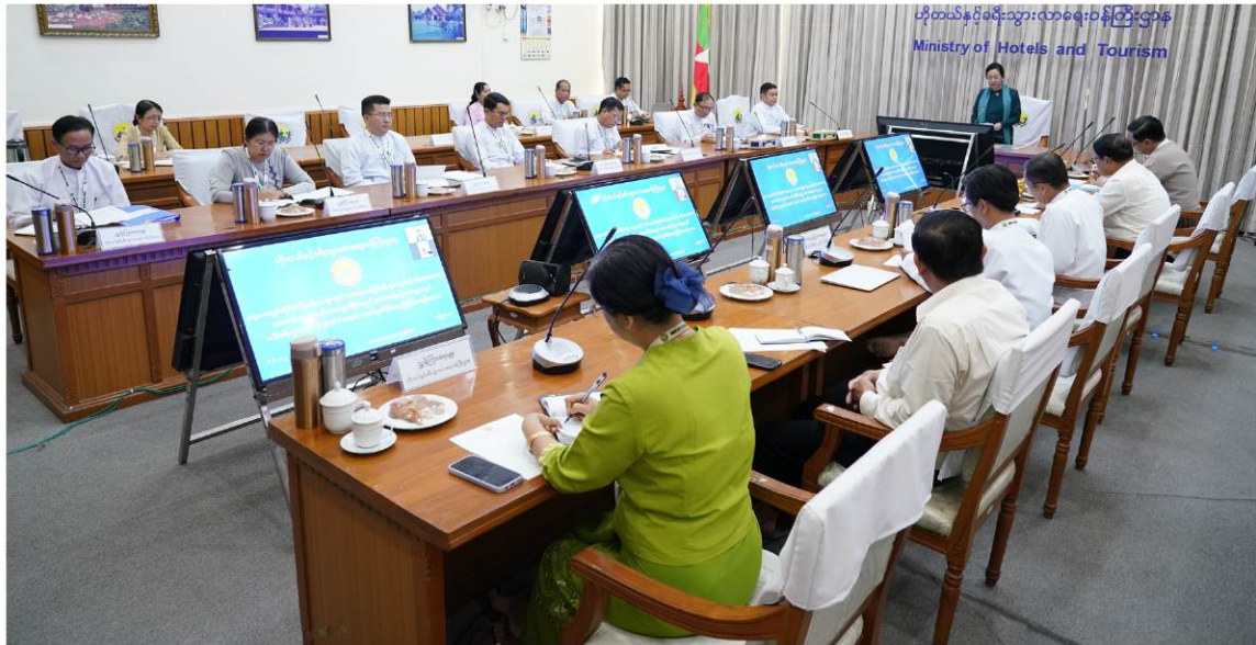
ဟိုတယ်နှင့်ခရီးသွားလာရေးဝန်ကြီးဌာန Ministry of Hotels and Tourism