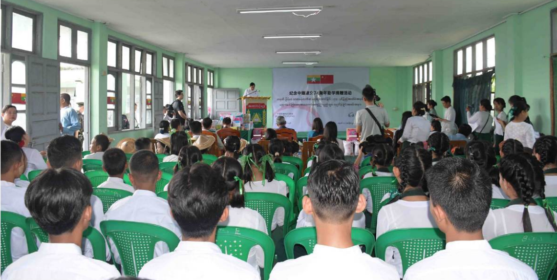
တာဝန်ရှိသူများသည် တရုတ်-မြန်မာ သံတမန်ဆက်ဆံရေးထူထောင်ခြင်း ၇၄