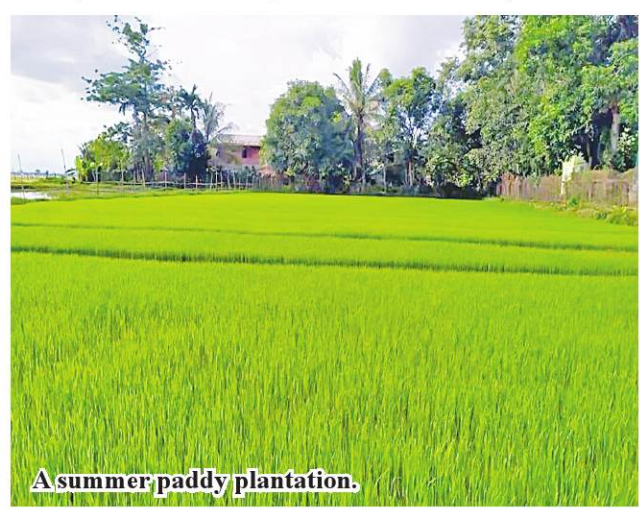
A summer paddy plantation.

ship, and from February statistics from the Department of Agriculture for Wetlet Township.