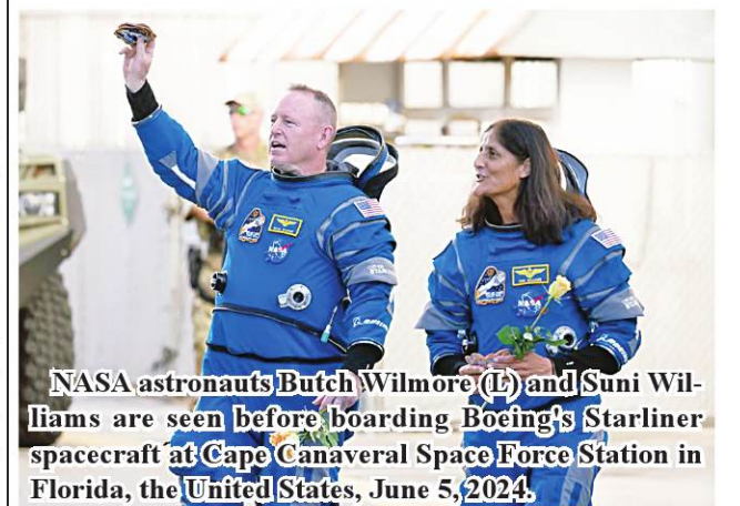
NASA astronauts Butch Wilmore (L) and Suni Williams are seen before boarding Boeing's Starliner spacecraft at Cape Canaveral Space Force Station in Florida, the United States, June 5, 2024.

The spacecraft is set to dock to the ISS on Thursday, or June 6.