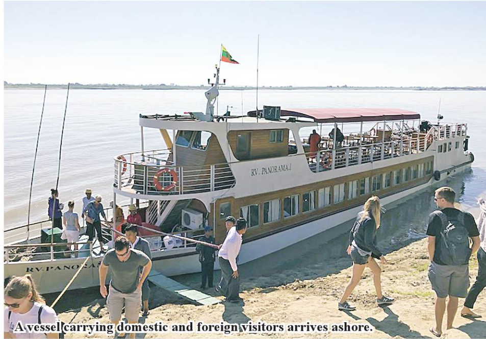
A vessel carrying domestic and foreign visitors arrives ashore.

Mandalay June 6 Passenger vessels are allowed to hire skillful pilots for water courses from Mandalay to Mingun and Bagan charging K3,000 per mile in