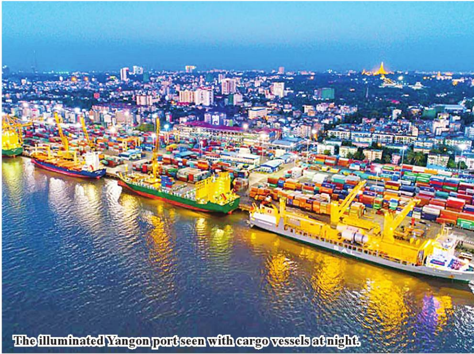
The illuminated Yangon port seen with cargo vessels at night.

made to admit 50 container vessels from 13 shipping lines in Yangon in June of 2024-25 financial year.