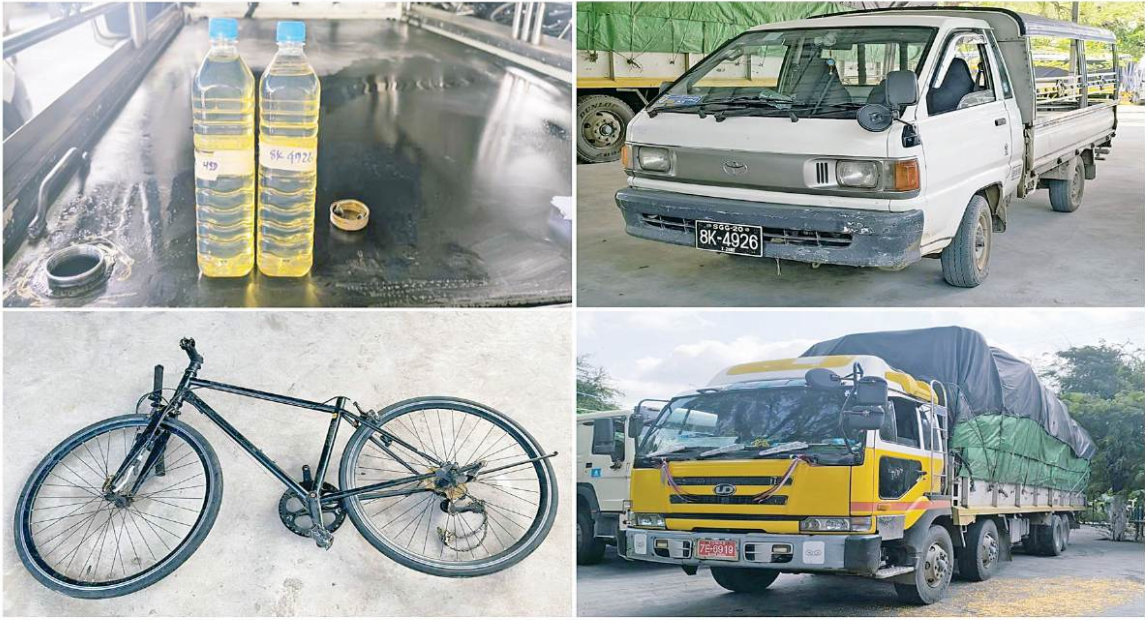
နေပြည်တော် ဇွန် ၆

တရားမဝင်ကုန်သွယ်မှုတိုက်ဖျက်ရေးဦးဆောင်ကော်မတီ၏ ကြီးကြပ်ကွပ်ကဲမှုဖြင့် တရားမဝင် ကုန်သွယ်မှုများကို ဥပဒေနှင့်အညီ ထိရောက်စွာ တားဆီးအရေးယူနိုင်ရေး ဆောင်ရွက်လျက်ရှိပါသည်။ ထိုသို့ ဆောင်ရွက်လျက်ရှိရာ ဇွန် ၄ ရက်တွင် အကောက်ခွန်ဦးစီးဌာန၏ စီမံခန့်ခွဲမှုဖြင့် တာဝန်ကျပေါင်းအဖွဲ့က စစ်ဆေးမှုများဆောင်ရွက်ခဲ့ရာ မြန်မာ့စက်မှုဆိပ်ကမ်း၌ ကုန်သွယ်မှုတစ်လုံးအတွင်းမှ သွင်းကုန်ကြေညာလာတွင် ကြေညာထားသည့်နှင့် ကွဲလွဲစွာပါရှိလာသည့် တရုတ်နိုင်ငံထုတ် လယ်ထွန်စက်အပို