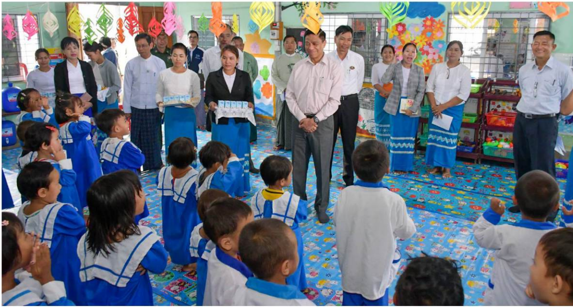
စားပင်များ စိုက်ပျိုးထားရှိရန်နှင့် ထောက်ပံ့မှုနှင့်အညီ ထိရောက်မြန်ဆန်စွာဖြင့် ပြည်သူ့ဆက်လက်၍ ပြည်ထောင်စုဝန်ကြီးနှင့်အဖွဲ့သည် ဟိုပုံးမြို့ရှိ ကန်သာယာမူလတန်း

ထိုသို့ကြည့်ရှုစစ်ဆေးရာတွင် ပြည်ထောင်စုဝန်ကြီးက စင်တာအတွင်းအပြင် သန့်ရှင်းသပ်ရပ်စေရေးနှင့် မီးဘေးလုံခြုံရေး အမြဲမပြတ် ဆောင်ရွက်ကြရန်၊ ဝင်းခြံအတွင်း အရိပ်ရအပင်နှင့် ရာသီအလိုက် အလှပင်၊ သီးပင်၊