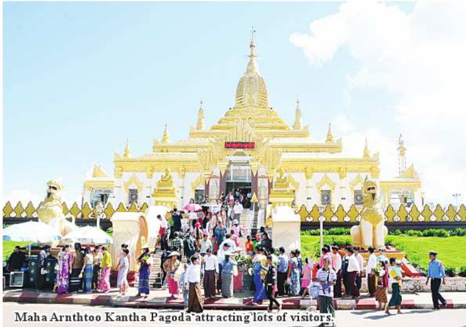
Maha Arnthtoo Kantha Pagoda attracting lots of visitors.