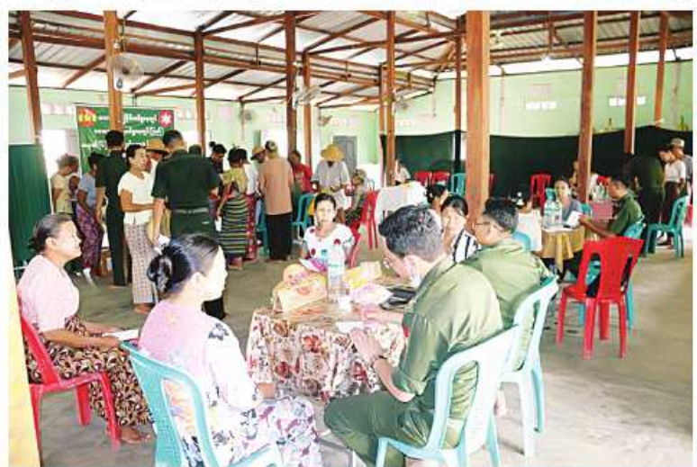
တောင်ပိုင်းတိုင်းစစ်ဌာနချုပ် နယ်လှည့်ဆေးကုသရေးအဖွဲ့က ဒေသခံပြည်သူများကို ကျန်းမာရေးစောင့်ရှောက်မှုလုပ်ငန်းများ ဆောင်ရွက်ပေးစဉ်။

နေပြည်တော် မေ ၁၇ ရန်ကုန်တိုင်းဒေသကြီး ခရမ်းမြို့နယ် မတ္တသံကျေးရွာနှင့် ပတ်ဝန်းကျင်ကျေးရွာ များမှ သံဃာတော်များနှင့် ဒေသခံပြည်သူ များကို ယနေ့နံနက်ပိုင်းတွင် ရန်ကုန် တိုင်းစစ်ဌာနချုပ် နယ်လှည့်ဆေးကုသရေး အဖွဲ့က အဆိုပါကျေးရွာရှိ မတ္တသံ ဘုန်းတော်ကြီးကျောင်း၌ ကျန်းမာရေး စောင့်ရှောက်မှုလုပ်ငန်းများ ဆောင်ရွက် ပေးသည်။ ထိုသို့ဆောင်ရွက်ပေးရာတွင် ဆေး ကုသရေးအဖွဲ့က သံဃာတော် တစ်ပါးနှင့် ဒေသခံပြည်သူ ၁၄၃ ဦးတို့ကို သွားနှင့် ခံတွင်းရောဂါ၊ မျက်စိရောဂါ၊ ခွဲစိတ်ကုသ မှုဆိုင်ရာရောဂါ၊ သားဖွားမီးယပ်ရောဂါ၊ အရိုးအကြောရောဂါ၊ ကလေးရောဂါ၊ အထွေထွေရောဂါတို့နှင့် ပတ်သက်၍ လိုအပ်သည် ရောဂါရှာဖွေစစ်ဆေး ကုသပေးခြင်းများ ဆောင်ရွက်ပေးသည်။ ယင်းသို့ ဆောင်ရွက်ပေးနေမှုများကို သန်လျင်တပ်နယ်မှ တာဝန်ရှိသူများက သွားရောက်ကြည့်ရှုအားပေးပြီး လိုအပ် သည်များ ညှိနှိုင်းဆောင်ရွက်ပေးသည်။