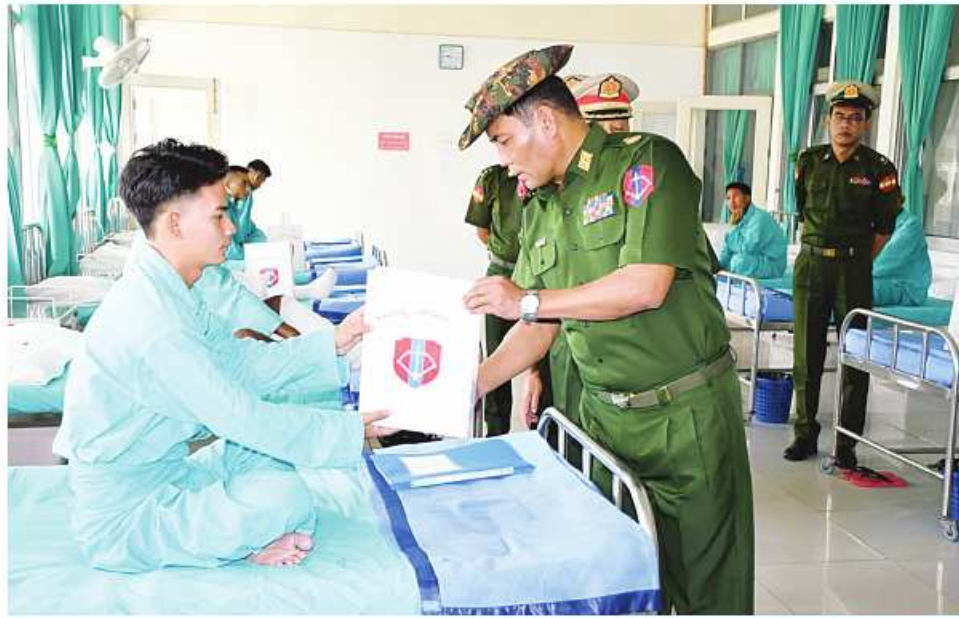
အနောက်မြောက်တိုင်းစစ်ဌာနချုပ် တိုင်းမှူး ဝိုလ်ချုပ်သန်းထိုက် ဆေးကုသမှုခံယူနေသူတစ်ဦးကို အာဟာရ ပြည့်စုံသောက်ဖွယ်ရာများ ပေးအပ်စဉ်။