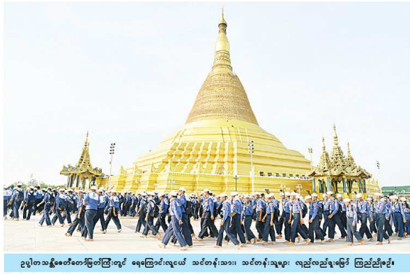
ဥပုတသန္တီတော်ကြီးတွင် ရေကြောင်းလေ့ကျင့်ရေး အဖွဲ့ဝင်များ သင်တန်းများ လေ့ကျင့်ပေးခြင်း ဖြစ်သည်။