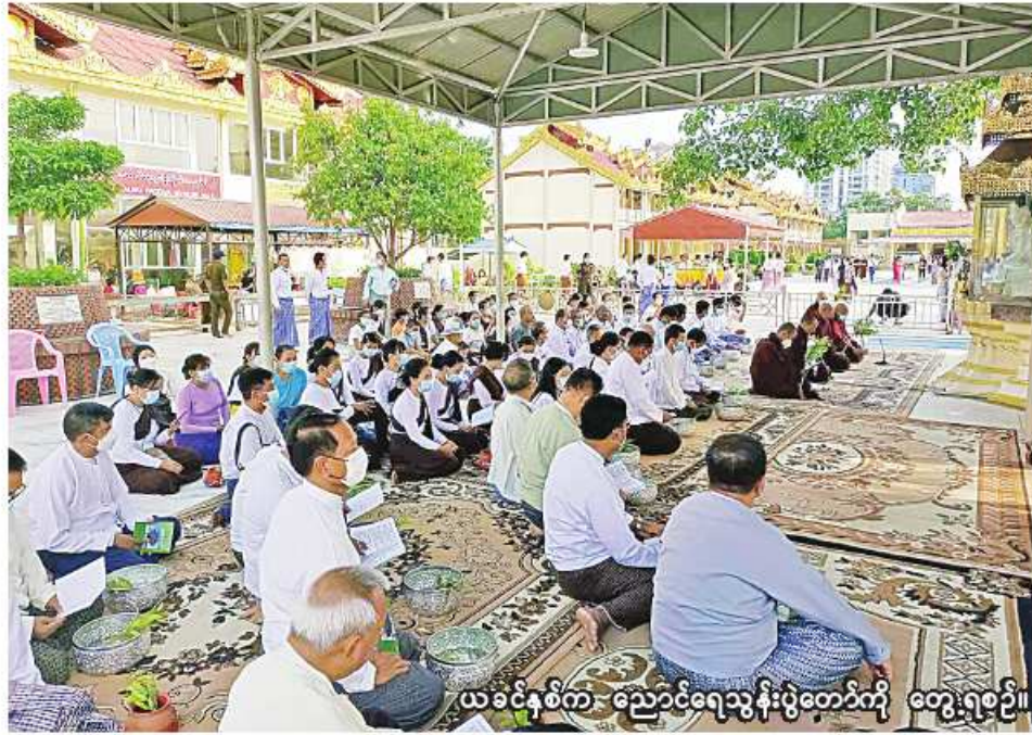
ယခင်နှစ်က ညောင်ရေသွန်းပွဲတော်ကို တွေ့ရစဉ်။

ရန်ကုန် မေ ၁၇ ရန်ကုန်တိုင်းဒေသကြီး ဗိုလ်တထောင်မြို့နယ်ရှိ ဗိုလ်တထောင်ကျိုက်ဒေးအပ်ဆံတော်ဦးစေတီတော်တွင် ၅၃ ကြိမ်မြောက် ညောင်ရေသွန်းပွဲတော်ကို မေ ၂၂ ရက် (ကဆုန်လပြည့်နေ့)တွင် စည်ကားသိုက်မြိုက်စွာ ကျင်းပသွားမည်ဖြစ်