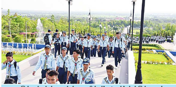
လေကြောင်းလေ့ကျင့်ရေး အဖွဲ့ဝင်များ သင်တန်းများ လေ့ကျင့်ပေးခြင်း ဖြစ်သည်။