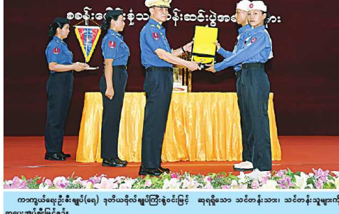
ကာလွယ်ရေးဦးစီးချုပ်(လေ) ဒုတိယဗိုလ်မှူးပြိုင်လှမ်းအောင် ဆုရရှိသော သင်တန်းသား၊ သင်တန်းဆင်နွှဲပေးသူများကို ဆုပေးအပ်ပေးခြင်း ဖြစ်သည်။