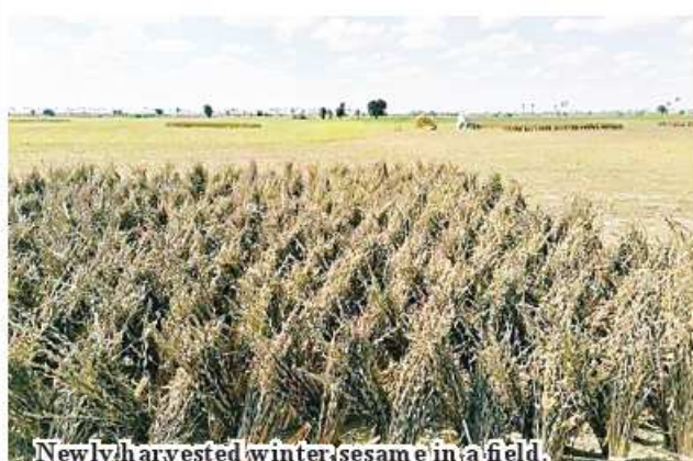
Newly harvested winter sesame in a field.

since this month, driven by strong demand from China. Each day, 2 to 3 twelve-wheeled trucks, each carrying 10 tons of dried chilies, are dispatched to China. High-quality chilies are sold for 6,500 to 7,000 kyats per viss, and sales have been robust. "China prefers our dried chilies. Farmers don't sell them wet; they dry and store them properly. If transportation conditions remain favorable, farmers will continue exporting almost daily. While prices aren't optimal yet, demand is high, and we are committed to exporting dried chilies. This potential for good prices is beneficial for farmers, allowing them to reap the rewards," she explained. Currently, the varieties being exported include 777, 999, and two others. Farmers are well-prepared to continue their exports. The regions cultivating these chillies include Ayeeyawady Region, Shan State, Magway Region and others.