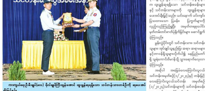
ကာလွယ်ရေးဦးစီးချုပ်(လေ) ခိုင်မာပြိုင်လှမ်းအောင် ဆုရရှိသည့် သင်တန်းသားတစ်ဦးကို ဆုပေးအပ်ပေးခြင်း ဖြစ်သည်။