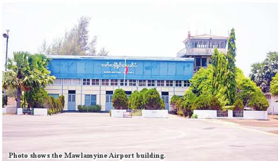
Photo shows the Mawlamyine Airport building.

Nay Pyi Taw May 17 Plans are underway to upgrade seven domestic airports in 2024-25 financial year, according to the Ministry of Transport and Communications. The airports under the control of Department of Civil Aviation namely Thandwe, Putao, Tachilek, Hanthawady, Mawlamyine, Myeik and Kawthoung airports will be upgraded this financial year. In this regard, the runway with 8,000 feet in length and 150 feet in width will be upgraded to a 9,000 feet long and 150 feet wide runway. So, the runway will be added with a 1,000 feet long section