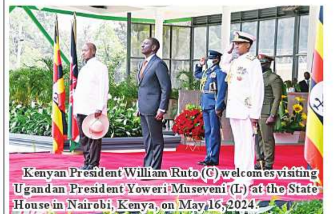
Kenyan President William Ruto (C) welcomes visiting Ugandan President Yoweri Museveni (L) at the State House in Nairobi, Kenya, on May 16, 2024.