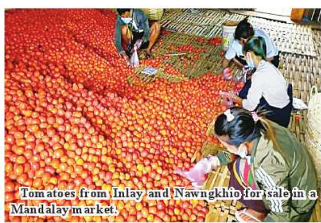
Tomatoes from Inlay and Nawngkhio for sale in a Mandalay market.

from Inlay region fetches K34,000 to K36,000 per 18-viss box and the fruits from Nawngkhio and PynOoLwin K22,000 to K30,000 per box, said U Aung Moe Naing, owner of Aung brokerage in Mandalay. "Tomato from Shan State firstly flows into the market getting good prices. Tomatoes from Nawngkhio and PynOoLwin fetch high prices in the market. Six truckloads of tomato from Nawngkhio and PynOoLwin and more than 20 truckloads from Inlay region flow into Mandalay market on a daily basis. These will be some 4,000 viss per day. Other regions cannot produce a large volume of tomato at present. Other remaining green groceries are being traded as usual,"