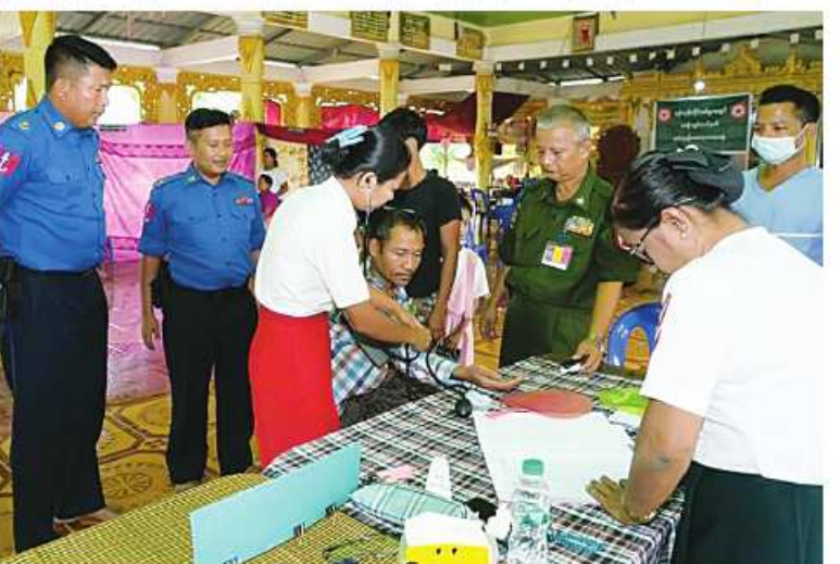
ရန်ကုန်တိုင်းစစ်ဌာနချုပ် နယ်လှည့်ဆေးကုသရေးအဖွဲ့က ဒေသခံပြည်သူများကို ကျန်းမာရေးစောင့်ရှောက်မှုလုပ်ငန်းများ ဆောင်ရွက်ပေးစဉ်။

အလားတူ ပဲခူးတိုင်းဒေသကြီး ပေးသည်။ ပြည်မြို့နယ် မှော်ဇာကျေးရွာအုပ်စု ထိုသို့ဆောင်ရွက်ပေးရာတွင် ဆေး တောင်လုံးညိုကျေးရွာရှိ ဒေသခံပြည်သူ ကုသရေးအဖွဲ့က ဒေသခံပြည်သူဦးရေ ၈၀ တို့ကို ခွဲစိတ်ကုသမှုဆိုင်ရာရောဂါ၊ နှလုံး တိုင်းစစ်ဌာနချုပ် နယ်လှည့်ဆေး ရောဂါ၊ သွေးတိုးရောဂါ၊ ဖျားနာရောဂါ၊ ကုသရေးအဖွဲ့က အဆိုပါကျေးရွာရှိ အရေပြားရောဂါ၊ ဆီးချိုသွေးချိုရောဂါ၊ အရိုးအကြောရောဂါ၊ နား၊ နှာခေါင်း၊ အထွေထွေရောဂါ စောင့်ရှောက်မှုလုပ်ငန်းများ ဆောင်ရွက် လည်ချောင်းရောဂါ၊ အထွေထွေရောဂါ