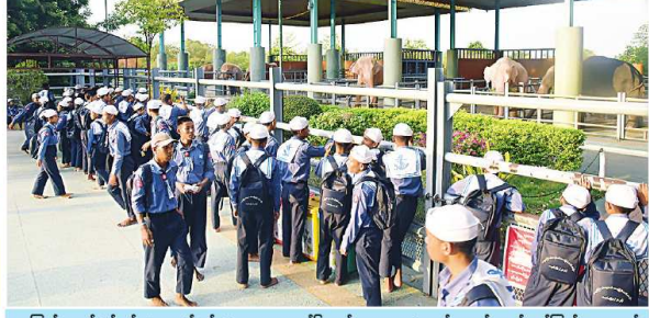
ရေကြောင်းလေ့ကျင့်ရေး အဖွဲ့ဝင်များ သင်တန်းများ လေ့ကျင့်ပေးခြင်း ဖြစ်သည်။