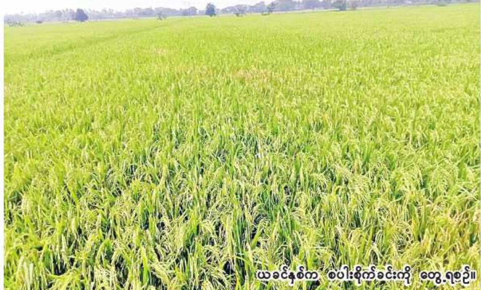
ယခင်နှစ်က စပါးစိုက်ခင်းကို တွေ့ရစဉ်။

အင်းတော် မေ ၁၇ စစ်ကိုင်းတိုင်းဒေသကြီး ကသာခရိုင် အင်းတော်မြို့နယ်တွင် ယခုနှစ် မိုးသီးနှံစိုက်ပျိုးရာသီ၌ စပါးဧက ၅၅၉၈၀ စိုက်ပျိုးသွားမည်ဖြစ်ကြောင်း အင်းတော်မြို့နယ် စိုက်ပျိုးရေးဦးစီးဌာနမှ သိရသည်။