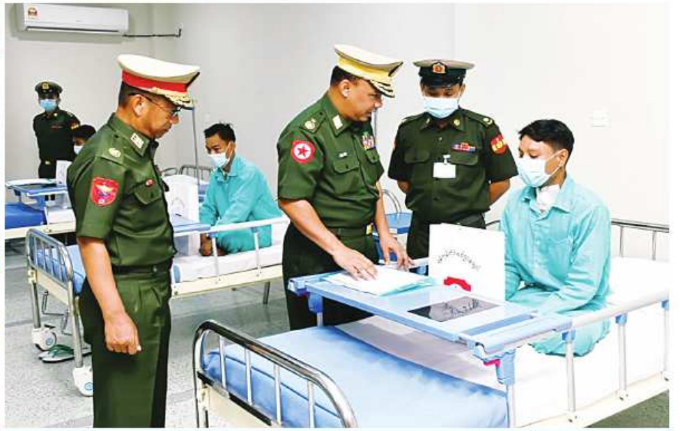
ရန်ကုန်တိုင်းစစ်ဌာနချုပ် တိုင်းမှူး ဝိုလ်ချုပ်စော်ဟိန်း ဆေးကုသမှုခံယူနေသူတစ်ဦးကို ရင်းရင်းနှီးနှီး မေးမြန်းအားပေးစကားပြောကြားစဉ်။

နေပြည်တော် မေ ၁၇ တပ်မတော်ဆေးရုံကြီး (ခုတင်-၁၀၀၀)၊ အရာရှိ၊ စစ်သည်၊ မိသားစုဝင်များ ပြစ်ပွားမှု၊ ဆေးဝါးကုသပေးထားမှုနှင့် ကြသည်။ ကချင်ပြည်နယ် မြစ်ကြီးနားမြို့ရှိ စစ်တိုင်းတိုင်းဒေသကြီး၊ ဗဟိုမြို့ရှိ နှင့် ဒေသခံပြည်သူများကို ယနေ့တွင် ကျန်းမာရေး တိုးတက်ကောင်းမွန်မှုအခြေ ထို့နောက် တိုင်းမှူးများနှင့် တာဝန်ရှိသူ တပ်မတော်ဆေးရုံနှင့် ပဲခူးတိုင်းဒေသကြီး သက်ဆိုင်ရာ တိုင်းစစ်ဌာနချုပ်အသီးသီးမှ အနေများကို ရင်းရင်းနှီးနှီးမေးမြန်း များက ဆေးရုံများအတွင်း လှည့်လည် မင်္ဂလာဒုံမြို့နယ်ရှိ တပ်မတော်အရိုးရောဂါ တောင်ငူမြို့ရှိ တပ်မတော်ဆေးရုံတို့၌ တိုင်းမှူးများနှင့် တာဝန်ရှိသူများက အားပေးစကားပြောကြားပြီး အာဟာရ ကြည့်ရှု၍ လိုအပ်သည်များညှိနှိုင်းဆောင် အထူးကုဆေးရုံကြီး (ခုတင်-၅၀၀)နှင့် တက်ရောက် ဆေးကုသမှုခံယူနေသော သွားရောက်ကြည့်ရှု၍ တစ်ဦးချင်း၏ရောဂါ ပြည့်စုံသောက်ဖွယ်ရာများ ပေးအပ် စွက်ပေးခဲ့ကြကြောင်း သတင်းရရှိသည်။