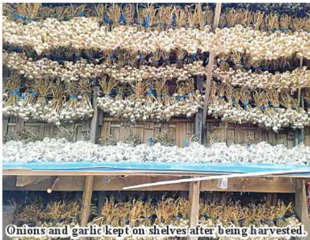
Onions and garlic kept on shelves after being harvested.

Local farmers cost K18 million per acre for onion and K15 million for garlic in cultivation. 206