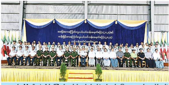
ကာလွယ်ရေးဦးစီးချုပ်(လေ) ခိုင်မာပြိုင်လှမ်းအောင် သင်တန်းဆင်နွှဲပေးခြင်း အခမ်းအနား အဖြစ် ဥပုတသန္တီတော်ကြီးတွင် ရေကြောင်းလေ့ကျင့်ရေး အဖွဲ့ဝင်များ သင်တန်းများ လေ့ကျင့်ပေးခြင်း ဖြစ်သည်။