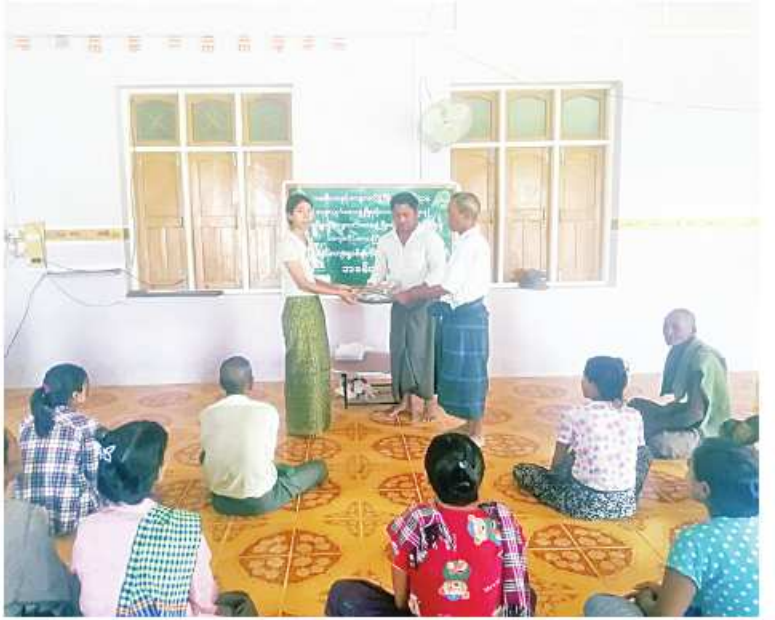
သူ ၃၈ ဦးကို ကျေးရွာမတည်ရန်ပုံငွေစီမံ ၀၅ သန်း ထုတ်ချေးပေးခဲ့ကြောင်း ကိန်း(VREFP )ရန်ပုံငွေကျပ် ၁၂ ဒသမ သိရသည်။ ကိုညို

ထို့နောက် ကျေးရွာမတည်ရန်ပုံငွေစီမံကိန်းကော်မတီဝင်များက မင်းဂံကျေးရွာရှိ စိုက်ပျိုးရေးလုပ်ငန်းလုပ်ကိုင်သူ ၃၁ ဦးကို ငွေကျပ် ၁၀ ဒသမ ၀၅ သန်း၊ မွေးမြူရေးလုပ်ငန်းလုပ်ကိုင်သူ ငါးဦးကို ငွေကျပ် ၁ ဒသမ ၃၅ သန်း၊ အရောင်းအဝယ်လုပ်ငန်းလုပ်ကိုင်သူ နှစ်ဦးကို ငွေကျပ် သုည ဒသမ ၆၅ သန်း စုစုပေါင်းအသင်းသား၊ အသင်း