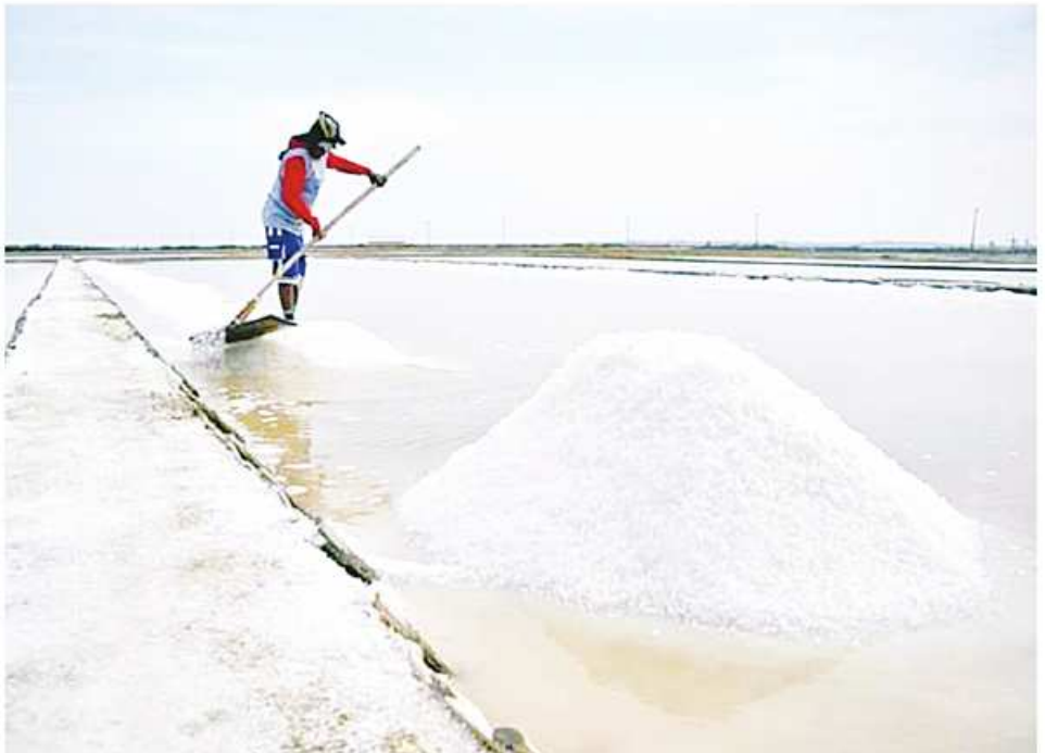
ဆေးဖက်ဝင်ဆားကြမ်းကို တွေ့ရစဉ်။

ဆားနင်းခြင်းအကျိုး (၁) မလိုအပ်တဲ့ အပူအောင်းနေတဲ့ အခိုးအငွေ့တွေ ခြေဖဝါးကနေတစ်ဆင့် ထွက်သွားနိုင်ပါတယ်။