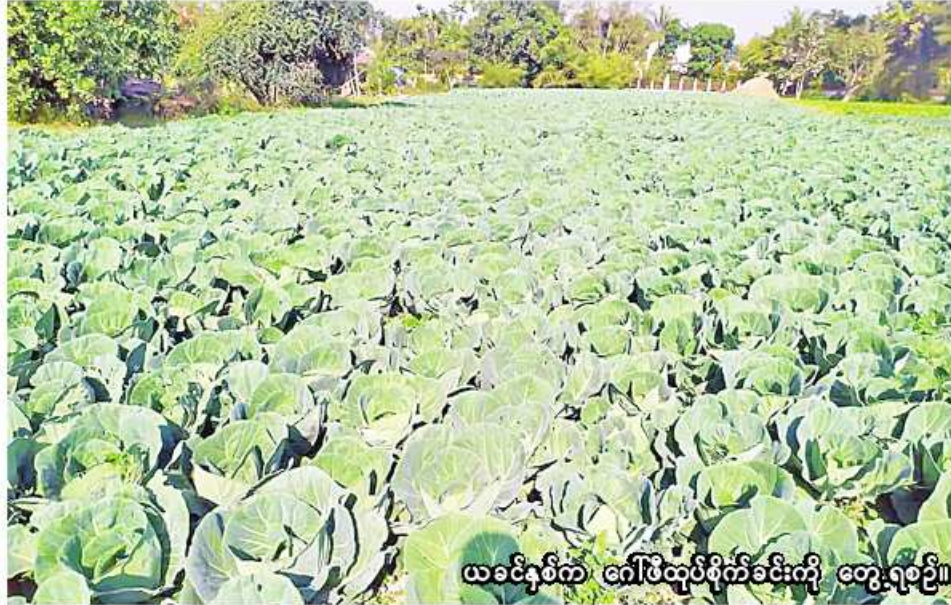
ယခင်နှစ်က ဂေါ်ဖီထုပ်စိုက်ခင်းကို တွေ့ရပေပြီ။

ကန့်ဘလူ မေ ၁၇ စစ်ကိုင်းတိုင်းဒေသကြီး ကန့်ဘလူခရိုင် ကန့်ဘလူမြို့နယ်တွင် ယခုနှစ် မိုးသီးနှံစိုက်ပျိုးရာသီ၌ ဟင်းသီးဟင်းရွက် ၁၉၆၃ ဧက စိုက်ပျိုးသွားမည်ဖြစ်ကြောင်း ကန့်ဘလူမြို့နယ် စိုက်ပျိုးရေးဦးစီးဌာနမှ သိရသည်။