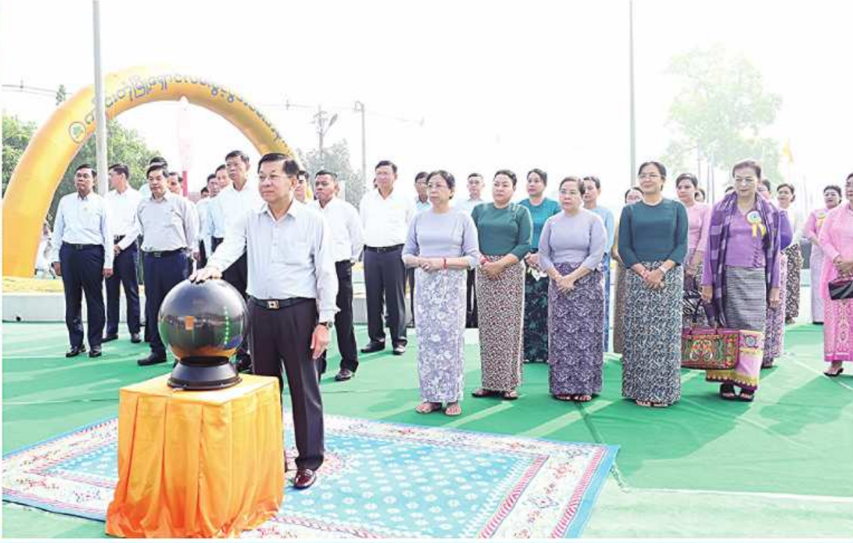
နိုင်ငံတော်စီမံအုပ်ချုပ်ရေးကောင်စီဥက္ကဋ္ဌ နိုင်ငံတော်ဝန်ကြီးချုပ် ဗိုလ်ချုပ်မှူးကြီးမင်းအောင်လှိုင် ကျိုင်းတုံမြို့ မြို့ရောင်လမ်းကမ္ဘည်းမော်ကွန်းကျောက်စာတိုင်ကို စက်လှေတံခိပ်ဖွင့်လှစ်ပေးစဉ်။

နေပြည်တော် မေ ၁၁ ရှမ်းပြည်နယ်(အရှေ့ပိုင်း) ကျိုင်းတုံမြို့ မြို့ရောင်လမ်းဖွင့်ပွဲအခမ်းအနားကို ယနေ့နံနက်ပိုင်းတွင် အဆိုပါလမ်းနေရာ၌ကျင်းပပြုလုပ်ရာ နိုင်ငံတော်စီမံအုပ်ချုပ်ရေးကောင်စီဥက္ကဋ္ဌ နိုင်ငံတော်ဝန်ကြီးချုပ် ဗိုလ်ချုပ်မှူးကြီးမင်းအောင်လှိုင် တက်ရောက်ချီးမြှင့်ဖွင့်လှစ်ပေးသည်။ အဆိုပါအခမ်းအနားသို့ နိုင်ငံတော်စီမံအုပ်ချုပ်ရေးကောင်စီဥက္ကဋ္ဌ နိုင်ငံတော်ဝန်ကြီးချုပ်နှင့်ဇနီး ဒေါ်ကြာကြာလှ၊ ကောင်စီတွဲဖက်အတွင်းရေးမှူး ဗိုလ်ချုပ်မှူးကြီးမင်းအောင်လှိုင် ဒုတိယဗိုလ်ချုပ်ကြီးရဲဝင်းဦးနှင့်ဇနီးကောင်စီဝင်များ နှင့်ဇနီးများ၊ပြည်ထောင်စုဝန်ကြီးများနှင့်ဇနီးများ၊ ရှမ်းပြည်နယ်ဝန်ကြီးချုပ်နှင့်ဇနီး၊ ကာကွယ်ရေးဦးစီးချုပ်ရုံးမှအဆင့်မြင့်တပ်မတော်အရာရှိကြီးများ နှင့်ဇနီးများ၊ ကြိတ်ဒေသတိုင်းစစ်ဌာနချုပ် တိုင်းမှူး၊ ဌာနဆိုင်ရာတာဝန်ရှိသူများ၊ရပ်မိရပ်ဖများ၊ဒေသခံ တိုင်းရင်းသားပြည်သူများ၊ တိုင်းရင်းသားရိုးရာ ယဉ်ကျေးမှုအဖွဲ့များနှင့် ကျောင်းသား၊ ကျောင်းသူ များ တက်ရောက်ကြသည်။