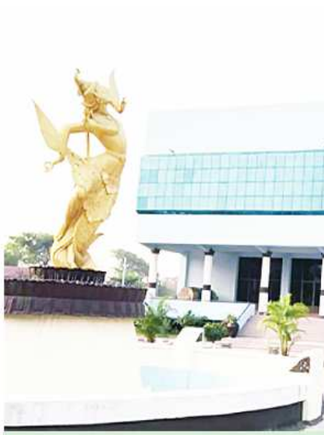
အမျိုးသားဇာတ်ရုံ(မန္တလေး)ကို တွေ့ရစဉ်။

အနောက်နိုင်ငံတို့တွင် ၁၇ ရာစုနှင့် ၁၈ ရာစုနှစ်အတွင်း ပြဇာတ်များအတွက် အခမ်းအနား၊ အခင်းအကျင်းကို အရေးပေးလာကြသည်။ ထို့ကြောင့် ဇာတ်ရုံများ၏အခင်းအကျင်းမှာ အထူးတိုးတက်လာသည်။ အီတလီနိုင်ငံ အော်ပရာဇာတ်ရုံများမှာ အခင်းအကျင်းဘက်၌ အထူးတိုးတက်လာတော့သည်။ ၁၉ ရာစုနှစ်အတွင်း မီလန်နှင့်နပယ်မြို့တို့ရှိ ပြဇာတ်ရုံများကို ကြီးကျယ်ခမ်းနားစွာ ဆောက်လုပ်ခဲ့ကြလေသည်။ အီတလီနိုင်ငံကိုအတူယူလျက် ပြင်သစ်၊ ဂျာမနီ၊ အင်္ဂလိပ်၊ အမေရိကန်နိုင်ငံတို့ကလည်း ကြီးကျယ်ခမ်းနားသောဇာတ်ရုံများကို ဆောက်လုပ်