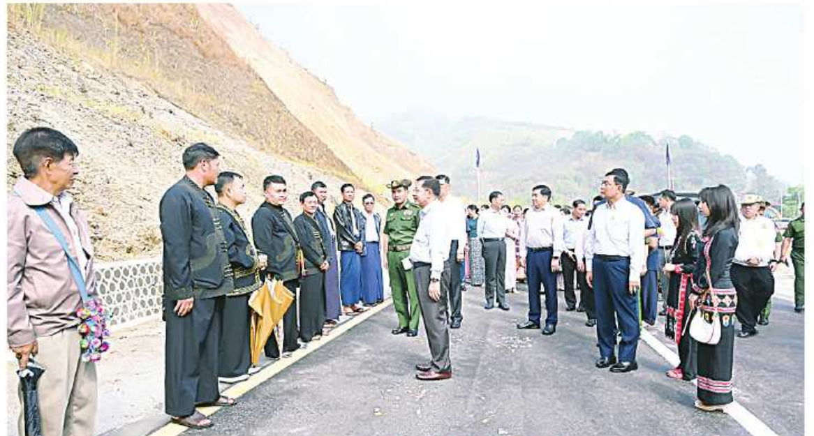
နိုင်ငံတော်စီမံအုပ်ချုပ်ရေးကောင်စီဥက္ကဋ္ဌ နိုင်ငံတော်ဝန်ကြီးချုပ် ဝိုလ်ချုပ်မျိုးကြီးမင်းအောင်လှိုင် ကျိုင်းတုံမြို့၊ မြို့ရှောင်လမ်းပိုင်းကို လိုက်လံကြည့်ရှုစစ်ဆေးပြီး ရပ်မိရပ်ဖများ၊ ဒေသခံတိုင်းရင်းသားပြည်သူများ၊ ဌာနဆိုင်ရာဝန်ထမ်းများနှင့် ကျောင်းသား၊ ကျောင်းသူများကို ရင်းရင်းနှီးနှီးလိုက်လံနှုတ်ဆက်စဉ်။