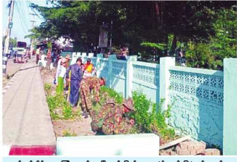
ရန်ကုန်တိုင်းဒေသကြီး လှည်းကူးမြို့နယ် ပြည်သူ့ဆေးရုံ၌ နယ်မြေခံတပ်မတော်သားများနှင့် ဌာနဆိုင်ရာဝန်ထမ်းများ စုပေါင်းသန့်ရှင်းရေးဆောင်ရွက်ကြခြင်း

ရန်ကုန်တိုင်းဒေသကြီး လှည်းကူးမြို့နယ်ရှိ မြို့နယ်ပြည်သူ့ဆေးရုံနှင့် ပဲခူးတိုင်းဒေသကြီး တောင်ငူမြို့ရှိ နယ်မြေခံတပ်မတော်ဆေးရုံတို့၌ ယနေ့နံနက်ပိုင်းတွင် သက်ဆိုင်ရာ တိုင်းစစ်ဌာနချုပ်များမှ နယ်မြေခံတပ်မတော်သားများ၊မြန်မာနိုင်ငံရဲတပ်ဖွဲ့ဝင်များ၊ မီးသတ်တပ်ဖွဲ့ဝင်များ၊ ကျန်းမာရေးဝန်ထမ်းများ၊ ဆရာ၊ ဆရာမများ၊ ဌာနဆိုင်ရာဝန်ထမ်းများနှင့် ဒေသခံတိုင်းရင်းသားပြည်သူများက ခြင်ခိုအောင်းနိုင်သော ချုံနွယ်များ၊ ပေါင်းမြက်များ ခုတ်ထွင်ရှင်းလင်းခြင်း၊ အမှိုက်များရှင်းလင်းခြင်း၊ ရေစီးရေလာကောင်းမွန်စေရေး ရေနုတ်မြောင်းများ တူးဖော်ပေးခြင်းစသည်