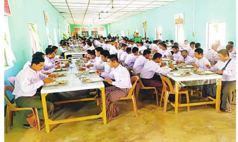
ကမ်းရိုးတန်းဒေသတိုင်းစစ်ဌာနချုပ်မှ တာဝန်ရှိသူများက ပြည်သူ့စစ်မှုထမ်း သင်တန်းအမှတ်စဉ်(၂)သို့တက်ရောက်ကြမည့် နိုင်ငံ့သားကောင်းရတနာများကို စားသောက်ဖွယ်ရာများကျွေးမွေးစဉ်။