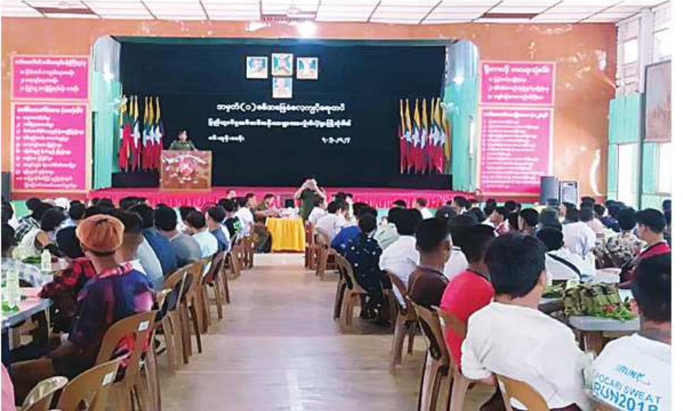
ရန်ကုန်တိုင်းစစ်ဌာနချုပ်မှ တာဝန်ရှိသူတစ်ဦးက ပြည်သူ့စစ်မှုထမ်းသင်တန်းအမှတ်စဉ်(၂)သို့ တက်ရောက်ကြမည့် နိုင်ငံ့သားကောင်းရတနာများကို တွေ့ဆုံအမှာစကားပြောကြားစဉ်။