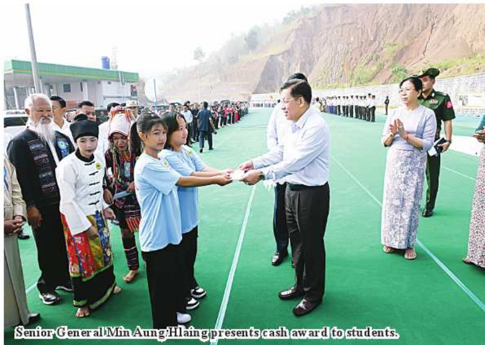
Senior General Min Aung Hlaing presents cash award to students.