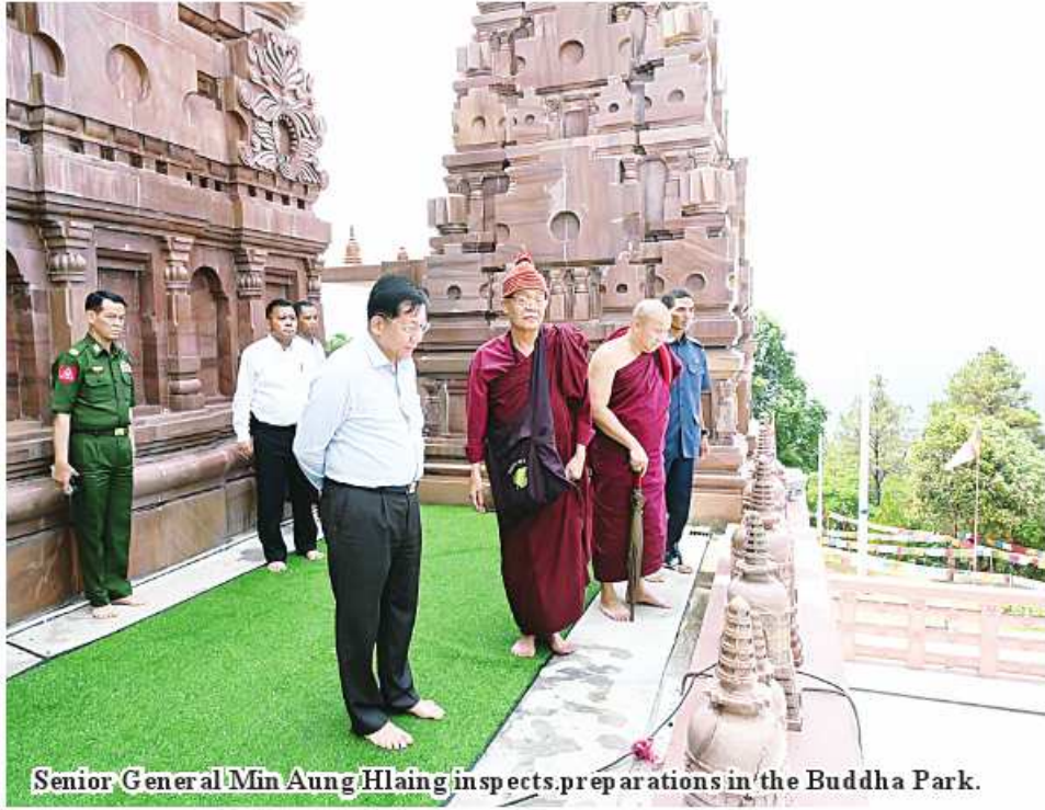
Senior General Min Aung Hlaing inspects preparations in the Buddha Park.