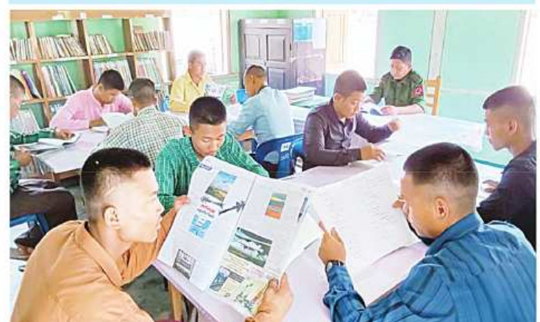
ပြည်သူ့စစ်မှုထမ်းသင်တန်းအမှတ်စဉ်(၂)သို့ တက်ရောက်ကြမည့် နိုင်ငံ့ သားကောင်းရတနာများ ဗဟုသုတစာပေများဖတ်ရှုနေမှုကို တွေ့ရစဉ်။