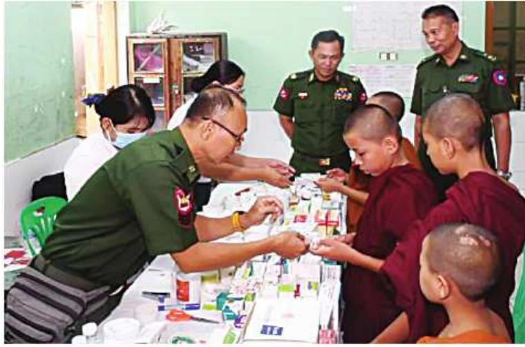
သံဃာတော်များအား အလယ်ပိုင်းတိုင်းစစ်ဌာနချုပ် နယ်လှည့်ဆေးကုသရေးအဖွဲ့က ကျန်းမာရေးစောင့်ရှောက်မှုလုပ်ငန်းများ ဆောင်ရွက်ပေးနေမှုကို တာဝန်ရှိသူများက ကြည့်ရှုအားပေးစဉ်။

နေပြည်တော် မေ ၁၁ ပဲခူးတိုင်းဒေသကြီး တောင်ငူမြို့နယ် ထန်းကုန်းကျေးရွာနှင့် ပတ်ဝန်းကျင်ကျေးရွာများမှ ဒေသခံပြည်သူများကို ယနေ့နံနက်ပိုင်းတွင် တောင်ပိုင်းတိုင်းစစ်ဌာနချုပ် နယ်လှည့်ဆေးကုသရေးအဖွဲ့က အဆိုပါကျေးရွာရှိဘုန်းတော်ကြီးကျောင်း၌ ကျန်းမာရေးစောင့်ရှောက်မှုလုပ်ငန်းများ ဆောင်ရွက်ပေးသည်။ ထိုသို့ ဆောင်ရွက်ပေးရာတွင် ဆေးကုသရေးအဖွဲ့က ဒေသခံပြည်သူ ၂၇၉ ဦးတို့ကို နှလုံးရောဂါ၊ မျက်စိရောဂါ၊ သွေးတိုးရောဂါ၊ ဖျားနာရောဂါ၊ အရေပြားရောဂါ၊ ဆီးချိုသွေးချိုရောဂါ၊ အရိုးအကြော ရောဂါ၊ အထွေထွေရောဂါတို့နှင့်ပတ်သက်၍ လိုအပ်သည့် ကျန်းမာရေးစစ်ဆေးကုသခြင်းများဆောင်ရွက်ပေးပြီး ECG စက်၊ Ultrasound စက်တို့ဖြင့် ရောဂါရှာဖွေစစ်ဆေးခြင်းများ ဆောင်ရွက်ပေးသည်။ ယင်းသို့ဆောင်ရွက်နေမှုများကို တိုင်းမှူးဗိုလ်မှူးချုပ်ကြည်သိုက်နှင့် တာဝန်ရှိသူများက သွားရောက်ကြည့်ရှုအားပေးပြီး ထန်းကုန်းကျောင်းတိုက် ဆရာတော်အား ဖူးမြော်ကြည်ညိုကာ လှူဖွယ်ပစ္စည်းများ ဆက်တစ်လှူဒါန်းသည်။ အလားတူ ရန်ကုန်တိုင်းဒေသကြီး မှော်ဘီမြို့နယ် လှပဒါးကျေးရွာနှင့် ပတ်ဝန်းကျင်ကျေးရွာများရှိ သံဃာတော်