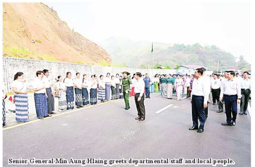
Senior General Min Aung Hlaing greets departmental staff and local people.