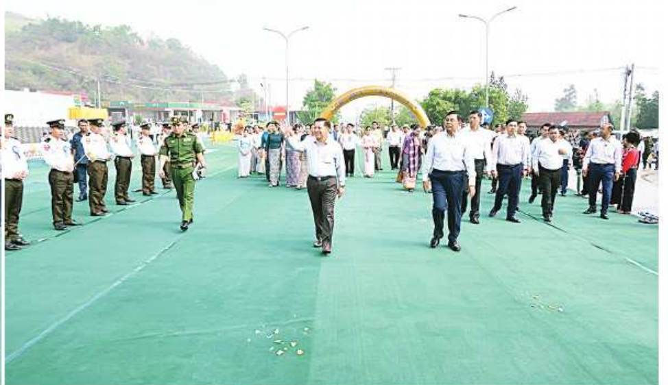
နိုင်ငံတော်စီမံအုပ်ချုပ်ရေးကောင်စီဥက္ကဋ္ဌ နိုင်ငံတော်ဝန်ကြီးချုပ် ဝိုလ်ချုပ်မျိုးကြီးမင်းအောင်လှိုင် ကျိုင်းတုံမြို့၊ မြို့ရှောင်လမ်းပိုင်းကို လိုက်လံကြည့်ရှုစစ်ဆေးပြီး ရပ်မိရပ်ဖများ၊ ဒေသခံတိုင်းရင်းသားပြည်သူများ၊ ဌာနဆိုင်ရာဝန်ထမ်းများနှင့် ကျောင်းသား၊ ကျောင်းသူများကို ရင်းရင်းနှီးနှီးလိုက်လံနှုတ်ဆက်စဉ်။