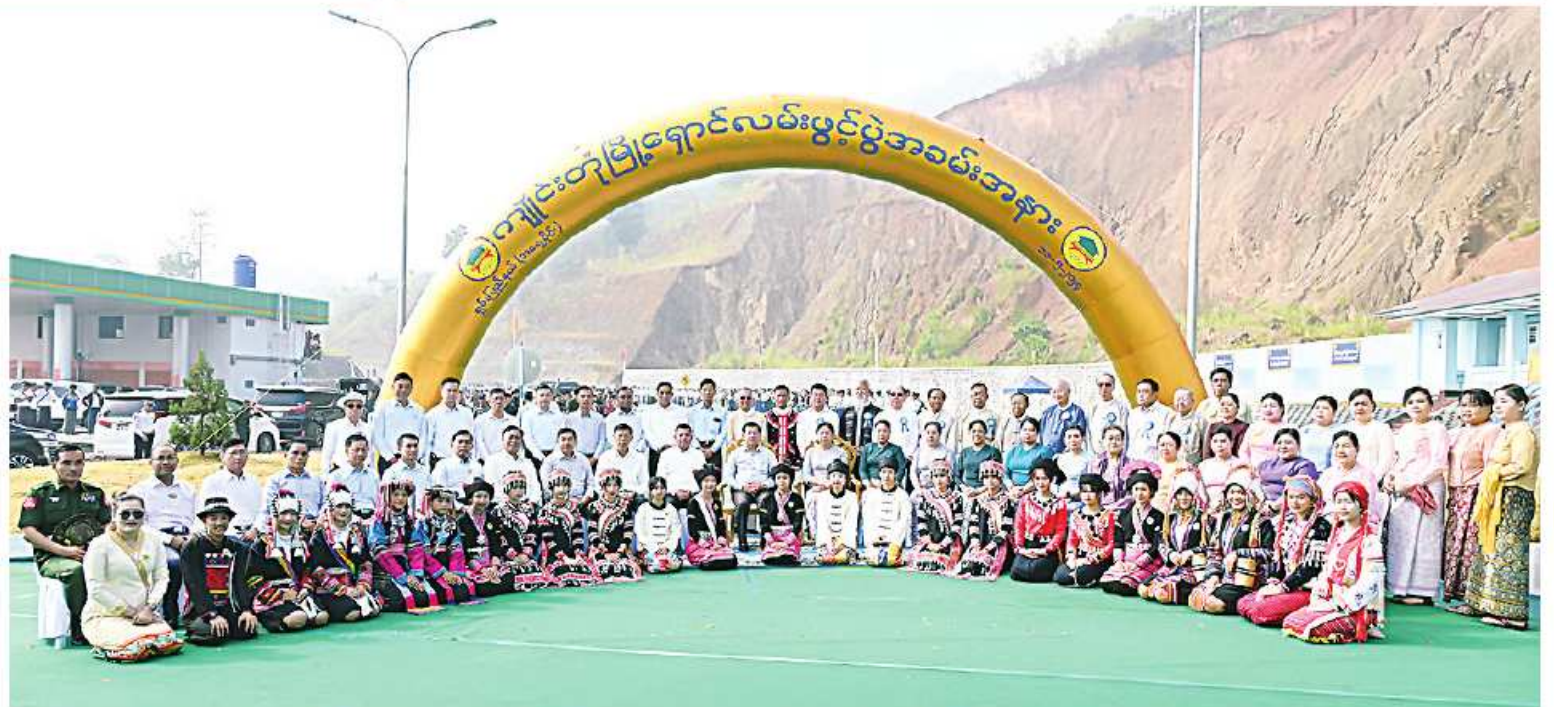
နိုင်ငံတော်စီမံအုပ်ချုပ်ရေးကောင်စီဥက္ကဋ္ဌ နိုင်ငံတော်ဝန်ကြီးချုပ် ဝိုလ်ချုပ်မျိုးကြီးမင်းအောင်လှိုင်နှင့်စနိုး ဒေါ်ကြူကြူလှ၊ အဖွဲ့ဝင်များ၊ ဌာနဆိုင်ရာတာဝန်ရှိသူများ၊ ရပ်မိရပ်ဖများ၊ ဒေသခံတိုင်းရင်းသားပြည်သူများ ကျိုင်းတုံမြို့၊ မြို့ရှောင်လမ်းဖွင့်ပွဲအထိမ်းအမှတ်အဖြစ် ဖုပေါင်းမှတ်တမ်းတင်ဓာတ်ပုံရိုက်စဉ်။

၎င်းနောက် ခရီးစဉ်တွင်လိုက်ပါလာသည့် ကောင်စီတွဲဖက်အတွင်းရေးမှူး၊ ကောင်စီဝင်များ၊ ပြည်ထောင်စုဝန်ကြီးများနှင့်တာဝန်ရှိသူများက ကမ္ဘည်းမော်ကွန်းကျောက်စာတိုင်ကို အမွှေးနံ့သာရည်များပက်ဖျန်းကြသည်။