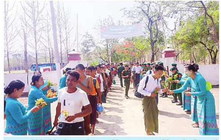
အလယ်ပိုင်းတိုင်းစစ်ဌာနချုပ်မှ တာဝန်ရှိသူများ။ ဌာနဆိုင်ရာဝန်ထမ်းများနှင့် ဒေသခံပြည်သူများက ပြည်သူ့စစ်မှုထမ်းသင်တန်းအမှတ်စဉ်(၂)သို့တက်ရောက် ကြမည့် နိုင်ငံ့သားကောင်းရတနာများကို အောင်သပြေများဖြင့် သောင်းသောင်း ဖြဖြရုတ်ဖြဖြကြိုဆိုစဉ်။