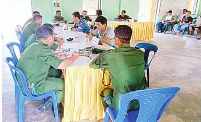
တာဝန်ရှိသူများက ပြည်သူ့စစ်မှုထမ်းသင်တန်းအမှတ်စဉ်(၂)သို့ တက်ရောက် ကြမည့် နိုင်ငံ့သားကောင်းရတနာများကို ကျန်းမာရေးစစ်ဆေးပေးခြင်းများ ဆောင်ရွက်ပေးစဉ်။