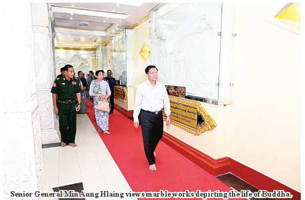
Senior General Min Aung Hlaing views marble works depicting the life of Buddha.