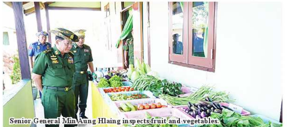
Senior General Min Aung Hlaing inspects fruit and vegetables.

eral and party inspected the agriculture and livestock breeding tasks being carried out in the command and the regional command commander reported to the Senior General on cultivation of paddy, corn, sunflower, tissue bananas and seasonal crops, the breeding of milk cows, goat and DYL pigs, fish and layer and broilers and Khaki king ducks and free-of-charge distribution of meat, fish, eggs and vegetables to Tatmadaw families and departmental personnel and distribution of them at cheaper prices to the people. After hearing the reports, the Senior General said it is necessary to boost per-acre-yields in cultivation of paddy and corn. Priority must be given to cultivation of staple crops. Similarly, Tatmadaw families must be encouraged to carry out manageable level cultivation of crops. It is necessary to raise local chicken species successfully. As the agriculture and livestock breeding are not mainly meant for profit but for the welfare of Tatmadaw, it is necessary to carry out the tasks successfully. Then, the Senior General and party inspected the agriculture and livestock breeding products produced at the command and gave necessary instructions. Afterward, the Senior General and party inspected the agriculture and livestock breeding zone of the regional command and gave necessary instructions over reports of the responsible officials.