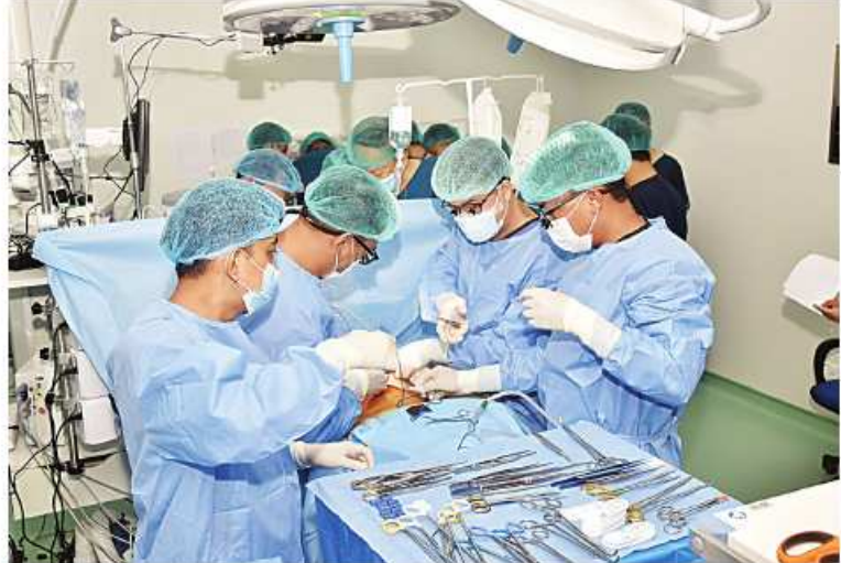
တပ်မတော်မှ အသည်းအစားထိုးခွဲစိတ်ကုသမှုအဖွဲ့နှင့် အိန္ဒိယနိုင်ငံမှ အသည်းအစားထိုး ခွဲစိတ်ကုသမှုအဖွဲ့တို့ပူးပေါင်း၍ အသည်းအစားထိုးခွဲစိတ်ကုသမှုကို ဆောင်ရွက်နေစဉ်။

နေပြည်တော် မေ ၁၁ တပ်မတော်တွင် ပထမအကြိမ် အသည်း အစားထိုးခွဲစိတ်ကုသမှုကို ၂၀၂၂ ခုနှစ် တွင် အသည်းအစားထိုး လူနာနှစ်ဦးဖြင့် လည်းကောင်း၊ ဒုတိယအကြိမ်၊ တတိယ အကြိမ်နှင့် စတုတ္ထအကြိမ်တို့ကို ၂၀၂၃ ခုနှစ် တွင် အသည်းအစားထိုးလူနာကိုးဦးဖြင့် လည်းကောင်း၊ ပဉ္စမအကြိမ်ကို ၂၀၂၄ ခုနှစ် တွင် အသည်းအစားထိုးလူနာသုံးဦးဖြင့် လည်းကောင်း အောင်မြင်စွာခွဲစိတ်ကုသ ဆောင်ရွက်ပေးနိုင်ခဲ့သည်။ ယခုအခါ ဆဋ္ဌမအကြိမ် အသည်းအစားထိုးခွဲစိတ် ကုသမှုကိုလူနာသုံးဦးဖြင့် ဆောင်ရွက်သွား မည်ဖြစ်ပြီး ပထမနေ့အသည်းအစားထိုးခွဲ စိတ်ကုသမှုကိုယနေ့တွင် မင်္ဂလာဒုံမြို့နယ်ရှိ အမှတ်(၁)တပ်မတော်ဆေးရုံကြီး (ဒုတိ-