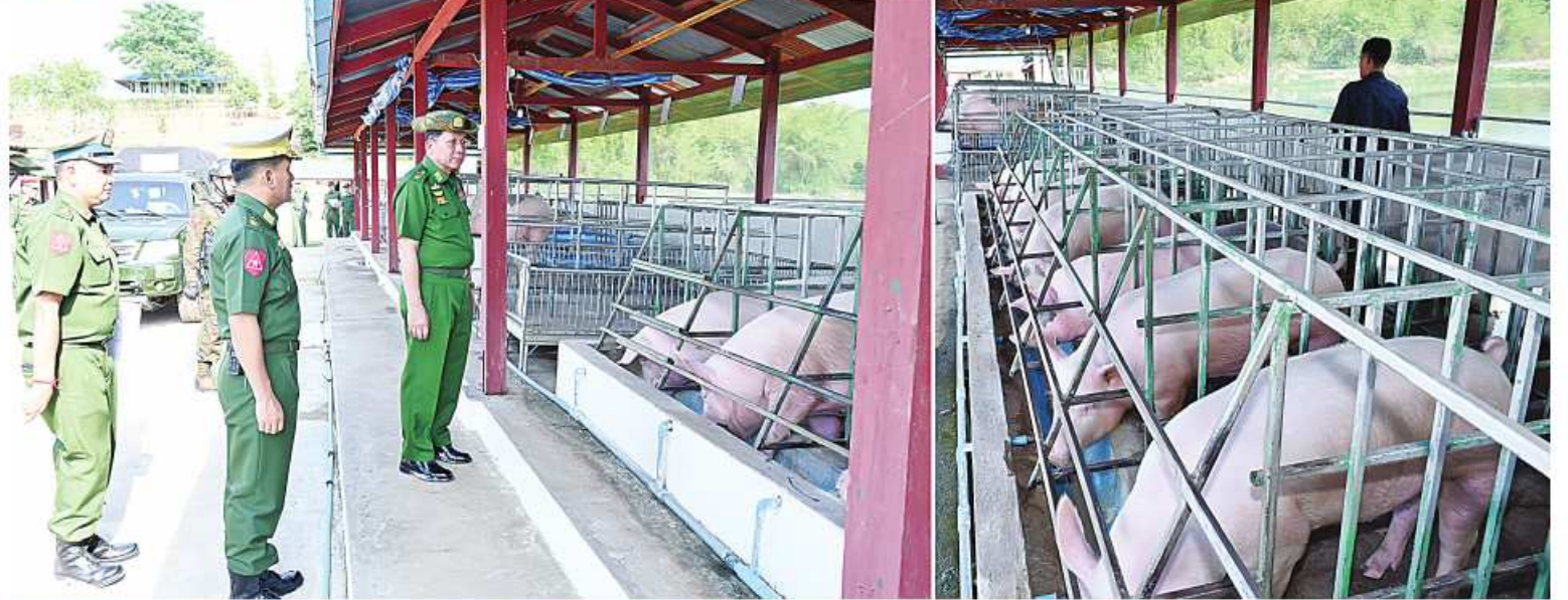
နိုင်ငံတော်စီမံအုပ်ချုပ်ရေးကောင်စီဥက္ကဋ္ဌ တပ်မတော်ကာကွယ်ရေးဦးစီးချုပ် ဝန်ထမ်းများကြီး မင်းအောင်လှိုင် တိုင်းစစ်ဌာနချုပ် ခိုက်ပျိုးမွေးမြူရေးရန်အတွင်း ဝန်ထောက်ချုပ်များ အကောင်အထည်ဖော်ဆောင်ရွက်ထားရှိမှုအခြေအနေများကို လိုက်လံကြည့်ရှုစစ်ဆေးစဉ်။

စာမျက်နှာ ၁၉ မှအဆက် အမိန့်နှင့်တာဝန်ကို ကျေပွန်စွာ တာဝန်ထမ်းဆောင်ကြရန် လိုကြောင်း၊ ဦးစီးခေါင်းဆောင်များ အနေဖြင့်လည်း မိမိတို့၏ လက်အောက်မှ အရာရှိ၊ စစ်သည်၊ မိသားစုများအတွက် ပတ်ဝန်းကျင်ကောင်းများ ဖန်တီးပေးနိုင် ရမည်ဖြစ်ပြီး ညီညွတ်မှုတည်ဆဲ အုပ်ချုပ်မှု ပုံစံရှိရမည်ဖြစ်ကြောင်း၊ တပ်မှူးကောင်း သဖွယ်စိတ်ဓာတ်၊ ဖခင်သဖွယ်စိတ်ဓာတ် ဖြင့် ကွပ်ကဲအုပ်ချုပ်ရမည်ဖြစ်ကြောင်း၊ အရာရှိ၊ စစ်သည်များ၊ မိသားစုဝင်များ အားလုံး ညီညွတ်ညွတ်ဖြင့် စည်းလုံး ညီညွတ်စွာနေထိုင်ကြရန်လိုပြီး နိုင်ငံတော် နှင့် တပ်မတော်က ပေးအပ်လာသည့် တာဝန်များကို ကျေပွန်စွာ ထမ်းဆောင် ကြရမည်ဖြစ်ကြောင်းဖြင့် မှာကြားပြီး အရာရှိ၊ စစ်သည်၊ မိသားစုများ၏ လိုအပ် ချက်များကို မေးမြန်းသည်။ ထို့နောက် နိုင်ငံတော်စီမံအုပ်ချုပ်ရေး ကောင်စီဥက္ကဋ္ဌ တပ်မတော်ကာကွယ်ရေး ဦးစီးချုပ်က ကျွမ်းကျင်တပ်နယ်မှ အရာရှိ၊ စစ်သည်၊ မိသားစုများအတွက် စားသောက် ဖွယ်ရာပစ္စည်းများကို ပေးအပ်ရာ တိုင်းမှူးကလည်းကောင်း၊ နိုင်ငံတော်စီမံ အုပ်ချုပ်ရေးကောင်စီဥက္ကဋ္ဌ တပ်မတော် ကာကွယ်ရေးဦးစီးချုပ်၏ဇနီးက တပ်နယ် မိခင်နှင့် ကလေးစောင်ရွှောက်ရေးအသင်း အတွက် ချီးမြှင့်ငွေများကို ပေးအပ်ရာ တိုင်းမှူး၏ဇနီးကလည်းကောင်း အသီးသီး လက်ခံရယူကြသည်။ ထို့နောက် နိုင်ငံတော်စီမံ အုပ်ချုပ်ရေးကောင်စီဥက္ကဋ္ဌ တပ်မတော် ကာကွယ်ရေးဦးစီးချုပ်နှင့် ဇနီး၊ အဖွဲ့ဝင် မိခင်နှင့် ကလေးစောင်ရွှောက်ရေးအသင်း အတွက် ချီးမြှင့်ငွေများကို ပေးအပ်ရာ တိုင်းမှူး၏ဇနီးကလည်းကောင်း အသီးသီး လက်ခံရယူကြသည်။ ထို့နောက် နိုင်ငံတော်စီမံ အုပ်ချုပ်ရေးကောင်စီဥက္ကဋ္ဌ တပ်မတော် ကာကွယ်ရေးဦးစီးချုပ်နှင့် ဇနီး၊ အဖွဲ့ဝင် မိခင်နှင့် ကလေးစောင်ရွှောက်ရေးအသင်း အတွက် ချီးမြှင့်ငွေများကို ပေးအပ်ရာ တိုင်းမှူး၏ဇနီးကလည်းကောင်း အသီးသီး လက်ခံရယူကြသည်။