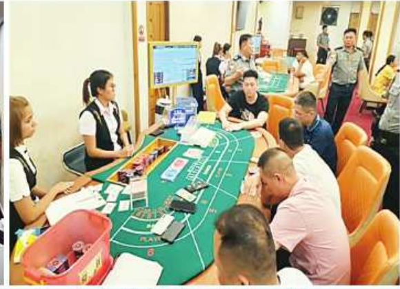
PAL HOTEL ဒုတိယထပ်တွင် လောင်းကစားပြုလုပ်နေစဉ် ဖမ်းဆီးရမိသည့် မှတ်တမ်းဓာတ်ပုံ။