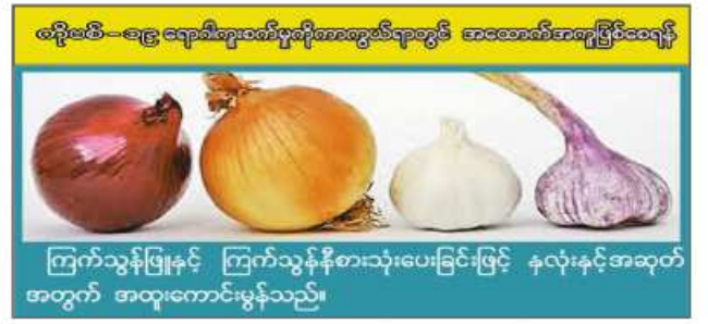
ကြက်သွန်ဖြူနှင့် ကြက်သွန်နီစားသုံးပေးခြင်းဖြင့် နှလုံးနှင့်အဆုတ် အတွက် အထူးကောင်းမွန်သည်။