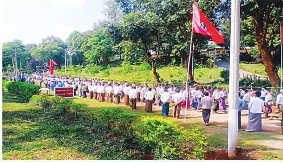
အရှေ့မြောက်တိုင်းစစ်ဌာနချုပ်မှ တာဝန်ရှိသူများ။ ဌာနဆိုင်ရာဝန်ထမ်းများနှင့် ဒေသခံပြည်သူများက ပြည်သူ့စစ်မှုထမ်းသင်တန်းအမှတ်စဉ်(၂)သို့တက်ရောက်ကြမည့် နိုင်ငံ့သားကောင်းရတနာများကို အောင်သပြေများဖြင့် သောင်းသောင်းဖြဖြရုတ်ဖြဖြကြိုဆိုစဉ်။