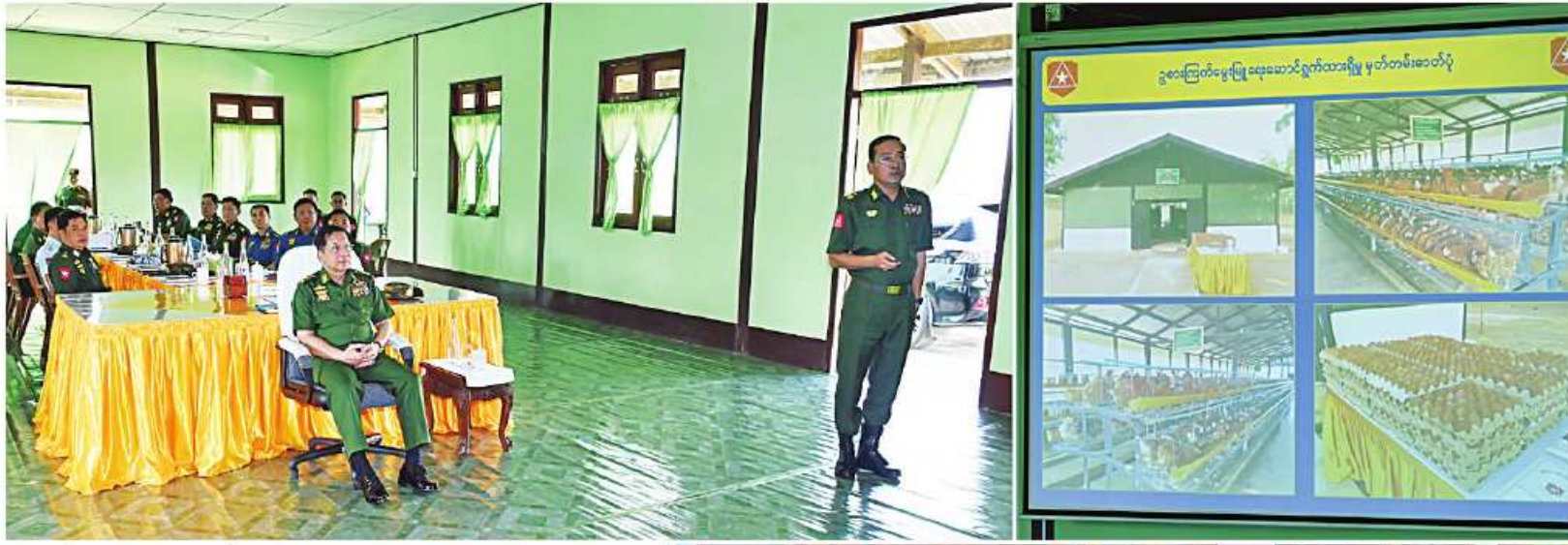
နိုင်ငံတော်စီမံအုပ်ချုပ်ရေးကောင်စီဥက္ကဋ္ဌ တပ်မတော်ကာကွယ်ရေးဦးစီးချုပ် ဝန်ထမ်းများကြီး မင်းအောင်လှိုင်အား ကြိုဂံဒေသတိုင်း ဝန်ထောက်ချုပ် တိုင်းမှူး ဝန်ထောက်ချုပ်အောင်နိုင်ဝင်းက ခိုက်ပျိုးမွေးမြူရေးဆောင်ရွက်ထားရှိမှု အခြေအနေများနှင့် ပတ်သက်၍ ရှင်းလင်းတင်ပြစဉ်။

စာမျက်နှာ ၁၉ မှအဆက် အမိန့်နှင့်တာဝန်ကို ကျေပွန်စွာ တာဝန်ထမ်းဆောင်ကြရန် လိုကြောင်း၊ ဦးစီးခေါင်းဆောင်များ အနေဖြင့်လည်း မိမိတို့၏ လက်အောက်မှ အရာရှိ၊ စစ်သည်၊ မိသားစုများအတွက် ပတ်ဝန်းကျင်ကောင်းများ ဖန်တီးပေးနိုင် ရမည်ဖြစ်ပြီး ညီညွတ်မှုတည်ဆဲ အုပ်ချုပ်မှု ပုံစံရှိရမည်ဖြစ်ကြောင်း၊ တပ်မှူးကောင်း သဖွယ်စိတ်ဓာတ်၊ ဖခင်သဖွယ်စိတ်ဓာတ် ဖြင့် ကွပ်ကဲအုပ်ချုပ်ရမည်ဖြစ်ကြောင်း၊ အရာရှိ၊ စစ်သည်များ၊ မိသားစုဝင်များ အားလုံး ညီညွတ်ညွတ်ဖြင့် စည်းလုံး ညီညွတ်စွာနေထိုင်ကြရန်လိုပြီး နိုင်ငံတော် နှင့် တပ်မတော်က ပေးအပ်လာသည့် တာဝန်များကို ကျေပွန်စွာ ထမ်းဆောင် ကြရမည်ဖြစ်ကြောင်းဖြင့် မှာကြားပြီး အရာရှိ၊ စစ်သည်၊ မိသားစုများ၏ လိုအပ် ချက်များကို မေးမြန်းသည်။ ထို့နောက် နိုင်ငံတော်စီမံအုပ်ချုပ်ရေး ကောင်စီဥက္ကဋ္ဌ တပ်မတော်ကာကွယ်ရေး ဦးစီးချုပ်က ကျွမ်းကျင်တပ်နယ်မှ အရာရှိ၊ စစ်သည်၊ မိသားစုများအတွက် စားသောက် ဖွယ်ရာပစ္စည်းများကို ပေးအပ်ရာ တိုင်းမှူးကလည်းကောင်း၊ နိုင်ငံတော်စီမံ အုပ်ချုပ်ရေးကောင်စီဥက္ကဋ္ဌ တပ်မတော် ကာကွယ်ရေးဦးစီးချုပ်၏ဇနီးက တပ်နယ် မိခင်နှင့် ကလေးစောင်ရွှောက်ရေးအသင်း အတွက် ချီးမြှင့်ငွေများကို ပေးအပ်ရာ တိုင်းမှူး၏ဇနီးကလည်းကောင်း အသီးသီး လက်ခံရယူကြသည်။ ထို့နောက် နိုင်ငံတော်စီမံ အုပ်ချုပ်ရေးကောင်စီဥက္ကဋ္ဌ တပ်မတော် ကာကွယ်ရေးဦးစီးချုပ်နှင့် ဇနီး၊ အဖွဲ့ဝင် မိခင်နှင့် ကလေးစောင်ရွှောက်ရေးအသင်း အတွက် ချီးမြှင့်ငွေများကို ပေးအပ်ရာ တိုင်းမှူး၏ဇနီးကလည်းကောင်း အသီးသီး လက်ခံရယူကြသည်။ ထို့နောက် နိုင်ငံတော်စီမံ အုပ်ချုပ်ရေးကောင်စီဥက္ကဋ္ဌ တပ်မတော် ကာကွယ်ရေးဦးစီးချုပ်နှင့် ဇနီး၊ အဖွဲ့ဝင် မိခင်နှင့် ကလေးစောင်ရွှောက်ရေးအသင်း အတွက် ချီးမြှင့်ငွေများကို ပေးအပ်ရာ တိုင်းမှူး၏ဇနီးကလည်းကောင်း အသီးသီး လက်ခံရယူကြသည်။