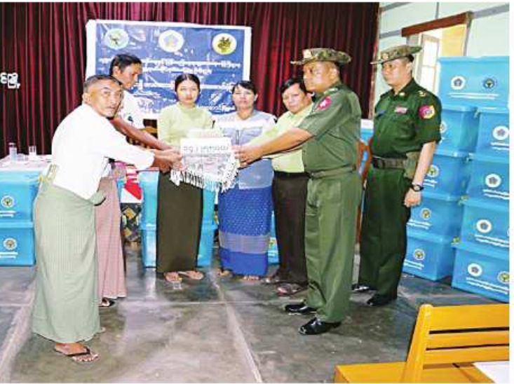
တောင်ပိုင်းတိုင်းစစ်ဌာနချုပ်မှ တာဝန်ရှိသူများက လေဘေးသင့်ပြည်သူများအတွက် ထောက်ပံ့ငွေနှင့် ကယ်ဆယ်ရေးပစ္စည်းများ ထောက်ပံ့ပေးအပ်ခဲ့ခြင်း

တောင်ပိုင်းတိုင်းစစ်ဌာနချုပ်မှ နယ်မြေခံ တပ်မတော်သားများက မြန်မာနိုင်ငံရဲ့ တပ်ဖွဲ့ဝင်များ၊ ဌာနဆိုင်ရာဝန်ထမ်းများ၊ ဒေသခံပြည်သူများနှင့်ပူးပေါင်း၍ ပြန်လည်ပြုပြင်ပေးခြင်းလုပ်ငန်းများ ဆောင်ရွက်ပေးသည်။ ထိုသို့ ဆောင်ရွက်ပေးနေမှုများကို တိုင်းစစ်ဌာနချုပ်မှ တာဝန်ရှိသူများက သွားရောက်ကြည့်ရှုအားပေးပြီး လိုအပ်သည်များ ပေါင်းစပ်ညှိနှိုင်းဆောင်ရွက်ပေးကာ လေဘေးသင့်အိမ်ထောင်စုများအတွက် ထောက်ပံ့ငွေ ၄၄၂ သိန်းကျော်နှင့် ကယ်ဆယ်ရေးပစ္စည်း ၁၇ မျိုးပါပုံး ၄၁ ပုံးနှင့်အိမ်ဆောက်ပစ္စည်းများ ထောက်ပံ့ပေးအပ်ခဲ့ကြောင်း သတင်းရရှိသည်။