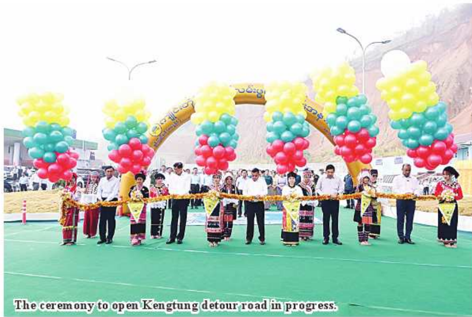
The ceremony to open Kengtung detour road in progress.