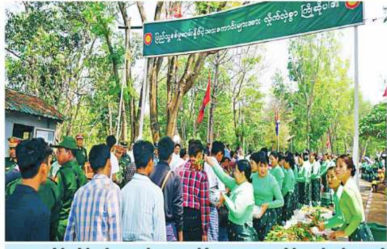
အရှေ့ပိုင်းတိုင်းစစ်ဌာနချုပ်မှ တာဝန်ရှိသူများ။ ဌာနဆိုင်ရာဝန်ထမ်းများနှင့် ဒေသခံပြည်သူများက ပြည်သူ့စစ်မှုထမ်းသင်တန်းအမှတ်စဉ်(၂)သို့တက်ရောက် ကြမည့် နိုင်ငံ့သားကောင်းရတနာများကို အောင်သပြေများဖြင့် သောင်းသောင်း ဖြဖြရုတ်ဖြဖြကြိုဆိုစဉ်။

ယခုကဲ့သို့ မျိုးချစ်စိတ်ဓာတ်အပြည့် အဝဖြင့် နိုင်ငံတော်၏ကာကွယ်ရေးတာဝန် များကိုထမ်းဆောင်ရန်အတွက် ရဲဝံ့သည် စိတ်ဓာတ်များဖြင့် ဝင်ရောက်လာသော နိုင်ငံ့သားကောင်းရတနာများကို အစဉ်အမြဲ လေးစားဂုဏ်ယူလျက်ရှိကြောင်း သတင်း ရရှိသည်။