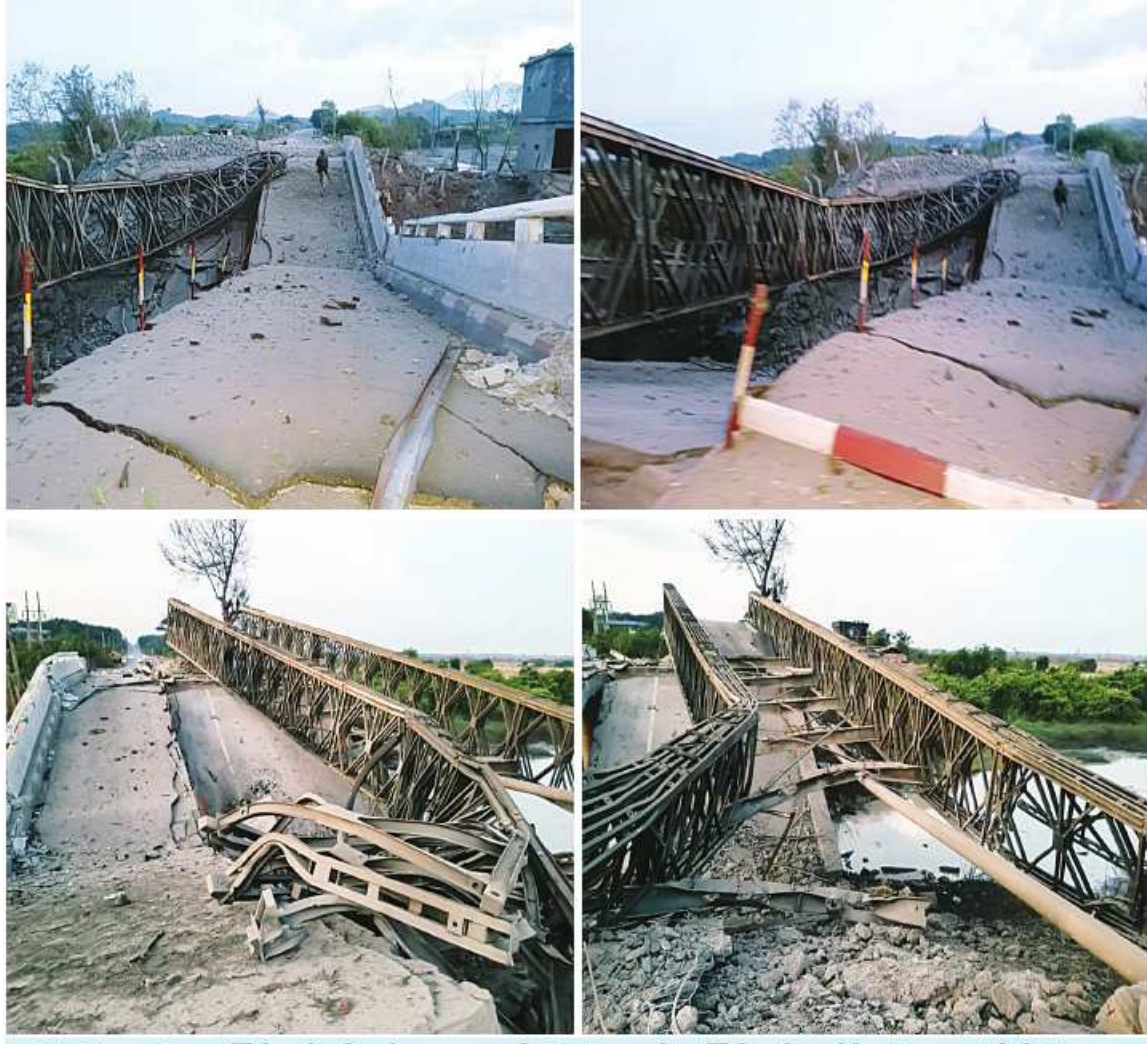
KNLA အဖွဲ့မှ အကြမ်းဖက်မှုကို လိုလားသူများနှင့် PDF အမည်ခံအကြမ်းဖက်ပူးပေါင်းအဖွဲ့က ကျုံအိတ်တံတားအား မိုင်းထောင်ဖောက်ခွဲဖျက်ကြောင့် တံတားပျက်စီးနေမှု ဖုတ်တမ်းဓာတ်ပုံ။

အများပြည်သူအသုံးပြုလျက်ရှိသည့် လမ်းမ၊ တံတားများကို ဖောက်ခွဲဖျက်ဆီးခြင်းသည် စစ်ရာဇဝတ်မှု (War Crime) ကို ကျူးလွန်ခြင်းဖြစ်သည်။ အဆိုပါမိုင်းခွဲဖျက်ဆီးမှုကြောင့် လက်ရှိတွင် လူနှင့်ယာဉ်ကြီး၊ ယာဉ်ငယ်များ ဖြတ်သန်းသွားလာရန် အခက်အခဲများဖြစ်ပေါ်လျက်ရှိသဖြင့် တံတားပျက်စီးမှုကို သက်ဆိုင်ရာ လမ်း၊ တံတား ဦးစီးဌာနမှ ဝန်ထမ်းများနှင့် တာဝန်ရှိသူများက အမြန်ဆုံးပြင်ဆင်နိုင်ရေး ဆက်လက်ဆောင်ရွက်လျက်ရှိကြောင်းနှင့် လုံခြုံရေးတပ်ဖွဲ့ဝင်များအနေဖြင့် လိုအပ်သည့် အကြမ်းဖက်ချေမှုန်းရေး စစ်ဆင်ရေး(Counter-Terrorism Operation)ကို ဆက်လက်ဆောင်ရွက်လျက်ရှိကြောင်း သတင်းရရှိသည်။