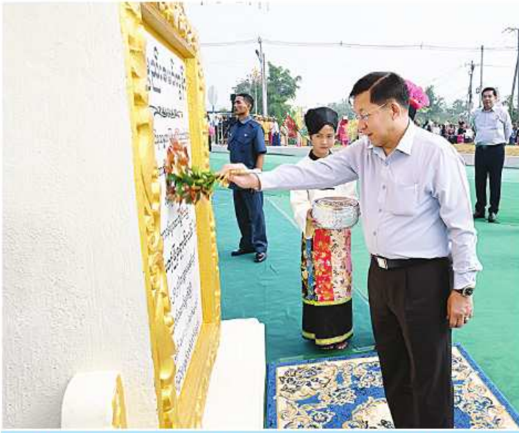
နိုင်ငံတော်စီမံအုပ်ချုပ်ရေးကောင်စီဥက္ကဋ္ဌ နိုင်ငံတော်ဝန်ကြီးချုပ် ဝိုလ်ချုပ်မျိုးကြီးမင်းအောင်လှိုင် ကျိုင်းတုံမြို့၊ မြို့ရှောင်လမ်းကမ္ဘည်းမော်ကွန်းကျောက်စာတိုင်ကို အမွှေးနံ့သာရည်များ ပက်ဖျန်းပေးစဉ်။