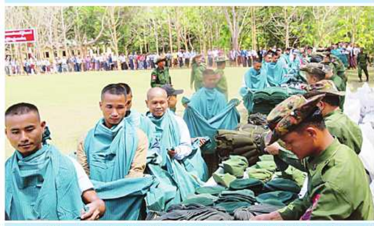
တာဝန်ရှိသူများက ပြည်သူ့စစ်မှုထမ်းသင်တန်းအမှတ်စဉ်(၂)သို့ တက်ရောက် ကြမည့် နိုင်ငံ့သားကောင်းရတနာများကို စစ်အသုံးအဆောင်ပစ္စည်းများ ထုတ်ပေးစဉ်။