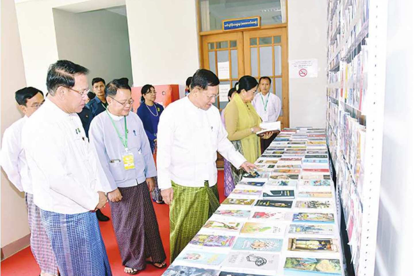
နိုင်ငံတော်စီမံအုပ်ချုပ်ရေးကောင်စီဥက္ကဋ္ဌ နိုင်ငံတော်ဝန်ကြီးချုပ် ဗိုလ်ချုပ်မှူးကြီးမင်းအောင်လှိုင်နှင့် ဇနီး ဒေါ်ကြူကြူလှတို့ စာအုပ်စာစောင်များနှင့် စာတတ်ပုံမှတ်တမ်းများကို စိတ်ပါဝင်စားစွာ လှည့်လည်ကြည့်ရှုစဉ်။

နေပြည်တော် မေ ၉ ပြည်ထောင်စုနယ်မြေနေပြည်တော် “စာကြည့်တိုက်များဖွံ့ဖြိုးတိုးတက်ရေးနှင့် စာပတ်ရှိန်မြှင့်တင်ရေးလှုပ်ရှားမှု” အခမ်းအနားကို ယနေ့နံနက်ပိုင်းတွင် နေပြည်တော် မြို့တော်ခန်းမ၌ ကျင်းပပြုလုပ်ရာ နိုင်ငံတော်စီမံအုပ်ချုပ်ရေးကောင်စီဥက္ကဋ္ဌ နိုင်ငံတော်ဝန်ကြီးချုပ် ဗိုလ်ချုပ်မှူးကြီးမင်းအောင်လှိုင်နှင့် ဇနီး ဒေါ်ကြူကြူလှတို့ တက်ရောက်သည်။ အခမ်းအနားသို့ နိုင်ငံတော်စီမံအုပ်ချုပ်ရေးကောင်စီဥက္ကဋ္ဌ နိုင်ငံတော်ဝန်ကြီးချုပ်နှင့် ဇနီးတို့နှင့်အတူ ကောင်စီတွဲဖက်အတွင်းရေးမှူး ဒုတိယဗိုလ်ချုပ်ကြီးရဲဝင်းဦးနှင့် ဇနီး၊ ကောင်စီအဖွဲ့ဝင်များနှင့် ဇနီးများ၊ ပြည်ထောင်စုအဆင့်ပုဂ္ဂိုလ်များ၊ ပြည်ထောင်စုဝန်ကြီးများနှင့် ဇနီးများ၊နေပြည်တော်ကောင်စီဥက္ကဋ္ဌ၊ ကာကွယ်ရေးဦးစီးချုပ်ရုံးမှ အဆင့်မြင့်တပ်မတော်အရာရှိကြီးများ၊နေပြည်တော်တိုင်းစစ်ဌာနချုပ် တိုင်းမှူး၊ ဒုတိယဝန်ကြီးများ၊ ဌာနဆိုင်ရာတာဝန်ရှိသူများ၊ အလှူရှင်များနှင့်ဖိတ်ကြားထားသူများ၊ နေပြည်တော်ကောင်စီနယ်မြေအတွင်းရှိ အသင်းအဖွဲ့များမှ တာဝန်ရှိသူများ၊ နေပြည်တော် စာကြည့်တိုက်များဖောင်ဒေးရှင်းမှ တာဝန်ရှိသူများ၊နေပြည်တော် Book Club အဖွဲ့ဝင်များ၊ စာမျက်နှာ ၁၆ ကော်လံ ၁၂၅