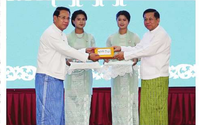
နိုင်ငံတော်စီမံအုပ်ချုပ်ရေးကောင်စီဥက္ကဋ္ဌ နိုင်ငံတော်ဝန်ကြီးချုပ် ဝိုလ်ချုပ်မှူးကြီးမင်းအောင်လှိုင်က အလှူငွေနှင့် စာအုပ်စာစောင်များထောက်ပံ့ပေးအပ်ရာ မြန်မာနိုင်ငံစာကြည့်တိုက်များ ဖွံ့ဖြိုးတိုးတက်ရေးပေါင်းဆောင်ရွက်မှုကော်မတီဥက္ကဋ္ဌ ပြန်ကြားရေးဝန်ကြီးဌာန ပြည်ထောင်စုဝန်ကြီး ဦးမောင်မောင်အုန်းက လက်ခံရယူစဉ်။ ၈၅၅၄၀ ကို ပြည်ထောင်စုနယ်မြေအပါအဝင် ၂၇ တိုက် အသစ်တည်ဆောက်ဖွင့်လှစ်တိုင်းဒေသကြီးနှင့် ပြည်နယ်အသီးသီးသို့ နိုင်ငံရန်အတွက် ငွေကျပ်သိန်းပေါင်း ၄၀၅၀ စုစုပေါင်းငွေကျပ်သိန်းပေါင်း ၆၄၅၀ နှင့် ပြည်သူများ စာပေဖတ်ရှုလေ့လာနိုင်ရန်အတွက် စာအုပ်စာစောင် ၆၇၇၈၀ ကို နိုင်ငံတော် စီမံအုပ်ချုပ်ရေးကောင်စီဥက္ကဋ္ဌ နိုင်ငံတော်ဝန်ကြီးချုပ်က စာမျက်နှာ ၁၉ သို့

အဆောက်အအုံများ တိုးချဲ့ဆောက်လုပ်နိုင်ရေး နိုင်ငံတော်စီမံအုပ်ချုပ်ရေးကောင်စီဥက္ကဋ္ဌ နိုင်ငံတော်ဝန်ကြီးချုပ်နှင့် ဇနီးမိသားစုက အလှူငွေများကို ပေးအပ်လှူဒါန်းရာ ပြန်ကြားရေးဝန်ကြီးဌာန ပြည်ထောင်စုဝန်ကြီးက လက်ခံရယူသည်။ ယင်းနောက် မြန်မာနိုင်ငံစာကြည့်တိုက်များ ဖွံ့ဖြိုးတိုးတက်ရေးပေါင်းဆောင်ရွက်မှုကော်မတီ၊ နေပြည်တော်ကောင်စီ၊ တိုင်းဒေသကြီးနှင့် ပြည်နယ်အစိုးရအဖွဲ့များနှင့် အလှူရှင်များက စာကြည့်တိုက်အဆောက်အအုံများ တိုးချဲ့ဆောက်လုပ်နိုင်ရေးအတွက် အလှူငွေများကို အသီးသီးပေးအပ်လှူဒါန်းကြရာ နိုင်ငံတော်စီမံအုပ်ချုပ်ရေးကောင်စီဥက္ကဋ္ဌ နိုင်ငံတော်ဝန်ကြီးချုပ်က လက်ခံရယူပြီး ဂုဏ်ပြုမှတ်တမ်းလွှာများ ပြန်လည်ပေးအပ်သည်။ ထို့နောက် ဧပြီ ၁၀ ရက်တွင် ပြုလုပ်ခဲ့သည့် မြန်မာနိုင်ငံတစ်ဝန်းလုံးရှိ စာကြည့်တိုက်များ ဖွံ့ဖြိုးတိုးတက်ရေးအတွက် အလှူငွေနှင့် စာအုပ်စာစောင်များ ပေးအပ်လှူဒါန်းပွဲအခမ်းအနားတွင် လက်ခံရရှိခဲ့သည့် အလှူငွေကျပ် ၁၀၂၇၆၂၄၃၈၀၊ စာအုပ်စာစောင်ပေါင်း