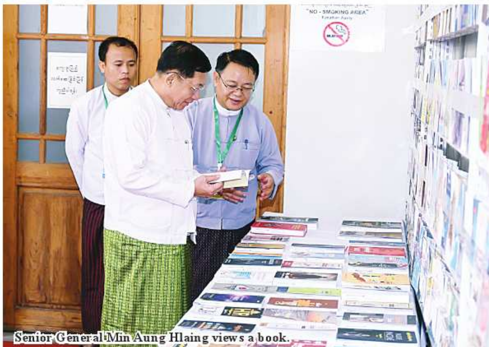
Senior General Min Aung Hlaing views a book.