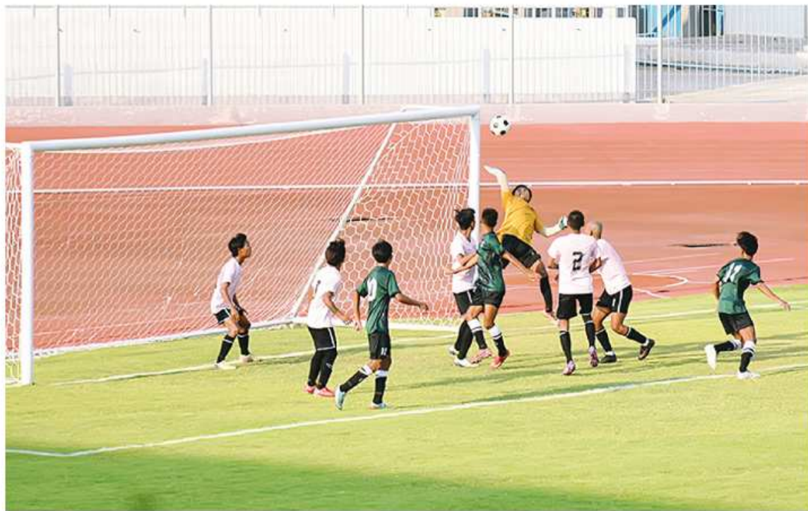
မန္တလေး မေ ၉

မန္တလေးတိုင်းဒေသကြီးဝန်ကြီးချုပ် ဖလား ခရိုင်ပေါင်းစုံ အသက် ၂၁ နှစ်အောက် အမျိုးသားဘောလုံးပြိုင်ပွဲ ဖွင့်ပွဲအခမ်းအနားကို အောင်မြေသာစံ မြို့နယ်ရှိ အောင်မြေမန္တလာအားကစားကွင်းတွင် ယနေ့ညနေပိုင်းက ကျင်းပရာ တိုင်းဒေသကြီးဝန်ကြီးချုပ် ဦးမျိုးအောင်၊ တိုင်းဒေသကြီး တရားလွှတ်တော်တရားသူကြီးချုပ်၊ တိုင်းဒေသကြီးဝန်ကြီးများနှင့် တာဝန်ရှိသူများ၊ တိုင်းဒေသကြီးအားကစားဆပ်ကော်မတီ အသီးသီးမှ ဥက္ကဋ္ဌနှင့် အဖွဲ့ဝင်များ၊ တိုင်းဒေသကြီးအဆင့် ဌာနဆိုင်ရာများ၊ အားကစားဝါသနာရှင်များ တက်ရောက်ကြသည်။