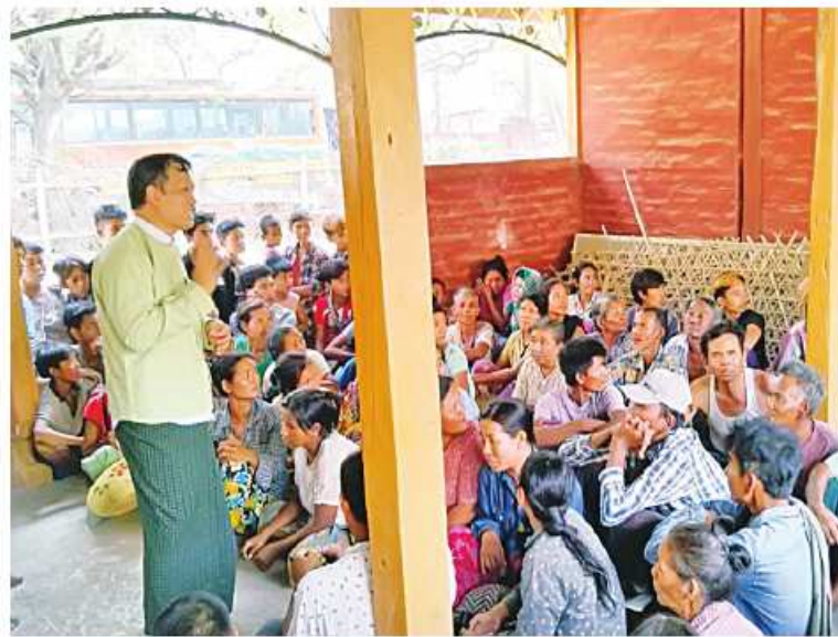
မြင်းခြံမြို့နယ် ဆုံရာကျေးရွာရှိ ဒေသခံပြည်သူများကို တာဝန်ရှိသူတစ်ဦးက တွေ့ဆုံ အားပေးစကားပြောကြားစဉ်။

နေပြည်တော် မေ ၉ မန္တလေးတိုင်းဒေသကြီး မြင်းခြံမြို့နယ် ဆီမီးခုံကျေးရွာ၏အရှေ့ဘက်ရှိ ဆုံရာကျေးရွာ ကို ယနေ့နံနက်ပိုင်းက PDF အမည်ခံ အကြမ်းဖက်သမားများက လက်နက်ကြီး၊ လက်နက်ငယ်များဖြင့် ပစ်ခတ်မှုကြောင့် ကျေးရွာနေဒေသခံပြည်သူ အမျိုးသား ၁၇ ဦး၊ အမျိုးသမီး ၁၅ ဦး စုစုပေါင်း ၃၂ ဦး သေဆုံးခဲ့ပြီး အမျိုးသား ၄၆ ဦး၊ အမျိုးသမီး ကိုးဦး စုစုပေါင်း ၅၄ ဦး ဖုံးစထိမှန်ဒဏ်ရာ များ ရရှိခဲ့သည်။ ထို့ပြင် ကျေးရွာအတွင်း စစ်ရေးနှင့် မသက်ဆိုင်သော အေးချမ်းစွာနေလိုသည့် အပြစ်မဲ့ပြည်သူများ၏ အိုးအိမ်များကို PDF အမည်ခံ အကြမ်းဖက်သမားများက မီးရှို့ဖျက်ဆီးခဲ့ရာ ကျေးရွာအတွင်းရှိ