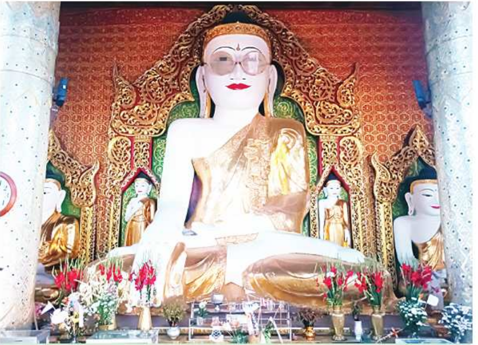
ရွှေတောင်မြို့ရှိ ရွှေမျက်မှန်ဘုရားကို တွေ့ရစဉ်။

လိုက်ရတယ်။ ရွှေမျက်မှန်ဘုရားက ရန်ကင်း- ပြည်လမ်းရဲ့အတွင်းဘက် မနီးမဝေးနေရာမှာ ရှိနေတယ်။ ဘုရားဝင်းထဲကိုရောက်တာနဲ့ ပထမဦးဆုံးတွေ့မြင်နေရတဲ့ ရုပ်ပွားတော်ကြီးကို ဝင်ရောက်ဖူးမြော်နေကြပေမဲ့ ရုပ်ပွားတော်ကြီးက ရွှေမျက်မှန်ဘုရားမဟုတ်သေးဘဲ နောက်ထပ်တစ်ခါ ထပ်မံဖူးမြော်ကြရတဲ့ ရုပ်ပွားတော်ကြီးကမှ ရွှေကိုင်းမျက်မှန်တပ်ဆင်ထားတဲ့ ရွှေမျက်မှန်