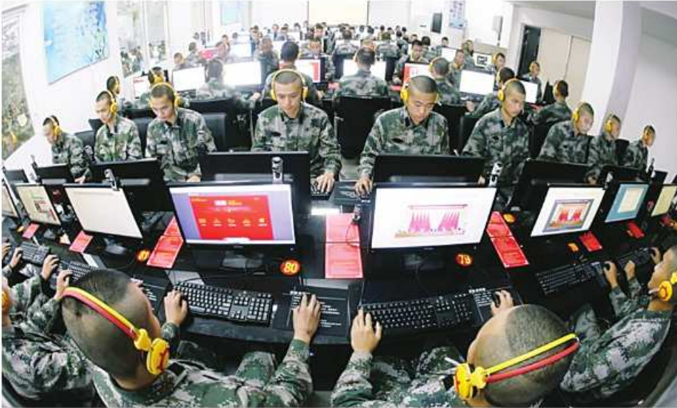
PLA-ISF အဖွဲ့၏ AI နည်းပညာများ လက်တွေ့လုပ်ဆောင်နေစဉ်။

ပြန်လည်အမည်ပြောင်းထားသော PLA-ISF သည် တရုတ်တို့၏ မဟာဗျူဟာမြောက်တွေးခေါ်မှု ကို သတင်းအချက်အလက်စစ်ဆင်ရေးများအောင်မြင် ခြင်းမှသည် ဥာဏ်ရည်တုအထောက်အကူပြုစစ်ပွဲ အောင်မြင်ရေးဆီသို့ ပြုပြင်ပြောင်းလဲလာမှုကိုထင်ဟပ် ပေါ်လွင်စေလျက်ရှိသည်။ ထို့ကြောင့် PLA-SSF ကို