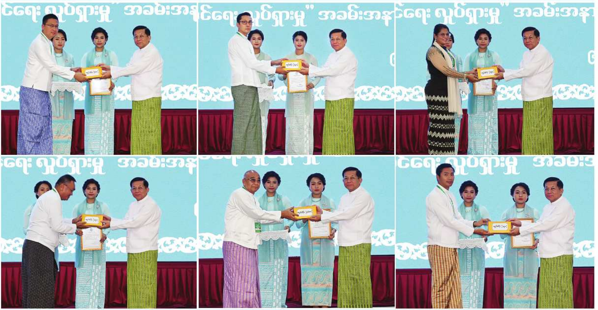
နိုင်ငံတော်စီမံအုပ်ချုပ်ရေးကောင်စီဥက္ကဋ္ဌ နိုင်ငံတော်ဝန်ကြီးချုပ် ဝိုလ်ချုပ်မှူးကြီးမင်းအောင်လှိုင်ထံ အလှူရှင်များက အလှူငွေများ ပေးအပ်လှူဒါန်းကြစဉ်။

စာမျက်နှာ ၁၇ မှအဆက် စာကြည့်တိုက်များ ဖွံ့ဖြိုးတိုးတက်ရေးအတွက် အလှူငွေများနှင့် စာအုပ်စာစောင်များ လှူဒါန်းခဲ့ကြသည့် အလှူရှင်များအားလုံး၏လှူဒါန်းမှုသည် စဉ်ဆက်မပြတ်သည့် ဖွံ့ဖြိုးတိုးတက်မှုအသိပညာအလှူဖြစ်သည့်အတွက် အထောက်အကူပြုသော လှူဒါန်းခြင်းဖြစ်သဖြင့် အထူးပင်ကျေးဇူးတင်ရှိသည်ကို ပြောကြားလိုကြောင်း၊ မှန်ကန်ကောင်းမွန်သည့် အသိပညာများ ရှာဖွေရေးအတွက် အထောက်အကူပြုနိုင်စေရန်အတွက် အစွမ်းအားပေးဆောင်ရွက်ပေးရမည်ဖြစ်ကြောင်း၊ မိမိတို့ စတင်တာဝန်ယူဆောင်ရွက်ခဲ့သည့် Green City၊ Clean City၊ Smart City ဖြစ်စေရန်နှင့် Smokeless Industry များ အကောင်အထည်ဖော်နိုင်ရေးဆောင်ရွက်ခဲ့ကြောင်း၊ ထိုအထဲတွင် ပညာရေးမြှင့်တင်ရေးအတွက် အထောက်အကူပြုနိုင်ရေးအတွက်လည်း အားပေးဆောင်ရွက်ခဲ့ပြီး တက္ကသိုလ်များကိုလည်း တိုးချဲ့တည်ဆောက် ဖွင့်လှစ်ပေးခဲ့ကြောင်း၊