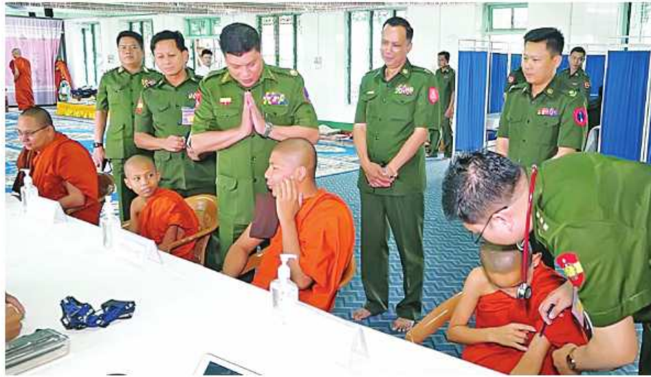
သံဃာတော်များအား မြောက်ပိုင်းတိုင်း ဝန်ကြီးဌာနချုပ် နယ်လှည့် ဆေးကုသရေးအဖွဲ့က ကျန်းမာရေး စောင့်ရှောက်မှု လုပ်ငန်းများ ဆောင်ရွက် ပေးနေမှုကို တာဝန်ရှိသူများက ဖူးမြော်အားပေးစကား လျှောက်ထားစဉ်။

နေပြည်တော် မေ ၉ ကချင်ပြည်နယ် မြစ်ကြီးနားမြို့ရှိ သံဃာတော်များအား ယနေ့ နံနက်ပိုင်းတွင် မြောက်ပိုင်းတိုင်းစစ်ဌာနချုပ် နယ်လှည့် ဆေးကုသရေးအဖွဲ့က မြစ်ကြီးနားမြို့ရှိ ဓမ္မရက္ခိတဝန်းသို့ကျောင်းတိုက်၌ ကျန်းမာ ရေးစောင့်ရှောက်မှုလုပ်ငန်းများ ဆောင် ရွက်ပေးသည်။ ထိုသို့ဆောင်ရွက်ပေးရာတွင် ဆေး ကုသရေးအဖွဲ့က သံဃာတော် ၄၁ ပါး