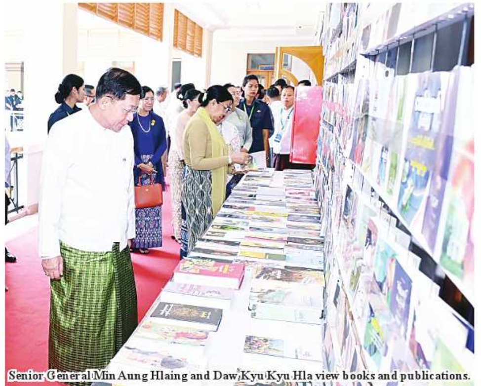
Senior General Min Aung Hlaing and Daw Kyu Kyu Hla view books and publications.

the people have completed just primary education, and they are beyond the school age. Hence, it is necessary to create chances for them to accumulate knowledge and technologies in the society. In order to achieve success in national vision of the State, it is necessary to turn well-versed human resources as a must to establish a developed society and a prosperous society and build Myanmar capable of keeping abreast of global countries. To do so, educated citizens must be turned out. Number of educated persons must be produced for development of a country. All developed countries encourage