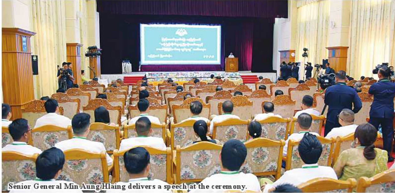
Senior General Min Aung Hlaing delivers a speech at the ceremony.

Nay Pyi Taw May 9 A ceremony to launch “developing libraries and raising reading habit campaign” took place in Nay Pyi Taw Union Territory at the Nay Pyi Taw City Hall this morning, with attendances of Chairman of the State Administration Council Prime Minister Senior General Min Aung Hlaing and wife Daw Kyu Kyu Hla.