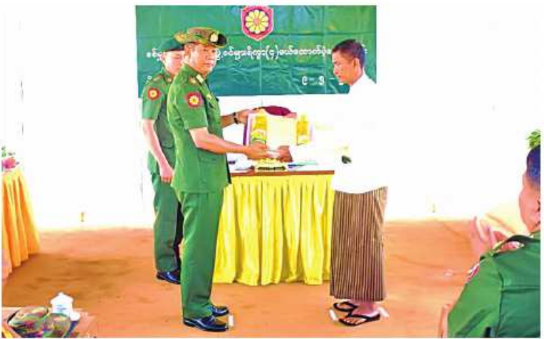
အရှေ့အလယ်ပိုင်းတိုင်းစစ်ဌာနချုပ် တိုင်းမှူး ဝိုင်းချုပ်မျိုးမင်းထွန်း စစ်မှုထမ်းဟောင်း အဖွဲ့ဝင်များနှင့် မိသားစုဝင်များအတွက် ဆန်၊ ဆီ၊ ဆား၊ ပဲနှင့် အာဟာရပြည့် စားသောက်ဖွယ်ရာများ ထောက်ပံ့ပေးအပ်စဉ်။

နေပြည်တော် မေ ၉ ရှမ်းပြည်နယ်(တောင်ပိုင်း) ခိုလှုံမြို့ရှိ စစ်မှုထမ်းဟောင်းအဖွဲ့ဝင်များနှင့် မိသားစု ဝင်များကို ယနေ့နံနက်ပိုင်းတွင် အရှေ့ အလယ်ပိုင်းတိုင်းစစ်ဌာနချုပ် တိုင်းမှူး ဝိုင်းချုပ်မျိုးမင်းထွန်းနှင့် အဖွဲ့ဝင်များက ခိုလှုံမြို့ရှိ စစ်မှုထမ်းဟောင်းအိမ်ရာ၌ သွားရောက်တွေ့ဆုံသည်။ ဦးစွာ တိုင်းမှူးက အမှာစကားပြောကြား သည်။ ထို့နောက် စစ်မှုထမ်းဟောင်းအဖွဲ့ဝင် များနှင့် မိသားစုဝင်များ၏ တင်ပြချက်များ အပေါ် လိုအပ်သည်များ ပေါင်းစပ်ညှိနှိုင်း