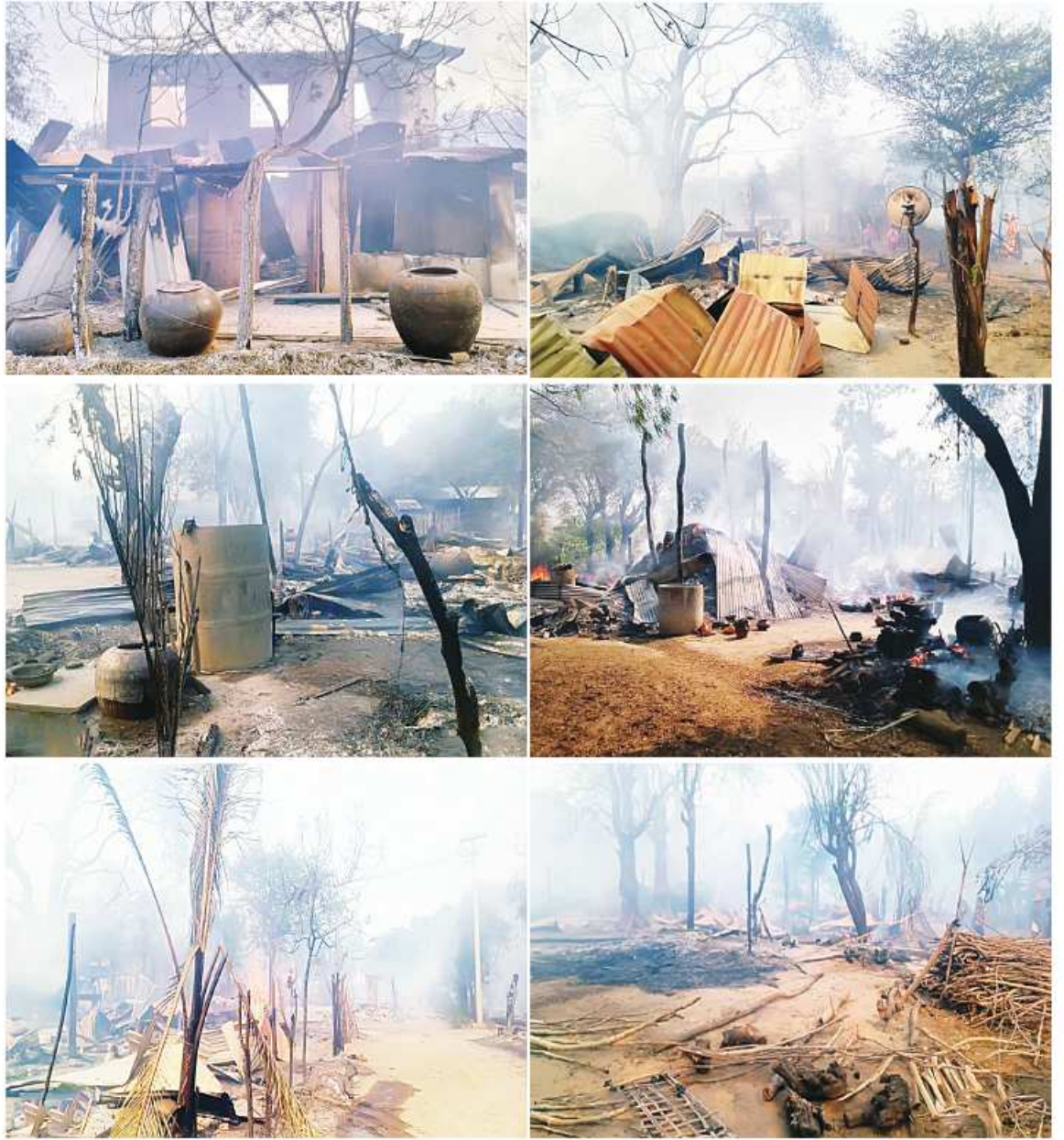
မြင်းခြံမြို့နယ် ဆုံရွာကျေးရွာအတွင်းသို့ PDF အမည်ခံအကြမ်းဖက်သမားများက လက်နက်ကြီးများဖြင့် ပစ်ခတ်တိုက်ခိုက်ပြီး ကျေးရွာအတွင်းရှိ နေအိမ်များအား မီးရှို့ဖျက်ဆီးခဲ့သည့် မှတ်တမ်းဓာတ်ပုံ။

နေပြည်တော် မေ ၉ မန္တလေးတိုင်းဒေသကြီး မြင်းခြံမြို့နယ် ဆုံရွာကျေးရွာအတွင်းသို့ PDF အမည်ခံ အကြမ်းဖက်သမားများက လက်နက်ကြီးများဖြင့် ပစ်ခတ်တိုက်ခိုက်ခဲ့သဖြင့် ကျေးရွာနေ ဒေသခံပြည်သူ အမျိုးသား ၁၇ ဦး၊ အမျိုးသမီး ၅ ဦး စုစုပေါင်း ၂၂ ဦး သေဆုံးခဲ့ပြီး အမျိုးသား ၁၂ ဦး၊ အမျိုးသမီး ၁၀ ဦး စုစုပေါင်း ၂၂ ဦး ပုံးစထိမှန် ဒဏ်ရာများ ရရှိခဲ့ကြောင်း သိရှိရသည်။