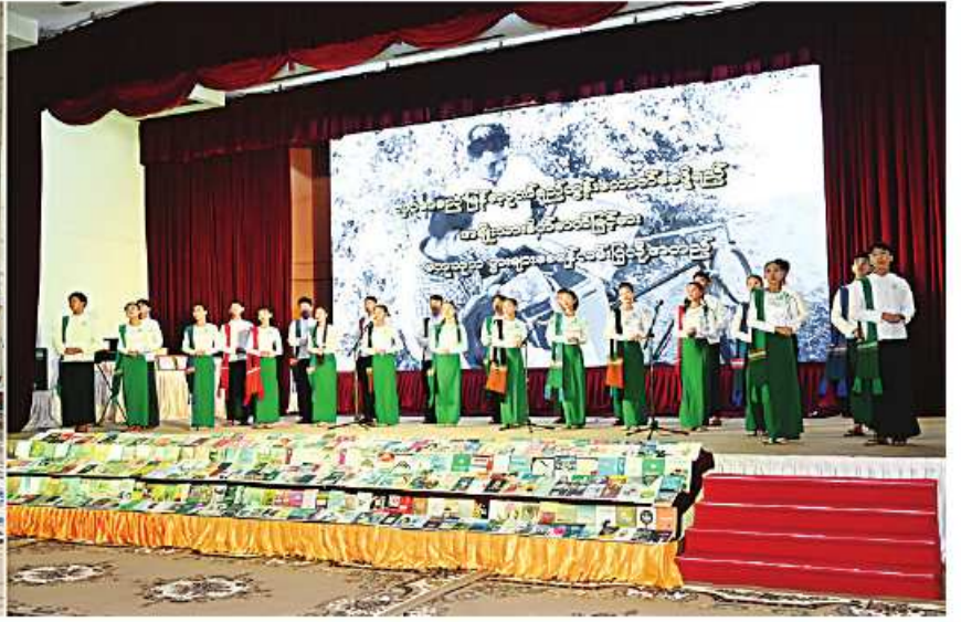
နိုင်ငံတော်စီမံအုပ်ချုပ်ရေးကောင်စီဥက္ကဋ္ဌ နိုင်ငံတော်ဝန်ကြီးချုပ် ဝိုလ်ချုပ်မှူးကြီးမင်းအောင်လှိုင်နှင့်ဇနီး ဒေါ်ကြူကြူလှ၊ အခမ်းအနားတက်ရောက်လာကြသူများက အမှတ်(၁၁)အခြေခံပညာအထက်တန်းကျောင်း နေပြည်တော်မှ ကျောင်းသား၊ ကျောင်းသူများ၏ “ပညာဘဏ်တိုက်စာကြည့်တိုက်သို့ သွားကြရုံ” တေးသီချင်းဖြင့် သီဆိုဖျော်ဖြေမှုကို ကြည့်ရှုအားပေးစဉ်။