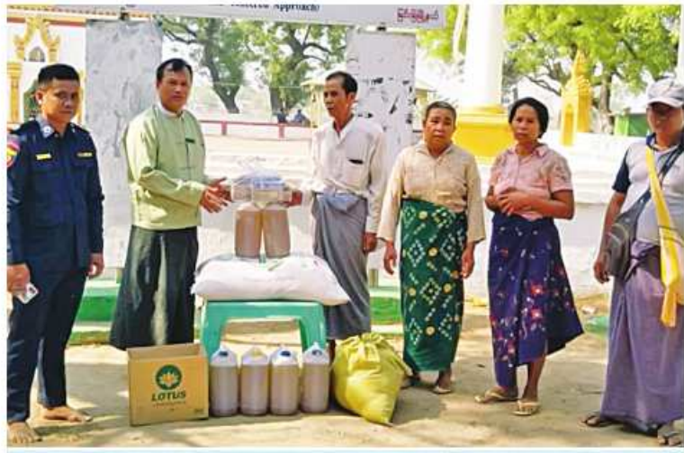
မြင်းခြံမြို့နယ် ဆုံရာကျေးရွာရှိ ဒေသခံပြည်သူများအတွက် တာဝန်ရှိသူတစ်ဦးက အလှူငွေနှင့် ထောက်ပံ့ပေးပစ္စည်းများ ထောက်ပံ့ပေးအပ်စဉ်။

နေအိမ်အလုံး ၅၀ ခန့် မီးလောင်ဆုံးရှုံးခဲ့မှု ပိုင်းတွင် မန္တလေးတိုင်းဒေသကြီးအစိုးရ များဖြစ်ပေါ်ခဲ့သည့်အတွက် ယနေ့နေ့လယ် အဖွဲ့နှင့် အလယ်ပိုင်းတိုင်းစစ်ဌာနချုပ်တို့မှ