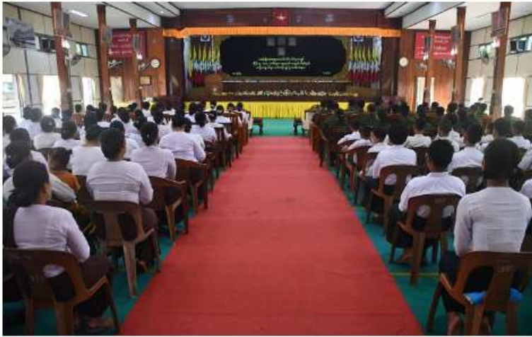
အရှေ့တောင်တိုင်းစစ်ဌာနချုပ်၌ မှီခိုသူကျောင်းသား၊ ကျောင်းသူများကို ယဉ်ကျေးလိမ္မာသင်တန်းဖွင့်လှစ် ကျင်းပစဉ်။

နေပြည်တော် မေ ၈ မှီခိုသူ ကျောင်းသား၊ ကျောင်းသူများ အနေဖြင့် နွေရာသီကျောင်းပိတ်ရက်ကာလများတွင် အားလပ်ချိန်များကို အကျိုးရှိစွာ အသုံးပြုစေရန်၊ ဘာသာ၊ သာသနာကို တန်ဖိုးထားတတ်စေရန်၊ အကျင့်စာရိတ္တကောင်းမွန်ပြီး ပညာထူးချွန်သူများဖြစ်လာစေရန်၊ လက်တွေ့အသုံးပြု ဘာသာရပ်များ