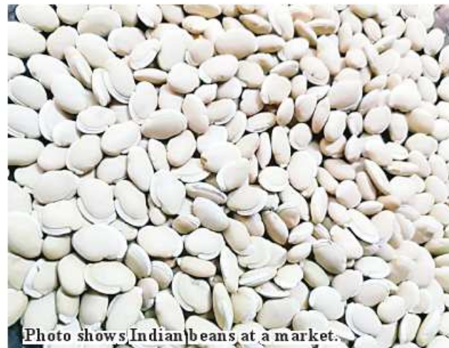
Photo shows Indian beans at a market.

In 2023-2024 winter crop planting season, 11,995 acres of Indian beans were earmarked to be planted in YeU District, and 15,526 acres were planted from October 2023 to December.