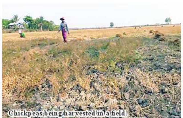
Chickpeas being harvested in a field.