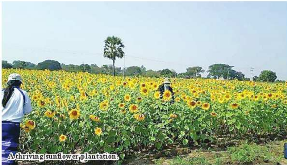
A thriving sunflower plantation.

Kalay May 8 A total of 48,443 acres of sunflower has been harvested in Kalay Township of Sagaing Region, according to Kalay Township Agriculture Department.