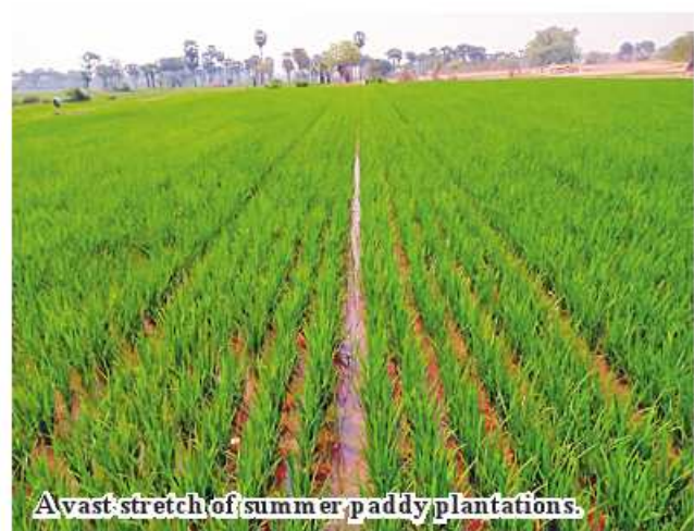
A vast stretch of summer paddy plantations.

was disbursed to over 3,000 acres of summer paddy of 749 farmers from 28 cooperative societies, starting from March. "Our department provides inputs to local farmers. Moreover, 1,448 baskets of quality paddy strains, 2,133 bags of natural fertilizer, 2,328 bags of pearl 50 kg and 1,782 bags of compound fertilizer worth more than K600 million were provided to local farmers. Such provision aims to increase per-acre yield of summer paddy and incomes of farmers. Interest rate is K1 per month. But, farmers need