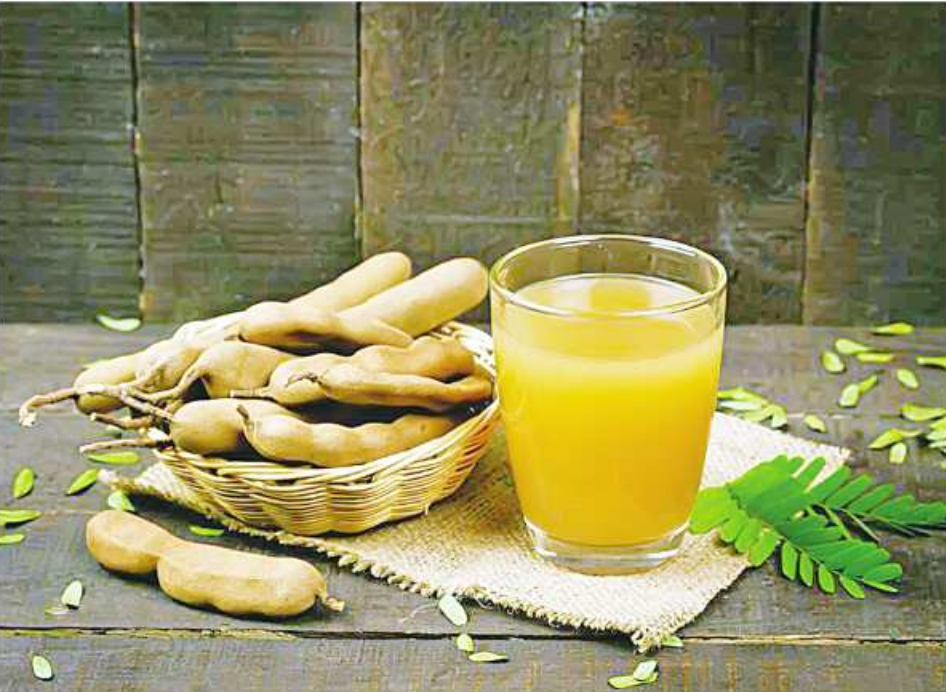
ဆေးဖက်ဝင်မန်ကျည်းဖျော်ရည်ကို တွေ့ရစဉ်။

ဖြေ။ ဒူးနာရောဂါဝေဒနာရှင်တွေအတွက် သင့်တော်ရာသုံးနိုင်မဲ့ ဆေးနည်းတို့တွေကို အောက်မှာဖော်ပြလိုက်ပါတယ်။ ၁။ မုန်ညှင်းဆီ ငါးကျပ်သားမှာ ချင်းတက်လက်နှစ်ဆစ်လောက်ထုခြေထည့်ပြီး မီးနဲ့ဆူအောင်ချက်ပါ။ အဲဒီဆီကို ဒူးထဲစိမ့်ဝင်အောင် တစ်နေ့ နှစ်ကြိမ်လိမ်းပေးပါ။ ၂။ ကိုယ်ရံကြီးဂမုန်းရွက်ကိုပျောလာအောင် မီးကင်ပြီး ဆီသုတ်(နှမ်းဆီမုန်ညှင်းဆီ) ဒူးမှာပတ်ပြီး ပတ်တီးနဲ့စည်းထားပါ။ သုံးနာရီစည်းပြီးရင် ဖြေပါ။ ကြာရုံစည်းရင်ယားတတ်ပါတယ်။ ဆေးစည်းပြီးယားရင် သနပ်ခါးနဲ့ဆားရောသွေးပြီးလိမ်းပါ။ ၃။ သင်္ဘောရွက်ကိုပျောအောင်ရေနွေးစိမ်ပါ။ ဒူးမှာအုပ်ပြီး ပတ်တီးစည်းထားပါ။ ညအိပ်ရာဝင်စည်းပြီး မနက်အိပ်ရာထရင် ဖြေပါ။ ၄။ ရက်မှန်မှန်စည်းပါ။ ဒူးကျိုးပေါင်းတက်ရောဂါ ပျောက်ပါတယ်။ ၅။ ချဉ်ပေါင်ရိုးနီကိုပျောအောင် ရေနွေးနဲ့ဖြုတ်ပြီးရေစစ်ပါ။ ငရုတ်ဆုံမှာထည့်ပြီး ညက်အောင်ထောင်းပါ။ ချဉ်ခြောက်အမှုန့်အနည်းငယ်ရောထည့်နယ်ပြီး ဒူးမှာအုံပတ်တီးစည်းပါ။ ညအိပ်ရာဝင်စည်းပြီး မနက်အိပ်ရာထရင် ဖြေပါ။ ၆။ ဟင်းခက်အနုကိုခူးပြီး မီးကင် ဒူးမှာကပ်ဒူးစွပ်စွပ်ထားပါက ဒူးနာသက်သာစေတယ်။ ပတ်တီးနဲ့စည်းထားရင်လဲ ရပါတယ်။ ၇။ ကြက်ဆူရိုးနီအရွက်ကို ရေနွေးစိမ်ပြီး ပျောလာပါက ညက်အောင်ထောင်းပါ။ ဒူးနဲ့တံကောက်ကွေးမှာ အုံပြီးစည်းရင် ကွေးဆန့်မရတဲ့ ဒူးအဆစ်ကျရောဂါ ပျောက်ကင်းပါတယ်။ ၈။ ဒူးကြီးရင်၊ ကျိုးပေါင်းတက် အဆစ်ကျပ်ရင် သံပရာသီး ငါးလုံးကိုရေခန်းပြုတ်ပါ။ သံပရာသီးထဲက အစေ့တွေကိုထုတ်ပြီး ညက်အောင်ထောင်းပါ။ နှုတ်ဆူနဲ့ရောနယ်ပြီး ဒူးမှာအုံစည်းရင် ဒူးကျိုးပေါင်းတက် အဆစ်ကျပ်ရောဂါ သက်သာစေပါတယ်။