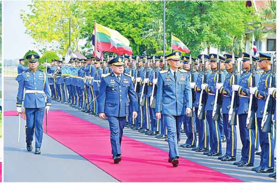
ကာကွယ်ရေးဦးစီးချုပ်(လေ) ဝိုလ်ချုပ်ကြီးထွန်းအောင် ဂုဏ်ပြုတပ်ဖွဲ့၏ အလေးပြုခြင်းကိုခံယူပြီး ဂုဏ်ပြုတပ်ဖွဲ့အား ဝမ်းဆေးစဉ်။