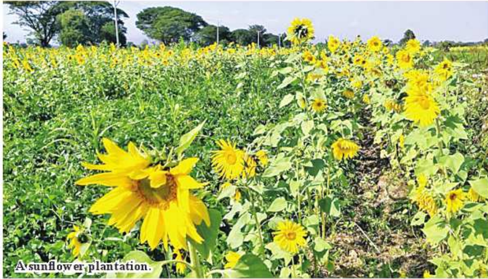
A sunflower plantation.

16,328 acres of sunflowers were initially planned for cultivation in Minkin Township, with all 16,335 acres sown between October and December 2023. Last year, during the same season, 16,328 acres were planted.