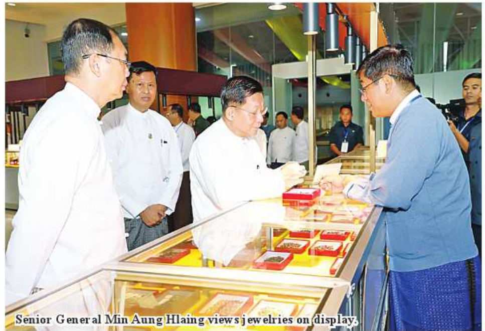
Senior General Min Aung Hlaing views jewelries on display.

fice of the Commander-in-Chief of Defence Services, the commander of the Nay Pyi Taw Command, departmental officials, responsible officials from Myanmar Gems Entrepreneurs Association, guests and local and foreign gems entrepreneurs. First, the Senior General and attendees watched the documentary video clip fea-