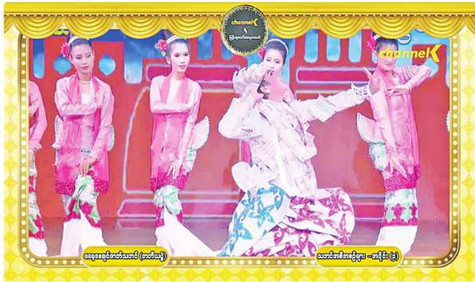
ဇာတ်သဘင်ပွဲတော်ကြီး (အင်္ဂါည)