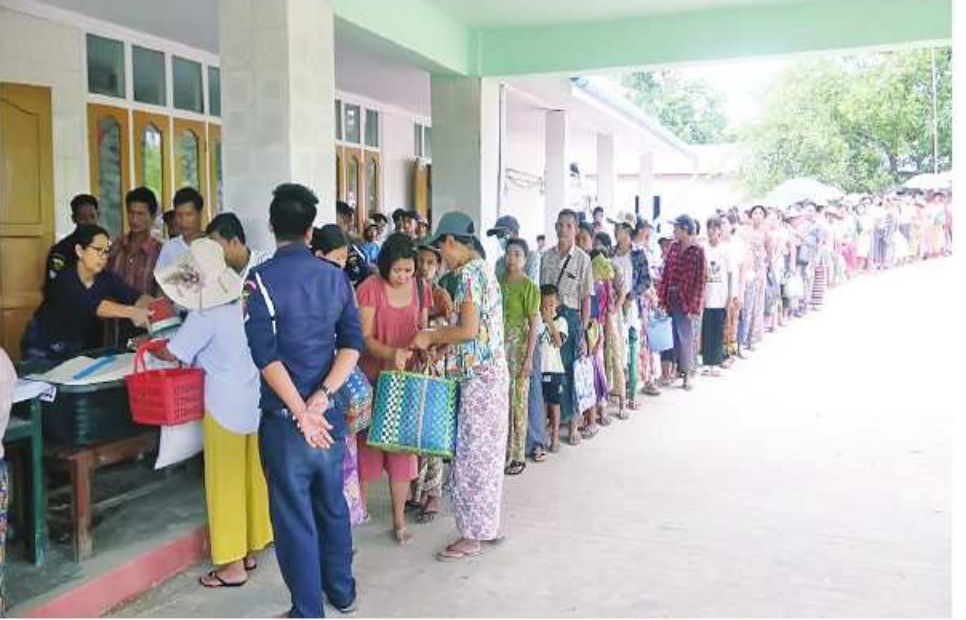
အမ်းမြို့နယ်အတွင်းရှိ ဒေသခံပြည်သူများ စားရေးအစာအပြတ်စေရန်အတွက် နိုင်ငံတော်စီမံအုပ်ချုပ်ရေးကောင်စီက စီစဉ်ဆောင်ရွက်ပေးသော အခြေခံစားကုန်ပစ္စည်းများရောက်ရှိပြီး သက်သာသောဈေးနှုန်းဖြင့် ရောင်းချပေးစဉ်။

နေပြည်တော် မေ ၃ ရခိုင်ပြည်နယ်အတွင်း AA အကြမ်းဖက် သောင်းကျန်းသူများက အကြမ်းဖက် လုပ်ရပ်များ လုပ်ဆောင်လျက်ရှိသည့် အပြင်ဆက်သွယ်ရေးလမ်းကြောင်းများကို နည်းမျိုးစုံဖြင့် ဖြတ်တောက်ပိတ်ဆို့ ခြင်းများ လုပ်ဆောင်လျက်ရှိသဖြင့် လုံခြုံရေးတပ်ဖွဲ့ဝင်များက အဆိုပါဒေသ တည်ငြိမ်အေးချမ်းရေးနှင့် လမ်းပန်း ဆက်သွယ်ရေး လုံခြုံချောမွေ့စေရေး တို့အတွက် ကြိုးပမ်းဆောင်ရွက်လျက်