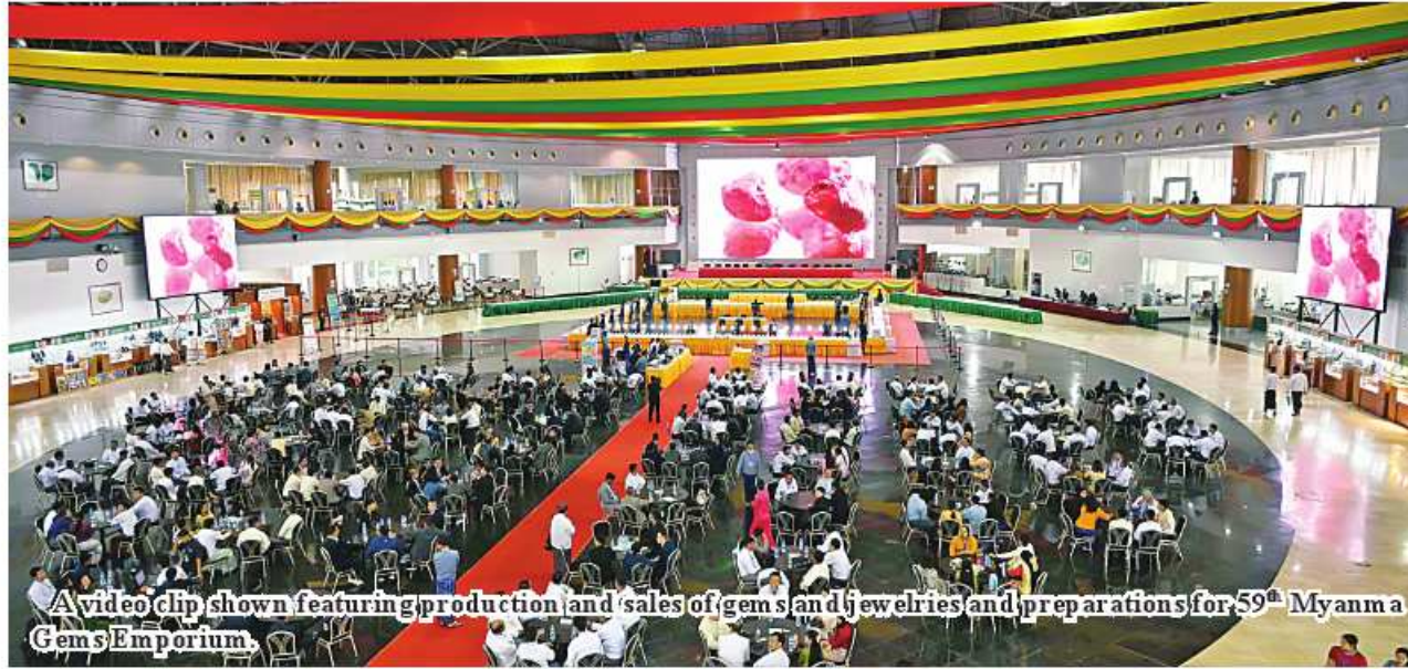
A video clip shown featuring production and sales of gems and jewelries and preparations for 59 th Myanmar Gems Emporium.

on reports of officials. Afterward, the Senior General and party viewed the sale booths of private finished gems and jewelries and inspected the raw jade lots displayed outside the hall. Myanmar Gems Emporiums have been held since 1964 with the aim of earning foreign exchange for the country and contributing to the economic interests of citizens. A total of 400 pearl lots, 160 gems lots and 4,550 jade lots will be sold to local and foreign gems required to make advance payments in US dollar or equivalent sums in Euro, Yuan and Baht. Local gems entrepreneurs can make advance payments in MMK. Advance payments for jade lots in group C, which are allowed for local entrepreneurs, can be made in MMK. Local and foreign entrepreneurs can make payments for jade lots in group A in US$ or equivalent sums in Euro, Thai Baht or Yuan. Payments for pearl, gems and jade lots in group B can