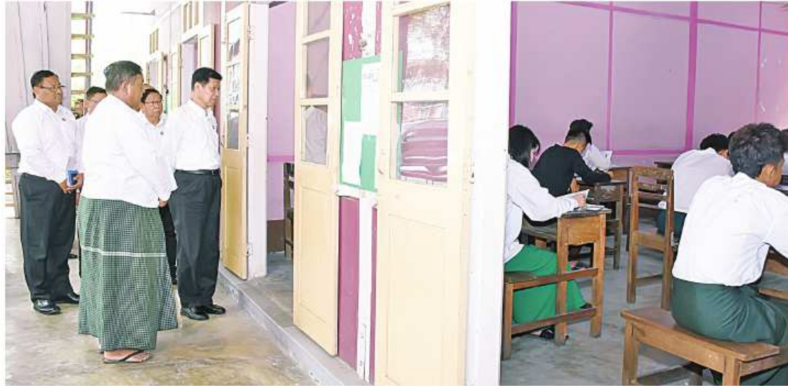
နေပြည်တော် မေ ၃

နိုင်ငံတော်အနေဖြင့် ပညာရေးကဏ္ဍကို အထူးအလေးထားဆောင်ရွက်ပေးလျက်ရှိပြီး ကျင်းပပြီးစီးခဲ့သည့် ၂၀၂၄ ခုနှစ် တက္ကသိုလ် ဝင်စာမေးပွဲတွင် ပြေဆိုရန်မှတ်ပုံတင်ထား ပြီးဖြစ်သော်လည်း လုံခြုံရေးအခြေအနေအရ တက္ကသိုလ်ဝင်စာမေးပွဲ ပြေဆိုခွင့်မရခဲ့ကြ သည့် ဒေသအချို့ရှိ ကျောင်းသား၊ ကျောင်းသူ များကို အထူးအစီအစဉ်တစ်ရပ်အနေဖြင့် သက်ဆိုင်ရာ တိုင်းဒေသကြီးနှင့် ပြည်နယ် အစိုးရများ၏ ပံ့ပိုးကူညီပေးမှုများနှင့်အတူ သတ်မှတ်ထားသည့် အခြေခံပညာကျောင်း များရှိ စာစစ်ဌာနများတွင် ဧပြီ ၂၉ ရက်မှ