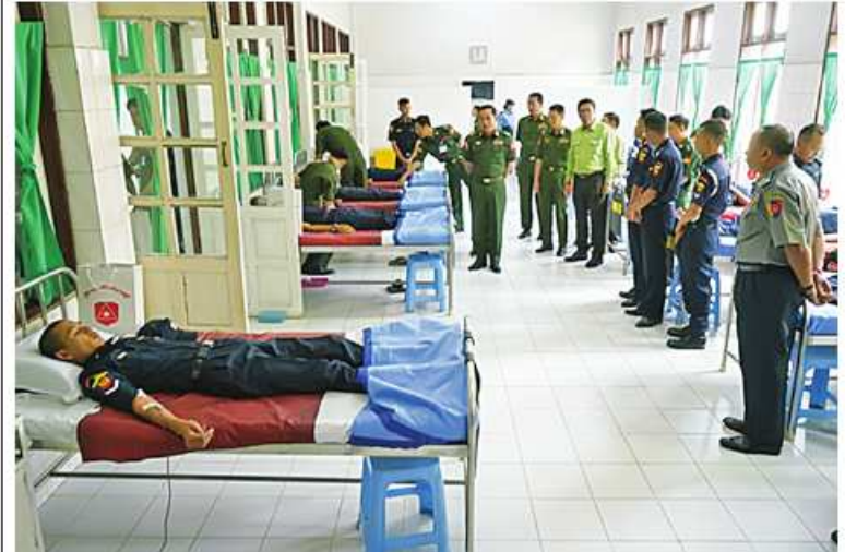
ကြိတ်ဒေသတိုင်းစစ်ဌာနချုပ် တိုင်းမှူး ဗိုလ်ချုပ်အောင်ခိုင်ဝင်း၊ မြန်မာနိုင်ငံမီးသတ် တပ်ဖွဲ့ဝင်များနှင့် မိသားစုဝင်များ စုပေါင်းသွေးလှူဒါန်းနေမှုကို ကြည့်ရှုအားပေးစဉ်။

သွားရောက်ကြည့်ရှုအားပေးကြသည်။ ဦးစွာ တိုင်းမှူးက သွေးလှူဒါန်းပွဲသို့ တက်ရောက်လာကြသည့် မီးသတ်တပ်ဖွဲ့ဝင် များကို ရင်းရင်းနှီးနှီးလိုက်လံနှုတ်ဆက်သည်။ ထို့နောက် တိုင်းမှူးက သွေးလှူဒါန်းနေသည့် မီးသတ်တပ်ဖွဲ့ဝင်များနှင့် မိသားစုဝင်များ ကို တစ်ဦးချင်းလိုက်လံကြည့်ရှုအားပေးပြီး အာဟာရပြည့် စားသောက်ဖွယ်ရာများနှင့် ဂုဏ်ပြုမှတ်တမ်းလွှာများ ပေးအပ်ရာ တာဝန်ရှိသူတစ်ဦးက လက်ခံရယူခဲ့ကြောင်း သတင်းရရှိသည်။