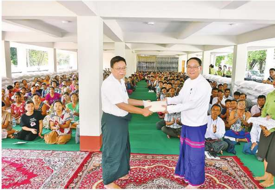
ကရင်ပြည်နယ်ဝန်ကြီးချုပ် ဦးစောမြင့်ဦး ယာယီပြောင်းရွှေ့နေထိုင်သူများအတွက် ဆန်ရိက္ခာများ ထောက်ပံ့ပေးအပ်စဉ်။