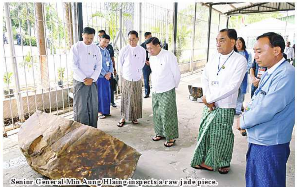
Senior General Min Aung Hlaing inspects a raw jade piece.