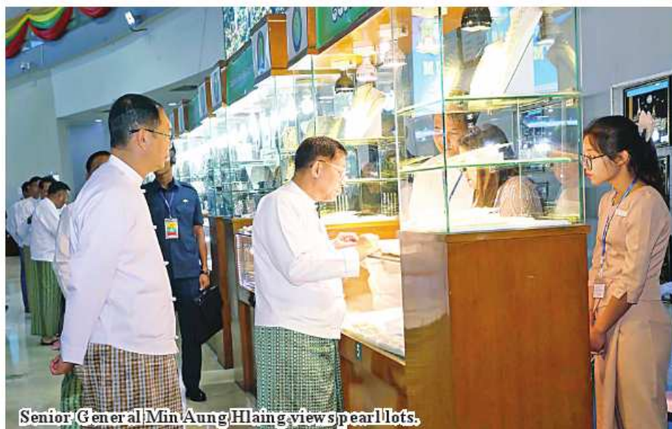
Senior General Min Aung Hlaing views pearl lots.

turing production and sales of Myanmar pearls, production of gems and jewelries and preparations for the 59 th Myanmar Gems Emporium (2024). Then, the Senior General and attendees inspected the jade, gems and pearl lots displayed for sales at the hall and the Senior General gave necessary instructions entrepreneurs in accordance with the rules and regulations through the open tender system. The floor prices of pearl, jade and gems lots in group A and B are set in US dollar while the floor prices of jade lots in group C are set in MMK. Foreign gems entrepreneurs who want to buy pearl, jade and gems be made in US$ or equivalent sums in Euro, Bhat and Yuan. As for local merchants, payments can be made in US$ or equivalent sums in MMK. Gems will be sold to local and foreign entrepreneurs in accordance with the rules and regulations of the open tender system. The emporium will last from 3 to 12 May. 100