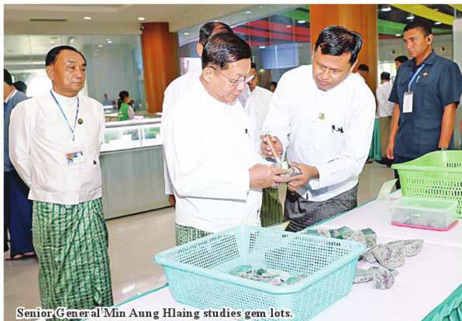
Senior General Min Aung Hlaing studies gem lots.

turing production and sales of Myanmar pearls, production of gems and jewelries and preparations for the 59 th Myanmar Gems Emporium (2024). Then, the Senior General and attendees inspected the jade, gems and pearl lots displayed for sales at the hall and the Senior General gave necessary instructions entrepreneurs in accordance with the rules and regulations through the open tender system. The floor prices of pearl, jade and gems lots in group A and B are set in US dollar while the floor prices of jade lots in group C are set in MMK. Foreign gems entrepreneurs who want to buy pearl, jade and gems be made in US$ or equivalent sums in Euro, Bhat and Yuan. As for local merchants, payments can be made in US$ or equivalent sums in MMK. Gems will be sold to local and foreign entrepreneurs in accordance with the rules and regulations of the open tender system. The emporium will last from 3 to 12 May. 100