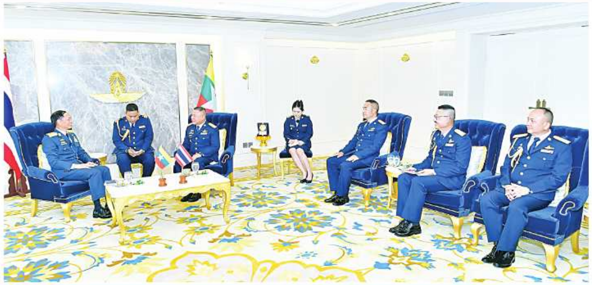
ကာကွယ်ရေးဦးစီးချုပ်(လေ) ဝိုလ်ချုပ်ကြီးထွန်းအောင် ဦးဆောင်သော ကိုယ်စားလှယ်အဖွဲ့နှင့် ထိုင်းဘုရင့်လေတပ်ဦးစီးချုပ် Air Chief Marshal Punpakdee Pattanakul တို့ တွေ့ဆုံဆွေးနွေးစဉ်။

မြန်မာနှင့် ထိုင်းလေတပ်နှစ်ရပ်အကြား ချစ်ကြည်ရင်းနှီးမှုနှင့် ပူးပေါင်းဆောင်ရွက်မှုများ ပိုမိုမြှင့်တင်နိုင်ရန်အတွက် ကာကွယ်ရေးဦးစီးချုပ်(လေ) ဝိုလ်ချုပ်ကြီးထွန်းအောင် ဦးဆောင်သော တပ်မတော်(လေ)ကိုယ်စားလှယ်အဖွဲ့သည် ထိုင်းဘုရင့်လေတပ်ဦးစီးချုပ် Air Chief Marshal Punpakdee Pattanakul ၏ ဖိတ်ကြားချက်အရ ဧပြီ ၃၀ ရက် ညပိုင်းတွင် ထိုင်းနိုင်ငံသို့ ချစ်ကြည်ရေးခရီးသွားရောက်ခဲ့ပြီး ထိုင်းဘုရင့်လေတပ်ဦးစီးချုပ် Air Chief Marshal Punpakdee Pattanakul နှင့် တွေ့ဆုံ၍ နှစ်နိုင်ငံလေတပ်အကြား ချစ်ကြည်ရင်းနှီးမှုနှင့် ပူးပေါင်းဆောင်ရွက်မှုများ ပိုမိုမြှင့်တင်နိုင်ရေးကိစ္စရပ်များနှင့် ပတ်သက်၍ တွေ့ဆုံဆွေးနွေးကြသည်။