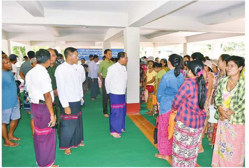
ကရင်ပြည်နယ်ဝန်ကြီးချုပ် ဦးစောမြင့်ဦး ယာယီပြောင်းရွှေ့နေထိုင်သူများကို ရင်းရင်းနှီးနှီးစုတ်ဆက် အားပေးစကားပြောကြားစဉ်။

ဘားအံ မေ ၃ ကရင်ပြည်နယ်အတွင်းရှိ မြို့နယ်အချို့တွင် အကြမ်းဖက်သောင်းကျန်းမှုများသည် ရပ်ကွက်၊ ကျေးရွာအုပ်စုများအတွင်း ဝင်ရောက်နေထိုင်၍ အကြမ်းဖက်လုပ်ငန်းများနှင့် တိုက်ပွဲများဖော်ဆောင်ခဲ့သည့် အတွက် ဒေသခံပြည်သူများသည် ဘားအံ၊ လှိုင်ဘွဲ့၊ မြိုင်ကြီးငူ၊ ကမမောင်းဒေသများသို့ ယာယီပြောင်းရွှေ့နေထိုင်ခဲ့ကြရာ ယနေ့ မွန်းလွဲ ၂ နာရီက အမျိုးသားသဘာဝဘေးအန္တရာယ်ဆိုင်ရာ စီမံခန့်ခွဲမှုကော်မတီက ထောက်ပံ့သည့် ဆန်ရိက္ခာများထောက်ပံ့ပေးအပ်သည့် အခမ်းအနားကို ဘားအံမြို့ကျောင်းထိုင်ဘုန်းကြီး သင်တန်းကျောင်း ဓမ္မာရုံ၌ ကျင်းပသည်။