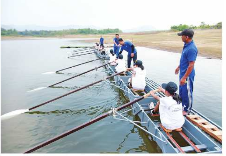
၂၀၂၄ ခုနှစ် ရေကြောင်းလူငယ်အခြေခံ နှင့် တန်းမြင့်သင်တန်းများကို သက်ဆိုင်ရာ မြို့နယ်အသီးသီး၌ လေ့ကျင့်သင်ကြား ပေးလျက်ရှိစဉ်။

ဌာနချုပ်ရှိ သင်တန်းသားများကို ကမ်းရိုး တန်းဒေသတိုင်းစစ်ဌာနချုပ် တိုင်းမှူး ဗိုလ်ချုပ်စိုးမင်းနှင့် တာဝန်ရှိသူများက သင်တန်းလေ့ကျင့် သင်ကြားနေမှုများကို သွားရောက်ကြည့်ရှုအားပေးပြီး ဂုဏ်ပြု ချီးမြှင့်ငွေများပေးအပ်ခဲ့ကြောင်း သတင်း ရရှိသည်။