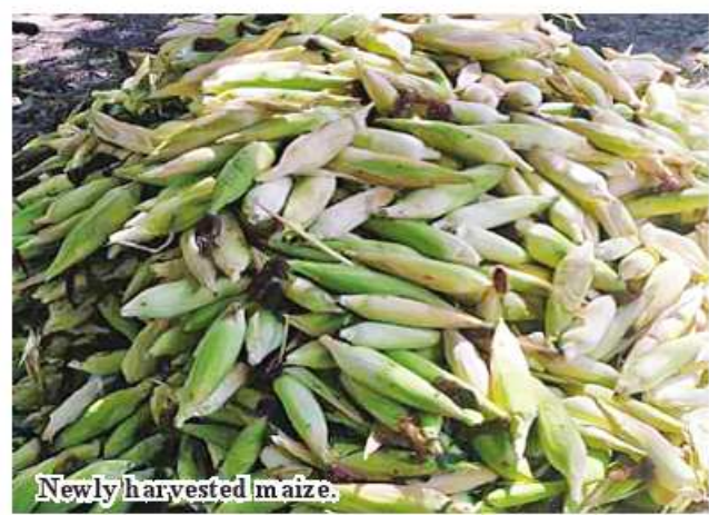
Newly harvested maize.

been harvested so far. Staff members of Township Agriculture Department educate local farmers to have knowledge about thriving crops and prevention of pesticide. Local farmers expand sown acreage of maize year after year due to grasping a good market," said U Ko Ko Aung, Head of Htigyaing Township Agriculture Department. The township earmarked 3,182 acres of maize and corns in 2023-24 financial year but local farmers have cultivated 3,860 acres exceeding the target.