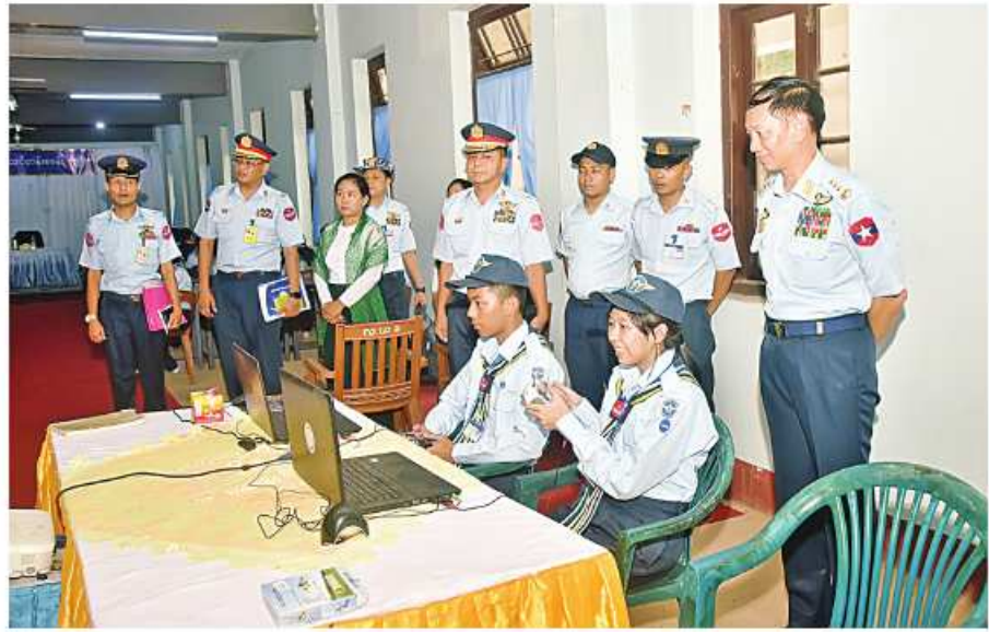
ကာကွယ်ရေးဦးစီးချုပ်(လေ) ဝိုလ်ချုပ်ကြီးထွန်းအောင် သင်တန်းသားများအား သင်ခန်းစာ လေ့ကျင့်သင်ကြားပို့ချနေမှုကို လိုက်လံကြည့်ရှုစစ်ဆေးစဉ်။

ပြင်ဆင်ရေးဌာနချုပ်တွင် ဖွင့်လှစ်ပို့ချလျက်ရှိသည့် အခြေခံလေကြောင်းလူငယ် သင်တန်းအမှတ်စဉ်(၁/၂၀၂၄)(ရန်ကုန် သင်တန်းစခန်း)နှင့် မှော်ဘီလေတပ်စခန်း တွင် ဖွင့်လှစ်ပို့ချလျက်ရှိသည့် တန်းမြှင့်လေကြောင်းလူငယ်သင်တန်း အမှတ်စဉ် (၁/၂၀၂၄)(မြန်မာပြည်တောင်ပိုင်းသင်တန်းစခန်း)များသို့ သွားရောက်ခဲ့ပြီး သင်တန်းသားများနှင့် တွေ့ဆုံအားပေး စကားပြောကြားခဲ့သည်။ ထို့နောက် သင်တန်းသားများသင်ခန်းစာပို့ချနေမှုများကို လိုက်လံကြည့်ရှုစစ်ဆေးခဲ့ပြီး ရင်းရင်းနှီးနှီးတွေ့ဆုံနှုတ်ဆက်ခဲ့ကြောင်း သတင်းရရှိသည်။