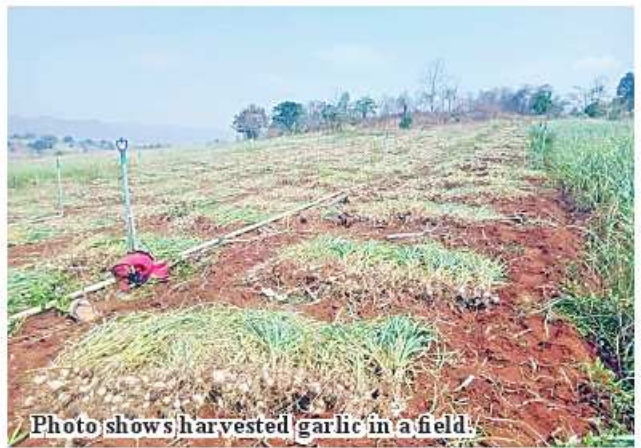
Photo shows harvested garlic in a field.

department is providing awareness programs for GAP crop cultivation to ensure better quality, higher prices, and access to both domestic and foreign markets. Farmers adopting the GAP system are expected to improve their socio-economic status.