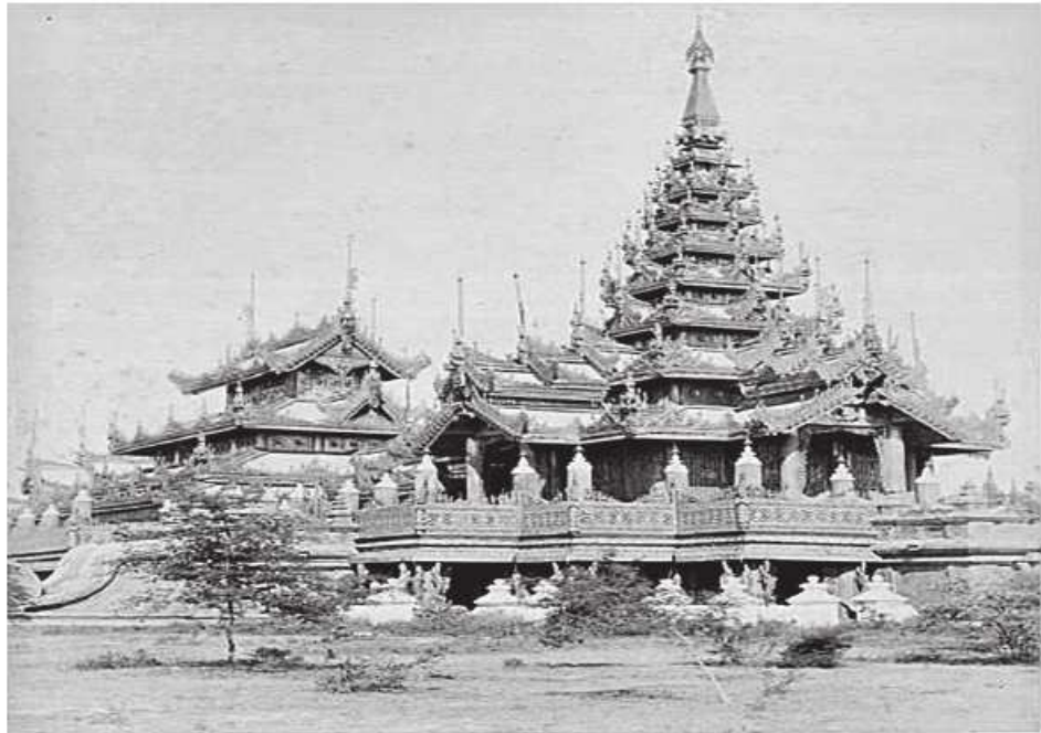
ဓာတ်ပုံဆရာ Felice Beato ရိုက်ကူးခဲ့သည့် မဟာစံလွတ်ဝေယန်အရှေ့မှန်ကျောင်း။

ကျောင်းတော်ကြီး ဆောက်လုပ်ပြီးစီးချိန်တွင် အကြီးအကြပ် များမတ်တော်များက မိဖုရားခေါင်ကြီးထံမှ အမိန့်တော်မြတ် ခံယူခဲ့သည်။ ထို့ကြောင့် မိဖုရားခေါင်ကြီးသည် ကျောင်းတော်ကြီးကို ရေစက်ချလှူဒါန်းရန် ရွှေနန်းတော်မှ ရွှေမြို့တော် အရွေ့မျက်နှာရှိ ဦးထိပ်တံတားအပြင် ကျုံးနဖူးသို့ ကြည်းကြောင်းဖြင့်