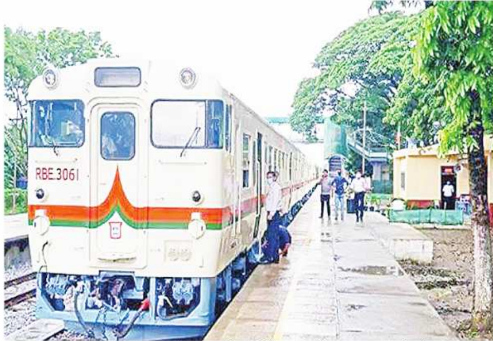
ရန်ကုန် ဧပြီ ၃၀

သင်္ကြန်မြို့ကာလတွင် ရန်ကုန် မြို့ပတ်ရထားခရီးစဉ်၌ RBE ရထား တွဲဆိုင်းခြောက်ဆိုင်းဖြင့် တစ်ရက် လျှင် ခရီးသည်ဦးရေ ၉၀၀၀ကျော် သယ်ယူပို့ဆောင်ပေးနေကြောင်း မြန်မာ့မီးရထား သတင်းများအရ သိရသည်။ ပို့ဆောင်ရေးနှင့်ဆက်သွယ်ရေး ဝန်ကြီးဌာန မြန်မာ့မီးရထားသည် သင်္ကြန်ပတ်ရထားကာလတွင် ရန်ကုန် မြို့ပတ်ရထားခရီးစဉ်များကို ယာယီ