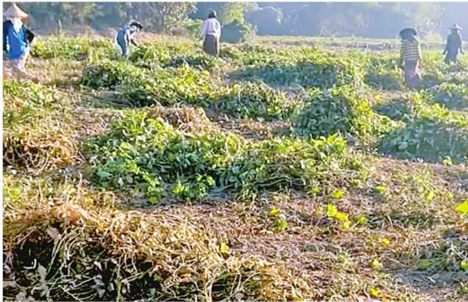
ရွှေဘို ဧပြီ ၃၀

စစ်ကိုင်းတိုင်းဒေသကြီး ရွှေဘိုခရိုင်တွင် ဆောင်းသီးနှံစိုက်ပျိုးရာသီက စိုက်ပျိုးထားသော မတ်ပဲ ၁၄၉၁၉ ဧက ရိတ်သိမ်းပြီးစီးပြီဖြစ်ကြောင်း ရွှေဘိုခရိုင်စိုက်ပျိုးရေးဦးစီးဌာနမှ သိရသည်။