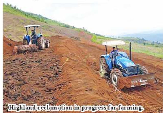
Highland reclamation in progress for farming.

reclamation project office, relevant township farmland management and statistics department, agriculture department and irrigation and water utilization management department. 336