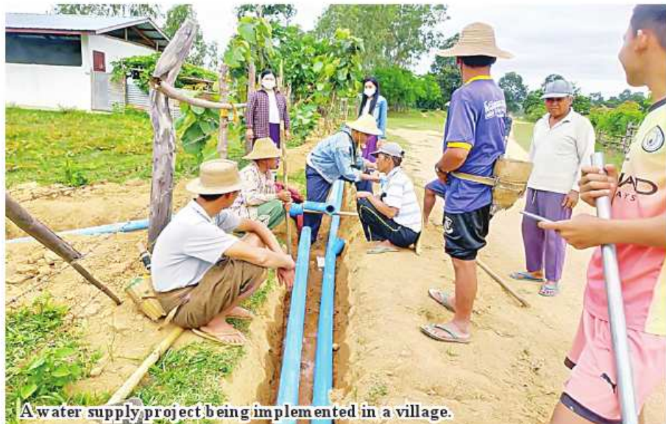
A water supply project being implemented in a village.

Nay Pyi Taw April 30 The Department of Rural Development stated that more than 500 villages which may face shortages of water will be supplied drinking water in 2024-25 financial year. The department is im-