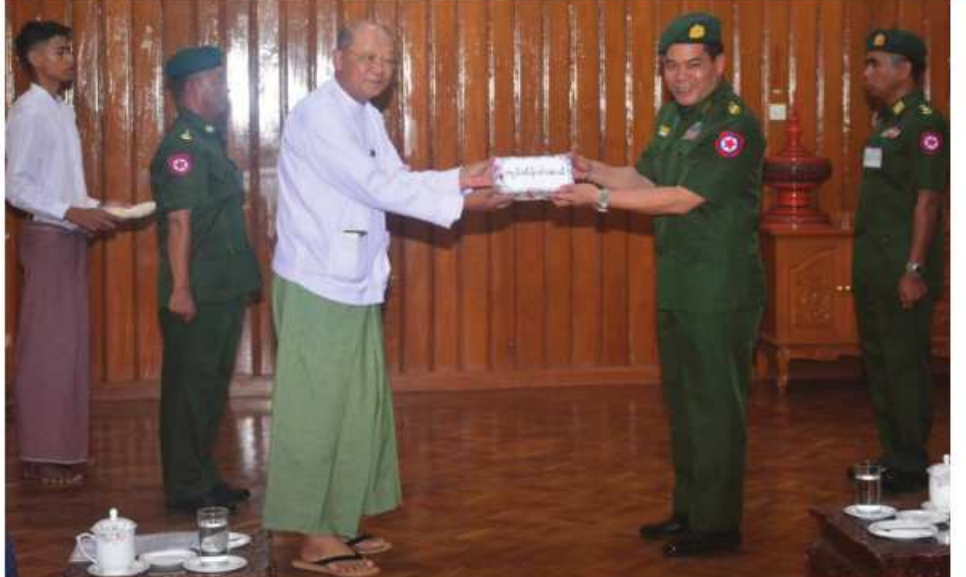
တိုင်းရင်းသားလူမျိုးရေးရာဝန်ကြီးဌာန ပြည်ထောင်စုဝန်ကြီး Jeng Phang နေပြည်တော် လုံခြုံရေးတပ်ဖွဲ့ဝင်များအတွက် ဂုဏ်ပြုချီးမြှင့်ငွေများကို နေပြည်တော်တိုင်းစစ်ဌာနချုပ် တိုင်းမှူး ဗိုလ်ချုပ်စောသန်းလှိုင်ထံ ဂုဏ်ပြုပေးအပ်စဉ်။

နေပြည်တော် ဧပြီ ၃၀ နိုင်ငံတော်ကာကွယ်ရေးနှင့် လုံခြုံရေး တာဝန်များကို စွမ်းစွမ်းတမံ ထမ်းဆောင် လျက်ရှိသော လုံခြုံရေးတပ်ဖွဲ့ဝင်များ အတွက် စေတနာရှင် အလှူရှင်များ က ဂုဏ်ပြုချီးမြှင့်ငွေများ ပေးအပ်လျက် ရှိသည်။