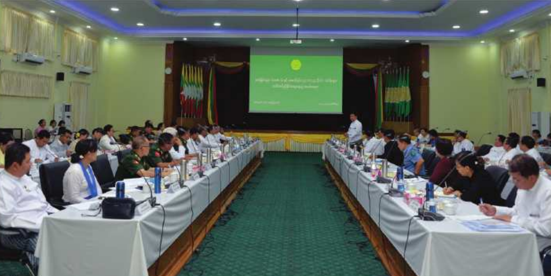
နေပြည်တော် ဧပြီ ၃၀ ညှိနှိုင်းဆွေးနွေးပွဲကို ယနေ့နံနက် ၁၀ နာရီ ကျင်းပရာ ဆက်စပ်ဝန်ကြီးဌာနများမှ အခြေခံပညာ Grade-12 နှင့် အဆင့်မြင့် တွင် နေပြည်တော် ပညာရေးဝန်ကြီးဌာန ပြည်ထောင်စုဝန်ကြီးများ၊ ဒုတိယဝန်ကြီး ပညာ(တက္ကသိုလ်)သင်ရိုးများ ပေါင်းစပ် ရုံးအမှတ်(၁၃) အစည်းအဝေးခန်းမ၌ များ၊ အမြဲတမ်းအတွင်းဝန်များ၊ ညွှန်ကြား

ရေးမှူးချုပ်များ၊ ပါမောက္ခချုပ်များ၊ ဒုတိယ ညွှန်ကြားရေးမှူးချုပ်များ၊ ဖိတ်ကြားထားသူ များနှင့် သက်ဆိုင်ရာ တာဝန်ရှိသူများ တက်ရောက်ကြသည်။ ဦးစွာ ပြည်ထောင်စုဝန်ကြီး ဒေါက်တာ ညွန့်ဖေက ၂၀၂၄ ခုနှစ်တွင် Grade 12 အောင်မြင်ခဲ့သော ကျောင်းသား၊ ကျောင်းသူ များ တက္ကသိုလ်တွင် အဆင့်မြင့်ပညာသင်ယူ ရာတွင် Grade 12 ထိ သင်ယူခဲ့သော သင်ရိုးညွှန်းတမ်းများအပေါ် အခြေခံပြီး တက္ကသိုလ်သင်ရိုးညွှန်းတမ်းများကို ချိတ်ဆက် သင်ကြားပေးနိုင်ရေးအတွက် ဆွေးနွေး အကြံပြုကြစေလိုပါကြောင်း၊ Grade 12 သင်ရိုးညွှန်းတမ်းနှင့်ချိတ်ဆက်၍ နိုင်ငံတကာ အဆင့်မီ သင်ရိုးညွှန်းတမ်းများဖြင့် ကျောင်းသား၊ ကျောင်းသူများ တတ်မြောက် အောင်သင်ကြားပေးနိုင်ရေးအတွက် အကြံပြု ဆွေးနွေးကြစေလိုပါကြောင်း၊ သဘာဝတူညီ သော တက္ကသိုလ်များအနေဖြင့် သင်ရိုး ညွှန်းတမ်းနှင့် ဘွဲ့သင်တန်းကာလသတ်မှတ် မှုတွင် ညှိနှိုင်းဆောင်ရွက်ကြစေလိုပါကြောင်း၊ သက်ဆိုင်ရာဝန်ကြီးဌာနများက ဘာသာရပ် ပါမောက္ခများ၊ တက္ကသိုလ်ပါမောက္ခချုပ်များ ၏ ဆွေးနွေးဆုံးဖြတ်ချက်များကို စုစည်း ကာ သက်ဆိုင်ရာကော်မတီသို့ တင်ပြ ပေးကြစေလိုပါကြောင်း၊ တက္ကသိုလ်များမှ အရည်အချင်းရှိသော ပညာတတ်များ မွေးထုတ်ပေးရန် ဝိုင်းဝန်းပူးပေါင်းဆောင် ရွက်ကြစေလိုပါကြောင်းဖြင့် ပြောကြား ခဲ့သည်။ ဆက်လက်၍ ဆွေးနွေးပွဲသို့တက်ရောက် လာကြသော ဆက်စပ်ဝန်ကြီးဌာနများမှ ပြည်ထောင်စုဝန်ကြီးများ၊ ဒုတိယဝန်ကြီး များနှင့် တာဝန်ရှိသူများက ဝိုင်းဝန်း ဆွေးနွေး အကြံပြုခဲ့ကြကြောင်း သတင်း ရရှိသည်။ (သတင်းစဉ်)