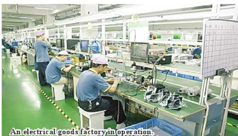
An electrical goods factory in operation.