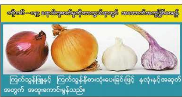
ကြက်သွန်ဖြူနှင့် ကြက်သွန်နီတို့အသုံးပြုနိုင်ပြီး နှလုံးနှင့်အဆုတ်အတွက် အထူးကောင်းမွန်သည်။

ကိန်းလုပ်ငန်းအဖွဲ့ဝင်များက စိုက်ပျိုးရေးလုပ်ငန်းလုပ်ကိုင်သူ ငါးဦးကို ငွေကျပ် ၂ ဒသမ ၁ သန်း၊ မွေးမြူရေးလုပ်ငန်းလုပ်ကိုင်သူ ၈၂ ဦးကို ငွေကျပ် ၃၃ ဒသမ ၂၅ သန်း၊ အရောင်းအဝယ်လုပ်ငန်းလုပ်ကိုင်သူ ကိုးဦးကို ငွေကျပ် ၃ ဒသမ ၈ သန်း စုစုပေါင်း အသင်းသား၊ အသင်းသူ ၉၆ ဦးကို ငွေကျပ် ၃၉ ဒသမ ၁၅ သန်း ထုတ်ချေးပေးခဲ့ကြောင်း သိရသည်။ ဟိန်းထက်စိုး(မလိုင်)