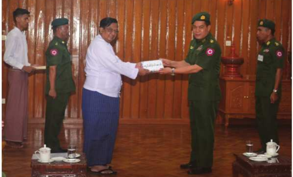
စက်မှုဝန်ကြီးဌာန ပြည်ထောင်စုဝန်ကြီး ဒေါက်တာချာလီသန်း လုံခြုံရေးတပ်ဖွဲ့ဝင်များအတွက် ဂုဏ်ပြုချီးမြှင့်ငွေများကို နေပြည်တော်တိုင်းစစ်ဌာနချုပ် တိုင်းမှူး ဗိုလ်ချုပ်စောသန်းလှိုင်ထံ ဂုဏ်ပြု ပေးအပ်စဉ်။