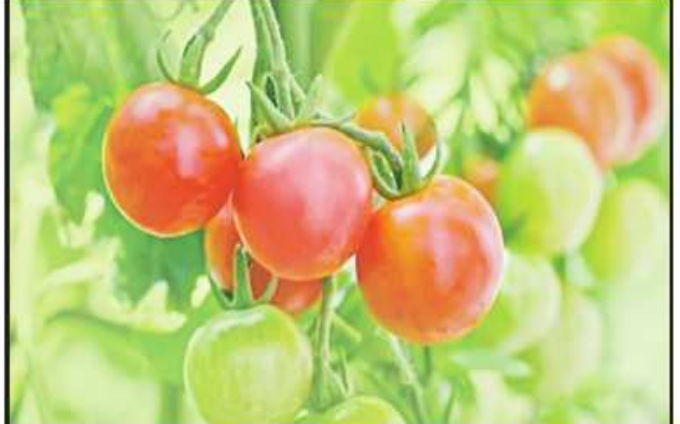
ခရမ်းချဉ်သီး

ဆောင်းအကုန် နွေအကူးမှာ ပေါ်တဲ့ရာသီစာ စတော်ဘယ်ရီသီးက ချိုချိုချဉ်ချဉ်အရသာရှိတာကြောင့် ပူတဲ့ရာသီဥတုနဲ့ကိုက်ညီတဲ့ အသီး ဖြစ်ပါတယ်။ စတော်ဘယ်ရီသီးမှာပါတဲ့ ရေဓာတ်က ခန္ဓာကိုယ်အပူချိန် ကိုလျှော့ချပေးနိုင်တဲ့အပြင် သူ့မှာပါတဲ့ ဖလာဗိုလ်နိုက်ဓာတ်က အရေပြားအတွင်း သွေးစီးဆင်းမှုကို ကောင်းမွန်စေပြီး ဝိတာမင်စီ လည်း ကြွယ်ဝစွာပါတဲ့အသီးဖြစ်တဲ့အတွက် စတော်ဘယ်ရီသီးကို လတ်ဆတ်တဲ့ အသီးဖျော်ရည်၊ လတ်ဆတ်တဲ့အသီး၊ အသုပ်အနေနဲ့ စားသုံးကြပါတယ်။