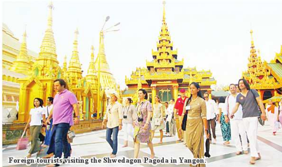
Foreign tourists visiting the Shwedagon Pagoda in Yangon.