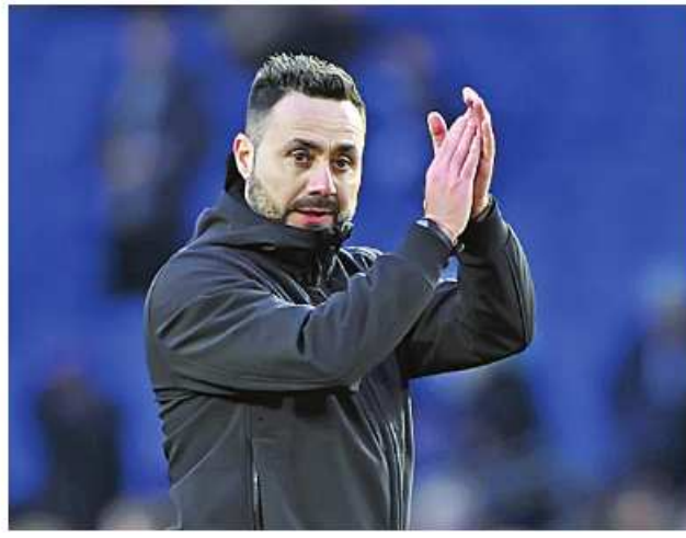
Ref : Xinhua Trs : ML

လန်ဒန် ဧပြီ ၂၁ အက်ဖ်အေပလား ဆီမီးပိုင်နယ် ပွဲစဉ်အဖြစ် ကစားခဲ့သည့် မန်စီးတီး အသင်းနှင့် ချဲလ်ဆီးအသင်းတို့ ပွဲစဉ်၌ မန်စီးတီးအသင်းက တစ်ဂိုး ရိုးမရှိဖြင့် အနိုင်ရခဲ့သောကြောင့် ပိုလ်လုပွဲ တက်ရောက်နိုင်ခဲ့ကြောင်း သိရသည်။