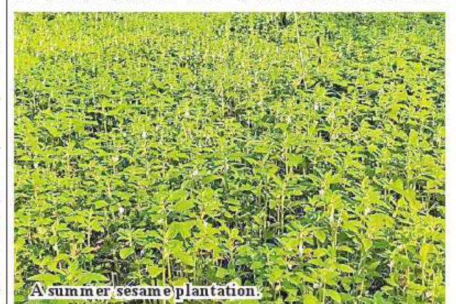
A summer sesame plantation.

Shwebo April 21 According to Shwebo Township Agriculture Department, a total of 1,576 acres of croplands were placed under summer sesame in Shwebo Township of Sagaing Region this year. Local farmers have so far cultivated 1,576 acres of summer sesame against the target of 18121 acres earmarked in Shwebo Township in 2023-24 financial year. "The township earmarked more than 18,000 acres of summer sesame. All are trying hard to meet