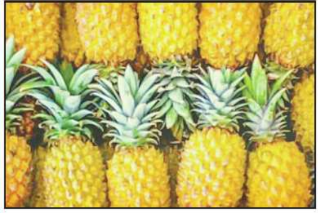
နာနတ်သီး

နွေရာသီရောက်တာနဲ့ လှိုင်လှိုင်ပေါ်တဲ့ ဖရဲသီးဟာ နွေရာသီမှာ အစားကြဆုံးအသီးလို့တောင် ဆိုနိုင်ပါတယ်။ သူ့မှာ ရေဓာတ်အပြည့်အဝ ပါဝင်တဲ့အပြင် ချိုအေးနေတဲ့သူ့အရသာက အပူဒဏ်ကြောင့် ပင်ပန်းနွမ်း နယ်မှုကို စားလိုက်တာနဲ့ ပြေပျောက်စေပါတယ်။ ဖရဲသီးဟာ နွေရာသီမှာ အစားသင့်ဆုံးအသီးဖြစ်ရတာဟာ ဖရဲသီးမှာ ရေဓာတ် ၉၂ ရာခိုင်နှုန်း ပါတဲ့အတွက်ကြောင့်ဖြစ်ပြီး အဲဒီလိုရေဓာတ်ကြွယ်ဝတာဟာ ခန္ဓာကိုယ် အတွက် လိုအပ်တဲ့ရေဓာတ်ကို ပြန်ဖြည့်ဆည်းပေးနိုင်တဲ့အပြင် စားသုံး လိုက်တာနဲ့ ခန္ဓာကိုယ်ကို အေးမြသွားစေပါတယ်။ ဒါ့ပြင် ဖရဲသီးမှာ ဝိတာမင်၊ သတ္တုဓာတ်၊ ကယ်လ်စီယမ်၊ အမျှင်ဓာတ်တွေမြင့်မားကြွယ်ဝ စွာပါဝင်တာကြောင့် အရိုးနဲ့နုလုံးသွေးကြောကျန်းမာရေးအတွက်လည်း ကောင်းမွန်တဲ့အတွက် နွေအခါမှာ စားသုံးပေးသင့်တဲ့ အသီးဖြစ်နေရ ခြင်းဖြစ်ပါတယ်။