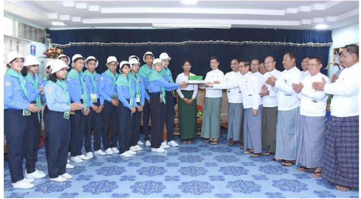
နှင့် အဖွဲ့သည် ကျောင်းပြည်နယ်နှင့် မန္တလေးတိုင်းဒေသကြီးအတွင်းမှ ရောက်ရှိနေသည့် လူရည်ချွန် ကျောင်းသား၊ ကျောင်းသူများကို ရင်းရင်းနှီးနှီးလိုက်လံနှုတ်ဆက်ပြီး ထောက်ပံ့ပေးအပ်ချီးမြှင့်ခဲ့ကြောင်းနှင့် လူရည်ချွန် ကျောင်းသား၊ ကျောင်းသူများကို နေရာချထားပေးသည့် အိမ်ဆောင်များအား လိုက်လံကြည့်ရှုစစ်ဆေးခဲ့ကြောင်း သတင်းရရှိသည်။ မျိုးကျော်

ဒေသကြီးအတွင်းမှ လူရည်ချွန်ကျောင်းသား၊ ကျောင်းသူများ ရောက်ရှိနေမှု၊ ဆက်လက်ရောက်ရှိလာမည့်အခြေအနေ၊ အိမ်ဆောင်များအတွင်း နေရာထိုင်ခင်းချထားပေးမှု၊ ကျန်းမာရေးကိစ္စများအပါအဝင် နေထိုင်စားသောက်ရေးအတွက် စီစဉ်ဆောင်ရွက်ထားရှိမှု အခြေအနေများနှင့်ပတ်သက်၍ ရင်းရင်းတင်ပြရာ တိုင်းဒေသကြီးဝန်ကြီးချုပ်က လူရည်ချွန်စုရပ်စခန်း၌ တည်းခိုနေထိုင်စဉ်အတွင်း လူရည်ချွန်ကျောင်းသား၊ ကျောင်းသူများ၏ အစားအသောက်အပါအဝင် ကျန်းမာရေးဆိုင်ရာကိစ္စရပ်များနှင့် သောက်သုံးရေလုံလောက်မှုရှိစေရေးတို့ကို အထူးအလေးထားဂရုစိုက်ဆောင်ရွက်ကြရန် တာဝန်ရှိသူများကို မှာကြားပြီး လိုအပ်သည်များကို ဖြည့်ဆည်းဆောင်ရွက်ပေးသည်။ ယင်းနောက် တိုင်းဒေသကြီးဝန်ကြီးချုပ်