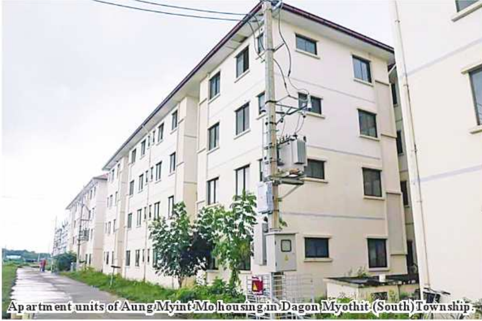
Apartment units of Aung Myint Moh housing in Dagon Myothit (South) Township.

Yangon April 21 Infrastructure Development (South) Township, is developed by Department of Urban and Housing Development under the Ministry of Construction. The housing project, located in Dagon Myothit