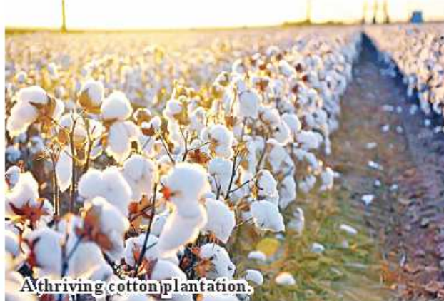
A thriving cotton plantation.