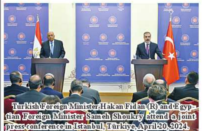
Turkish Foreign Minister Hakan Fidan (R) and Egyptian Foreign Minister Sameh Shoukry attend a joint press conference in Istanbul, Türkiye, April 20, 2024.