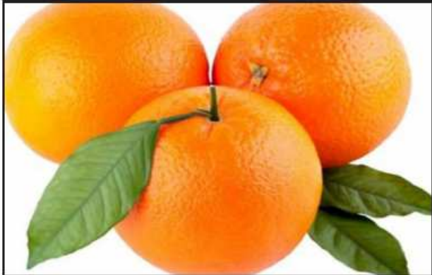
လိမ္မော်သီး

သရက်သီးဟာ နွေအခါမှာ သဘာဝအတိုင်းပဲဖြစ်ဖြစ် အအေးခံပြီးပဲ ဖြစ်ဖြစ် စားသုံးရင် အရသာအင်မတန်ရှိတဲ့ အသီးတွေထဲကတစ်ခုဖြစ်ပါ တယ်။ သရက်သီးမှာ ဝိတာမင်အေ၊ ဝိတာမင်စီ၊ ဝိတာမင်အီ၊ ကယ်လ်စီယမ်၊ ပိုတက်စီယမ်နဲ့ သံဓာတ်တို့ ကြွယ်ဝစွာပါဝင်တာကြောင့် နွေရာသီမှာ စားသုံးသင့်တဲ့ အကောင်းဆုံးအသီးဖြစ်တဲ့အပြင် အသီးမှာ သရက်လို့ ဆိုကြတဲ့အတွက် မြန်မာလူမျိုးများအကြိုက်ဆုံးသစ်သီးလို့လည်းဆိုနိုင်ပါ တယ်။ သရက်သီးဟာ ကိုယ်ခံအားစနစ်ကို မြှင့်တင်ပေးနိုင်တဲ့အတွက် ဖျားနာခြင်းမှ ကာကွယ်ရာမှာလည်း လူသိများတဲ့အပြင် သရက်သီးမှာ ပါဝင်တဲ့သကြားဓာတ်ကြောင့် အရသာက ချိုမွှေးနေပေမယ့် ကိုလက် စထရောနဲ့ သွေးတွင်းသကြားဓာတ်ပမာဏကို သဘာဝအတိုင်း ထိန်းညှိ ပေးနိုင်တာကြောင့် စားသုံးပေးသင့်ပါတယ်။ ဒါပေမဲ့လဲ တန်ဆေး လွန်ဘေးဖြစ်တတ်တာကြောင့် အလွန်အကျွံစားသုံးမိဖို့တော့ သတိပြု ရပါမယ်။