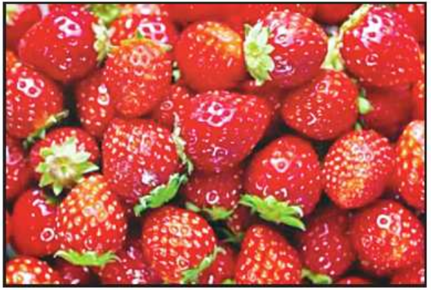
စတော်ဘယ်ရီသီး

ရက်စံဘယ်ရီသီး ရက်စံဘယ်ရီသီးဟာ နွေရာသီမှာ စားသုံးသင့်တဲ့ အကောင်းဆုံး အသီးတွေထဲကတစ်ခုဖြစ်ပြီး သူ့မှာ ရေဓာတ်ကြွယ်ဝစွာပါတဲ့အပြင် ချိုမြတဲ့အရသာက စားသုံးသူကို စိတ်ကျေနပ်မှုရစေမှာဖြစ်ပါတယ်။ ရက်စံဘယ်ရီသီးမှာ ဝိတာမင်စီကြွယ်ဝစွာပါဝင်တာကြောင့် အသားအရေ ကို နေလောင်ဒဏ်ကနေ ကာကွယ်ပေးတဲ့အပြင် အသားအရေကိုလည်း နုပျိုလှပစေနိုင်ကာ သူ့မှာပါတဲ့ အမျှင်ဓာတ်က အူလမ်းကြောင်းကို ကောင်းမွန်စေတာကြောင့် ကျန်းမာရေးကို အထောက်အကူဖြစ်စေတဲ့ အသီးဖြစ်လို့ စားသုံးပေးသင့်ပါတယ်။