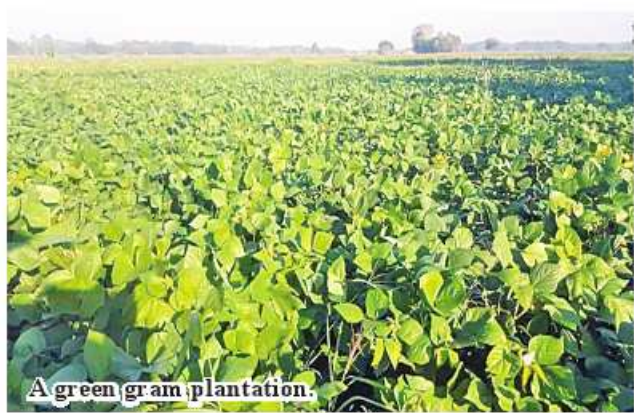
A green gram plantation.

Kanbalu April 21 The statistics of Kanbalu Township Agriculture Department stated that a total of 6,562 acres of croplands have been placed under pre-monsoon green gram in Kanbalu Township of Sagaing Region. Local growers have planted 6,562 acres of pre-monsoon green gram against the target of 6,594 acres in the township in 2023-24 financial year. "Officials from relevant departments and local farmers are making efforts for