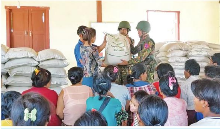
အနောက်ပိုင်းတိုင်းစစ်ဌာနချုပ်မှ တာဝန်ရှိသူများက ကျေးရွာအုပ်စုမှ အိမ်ထောင်စု ၃၀၇ခုအတွက် ဆန်၊ ဆီနှင့် စားသောက်ဖွယ်ရာများ ထောက်ပံ့ပေးအပ်စဉ်။

နေပြည်တော် ဧပြီ ၂၀ ရခိုင်ပြည်နယ် အမ်းမြို့နယ် အမ်း-ပဒါန်းလမ်းကြောင်းပေါ်ရှိ တောင်တော်ကျေးရွာအပါအဝင် ပတ်ဝန်းကျင်ကျေးရွာများမှ ဒေသခံပြည်သူများနှင့် ယာယီနေရပ်စွန့်ခွာသူ ဒေသခံပြည်သူ ၅၈ ဦးတို့ကို ယနေ့တွင် အနောက်ပိုင်းတိုင်းစစ်ဌာနချုပ် နယ်မြေခံဆေးကုသရေးအဖွဲ့က အဆိုပါ ကျေးရွာ၌ လိုအပ်သည့် ကျန်းမာရေးစောင့်ရှောက်မှုလုပ်ငန်းများ ဆောင်ရွက်ပေးသည်။ ထိုသို့ဆောင်ရွက်ပေးနေမှုများကို တိုင်းစစ်ဌာနချုပ်မှ တာဝန်ရှိသူများက သွားရောက်ကြည့်ရှုအားပေးပြီး အမ်း-ပဒါန်းလမ်းကြောင်းပေါ်ရှိ ကျေးရွာ ခုနစ်ရွာမှ အိမ်ထောင်စု ၃၀၇ စုတို့အတွက် ဆန်၊ ဆီနှင့် စားသောက်ဖွယ်ရာများ ထောက်ပံ့ပေးအပ်သည်။ အလားတူ မန္တလေးတိုင်းဒေသကြီး ပြည်ကြီးတံခွန်မြို့နယ် ချမ်းမြသာယာရပ်ကွက် မိုးကုတ်ဝိပဿနာမင်္ဂလာရိပ်သာ ရှိ သံဃာတော် ၃၆ ပါး၊ သာသနာ့နယ်ဝင် သီလရင် ၅၇ ပါးနှင့် ဒေသခံပြည်သူ ၂၇ ဦးတို့ကို ယနေ့နံနက်ပိုင်းတွင် အလယ်ပိုင်းတိုင်းစစ်ဌာနချုပ် နယ်မြေခံဆေးကုသရေးအဖွဲ့က အဆိုပါရိပ်သာ၌ သွေးတိုးရောဂါ၊ ဆီးချိုရောဂါ၊ အသက်ရှူလမ်းကြောင်းဆိုင်ရာရောဂါ၊ မျက်စိရောဂါ၊ သွားနှင့်ခံတွင်းရောဂါ၊ ခွဲစိတ်ကုသမှုဆိုင်ရာရောဂါ၊ အထွေထွေရောဂါတို့နှင့် ပတ်သက်၍ လိုအပ်သည့် ကျန်းမာရေးစစ်ဆေးကုသပေးခြင်း၊ ECG၊ Ultrasound စက်များဖြင့် ရောဂါရှာဖွေ စစ်ဆေးပေးခြင်း၊ ဆီးချိုသွေးချိုစစ်ဆေးပေးခြင်း၊ သွေးအုပ်စုခွဲခြားပေးခြင်းနှင့် ကျန်းမာရေးအသိပညာပေးဟောပြောဆွေးနွေးခြင်းများ ဆောင်ရွက်ပေးပြီး ဆေးရုံတက်ရောက်ကုသရန် လိုအပ်သူများကို နယ်မြေခံဆေးကုသရေးအဖွဲ့မှ တက်ရောက်ကုသနိုင်ရေးစီစဉ်ဆောင်ရွက်ပေးခဲ့ကြောင်း သတင်းရရှိသည်။