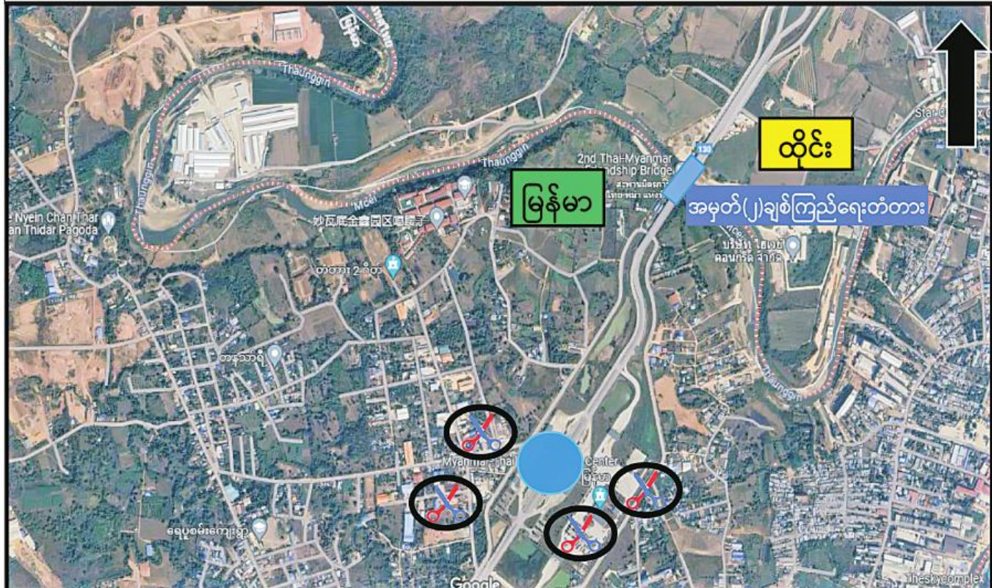
GNU အဖွဲ့မှ အကြမ်းဖက်မှုကိုလိုလားသူများ၊ KKO(ခွဲထွက်)အဖွဲ့နှင့် PDF အမည်ခံအကြမ်းဖက်သမားပူးပေါင်းအဖွဲ့တို့က ထိုင်း-မြန်မာ အမှတ်(၂)ချစ်ကြည်ရေးတံတားအနီး လုံခြုံရေးဆောင်ရွက်လျက်ရှိသည့်တပ်ဖွဲ့ဝင်များကို လာရောက်ပစ်ခတ်တိုက်ခိုက်မှုဖြစ်စဉ်ပြပုံ

နေပြည်တော် ၈ ဇူလိုင် ၂၀ GNU အဖွဲ့မှ အကြမ်းဖက်မှုကိုလိုလားသူများ၊ KKO(ခွဲထွက်)အဖွဲ့နှင့် PDF အမည်ခံအကြမ်းဖက်သမားပူးပေါင်းအဖွဲ့တို့သည် ကရင်ပြည်နယ် မြဝတီမြို့နယ် ထိုင်း-မြန်မာအမှတ်(၂)ချစ်ကြည်ရေးတံတားအနီး လုံခြုံရေးဆောင်ရွက်လျက်ရှိသည့် တပ်ဖွဲ့ဝင်များကို လာရောက်ပစ်ခတ်တိုက်ခိုက်ခဲ့ကြောင်း သိရှိရသည်။ ဖြစ်စဉ်မှာ နှစ်နိုင်ငံချစ်ကြည်ရေးတံတားအနီး လုံခြုံရေးဆောင်ရွက်နေသည့် တပ်ဖွဲ့ဝင်များကို ယနေ့နံနက်ပိုင်းတွင် GNU အဖွဲ့မှ အကြမ်းဖက်မှုကိုလိုလားသူများ၊ KKO(ခွဲထွက်)အဖွဲ့နှင့် PDF အမည်ခံ အကြမ်းဖက်သမားပူးပေါင်းအဖွဲ့တို့က နှစ်နိုင်ငံနယ်စပ်နယ်နိမိတ်အနီး တည်ငြိမ်အေးချမ်းမှုကိုပျက်ပြားစေရန်၊ နယ်စပ်ဒေသရှိ နှစ်နိုင်ငံ ပြည်သူလူထုတို့ကို ကြောက်ရွံ့ထိတ်လန့်စေရန် စသည့်ရည်ရွယ်ချက်များဖြင့် လက်နက်ကြီးများဖြင့် အဝေးမှပစ်ခတ်တိုက်ခိုက်ခြင်း၊ Drop ဗုံးများဖြင့် ပစ်ချတိုက်ခိုက်ခြင်းတို့ကို သာလွန်အင်အားအသုံးပြု၍ တိုက်ပွဲဖော်ဆောင်လာခဲ့ကြောင်း သိရှိရသည်။