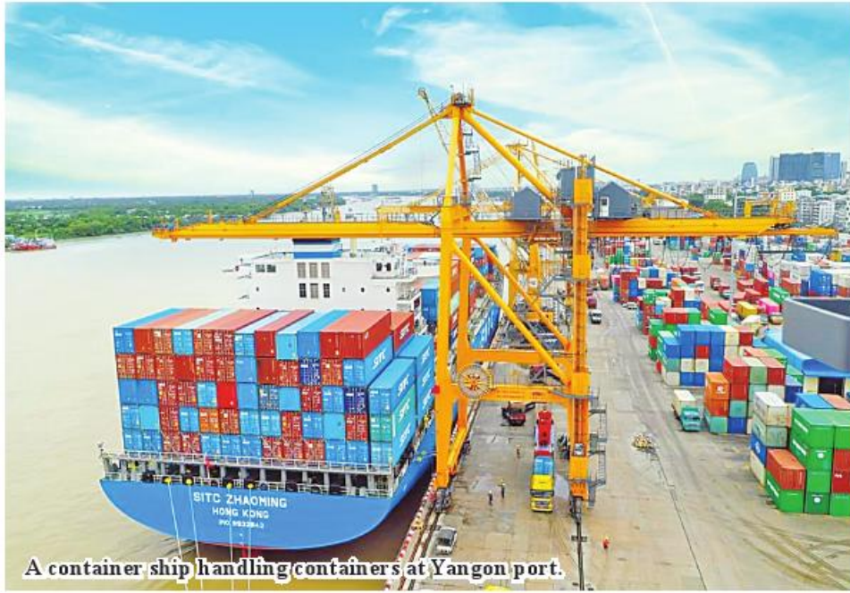
A container ship handling containers at Yangon port.

Nay Pyi Taw April 20 The Ministry of Commerce stated that maritime trade sector secured US$14 billion more than that of border trade sector in 2023-24 financial year. In the trade sector which generated US$30.09 billion in the previous financial year, maritime trade sector earned US$22.36 bil-