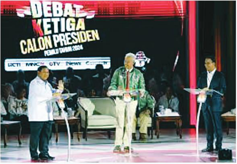
သမ္မတလောင်းများ စကားစစ်ထိုးပွဲကျင်းပနေပုံ

ပရာဘိုဝိုဆူဘီရန်တို (Prabowo) သည် အသက် ၇၂ နှစ်အရွယ်ရှိ စစ်ဗိုလ်ချုပ်ဟောင်းတစ်ဦး ဖြစ်ပြီး လက်ရှိ ကာကွယ်ရေးဝန်ကြီးလည်းဖြစ်သည်။ ယခင် အာဏာရှင်ဟောင်း ဆူဟာတို၏ သမက် တော်သူလည်းဖြစ်သည်။ ၂၀၁၄ ခုနှစ်နှင့် ၂၀၁၉ ခုနှစ် သမ္မတရွေးကောက်ပွဲများတွင် သမ္မတဂျီကိုဝိုဒိုကို ရှုံးနိမ့်ခဲ့ပြီး ယခုအကြိမ်သည် တတိယအကြိမ်မြောက် ဝင်ရောက်ယှဉ်ပြိုင်ခြင်းဖြစ်သည်။ ပရာဘိုဝိုသည် စစ်တပ်တွင် တာဝန်ထမ်းဆောင်စဉ်ကာလ ၁၉၉၀ ပြည့်နှစ်နှောင်းပိုင်းကာလများတွင် ဒီမိုကရေစီအရေး လှုပ်ရှားသူဦးရေ ၂၀ ခန့်ကို ပြန်ပေးဆွဲမှုဖြင့် တရားစွဲ ဆိုခံခဲ့ရဖူးသည်။ အရှေ့တီမောနှင့် ပါပူဝါတို့တွင် လည်း လူ့အခွင့်အရေးချိုးဖောက်မှုဖြင့် စွပ်စွဲခံခဲ့ရပြီး ၁၉၉၈ ခုနှစ်တွင် တပ်မတော်မှ နုတ်ထွက်ခဲ့သည်။ သမ္မတ ဂျီကိုဝိုဒိုလက်ထက်တွင် ကာကွယ်ရေး ဝန်ကြီးဖြစ်လာပြီး ၂၀၂၀ ပြည့်နှစ်ထိ အမေရိကန်