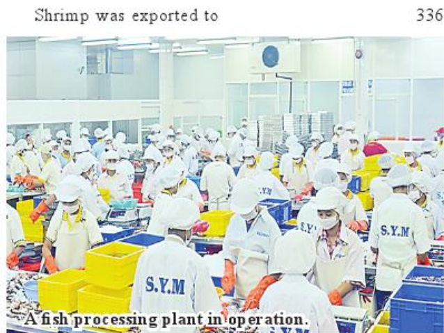
A fish processing plant in operation.

million. Among them, shrimp export in the fishery sector secured US$38.18 million in 2023-24 financial year. Shrimp was exported to earn US$33.74 million in maritime trade channel and US$4.44 million in land borders, totalling US$38.18 million. 336