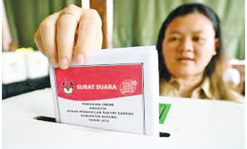
မဲဆန္ဒရှင်တစ်ဦးမှ မဲပေးနေပုံ

မဲဆန္ဒရှင်သည် မဲလက်မှတ်ငါးစောင် (သမ္မတနှင့် ဒုတိယသမ္မတ၊ အထက်လွှတ်တော်၊ အောက်လွှတ်တော်၊ ပြည်နယ်နှင့် မြူနီစီပယ်တို့အတွက် တစ်စောင်စီ) ရရှိပြီး ပါက ဂျွီဂျက်ဆန္ဒပြုခန်းသို့သွား၍ မိမိမဲပေးလိုသည့် ကိုယ်စားလှယ်လောင်း၏အမည်၊ နံပါတ်၊ ဓာတ်ပုံ၊ ပါတီလိုဂိုနေရာ တစ်ခုခုတွင်သံဖြင့် အပေါက်ဖောက်၍ မဲပေးရခြင်းဖြစ်သည်။ မဲလက်မှတ်ကိုခေါက်၍ သက်ဆိုင်ရာမဲပုံးအတွင်းသို့ထည့်၍ လက်ချောင်းတွင် မင်တိုပြီးပါက မဲပေးခြင်းလုပ်ငန်းစဉ်ပြီးဆုံးသည်။ နိုင်ငံပြင်ပရောက် မဲဆန္ဒရှင်များအနေဖြင့် သမ္မတ၊ ဒုတိယသမ္မတနှင့် အောက်လွှတ်တော်တို့အတွက် မဲလက်မှတ် နှစ်စောင်သာ ရရှိမည်ဖြစ်သည်။ မြို့တော်ဂျကာတာရှိ အချို့နေရာများ၌ ဈေးဝယ်ရာတွင် မင်တိုထားသော လက်ချောင်းကို ပြသနိုင်ပါက ရွေးကောက်ပွဲနေ့ အထူးလျှော့ဈေးများရရှိခြင်း၊ လက်ဆောင်များ ရရှိခြင်းတို့ရှိသည်။