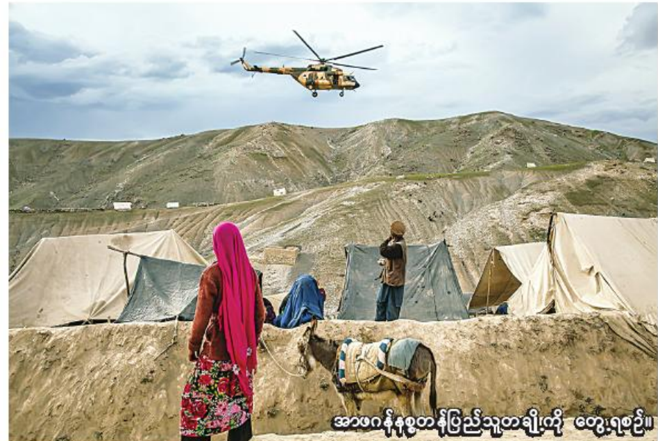
အာဖဂန်နစ္စတန်ပြည်သူတချို့ကို တွေ့ရစဉ်။

အမေရိကန်အစိုးရအဖွဲ့၏ ပြောကြားချက်များနှင့်စပ်လျဉ်း၍ အာဖဂန်နစ္စတန်ဗဟိုဘဏ် ပြောရေးဆိုခွင့်ရှိသူက တစ်စုံတစ်ရာတုံ့ပြန်ခဲ့ခြင်း မရှိပေ။