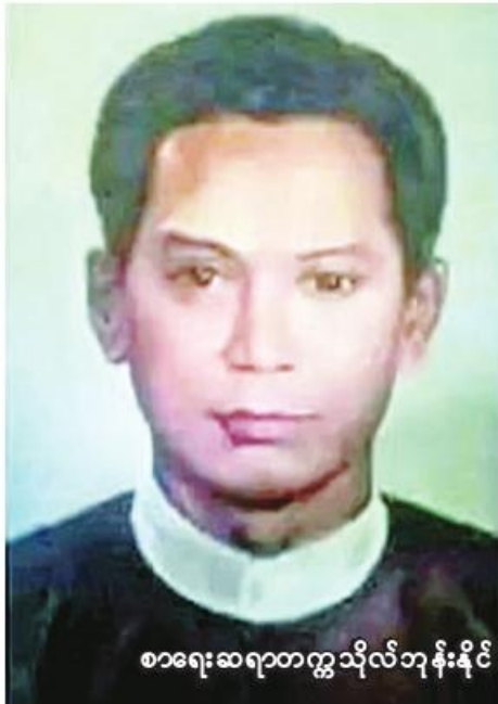
စာရေးဆရာတက္ကသိုလ်ဘုန်းနိုင်

တက္ကသိုလ်ဘုန်းနိုင်သည် မြန်မာနိုင်ငံစာပေလောကတွင် အလွန်ထင်ရှားကျော်ကြားသော စာရေးဆရာတစ်ဦးဖြစ်ပါသည်။ ဆရာသည် စာရေးဆရာတစ်ဦးသာမကပဲ မြန်မာနိုင်ငံ၏ အဆင့်မြင့်ပညာရေးလောကတွင် ကျောင်းဆရာတစ်ဦးလည်းဖြစ်ပါသည်။ တက္ကသိုလ်ဘုန်းနိုင်သည် တက္ကသိုလ်ကျောင်းသား၊ ကျောင်းသူ လူငယ်ထု၊ အခြေခံပညာကျောင်းသား၊ ကျောင်းသူ လူငယ်ထုအပြင် စာဖတ်ဝါသနာပါသော လူကြီးလူငယ်၊ လူရွယ်လူလတ်တို့၏အသင်းစွဲ ဝတ္ထုစာပေဖြင့် အဆွေဆောင်နိုင်ဆုံး၊ အကြည်ညိုဆုံး၊ လေးစားဆုံး၊ အချစ်ခင်ဆုံး စာရေးဆရာတစ်ဦးဖြစ်ပါသည်။