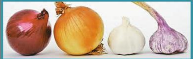
ကြက်သွန်ဖြူနှင့် ကြက်သွန်နီစားသုံးပေးခြင်းဖြင့် နှလုံးနှင့်အဆုတ် အတွက် အထူးကောင်းမွန်သည်။

ထိုစဉ်-ခင် ဂျော့ဂျော့ဝတ်မှတ်အာရုံစဉ် အာဆေးကန်အဖြစ်ရေရန်