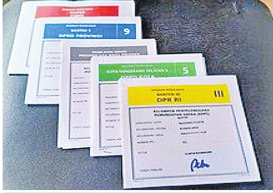
မဲလက်မှတ်ပုံစံ

အကြောင်းအရာကိုလည်းကောင်း၊ ပဉ္စမအကြိမ်တွင် နည်းပညာ၊ ပြည်သူ့ဝန်ဆောင်မှု၊ ပညာရေး၊ ယဉ်ကျေးမှု၊ ကျန်းမာရေးနှင့် လူ့စွမ်းအားအရင်းအမြစ် ဆိုင်ရာအကြောင်းအရာများနှင့် ပတ်သက်၍ စကားစစ်ထိုးပွဲများ ကျင်းပခဲ့သည်။