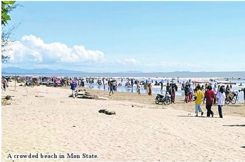
A crowded beach in Mon State.

Mawlamyine April 20 More than 1.25 million travellers at home and abroad paid visits to destinations in Mon State within 2023-24 financial year, according to