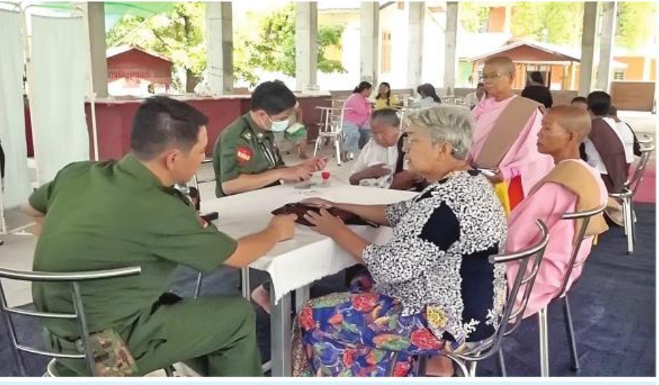
သာသနာ့နယ်ဝင်သီလရင်များနှင့် ဒေသခံပြည်သူများကို အလယ်ပိုင်းတိုင်းစစ်ဌာနချုပ် နယ်မြေခံဆေးကုသရေးအဖွဲ့က ကျန်းမာရေးစောင့်ရှောက်မှုလုပ်ငန်းများ ဆောင်ရွက်ပေးစဉ်။