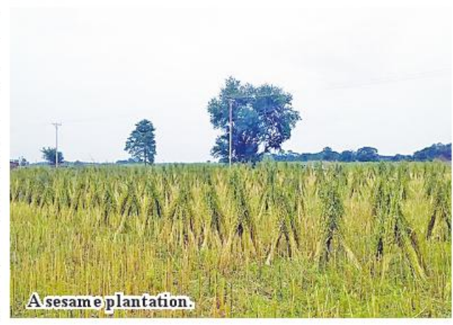
A sesame plantation.

good agricultural practices can get better quality than other crops and good prices not only in domestic market