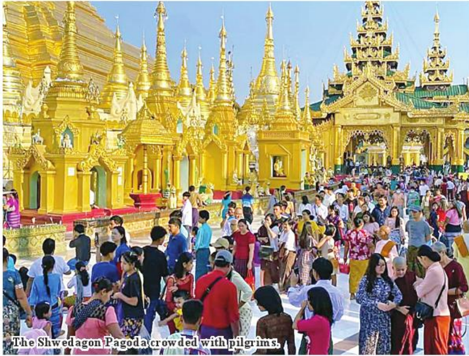
The Shwedagon Pagoda crowded with pilgrims.