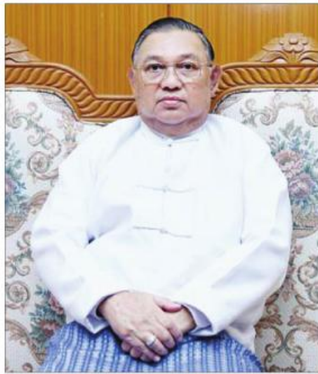
အခါသမယ သင်္ကြန်ပွဲတော်လည်း ဖြစ်ပါတယ်။

ဒီလိုကောင်းမြတ်တဲ့ အစဉ်အလာတွေနဲ့ နှစ်သစ်ကို ကြိုဆိုတဲ့အခါမှာ၊ နှစ်သစ်ကို ရင်ဆိုင်ကြတဲ့အခါမှာ ကောင်းမြတ်သော စိတ်ရင်းစေတနာ၊ ကောင်းမြတ်သောစိတ်ထားတွေနဲ့ အပြုသဘောဆောင်သော ကိုယ်ကျင့်တရားများနဲ့ ကျင့်ကြံအားထုတ်မှုများနဲ့ နှစ်သစ်မှာ ရှင်သန်သွားကြဖို့ကို ရည်သန်တဲ့