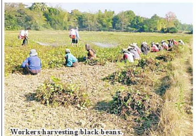
Workers harvesting black beans.