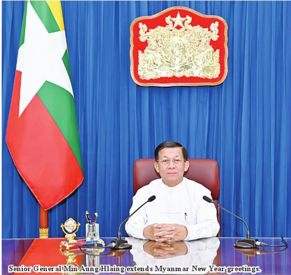
Senior General Min Aung Hlaing extends Myanmar New Year greetings.

I extend my heartfelt greetings to all people residing worldwide, including all national people of Myanmar, to be free from varieties of dangers and to physical and mental well-being on the occasion of Myanmar New Year's Day when it falls to be free from varieties of