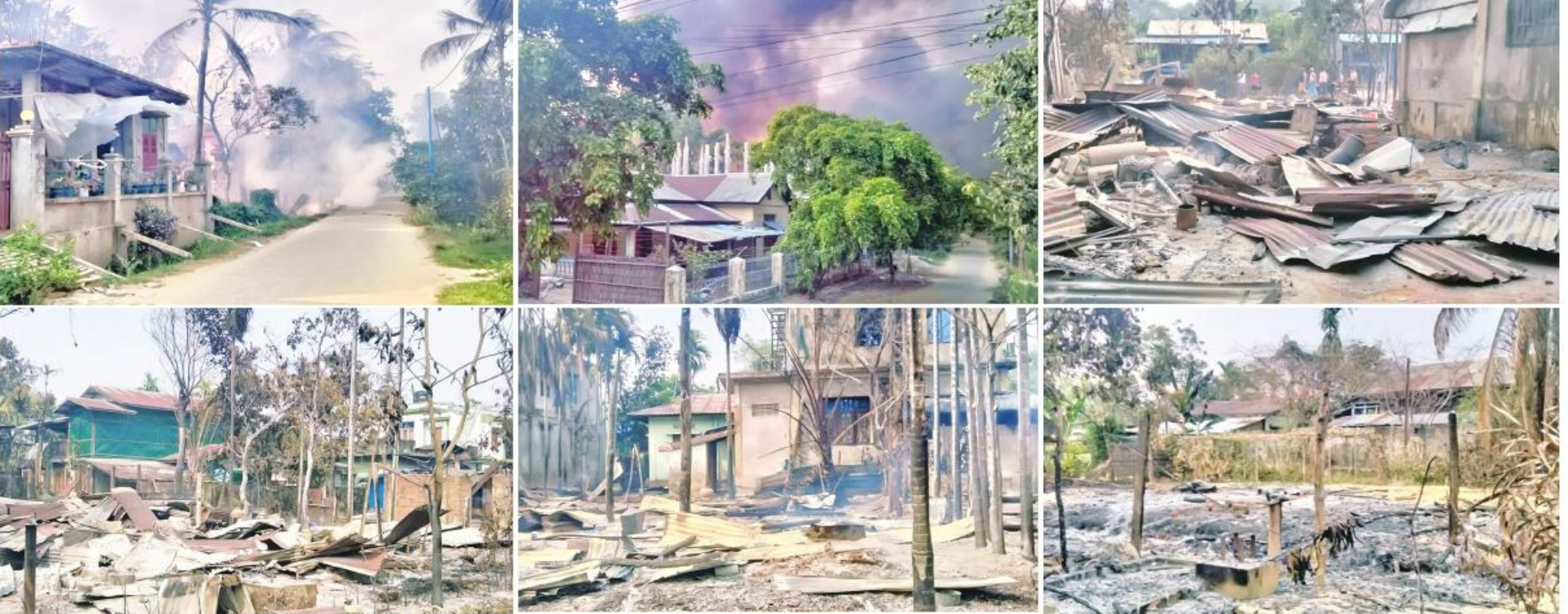
ရခိုင်ပြည်နယ် ဘူးသီးတောင်မြို့ အမှတ်(၅)ရပ်ကွက်ရှိ လူနေအိမ်များမီးလောင်ပျက်စီးဆုံးရှုံးခဲ့သည့် မှတ်တမ်းဓာတ်ပုံ။

နေပြည်တော် ဧပြီ ၁၈ - တစ်ဆိုင်မှ မီးစတင်လောင်ကျွမ်းခဲ့ပြီး ၂၀ကျော် စုစုပေါင်းနေအိမ်အလုံး ၅၀ကျော် ရခိုင်ပြည်နယ် ဘူးသီးတောင်မြို့နယ် အခြားနေအိမ်များသို့ ထပ်မံစွက်စက်လောင် မီးလောင်ပျက်စီးဆုံးရှုံးခဲ့ကြောင်း သိရှိ အမှတ်(၅)ရပ်ကွက်အတွင်း၌ ဧပြီ ၁၇ ရက် ကျွမ်းခဲ့ရာ နှစ်ထပ်တိုက်နေအိမ်အလုံး ၃၀ ရသည်။ နံနက် ၁၁ နာရီခွဲခန့်တွင် ကားပစ္စည်းဆိုင် ခန့်နှင့် ပျဉ်ထောင်၊ သွပ်မိုးနေအိမ်အလုံး အဆိုပါရပ်ကွက်၌ နေထိုင်သော ကျေးရွာများသို့ ပြောင်းရွှေ့နေထိုင်လျက်ရှိ