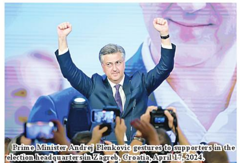
Prime Minister Andrej Plenkovic gestures to supporters in the election headquarters in Zagreb, Croatia, April 17, 2024.