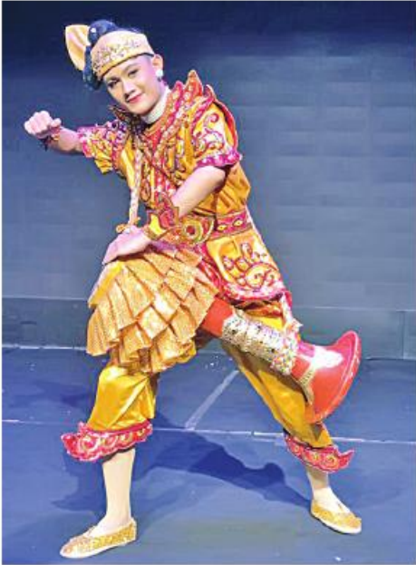
အိုးစည်အက

လွယ်မထားသော်လည်း လွယ်ထားဟန်ပြုရသည်။ ခိုးပတ်မပါဘဲ ကပြနေသော်လည်း ကသူကိုယ်တိုင်က ခိုးပတ်တီးနေဟန် ကပြနိုင်ကြသဖြင့် ခိုးပတ်အကဟူ၍ ကကြီးတစ်ရပ်အဖြစ် ထင်ရှားနေခြင်းဖြစ်သည်။