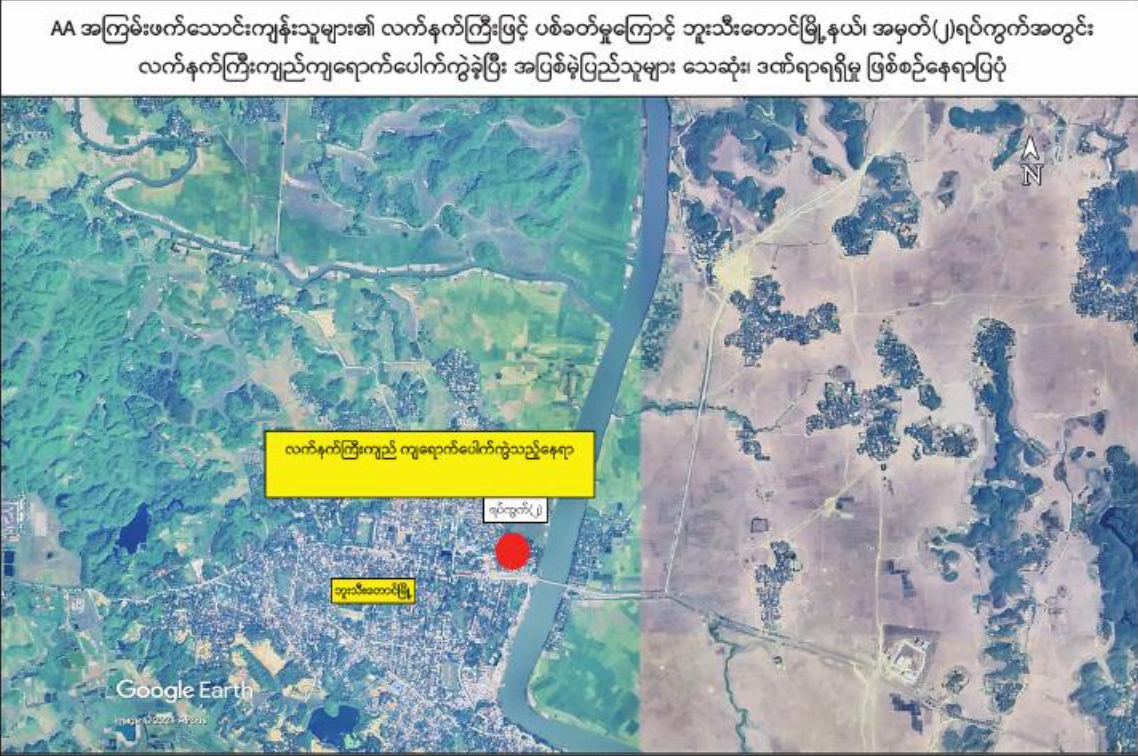
နေပြည်တော် ဧပြီ ၁၈ - AA အကြမ်းဖက်သောင်းကျန်းသူများ သည် နိုင်ငံအတွက် ထူးခြားလေးနက်သည့် သောအခါသမယ၌ ပြည်သူများ ဘုရား နှစ်ဟောင်းကုန်ဆုံး၍ နှစ်သစ်သို့ကူးပြောင်း ကျောင်းကန်များသို့ သွားရောက်၍ ဥပုသ်

သီလဆောက်တည်ခြင်း၊ ဇီဝိတဒါနပြုလုပ်ပြီး ကုသိုလ်ယူနေချိန်တွင် ပြည်သူများတည်ငြိမ် အေးချမ်းမှုပျက်ပြားကာ အထိတ်တလန့်ဖြစ် စေရန် ရည်ရွယ်၍ ဧပြီ ၁၇ရက် ညနေ ၅ နာရီခွဲခန့်တွင် ရခိုင်ပြည်နယ် ဘူးသီးတောင် မြို့အတွင်းသို့ မြို့၏အရှေ့မြောက်ဘက်မှ လက်နက်ကြီးများဖြင့် ရမ်းသန်းပစ်ခတ်ခဲ့ရာ လက်နက်ကြီးကျည်များသည် အမှတ်(၅) ရပ်ကွက်အတွင်းသို့ ကျရောက်ပေါက်ကွဲခဲ့ သဖြင့် အပြစ်မဲ့အရပ်သားပြည်သူအမျိုးသား တစ်ဦးအမျိုးသမီးသုံးဦး စုစုပေါင်း လေးဦး သေဆုံးပြီး ၁၂ နှစ်အရွယ် ကလေးငယ် တစ်ဦးအပါအဝင် ရှစ်ဦးပြင်းထန်စွာထိခိုက် ဒဏ်ရာရရှိခဲ့ကြောင်းနှင့် အဆိုပါထိခိုက် ဒဏ်ရာရရှိသူများကို လုံခြုံရေးတပ်ဖွဲ့ဝင် များက နယ်မြေခံတပ်မတော်ဆေးရုံသို့ ပို့ဆောင်၍ လိုအပ်သောဆေးဝါးကုသမှု များ ဆောင်ရွက်ပေးလျက်ရှိကြောင်း သိရှိ ရသည်။