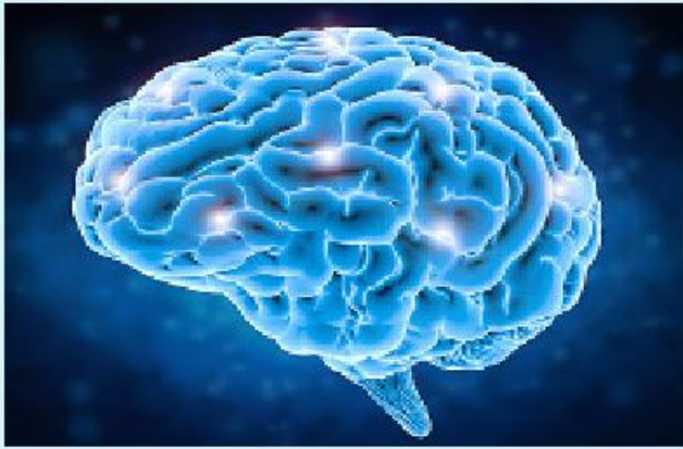
လမ်းလျှောက်ခြင်းဟာ မိမိ တို့ရဲ့ ဦးနှောက်တွေအတွက်

အကျိုးကျေးဇူးများစွာ ပေးစွမ်း ရှိတဲ့ စိတ်ဖိစီးမှုတွေ လျော့ကျ တယ်လို့ သုတေသနတစ်ခုမှာ လေ့လာဖော်ပြထားပါတယ်။ ဒါ့အပြင် အဲဒီဟော်မုန်းက လမ်းလျှောက်တဲ့ အခါမှာ ဦးနှောက်ရဲ့ အလုံးစုံကျန်းမာရေး အန်ဒေါ့ဖင်လိုခေါ်တဲ့ ဟော် ကို အထောက်အပံ့ဖြစ်စေတဲ့ မုန်းတစ်မျိုးထွက်ရှိမှု မြင့်တက် အပြင် ဒီမန်းရှားလိုခေါ်တဲ့ လာပါတယ်။ အဲဒီဟော်မုန်းက မှတ်ဉာဏ်ချို့ယွင်းရူးသွပ်ခြင်း နာကျင်မှုဝေဒနာကို သက်သာ ရောဂါနဲ့ အယ်ဒိုင်းမားရောဂါ စေတဲ့ဟော်မုန်းပါ။ အန်ဒေါ့ဖင် တို့ ဖြစ်ပွားနိုင်ခြေကိုတောင်မှ ဟော်မုန်းထွက်ရှိလေ မိမိတို့မှာ လျော့ချပေးနိုင်ပါတယ်။