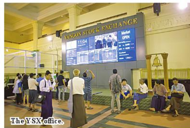
The YSX office.

In that financial year, the shares of the eight listed public companies were traded daily, and the number of investors who bought the shares was 46,191.